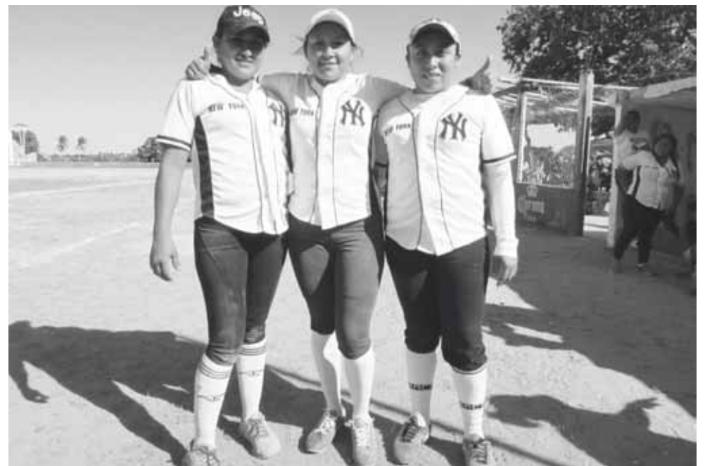
► Ontiveros ganó 2 juegos.