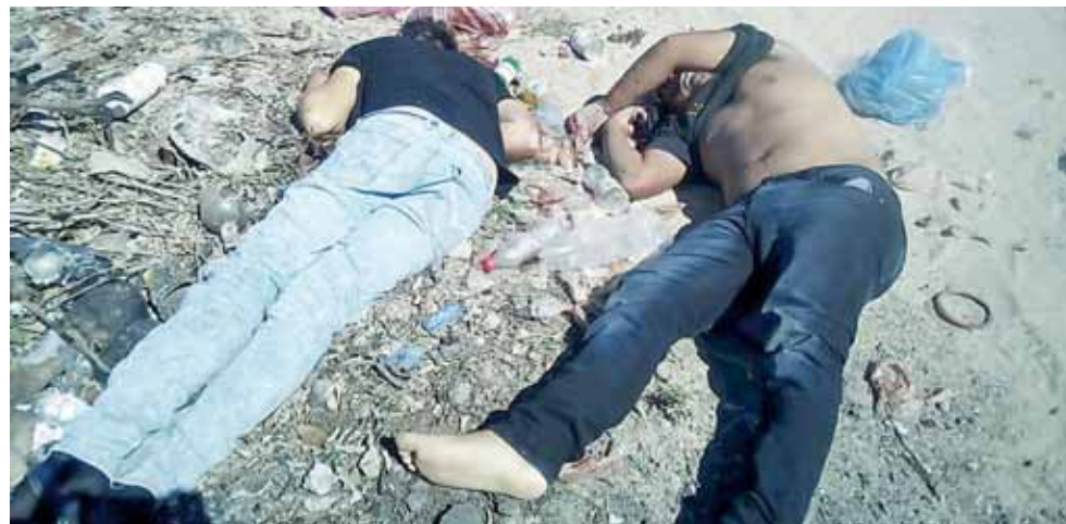
► Los cuerpos fueron localizados en el basurero de Ixhuatán.

Ciudadanos reportaron la presencia de los cuerpos sin vida de dos personas que al parecer fueron ejecutadas durante la mañana en ese mismo lugar