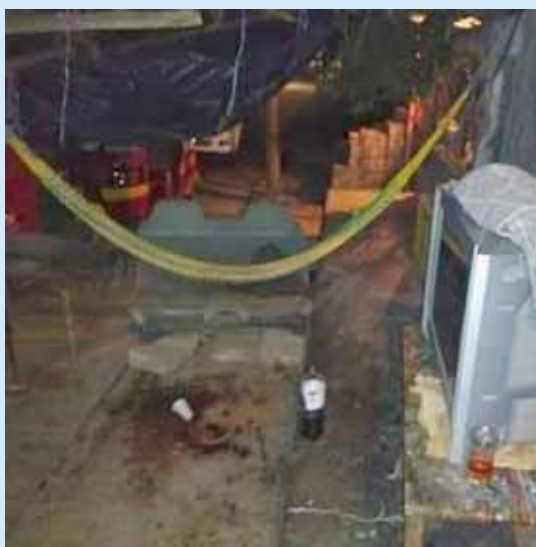
► El Quepa fue ejecutado la noche del sábado en el interior de su domicilio.