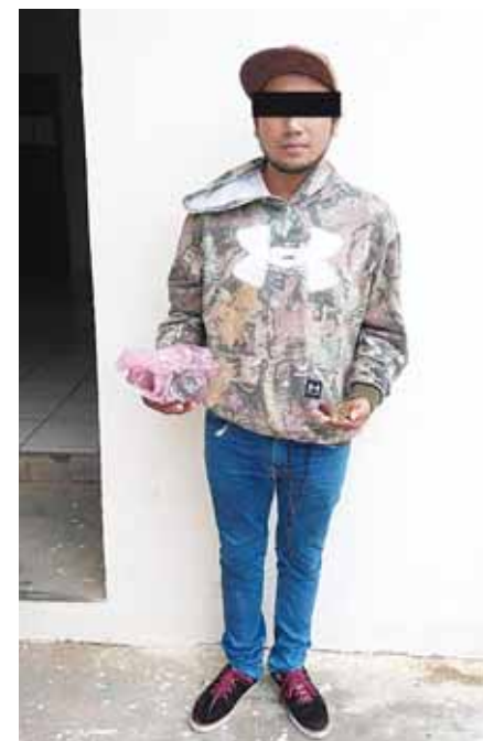
► Fue trasladado y puesto a disposición del Ministerio Público federal para que defina su situación legal.

ro, ha dado buenos resultados en estos últimos días de la quincena de diciembre, pues en reciente fecha aseguraron en la población de Santiago, Ixtaltepec, a un sujeto con 2 rifles de asalto y dos escopetas, además de