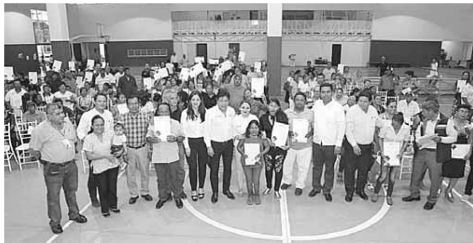
► Esto representa seguridad para las familias y sus patrimonios.