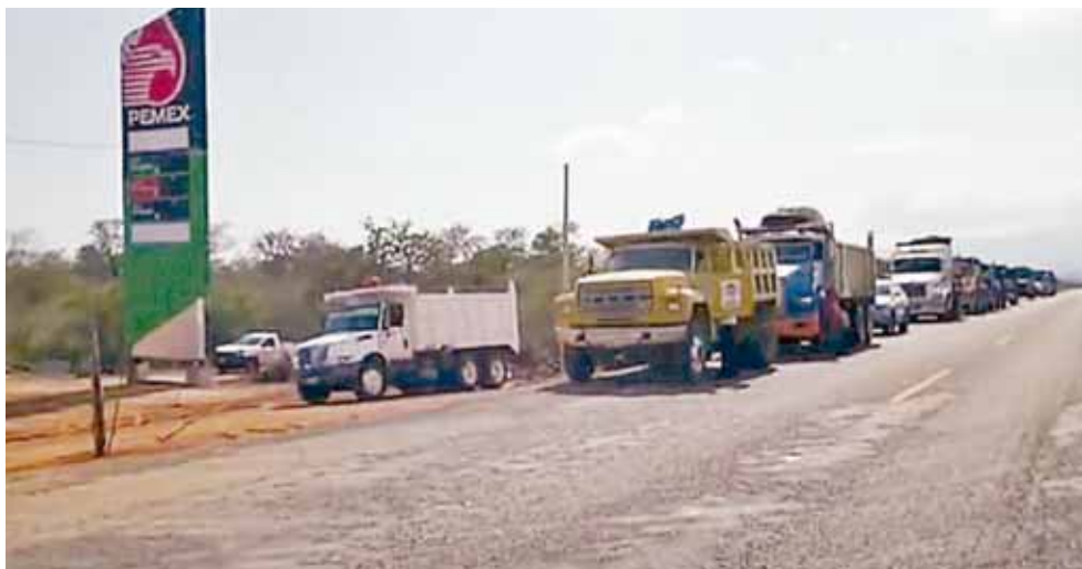
► Aseguran que no hay ningún acto de violencia en el que estén involucrados.