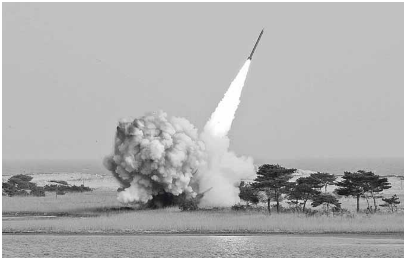
► La respuesta del Norte sigue al anuncio de Estados Unidos de sanciones a tres funcionarios norcoreanos.

Nicaragua vive una crisis social y política que ha generado protestas contra el Gobierno de Ortega y un saldo de entre 325 y 545 muertos, según organismos de derechos humanos locales y extranjeros, mientras que el Ejecutivo cifra en 199 los fallecidos.