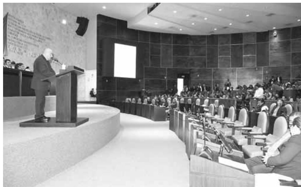
► Legisladores pidieron sumar esfuerzos para mejorar la educación en el estado.

Señaló que en el tema de la reconstrucción de escuelas, el IEEPO contó con recursos para atender este