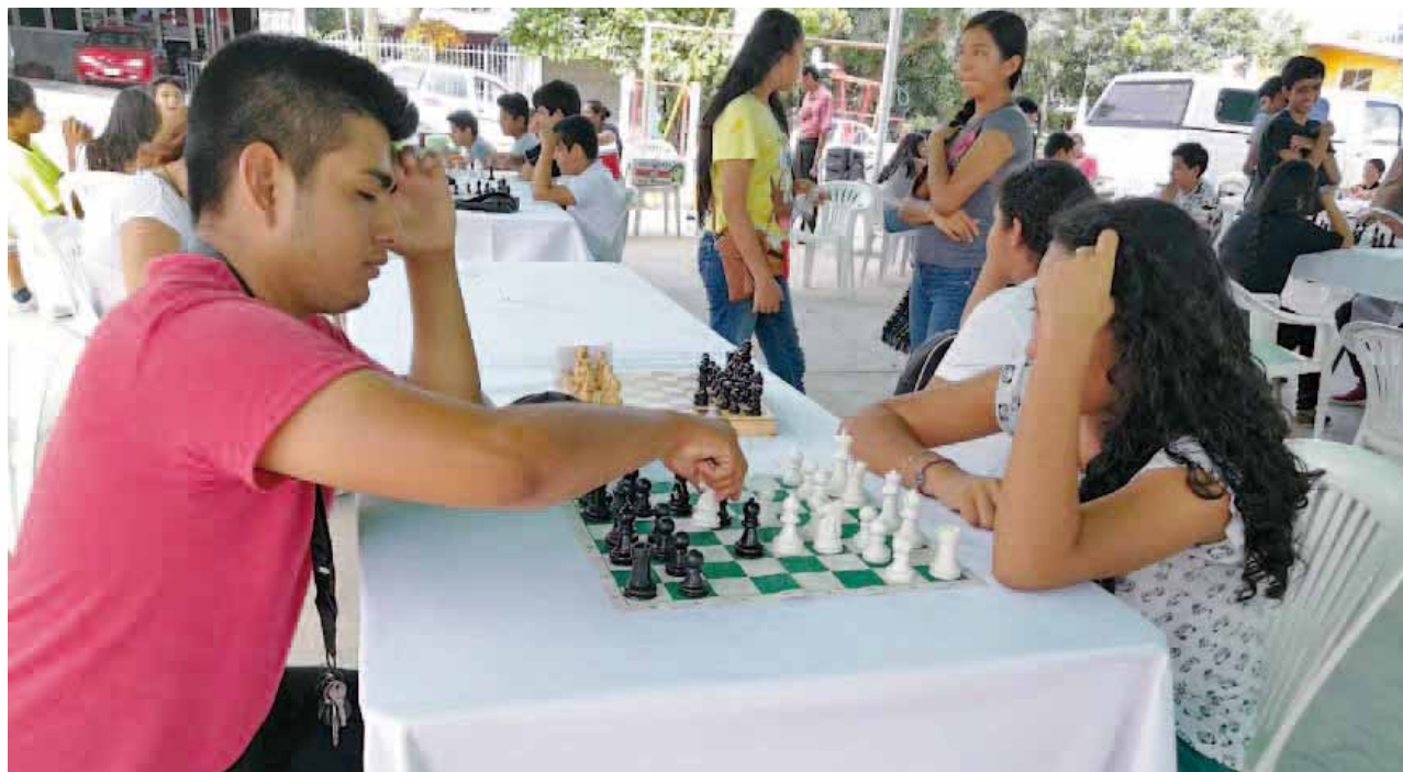
► La delegación municipal de la colonia Aeropuerto se vio abarrotada.

El director comentó que las inscripciones fueron totalmente gratuitas, de igual manera abundó en que debido al éxito de este primer torneo de ajedrez, se está ya analizando iniciar desde ahora con la organización de un segundo torneo el próximo año, trataremos dijo que este evento quede de manera permanente por estas fechas, esto con el fin de fomentar esta disciplina entre los estudiantes y todo aquel que le interese desarrollar su intelecto.