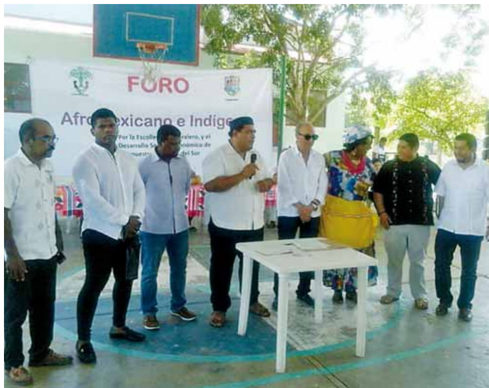
► Más de 40 pueblos de Oaxaca, Guerrero y Estado de México reunidos en Corralero.

Proponen gestionar recursos para la edificación de una Escuela Nor-