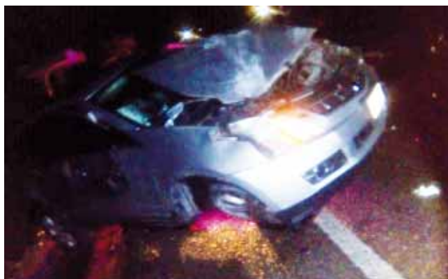
► Se sospecha que el conductor es de una población cercana.