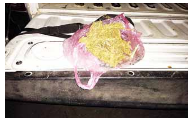
► Portaba una bolsa de nilón con hierba seca con las características de la marihuana.

La Policía Estatal acuatelada en Matías Rome-