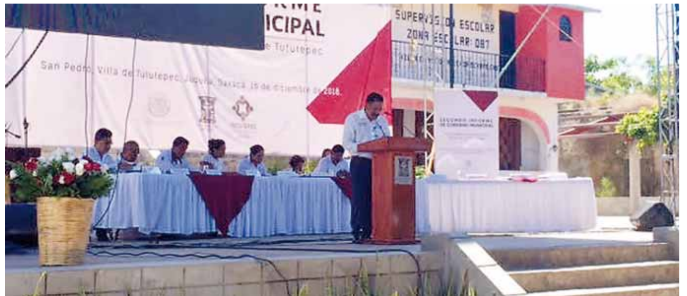
► Los ingresos del ramo 28 ascendieron a 33 millones 490, 237.11 pesos.

33 fondo III fue de 64 millones 993,707.60 así como del fondo IV, 28 millones 032,840.00.