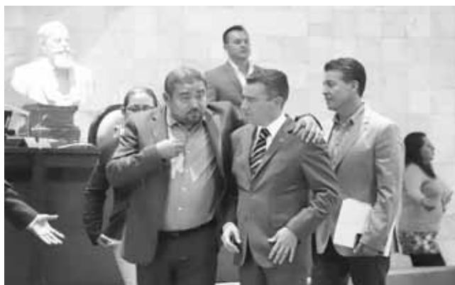
► El encargado, blindado por la minoría priista.

ladores, a diferencia de lo que ocurrió con sus antecesores que fueron duramente señalados.