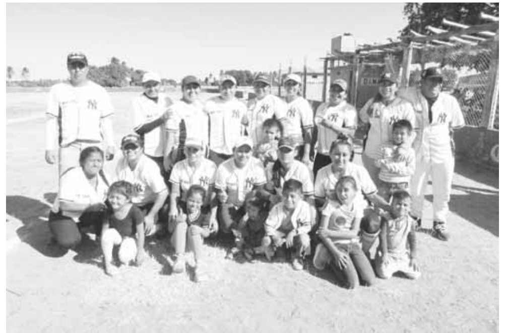
► Espartanas a playoffs.