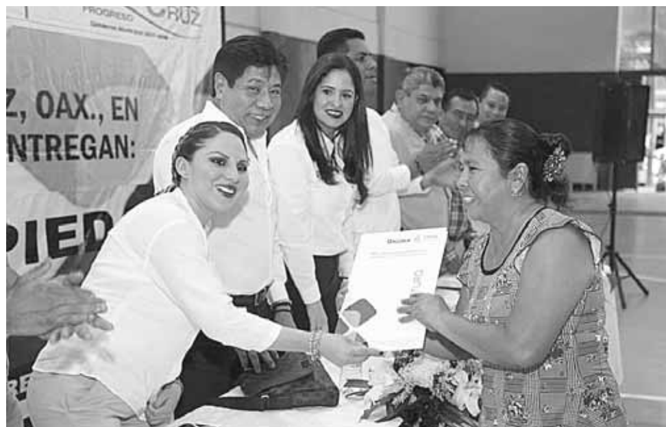
► Las autoridades agradecieron el invaluable apoyo del Gobernador del Estado.

Es una garantía plena sobre sus propiedades que durante diez años se les había negado, pero que finalmente se les hace justicia social