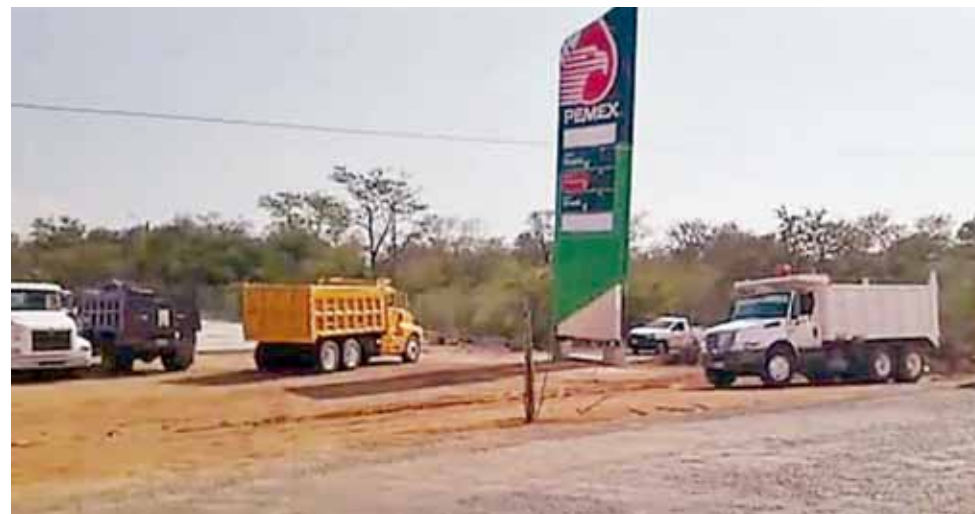
► Consideran que las autoridades están inmiscuidas en los problemas de la obra.

Una pugna entre transportistas surgió en el municipio, luego de la adjudicación de los trabajos de acarreo de material para la construcción de una gasolinera