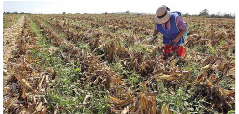
► Es necesario impulsar la Reforma para la Transformación del Campo.