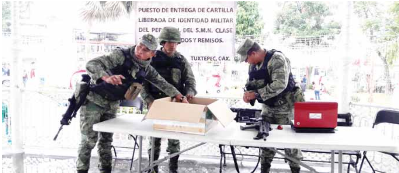
► El módulo de Tuxtepec entregará mil 232 cartillas liberadas a anticipados y remisos.