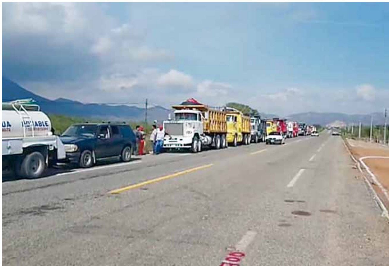
► El secretario general del sindicato de obreros y camioneros de la CTM salió en defensa de sus compañeros.

La CTM en ningún momento bloqueó accesos a la obra ni la carretera costera, así como tampoco violento los trabajos.