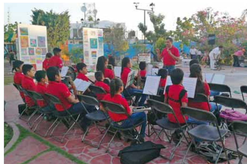
► La institución ofrece cursos de inglés, danza, solfeo, gimnasia, pintura y música, entre otras disciplinas.

corte y confección, yoga, teatro entre otras disciplinas, en meses anteriores gracias a sus gestiones, el club rotario donó a esta institución varios equipos computacionales, para que los estudiantes que carezcan de una PC puedan asistir a realizar sus tareas, sin tener que gastar un solo peso, comentó que después de gestionar algunos apoyos en la secretaría de las culturas del estado, logró recibir apoyos importantes para la realización de un lote de trajes tradicionales para el grupo de danza y la construcción de una palapa de uso múltiples, y que la actual se encontraba ya en muy malas condiciones.