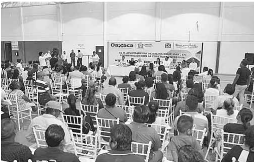
► Diez años tardaron los ciudadanos en obtener seguridad para sus hogares.