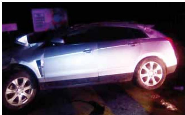
► Perdió el control al pasar un tope.

Ante los daños provocados al vehículo, el conductor lo dejó abandonado ya que el dueño podría ser de una población cercana, el vehículo fue trasladado al corralón oficial.