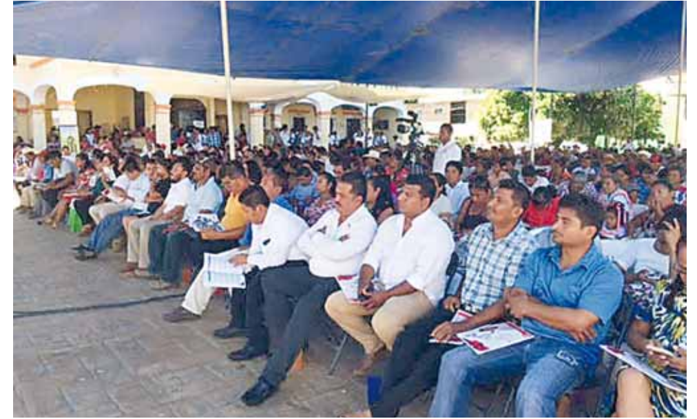
► Las cincuenta cinco comunidades que integran el municipio recibieron obras.

Porello, dijo que los ingresos del ramo 28 ascendieron a 33 millones 490,237.11 y del ramo