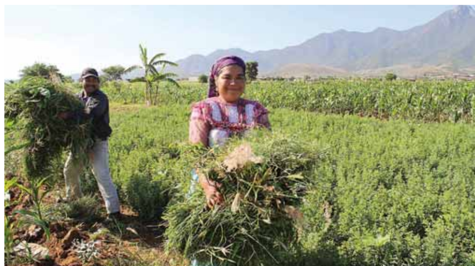
► Oaxaca es el segundo estado más pobre de la República mexicana.