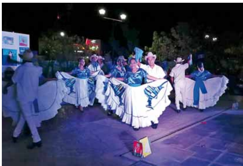
► Reconocen el trabajo de los profesores de esta institución.

Este fin de semana, la Casa de la Cultura organizó un evento de fin de cursos, en el parque de la ciudad donde el público se dio cita para ver los avances de los estudiantes