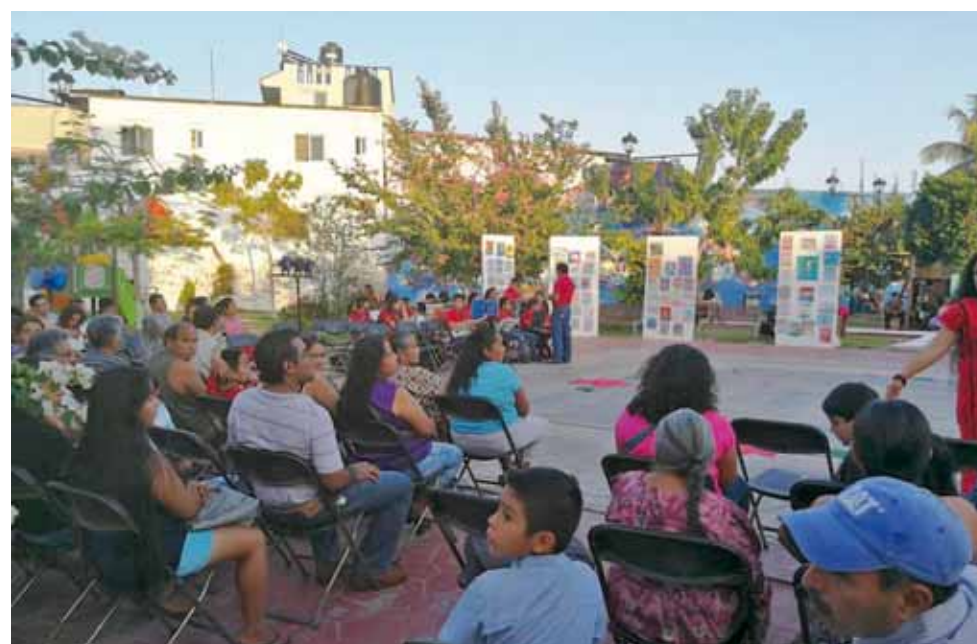
► Un buen número de personas se dio cita en el parque El Idilio.