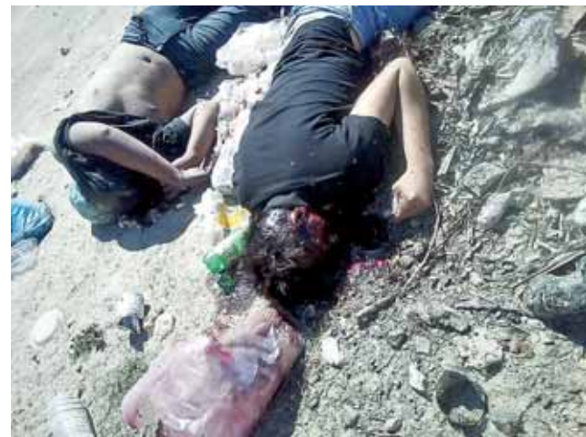
► Elementos ministeriales iniciaron una averiguación previa.

Los cuerpos serían trasladados al descanso municipal para realizarle la autopsia correspondiente terminar la verdaderas causas del deceso.