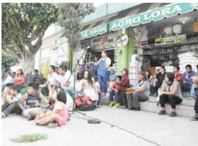
► El teatro callejero es más cercano a la gente.

Después de Oaxaca, el festival tendrá réplicas (pequeñas intervenciones) en Tapachula, Chiapas; Ciudad de México, Monterrey, Nuevo León; Sevilla (España), Bogotá (Colombia) y por Francia.