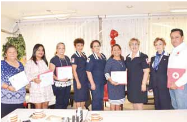
► La Cruz Roja entregó reconocimientos a las capitanas de la Vela Cruz Roja.