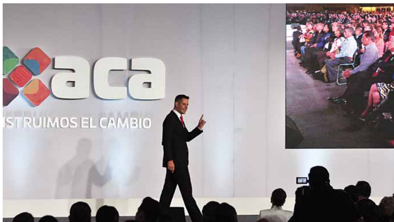
▶ En el marco de su Segundo Informe de Actividades, el gobernador Alejandro Murat Hinojosa ofreció un mensaje al pueblo de Oaxaca desde el Centro de Convenciones.

blemas de cultivo en la Sierra Sur y Norte.