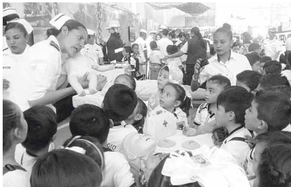
► Niños de diversos planteles mostraron gran entusiasmo en la Expo Mar.