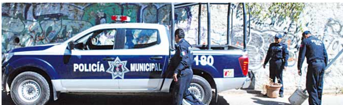
► Son tres ya los asaltos a esta tienda tras su apertura.

esas ratas, aunque tú te empeñes en culparnos de asesinatos secuestradores y además hacemos lo que tu policía no hace pero si lo mandas a matar familia de gente que está en el partido que te ganó la gubernatura y decimos que tu hijo solo era pantalla tuya, aprende a perder, ya se te acabó tu reinado hiciste tu película como siempre para enganar al pueblo con retrato hablado que nada se prevé al presunto asesino que sacó tu fuerza civil de su casa para dejarlo muerto solo te quedan quince días para que se te acabe tus marranadas", señala el mensaje dejado en mantas.