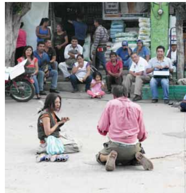
► Chachareando o concierto para basura y dos pepenadores.

puede consultar en la página https://nomasmuros.kefir.net , y en la que la migración se relaciona con otros temas como las desapariciones, además de afectar a sectores de la población en situación de vulnerabilidad: la niñez y las mujeres, por ejemplo.