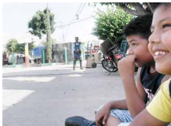
► Los niños se sienten atraídos por este tipo de expresiones.