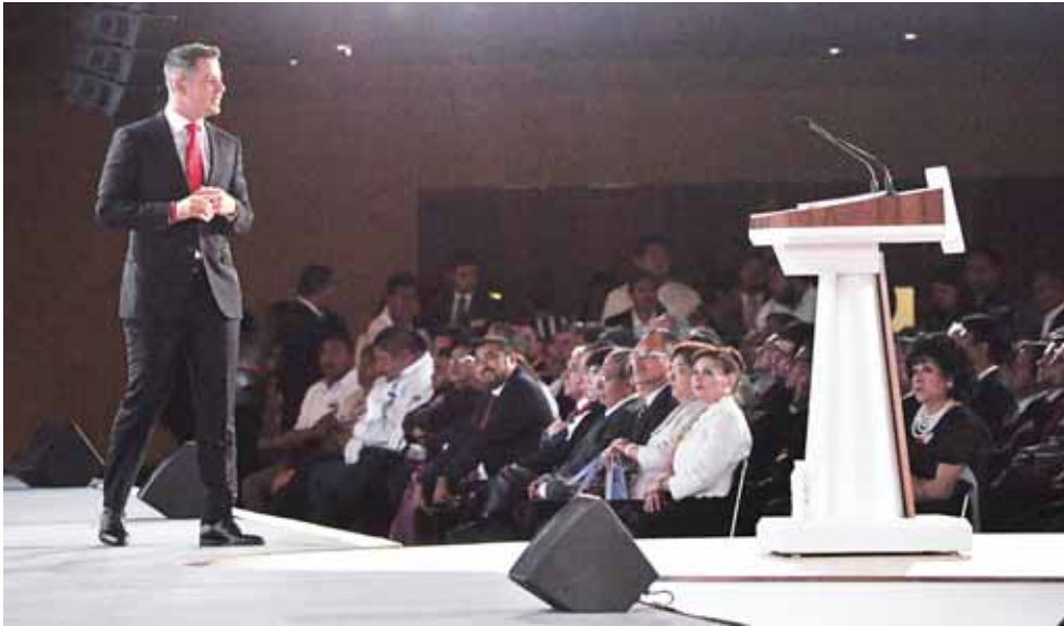
► Alejandro Murat informa sobre los avances en su administración.