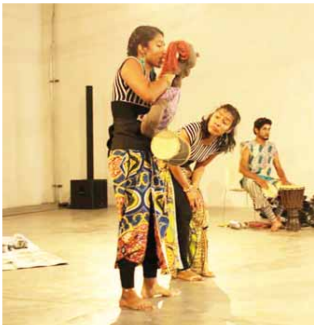
► Los de siempre colectivo.