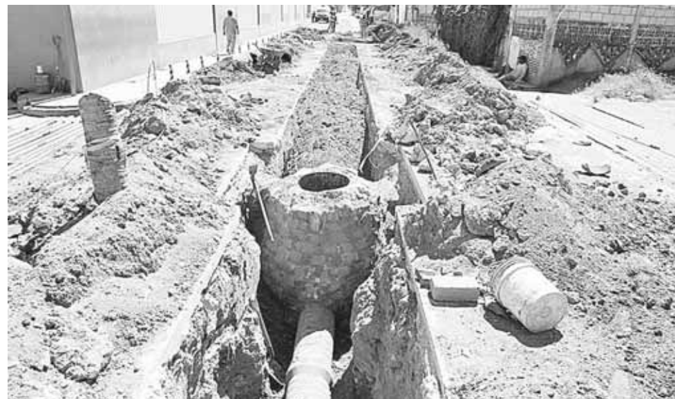
► Vecinos agradecen la atención de las autoridades.