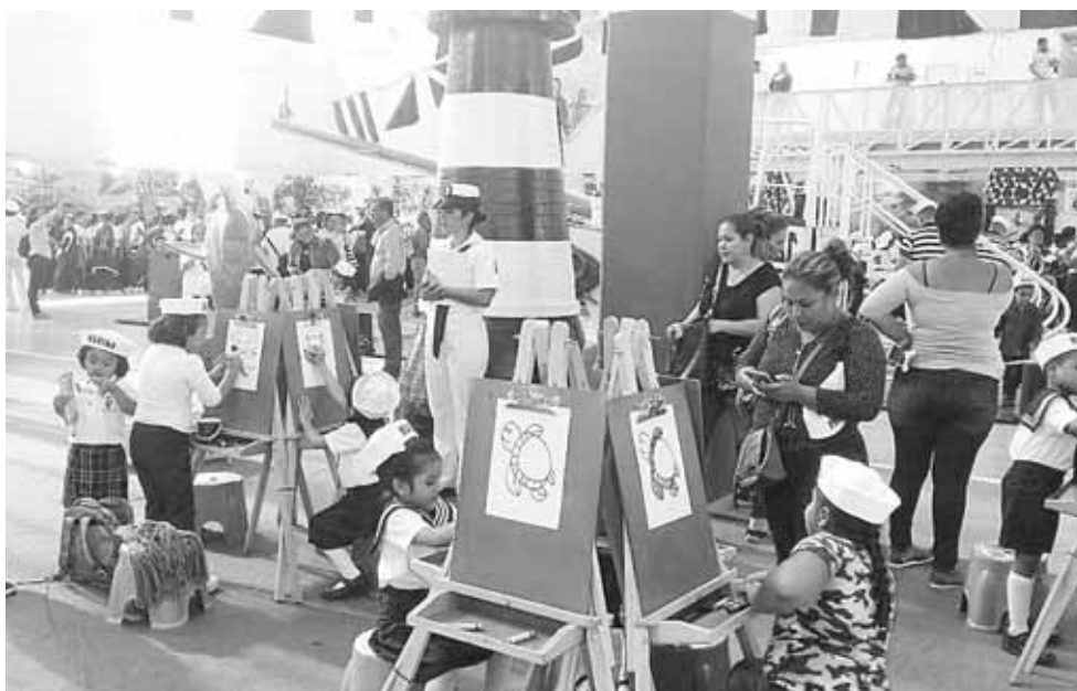
► Invitan a la ciudadanía en general para que visiten la Expo Mar.