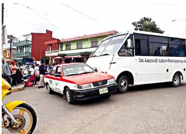
► La falta de precaución provoca otro accidente.

presta el servicio de pasaje hacia la comunidad de Almoloya, según testigos, los dos conductores llevaban prisa por lo que la falta de precaución ocasionó el accidente, no se reportaron lesionados solamente daños materiales.