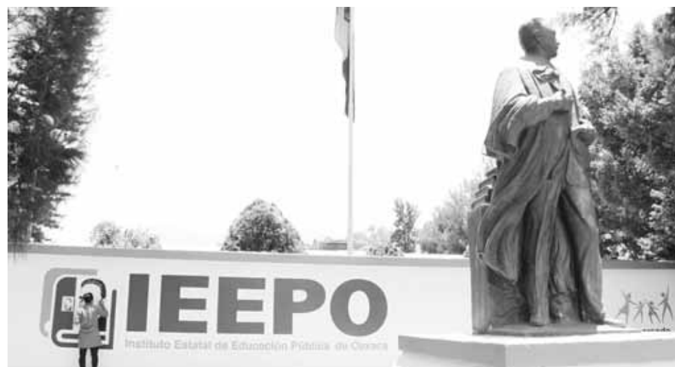
► El IEEPO admite que han cambiado las circunstancias políticas del país.