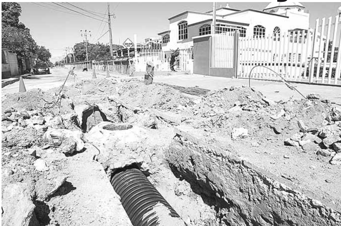
► Los trabajos constituyen la introducción de 430.30 metros lineales de tubería.