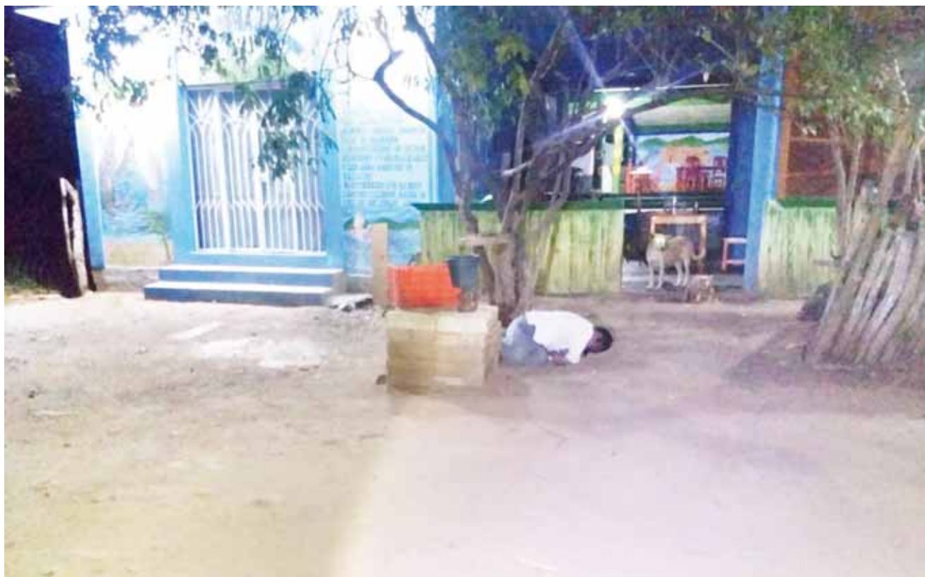
► Un grupo de hombres lo asesinó sin mediar palabra.

Entanto los agentes integraron el legajo correspondiente por el presunto delito homicidio calificado con alevosía y ventaja.