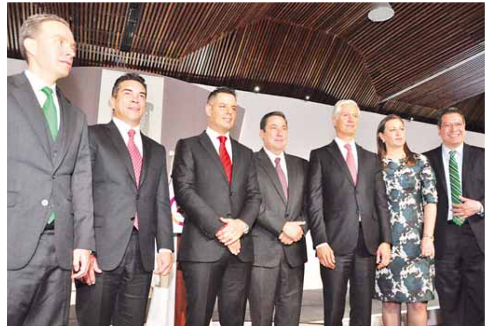
► Alejandro Murat con los gobernadores que asistieron a la ceremonia de su mensaje político.

En este sentido, en materia de salud, al arribo de su administración dijo que había 30% de abasto en medicinas, pero hoy existe un 80% y se ha incorporado a la compra consolidada del Instituto Mexicano