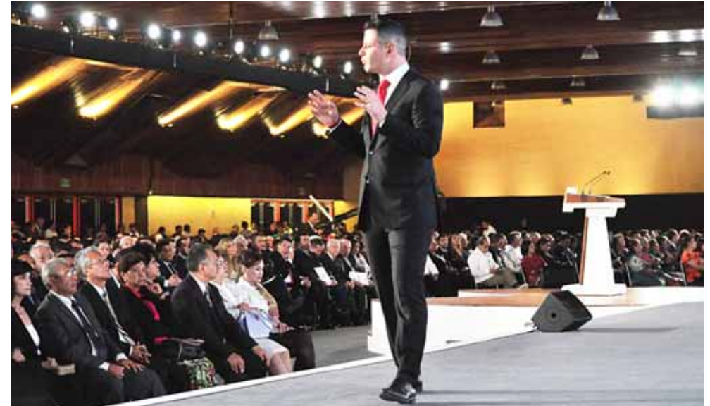
► Apoya mandatario estatal la legalización de la marihuana.