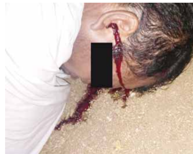
► El cadáver fue trasladado al descanso para practicarle la necropsia de ley.

El empresario de 50 años de edad fue asesinado de un balazo en la cabeza afuera de su domicilio y local comercial