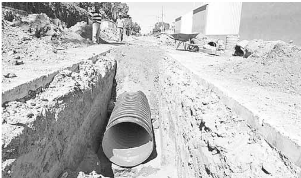
► Anteriormente en temporada de lluvias la avenida Francisco Villa se convertía en un río.