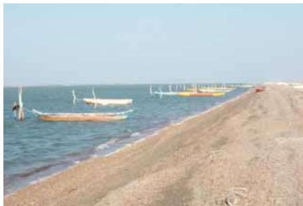
► La desaparición fue reportada por autoridades de la agencia Bernal.

zaron el levantamiento del cadáver, guardando un hermetismo total, según la comandancia por el protocolo del nuevo sistema justicia y por considerarse un delito de alto impacto, aunque lo que se protege es la fuga de información, hasta hoy día no se ha esclarecido un solo homicidio, como es el caso del sujeto que asesino al policía industrial en Palomares, el sujeto que asesinó al profesor Calixto en San Juan Guichicovi y así una serie de carpetas que duermen el sueño de los justos, por el nuevo sistema de justicia y otros más porque hay una figura política que cubre o impide que las investigaciones continúen para dar resultados a la sociedad o la víctima.