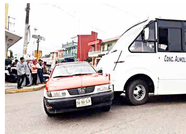
► No se reportaron lesionados, solo daños materiales.