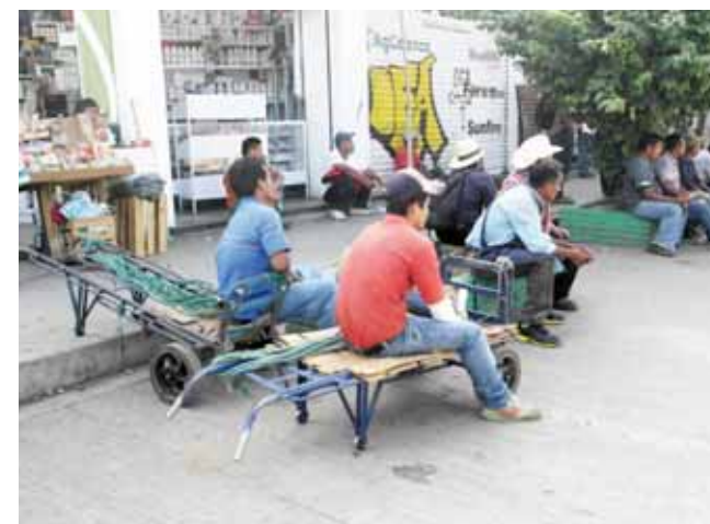
► La gente se identifica con lo que observan.