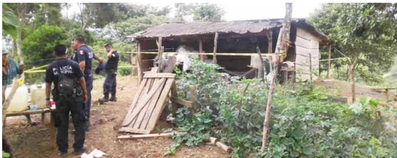
► El dueño del rancho encontró el cuerpo y dio parte a la Policía Municipal.

Ante esta situación el agente decidió reportar los hechos ante Protección Civil delegación Istmo, quien a su vez informó a la Secretaría de Marina, con quien se coordina el operativo de búsqueda.