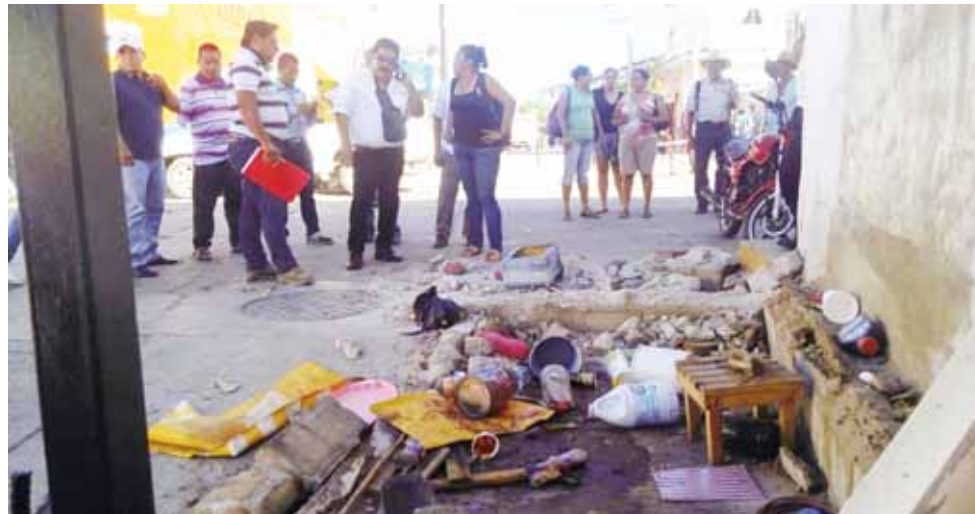
► En la imagen, los daños causados por el desalojo de la caseta.