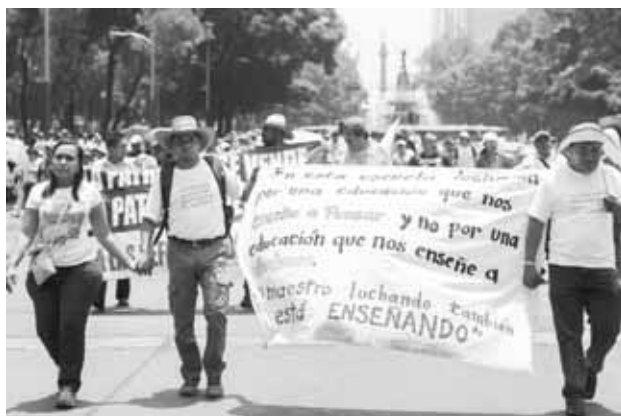
► Los opositores a la Reforma Educativa han convocado a sus bases a marchar.

“Oaxaca está inmerso en un pacto federal y si el pacto federal implica un