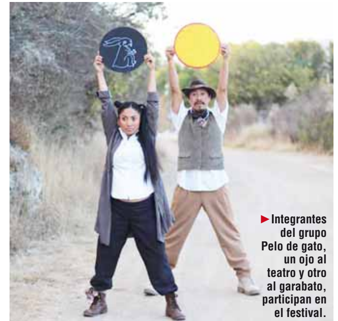
► Integrantes del grupo Pelo de gato, un ojo al teatro y otro al garabato, participan en el festival.

tival sacará al teatro de los muros a la calle, con piezas que replantean la migración desde distintas perspectivas. Invitados de Veracruz, Ciudad de México y Argentina, participan en las actividades que tendrán como sedes principales la primera cuadra de la calle Macedo-