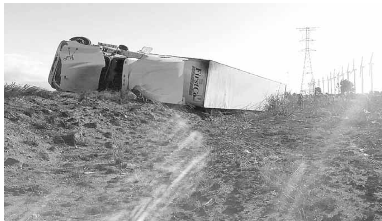
► Las rachas superan los 180 kilómetros por hora, fuerza de un huracán categoría 3.

De acuerdo con la información del Servicio Meteorológico Nacional (SMN), el cual por cierto no dice la velocidad de los vientos, la primera tormenta invernal y el Frente Frío número 10, dejarán de afectar al país en