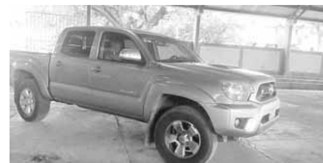
► También retuvieron los vehículos en que se desplazaban los funcionarios del INE.

de mantenerlos en la cárcel, bajo el compromiso de analizar la situación que se vive en San Dionisio del Mar, en donde se asegura no hay con-