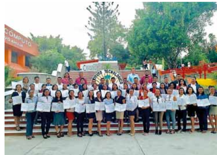
► El Tecnológico de Pinotepa cumple 26 años de vida.

El Tecnológico de Pinotepa cumple 26 años de vida en esta ciudad costeña, por lo que, se llevan a cabo diversas actividades como conferencias, talleres, juegos deportivos, entre otras.