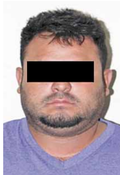
► La orden en ser cumplida debido a que uno de los imputados había escapado.