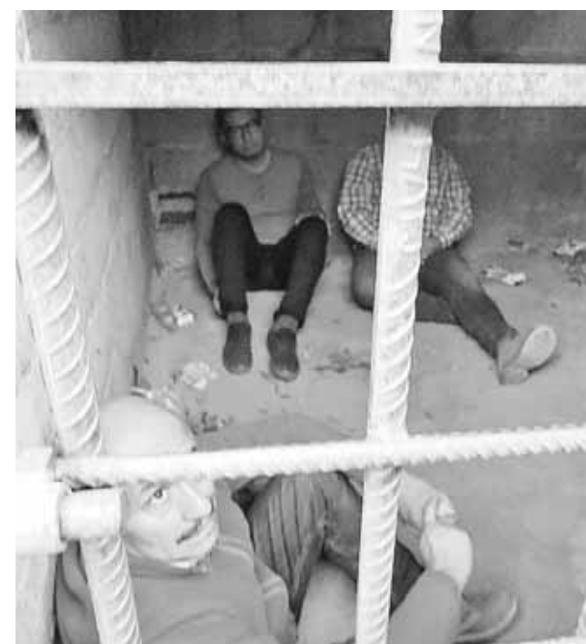
► Los trabajadores del INE habían acudido a la comunidad a entregar nombramientos.