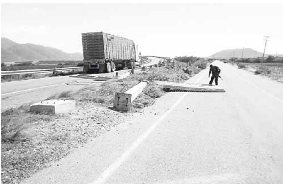
► Los fuertes vientos han causado daños en el Istmo durante los últimos dos días.

Sin embargo, no comunica la fuerza del viento, por