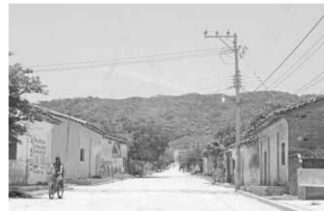
► Los inconformes retuvieron por varias horas a personal del INE.

Los funcionarios fueron liberados después de aproximadamente 10 horas