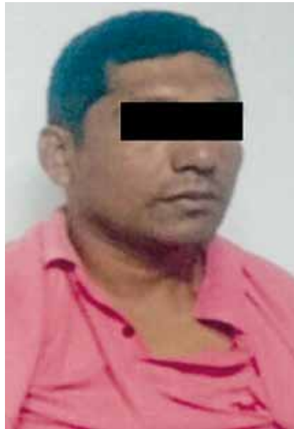
► Después de tres años fue cumplimentada la orden de aprehensión.