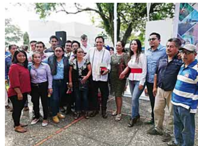
► Si el IEEPCO no valida las actas, aseguran que se pronunciarán por una nueva elección.