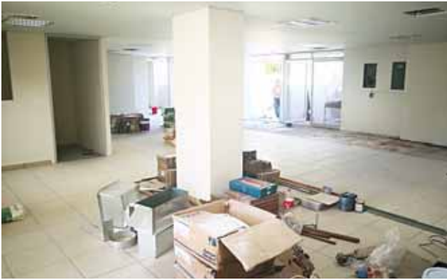
► El área de gobierno presenta avances de rehabilitación.