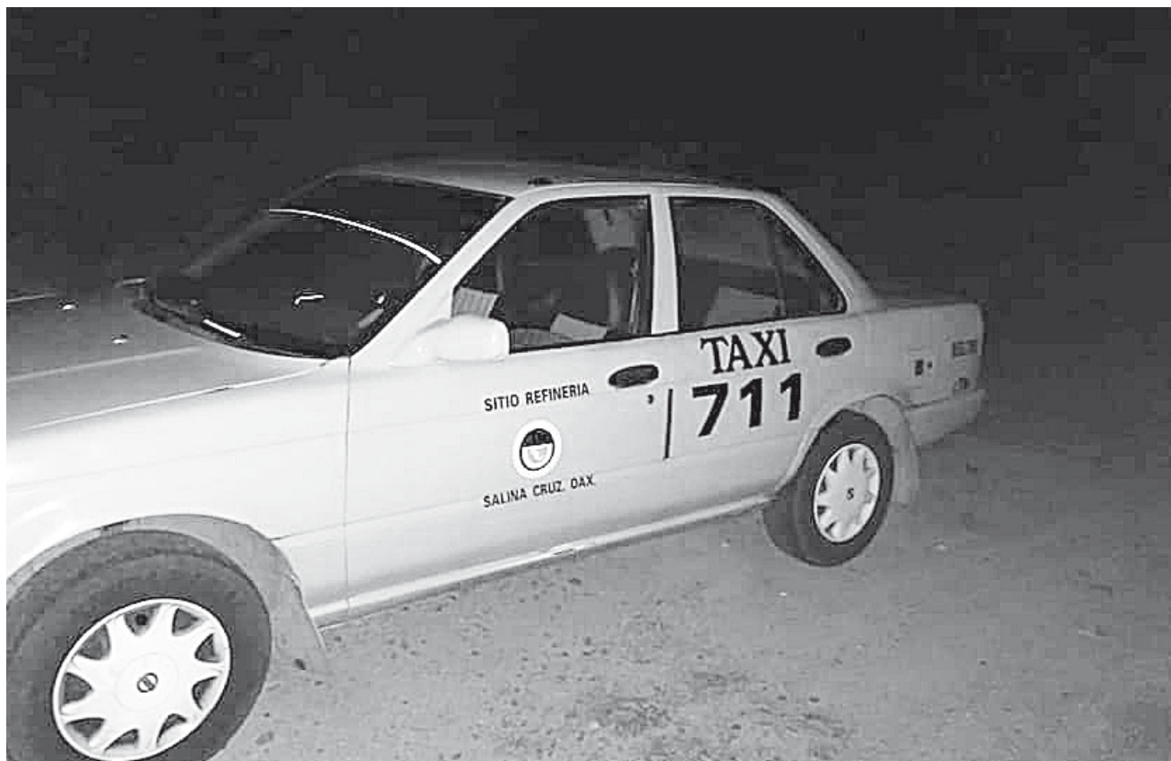
► Aseguran que Salina Cruz se está convirtiendo en un polvorín que en cualquier momento estalla.