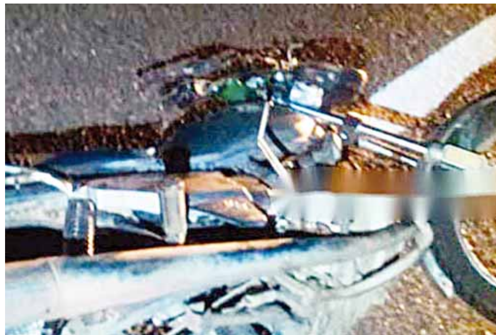
► El accidente que costó la vida al motociclista fue reportado por otros conductores.