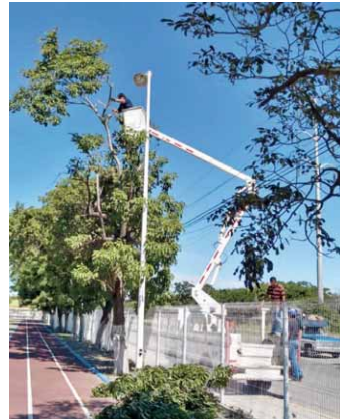
► Aparte de la rehabilitación del alumbrado, también se comenzó con la poda de las ramas para proteger las lámparas.

Indicó que es importante también que la ciudadanía contribuya informándoles donde se registran los daños al alumbrado público para que el personal a su cargo del área de electrificación se aboquen a darle mantenimiento.