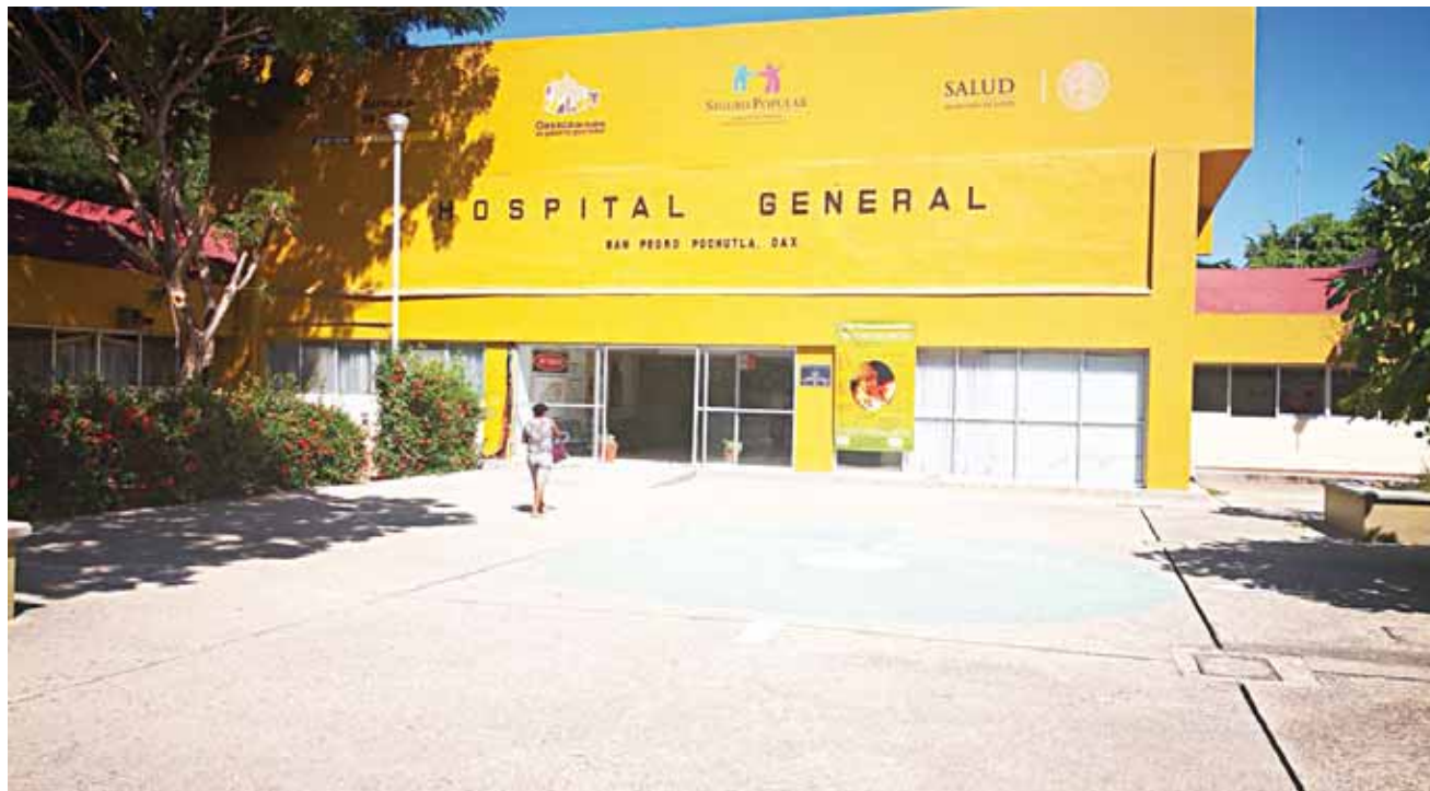
► El hospital regional de Pochutla tiene trabajos de mejoramiento.

de mantenimiento del nosocomio de segundo nivel, detalló que también se dignificó el área de cuneros, así como el área de urgencias, «los trabajos se supervisan, tenemos