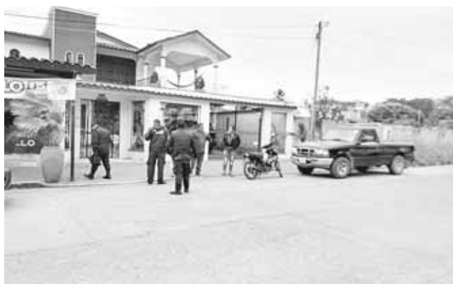
► Los asaltantes la amenazaron de muerte para quitarle sus cosas.

la tarde de ayer cuando la ciudadana acudiera a cambiar algunos dólares al salir de la sucursal para abordar su motocicleta y dirigirse a buscar a su padre, fue alcanzada por un hombre y una mujer quienes mediante la amenaza de muerte la despojaron del efectivo que traía así como de su medio de transporte.