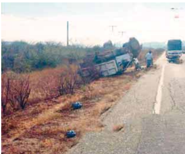
► Como pudo salió de la cabina de la unidad volcada para ponerse a salvo.

Los elementos policíacos solicitaron los servicios de una grúa para poder retirar el camión materialista siniestrado al encierro para deslindar responsabilidad.