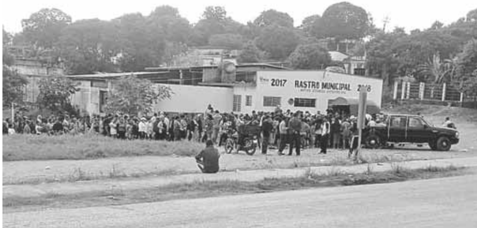
► Señalan a Canadá de apoyar gobiernos que beneficien sus operaciones mineras.