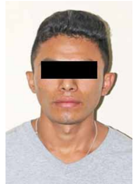
► También se les señala de haber cometido otro asesinato.