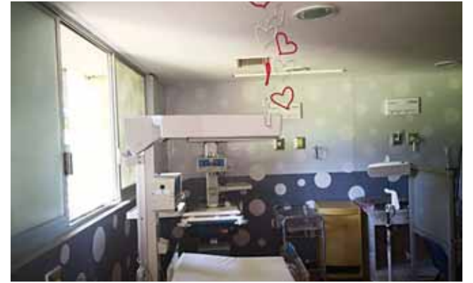
► El área de cuneros fue dignificado.

Con el arribo de un nuevo director para el Hospital General se retomaron los trabajos pendientes de mejoramiento en diversas áreas