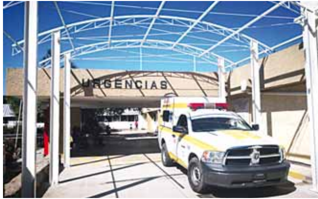
► En la imagen los trabajos de techumbre en el área de urgencias.