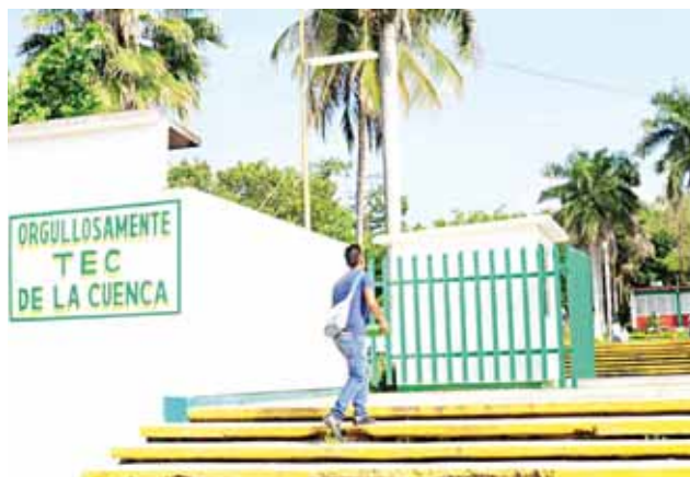
► La cabalgata iniciará este viernes 16 de noviembre a mediodía.

Por lo que este viernes 16 de noviembre se llevara a cabo una cabalgata que partirá al medio día del Parque Hidalgo de la ciudad de Tuxtepec a este Centro educativo, pasando por las principales calles y avenidas, por lo que se invita a la población estudiantil