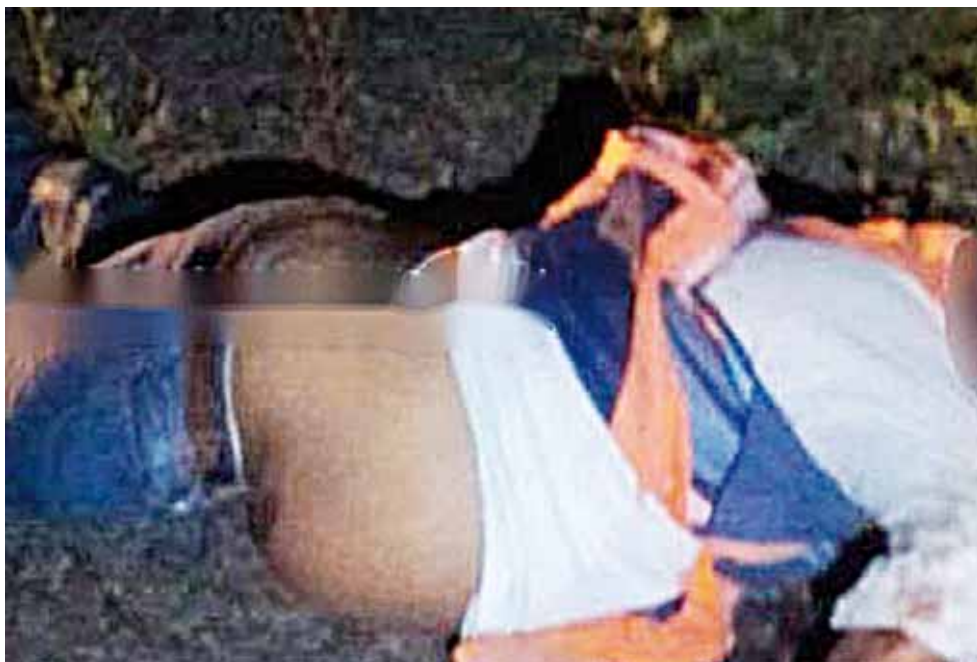
► El occiso era vecino de la comunidad de La Blanca, Santo Domingo Ingenio.