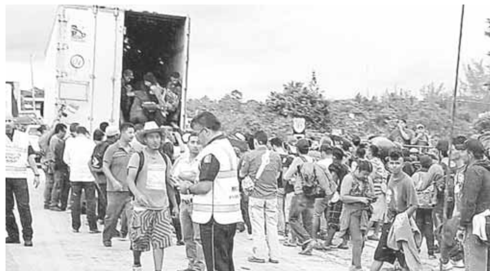
► Entre 50% y 70% de las inversiones mineras en América latina provienen de Canadá.