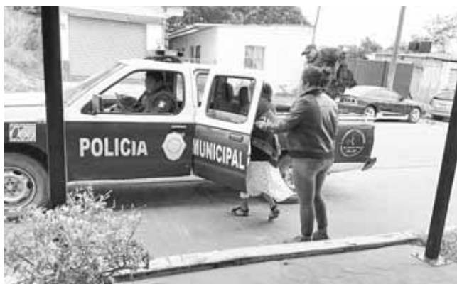
► Acudió a la casa de cambio para cambiar algunos dólares.