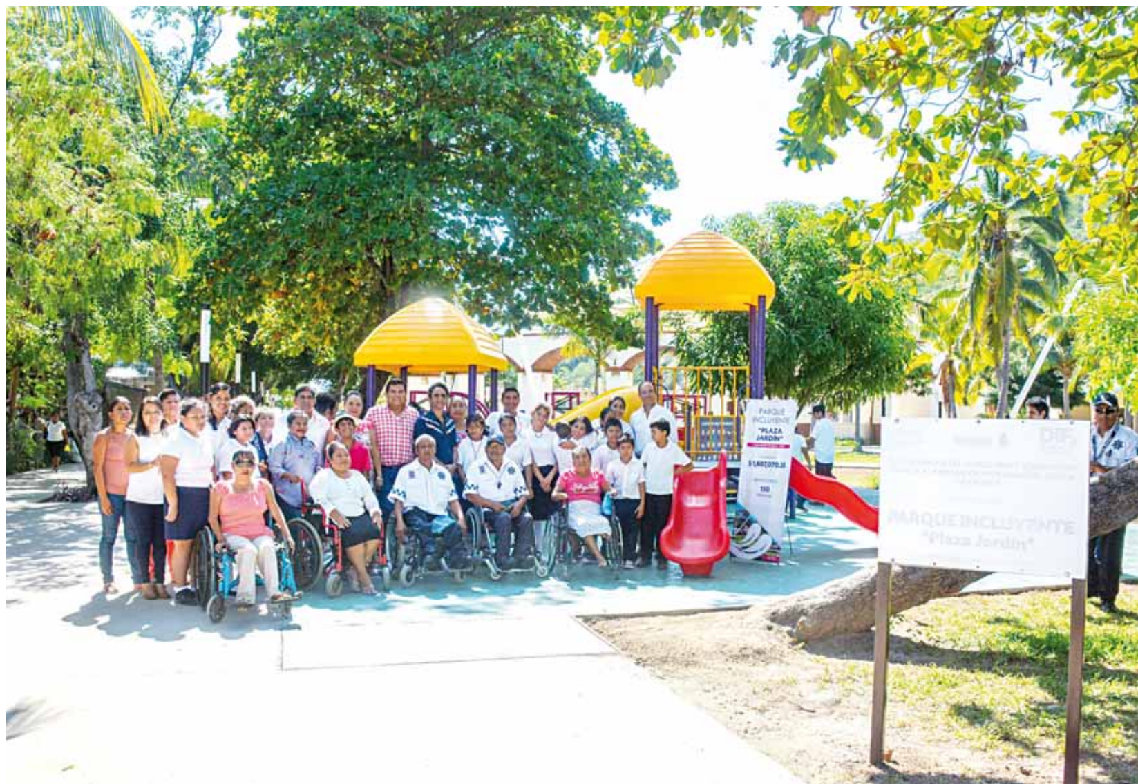
► También se trabaja en la creación de la primera playa incluyente en Huatulco.

La obra forma parte de los cuatro parques incluyentes instalados en el estado; dos en la capital oaxaqueña y uno más en el puerto de Salina Cruz; espacios