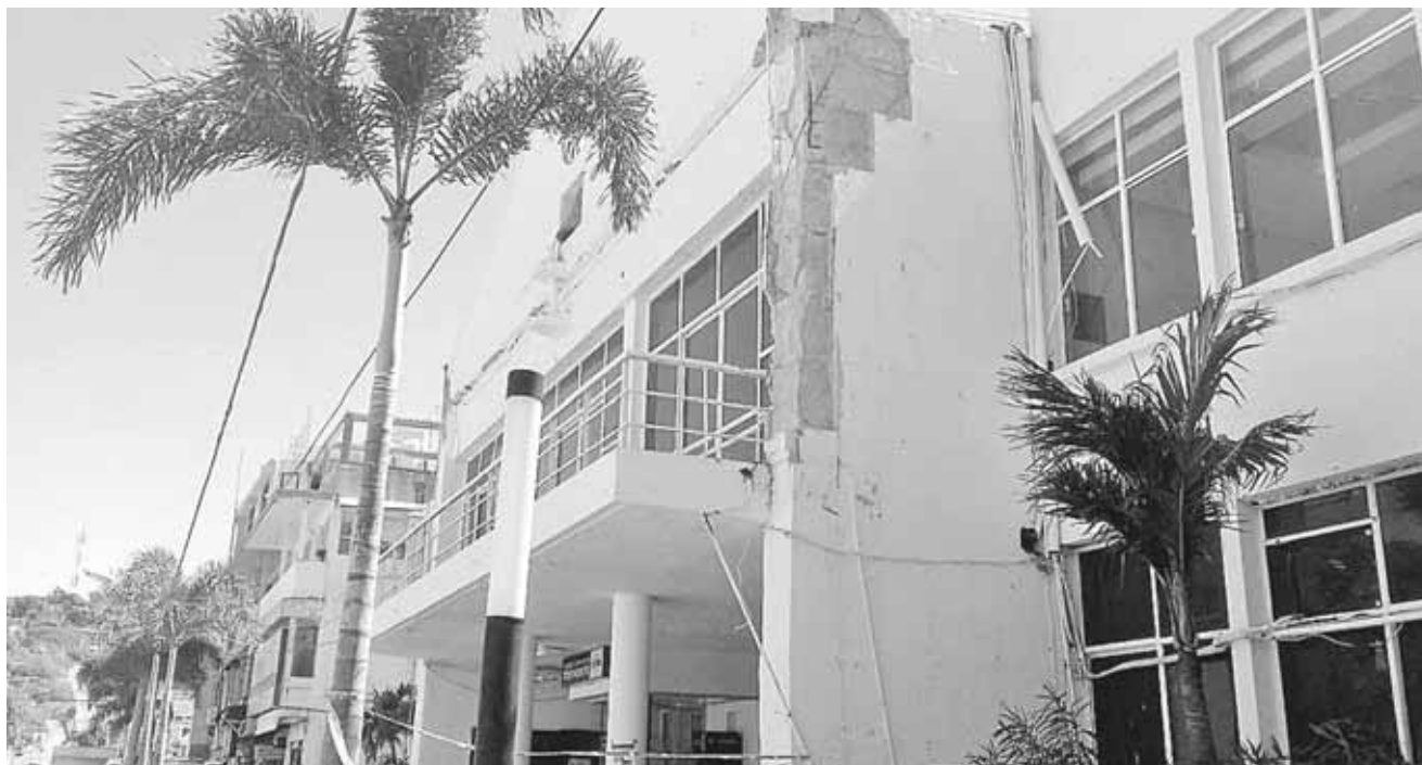
► Los trozos de concreto comienzan a caer ante la falta de mantenimiento para el edificio.

Dijo que desde el 7 de septiembre del año 2017 ha resistido una serie de temblo-