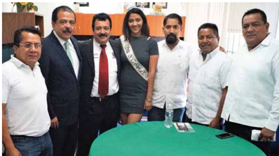
► Han egresado 40 generaciones de ingenieros asegura el director.

Finalmente el presidente municipal se fue con el secretario de la Sedesol al polideportivo de esta comunidad en donde valoraron los avances de los trabajos, y el Secretario prometió regresar el lunes 19 de noviembre para inaugurar algunas obras que están por terminarse en este municipio.