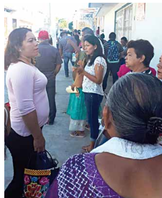
► Los organizadores del censo buscan evitar problemas como en el primer censo.