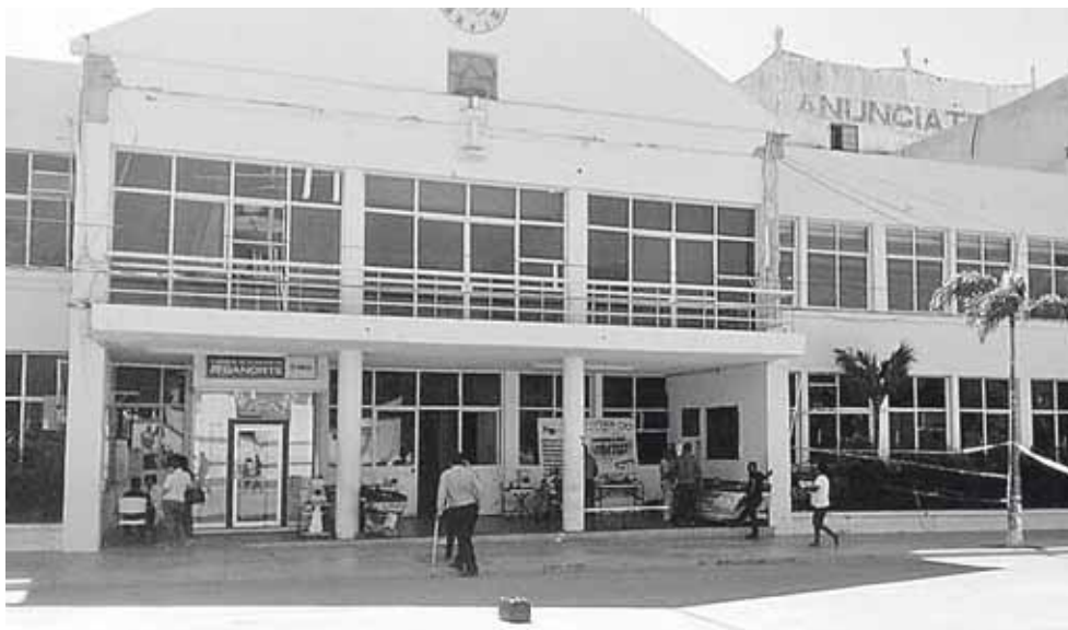
► Las constantes réplicas han estado dañando la estructura física del inmueble.