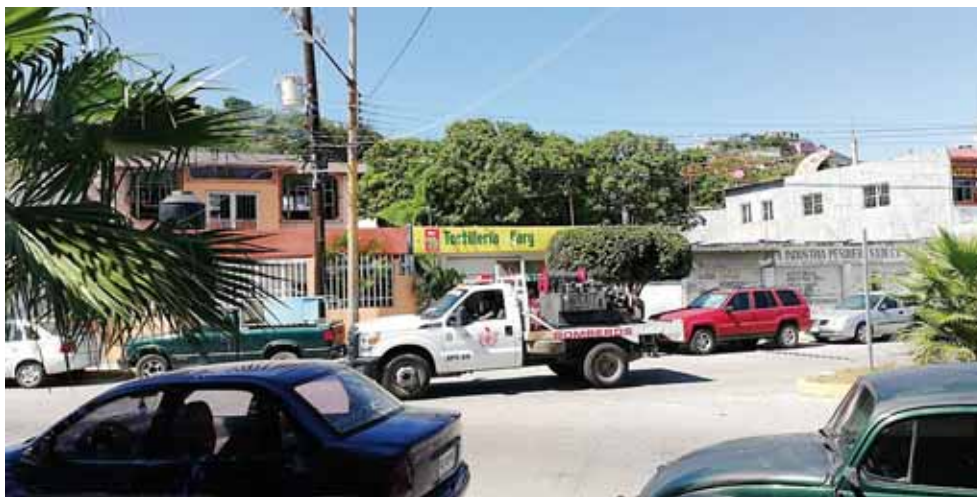
► Elementos de la Policía Municipal resguardaron el área donde ocurrió el incendio.

Los fuertes vientos provocaron que los cables conductores de energía chocaran provocando corto circuito lo que derivó que comenzará a arder un poste