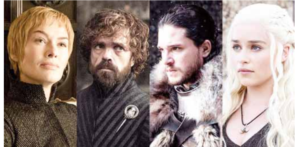
► En 2019 se estrenará la octava y última temporada.

"Toda batalla, toda traición, todo riego, toda lucha, todo sacrificio, toda muerte. Todo por el trono", indicó HBO en el mensaje que acompaña al video.