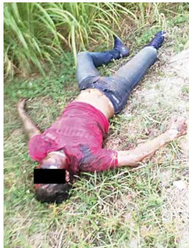
► Todo indica que estaba en calidad de turista en este destino de Puerto Escondido.

En ese momento los municipales se avocaron al acordonamiento del lugar, para posteriormente hacerle del conocimiento al personal de la Agencia Estatal de Investigaciones, una vez que la autoridad correspondiente se apersonó en el lugar, inició con las diligencias pertinentes, en un inicio se dijo que la persona que yacía sin vida en el lugar, se encontraba en calidad de desconocida, se calculaba que posiblemente contaba con más o menos 30 años