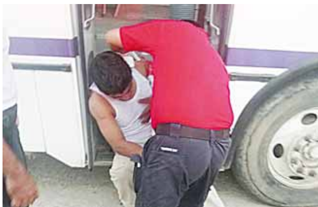
► Fue agredido sobre la carretera interestatal numero 131.