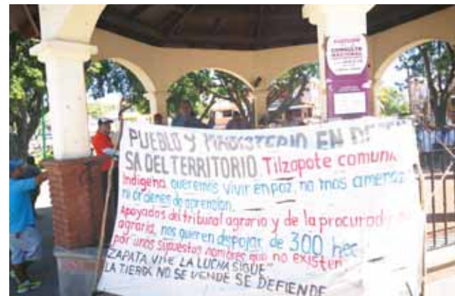
► El magisterio amaga medidas de protesta si no cancelan el desalojo.

Para los pobladores y comuneros es claro que las omisiones en el juicio agrario fueron letales para converger en una reversión o despojo de las tierras comunales, "ya hemos detallado que Tilzapote fue objeto de estudios de campo y deslindes en 1970 para poder ser parte de la resolución presidencial de 1986 y ser reconocidos como anexo comunal del núcleo agrario de Cozoaltepec, durante ese periodo jamás nadie reclamó Tilzapote, ahora que ven jugosos negocios inmobiliarios nos quieren despojar a base de argucias legaloides y omisiones de quiénes en su momento debieron presentar los argumentos agrarios", concluyeron varios comuneros.