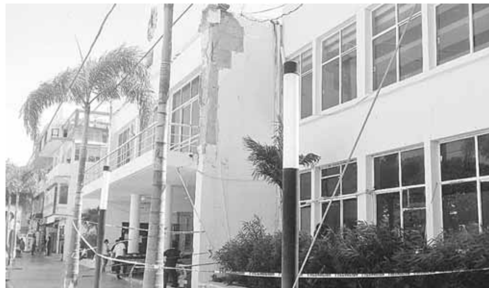
► Desde el 7 de septiembre, el edificio ha resistido varios temblores.

A un año y dos meses del sismo de 2017, permanece abandonado el Palacio Municipal y una parte de la fachada ya comienza a desmoronarse