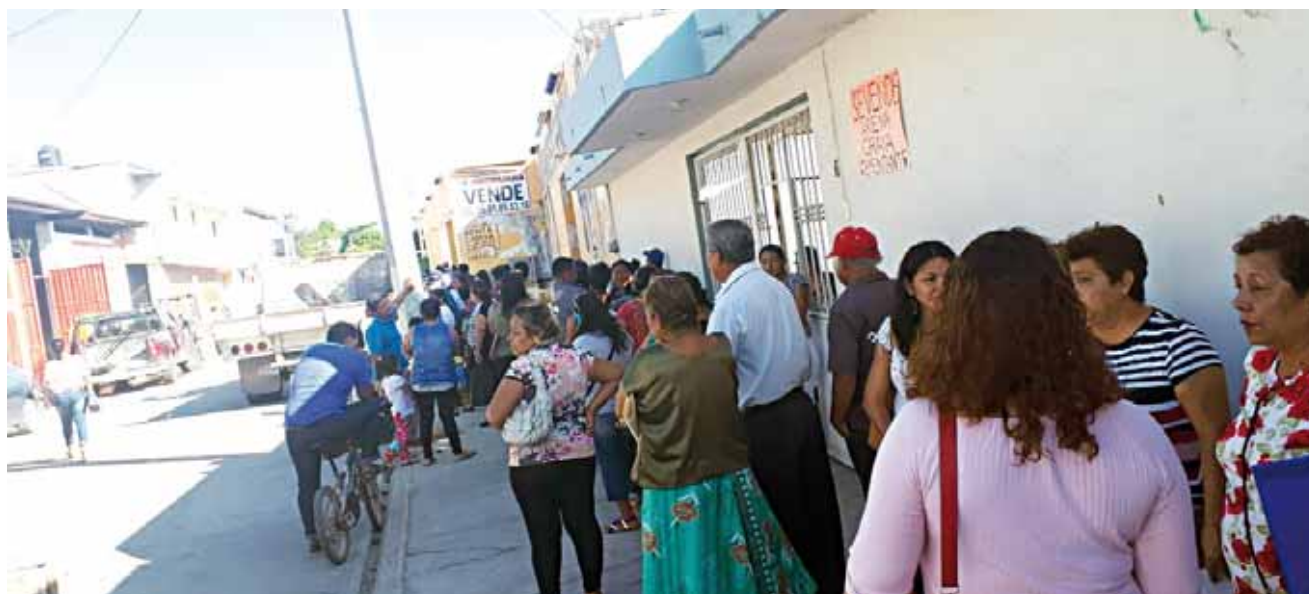
► Se han dado a conocer las listas de las 5 mil 179 personas que recibirán el apoyo del Fonden.