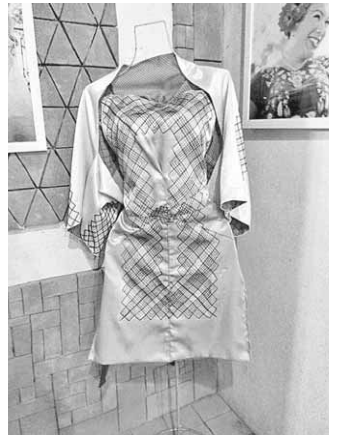
► Estos diseños están bajo la licencia de Creative Commons para evitar plagios.