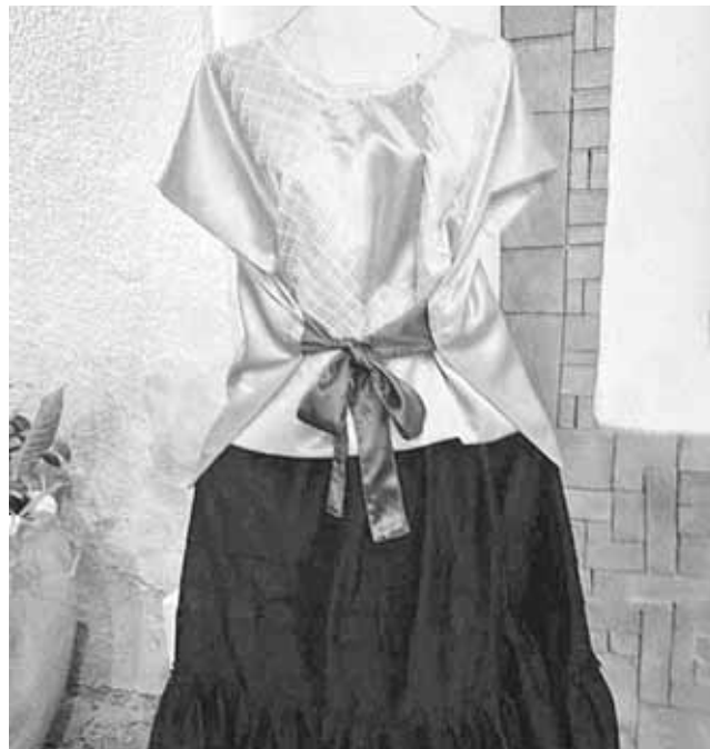
► Para la exposición, la diseñadora realizó una investigación sobre la vestimenta del Istmo.

“Me refiero a esta simbiosis, porque tanto la ropa tradicional japonesa como la ropa tradicional mexicana no utilizan talla, no hay talla chica, mediana, grande, es unitalla y además no hay un patrón americano, anglosajón, enton-