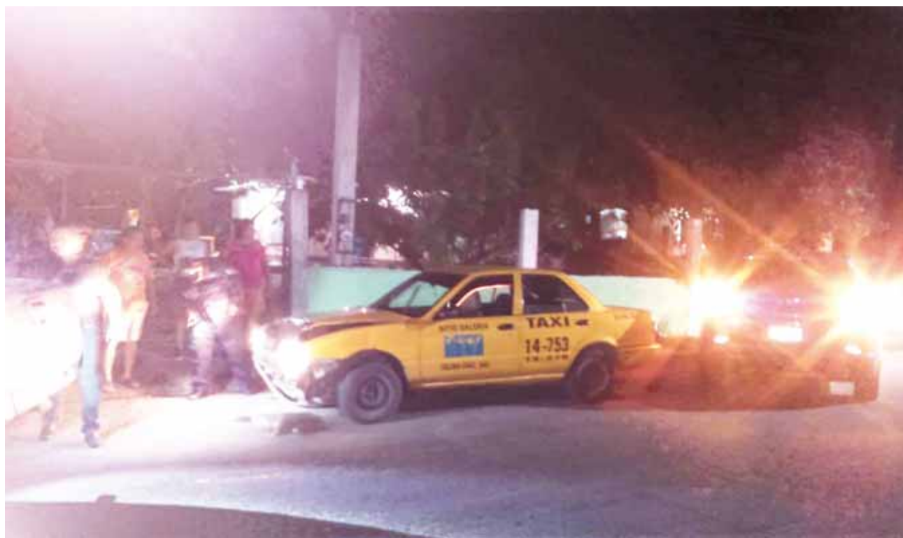
► Agentes viales ordenaron que la unidad fuera enviada al corralón.

Asimismo les tomaron los datos a ambos involucrados para poder determinar su responsabilidad en la comisión de este incidente automovilístico.