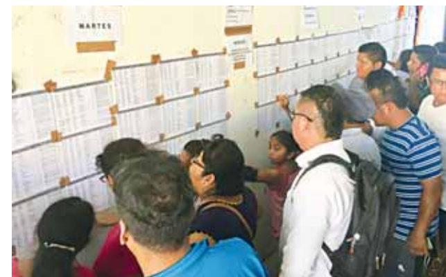
► La recepción de los documentos se estará realizando los días martes, miércoles y jueves.

Indicó que los cheques por daño parcial serán de una sola exhibición (15 mil pesos), mientras que por daño total (120 mil pesos), serán dos cheques este año y dos más el siguiente año, cheques personales, no negociables, que el beneficiario podrá cambiar en el banco, por lo que la revisión será exhaustiva.