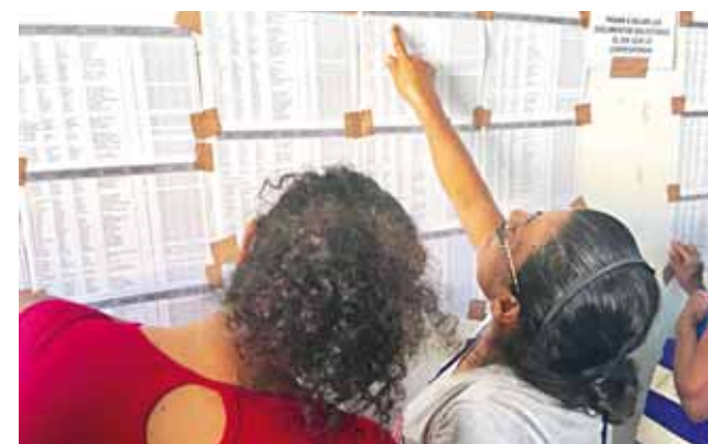
► La entrega de los apoyos se llevará a cabo dentro de dos semanas aproximadamente.