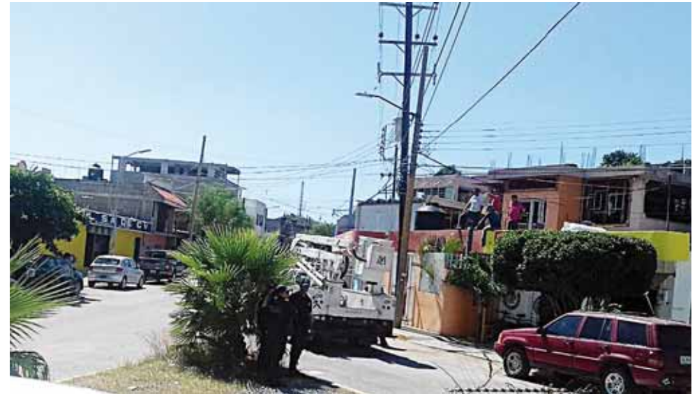
► Los vecinos tenían temor por lo que solicitaron el auxilio a Protección Civil.