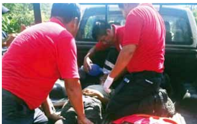
► Trascendió que la persona fallecida tenía 49 años.