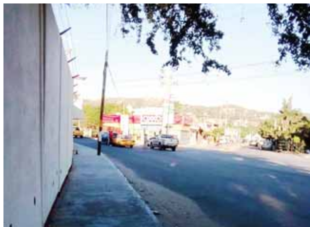
► Los agentes pidieron a los involucrados a ponerse de acuerdo para cubrir sus daños.

Agentes viales ordenaron que la unidad fuera enviada al corralón para fincar responsabilidad en relación a este accidente.