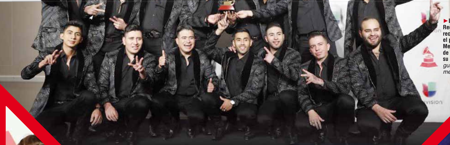
► Los Recoditos recibieron el premio al Mejor Álbum de Banda por su disco Los gustos que me doy .