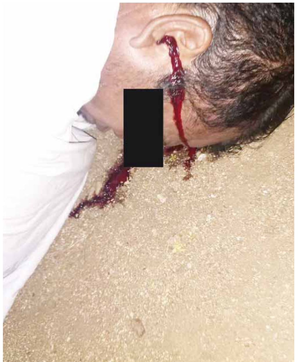
► La víctima recibió varios disparos.