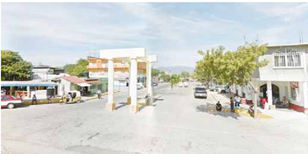
► El homicidio se suscitó en Jalapa del Marqués.

Por tal motivo se levantó un legajo de investigación por homicidio en contra de quien o quienes resulten responsables de cobarde crimen.