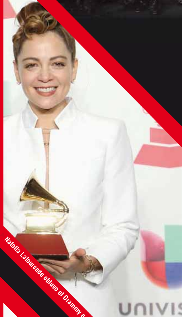
Natalia Lafourcade obtuvo el Grammy a Mejor Álbum Folclórico.