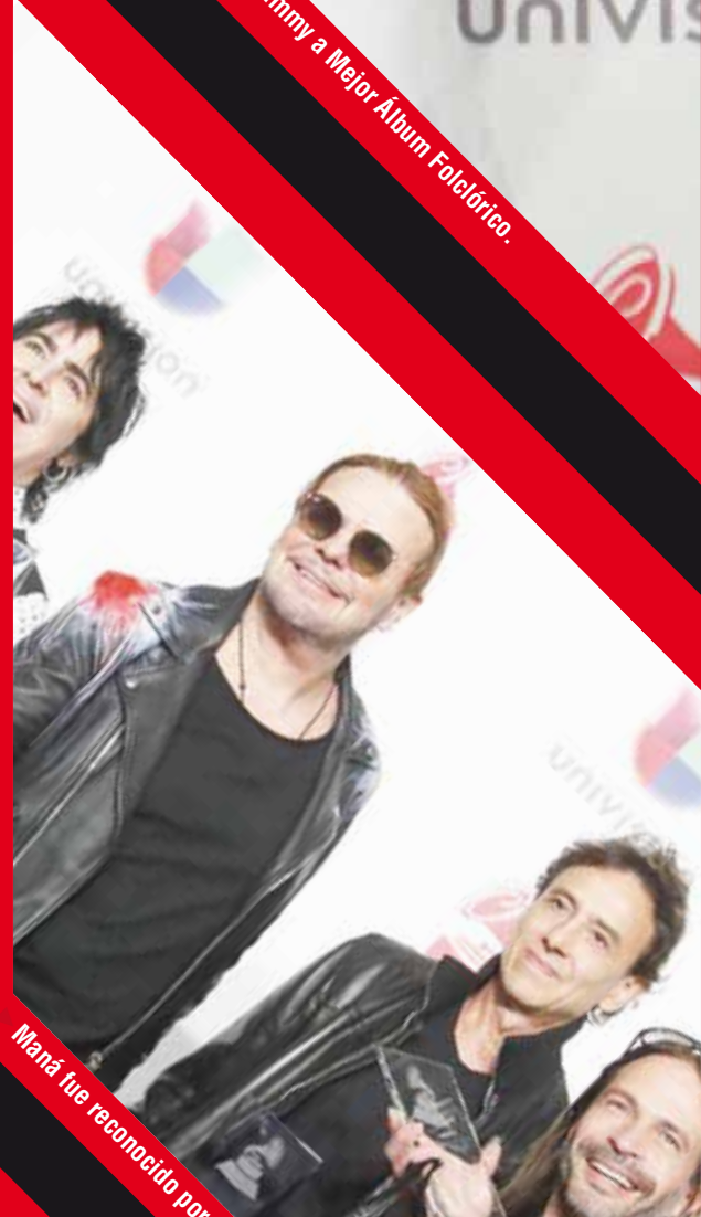
Maná fue reconocido por su larga trayectoria musical y sus contribuciones altruistas.