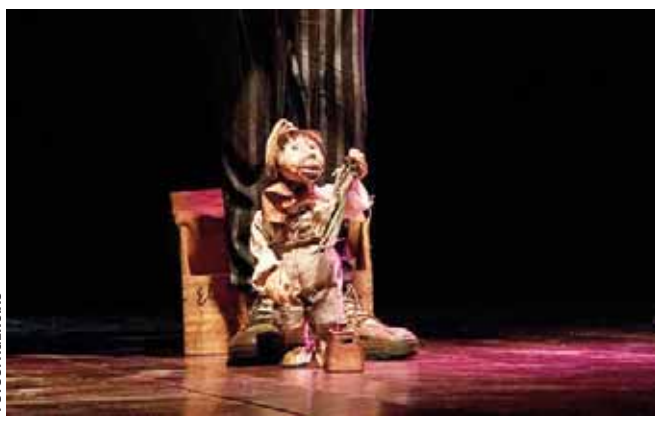
► Punchileros Titeres.

Entre las obras a presentar está Nozi, madrina de libros, que pertenece a la trilogía de cuen-