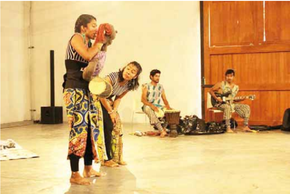
► Los de siempre colectivo.

enescena@imparcialenlinea.com / Teléfono 501 83 00 Ext. 3172