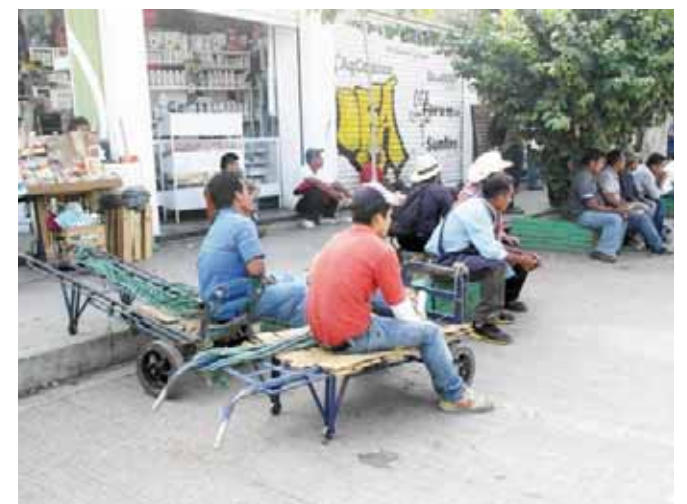
► La gente se identifica con lo que observan.