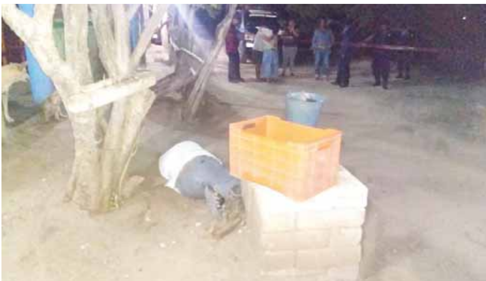
► Al parecer fue asesinado por negarse a pagar derecho de piso.