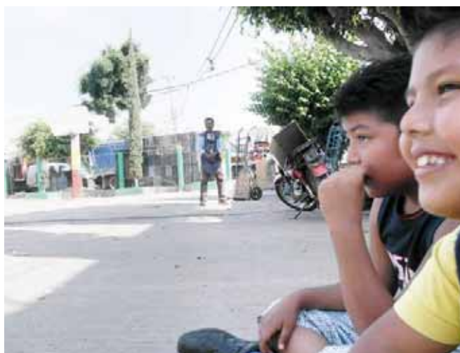
► Los niños se sienten atraídos por este tipo de expresiones.