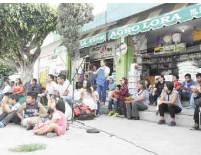
► El teatro callejero es más cercano a la gente.

Después de Oaxaca, el festival tendrá réplicas (pequeñas intervenciones) en Tapachula, Chiapas; Ciudad de México, Monterrey, Nuevo León; Sevilla (España), Bogotá (Colombia) y por Francia.