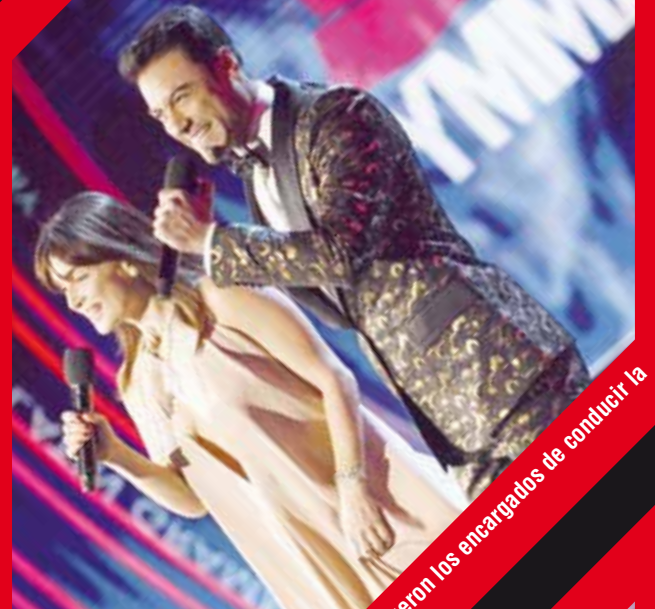
Los mexicanos Carlos Rivera y Ana de la Reguera fueron los encargados de conducir la ceremonia número 19 de los Grammy Latinos.