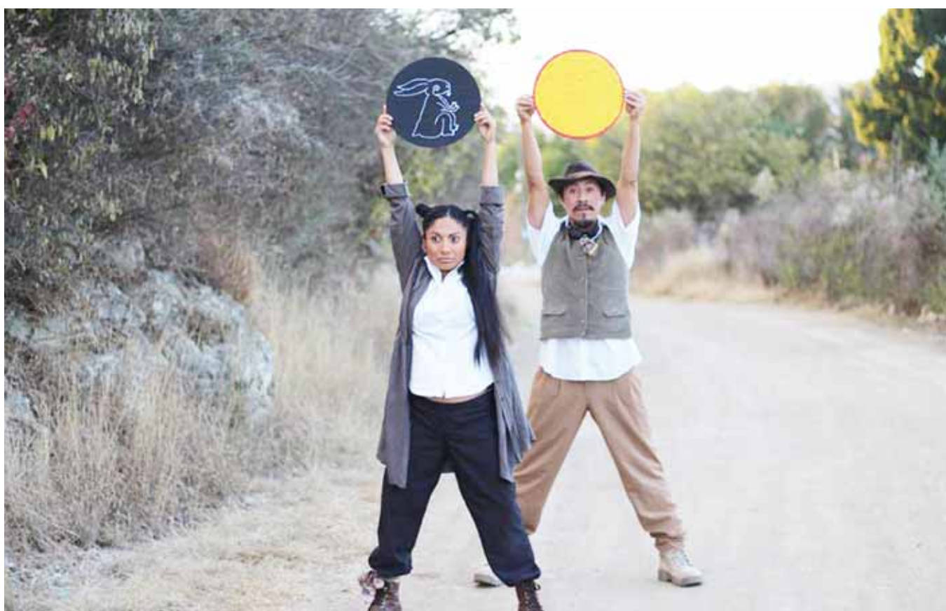
► Integrantes del grupo Pelo de gato, un ojo al teatro y otro al garabato, participan en el festival.

CON PUESTAS EN ESCENA DE TIPO CALLEJERO, GRUPOS DEL PAÍS SE UNEN A LA SEGUNDA EDICIÓN DEL FESTIVAL, QUE SE REALIZARÁ DEL 1 AL 5 DE DICIEMBRE