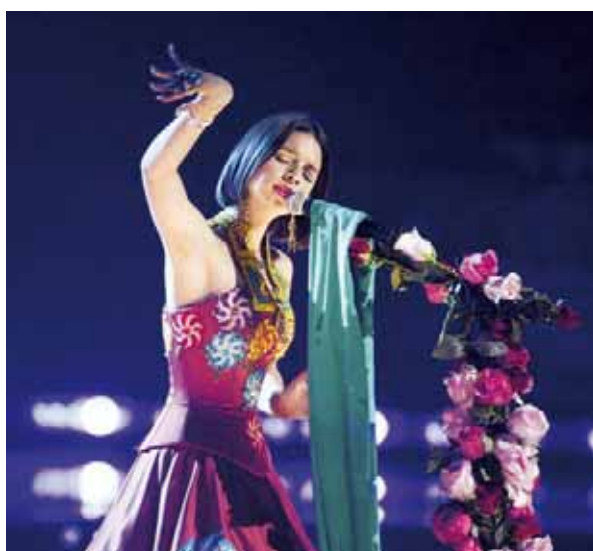
► Ángela Aguilar, hija del cantante Pepe Aguilar, entonó La Llorona .

La ceremonia del Latin Grammy 2019 fue conducida por Carlos Rivera y Ana de la Reguera, también contó con la participación musical de Marc Anthony, Will Smith, Karol G y Bad Bunny.