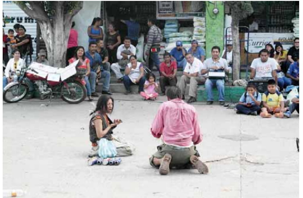
► Chachareando o concierto para basura y dos pepenadores.