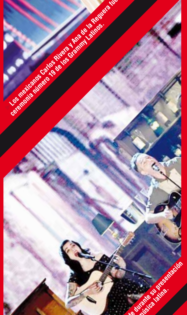
David Aguilar, Mon Laferte, Jorge Drexler y Natalia Lafourcade durante su presentación en el escenario de la 19ª entrega de los premios a lo mejor de la música latina.