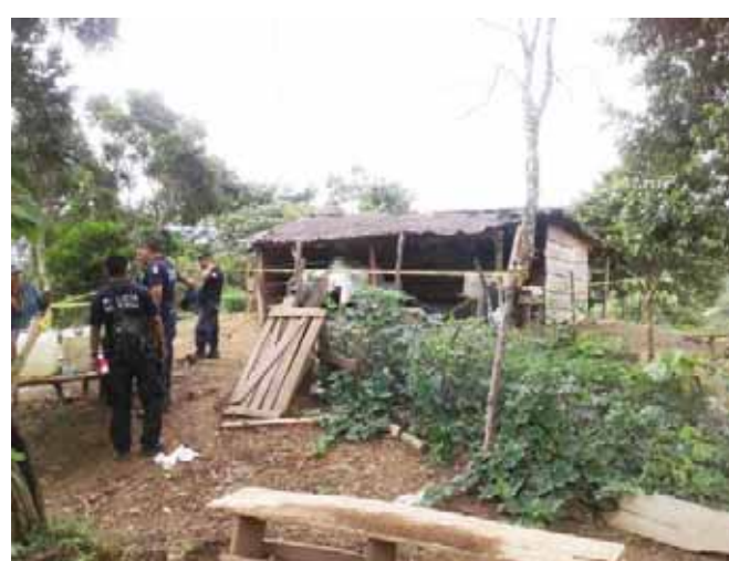
► El cuerpo fue localizado por el dueño del rancho.

El dueño del rancho al darse cuenta del criminal dio parte a la Policía Municipal quien a su vez informó a la Fiscalía para la realización de las primeras diligencias y levantar el cadáver. La Policía Municipal acudió al lugar para acordar el área, en tan-