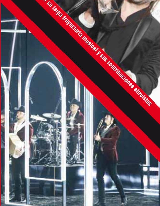
El grupo mexicano de música norteña Calibre 50 interpreta su canción 'Corrido de Juanito' durante la gala.