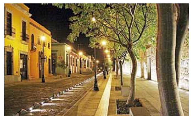
▶ Centro Histórico de la ciudad de Oaxaca.

Mientras que el centro ceremonial de Monte Albán ha creado un paisaje arquitectónico que representa un logro artístico único en su tipo; es ejemplo, de un centro ceremonial precolombino en la zona media del México actual con su juego de pelota, templos, tumbas bajo relieves con inscripciones jeroglíficas que dan testimonio único de las civilizaciones que habitaron el valle durante el periodo preclásico y clásico.