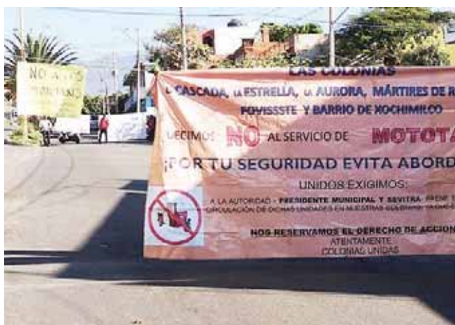
▶ La gente no permitirá el ingreso de estas unidades.