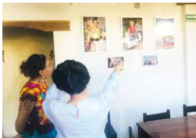
► Muestra las cualidades de los muxes como seres humanos.