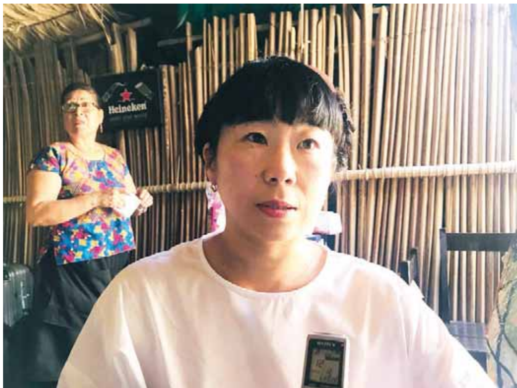
► Desde 1999, la fotógrafa japonesa viaja a Juchitán para retratar a los muxes.

enesena@imparcialenlinea.com / Teléfono 501 83 00 Ext. 3172