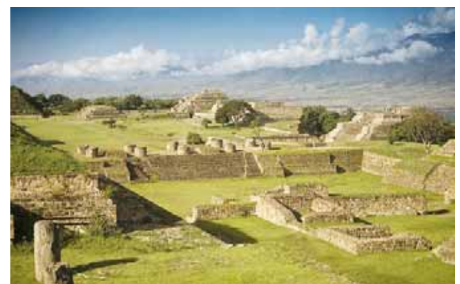
▶ Zona arqueológica de Monte Albán.