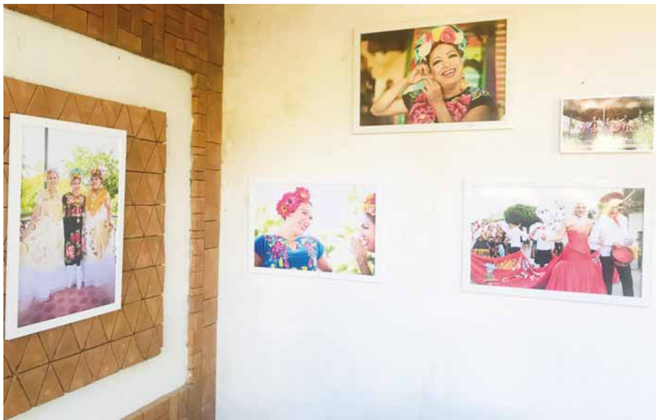
► Le gusta mucho acercarse a las comunidades en donde tienen un sentido de relaciones muy fuerte.

Señaló que quiere expresar el lado positivo, “yo creo