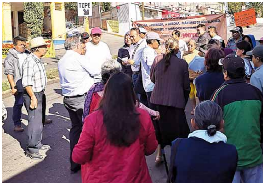
▶ Los vecinos se reunieron y exigen una mesa de diálogo con las autoridades.

Viajar en el transporte público como en los camiones urbanos, taxis y mototaxis, es aventurarse a un viaje de alto riesgo en la Zona Metropolitana de Oaxaca (ZMO), son inseguros, los operadores son agresivos, montoneros y no respetan las señalizaciones de tránsito.