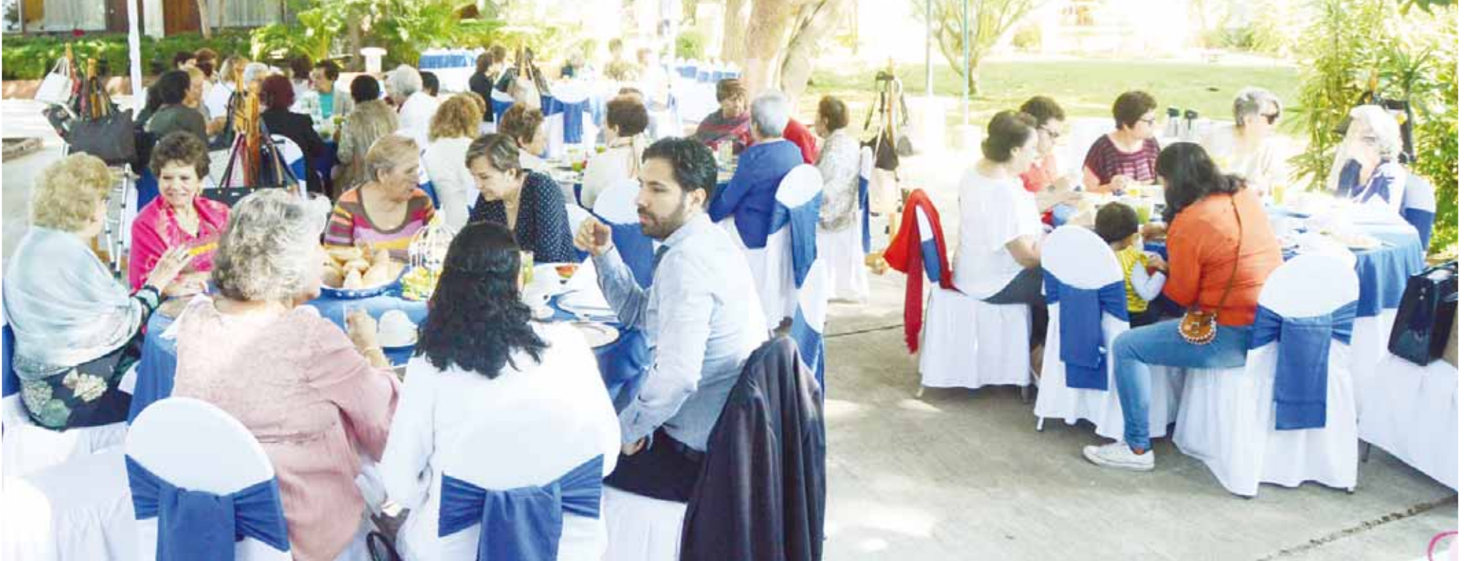
► Los invitados la pasaron increíble.