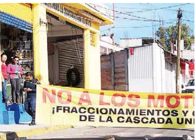
▶ La exigencia principal es la salida de los mototaxis.

Con la promesa de las autoridades de llevar a cabo los operativos, alrededor de las 13 horas, los vecinos retiraron el bloqueo, pero advirtieron que tomarán otras acciones en caso de que estas unidades continúen circulando en la zona.