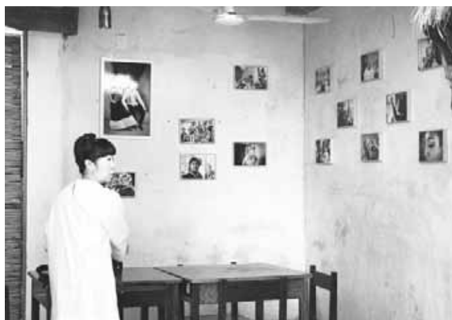
► Se aprecia el sentido del valor, la protección y la hermandad.

que estos prejuicios vienen de la colonización, en el momento en que la cultura occidental se pone encima de una cultura que ya existe, surgen estas situaciones como de desigualdad, económica, sexual y de varios asuntos”.