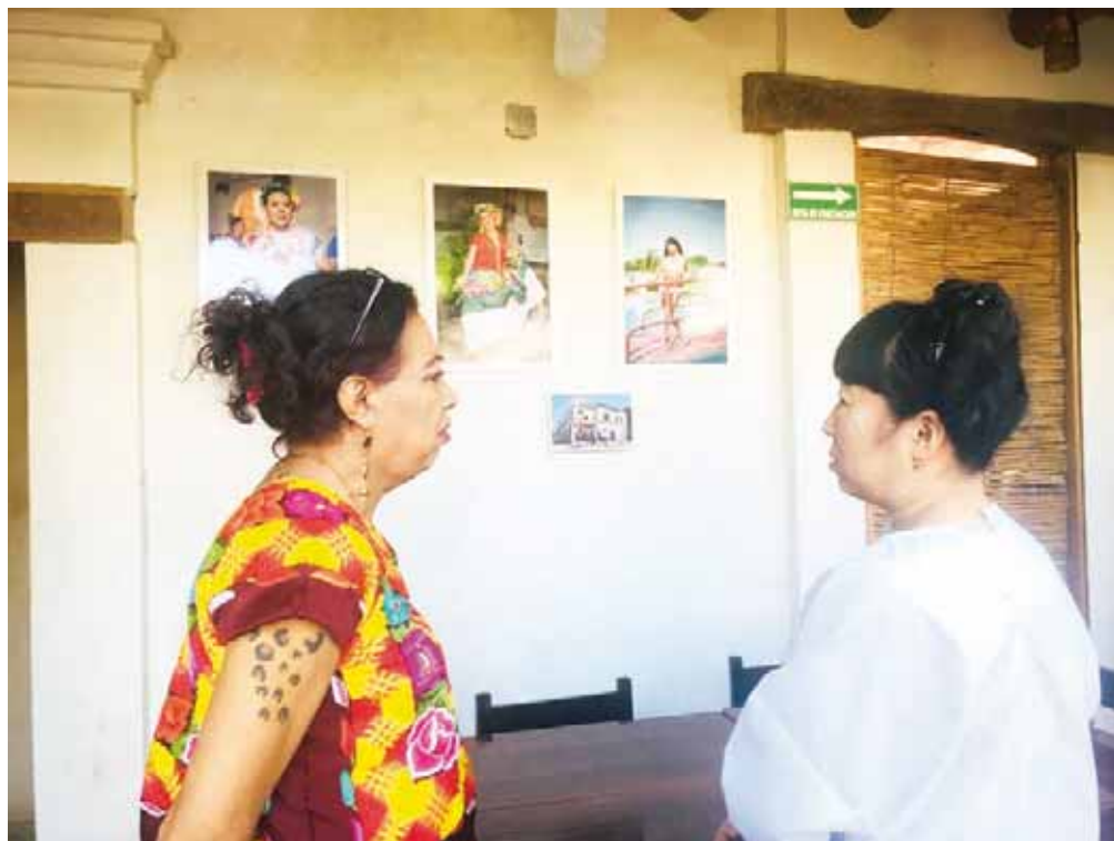
► Colección de imágenes de belleza, fuerza y seguridad.

TEXTO Y FOTOS: FAUSTINO ROMO MARTÍNEZ/CORRESPONSAL