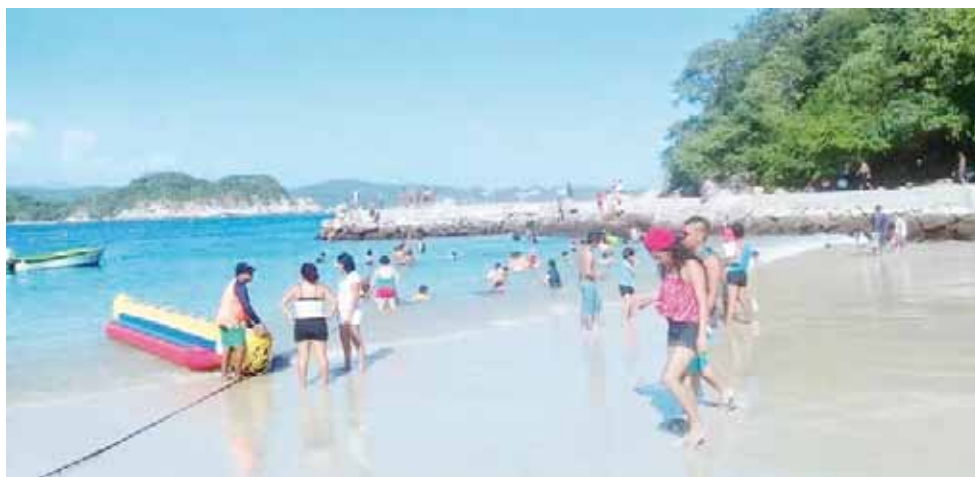
► Ocurrió en Playa la Entrega.

Bañista es rescatado por un lanchero la tarde de ayer domingo, en Playa La Entrega, algunos socorristas le brindaron los primeros auxilios y hoy está fuera de peligro.