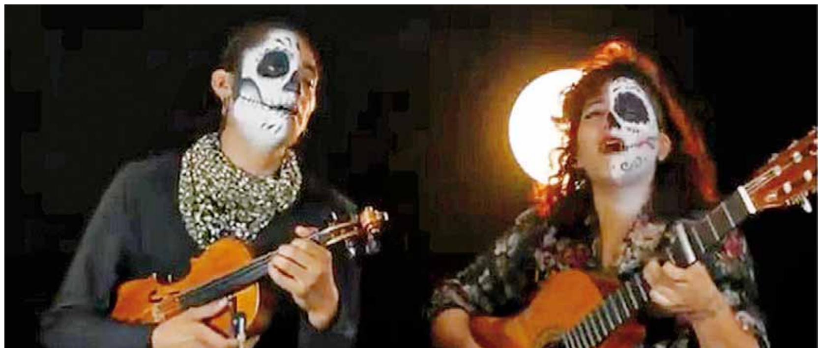
► Dueto Bajo mis manos.

La interpretación fue gestada en una forma coral en una noche de borrachera en casa del pintor Oswaldo