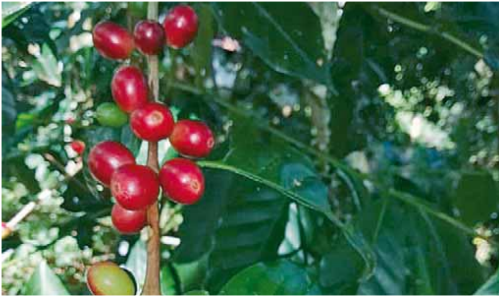
► Notificaciones positivas aprobadas.