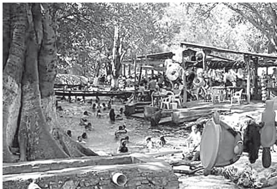
► Decidieron boicotear el ojo de agua.

COMISARIADO DE BIENES COMUNALES STGO. LAOLLAGA, OAX.