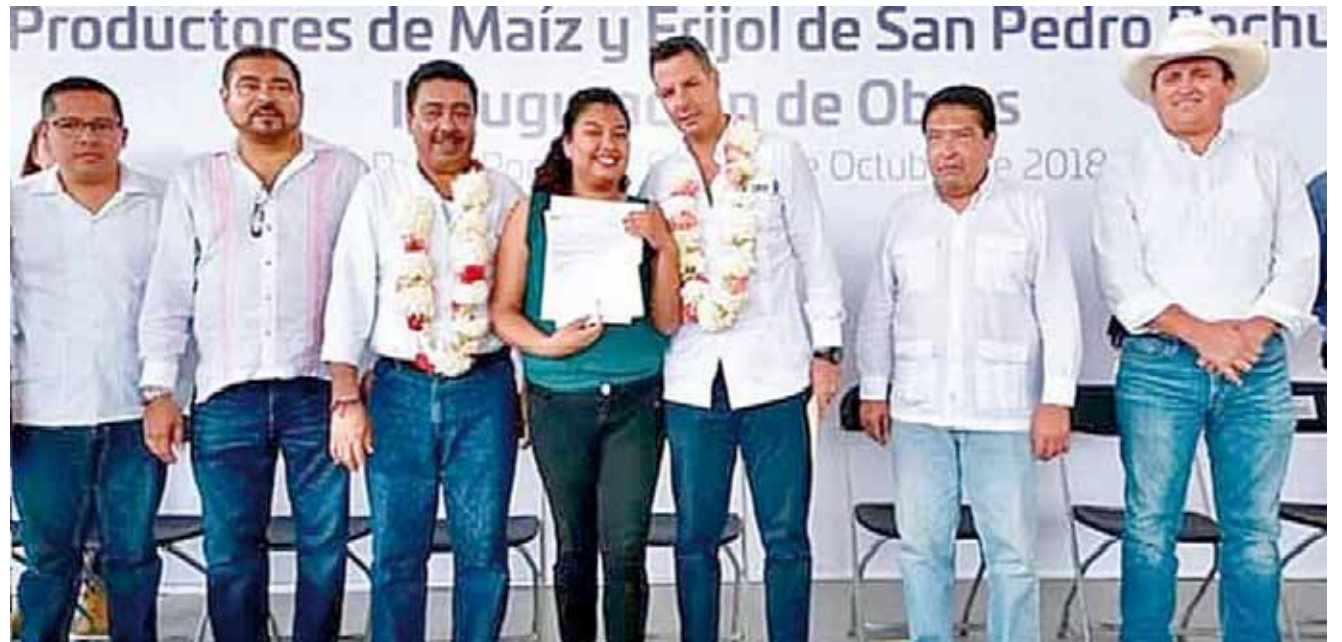
► El Gobernador Alejandro Murat entregó apoyos a caficultores de la Costa y Sierra Sur.

Cabe destacar que la Sagarpa a través del programa Concurrencia de la Alianza para el Campo emitió recursos económicos bajo dictámenes técnicos ya