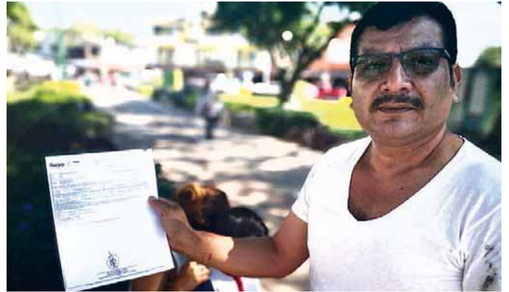
► Convenios específicos por menores cantidades emitidas por Sedapa.

Sedapa pretende recortar recursos a los productores de café de la región, piden apoyo del gobernador