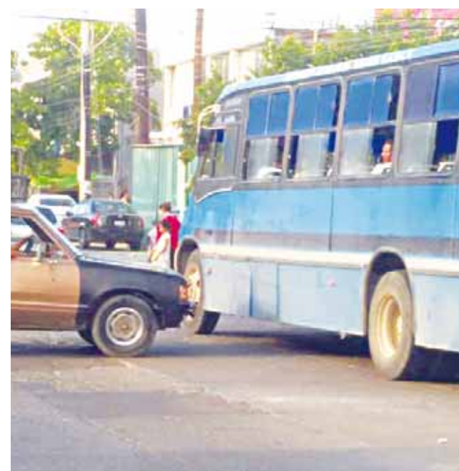
► Los usuarios no cuentan con ninguna garantía.