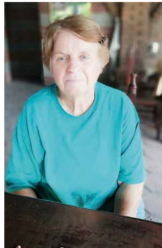
► La ciudadana estadounidense espera respuesta desde hace ya un tiempo.

Es importante señalar que la afectada se encuentra hospedada en la ciudad desde esa fecha hasta hoy día en espera de ser atendida, por lo que es importante que las autoridades actúen conforme a derecho ya que esta acción deja mucho que desear, sobre todo que se trata de una ciudadana americana, que lo único que pide es que le reparen su camioneta, o la autoridad proceda contra el implicado.