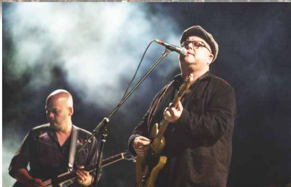
► Pixies emocionó al público con canciones como Ed is Dead.

Las niñas estaban en los hombros de sus padres; los morritos bebés dormidos en los brazos de sus padres sin importar que Black Fran-