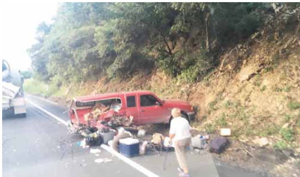
► Su auto quedó con daños severos.