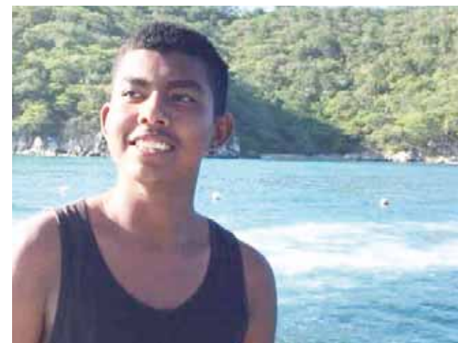
► Fue rescatado por un lanchero.