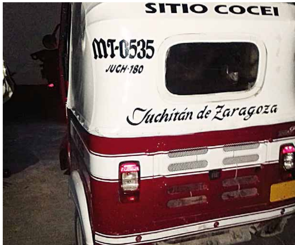
► Los presuntos ladrones intentaban huir en un mototaxi.

El ahora detenido y la unidad asegurada por elementos Municipales, fueron puestos a disposición del Ministerio Público de esta ciudad a petición del afectado, ya que dijo necesitar sus pertenencias y el dinero en efectivo que estos dos hermanos robaron de la tienda de ropa ubicado en pleno centro de esta ciudad.