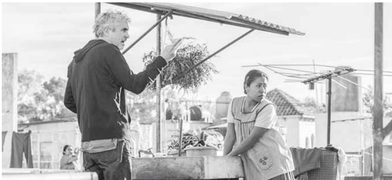
► Roma, película del mexicano Alfonso Cuarón.

Con ellas, la asociación festeja un trabajo hecho desde distintos frentes: la formación (como la hecha desde junio hasta este mes mediante el programa OaxacaCine Formación), la exhibición (a través de las proyecciones filmicas que se realizan por ciclos a lo largo del año) y la preservación (a través de los archivos audiovisuales, su diagnós-