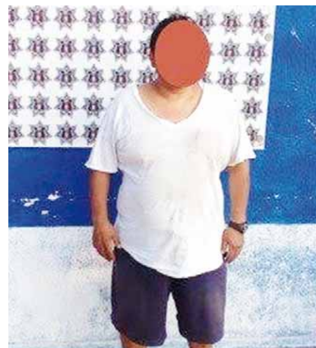
► Fueron puestos a disposición de la procuraduría.