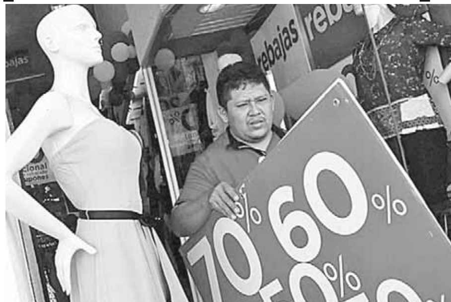
► Los mexicanos gastarán este año mucho más que el anterior.

El uso de medios electrónicos en las compras tomó fuerza en los últimos años; en particular, el uso de tarjetas de crédito y débito registraron operaciones de compra por 21 mil millones de pesos, 52 por ciento de las ventas totales, mientras que en 2017 sumaron 63 mil millones de pesos que es 68 por ciento del total, debido en particular al mayor uso de plásticos de crédito.