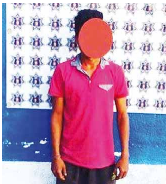
► Fueron detenidos.