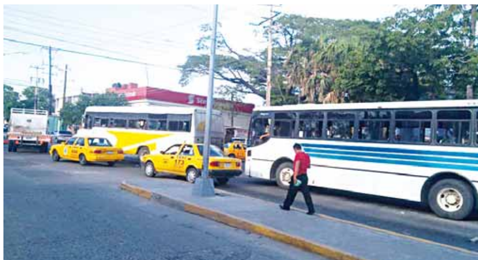
► Son casi 45 mil usuarios diariamente utilizando el transporte público.