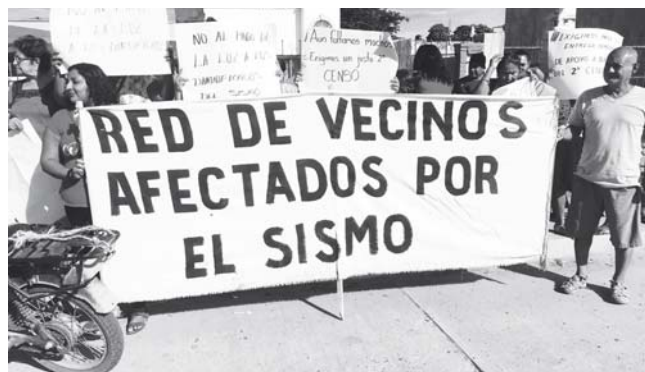
► Exigen al gobierno respetar los acuerdos hechos con los damnificados.

“La autoridad municipal en vez de respaldar la lucha de los damnificados, pretende decir que todo es falso, hasta la creación de la Red de Vecinos, dice así por ahí hay un grupito, cuando nosotros echamos sido única organización de damnificados que ha entregado más de 400 apoyos a totoperas, panaderas, que ha bajado más de 2 mil tarjetas del Fondo, cuando esas tarjetas ya no iban a regresar a Juchitán, hemos exigido el Segundo censo y que se resuelvan todos los rezagáis del primer censo, aún hay 50 compañeros que no han podido cobrar”, comentó