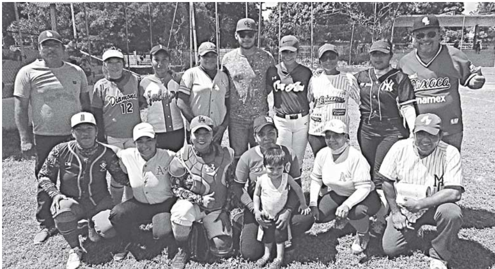
► Atléticas del Marqués, lideresas absolutas.