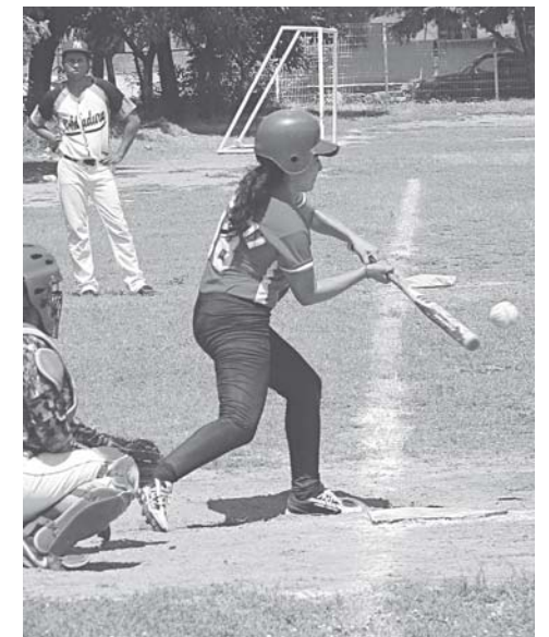
► Con seguro contacto la batería.

Atlético Halcones se mantiene en el quinto puesto con tres juegos ganados por trece perdidos y Atléticas del Marqués no suelta el liderato cosechando catorce triunfos por solo dos derrotas.