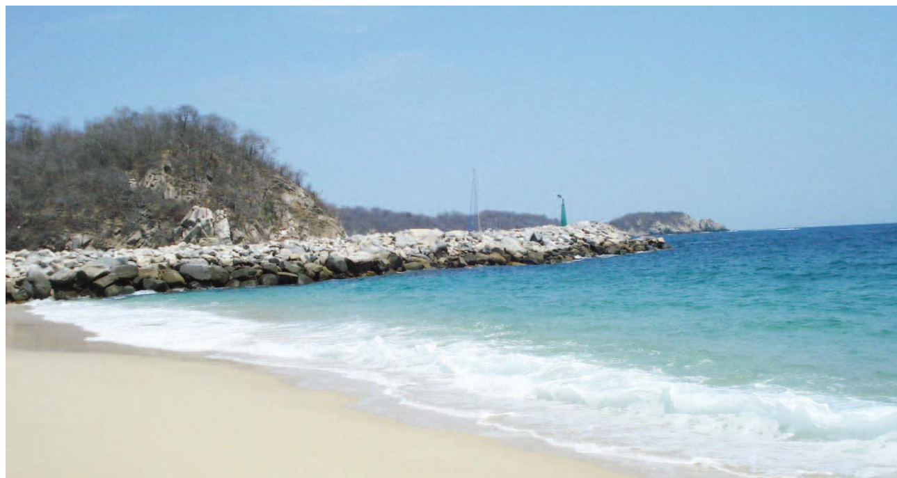
► El cuerpo corresponde a una persona de aproximadamente 54 años de edad.

Presuntamente se había reportado que al interior de la unidad viajaba un grupo de personas sospechosas sin embargo no encontraron nada.