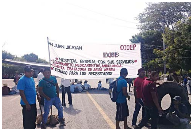
► Dijeron que solo darán paso a vehículos lleven algún tipo de emergencia.