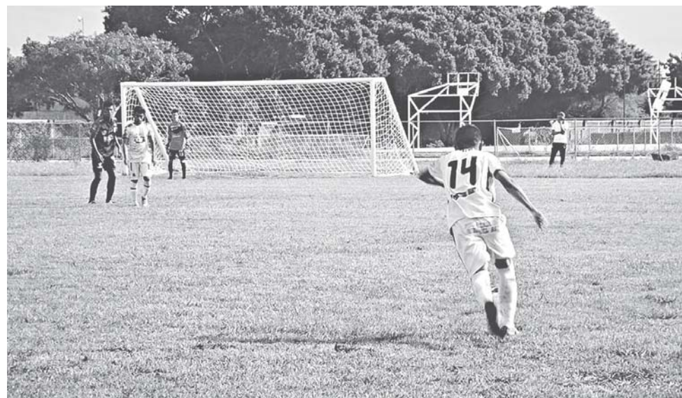
► Buscaron el gol a balón parado.