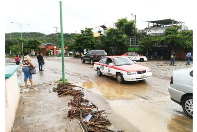
► Las corrientes de agua provocaron que varios vehículos fueran arrastrados.