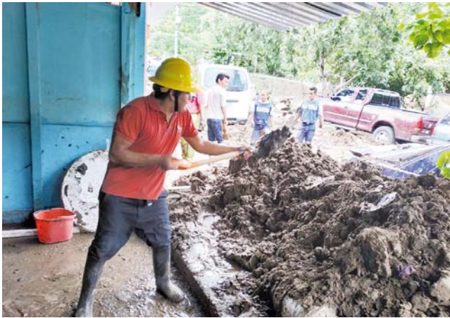
► Personal municipal se organizó para realizar limpiezas en las zonas afectadas