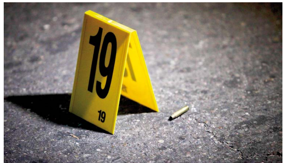
► Hasta el momento se desconoce la identidad de los agresores.

Elementos de las policías municipal y estatal llegaron al hogar e indicaron que efectivamente habían casquillos percutados en el interior de un domicilio por lo que solicitaron primero la inter-