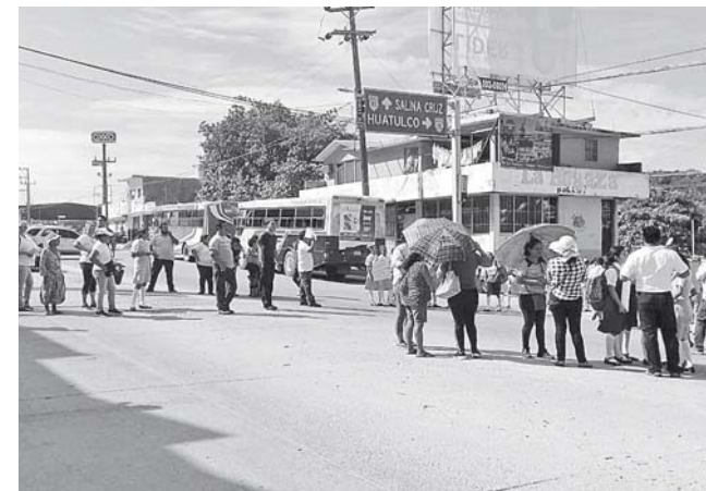
► Funcionarios del DIF señalaron que los apoyos solicitados no están enmarcados en ningún programa.

La comunidad de la Escuela Secundaria Benito Juárez pidió al gobierno la entrega de uniformes y útiles, así como un comedor para los estudiantes sin recursos