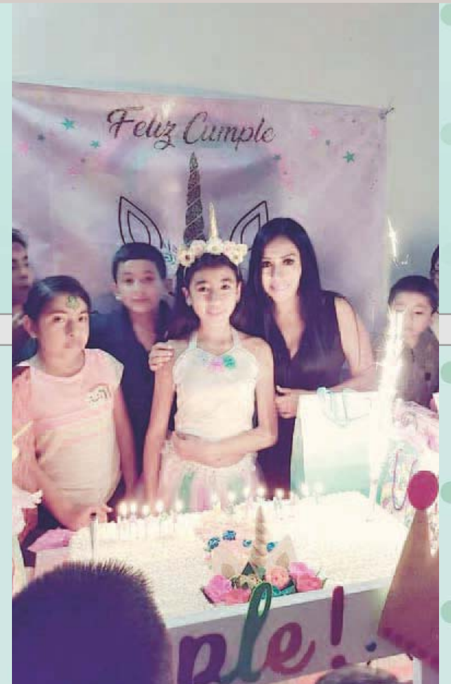
► La cumpleañera en compañía de su madre.