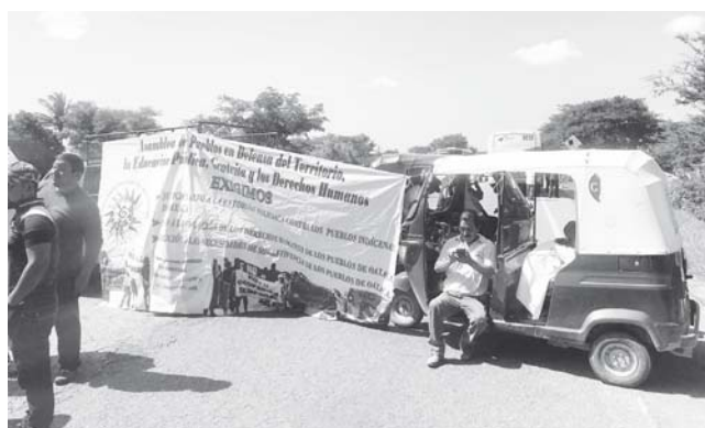
► Amenazan con protestar todo el tiempo necesario hasta obtener respuesta.