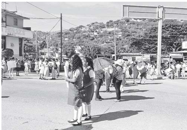
► A través del DIF los padres habían solicitado una cocina comunitaria.