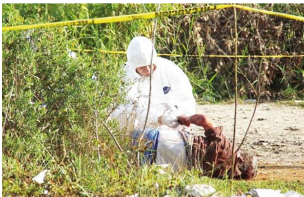
► El cuerpo fue localizado en el paraje Los mangos.