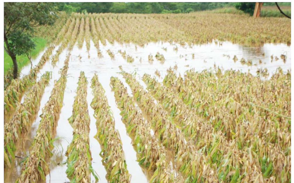
► Entre las temporadas de sequía y las de tormenta, el sector agropecuario de ha visto seriamente afectado.

la superficie afectada", subrayó Salinas Ojeda.