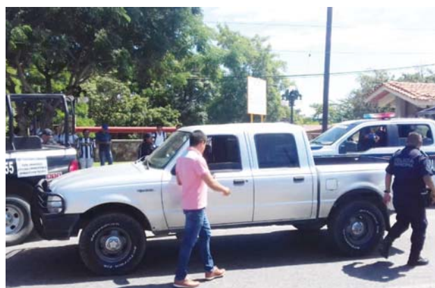
► Se había reportado que en la unidad viajaba un grupo de personas sospechosas.

Que los vecinos sometieron a "El Varón", quien realizaba hurtos a las casas habitacionales que eran afectadas por las fuertes lluvias, a orillas del Canal Chahué.