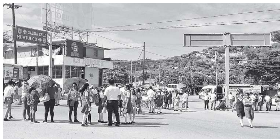
► De acuerdo con los padres de familia la Sección 22 les negó la entrega de uniformes y útiles a través de amenazas al IEEPO.

Indicaron también que la calle que comunica a la escuela no está pavimentada y ha sido uno de los reclamos que han estado solicitando