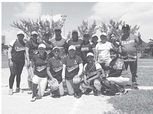
► Xhuncas sigue en el subliderato.