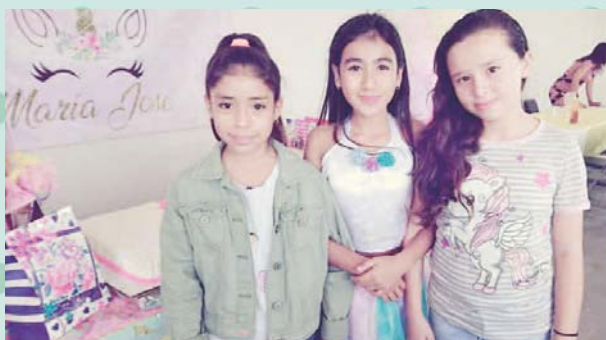
► La cumpleañera se divirtió con sus amigas.