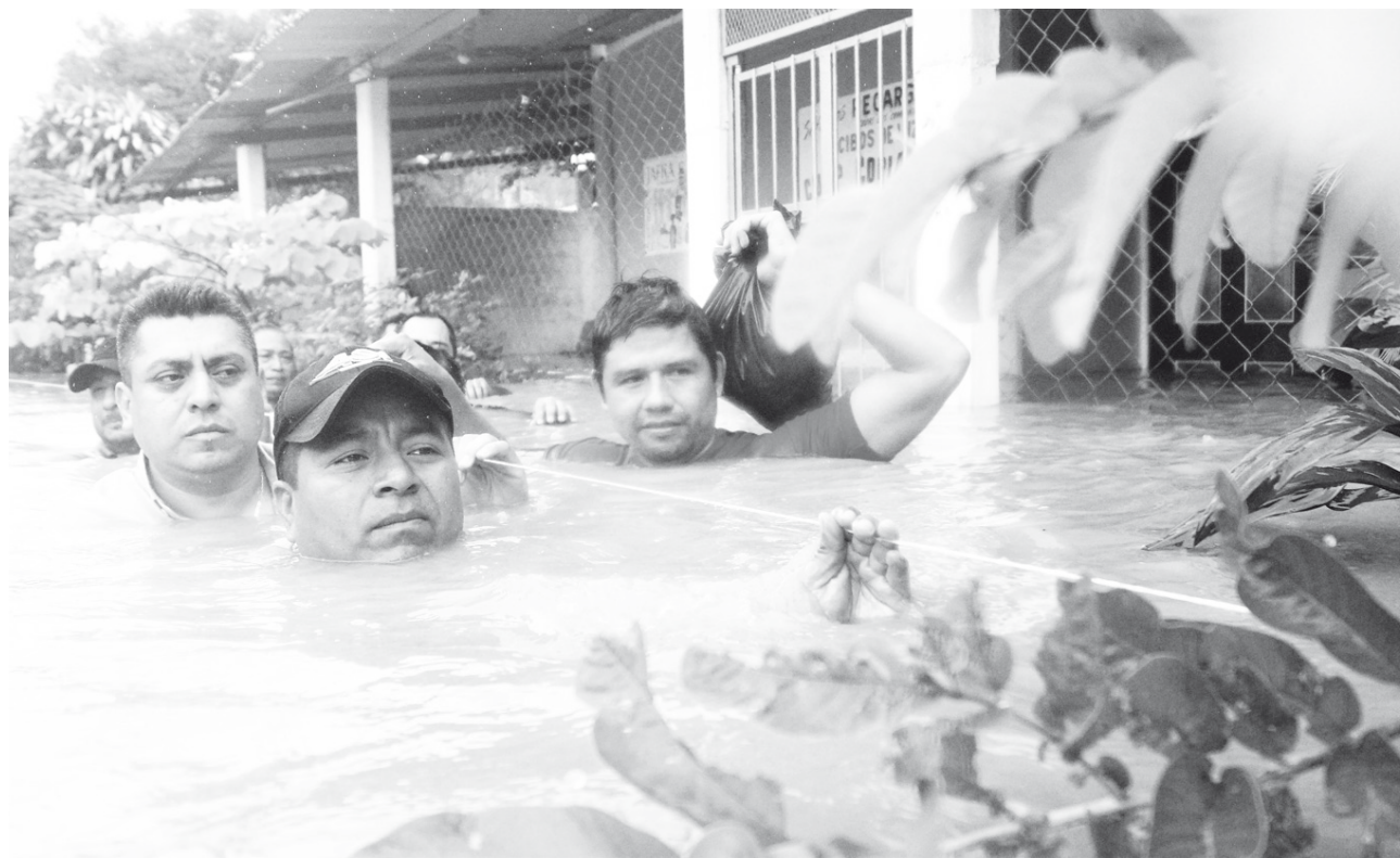
► En la colonia Santa Cruz, el agua llegó hasta el cuello de los ciudadanos, quienes han tenido que abandonar sus hogares.

Se desconoce si ya alguna autoridad estatal o local ha dialogado con los dirigentes para que dejen pasar a la gente ya que nadie puede salir de la ciudad ni entrar prácticamente Tuxtepec es un estado de sitio.