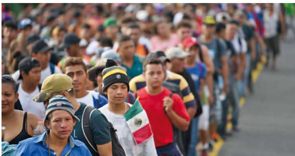
► Una brigada de médicos de Oaxaca y Chiapas, se trasladarán a Tapachula donde atenderán a los migrantes.

Finalmente comentó que la propuesta original es dar atención médica en Tapachula, pero, todo dependerá de la forma como se mueva la caravana, por lo que, tienen como una segunda opción instalar la brigada médica en Arriaga Chiapas.