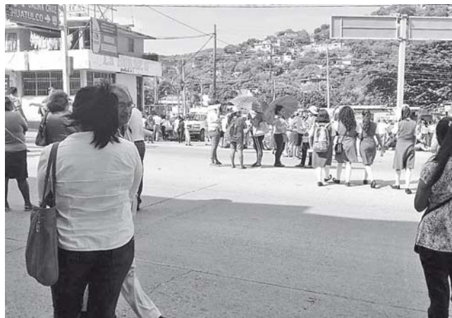
► La comunidad de la Escuela Secundaria Benito Juárez bloqueó la carretera Costera y Cuatro Carriles.