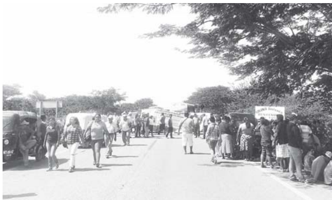
► Solicitaron presentar avances en la investigación de la muerte de su dirigente.