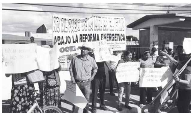
► Los damnificados piden que se les condone el pago de electricidad.

bien todos lo saben son de dos maneras, daño parcial y daño total, será en materiales y será 25 y 120 mil respectivamente, sin embargo, la autoridad municipal dice que será en tres categorías, menor, parcial y total, pero la información del Gobierno del Estado, es que será parcial y total, solo paquetes de materiales, no habrá tarjetas, Bansefi no tendrá injerencia. Es por esta misma razón que decimos si el