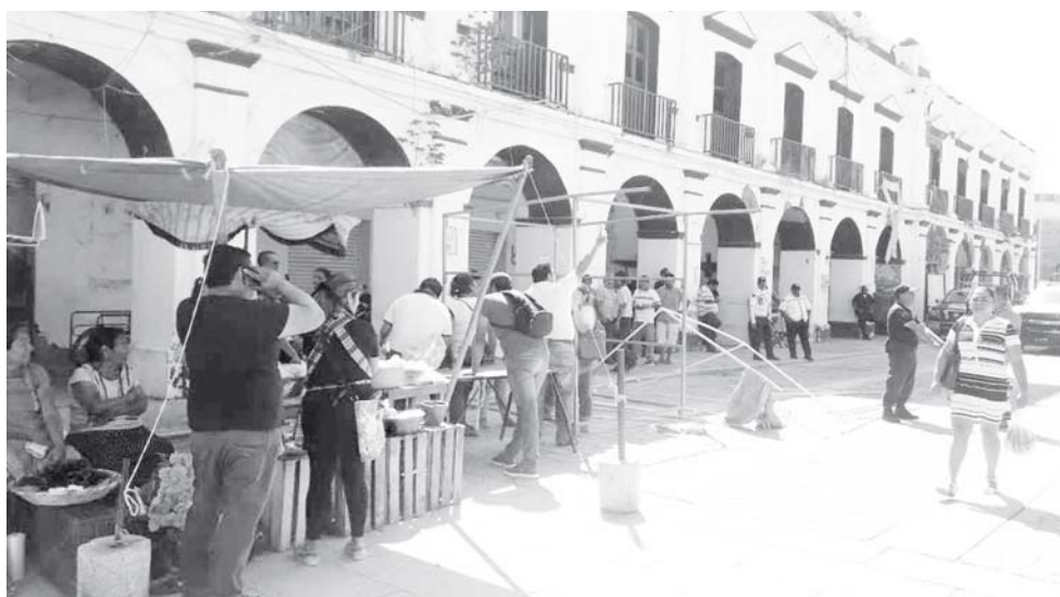
► Se presume una venganza política por la conexión entre la comerciante afectada y el director de Servicios Municipales.

de Todos Santos, por lo que decidieron cerrar la calle 16 de Septiembre como una medida de protesta.