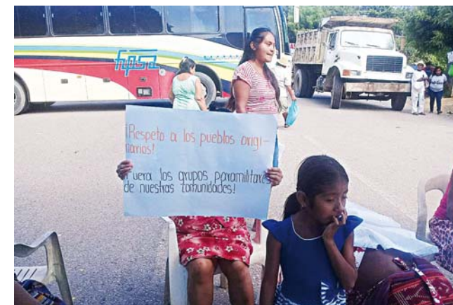
► Con palos y pancartas impidieron la libre circulación de cientos de vehículos.

Integrantes de esta organización social tomaron un autobús de la línea Fletes y Pasajes que se dirigía de Oaxaca a Pinotepa para bloquear la vía federal 200