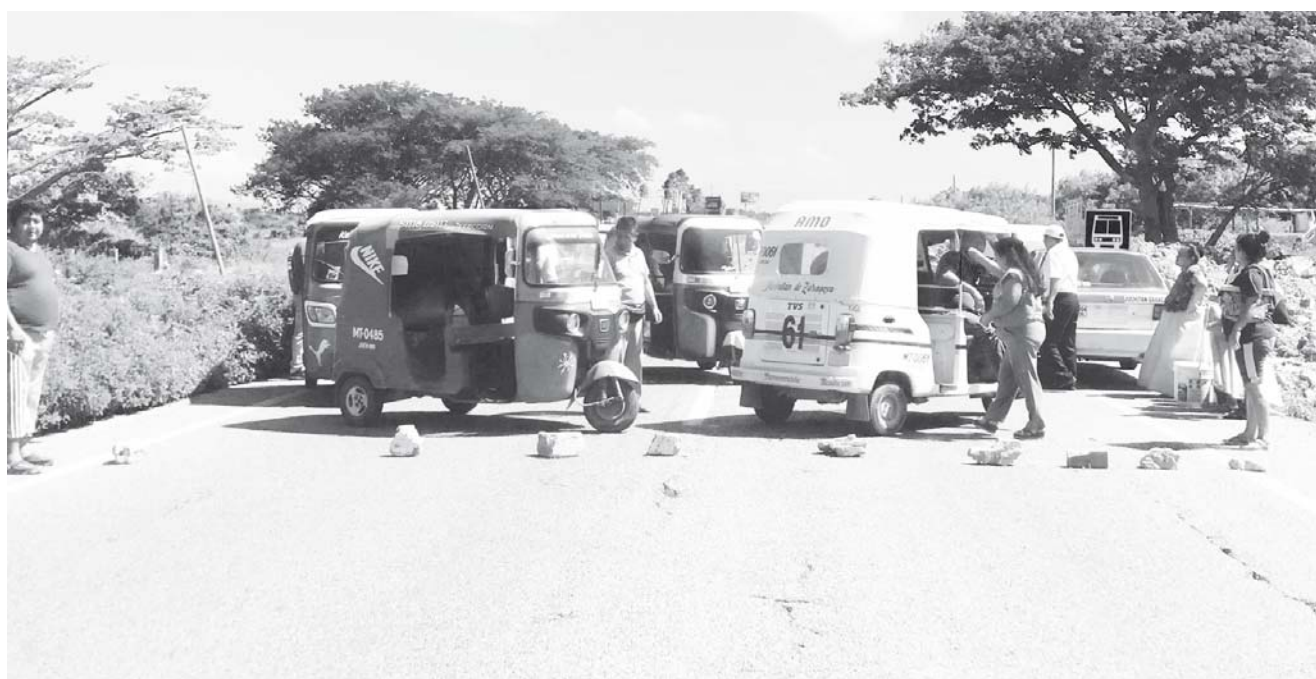
► Organizaron movilizaciones en Juchitán, Oaxaca, en la Sierra Sur, Tuxtepec, la Mixteca y La Costa.

lización tiene que ver con la exigencia al gobernador, al secretario de Gobierno, al fiscal general y al presidente del Tribunal de Justicia, el esclarecimiento del artero asesinato del fundador de la