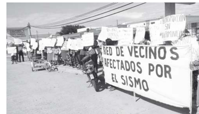
► Piden una fecha exacta para la entrega de apoyos del segundo censo.