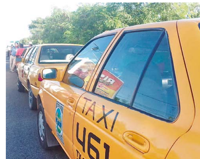
► Amenazan con protestas mayores de no recibir respuesta de las autoridades.