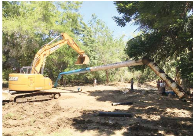
► Personal del Fonatur realiza mantenimiento de los ductos de agua potable.