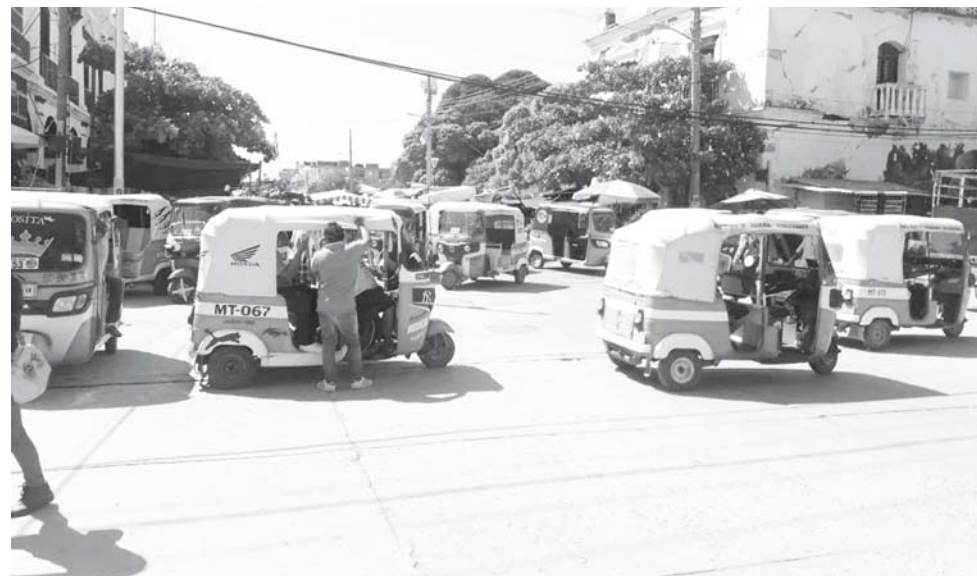
► Fue retirada a pesar de contar con un permiso firmado por la presidenta municipal.

Mototaxistas afiliados al FUCO cerraron la calle 16 de Septiembre para protestar por el retiro del puesto de una comerciante de dulces típicos de Día de Muertos