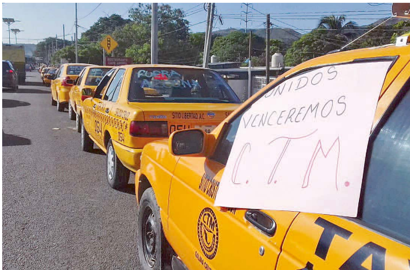
► Denunciaron que el sábado fueron detenidos tres de sus compañeros y pretenden cobrar una multa de más de 50 mil pesos para liberarlos.

Y advirtió que de continuara estas anomalías en contra del transporte, bloquearán las arterias de Salina Cruz para exigir la destitución de este mal funcionario.