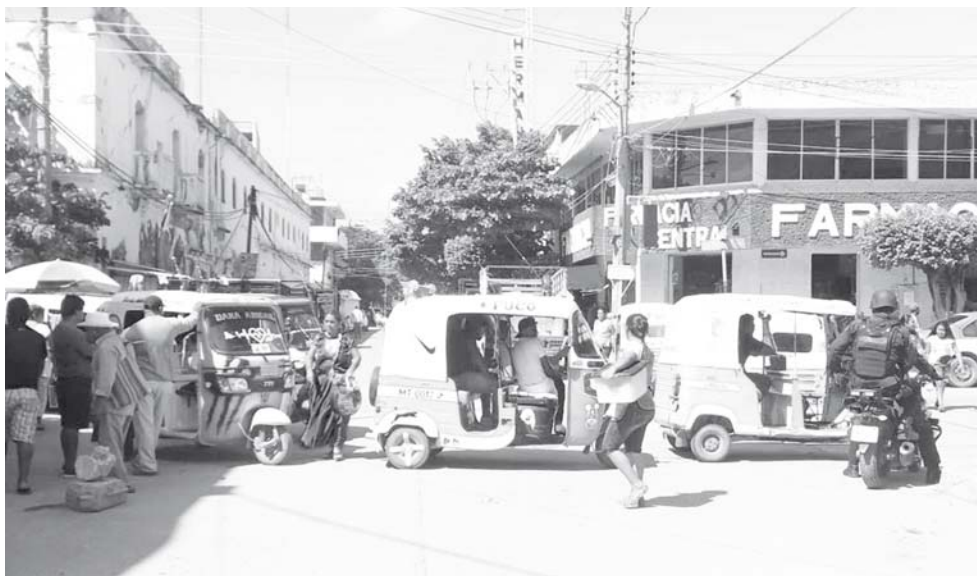
► La comerciante indicó que arribaron varias patrullas para retirarla a ella y a sus cosas.