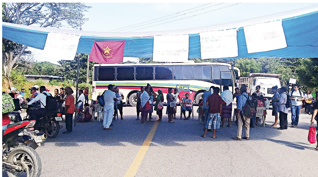
► Entre las comunidades que participan están Jicayán, Lo de Soto, Jamiltepec, Tetepelcingo, San Juan Colorado, Pinotepa de Don Luis y Tlacamama.

"No le vamos a permitir al Fiscal y al presidente del Tribunal que los crímenes que se cometan en agra-