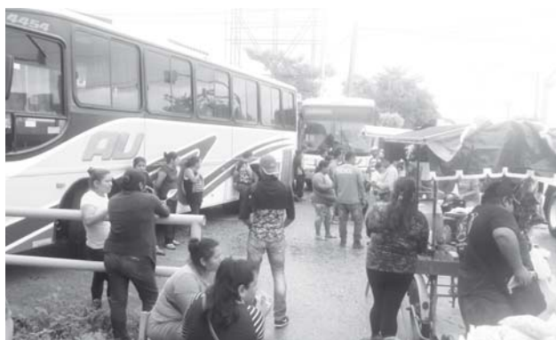
► Se desconoce si ha habido diálogo para liberar las vialidades.

Más tarde, el edil tuxtepecano se trasladó a la colonia Moderna para recorrer esta colonia en sus tres secciones, hasta esta tarde las afectaciones por las lluvias y la crecida del arroyo no es grave, sin embargo el alcalde manifestó que el Gobierno Municipal está muy al pendiente de lo que se pudiera presentar ya que de acuerdo al pronóstico del tiempo las lluvias persistirán hasta el próximo viernes.