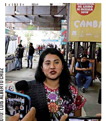
“Debemos entender que los muros no son la mejor ruta”, NLG.

Durante el evento celebrado en el Centro Cultural y de Convenciones de Oaxaca (CCCO) afirmó que ante los recientes episodios que han marcado la historia del país, la FILO brinda la oportunidad de comprender el fenómeno migratorio, a través de los libros que han escrito los grandes pensadores y filósofos, y guiar así las acciones para una mejor sociedad.