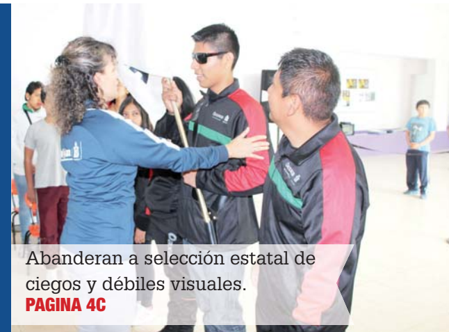
Abanderan a selección estatal de ciegos y débiles visuales. PAGINA 4C