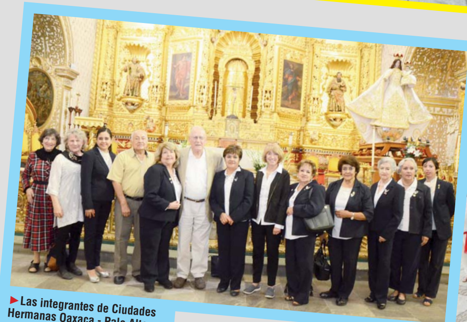
► Las integrantes de Ciudades Hermanas Oaxaca - Palo Alto asistieron a la celebración.

albergue, salud, alimentación y educación a niñas y niños indigentes; encargándose de su formación en general, con el fin de hacerlos capaces de valerse por sí mismos. • La institución proporciona a sus acogidos albergue, salud, alimentación, educación cultural y valores como son la sencillez, disponibilidad, solidaridad, respeto, justicia, amor, etc.