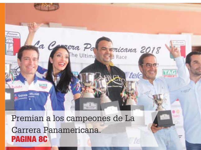
Premian a los campeones de La Carrera Panamericana. PAGINA 8C