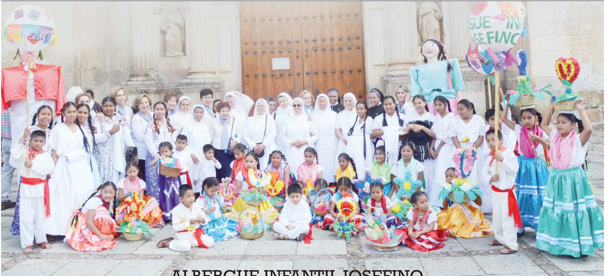
ALBERGUE INFANTIL JOSEFINO