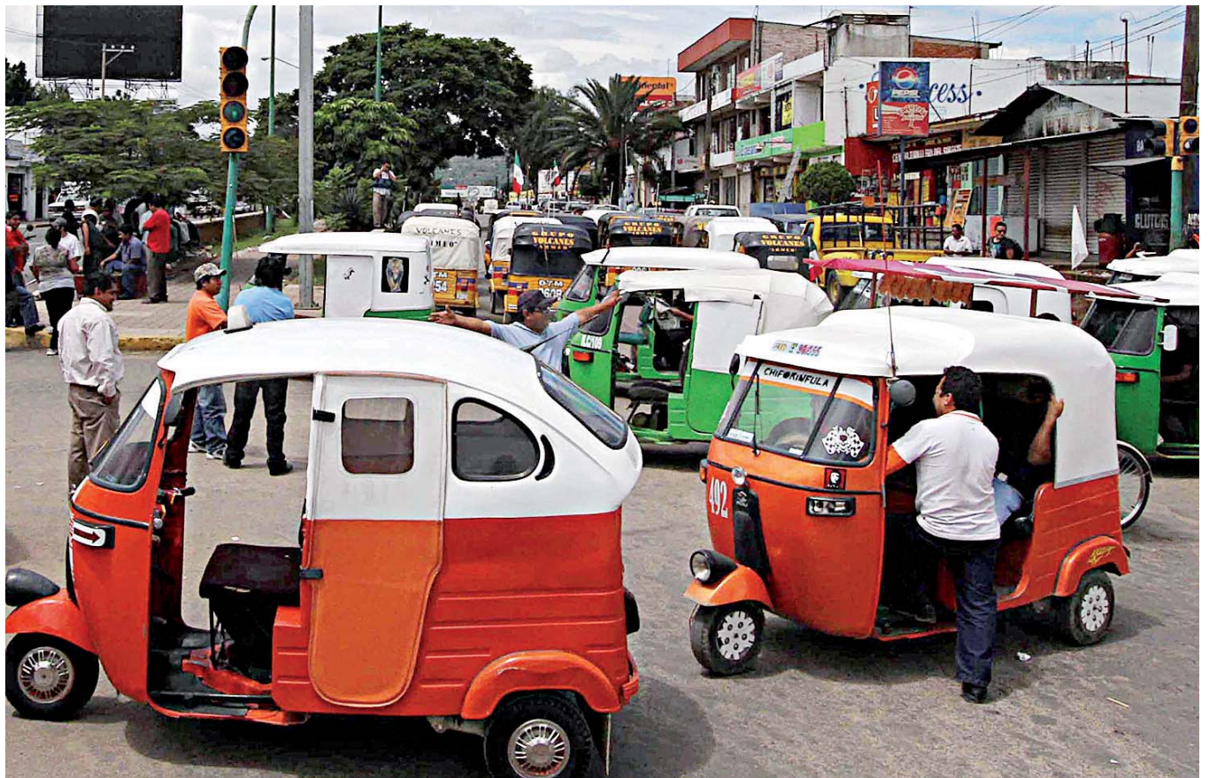
► La lucha por el control de concesiones, contratos y otros, entre sindicatos y organizaciones del transporte, ha sido a muerte.

Nada de eso es broma. Es la realidad cruda. Un aeropuerto en construcción sometido a consulta del "pueblo sabio" (y adulado). Un tren dinástico "afortiori"; una descentralización de burócratas por dedazo (o por dedito), son acontecimientos que laceran a la democracia y agravan a una nación, de la cual 30 millones de ingenuos dieron un voto por la equivocación. Como en el cine: FIN.