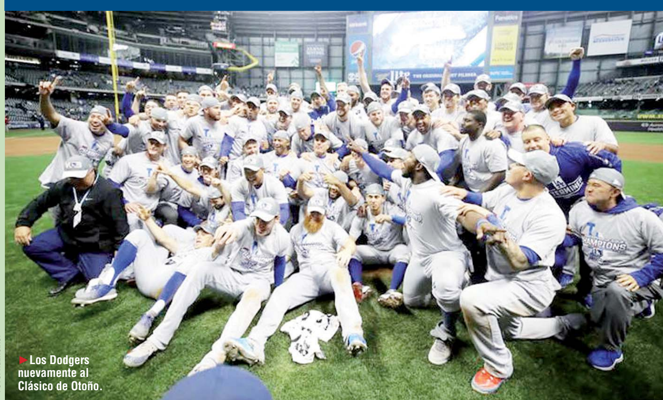
Los Dodgers nuevamente al Clásico de Otoño.

te las cervezas guardadas en el congelador porque no hubo celebración. Los Dodgers respondieron en la segunda con el bambinazo de Bellinger que les dio la ventaja 2-1 y el cubano Puig aseguró el boleto con otro palo de vuelta entera de tres carreras en la sexta. El mexicano Julio Urias lanzó un tercio de entrada sin recibir daño, la victoria fue para Ryan Madson en labor de relevo con Clayton Kershaw sacando el último inning. El martes se jugará el primer partido de la Serie Mundial en Boston en punto de las 19:09 horas del centro de México. Los Ángeles se medirán en el Clásico de Otoño con los Boston Red Sox que vencieron este jueves 4-1 a los Houston Astros para lograr el boleto al encuentro por la supremacía.