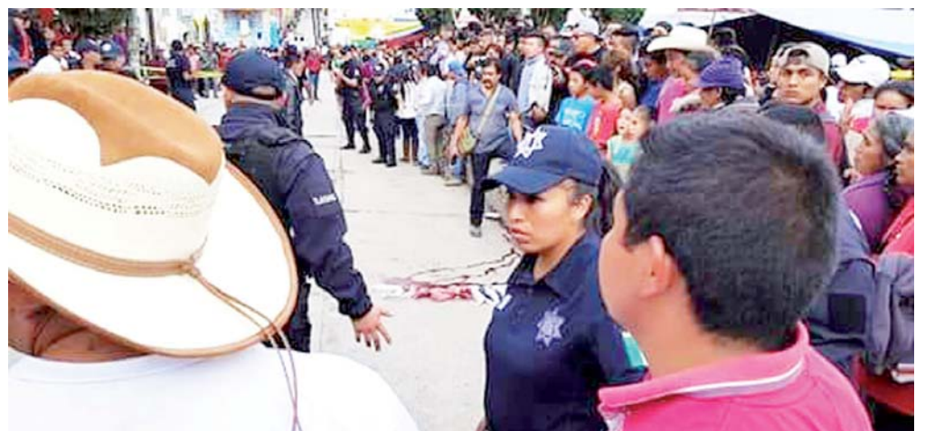
► Policías y curiosos rodearon el cuerpo de la víctima.

hombres con gorra disparar detrás de la víctima, la gente sale despavorida y los asesinos después de consumada su acción corren entre la gente.