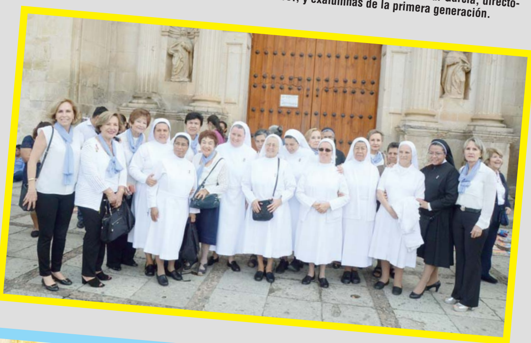
► La Asociación Civil es atendida por madres pertenecientes a la orden de Madres de San José de la Montaña.