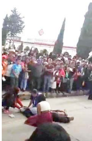
► Nadie lo podía creer.

Luego del asesinato a través de redes sociales circuló un video en donde se observa el momento preciso en que la calenda circulaba por la calle Constitución, se ve al grupo de danza de