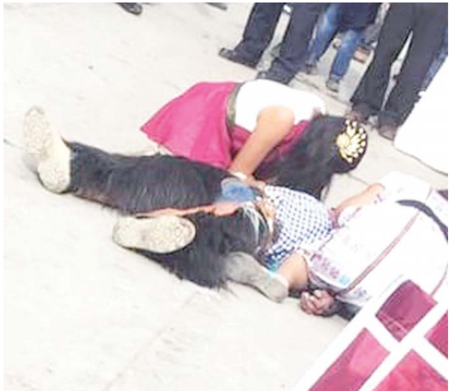
► La víctima quedó tendida en el suelo, al recibir los balazos.

los diablos de Juxtlahuaca participando de la algarabía de la fiesta, segundos después se alcanza a apreciar como uno de sus integrantes cae y se ven a dos