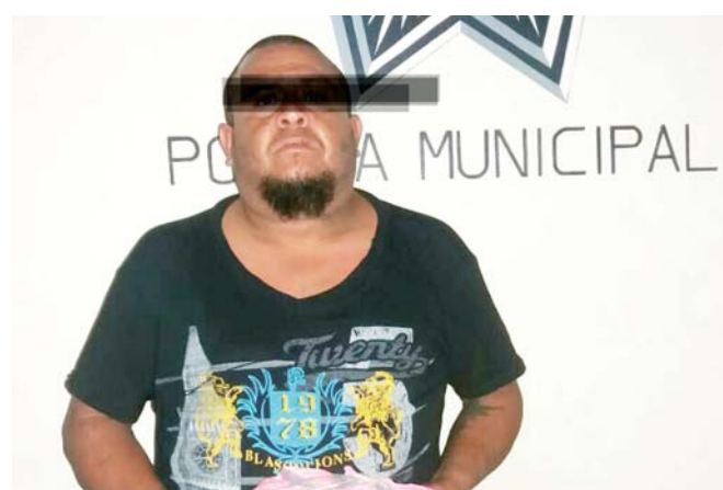
► Fueron turnados ante las autoridades.

les entregaban dinero. Los uniformados al verlo anterior les marcaron el