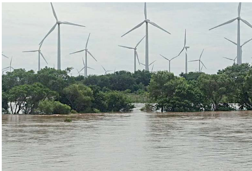
Los daños en viviendas y campos aún no han sido cuantificados.

parte de su patrimonio y mantienen la preocupación ante el pronóstico de más lluvias en la región por el desplazamiento de la tormenta “Vicente”.