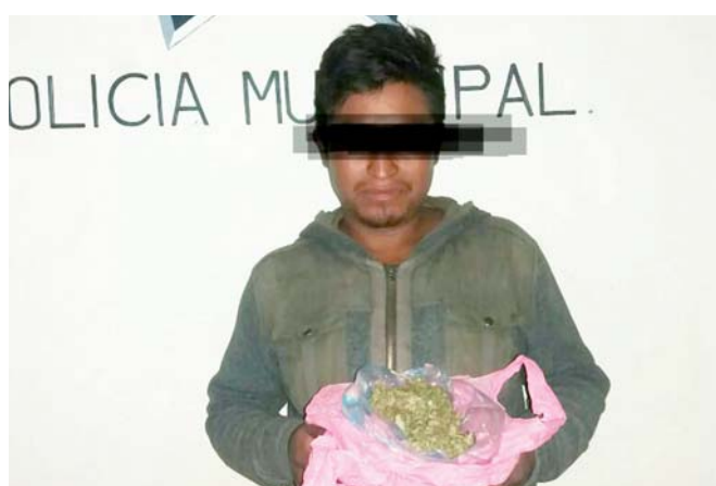
► Los sujetos llevaban marihuana.

Elementos de la Policía Estatal Preventiva a bordo de su patrulla realizaban su recorrido de vigilancia en la calle Principal de Ejutla de Crespo, al ver que tres hom-