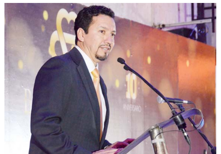
► Las palabras de otros empresarios motivaron la escena.