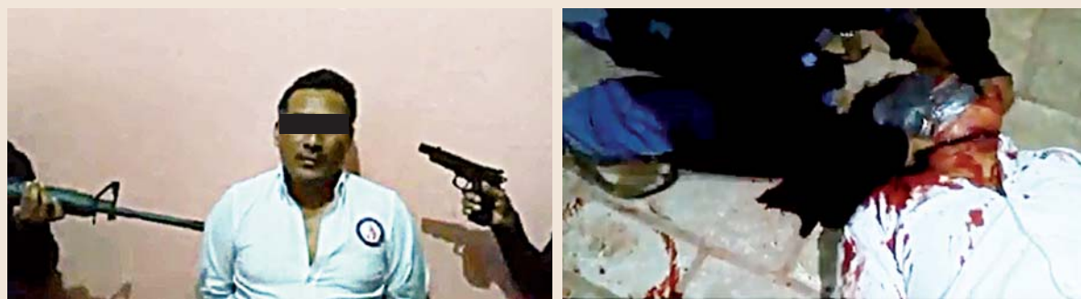
► Imágenes de la videograbación difundida en redes sociales, durante la decapitación.

CATEAN, EN VIGUERA, CASA DE SEGURIDAD DE MIEMBROS DE UNA SUPUESTA BANDA DEL CRIMEN ORGANIZADO, EN LA CUAL GRABABAN LA EJECUCIÓN DE SUS VÍCTIMAS Y LO DIFUNDÍAN EN REDES SOCIALES