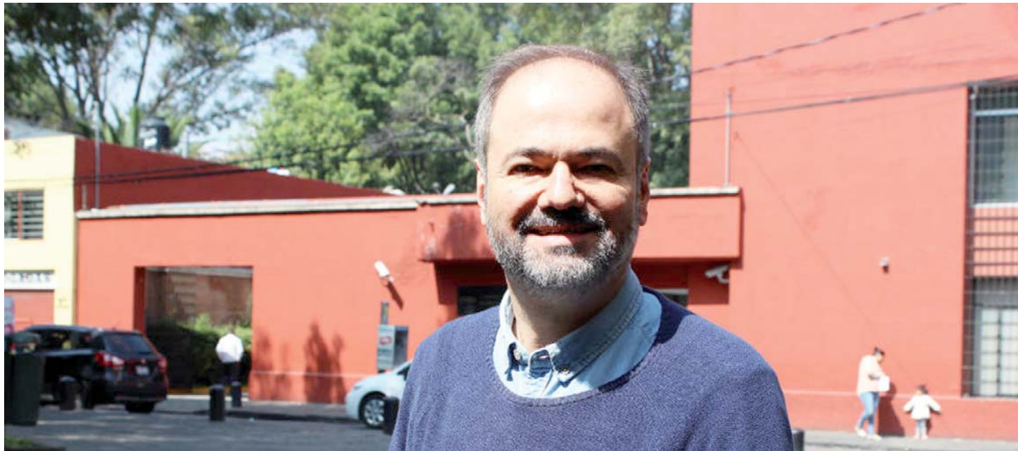
► Para Juan Villoro México está ante una oportunidad de cambios, sólo resta esperar.

El autor de 'El vértigo horizontal', advierte que falta una verdadera opción de izquierda en nuestro país