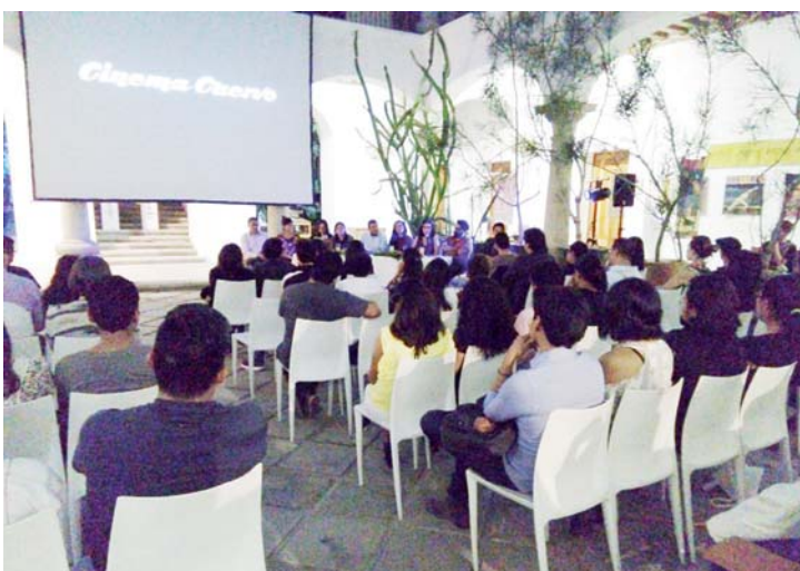
► La poesía es el eje de Astromelia Editores.