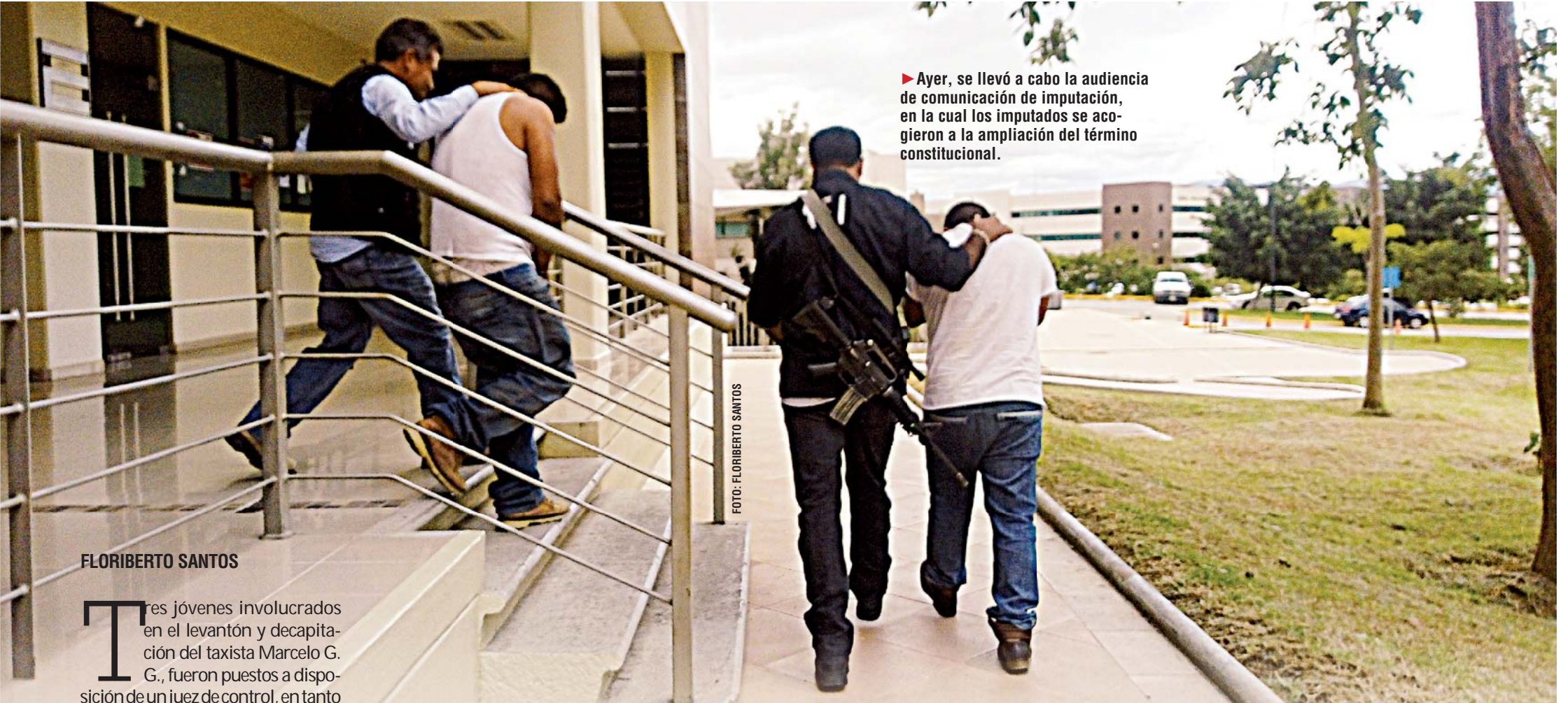
► Ayer, se llevó a cabo la audiencia de comunicación de imputación, en la cual los imputados se acogieron a la ampliación del término constitucional.

policiaa@imparcialenlinea.com / Teléfono 501 83 00 Ext. 3176