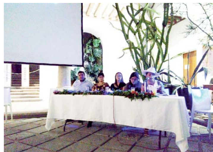
► Se lanzaron dos versiones: la artesanal y la comercial.