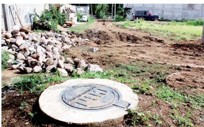
► Se benefició a 791 habitantes de Mexicápam.

de las 23 que se tienen contempladas realizar durante el ejercicio fiscal 2018 provenientes