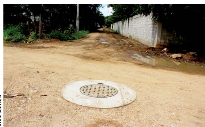
► Los ciudadanos llevaban cuatro años pidiendo las obras.

del Fondo 3, Ramo 33, así como recursos de los ahorros obtenidos de la política de austeridad