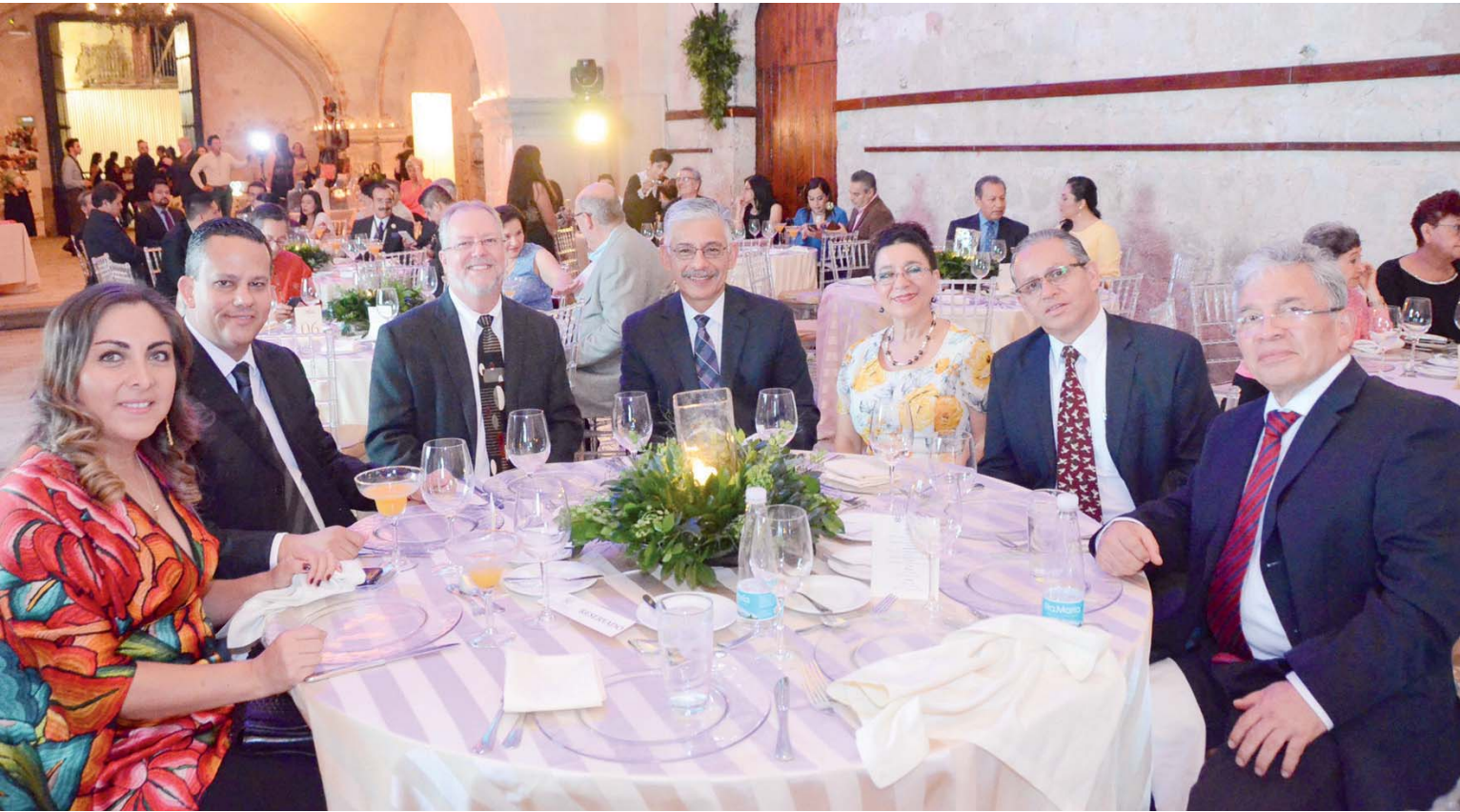
► Integrantes y personal de Buckner México.

estilo@imparcialenlinea.com / Teléfono 501 83 00 Ext. 3171