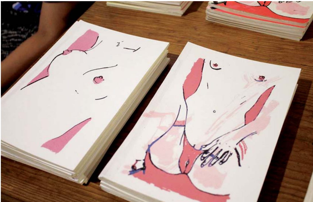
► Por encima de los altibajos de la moral, la poesía es patrimonio de todos.

enesena@imparcialenlinea.com / Teléfono 501 83 00 Ext. 3172