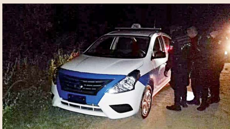
► El taxi fue abandonado en Etla.