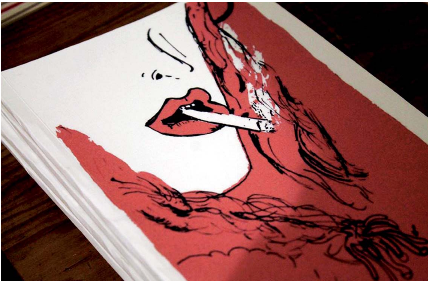
► Un navío de mujeres ofrece sus poemarios sobre violencia, tristeza, libertad, sexualidad.

“Y creo que al final lo logré”, apunta el también autor de El sueño ligero de los gatos y La segunda muerte , quien concreta esta pretensión de hacer varios años. Lo mismo que de reiteradas invitaciones a las autoras que “nunca se animaron a