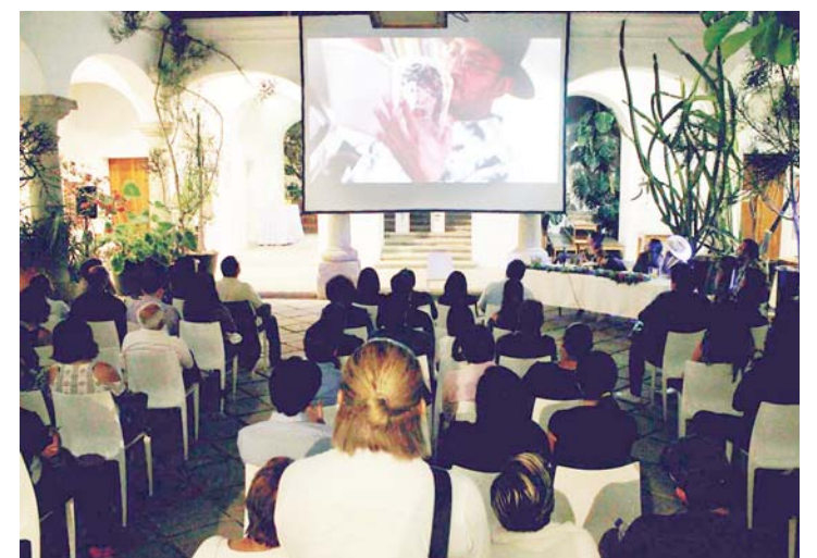
► Se desconoce mucho el trabajo de las mujeres.