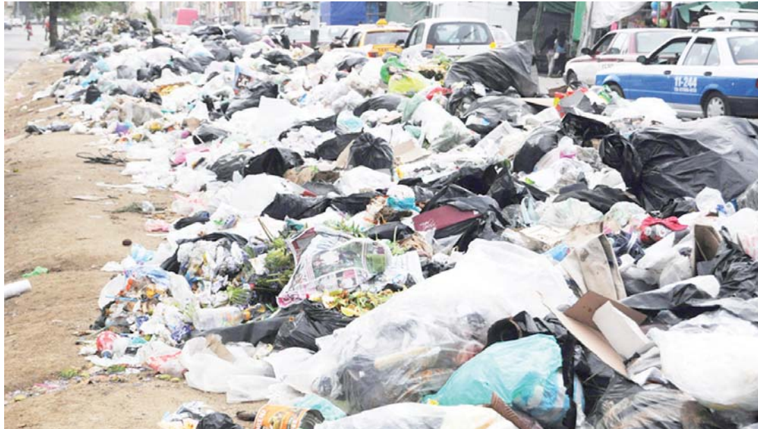
► Se podría reducir a la mitad la generación de desechos.

Se necesita ahondar en esta cultura en todos los estratos sociales, pues hasta ahora han sido esfuerzos dispersos que no han trascendido; en especial cuando la falta de un sistema funcional de recolección de basura, leyes que promuevan la separación de residuos y la incipiente conciencia ambiental entre los ciudadanos, figu-