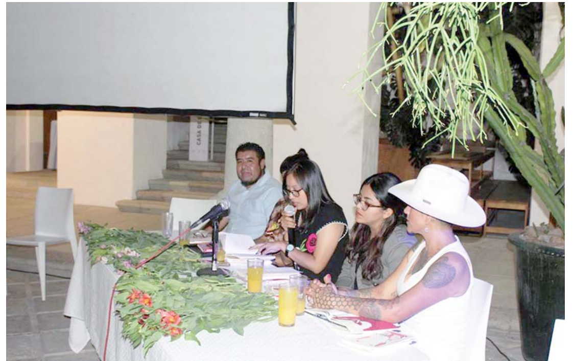
► Se puede entender a la poesía como una manera de alzar la voz.