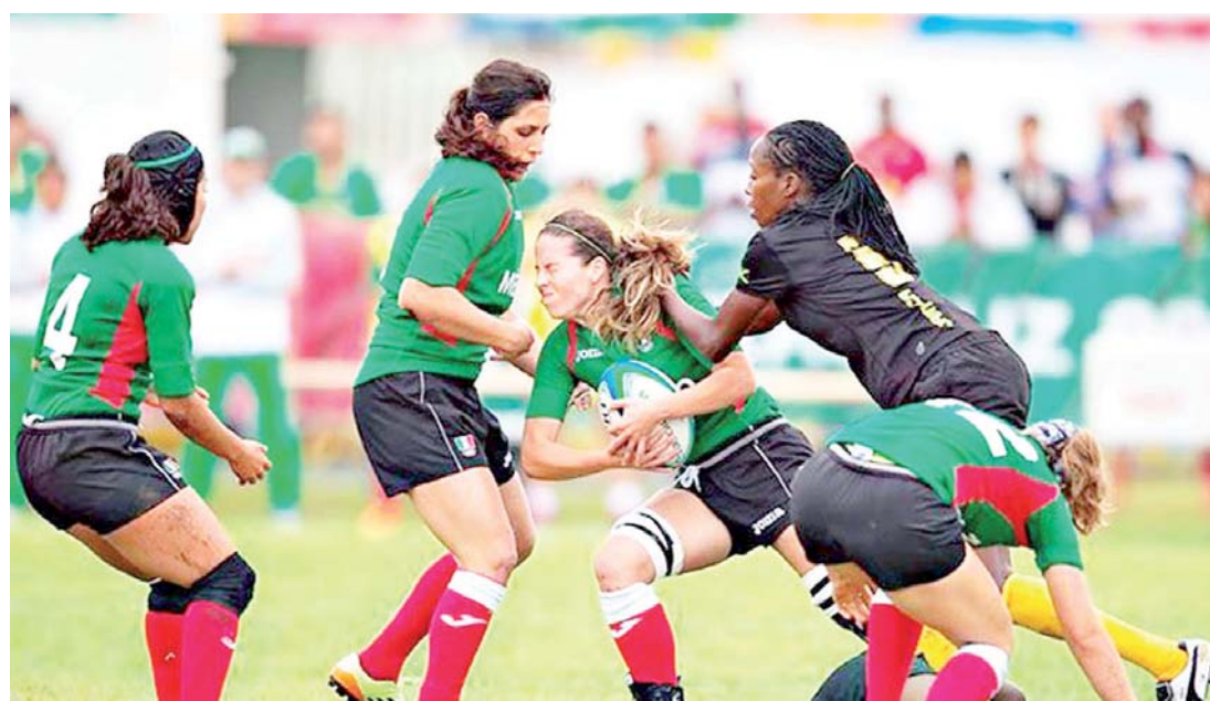
► México venció 15-10 a Trinidad y Tobago.