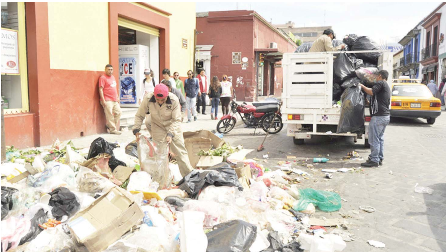
► Siguen sin separar la basura, ni rescatar lo reciclable.

El manejo adecuado de los residuos en las etapas que siguen a su generación, permite mitigar los impactos negativos que causan a la salud pública y el ambiente. El reuso y reciclaje de materiales son fundamentales para reducir la presión sobre los ecosistemas y otras fuentes de recursos de las que se extraen. Paralelamente disminuye el uso de energía y de agua necesaria para realizar su extracción y procesamiento, además de disminuir las necesidades de espacio para llevar a cabo la disposición final de los residuos.