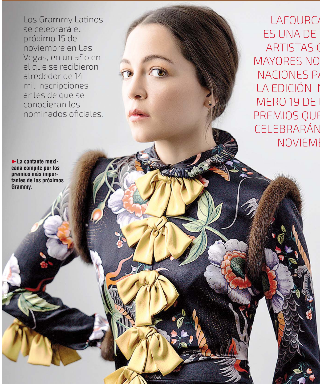
► La cantante mexicana compite por los premios más importantes de los próximos Grammy.

"Creo que el único riesgo del género urbano es que se repita a sí mismo, como le pasó en su momento al pop cuando todo sonaba igual", dijo.