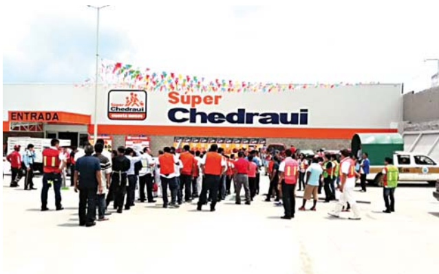
► Bomberos apoyaron macro simulacro en Pochutla.