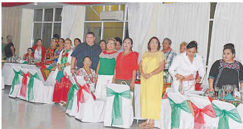
► Los presentes asistieron portando ropa acorde a los colores de la bandera.

ñez fue el abanderado y junto con su comitiva participó en los honores a lábaro patrio, posteriormente, el doctor Vicente Oroz-