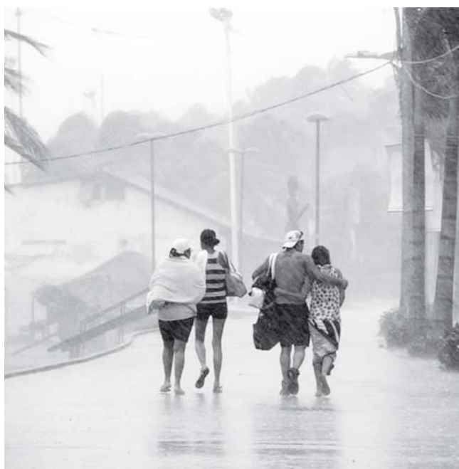
► Soldados asistieron a un camión de pasajeros que se quedó varado en la crecida de un arroyo.

trativas del involucrado. La ley establece que, hasta que se dicte la resolución procedente, la SFP debe supervisar que se le respete la subsistencia mínima que, de acuerdo a criterios judiciales, equivale a un porcentaje de su sueldo.