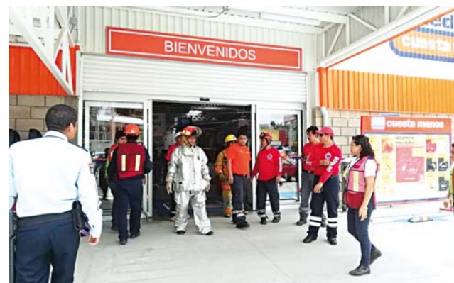
► Bomberos lamentan que haya falta de cultura en temas de protección civil.

gada capacitada de Protección Civil y que solicitó con anterioridad el apoyo de corporaciones para la actividad, el también técnico en urgencias médicas, apreció la importancia de que la sociedad cuente con una idea clara en los temas de prevención, de forma particular durante la ocurrencia de un sismo.