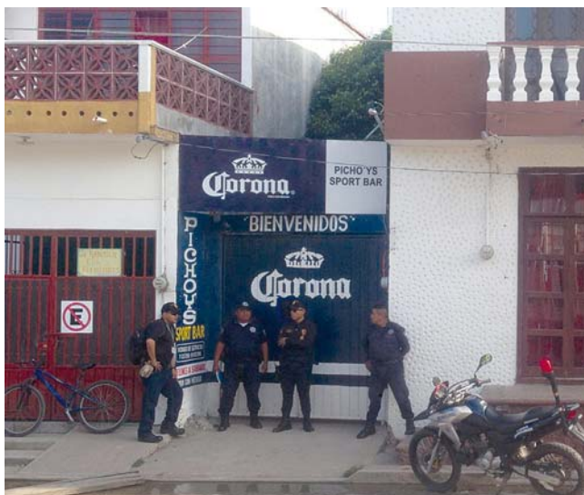
► Murió en el interior del Bar Pichoys.