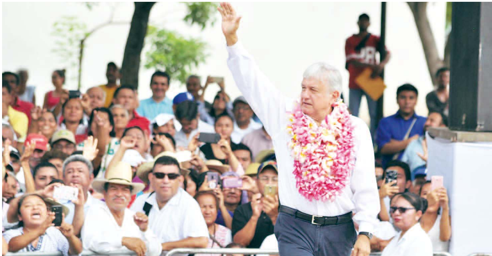
► Obrador recorre todo el país para agradecer los votos que le dieron el triunfo en la pasada contienda electoral.

▪ 47,909 personas con discapacidad tendrán apoyos ▪ 5 mil millones de pesos invertirán en adultos mayores ▪ 2 mil 874 millones de pesos destinarán para Prospera