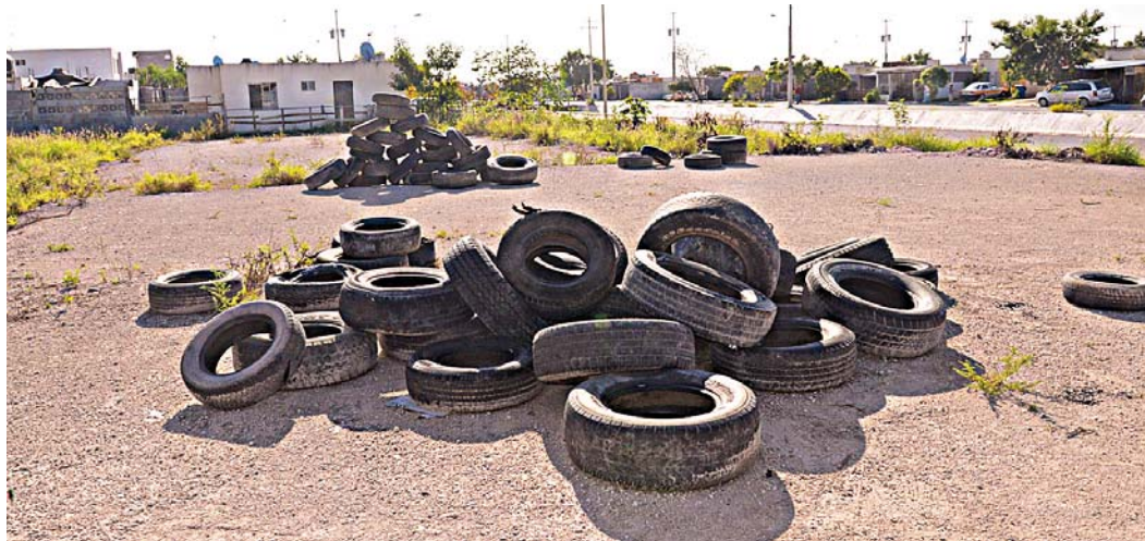
► Las campañas de descacharrización no han sido efectivas.

Además mencionaron que han escuchado que el Presiden-