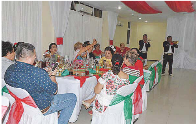
► Degustando de la cena preparada para la ocasión.