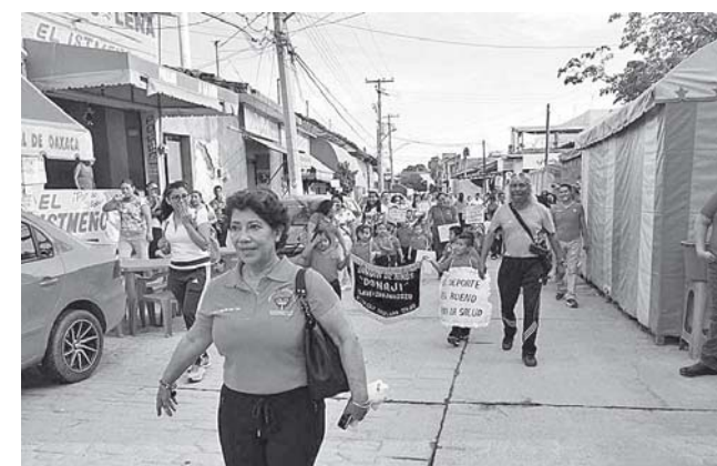
► Emotiva tercera caminata.

El objetivo de estas marchas es dar a conocer la importancia que tiene en estos días la práctica de una actividad física aeróbica, en especial la caminata, la que es una actividad que se ajusta a todas las personas sin diferencia de edades o sexo, además no incurre en costo alguno; la actividad física la desarrollan, en distinto gra-