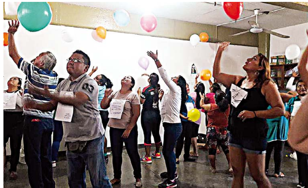
► Aplicaron el programa La risa como herramienta para el afrontamiento.