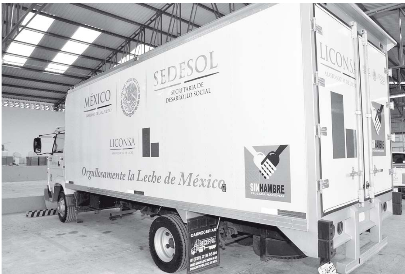
► Se sospecha que tomó fondos de Liconsa para beneficio de un particular.

La Unidad Estatal de Protección Civil instaló los comités de operación a emergencias para asistir a la población damnificada y evaluar daños en instalaciones públicas.