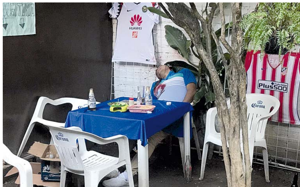
► El occiso se preparaba para volver a su hogar cuando fue asesinado.