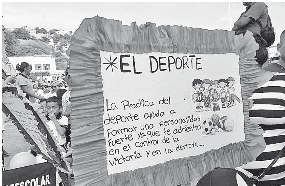
► Cartulinas alusivas resaltaron en la caminata.