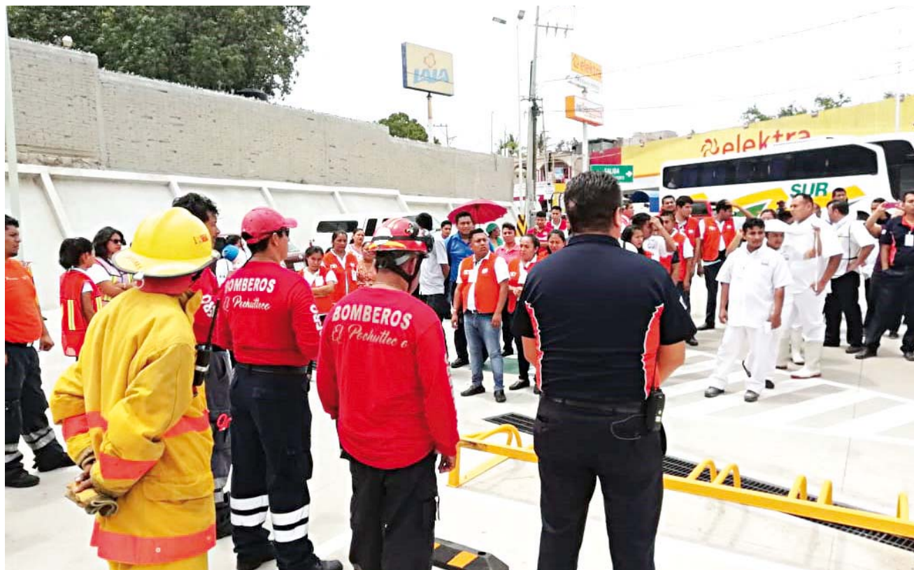
► Solo una tienda comercial y muy pocas escuelas en Pochutla, cuentan con brigadas capacitadas.

Apenas unas cuantas negociaciones, escuelas y hoteles realizan el simulacro para conmemorar sismos de 1985 y 2017