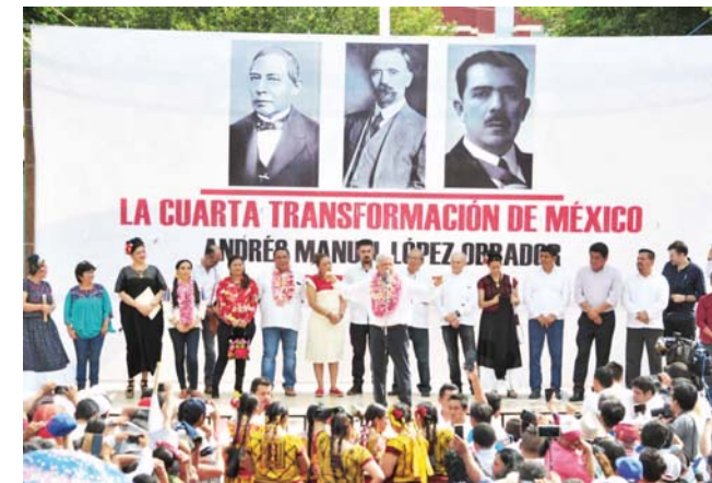
► López Obrador llegó de gira a la región istmeña para agradecer el voto y refrendar su compromiso.