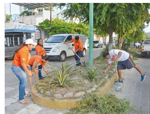
► En grupos de personas se realizan labores de limpieza en playas, ríos y carreteras.

En el 2017, las jornadas de descacharrización acopiaron más de 400 toneladas de desechos, entre los que predominan materiales plásticos, muebles, colchones, llantas y electrodomésticos inservibles.