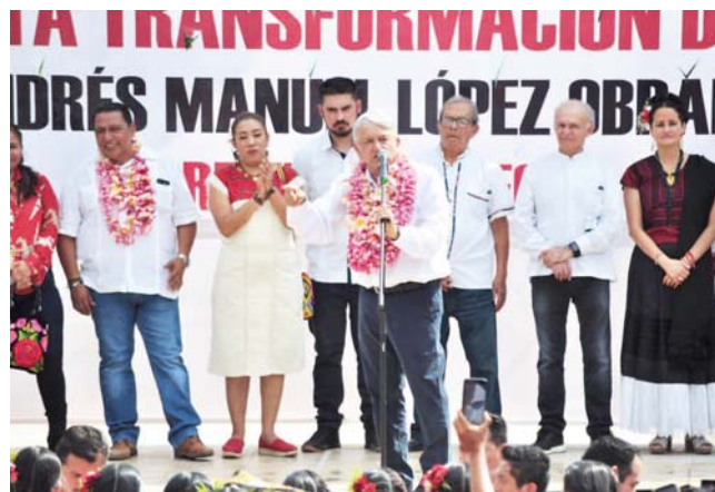
► Ante los istmeños el presidente electo dijo que realizará una inversión millonaria en Oaxaca.