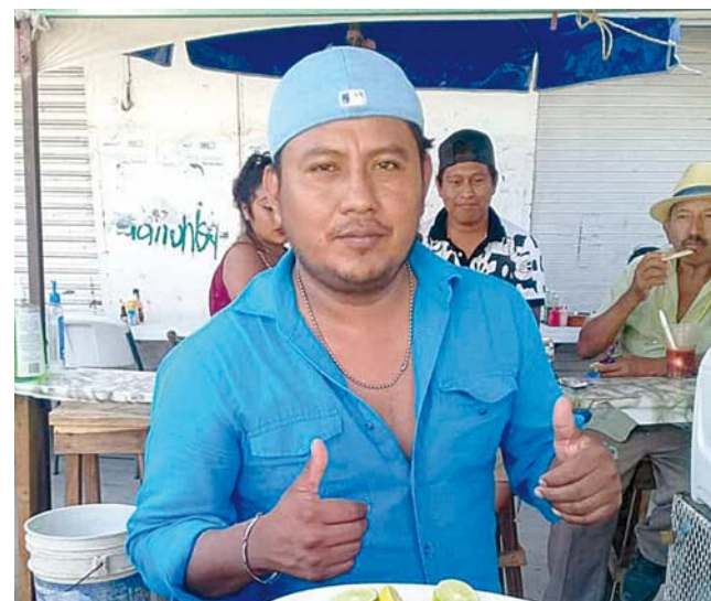
► La víctima en vida.

Testigos aseguran que el agresor fue una sola persona que salió caminando y abordo un mototaxi para huir del lugar los hechos, de igual manera aseguran que el hoy occiso comentó que estaba por irse a su casa donde su esposa lo esperaba para festejar junto a él su cumpleaños.