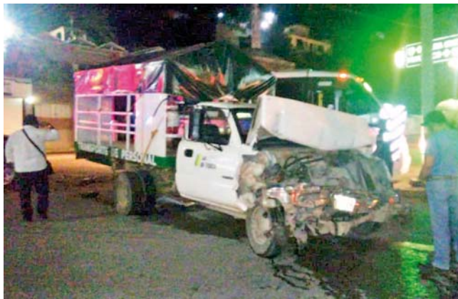
► Camión de la empresa Gasera, Gas del Trópico fue la más afectada.