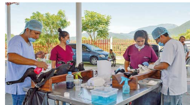
► Un aproximado de más de 600 animales ha sido esterilizado en el 2018.