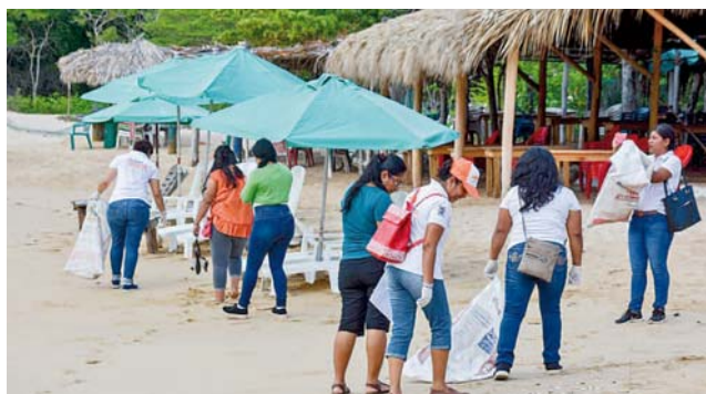
► Los participantes en la limpieza recuerdan la importancia del respeto al ambiente.