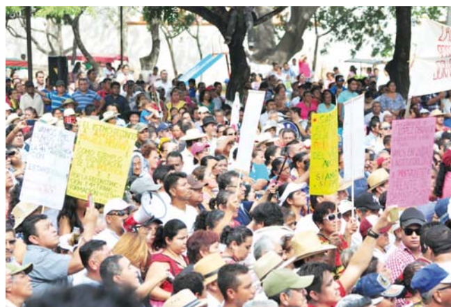
► Quienes acudieron al evento portaban pancartas pidiendo ayuda para la reconstrucción y mensajes para Obrador.

Los recursos, dice, deben ser obras de desarrollo como la ruta transístmica, a la que invertirá mil 100 millones de pesos; la pavimentación de caminos de acceso a comunidades, con 2 mil 231 millones de pesos.