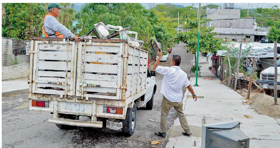
► Asociaciones civiles, instituciones educativas y prestadores de servicios realizan diversas acciones para conservar el medio ambiente.

Limpieza de playas y carreteras; esterilizaciones gratuitas para perros y gatos; aplicación de vacunas antirrábicas; jornadas de descacharrización; son actividades que realizan en conjunto