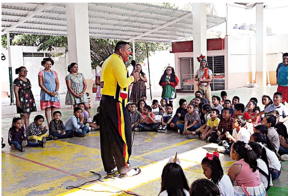
► El payaso Ronnin presentó su propuesta para generar conciencia.

“Nos hace falta mucho liderazgo de acción, porque hemos visto liderazgos de labios para afuera, pero no hemos visto un liderazgo de acción, entonces necesitamos líderes que puedan comenzar a hacer algo y que puedan influir en la vida social, nosotros queremos se alguna manera ser como punta de lanza y dar lo propio, lo nuestro, ir contagiando más personas y poder recuperar esos valores”, apuntó.