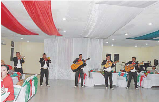
► Un mariachi estuvo amenizando el festejo.