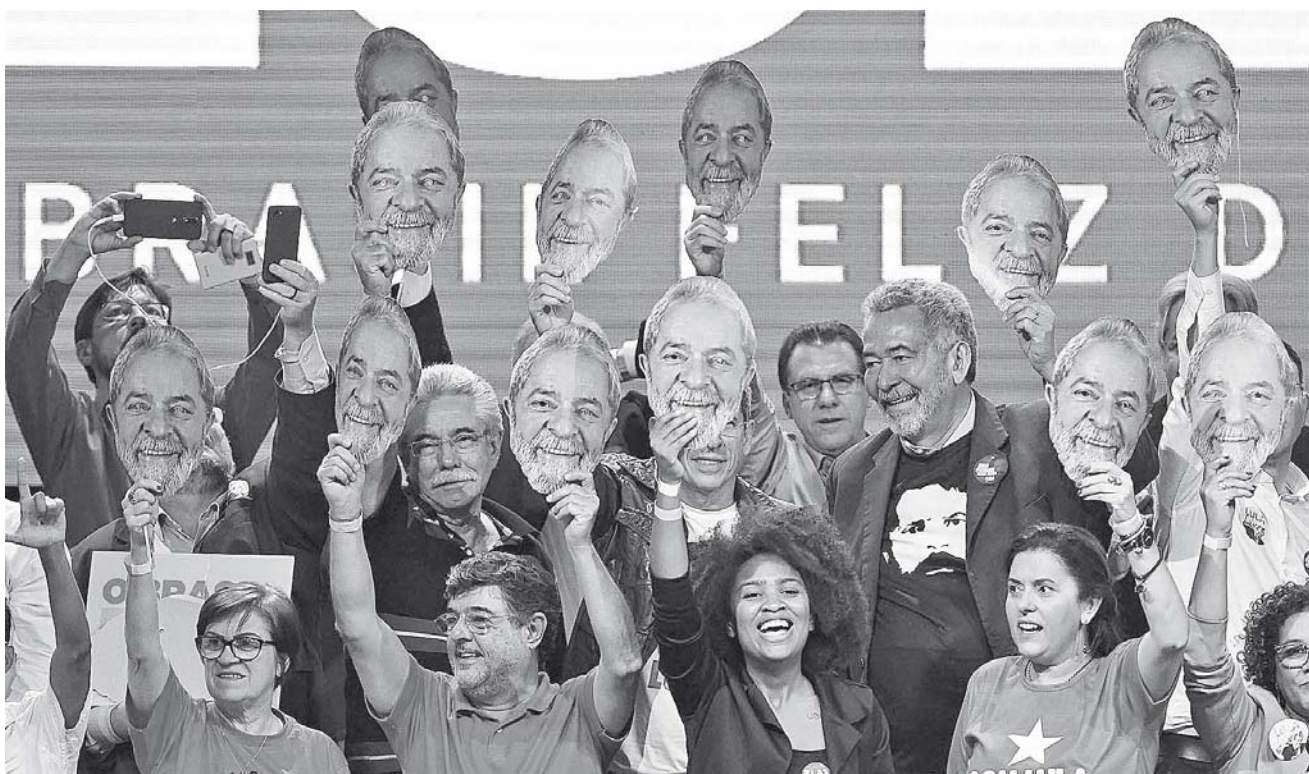
► Cuando faltan menos de tres semanas para la votación, las encuestas muestran que el centro se ha desintegrado y que el electorado se dirige a los extremos.

dor del partido y el político más popular de Brasil, el expresidente encarcelado Luiz Inácio Lula da Silva, no se le permitió presentarse debido a una condena por corrupción.