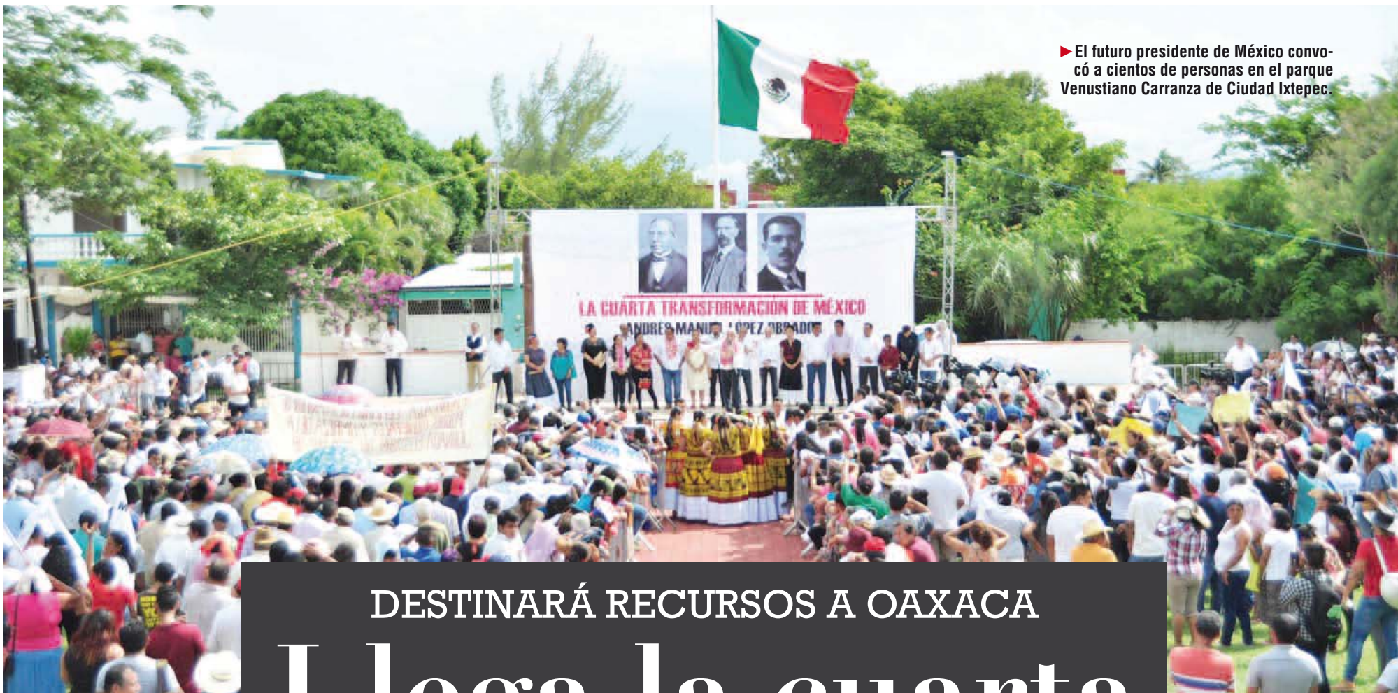
► El futuro presidente de México convocó a cientos de personas en el parque Venustiano Carranza de Ciudad Ixtepec.