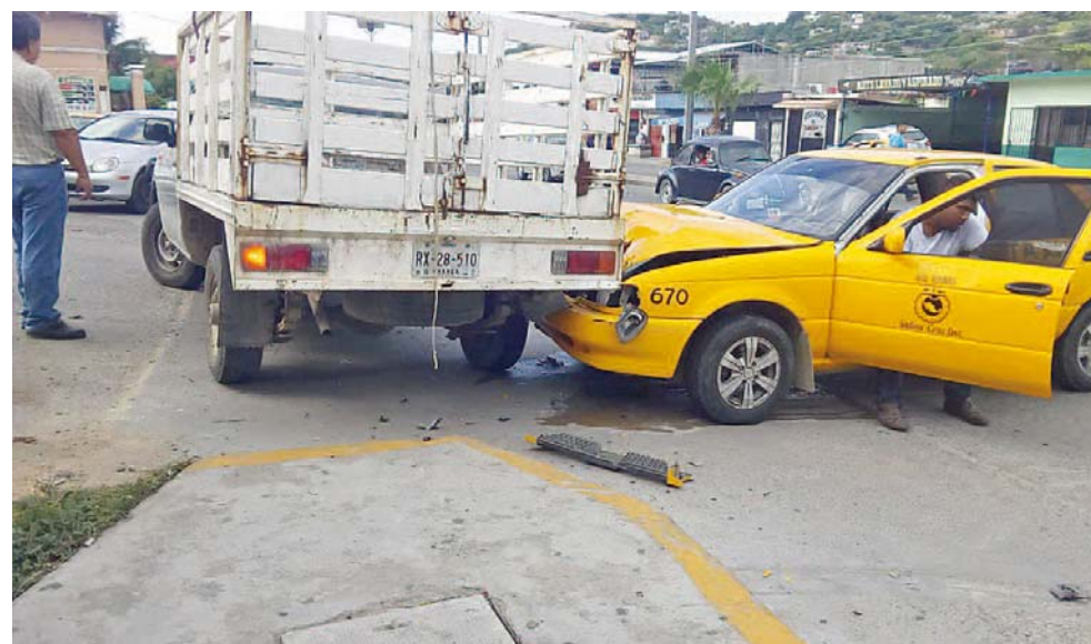
► Taxi impacta a camioneta por corte de circulación.

El motivo del suceso fue la posibilidad de velocidad immoderada e imprudencia al conducir, que finalmente existió la colisión