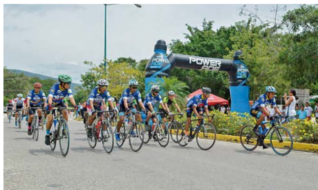
► Los participantes contribuyen con las diversas actividades.

Los participantes contribuyen con las diversas actividades, a preservar el ambiente y los espacios urbanos con mejor aspecto, además de aportar a prevenir graves problemas de salud pública en Huatulco.