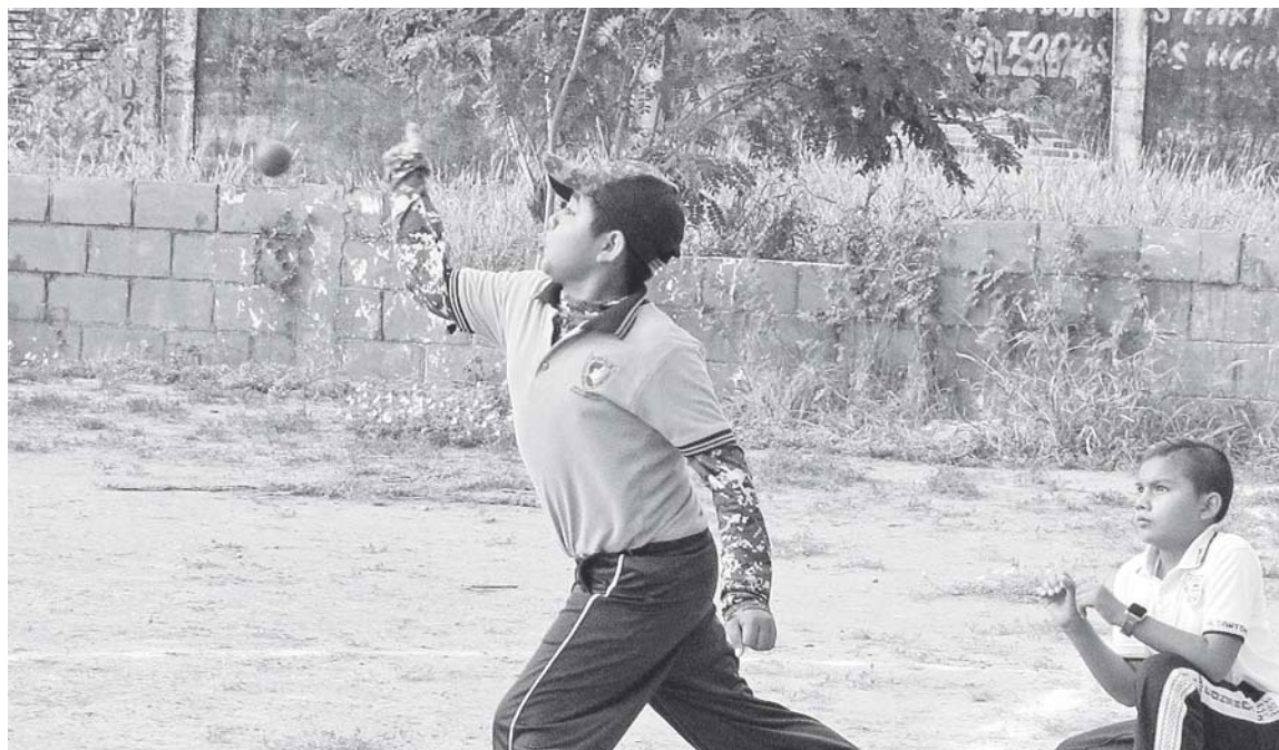
► Los chicos de la Josefa, más contundentes.

Desde la primera entrada los golpes al esférico esponjoso fueron mejor contenido por la defensa de los alumnos de la Josefa Ortiz de Domínguez quienes maniataron a sus adversarios de la Rosendo Santome y a la hora de ir a la caja de bateo fueron contundentes y con mejor contacto al esférico