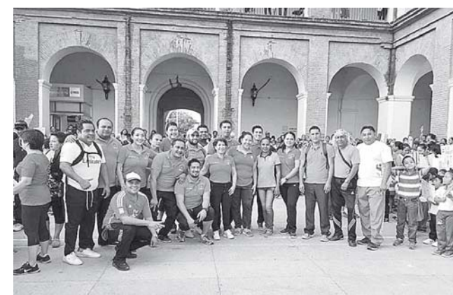
► Magno evento de la S.E.F. 13.

do, todos los seres humanos durante su existencia.