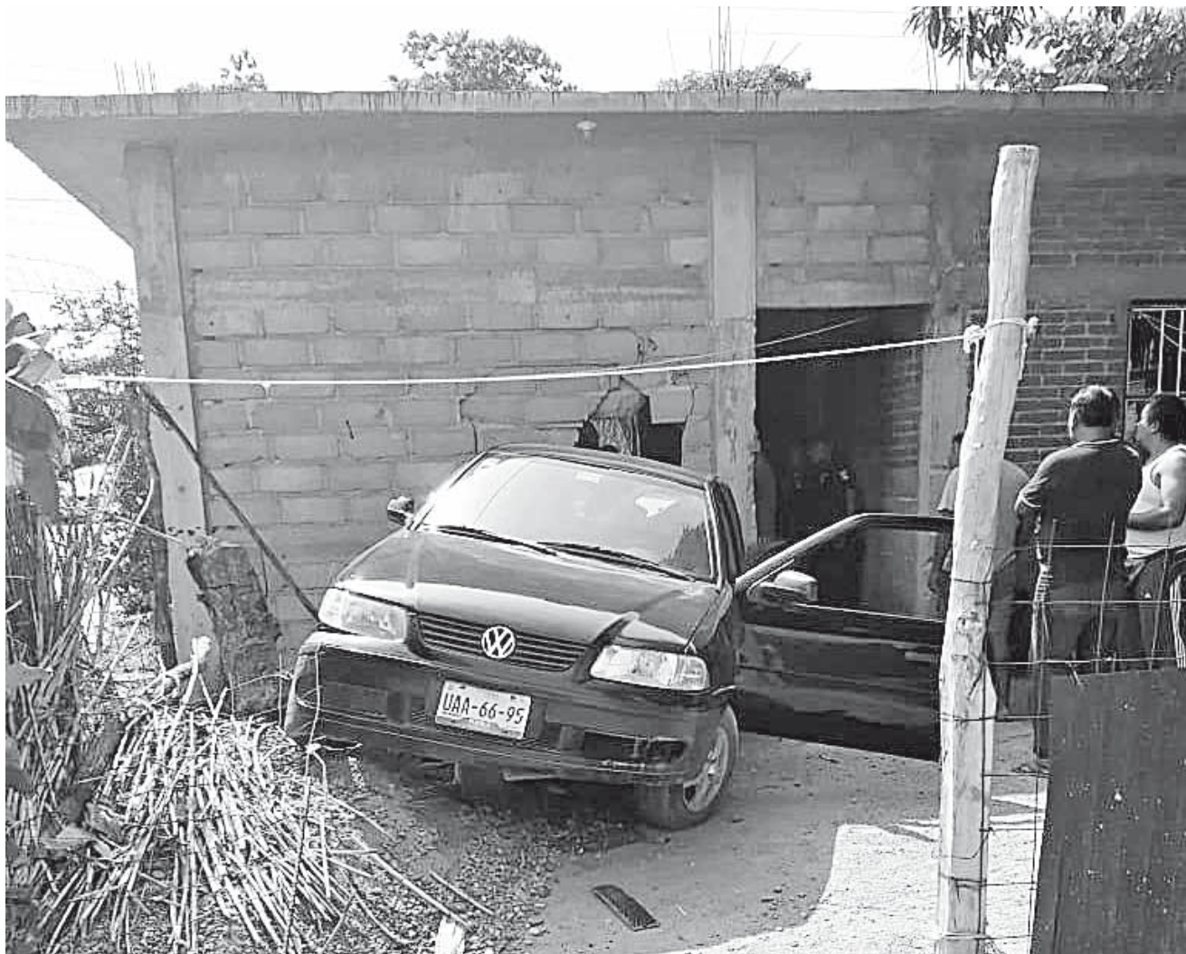
► Los elementos policíacos se retiraron al ser notificados de que ambas llegaron a un acuerdo.

Los elementos policíacos se retiraron al ser notificados de que ambas llegaron a un acuerdo.