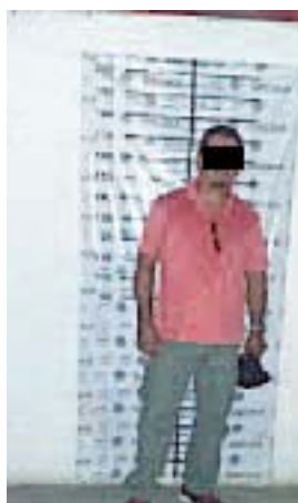
► Fue puesto a disposición del MP.