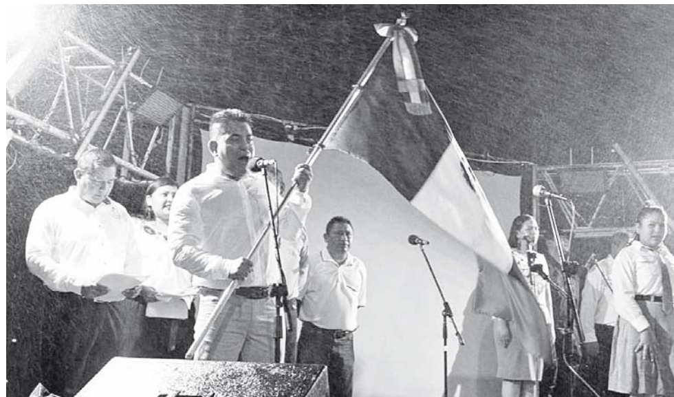
► Ni la intensa lluvia que cayó la noche del sábado detuvo el Grito de Independencia.

En completo orden y con mucha alegría los Jacatepecanos disfrutaron de esta celebración