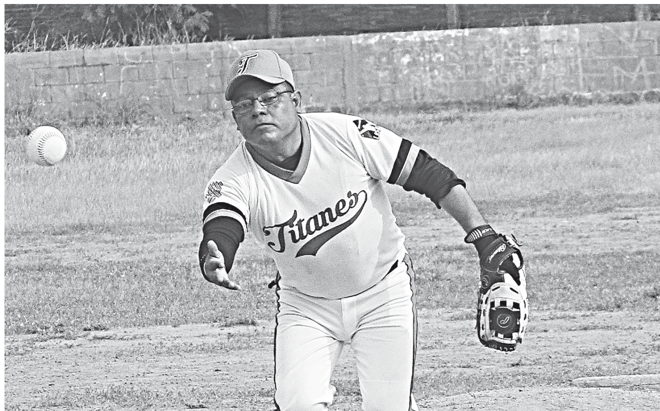
► El Pequeño Gigante cayó.

Los Escarlatas dan cuenta de Titanes con pizarra de 8-1, en el majestuoso Campo Rojo del Barrio Santa María en la Liga Sabatina de Softbol