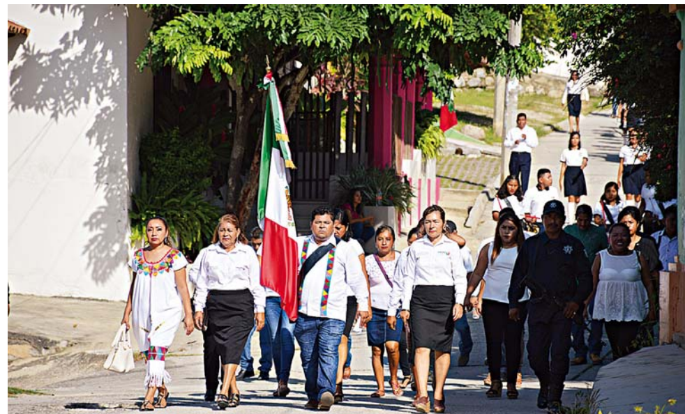
► El Grito de Independencia y el desfile se registraron con saldo blanco.