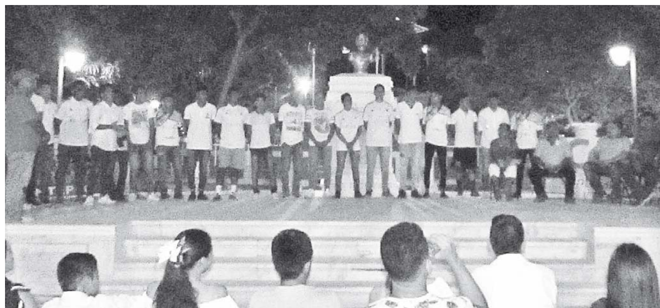
► Respaldo de la afición.