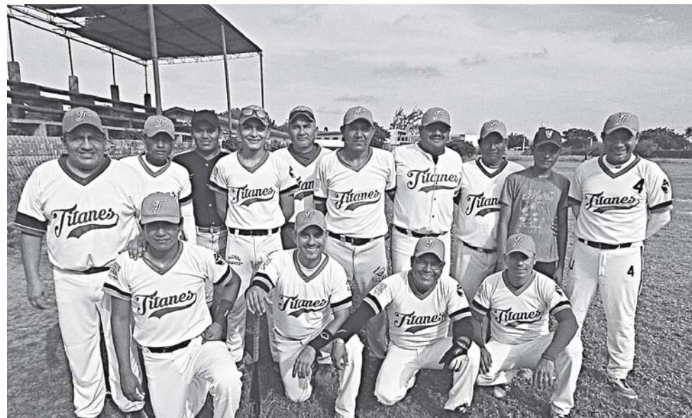
► Titanes no alcanza su ritmo.