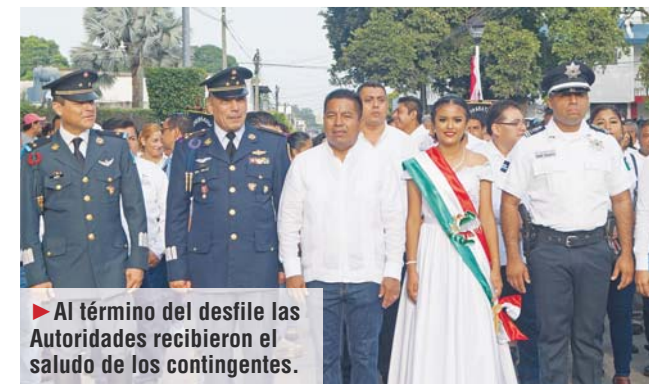
► Al término del desfile las Autoridades recibieron el saludo de los contingentes.