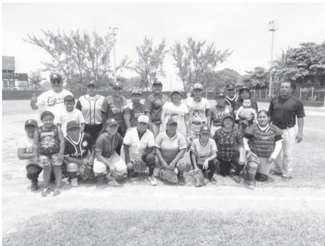
► Met's con dos nocaouts.