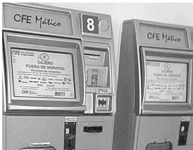
► Hay malestar de la población ante esta situación.