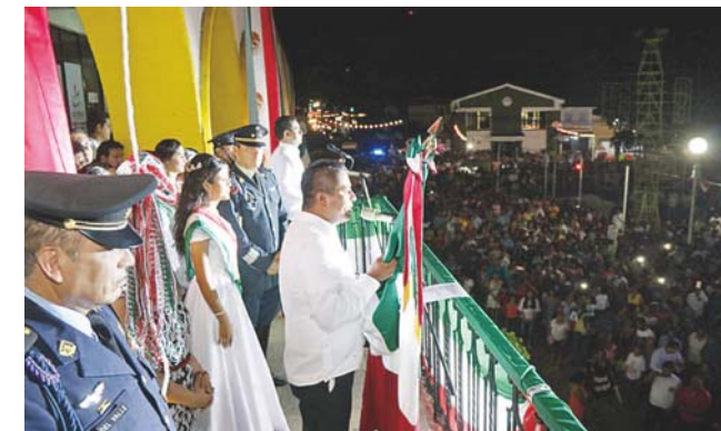
► El Presidente Municipal protagonizó el tradicional grito.

Al término del desfile las Autoridades Municipales y Militares, recibieron el saludo de cada uno