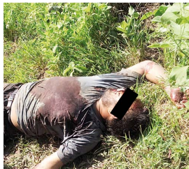
► Se sospecha del robo como motivo del crimen.

Ambos cuerpos fueron trasladados por una funeraria de Tehuantepec para posteriormente realizarse la autopsia.