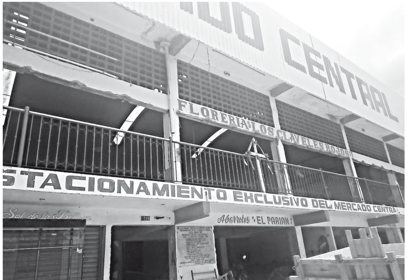
► Los locatarios se han molestado por las diversas fechas para la entrega del mercado.