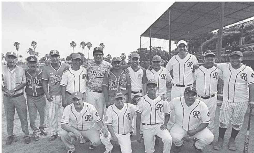
► Rojos mantiene el tercer puesto.