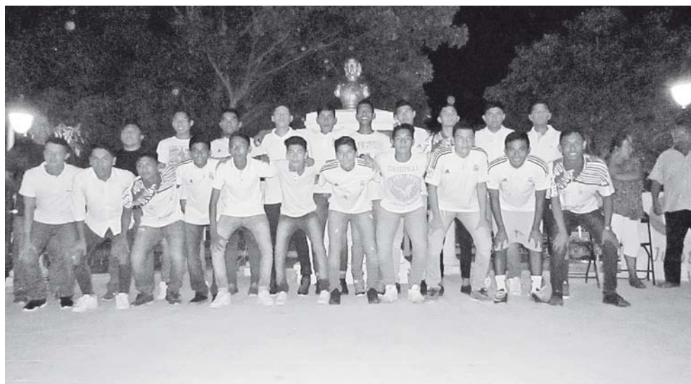
► Presentación del Deportivo Tehuantepec.