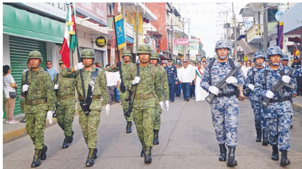
► La mañana del 16 de septiembre se llevó a cabo el desfile cívico-militar conmemorando la Guerra de Independencia.

Al concluir la ceremonia cívica, dio inicio el Desfile Cívico Militar que simboliza la entrada triunfal del Ejército Trigarante que habría de dar libertad y soberanía a nuestro país, iniciando con las Escoltas del VI Regimiento de Caballería Motorizado y de la Estación número Ocho de la Fuerza Aérea; participaron también 13 planteles educativos, Policía Municipal y VI Regimiento de Caballería Motorizado, con un número aproximado de 2 mil 300 participantes.