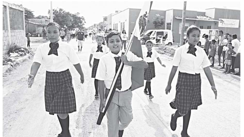
► En La Ventosa, la Escuelas Primaria Cámara Junior y el Preescolar José Vasconcelos salieron a las calles para demostrar que están de pie.

adversidades que enfrentan los padres de familia, los niños y los propios maestros tras un año difícil para los istmeños.