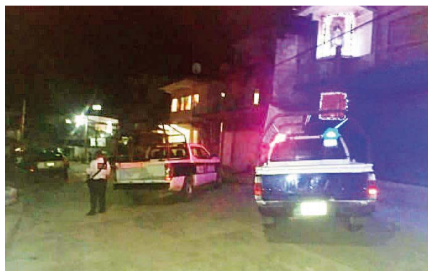
► El occiso era policía, luego se volvió empresario.

El joven lesionado fue llevado de urgencias al hospital general para ser atendido, por su parte los elementos de la policía preventiva municipal realizaron recorridos de vigilancia en la zona centro en búsqueda de los asaltantes sin obtener hasta el momento resultados favorables pese a que existen filtros de control en las entradas y salidas de la ciudad.