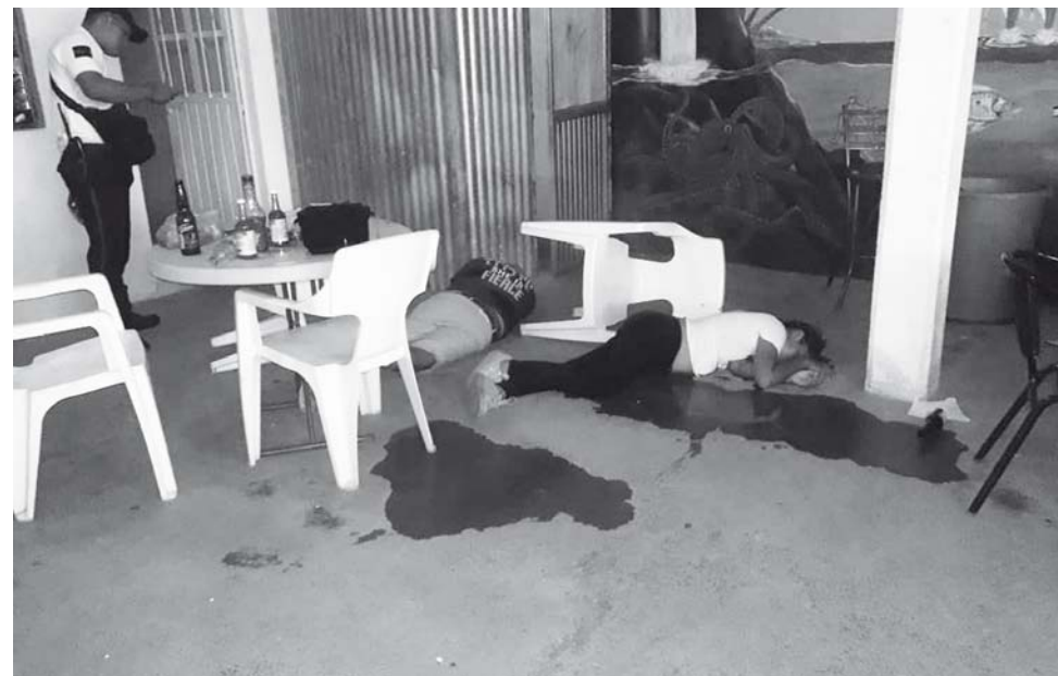
► Un solo hombre fue el encargado de terminar con la vida de ambas personas.

Los agentes se trasladaron hasta el crucerito de la Tercera Sección del barrio de Santa Cruz Tagolaba de Santo Domingo Tehuantepec.