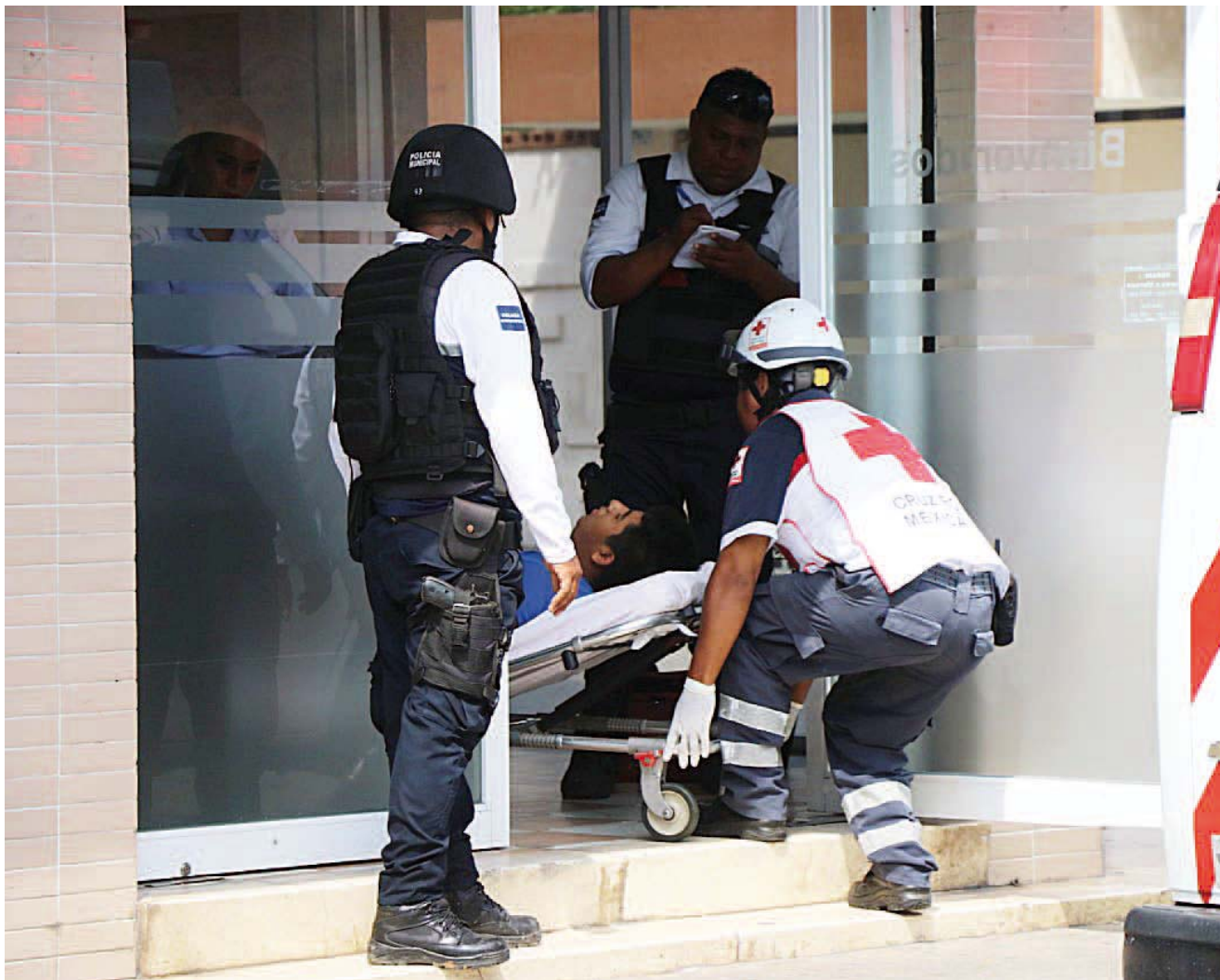
► El joven lesionado fue llevado de urgencias al hospital general para ser atendido.

A decir de algunos conocidos del finado, el "Güero", fue director de la policía municipal de Jalapa de Díaz Oaxaca, posteriormente se convirtió en empresario transportista y era lo que en la actualidad se dedicaba, hasta el momento se desconoce el móvil del crimen pero las autoridades investigadoras ya trabajan en el caso para esclarecerlo.