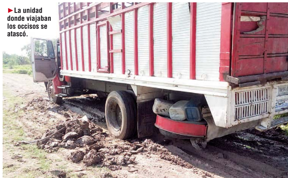
► La unidad donde viajaban los occisos se atascó.

personas acudieron a la población para comprar unas reses y un caballo. Pero que en el trayecto la unidad se atascó en una zona lodosa por lo que no pudieron continuar su camino.