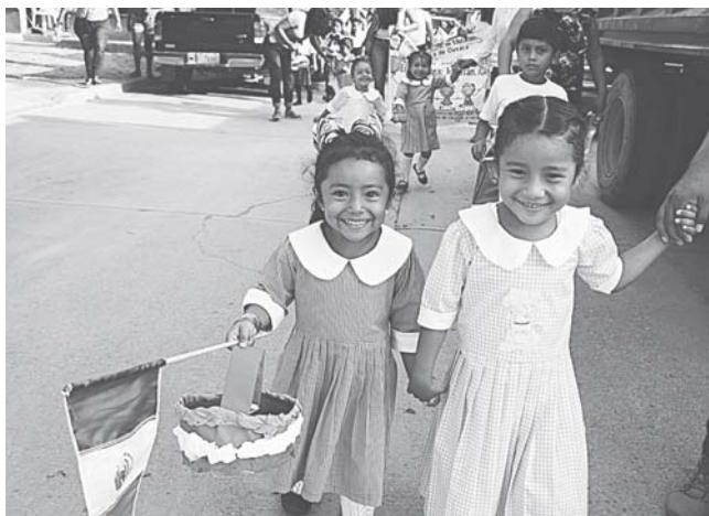
► Conmemoraron el 208 aniversario de la Independencia.

las Primaria Cámara Junior y el Preescolar José Vasconcelos salieron a las calles para demostrar que están de pie, aún a pesar de las