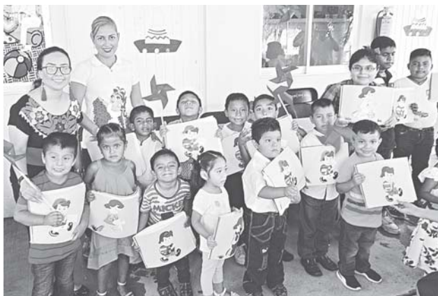
► Aserrín, café, papel china, papel crepe, arroz, foami, pasta y material de reciclaje fueron transformados en bellos trabajos.

De esta manera el DIF asistió exitosamente a 29 niños y 11 niñas de Otatitlán, Ciudad Alemán, Temascal, Ayotzintepic, así como de diversas colonias y comunidades de nuestro municipio, los cuales tienen problemas de lenguaje, sordera, autismo, déficit de atención, entre otros padecimientos; la institución destacó que en total son 179 los pequeñitos que con regularidad asisten se atienden en el área y que esperan que a ellos se sumen muchos más que requieran de estos servicios.