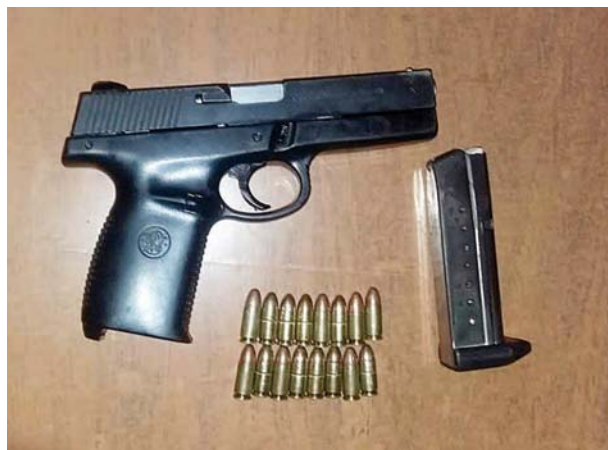
► Portaba un arma calibre 9 milímetros.