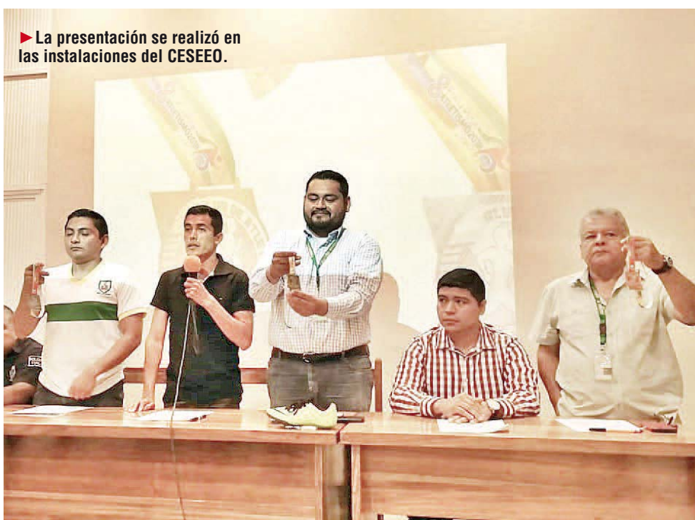
► La presentación se realizó en las instalaciones del CESEEO.

La competencia tendrá finales contra reloj; la Junta previa se realizará el miércoles 19 del presente mes a las 17:00 horas en las instalaciones del CESEEO 5 de mayo.