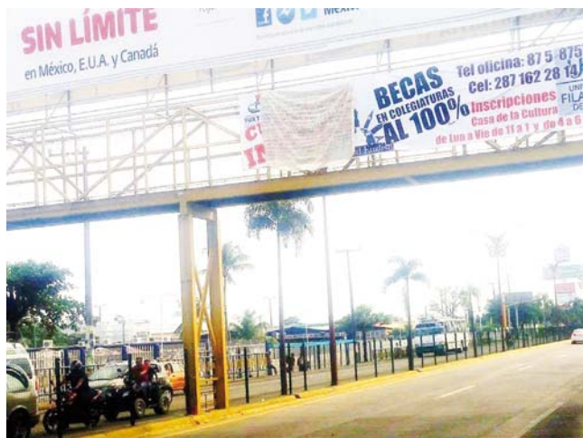
► Apareció la mañana de este domingo en el puente peatonal que se ubica frente al CBTIS.

Al mediodía del domingo, autoridades policiacas dieron a conocer que sobre la calle Querétaro y la prolongación 20 de noviembre de la colonia 5 de Mayo, una persona había sido atacada a balazos y era necesaria su presencia ya que la víctima estaba muriendo, al llegar los uniformados observaron que se trataba de una persona de sexo masculino que