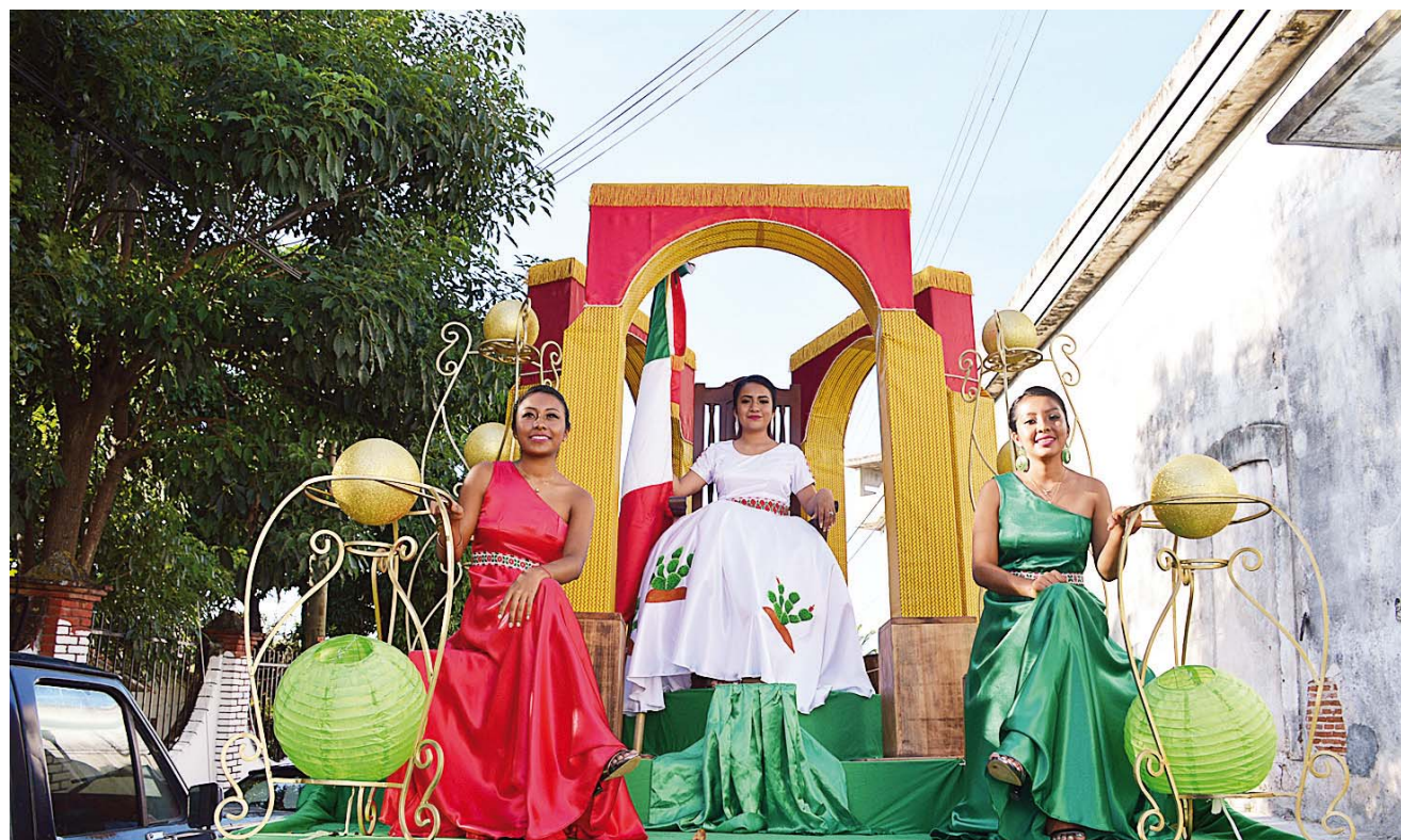
► El acto cívico incluyó el canto del Himno Nacional Mexicano por parte de las coristas y la América.

El desfile de 16 de septiembre incluyó la participación de secundarias, preparatorias, CECYTE y cientos de niños de primaria