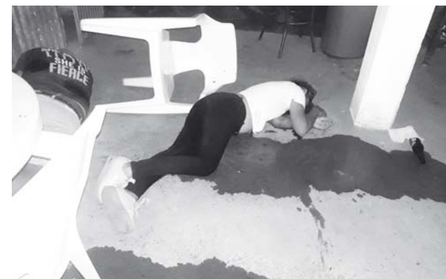
► Ambas personas tenían su domicilio en el Fraccionamiento el Pitayal.