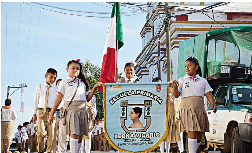
► Los contingentes recorrieron las principales calles de la población.