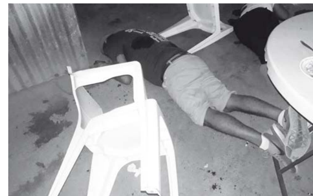
► El varón asesinado tenía 38 años, originario de Tehuantepec y de oficio chófer.