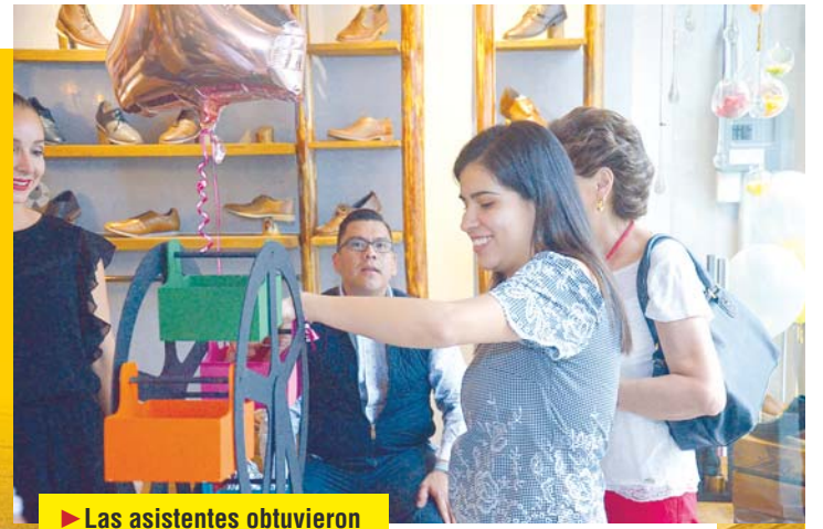
► Las asistentes obtuvieron descuentos en calzado.