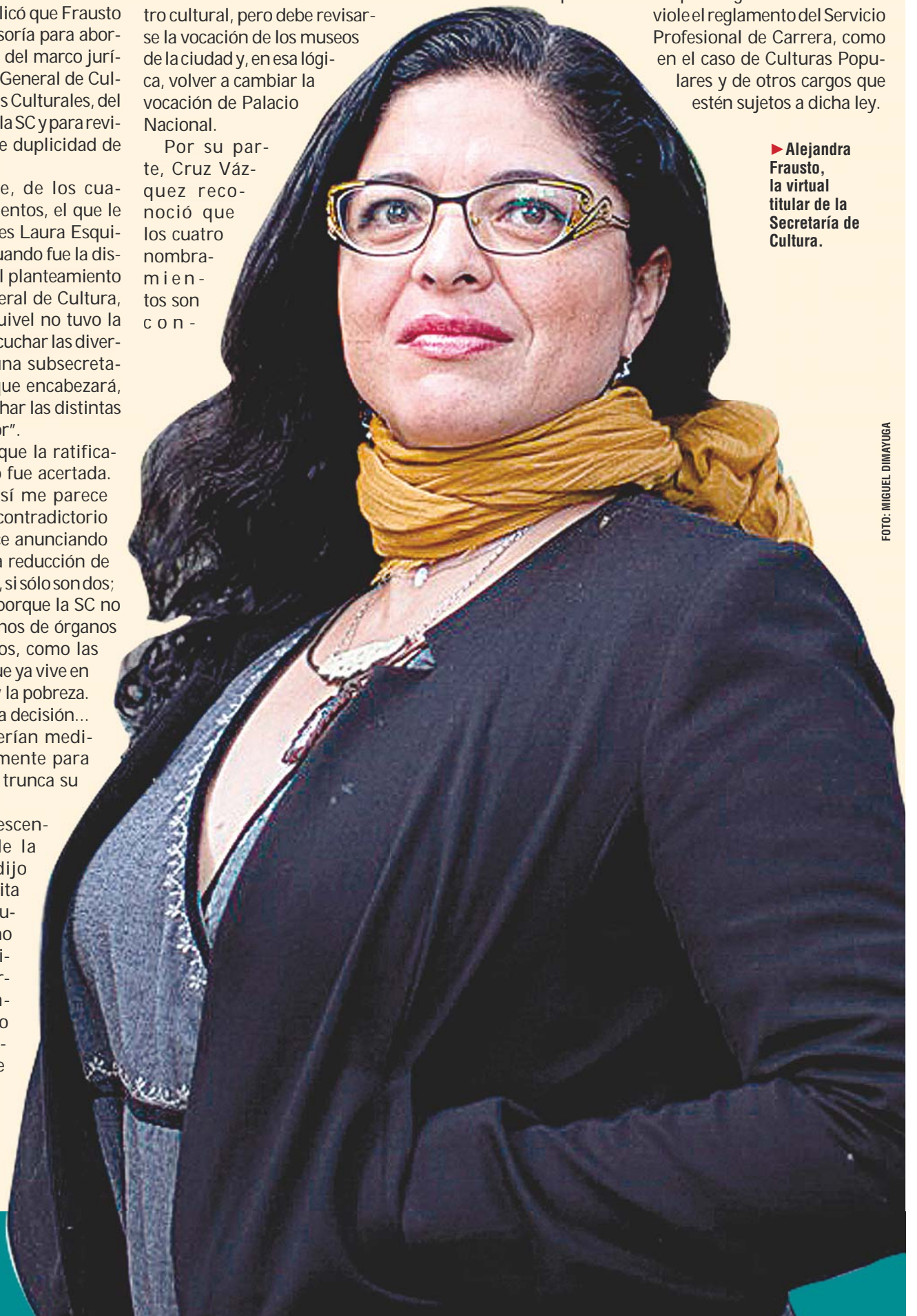
► Alejandra Frausto, la virtual titular de la Secretaría de Cultura.