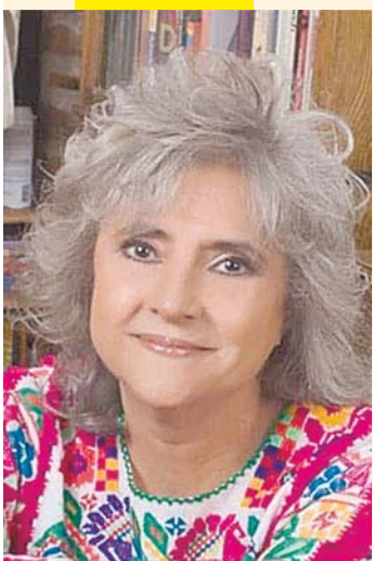
► Laura Esquivel.

Alejandra Frausto dijo que el primero es Laura Esquivel, la exlegisladora y autora de Como agua para chocolate