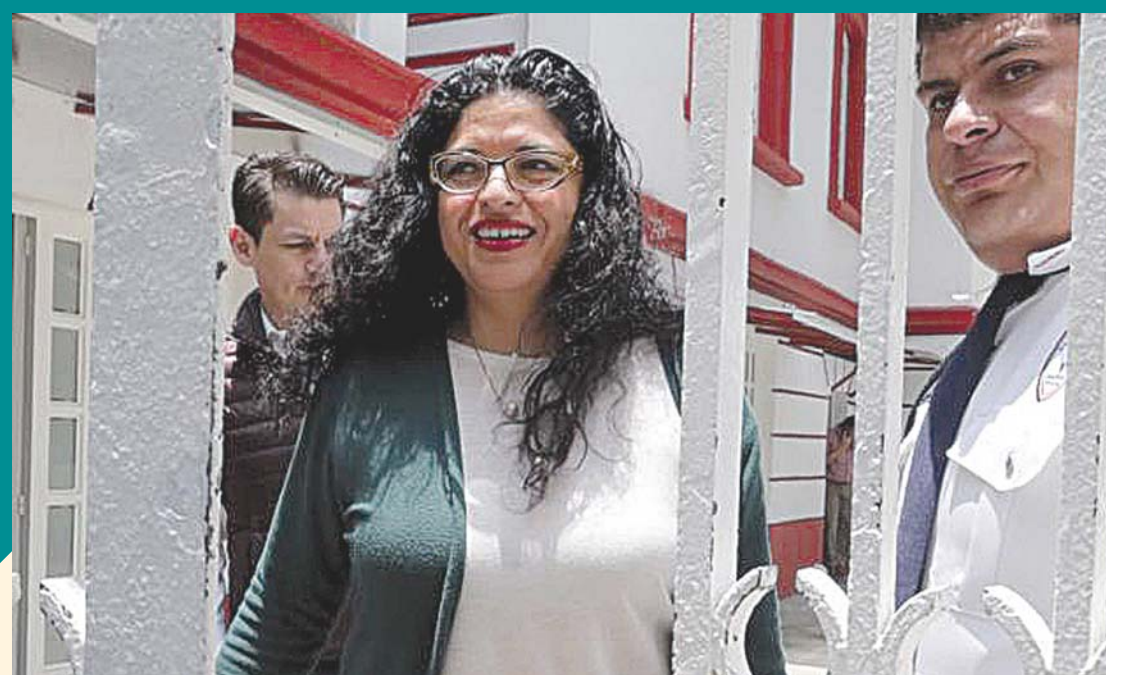
► Los Pinos se convertirá en un centro cultural.