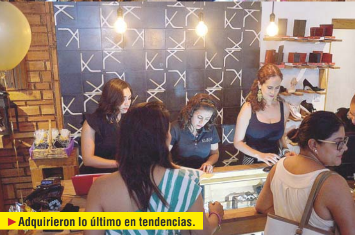
► Adquirieron lo último en tendencias.