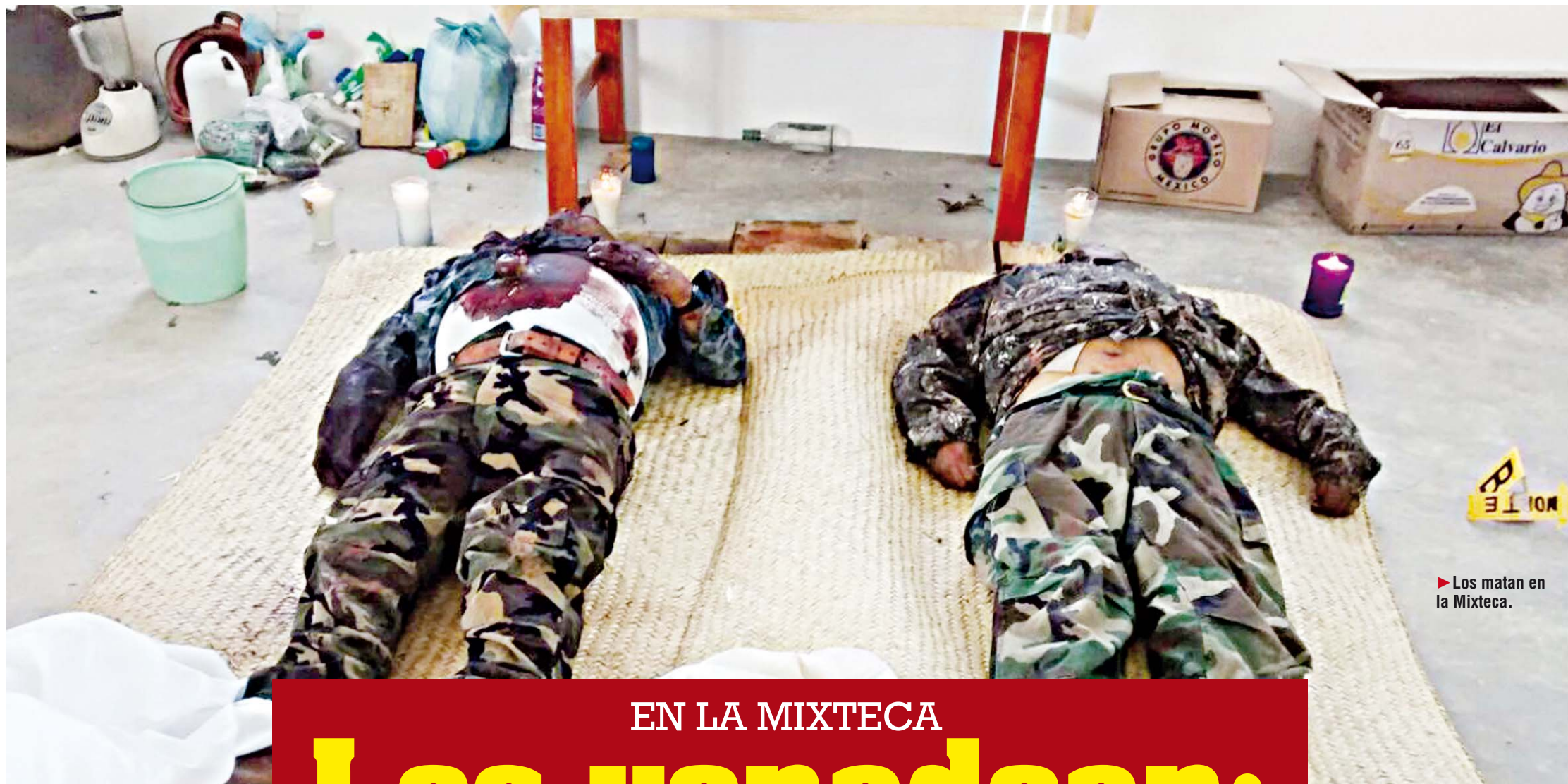
► Los matan en la Mixteca.

policiaca@imparcialenlinea.com / Teléfono 501 83 00 Ext. 3176