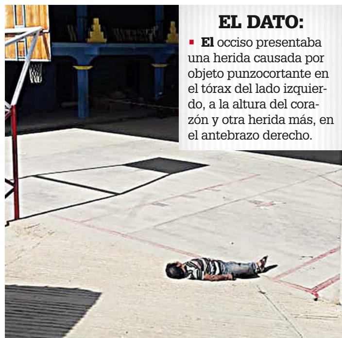
► El hombre fue acuchillado en la Lapaguía Ozolotepec.