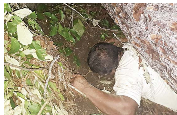
► Muere aplastado en Coatlán.