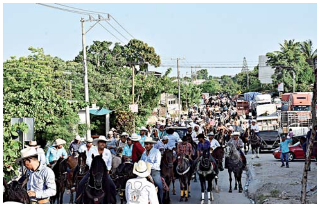
► A lo largo de una semana se contemplan diversas actividades en honor al santo.