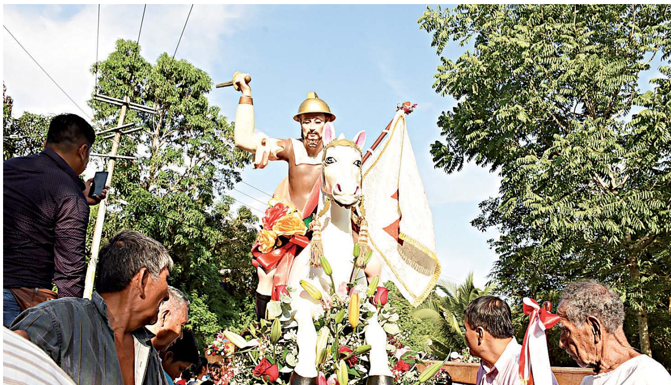
► Escoltaron al santo patrón de Jamiltepec con una cabalgata por la comunidad.

La celebración inició con la cabalgata encabezada por la imagen de Santiago Apóstol que fue custodiada por los tatamandones