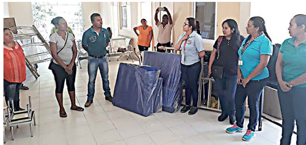
► Autoridades acudieron para verificar la entrega del equipo.