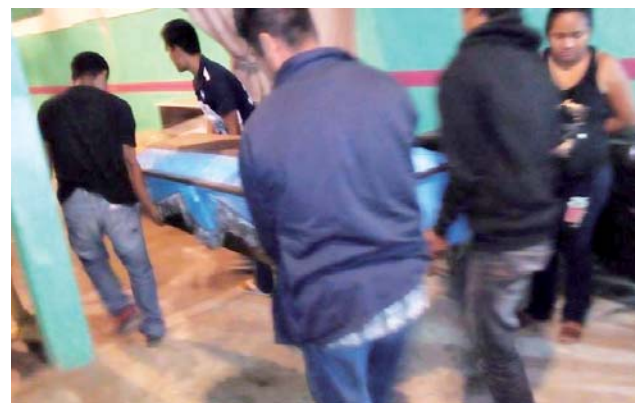
► La víctima, estuvo defendiendo a una persona en la comunidad de Salchi.

Por la noche, integrantes del Codedi se comenzaron a concentrar en el entronque de la carretera local que comunica a Santa María Huatulco con la carretera federal 200 y desde las 23 horas bloquearon el paso a automovilistas, impidiendo el paso hacia