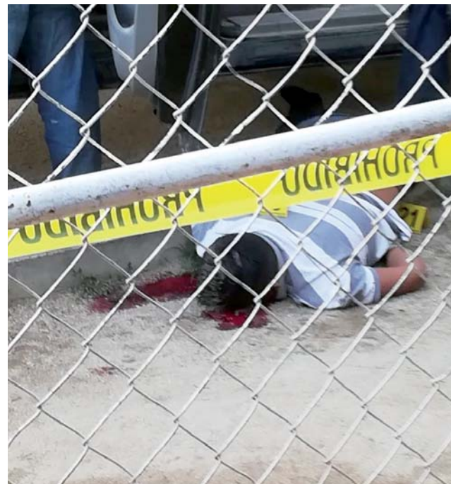
► Hasta el momento se desconoce las causas por las que fueron asesinados.

sin vida en el interior de la camioneta, frente al volante; el otro en el suelo, a un