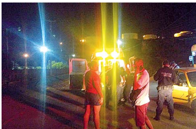
► El afectado no recibió heridas de gravedad.

Elementos de la policía vial tomaron nota de los hechos y posteriormente solicitaron la presencia de la grúa para arrastrar la unidad de motor al corralón donde quedó a disposición.