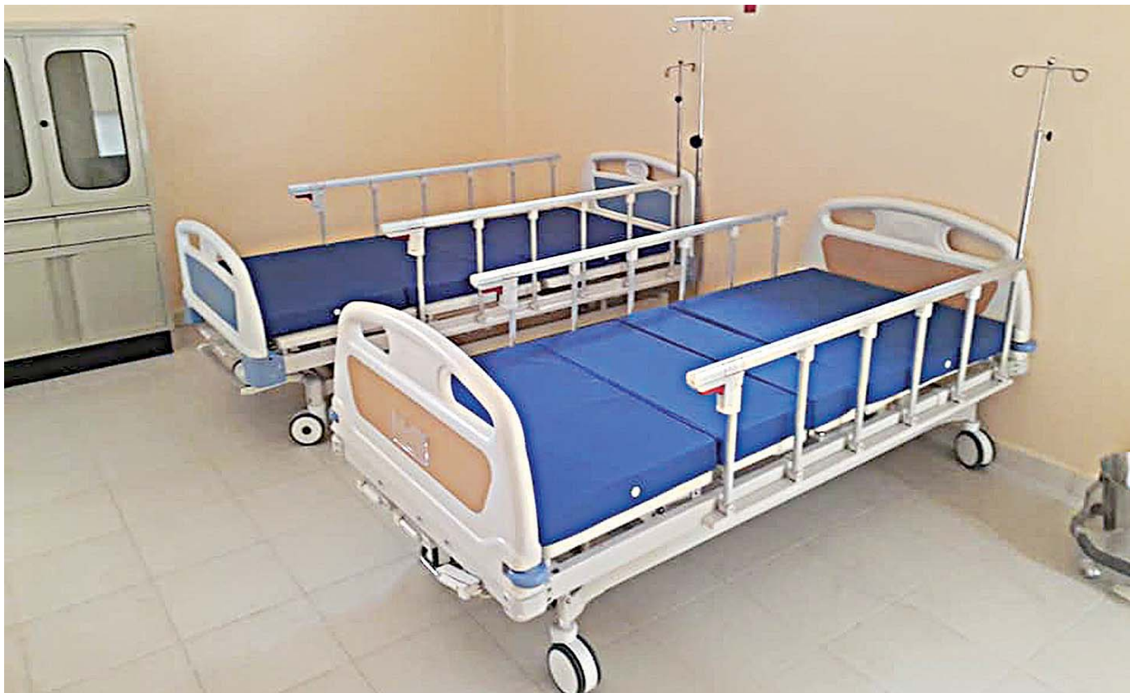
► La administración municipal buscó el modo de que se equipara la obra.

LA INSTALACIÓN SERÁ INAUGURADA DESPUÉS DE MÁS DE CUATRO AÑOS QUE ESTUVO COMO UN ELEFANTE BLANCO, DEBIDO A LA FALTA DE EQUIPAMIENTO