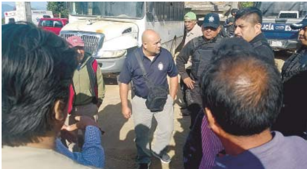
► Las autoridades policiales del estado fueron a la zona del conflicto.