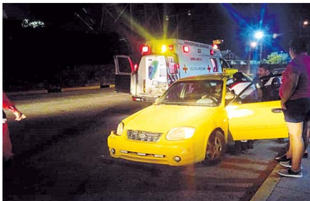
► Los hechos ocurrieron en la avenida Teniente Azueta.