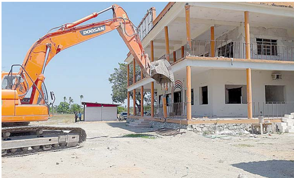
► Denunciaron desinterés del gobierno para atender a los damnificados.