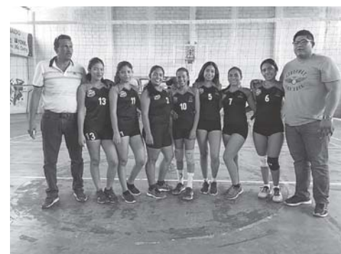
► Panteras cayó en imprecisiones.