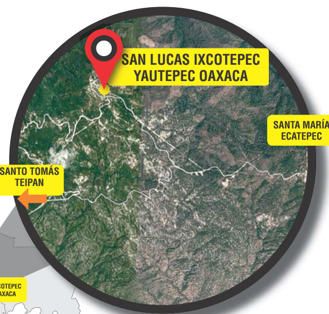
► En el mapa se pueden ubicar las dos comunidades en conflicto