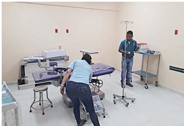
► Están programando la fecha de inauguración del nuevo Centro de Salud.

Por ello, informó que están programando la fecha de inauguración del nuevo Centro de Salud, el cual, dijo será en más o menos un mes y medio, con lo que, será un logro relevante para este municipio costero.