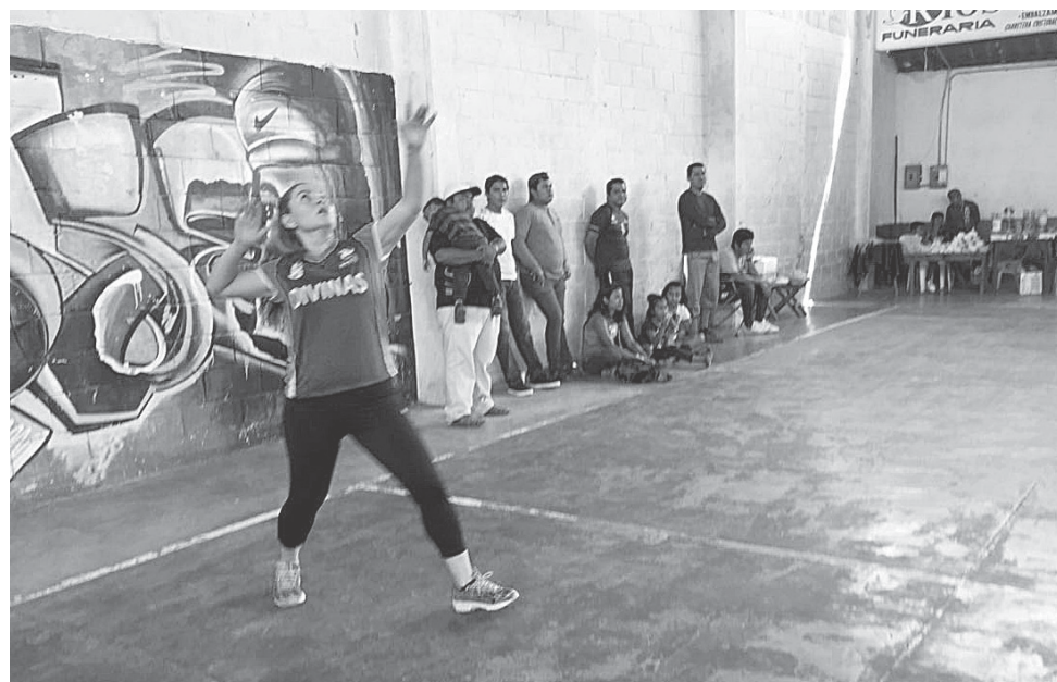
► Divinas hizo lo suyo.