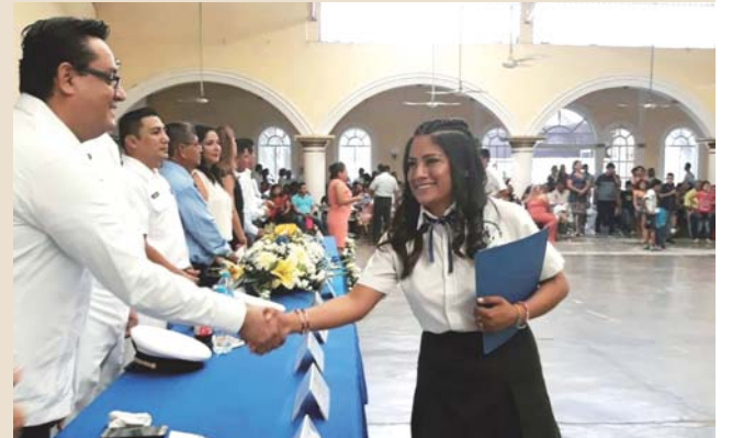
► La joven recibiendo sus documentos mediante la ceremonia.