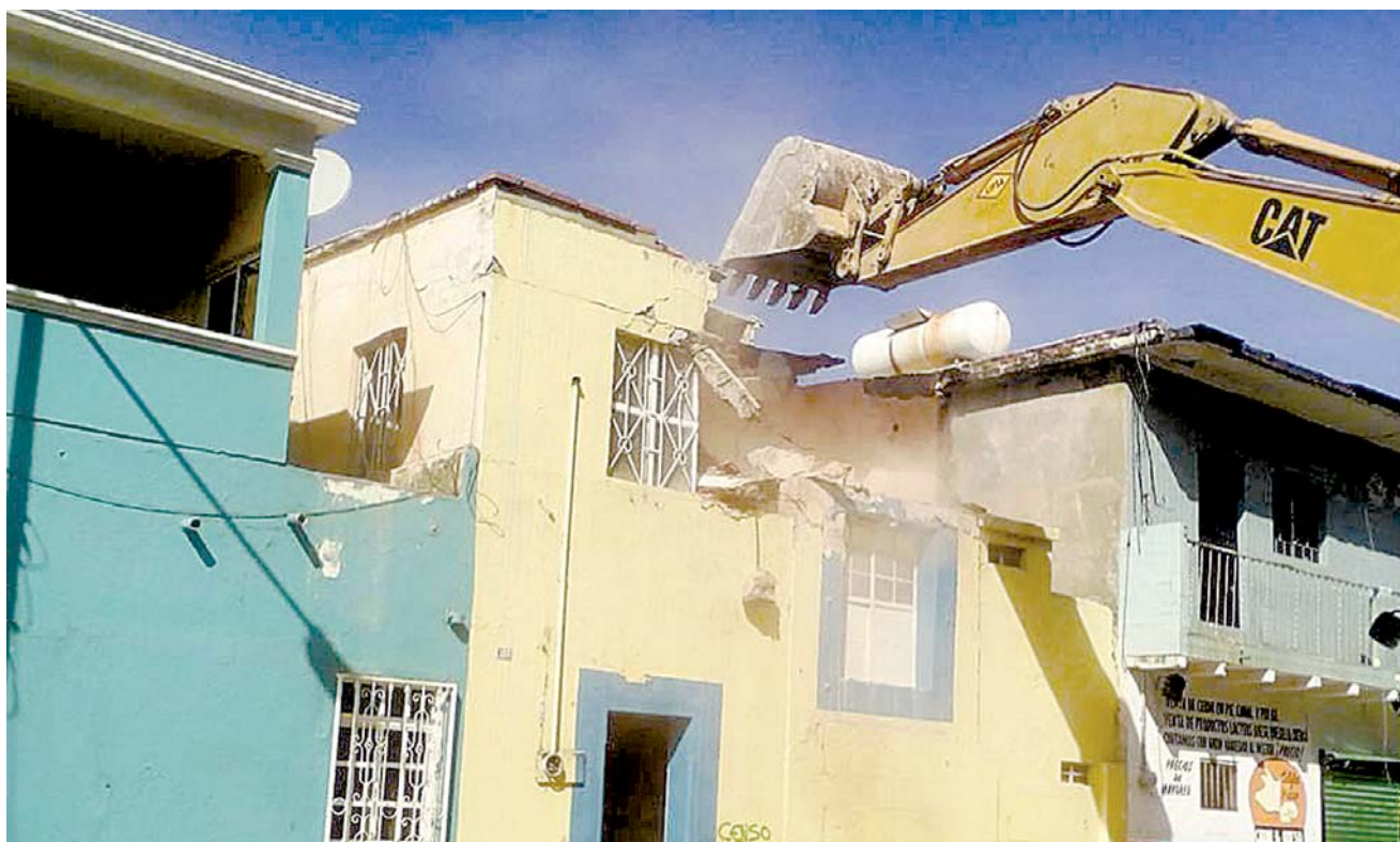
► Aseguran que algunos políticos se han visto beneficiados con los apoyos.

El padrón de damnificados incluye más de 30 mil familias de Salina Cruz, Tehuantepec, Juchitán, Unión Hidalgo, entre otros municipios