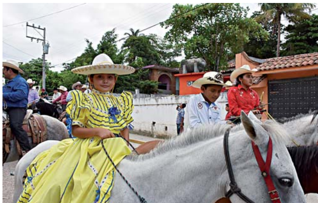
► La cabalgata concluyó en el centro de la población, donde celebraron una verbena.