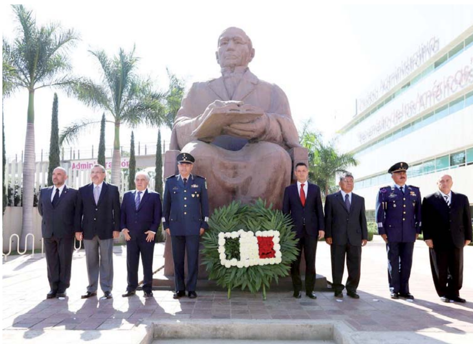
► Un oaxaqueño universal, cuyo ejemplo es símbolo de las causas que es el fundamento del México moderno.