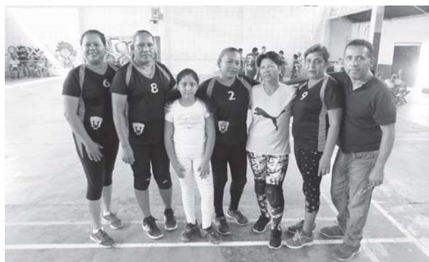
► Mamás Pumas se confiaron en demasía.