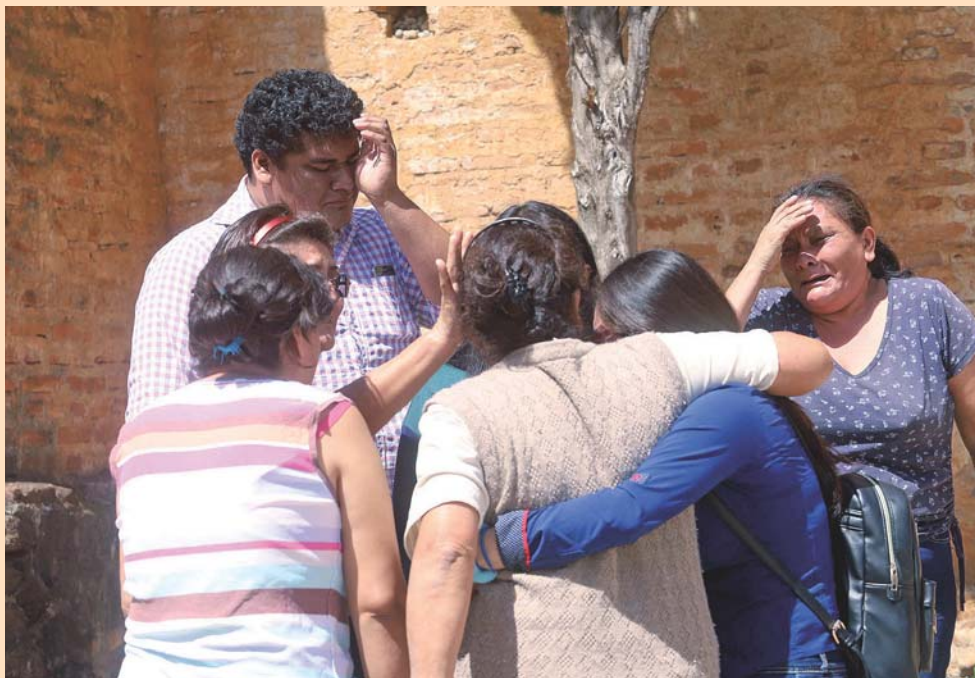
► Familiares de las víctimas exigen justicia.

os vecinos de la comunidad de Santa María Ecatepec