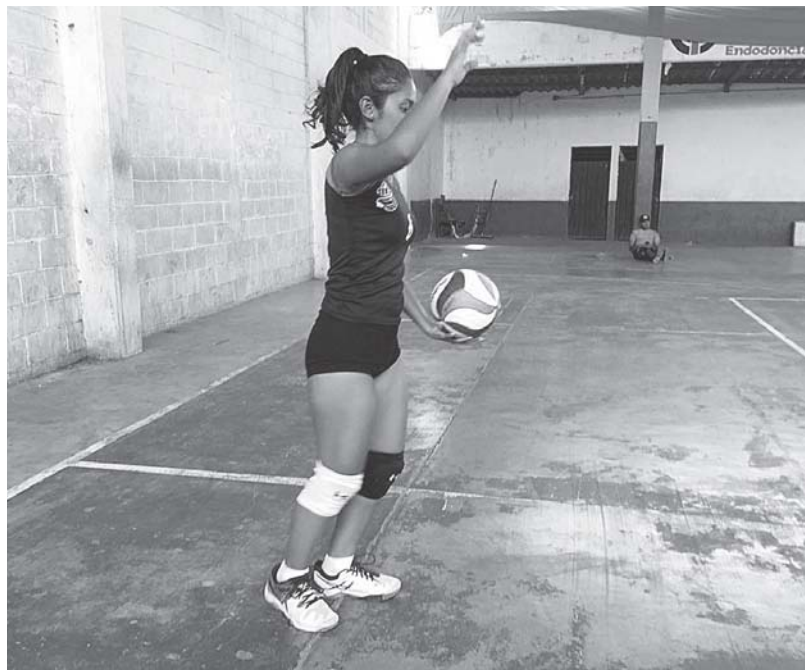
► Buscando acomodar el saque.