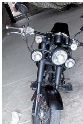
► El robo de motocicletas va en aumento.

El robo de motocicletas va en aumento en el municipio en donde hasta el momento no han podido frenar esa incidencia pese a