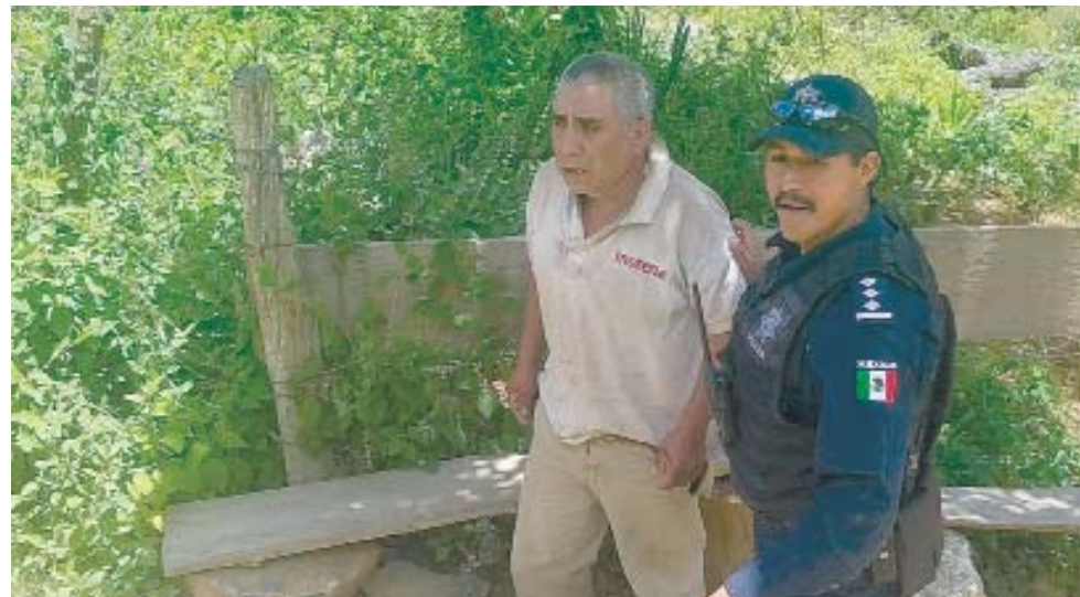
► Un sobreviviente al ataque quedó con una herida.