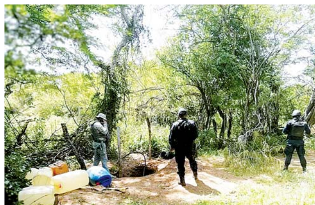
► Los resultados se deben a la "Operación Sellamiento".

El robo de hidrocarburo en estos últimos meses disminuyó en el Istmo debido al aseguramiento de 23 tomas clandestinas por corporaciones de seguridad