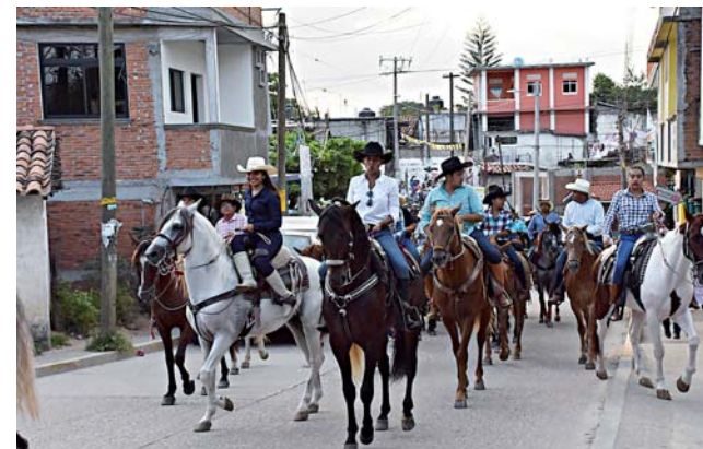
► La cabalgata se realizó al concluir la misa en honor a Santiago Apóstol.