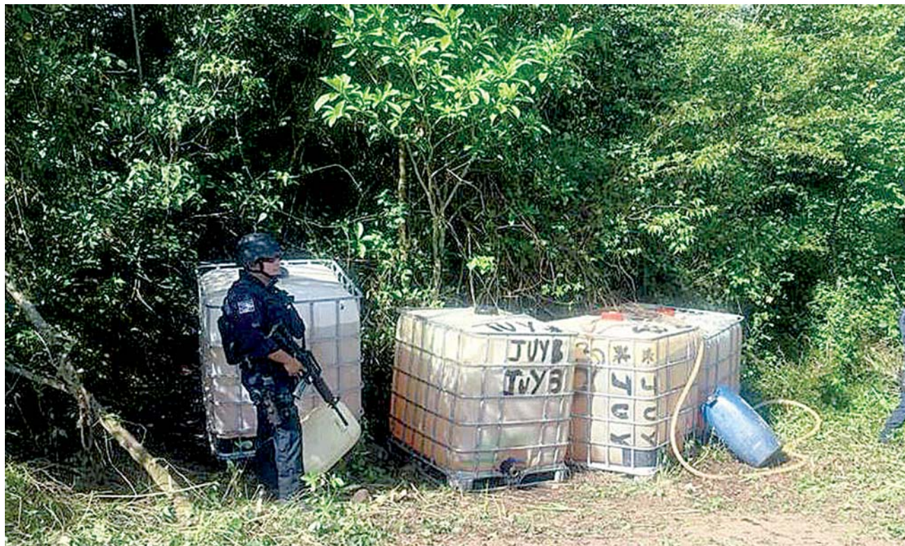
► Los aseguramientos han permitido reducir este ilícito en Juchitán, Salina Cruz y Matías Romero.