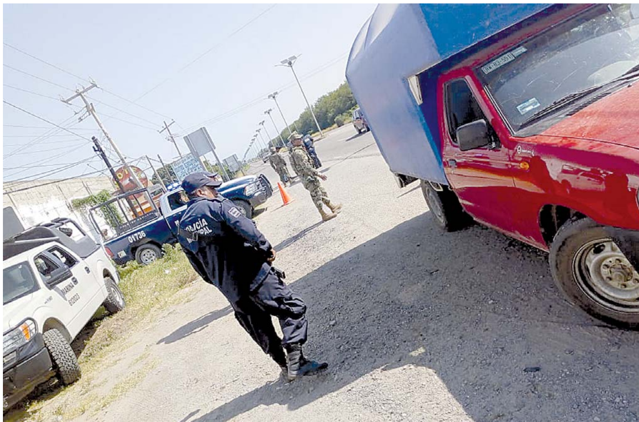
► Los operativos continuarán en el municipio con la finalidad de reducir el índice delictivo.

Los operativos continuarán en el municipio con la finalidad de reducir el índice delictivo en el municipio de Salina Cruz.