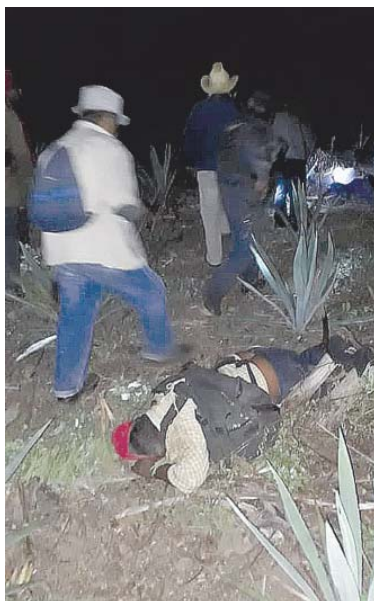
► En la noche seguía la incertidumbre en la zona.