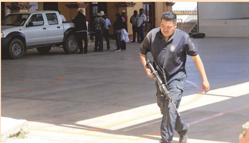
► Elementos de la Policía Estatal y de la AEI mantienen un operativo en la zona.

del ayuntamiento, donde fueron limpiados para proceder al reconocimiento de los familiares.