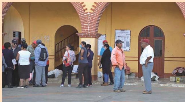
► En la explanada del palacio los familiares de las víctimas lamentaban la tragedia.

tras un homenaje de cuerpo presente en la iglesia de la comunidad.