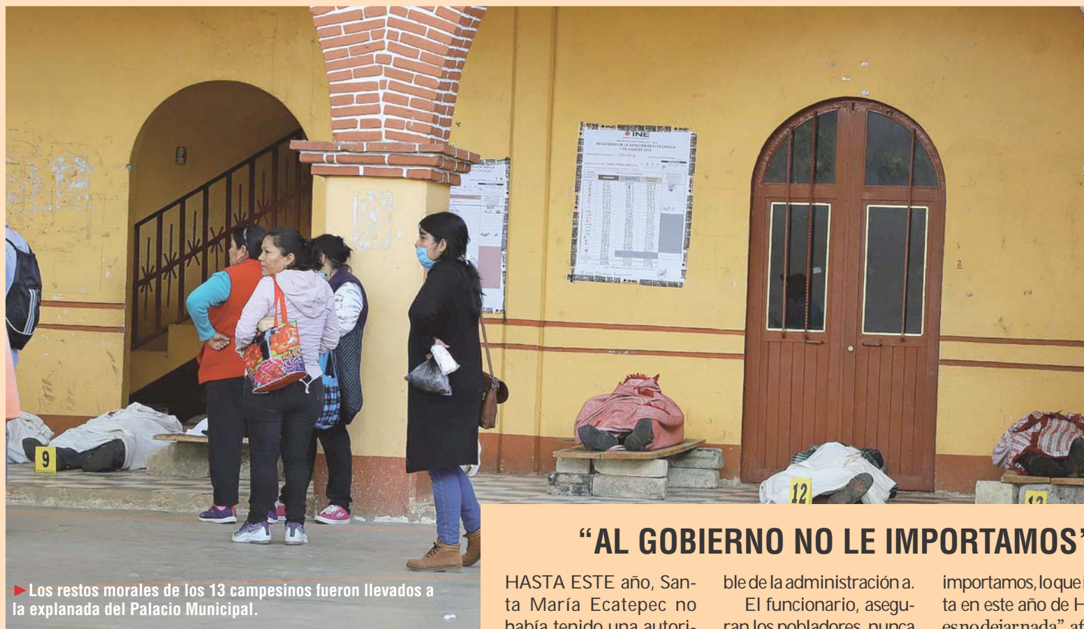
► Los restos morales de los 13 campesinos fueron llevados a la explanada del Palacio Municipal.