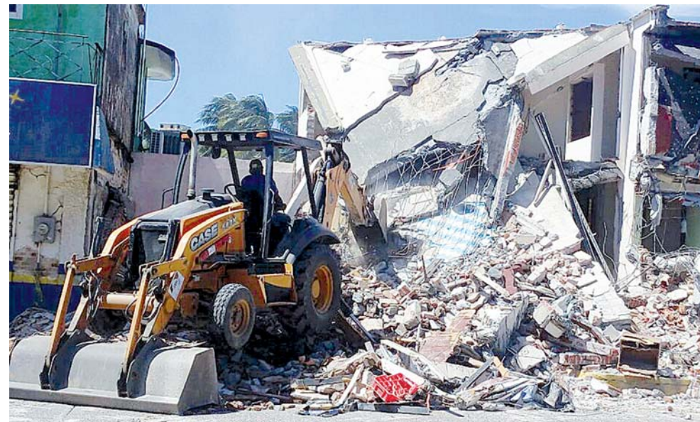
► Aseguran que algunos falsos damnificados se han visto beneficiados.