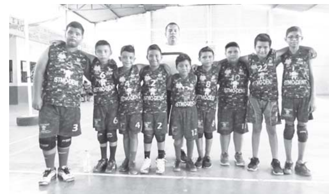
► Tekos A dieron la sorpresa.