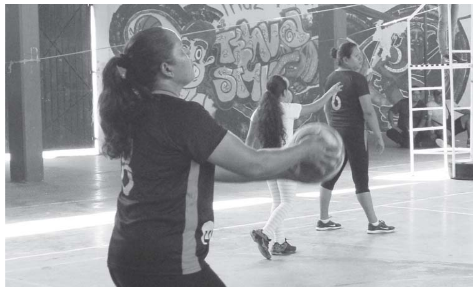
► Las Mamás Pumas le echaron los kilos.

Las Mamás Pumas fueron víctimas de los Tekos "A" quienes dieron un excelente partido y en dos sets se impusieron en la cancha del Barrio Laborío