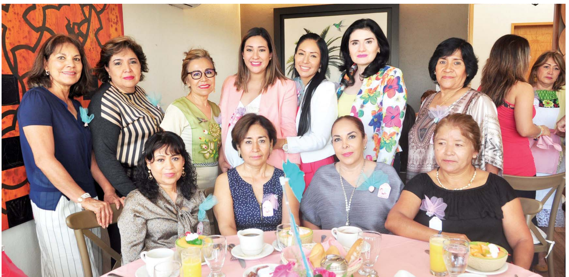
► En compañía de sus más allegadas celebró el próximo nacimiento de su primogénita.