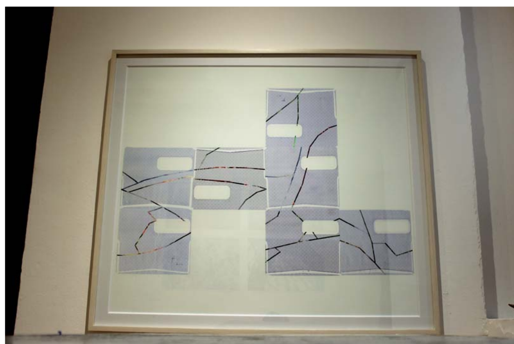
► Da una nueva lectura sobre cómo la sociedad está atravesada.

En tanto Auditoría personal hace pensar en el origen y todo lo que conlleva la producción de la vestimenta en un mundo globalizado. Para ello, Edith investigó el uso de los recursos y la mano de obra implicada en la producción de su guardarrropa. Se percató que hay una esclavitud moderna que se da desde la contratación de personas partir de los 12 años de edad, a quienes se les paga en promedio, en Indonesia, 7.10 dólares por una jornada de ocho horas, mientras que en China es una cifra equivalente a 45 pesos por jornada. Además, que "para producir un kilo de algodón necesitas entre 7 mil y 15 mil litros de agua, un promedio de 12 mil".