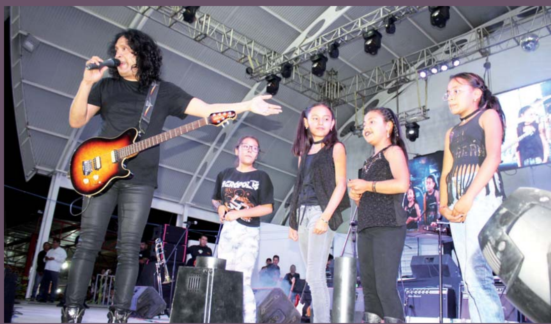
Pequeños y grandes disfrutaron del concierto.

Los integrantes de la banda que surgió en la Ciudad de México, consintieron a sus fans que los esperaron desde la tarde en el