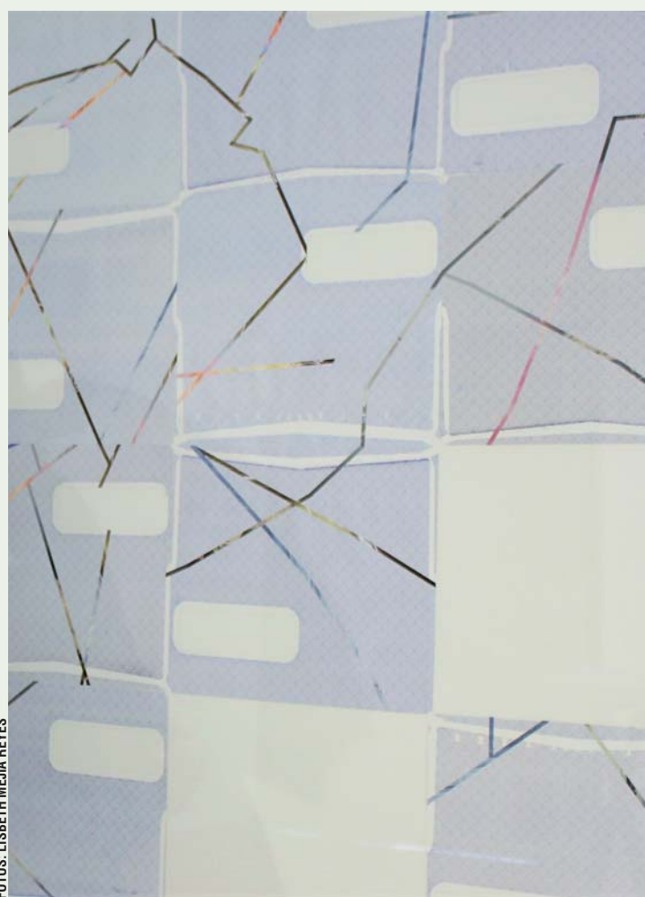
► Combina varios recursos y soportes.

"Y ahí, de alguna manera, como están solas, lejos de la familia, empieza este fenómeno que ya conocemos, que es desapariciones", explica la creadora de Cifra , intervención que retoma la violencia