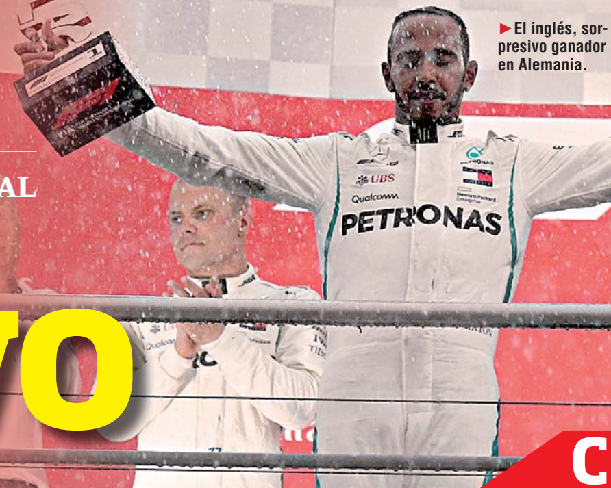
► El inglés, sorpresivo ganador en Alemania.

Kimi Räikkönen fue tercero y sumó su cuarto podio consecutivo, séptimo de la temporada.