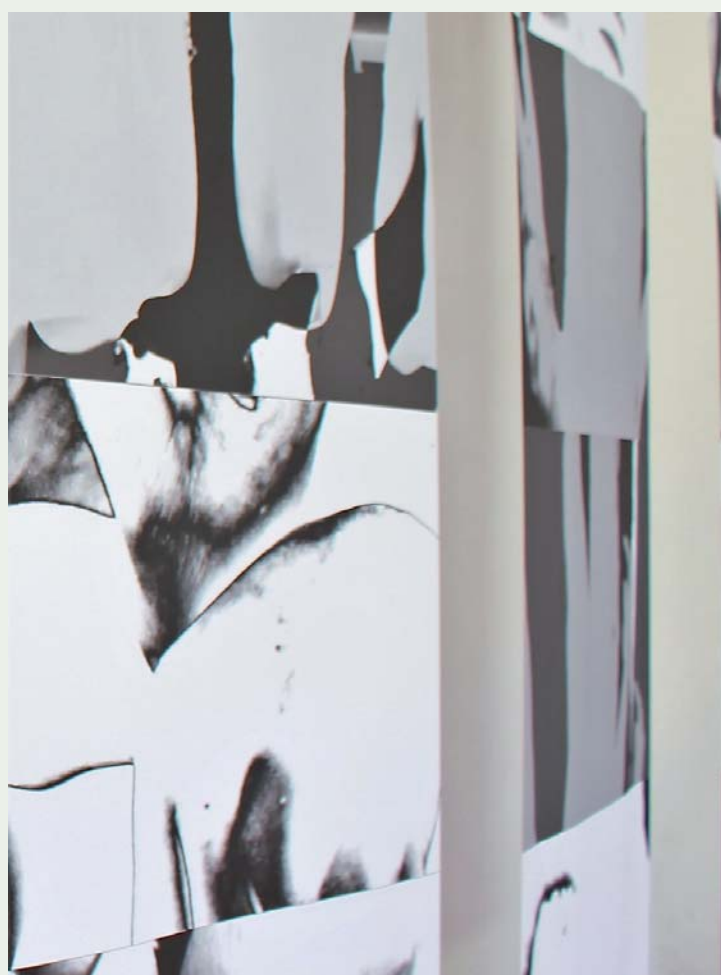
► Replantea la inflación y su reflejo en el poder adquisitivo de las personas.

Auditoría personal , Ausentesy Circulante . En ellas, por ejemplo, mantiene temas abordados en obras previas, como la inflación que describió a través de Universos alternos (2016). Desde su formación como contadora y con recursos del arte, replantea la inflación y su reflejo en el poder adquisitivo de las personas, quienes desconocen exactamente la medición de parte del sistema y sólo la perciben de manera subjetiva.