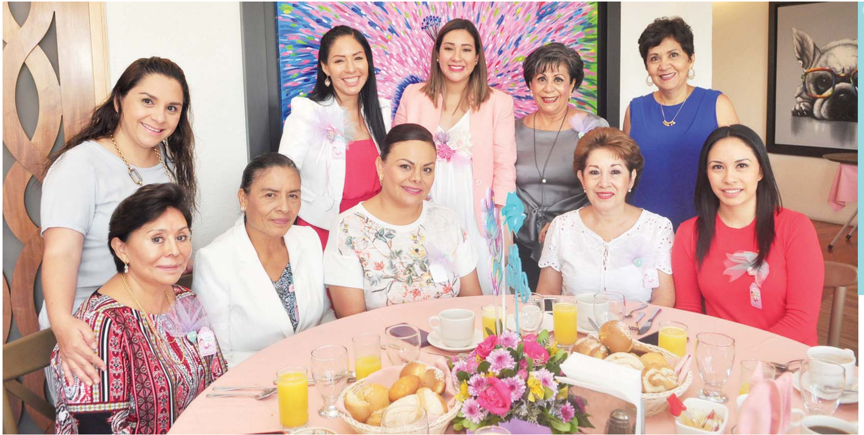
► La futura mamá estuvo acompañada de sus más cercanas, quienes le desearon lo mejor a su bebida.

Para cuidar el kokoro ama, apasionate, crea, perdona, ten buenas relaciones, conéctate con la naturaleza y sé coherente en los distintos aspectos de tu vida.