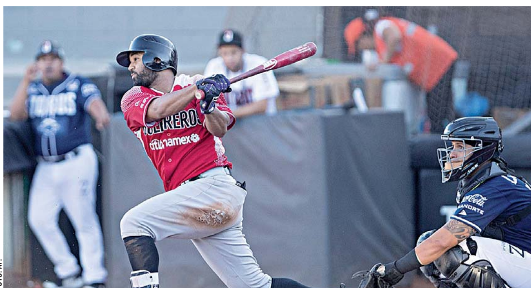
► Los Guerreros vuelven esta semana al Templo Bélico.