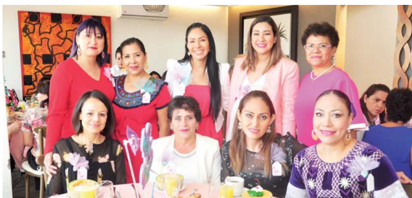
► Sus invitadas le entregaron lindos obsequios, deseándole lo mejor en la etapa como mamá que está por iniciar.