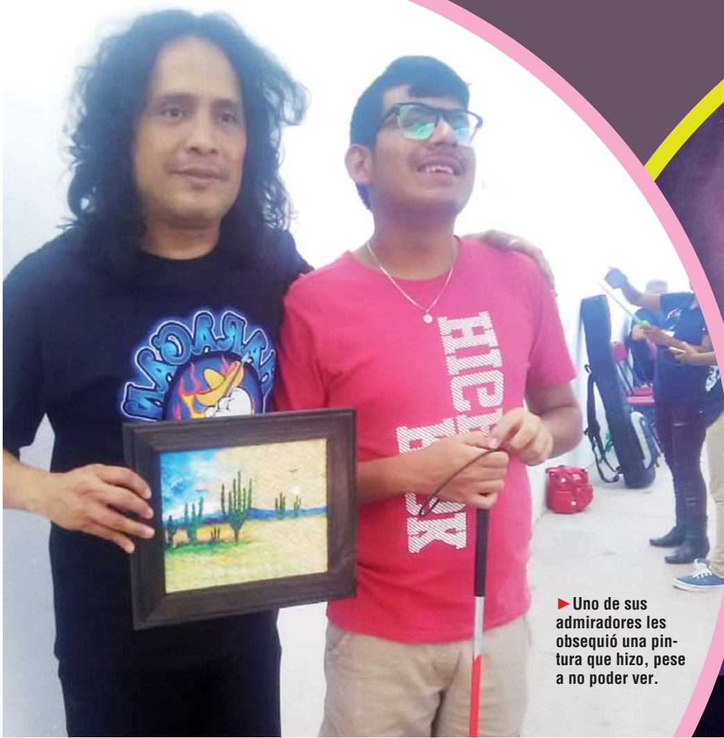
Uno de sus admiradores les obsequió una pintura que hizo, pese a no poder ver.