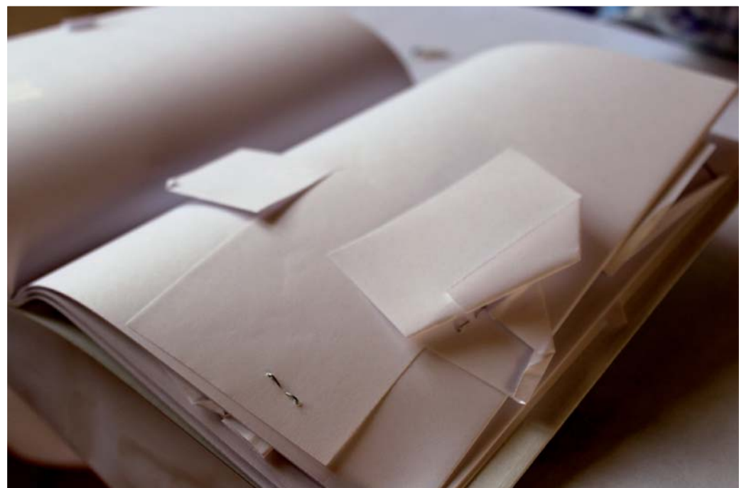
► La muestra está abierta al público desde el 20 de julio.