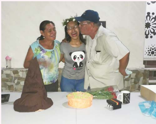
► Festejó con sus seres queridos.