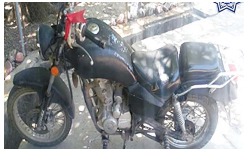
► La motocicleta arrojó reporte de robo vigente.