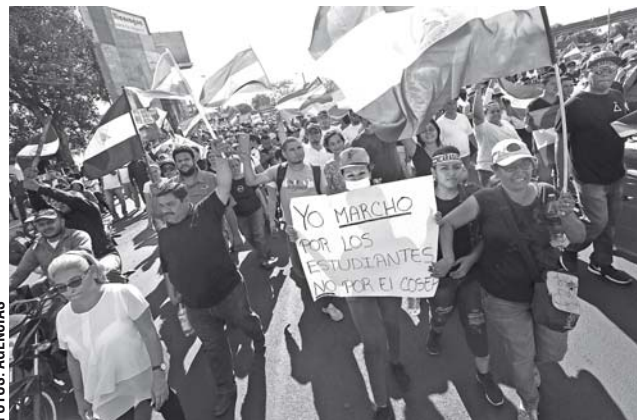
► Los opositores exigen la renuncia de Ortega.

una reforma al sistema de seguridad social, pero se ampliaron tras la violenta represión.