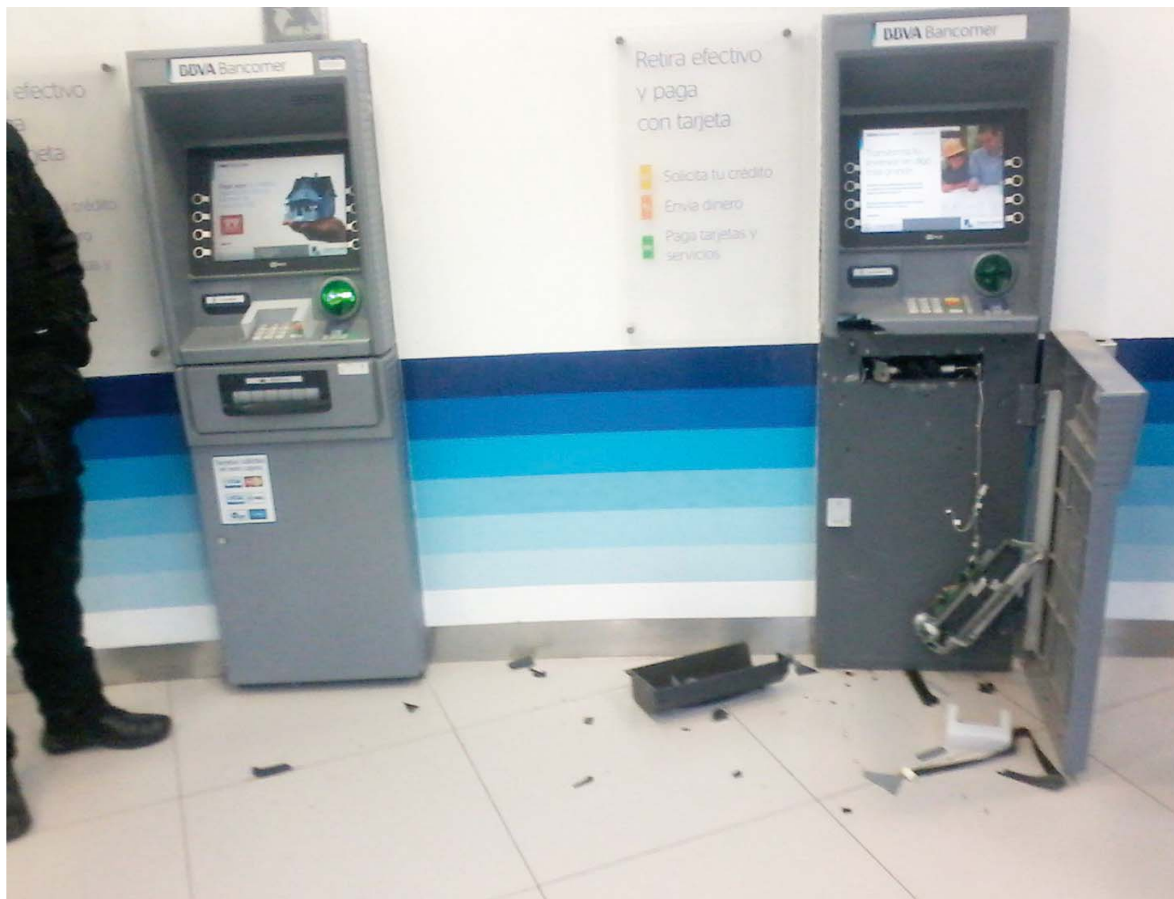
► Los robos no paran.

Al entrevistarse los agentes con los policías les indicaron que en una camioneta Ford Lobo subieron uno de los cajeros