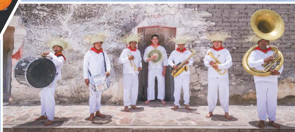
► La orquesta Alma Chocholteca, es creada por gente originaria de Tamazulapán del Progreso.

Es un apasionado de la música, el teatro y la danza, ha compuesto música inspirada principalmente en los pueblos de la Mixteca, en especial de Tamazulapán del Progreso, su comu-