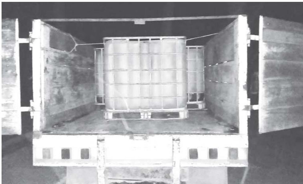
► Unidades y combustible fueron entregados a la autoridad correspondiente.