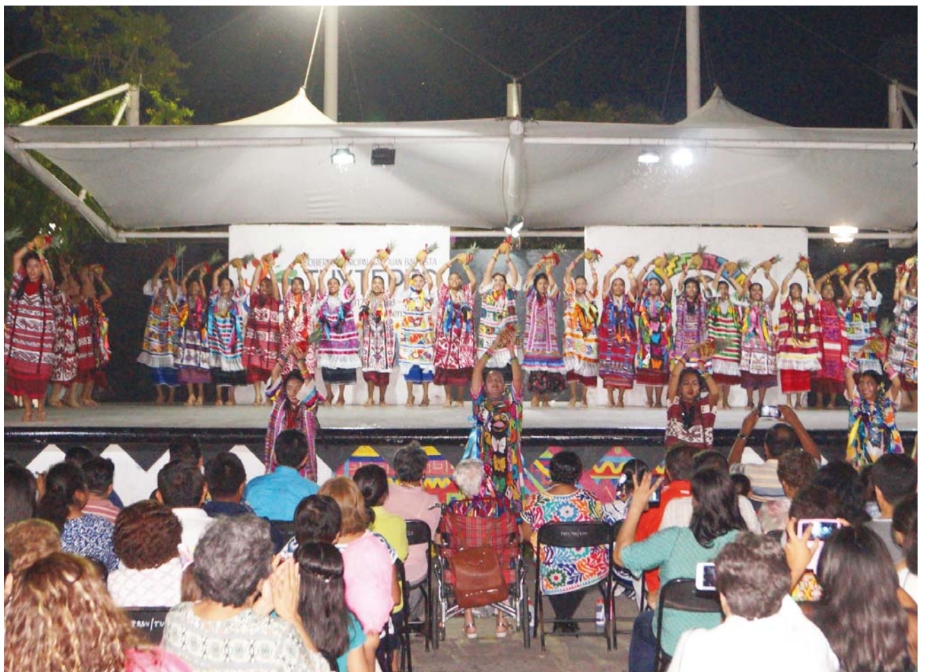
► La Guelaguetza se celebrará en el parque Benito Juárez.