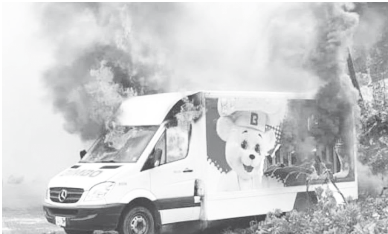
► La compañía mexicana interpuso denuncias correspondientes ante las autoridades locales.