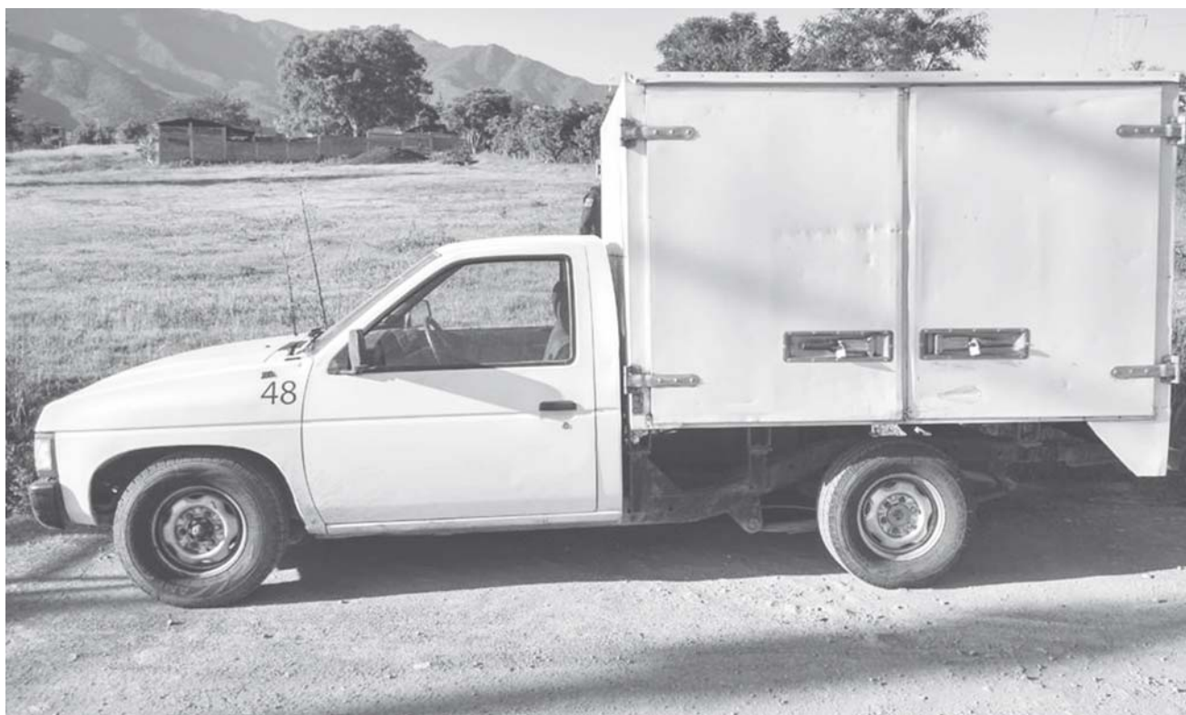
► Uno de los vehículos cargados con gasolina de procedencia ilegal fue encontrado en la Carretera Federal, tramo Salina Cruz-Tehuantepec.

Como producto de patrullajes disuasivos, una camioneta con reporte de robo fue recuperada y al menos 3 mil litros de hidrocarburo