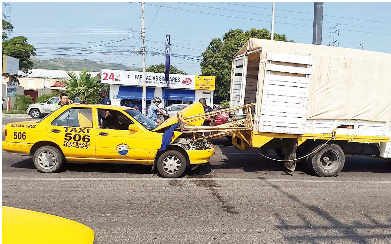
► La avenida de los cuatro carriles ha sido una de las arterias donde se registra el mayor número de accidentes.

Falta de capacitación, precaución y regularización han sido algunos factores por los cuales los taxistas han provocado más de 400 accidentes