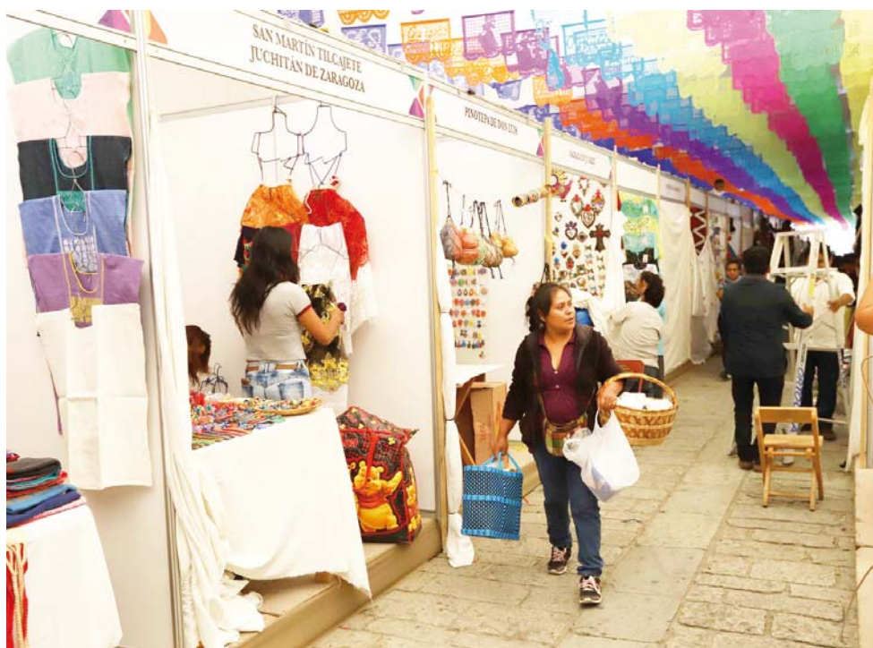
► La Expo concluirá el 30 de julio en "El Llano" y el 5 de agosto en el andador.