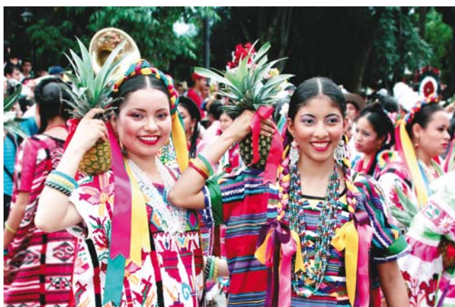
► Se presentarán los lunes 23 y 30 de julio.

está Guelaguetza 2018, está programada para presentarse los lunes 23 y 30 de julio, con el apoyo invaluable del maestro Jorge Moreno y su grupo folklórico.