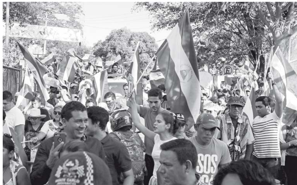
► Las manifestaciones contra el Gobierno de Ortega comenzaron a mediados de abril.