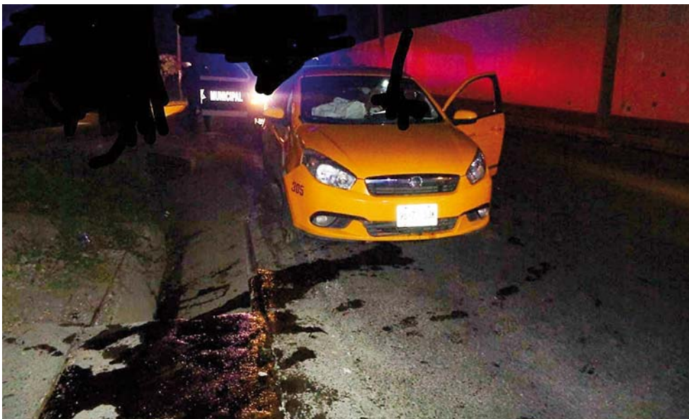
► Los taxistas han venido cometiendo una serie de accidentes.