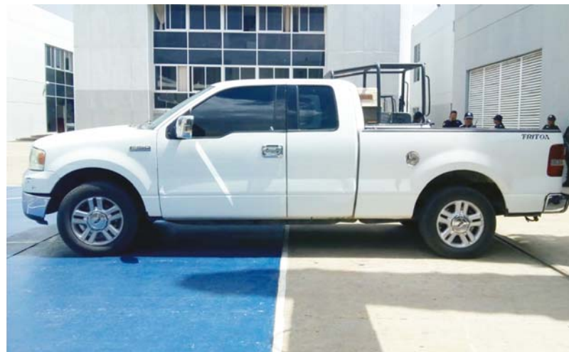
► El vehículo fue puesto a disposición de la autoridad competente.

Tras la actitud sospechosa y evasiva del conductor, los elementos de la Policía Estatal procedieron a darle alcance para efectuar la revisión de seguridad correspondiente tanto al chofer como al vehículo, constatando que la unidad en la que se trasladaba contaba con reporte de robo vigente.