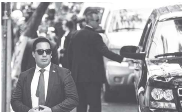
► Este sería el segundo encuentro internacional en la casa de transición.