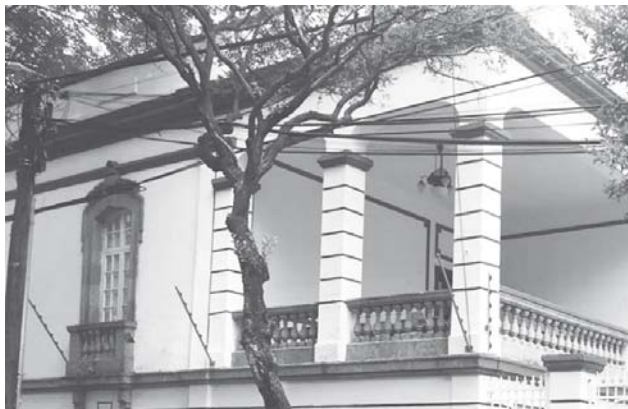
► El pasado 13 de julio Obrador recibió a Michael Pompeo.

sor de Asuntos Internacionales y Defensa. ESTE SERÍA el segundo encuentro con una comitiva internacional a realizarse en la casa de transición del candidato ganador, luego que el pasado 13 de julio López Obrador y Marcelo Ebrard, entre otros integrantes de su gabinete, recibieron una delegación del gobierno estadounidense encabezada por el secretario de Estado, Michael Pompeo.