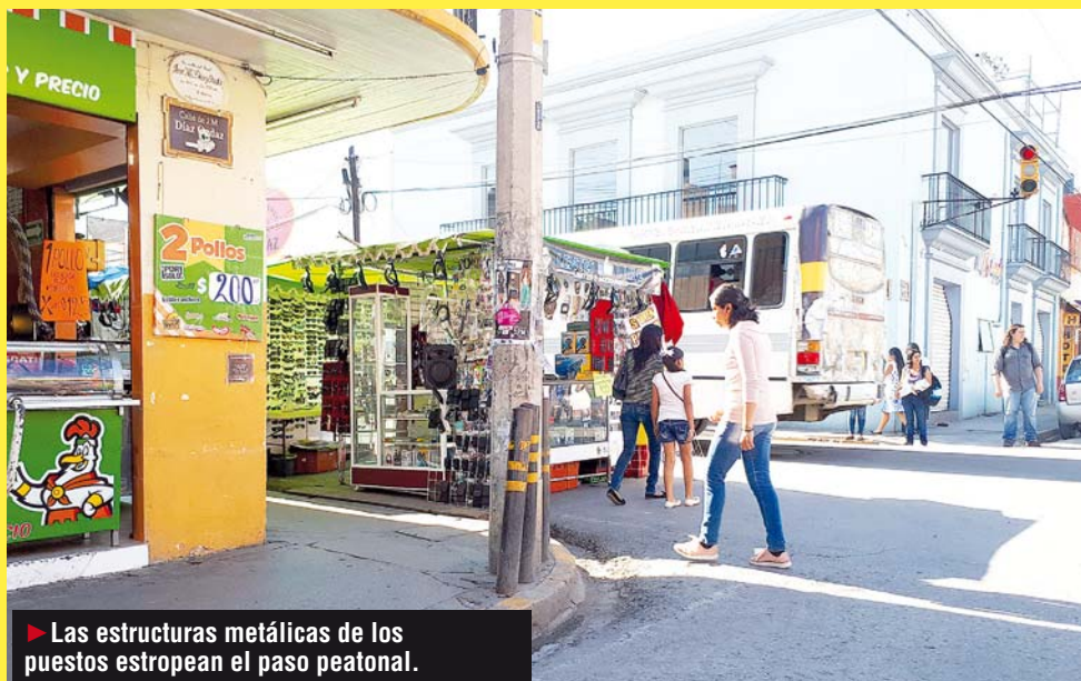
► Las estructuras metálicas de los puestos estropean el paso peatonal.

A plena luz del día, sin mostrar preocupación alguna los dirigentes del comercio informal efectivamente instalaron sus oficinas en unas mesas de los portales, desde donde ope-