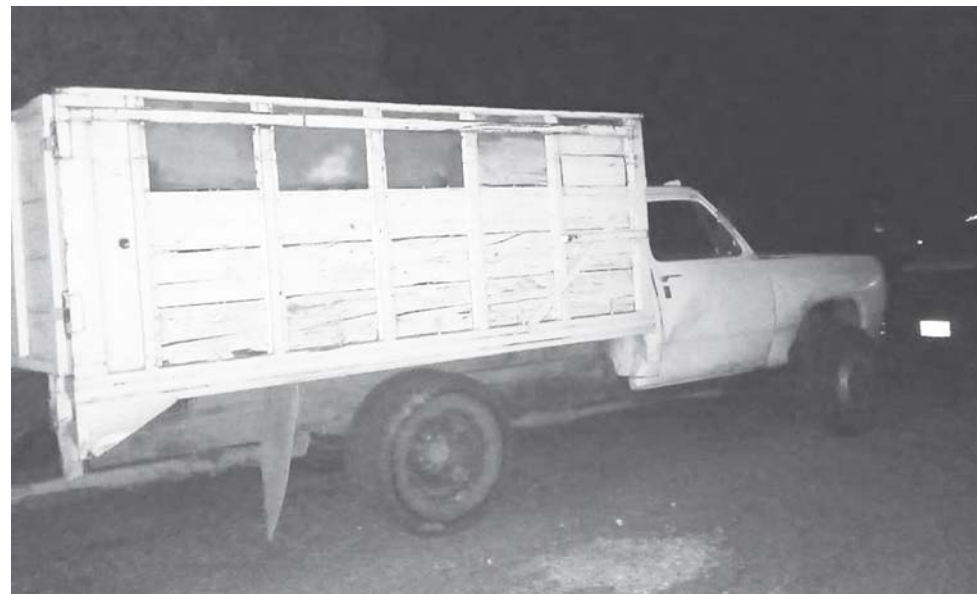
► Una de las unidades fue hallada en el paraje La Cueva de San Agustín Yatareni.