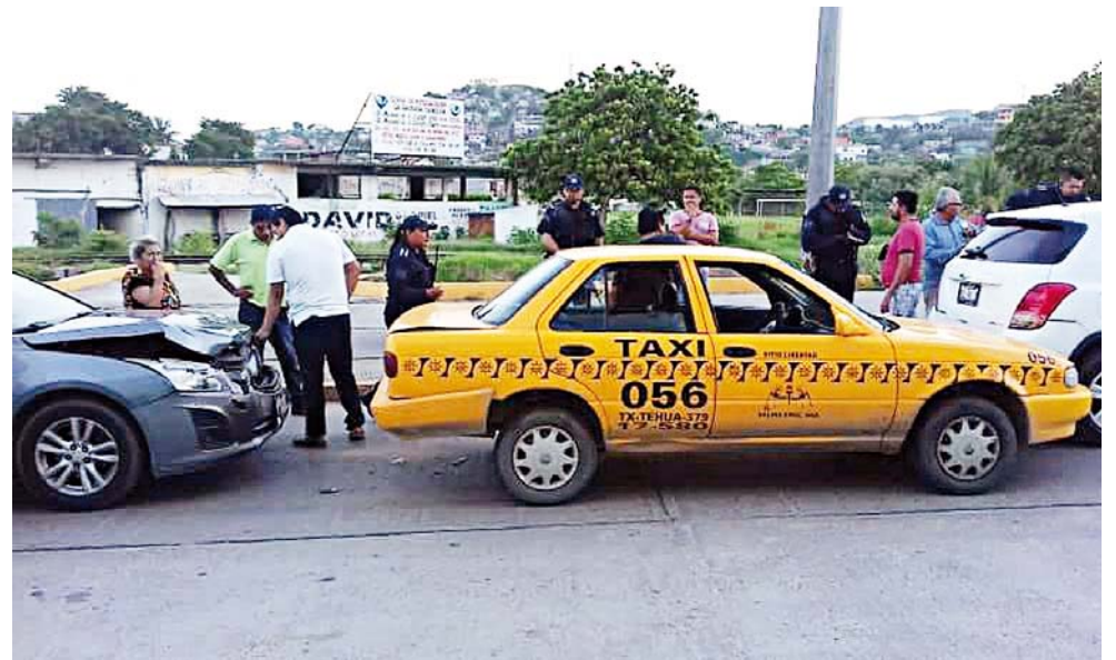
► El parque de transporte público creció desproporcionalmente.