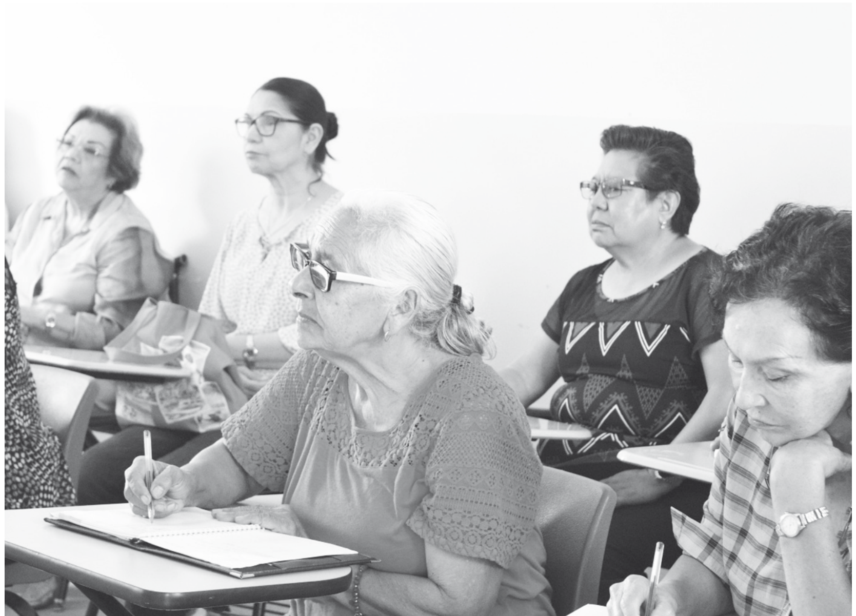
► Buscan combatir el analfabetismo.

Por tal motivo, tan solo en esta Jornada, de las más de 16 mil personas que serán acreditadas en todo el país, se busca que en la entidad oaxaqueña sean beneficiadas entre