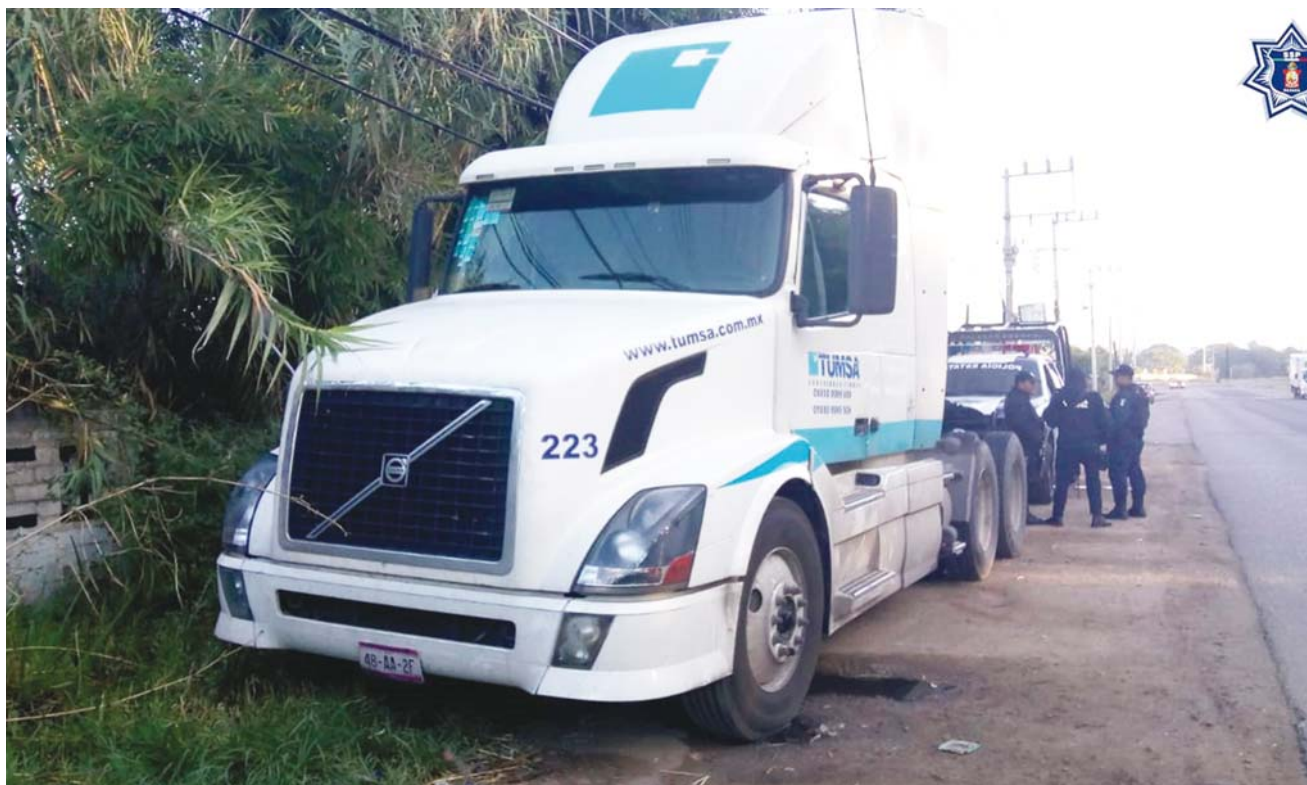
► Fue asegurado un tracto camión marca Volvo.

La SSPO informó que fueron detenidas dos personas y recuperadas cuatro unidades de motor con reporte de robo