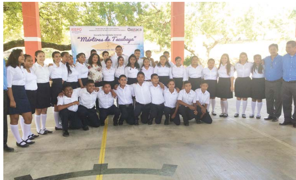
► La generación egresada fue bautizada como "La Esperanza del Futuro".