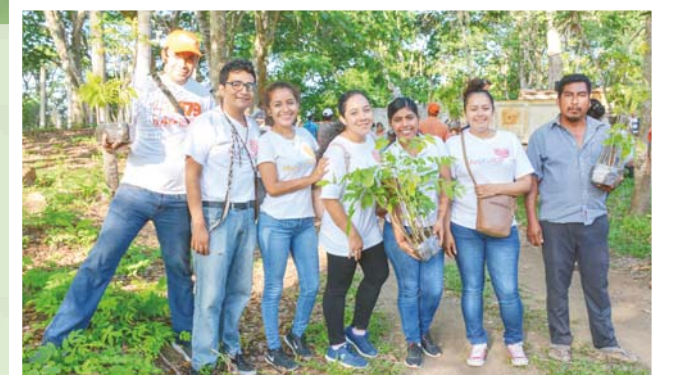
Sembraron árboles en Huatulco, Chacalmata y otras comunidades.

comunitario, Control biológico de plagas, Preparación y germinación de almácigos, Generación de composta y lombricomposta, Separación de Residuos Sólidos Urbanos, Reciclación, Taller de Biofertilizantes, y Huertos familiares.