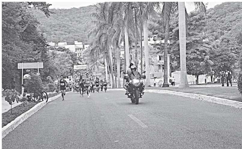
► Concluyó con éxito el Medio Maratón Huatulco-Oaxaca 2018.

La carrera pedestre contó con el aval de la Federación Mexicana de Asociaciones de Atletismo (FMAA), y la distancia está certificada, por lo que es puntuable en el ranking nacional, tal es el caso del seleccionado nacional, Darío Castro Pérez, quien con un tiempo de una hora, ocho minutos y cuarenta y cuatro segundos, concluyó el medio maratón en preparación para su participación en los Juegos Centroamericanos y del Caribe 2018 a celebrarse en Barranquilla, Colombia, desde el