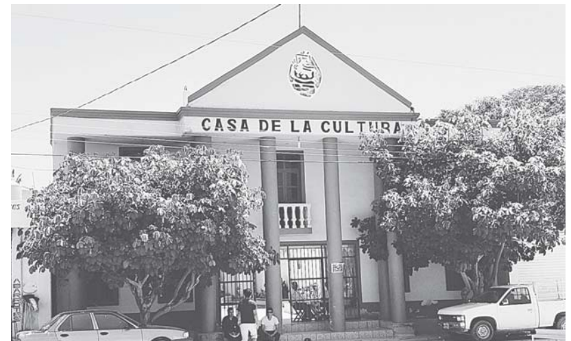
► Entre los despedidos figuran un comandante de policía y empleados de la Casa de la Cultura.