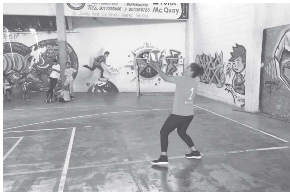
► Los saques precisos.