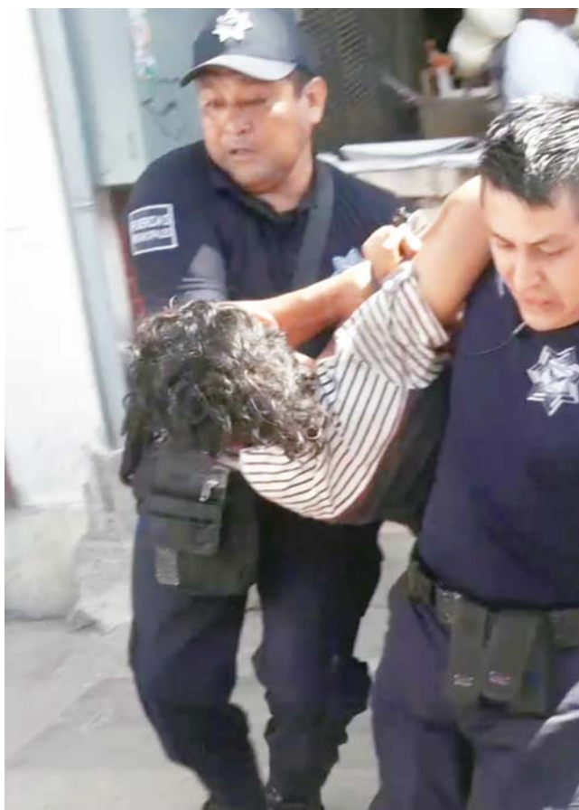
► El señalado fue detenido por la Policía Municipal.