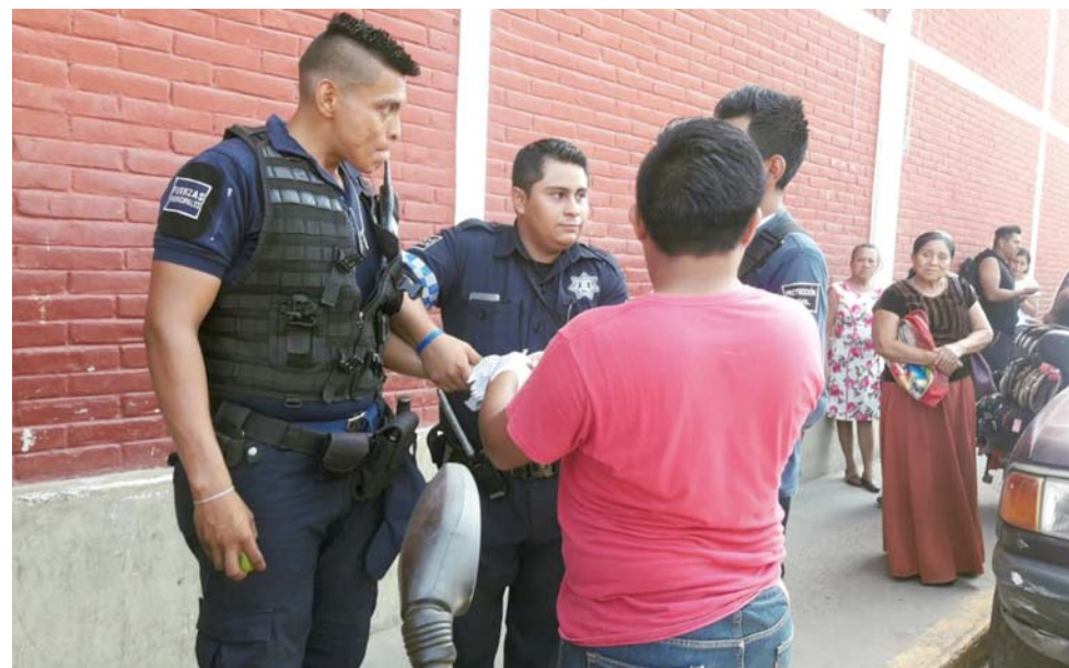
► El hombre atacó al oficial con un cuchillo que cargaba en la cintura.