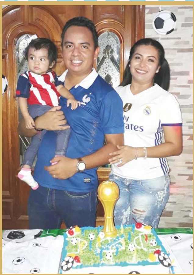
► Apagando las velitas del pastel.