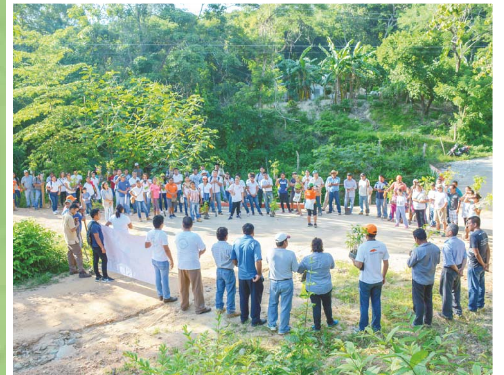
En este 2018, se inició con la parte alta de la cuenca en San Miguel Suchixtepec.