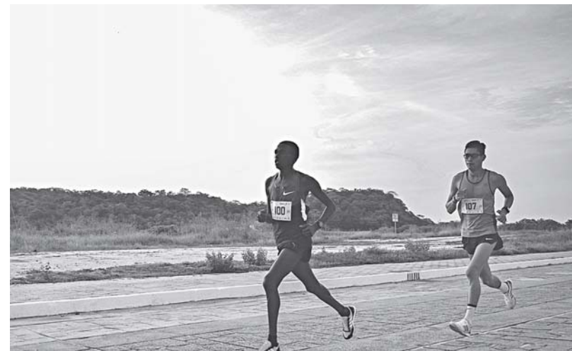
► La carrera pedestre contó con el aval de la FMAA.