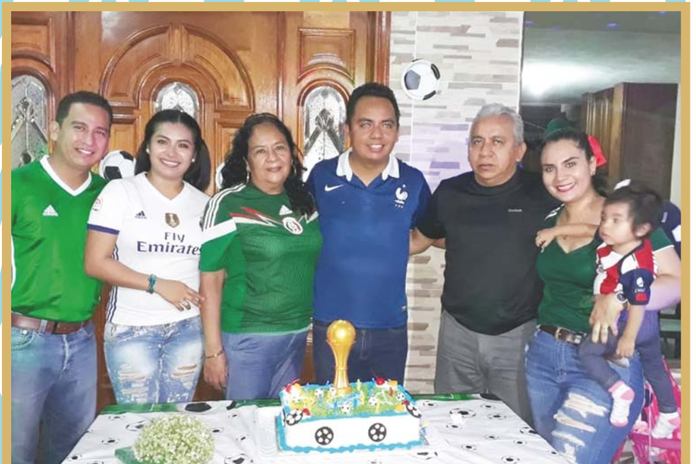
► El cumpleaños acompañado de sus padres, su esposa, su hermano y su cuñada.