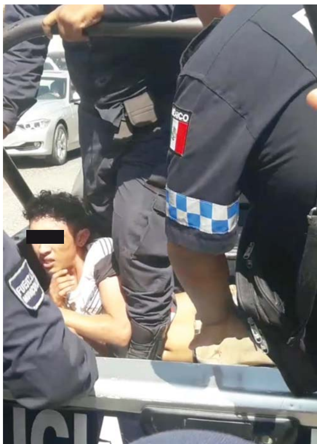
► Lo agarraron fumando marihuana en el mercado Jesús Carranza.