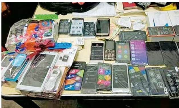
► El ladrón intentó huir en un taxi.