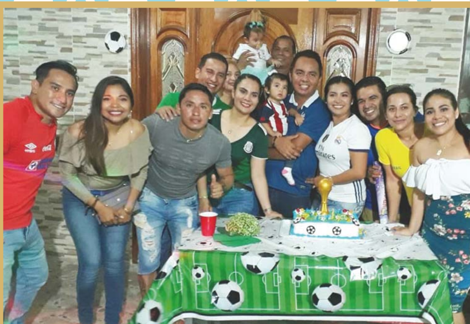
► Los invitados se tomaron la foto del recuerdo.