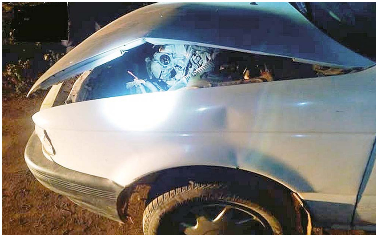
► El robo de automóviles va en aumento en el municipio de Tehuantepec.