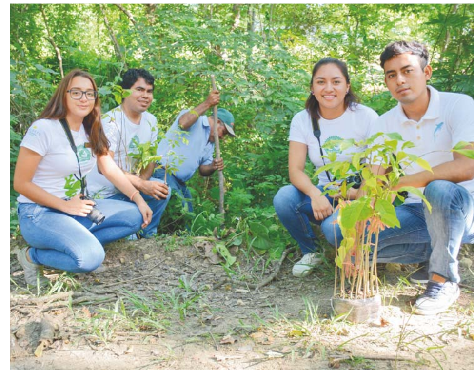
Los árboles fueron donados por la Fundación Caudalie y el Fondo Mundial para la Naturaleza.

En septiembre de 2017, la reforestación se desplegó en San José Cuajinicuil, Puente Coyula, Cuapinolito, Cuajinicuil Alto, Colonia La Gradera, La Erradura, Barrio El Tamarindo, Paso Ancho, La Soledad, La Poza, La Mina, Hondura de Toro y Río Laje.