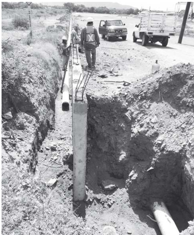
► Realizan trabajos de reubicación de tuberías.