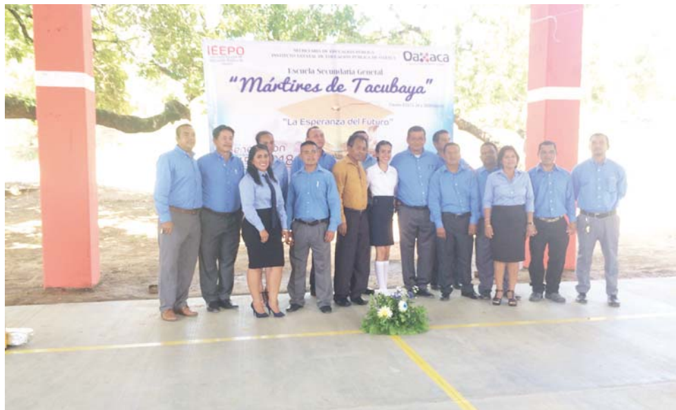
► Asistieron a la ceremonia varios invitados especiales.