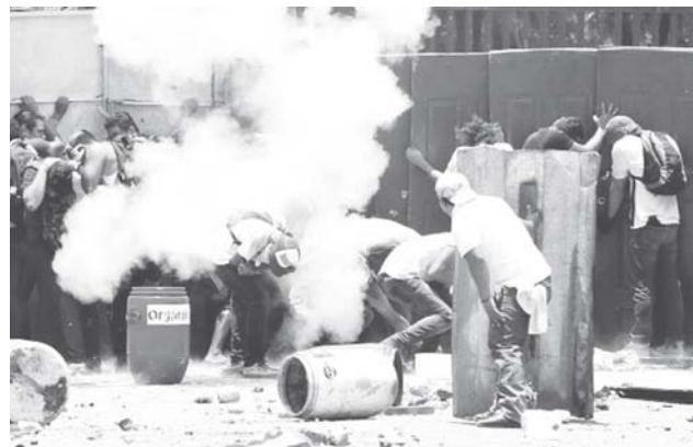
► Los intentos de diálogo hasta ahora no han dado resultados.