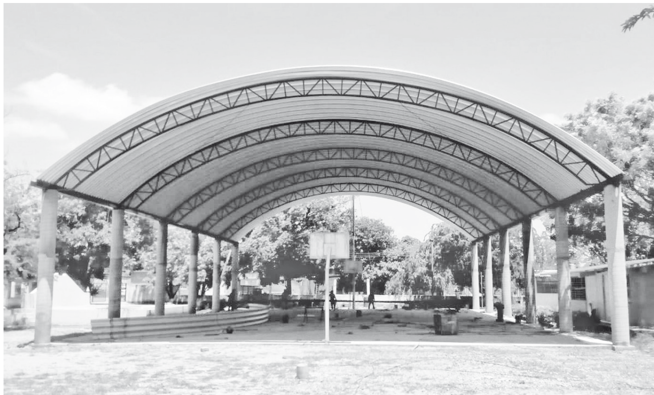
► Docentes y padres de familia reconocieron el compromiso de la administración con la educación.

Y es que en estos dos últimos años, el gobierno le ha estado invirtiendo en materia de agua potable en Salina Cruz debido a que ha habido problemas para poder proveerlos a los habitantes por falta de infraestructura y otros servicios.