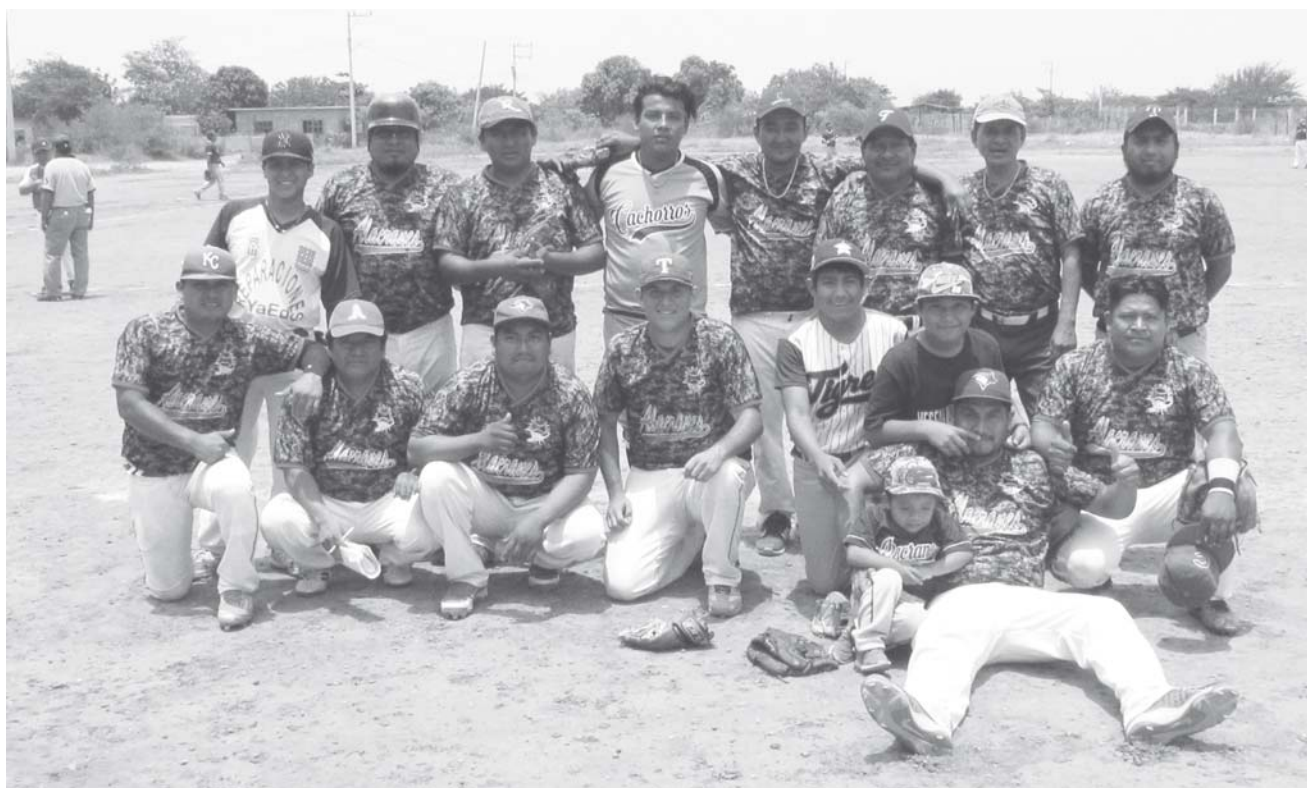
► Alacranes se despide con triunfo.

Alacranes recibió a Piratas de PatMar en el campo Alacranes del Barrio La Soledad en la Liga de Beisbol Municipal de San Blas Atempa