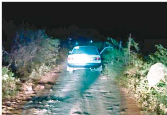
► La unidad ya había sido desvalijada.

El vehículo fue hallado gracias a la intervención de la policía propiciada por una llamada telefónica a emergencias denunciando el robo