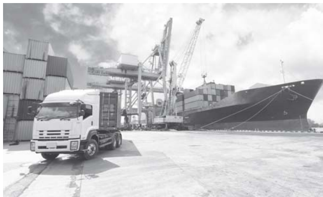
► La batalla comercial entre EU y China continúa.