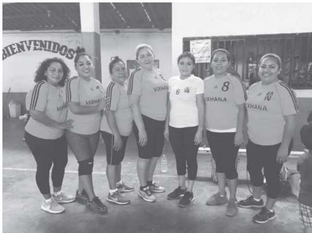
► Vixhana se llevó tremendo duelo.