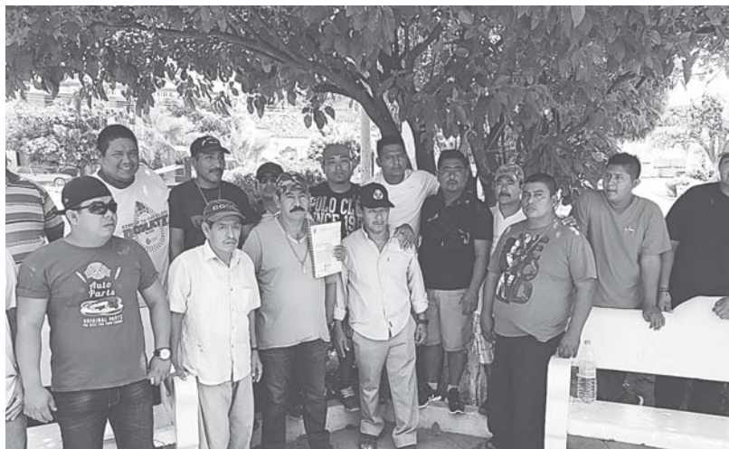
► Suman alrededor de un centenar de empleados despedidos.

Acompañado de algunos elementos de la policía y de personal de otras áreas despedidos, dijo que estuvieron de servicio has-