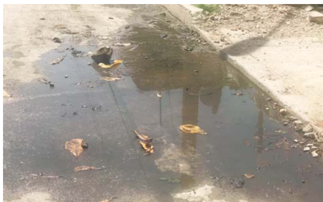
► Se niegan a que el Ayuntamiento se limite a limpiar.