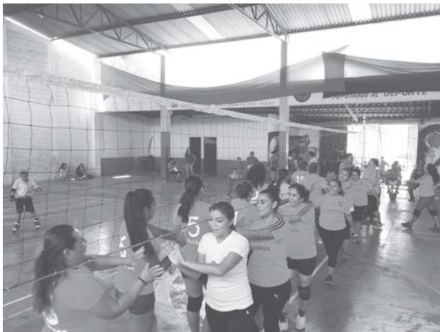
► La despedida cordial.