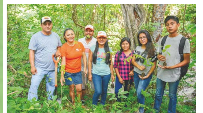
Este programa también se llevó a cabo en 2017.

A cada alumno participante recibió un certificado de adopción del árbol que ayudó a plantar, con el fin de crear una cultura de conciencia sobre el cuidado del mismo.