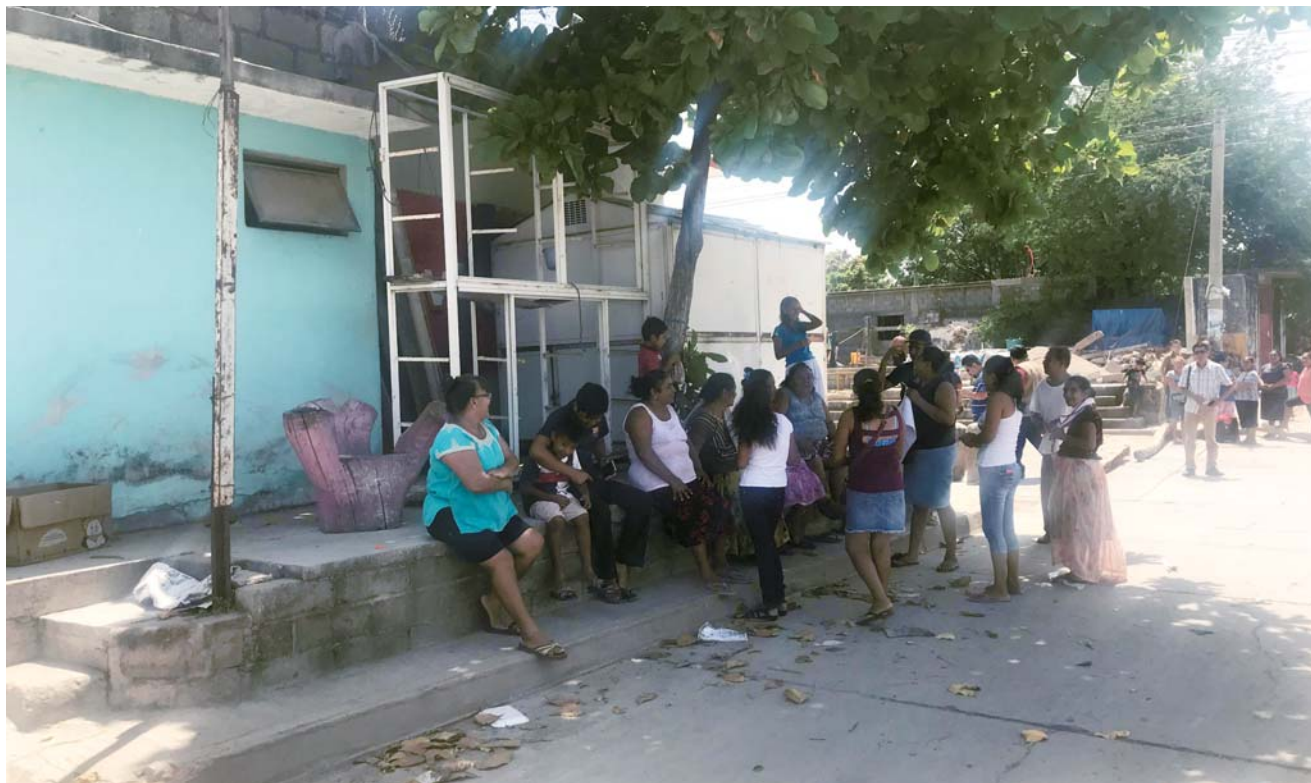
► Señalaron que hay muchos lugares que presentan este problema.

Explicaron que esta situación lleva varios meses por lo que decidieron protestar, pues las aguas negras corren por las calles