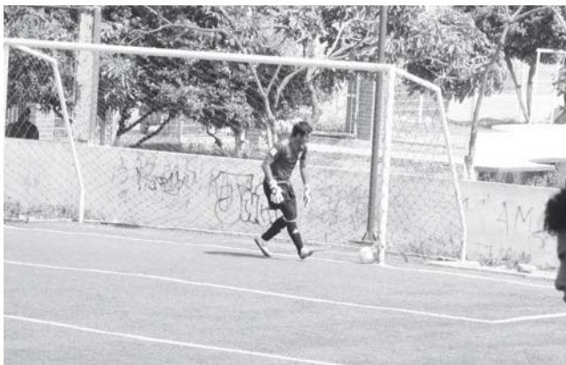
► Craso error del cancerbero costó el empate.