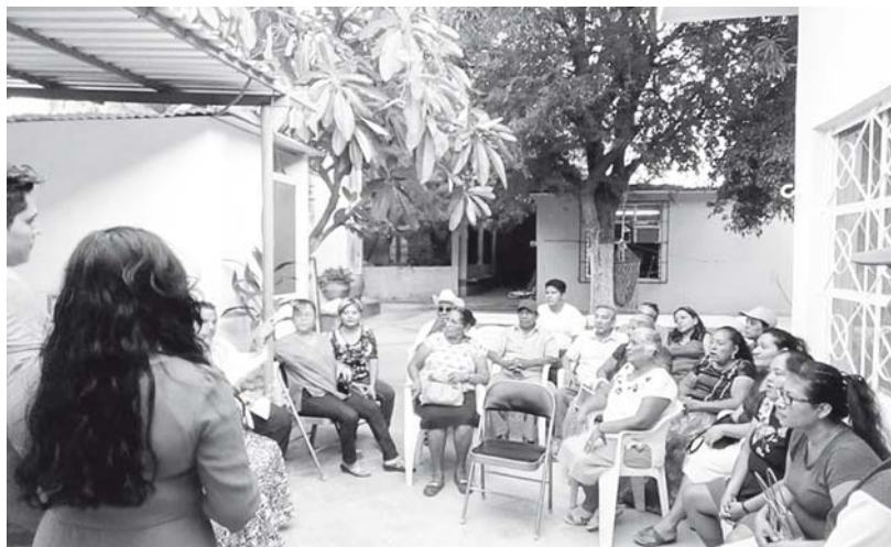
► En el caso del segundo censo, aún no hay fecha para los apoyos.

"En el caso de la entrega de nuevas tarjetas solamente tendrán un lapso de 7 días para pasar al banco a recogerlos, que sería del 23 al 30 de este mes y para el tema de duplicidad u homonimias por el cual no han sido depositados los recursos, cada persona tendrá que realizar un oficio en donde se plantee la