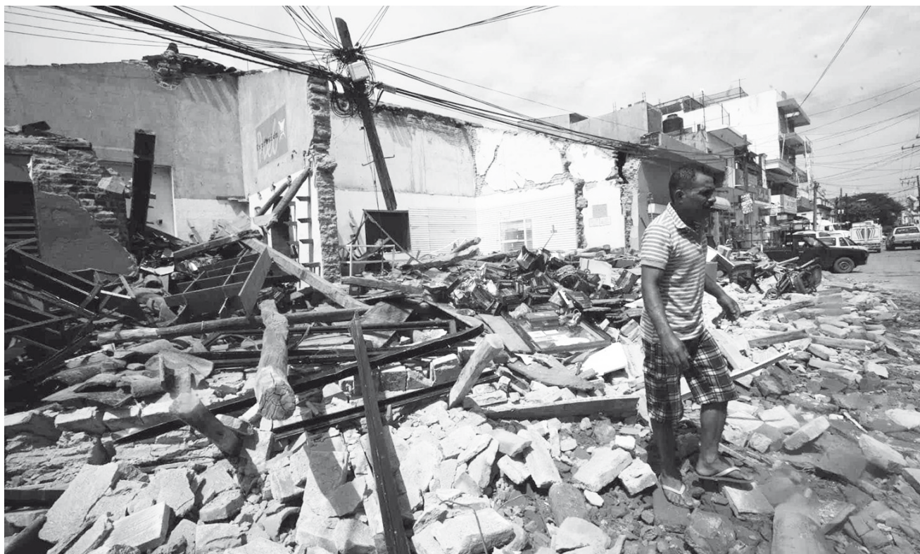
► De una lista general de 150 personas con incidencias entregadas por la RED, se lograron resolver más de 100 casos.

La Red de Vecinos Afectados logró el compromiso de la SEDATU y BANSEFI de atender los problemas de los beneficiarios del FONDEN