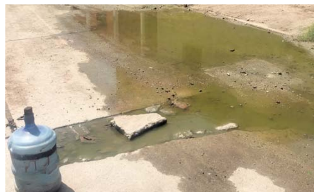
► Los ciudadanos afectados piden el arreglo de la red de drenaje.

tome en cuenta la salud de Juchitán, pues la salud de los vecinos es lo primero, no el dinero", dijo Ángel Esteva