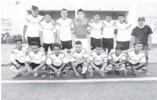
► Estudiantes dio el extra.