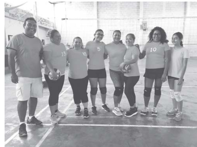
► Rebeldes estuvieron a la altura.