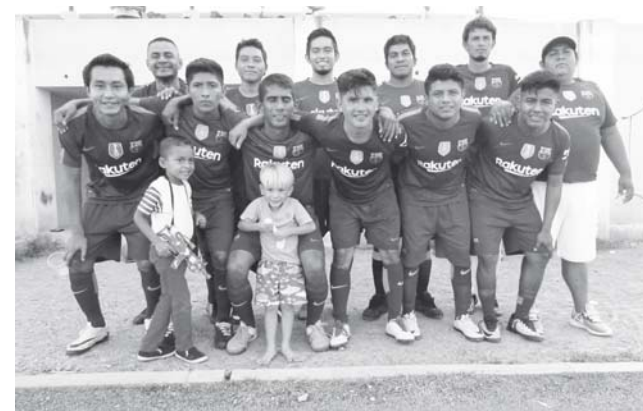
► Azteca cayó con la frente en alto.