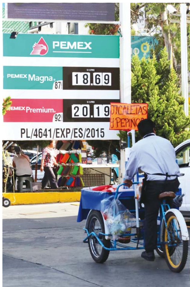
► El costo del combustible no ha dejado de incrementarse en el último año.

Presidente Enrique Peña Nieto, el precio del litro de la gasolina Magna estaba en 10.92 pesos por litro, la Premium en 11.48 pesos y el diésel en 11.28 pesos.