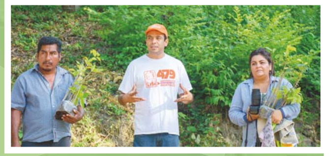
En Huatulco existen varias acciones encaminadas a la sustentabilidad.