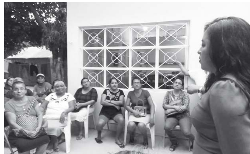
► Es importante que la ciudadanía esté pendiente de sus problemas de tarjetas.