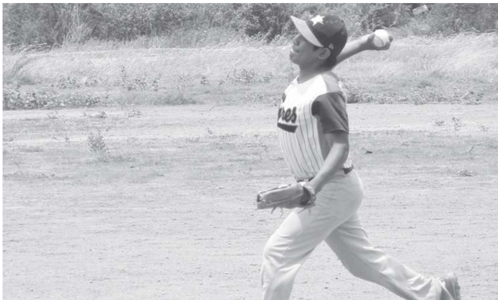
► Chemita hizo buen relevo.