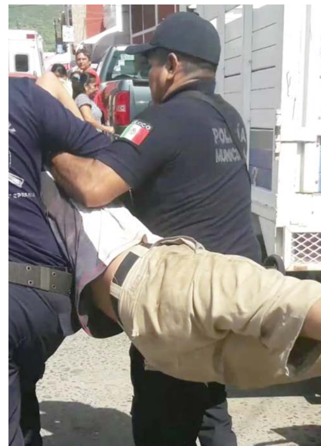
► El ciudadano tuvo que ser detenido por varios elementos.