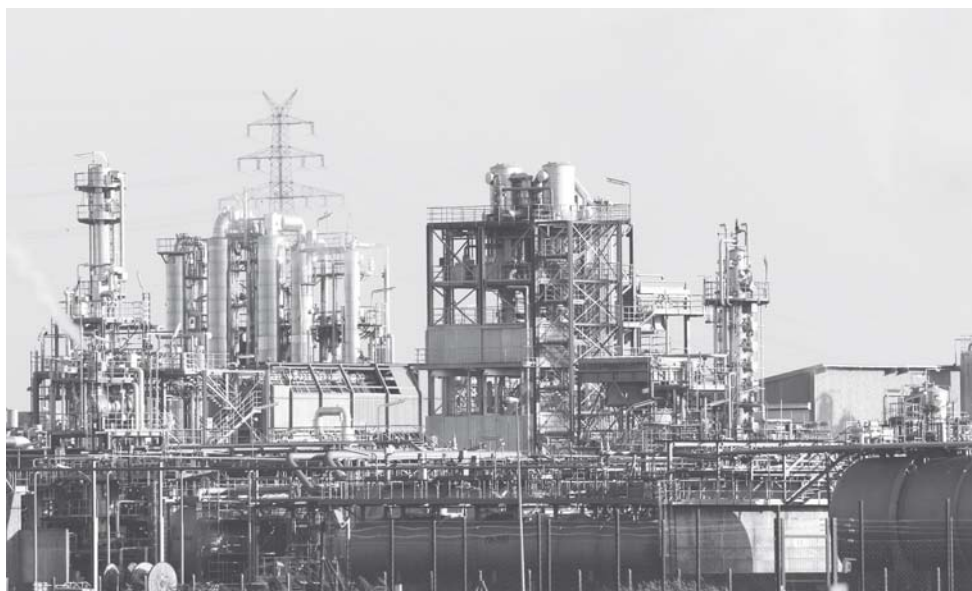
► China trata de abandonar su imagen proteccionista aprobando grandes inversiones, como un proyecto petroquímico de 10 mdd.

Li Keqiang, primer ministro chino subraya la necesidad de defender el libre comercio, en un momento en que EU y China profundizan su disputa comercial