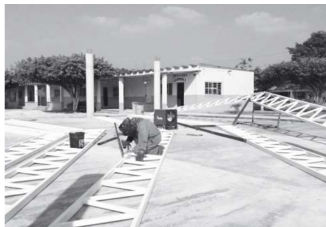
► El gobierno municipal escuchó las necesidades de la escuela.

La construcción del domo de la Primaria María Isabel Villalpando beneficiaría a 100 alumnos y contempla 710.40 metros cuadrados de techado