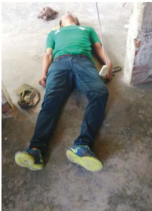
► El occiso fue encontrado por su madre.