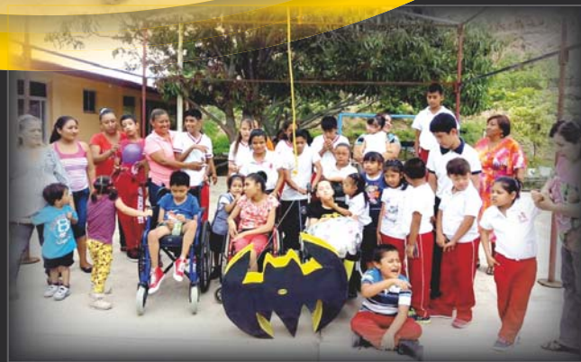
► La cumpleañera posó con sus amiguitos.