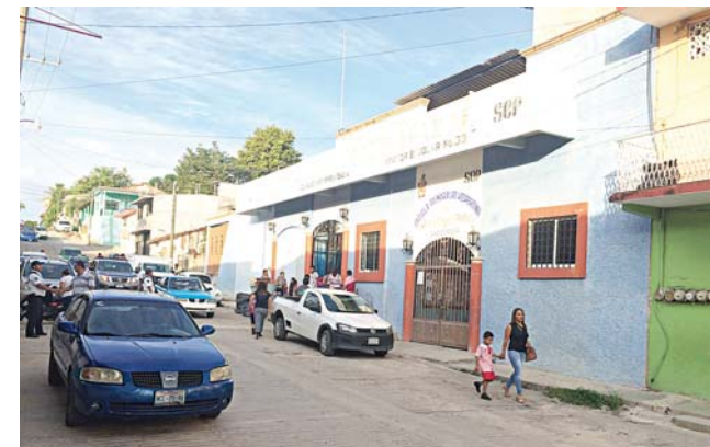
► Los profesores demandan la reconstrucción de escuelas.