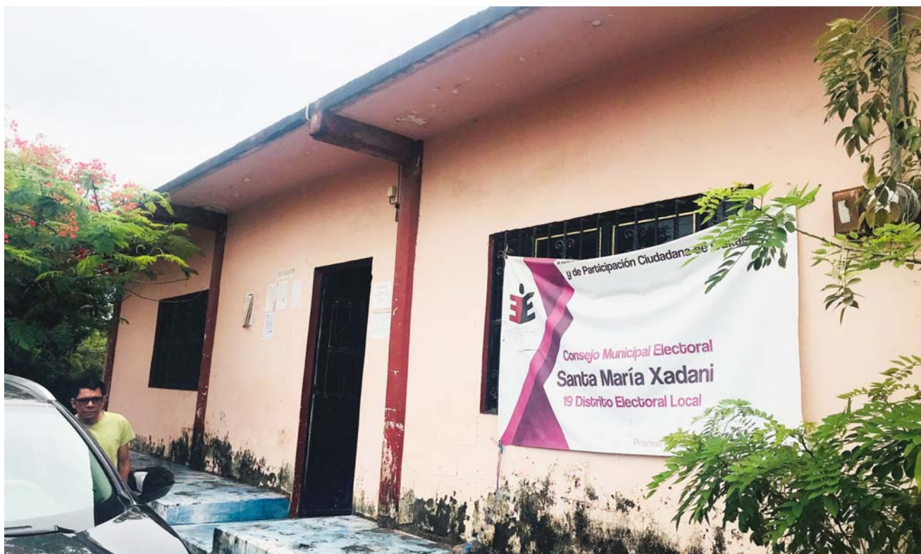
► En Santa María Xadani se tiene un padrón electoral de 6 mil 679 votantes.

El Consejo Municipal Electoral detectó un faltante de boletas para la jornada electoral del 1 de julio y esperan que sean repuestas