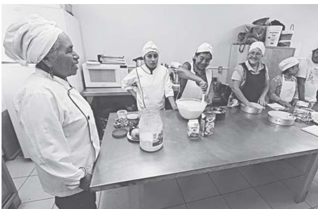
► El objetivo es que las ciudadanas se autoempleen.

Como parte del trabajo que se está haciendo en Tuxtepec, el DIF municipal tiene como objetivo primordial el seguir brindando este tipo de actividades que saben son necesarias para las mujeres que se dedican a sus casas y se preocupan por el bienestar de sus familias pues hoy en día muchas de ellas son el sustento del hogar.