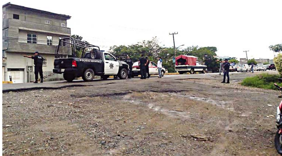
► Ambas unidades de motor quedaron varadas en medio de la cinta asfáltica.

Uno de los implicados informó que no pudo evitar la colisión a pesar de haber activado el freno, en la colisión afortunadamente no hubo lesionados