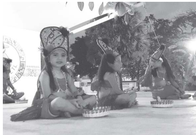
► Las niñas de danza polinesia presentaron su trabajo.

clóricos, danza, ballet y cantantes locales; todo esto en el marco de San Juan Bautista, por lo que también, la grey católica efectúa las tradicionales peregrinaciones que salen del parque "Hidalgo" de la colonia La Piragua y concluyen en la Catedral.