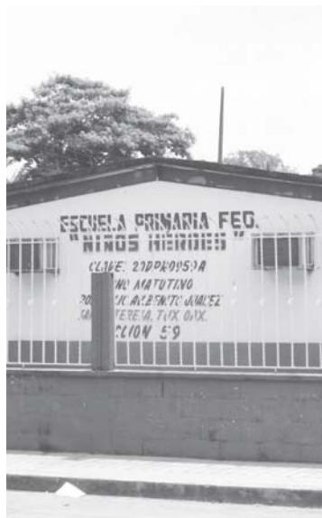
► Respetaron el calendario escolar.