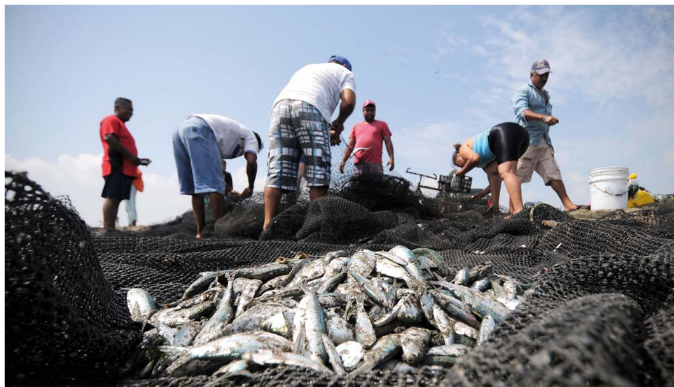
► La capacitación busca garantizar la mejora de las prácticas de sanidad de captura, manejo y procesamiento de alimentos marinos.

Personal de gobierno capacitó a pescadores sobre manejo de alimentos e hizo estudios para prevenir la presencia de marea roja