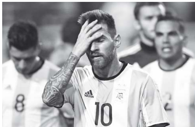
► Argentina está más cerca de Buenos Aires que de Moscú.