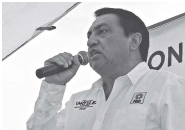
► Los primeros reportes señalan al menos a tres agresores.