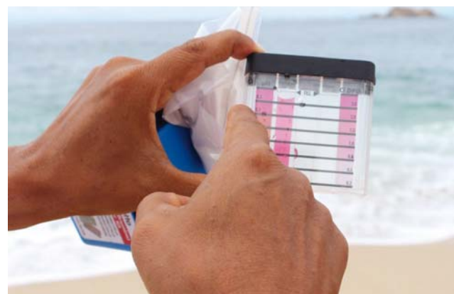
► Las playas investigadas resultaron libres de algas nocivas.

se garantiza la mejora de las prácticas de sanidad de captura, manejo y procesamiento de las especies; así como garantizar productos del mar óptimos y de calidad.