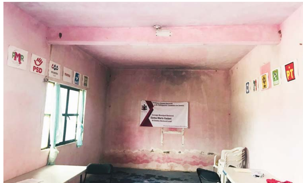
► La elección pasada se tuvo algunos problemas durante el proceso.