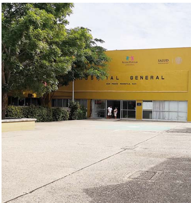
► El Patrimonio de la Beneficencia Pública pide una restitución.

La difusión del documento entre la base sindical causó malestar, los trabajadores hacen énfasis en que debe acabar la corrupción en los Servicios de Salud de Oaxaca "la falta de medicamentos e insumos es demasiado sensible y causa estragos en la economía de la usuarios, y ahora que se sabe esto se debe poner un precedente ejemplar para que no vuelva a pasar, es un grave insulto a la Institución y a la población", concluyeron.