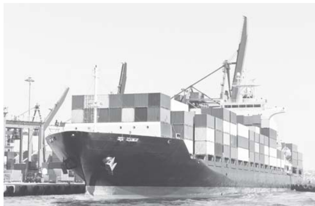
► México está haciendo 100 mil millones de dólares al año a expensas de nosotros: Trump.