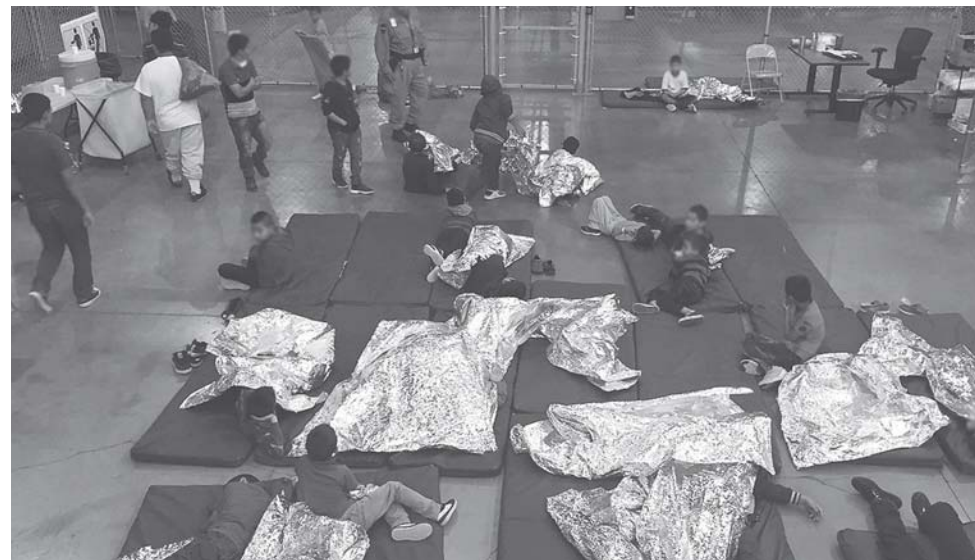
► Trump persiste en su deseo de detener el flujo migratorio.

El presidente estadounidense insiste en que la crisis humanitaria generada por su política de cero tolerancia es culpa de otros factores