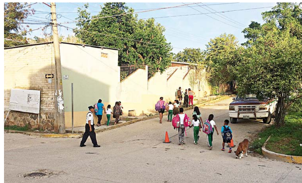
► Miles de niños se habían quedado sin clases desde el 28 de mayo pasado.

En lo que va del ciclo escolar, los profesores del sector 02 han participado de varios paros laborales que han detenido las actividades educativas