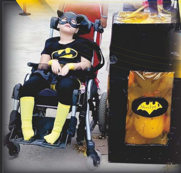
► Sus padres organizaron una fiesta temática.