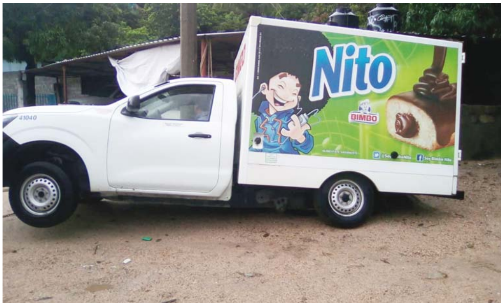
► Entre más aceleraba más se enterraba.