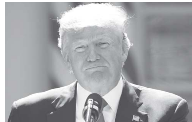
► Insiste en que el TLCAN es un mal acuerdo.