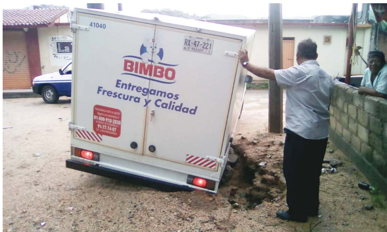
► El socavón midió un aproximado de medio metro de profundidad.

LAS LLUVIAS PROVOCARON QUE EL SUELO SE ABLANDARA, FORMANDO UN SOCAVÓN DE CASI MEDIO METRO, EN EL CUAL CAYÓ UNA CAMIONETA DE BIMBO