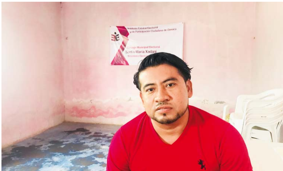
► Explicaron que las boletas tenían folios faltados.