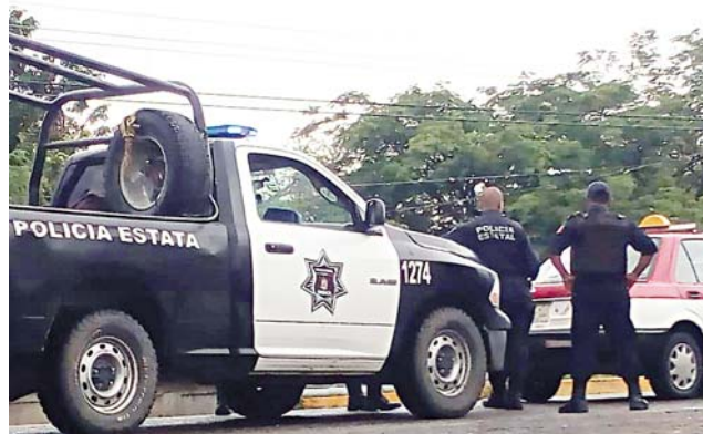
► El hombre se colgó de una viga.

llegada comenzara con el levantamiento del reporte.