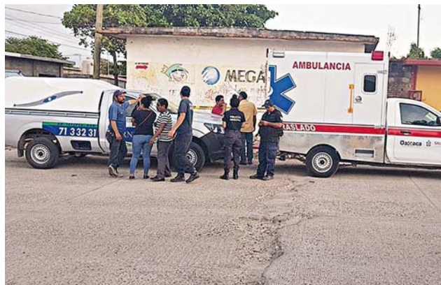
► Aliqui dolumquo maionectus quodis quas nam qui comnis.