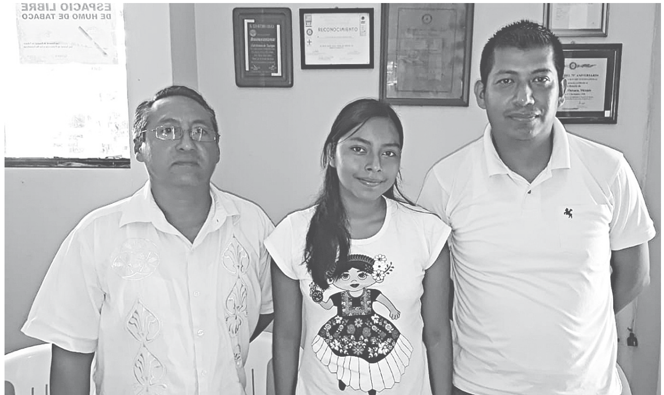
► El evento se llevará a cabo del 24 al 27 de junio en San Miguel de Allende Guanajuato.