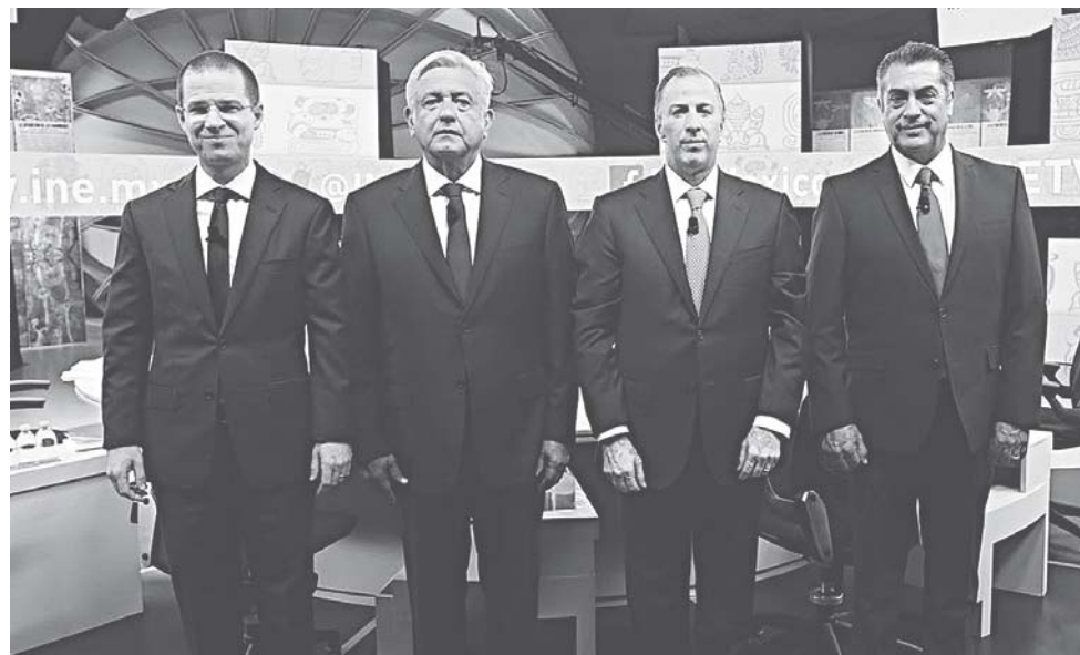
► Se ha otorgado a las campañas un tiempo de 7 mil 883 horas, 30 minutos y 50 segundos.

El candidato con mayor cobertura es Andrés Manuel López Obrador, con 31.6 % del tiempo, seguido de José Antonio Meade, con 28 % del espacio