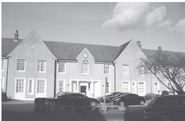
► La investigación fue sostenida por las familias de los afectados.

En 2010, el Consejo General Médico determinó que Barton era "culpable de mala conducta profesional relacionada con la muerte de 12 pacientes", pero no fue juzgada ni se le retiró la licencia médica.