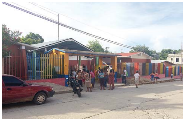
► El magisterio oaxaqueño no detendrá su lucha.