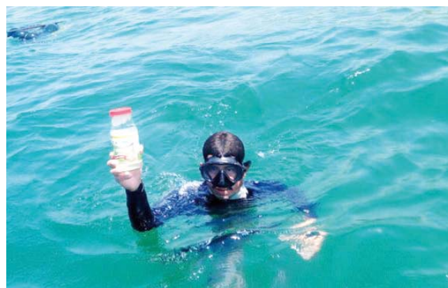
► Tomaron muestras para buscar indicios de marea roja.