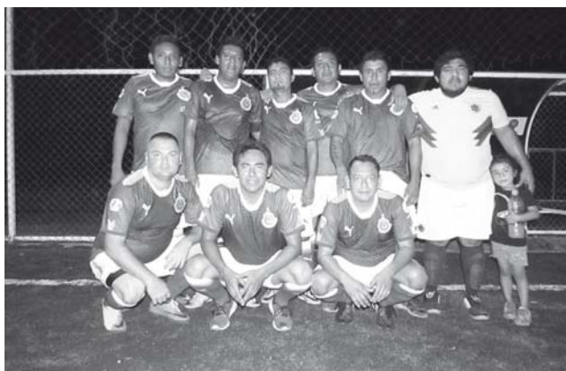
► CTM quiere recuperar el liderato.

Ya no hubo goles y se fueron a serie de penales para definir el punto extra.