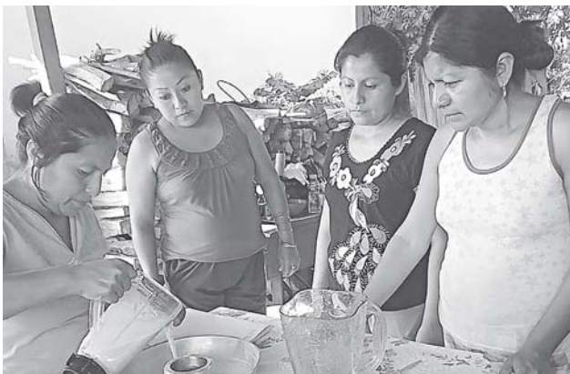
► Más de 20 mujeres acudieron a recibir los cursos de repostería.