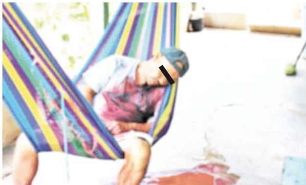
► El homicidio ocurrió por una riña entre hermanos.