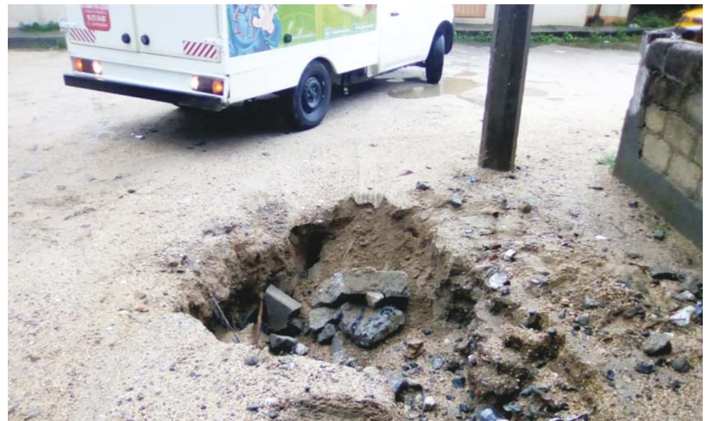
► Terreno flojo por la lluvia.