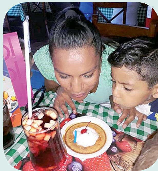
► Apagando las velitas del pastel con su hijo.