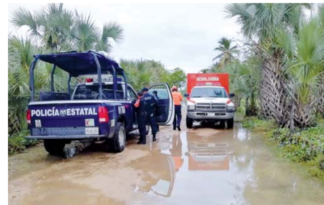
► La lluvia hace peligroso cruzar la Bocabarra.