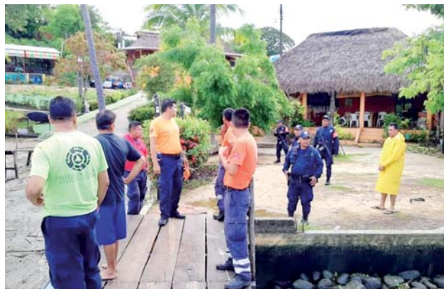
► El desaparecido tiene 29 años de edad.