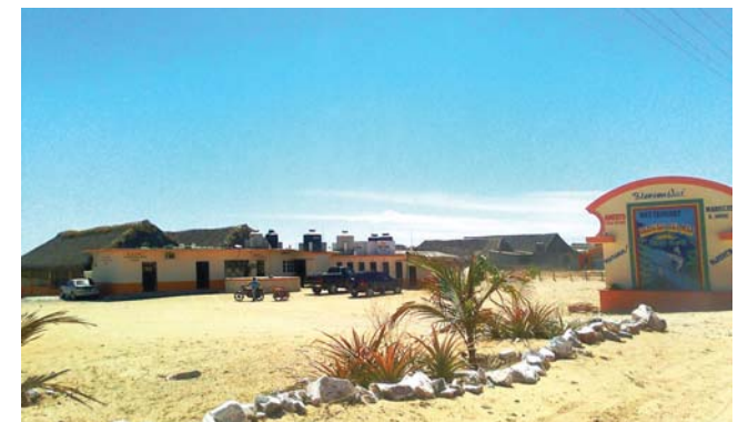
► Los empresarios señalan desatención del gobierno.

Aparte explicó que todos los productos que se utilizan están caros y no pueden ellos tener un precio bajo cuando no van a recuperar lo que invirtieron.