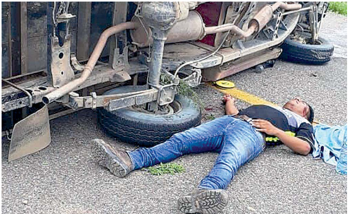
► El accidente pudo haberse debido al exceso de velocidad.

De inmediato tuvo que ser canalizado a un hospital para su valoración y así poder descartar cualquier daño que le pueda causar la muerte.