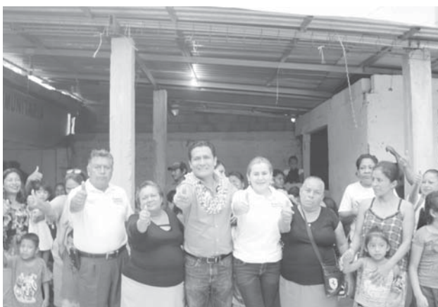
► Lleva hasta el momento 50 colonias visitadas.