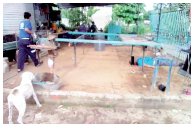
► Uno de los ayudantes falleció mientras viajaba al hospital.

de 26 años, también originario y vecino de la misma comunidad.