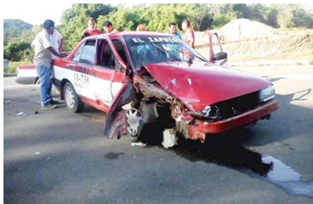
► Al sitio arribaron paramédicos del Cuerpo de Bomberos de Pochutla.

Al sitio arribaron paramédicos del Cuerpo de Bomberos de San Pedro Pochutla quienes acudieron a valorar a los ocupantes de la unidad del servicio de alquiler; la mujer que se trasladaba en el asiento del copiloto fue llevada por los servicios de emergencia de bomberos al Hospital General de San Pedro Pochutla donde quedó internada con el objetivo de recibir tratamiento médico y recuperarse de sus lesiones.