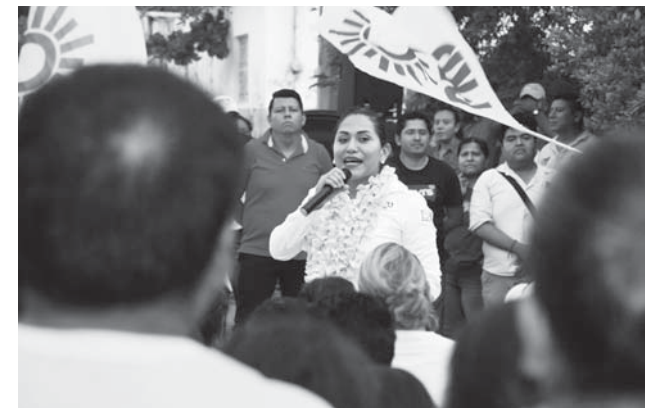
► Los ciudadanos se reunieron para ofrecerle su voto de confianza.