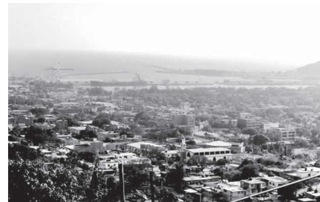
► Los bloqueos son un cáncer y que ha parado al estado.