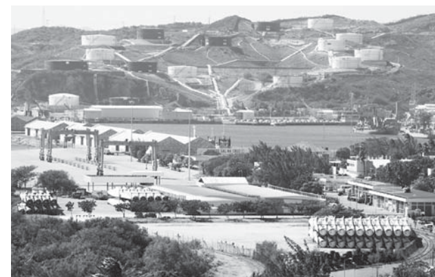
► No hay empleos y el puerto está abandonado.

Pero dijo que Salina Cruz es uno de los puertos que ha estado por años en el abandono por parte de los tres niveles de gobierno y eso ha repercutido en que no despunte como una zona petrolera e industrial que requiere.