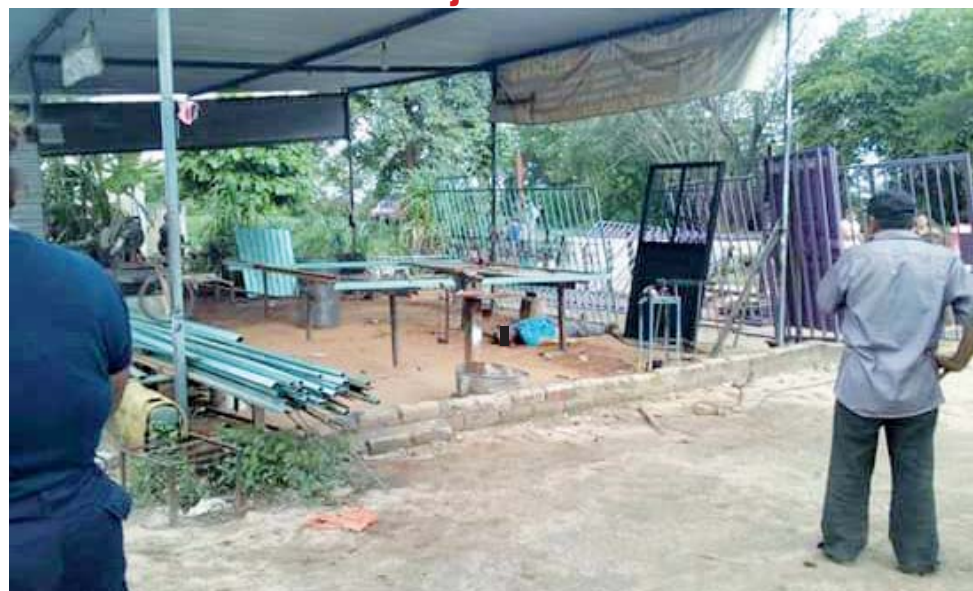
► El dueño de la balconería murió en el lugar del ataque.

Según los testigos del homicidio, personas desconocidas descendieron de una camioneta y abrieron fuego contra el dueño y dos de sus trabajadores