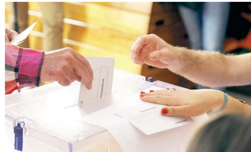
► Negaron las acusaciones de querer hacer daño a los candidatos.