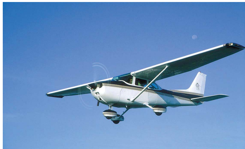
► La avioneta que ayuda en la búsqueda pertenece a Protección Civil.

Elementos de la Marina, así como una avioneta se han abocado a la búsqueda de un joven que desapareció al tratar de cruzar la Bocabarra