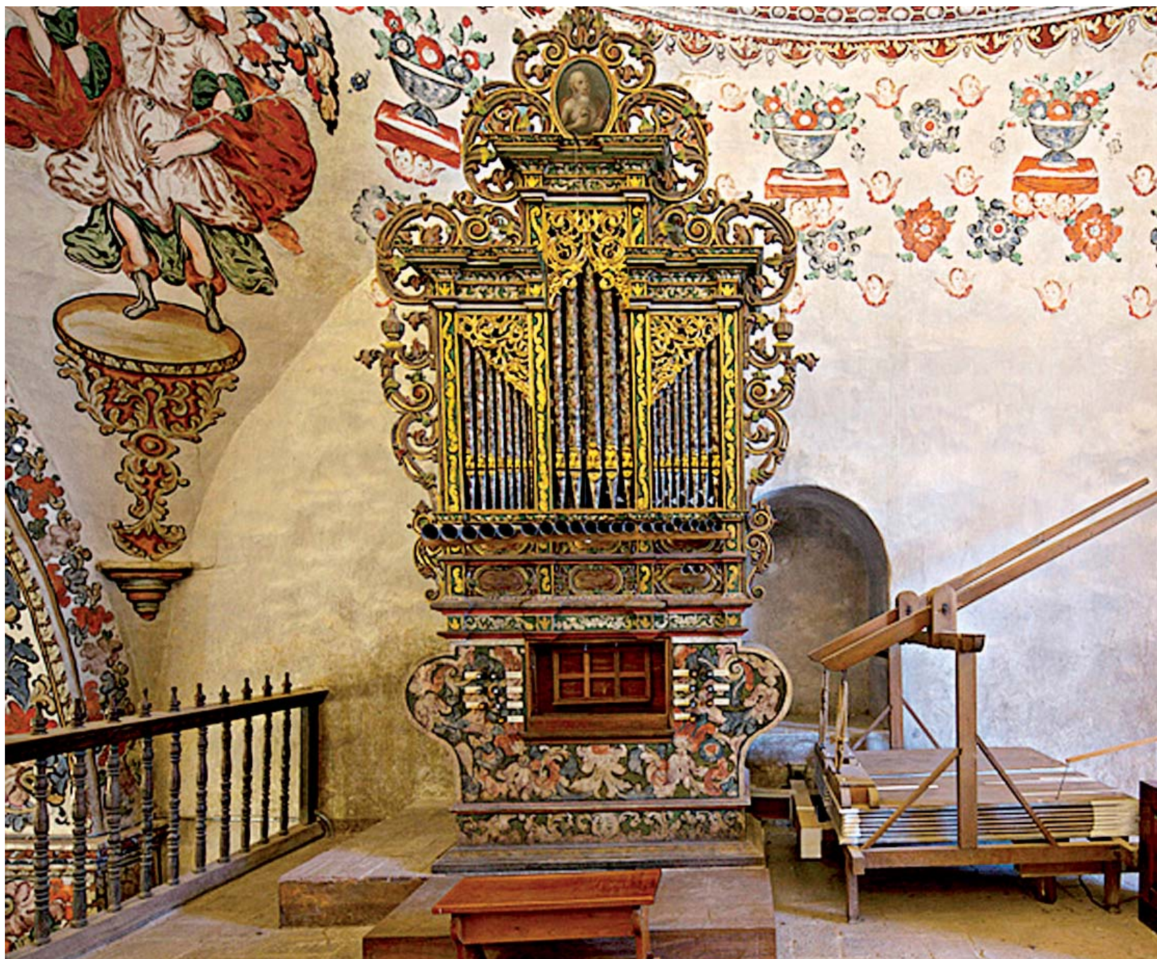
► El primer concierto será con el órgano de la parroquia de San Jerónimo Tlacoahuaya.

Organizado por la Asociación de Maestros Activos Culturales de Oaxaca (AMACO), el programa tendrá entre sus invitados