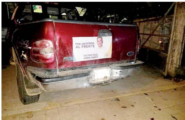
► El candidato afectado asegura que no es la primera vez que se ve amenazado.