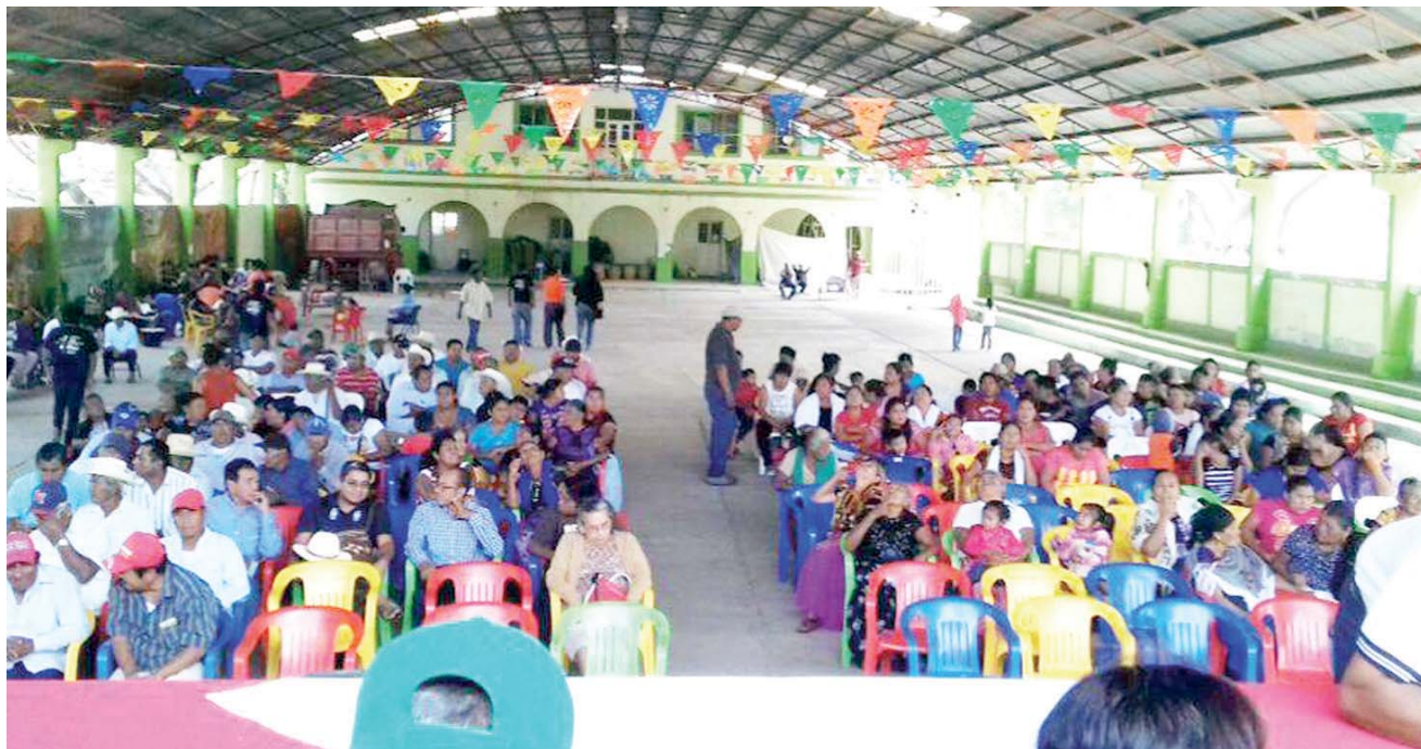
► Acusan a la presidenta municipal y a su cabildo de pretender a toda costa, seguir en el poder a través de la reelección.

La organización se pronunció contra el intento de las actuales autoridades para mantener el poder a través de la reelección