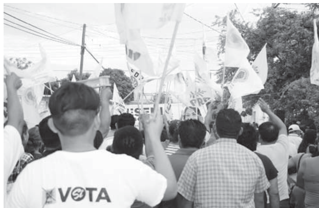
► Invitó a la población presente a defender la elección con su voto.

De hecho, informaron que ayer se manifestaron en el juzgado de control en Santo Domingo Tehuantepec y posteriormente lo realizaron en los Juzgados Civil y Familiar de Matías Romero.