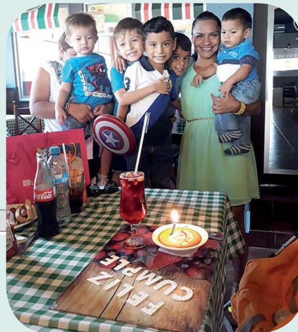
► La joven compartió un día muy agradable en compañía de sus amigas y sus sobrinos.