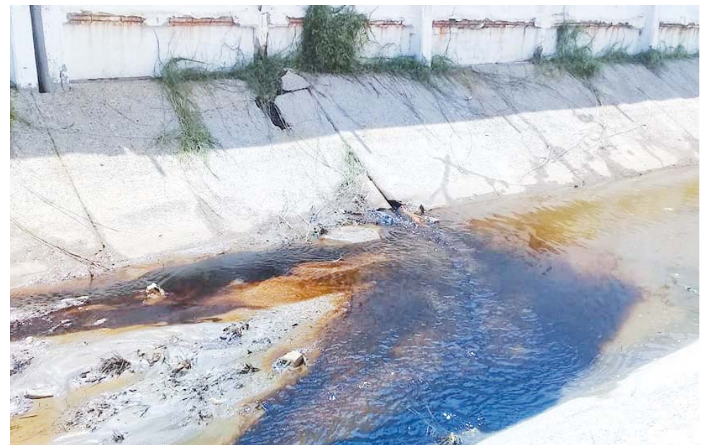
► El derrame afecta a más de 500 personas que residen en la zona, así como a los ciudadanos que dependen de la pesca.