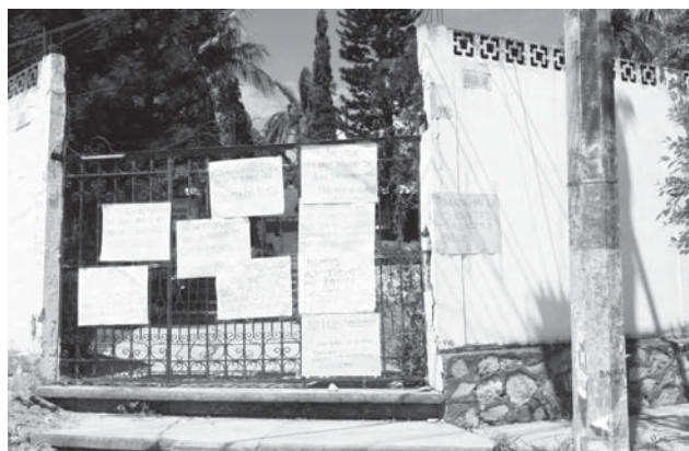
► Ayer protestaron en los juzgados de Tehuantepec.

yecto de Yesenia Nolasco, porque esto va más allá de colores y partidos políticos, hoy vamos juntos por el desarrollo y progreso de Tehuantepec; y vamos con Yesenia porque es una mujer que en muy poco tiempo ha podido realizar grandes obras y ha dado resultados, concluyó.