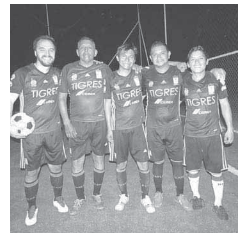
► Romero inició la ofensiva.