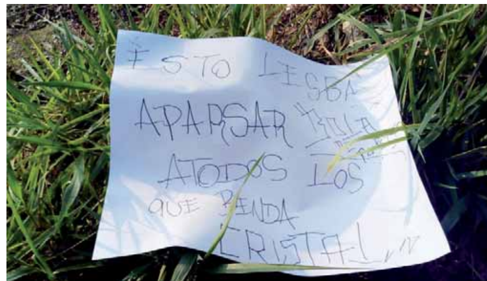
► La cartulina que pusieron a un lado del cuerpo.

A un lado del cuerpo de la víctima se encontró un mensaje escrito en una cartulina que amenaza que eso podría pasarle a los vendedores de