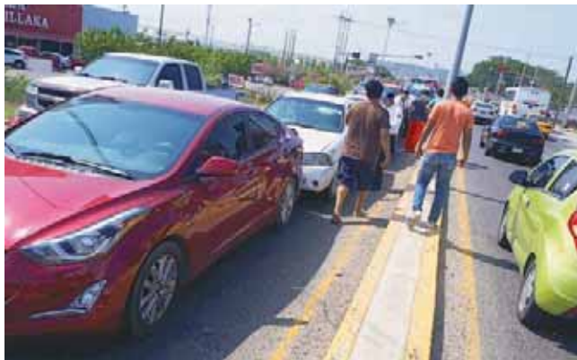
► Los vehículos de motor involucrados en el accidente.

Los municipales informaron del accidente a la Policía Federal, quienes estuvieron en espera de su arribo para que se hicieran cargo de la situación.