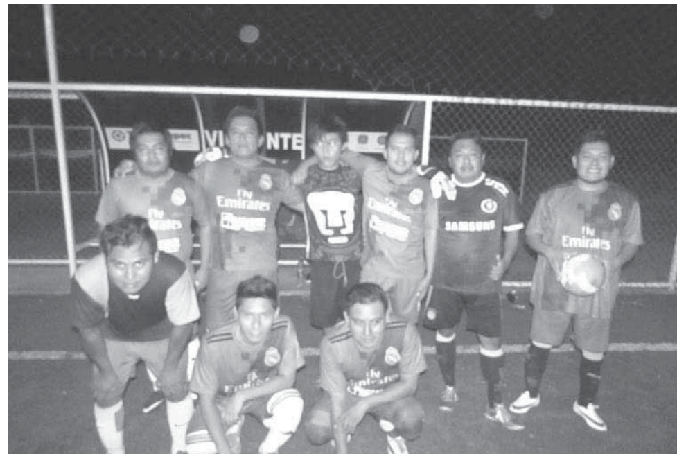
► Conmutadores desconectados.