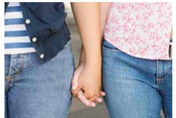
► En muchos casos, la desaparición está ligada a la trata de personas.