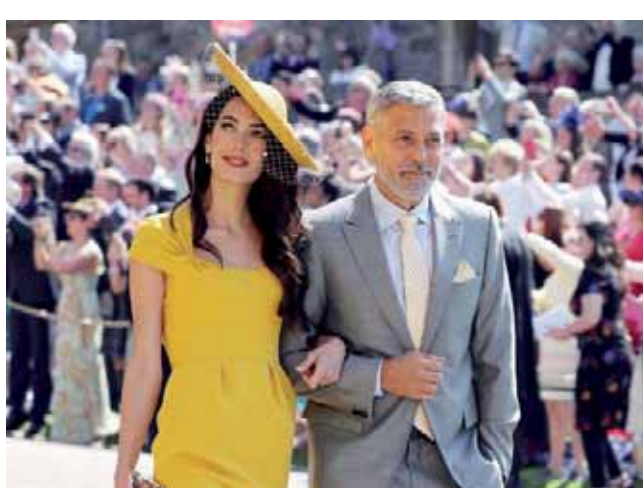
► Amal y George Clooney a su llegada al castillo de Windsor.