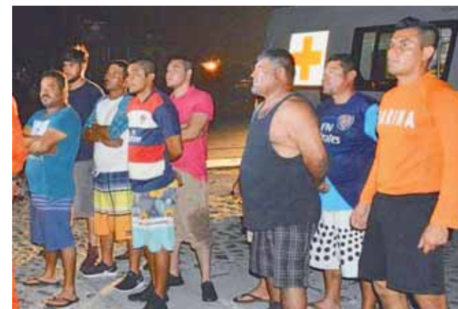
► Los tripulantes sanos y salvos en el puerto después del rescate.