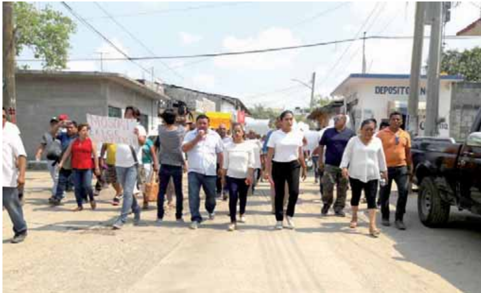
► Recorrieron las principales calles de la ciudad para dar a conocer su molestia por la falta de celeridad en el caso.