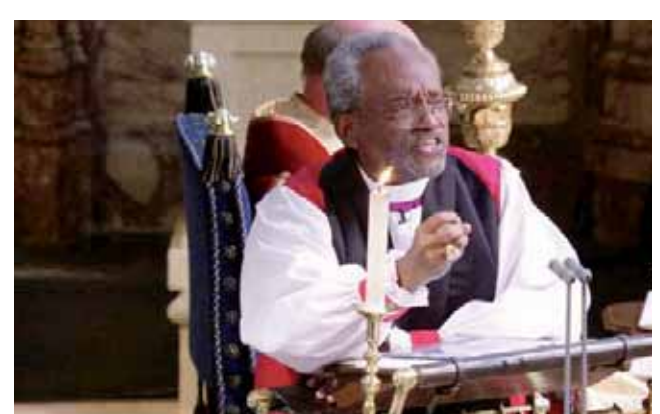
► El obispo presidente de la Iglesia Episcopal de EEUU, el reverendo afroamericano Michael Bruce Curry, encargado de dar el sermón está sorprendiendo a todos con su manera dirigirse a los presentes.