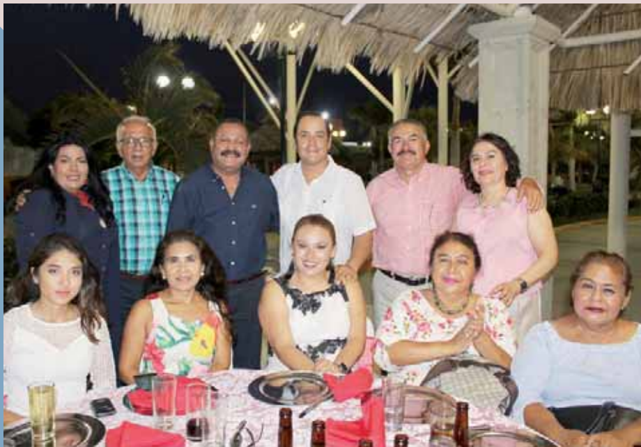
► El capitán Rivera Mar compartió un momento muy agradable con amigos y familiares.