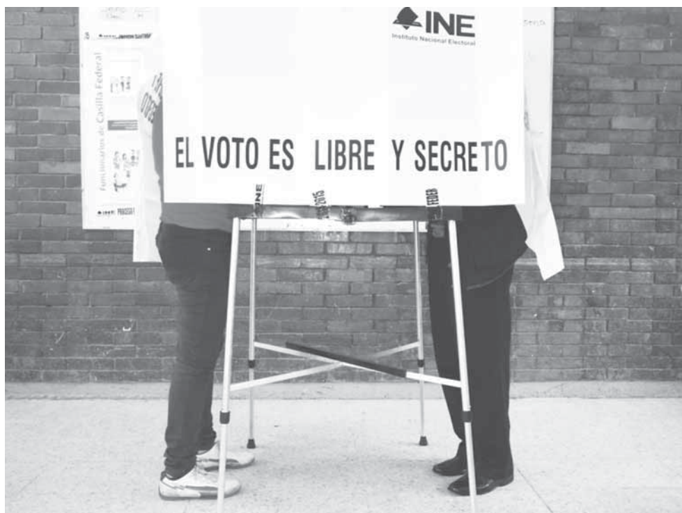
► Llaman a votar de manera libre y secreta el próximo primero de julio.