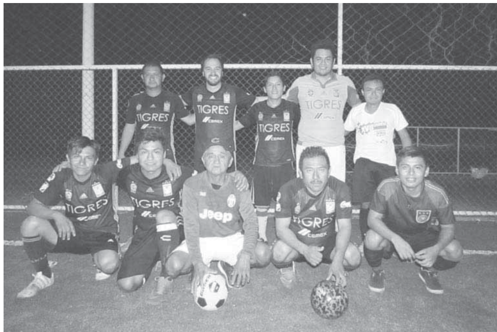
► Cemex con rápido secado.