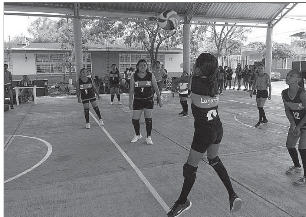
► Asegurando la recepción.