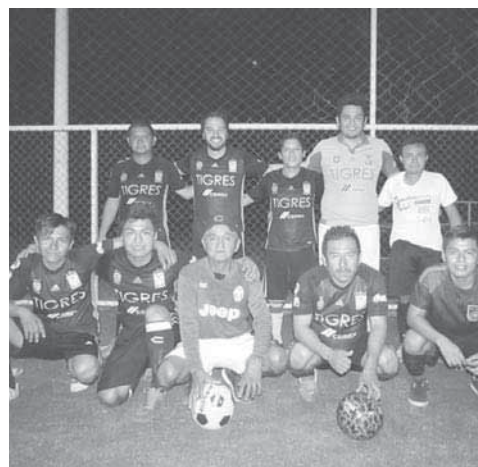
► Bautista se la rifó solo.