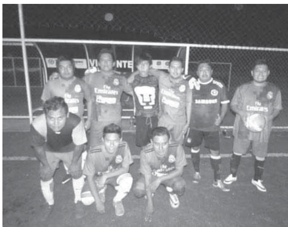
► Gentera no volvió por el cambio.