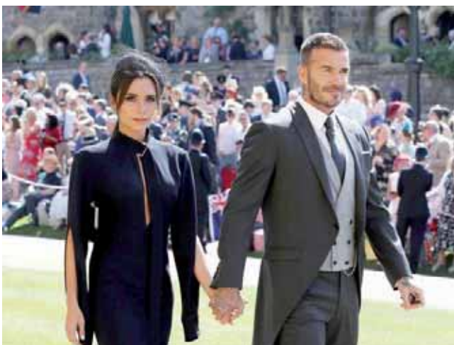
► Victoria y David Beckham.