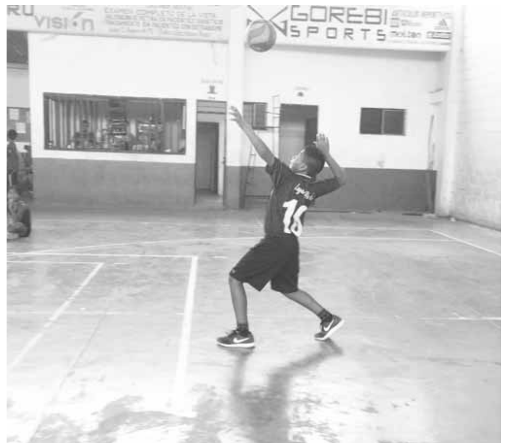
► Buscando el hueco.