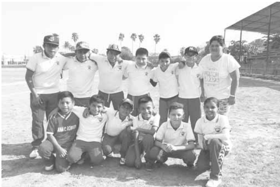
► Escuela Juana C. Romero con un triunfo.