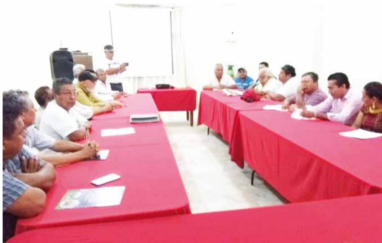
► Durante la reunión que sostuvieron el grupo de inconformes.

tos para los productores del campo, para los palmeros y todos los sectores productivos de Unión Hidalgo", destacó López López.