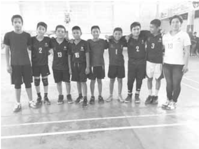
► Lagartos Jr. B de más a menos.