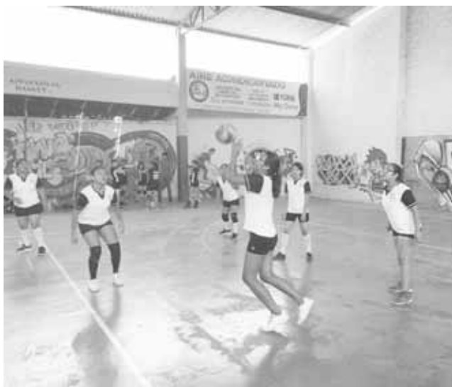
► IMA trató de enderezar.