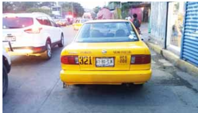
► La unidad que estuvo involucrada en el accidente vial.