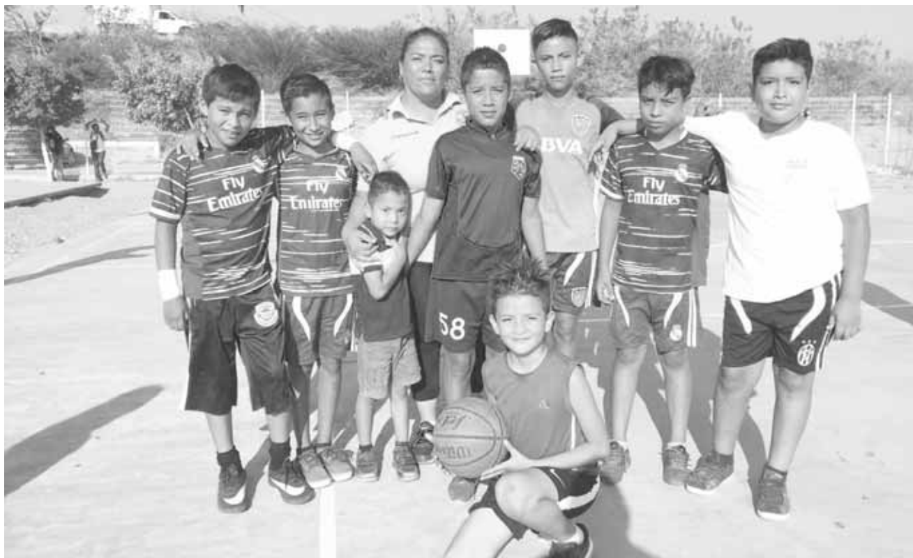
► 22 de Marzo en ceros.

En la alineación de 22 de Marzo estuvieron: Sal-