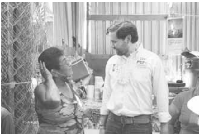
► Escucha las inquietudes de las locatarias.