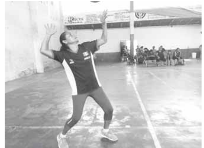
► Acomodando el saque.