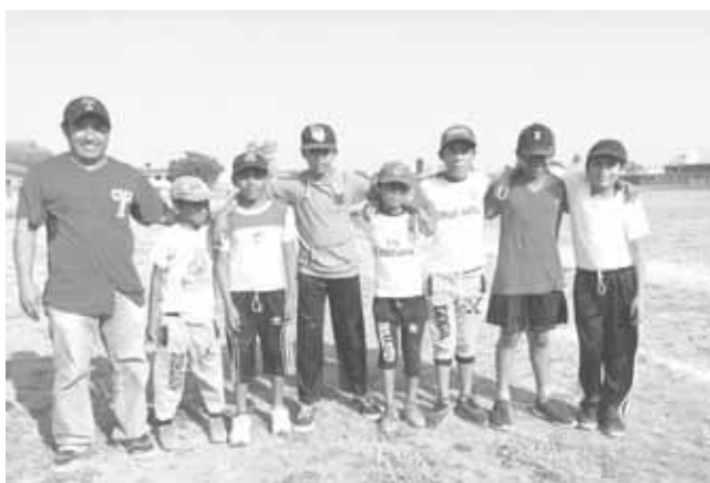
► Escuela José Vasconcelos, con una derrota.

canando la escuela Patria, en punto de las 16:30 horas en el campo Rojo del Barrio Santa María.