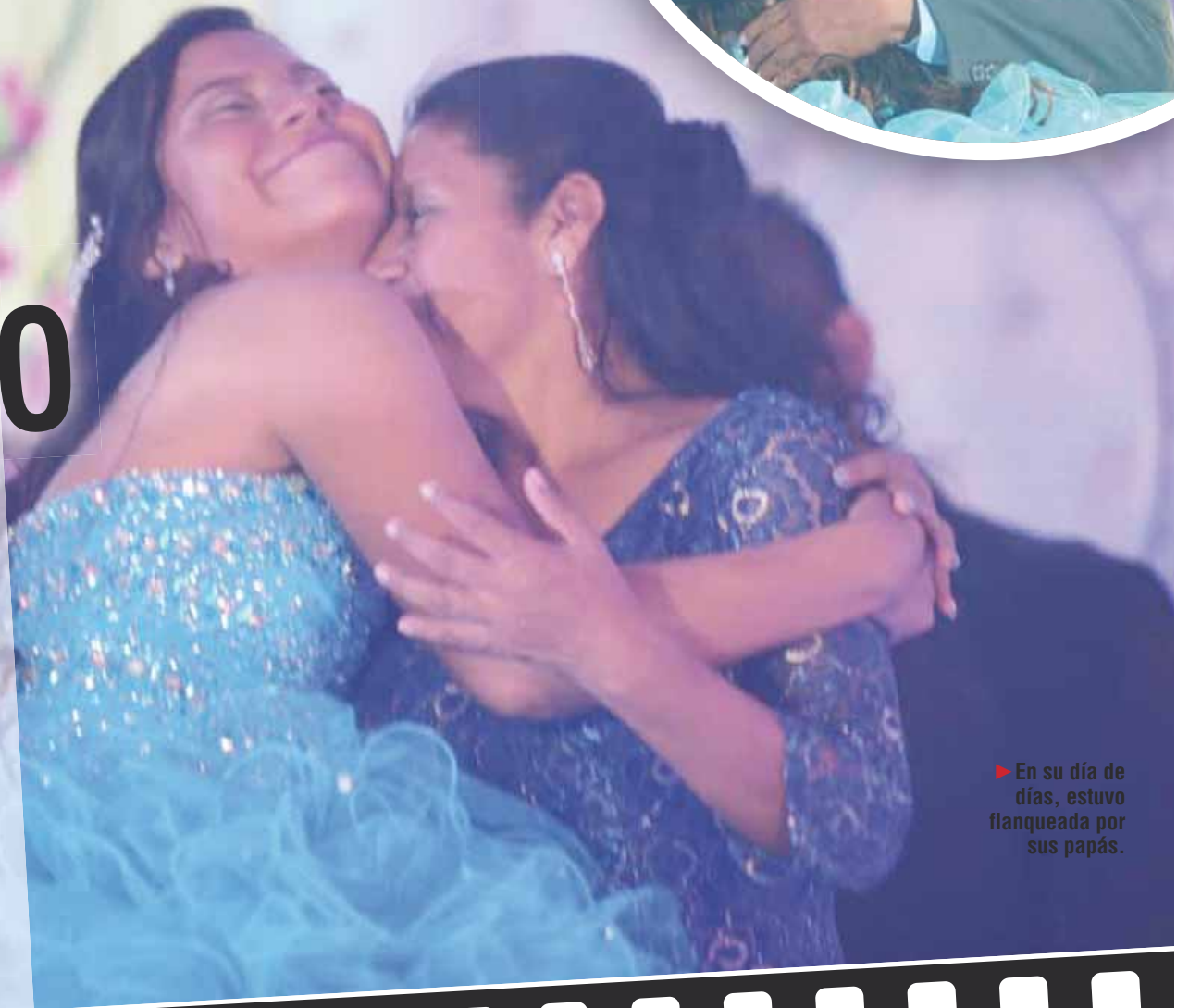
► En su día de días, estuvo flanqueada por sus papás.

Los presentes disfrutaron de un rico banquete preparado para la ocasión.