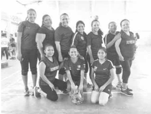
► Binni Hrucaalu se fortaleció.