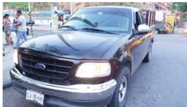
► La camioneta que participó en la colisión.

involucrado fue un taxista quien tripulaba la unidad 321 del sitio Morelos en donde viajaba una señora de copiloto.