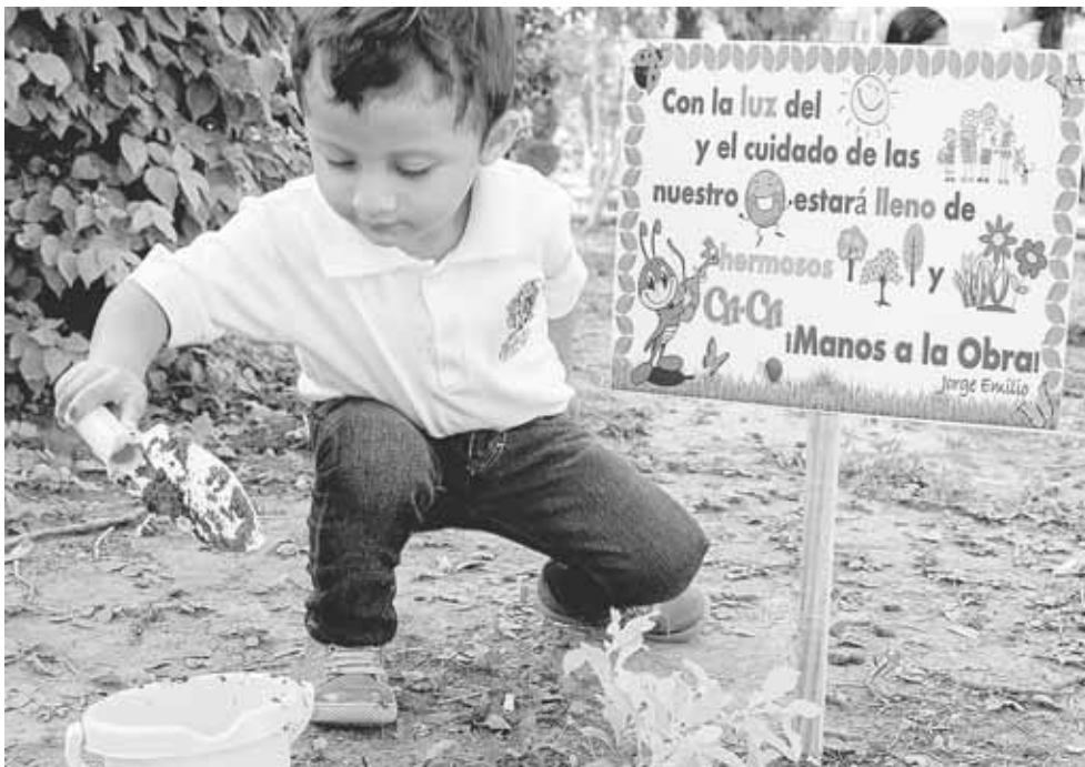
► Enseñan a los infantes a cuidar las plantas y los árboles por el bien del planeta.