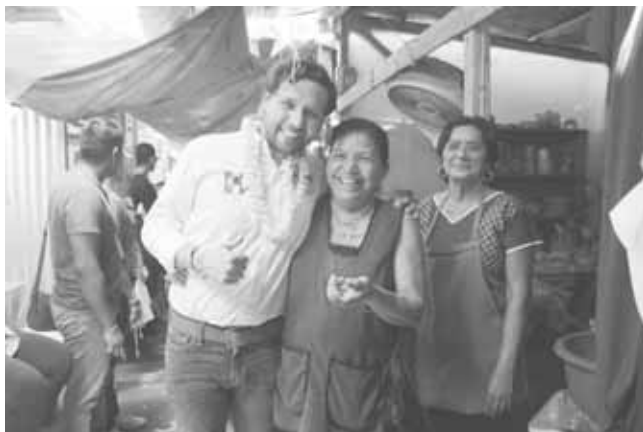
► Es recibido con gran afecto por las cocineras.