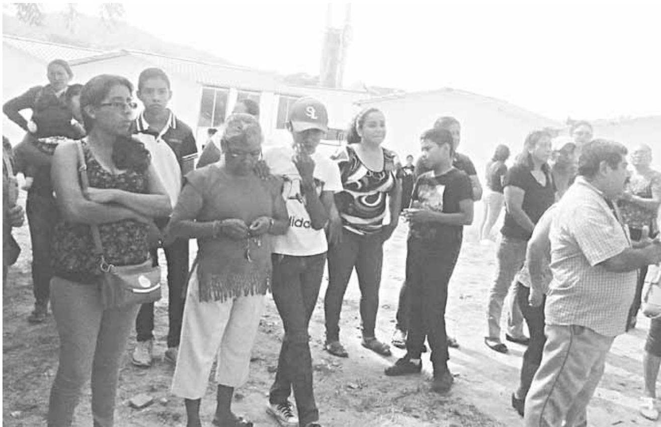
► Explican que no se darán por vencidos hasta que logren que los juegos mecánicos se quiten.

El gobierno reiteró su respeto absoluto a la vida sindical de los trabajadores de los tres Poderes del Estado y a los resultados ema-