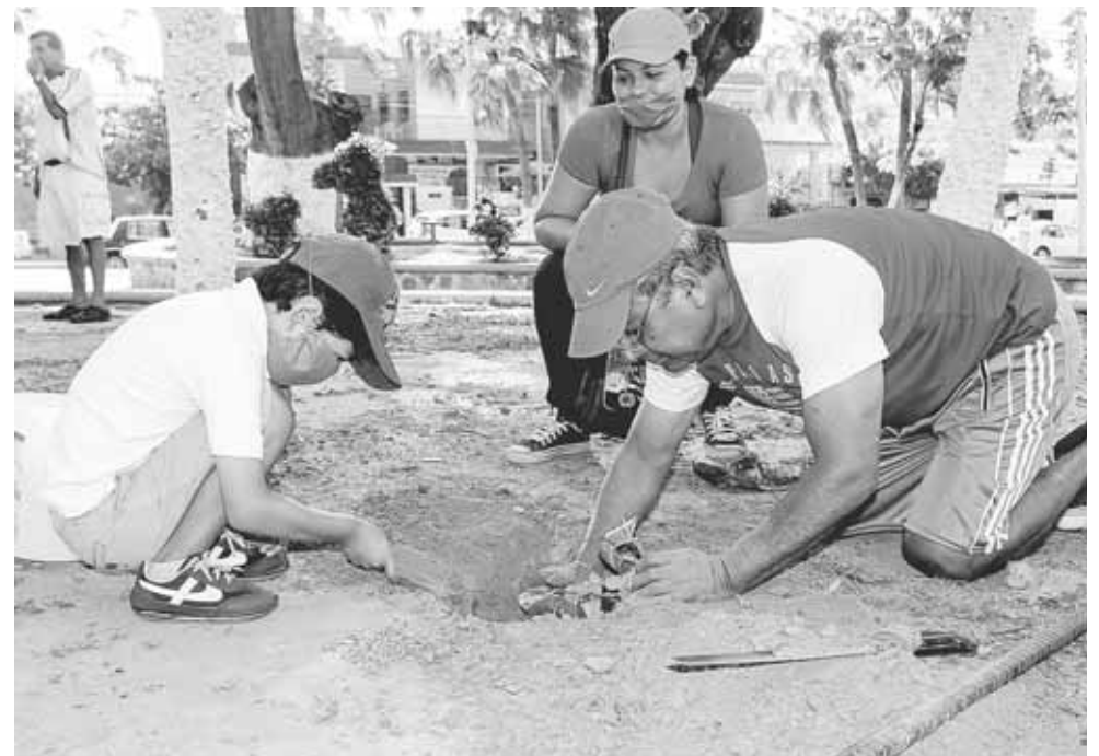
► Familias enteras se abocaron a plantar flores y árboles en el parque.