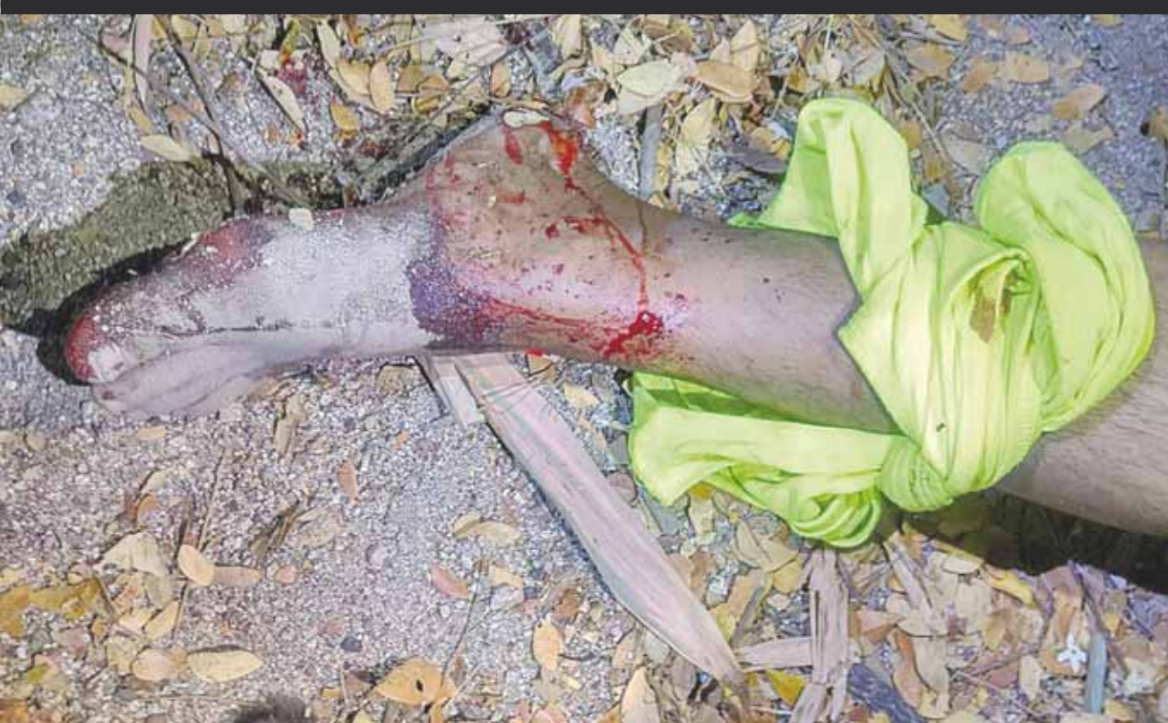
► Se abrió una carpeta de investigación para dar esclarecer los hechos.