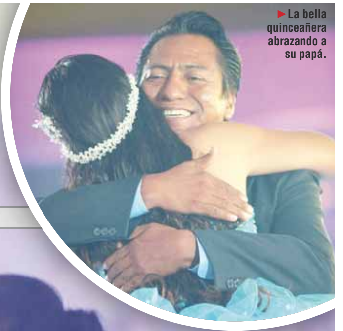
► La bella quinceañera abrazando a su papá.