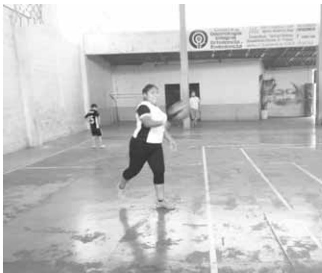
► Poderoso saque.