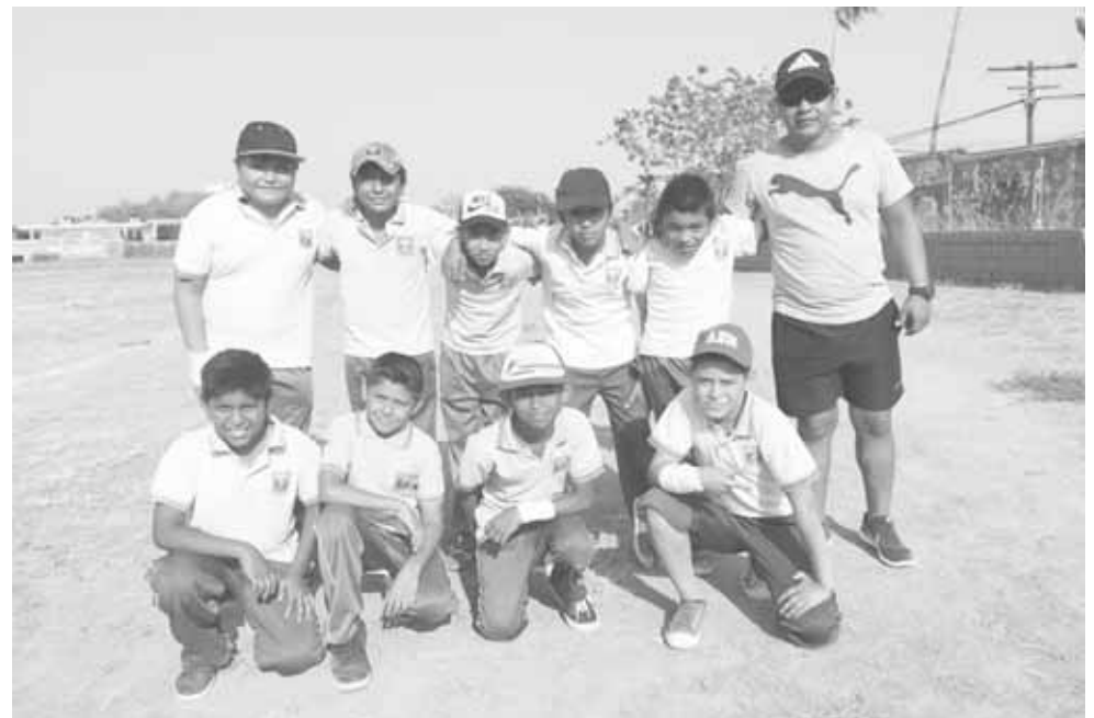
► Escuela Donají tuvo 1 y 1.