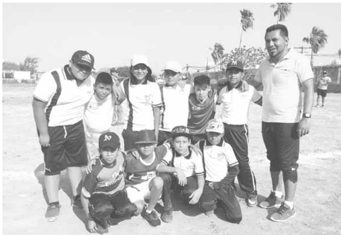
► Escuela Patria con un juego perdido.