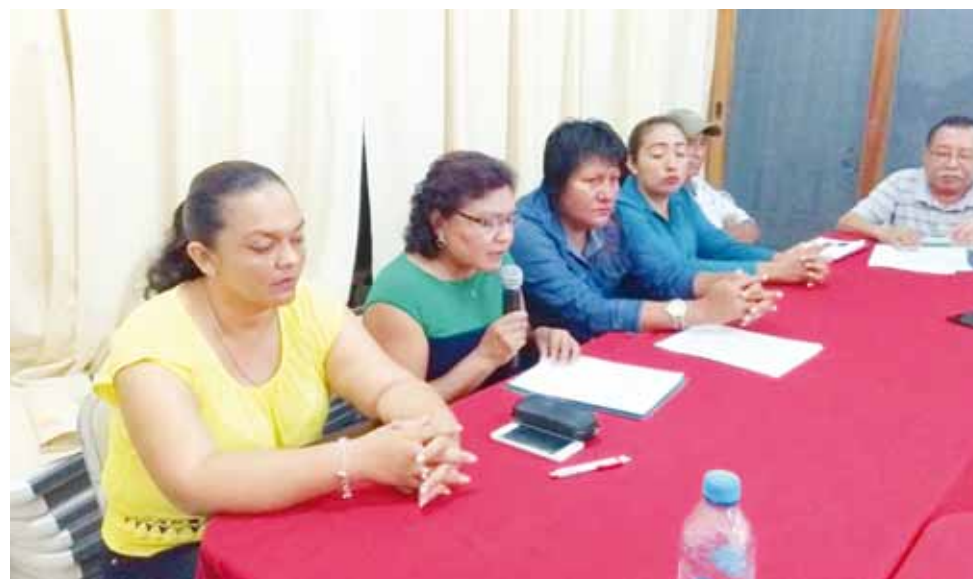
► Enlistan una serie de irregularidades que se han presentado.

de este proyecto eólico, los sectores productivos de esa comunidad estarán gestionando la construcción de un hospital, así como una extensión del Tecnológi-