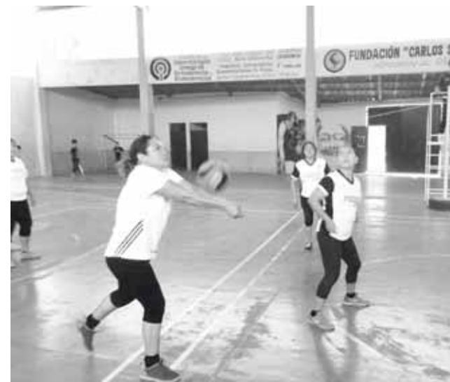
► Segura en la recepción.

Las jovencitas del I.M.A. trataron de replantear sus líneas y buscaron tener mayor ofensiva, pero les costó