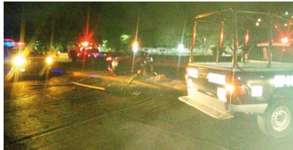
► La policía dio a conocer que se le multó al ciudadano por una cantidad de 10 mil pesos.