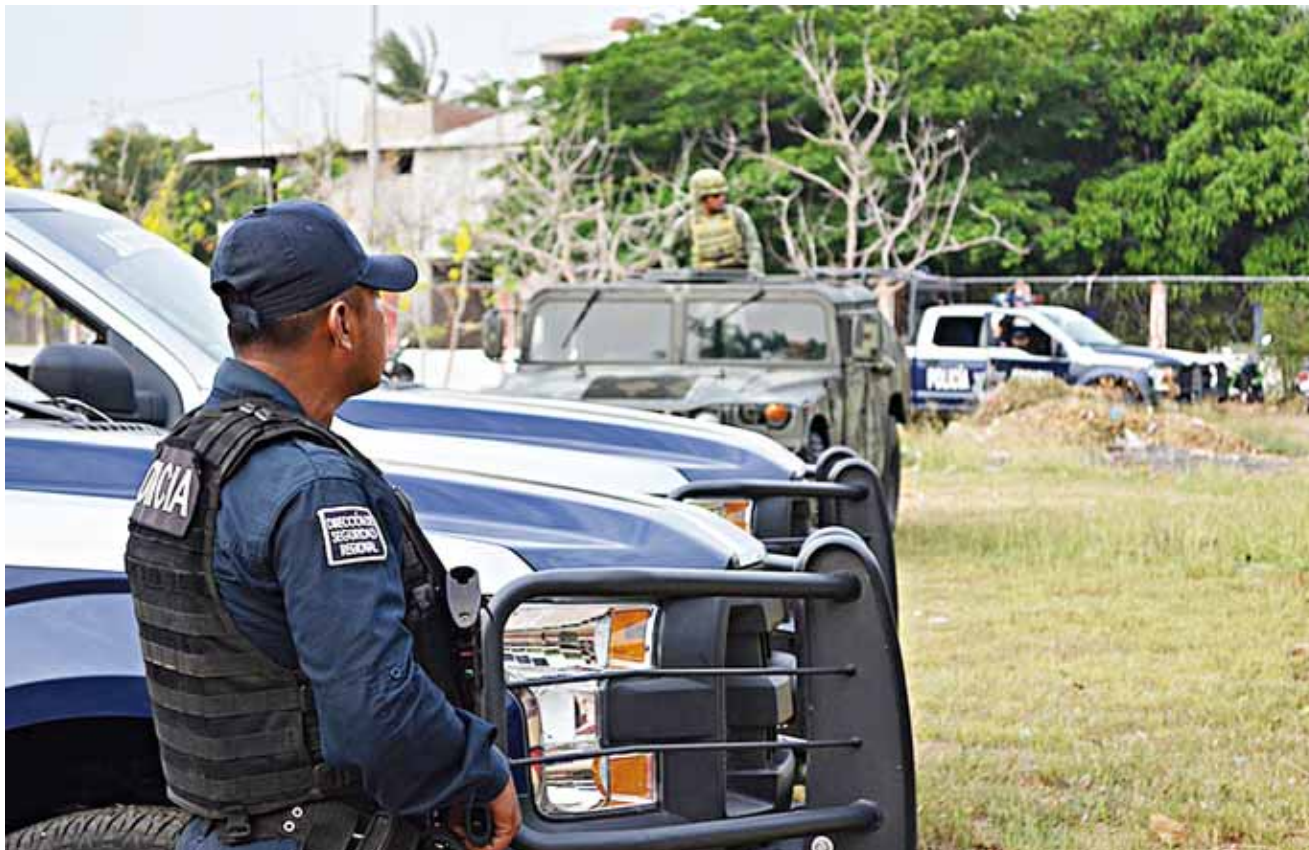
► El Subsidio para la Seguridad en los Municipios es elemental para mejorar las condiciones laborales.

Hasta el momento, la Comisaría de seguridad pública municipal tiene 14 policías capacitados y certificados, cinco más se encuentran en la academia recibiendo capacitación, "obtienen certificación de carácter estatal, y pueden acceder a un empleo de policía dentro de la entidad o en cualquier entidad federativa, en la academia permanecen dos meses y medio, después deben certificar su cartilla del servicio militar nacional