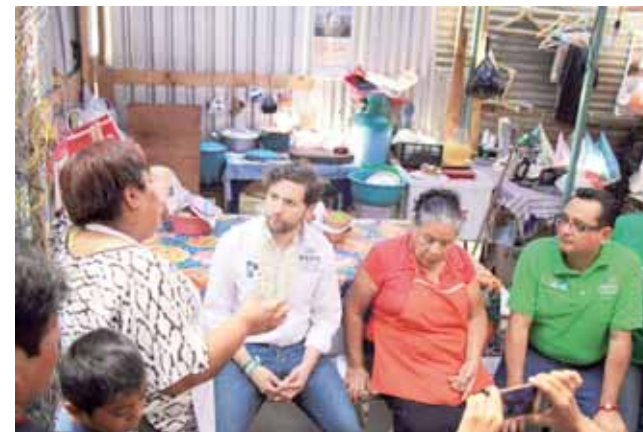
► Le dan a conocer cada una de sus necesidades.