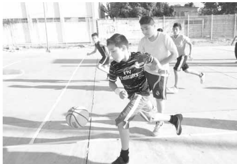
► Los niños de fueron todo.