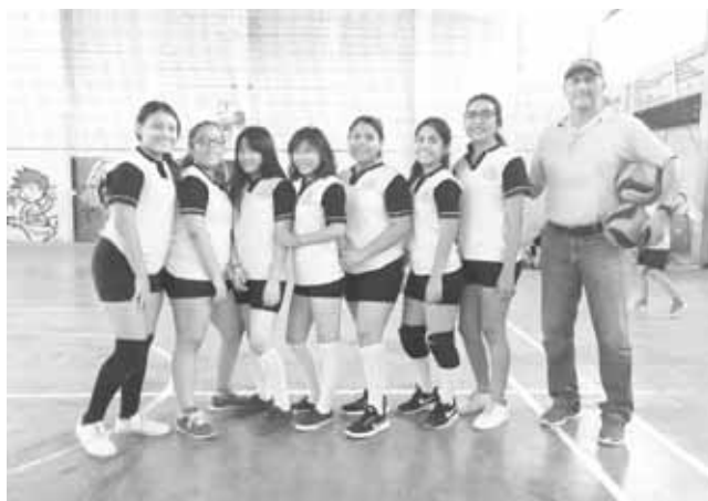
► I.M.A. poca concentración.

Las acciones iniciaron con el dominio desde el área de saque por las jóvenes de Friend's Club, quienes mostraron su oficio y juego de conjunto cada vez más coordinado y con mayor ofensiva, lo que les permitió ir ampliando cada vez más la ventaja sobre las chicas del Instituto Manuel Altamirano quienes les costó más esfuerzo poder conjun-