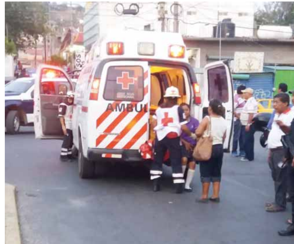
► Al momento en el que paramédicos trasladan a la herida de gravedad.

rer dar vuelta para incorporarse sobre la calle Progreso no se fijó que sobre la avenida circulaba el taxista dándole un fuerte golpe a la unidad de motor lesionando a la señora.