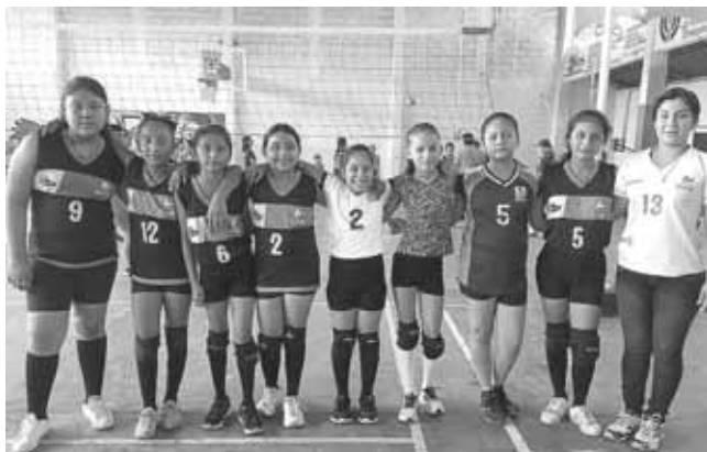
► Lagartas Jr. C muy cerca se quedó.