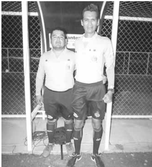
► Pacheco y Alvarado dieron el aval.