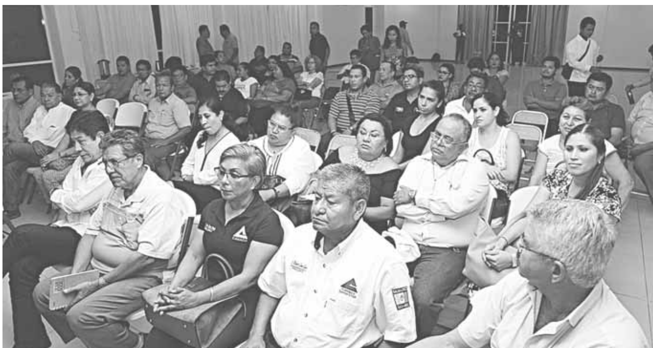
► El auditorio estuvo nutrido con la participación de decenas de periodistas.

Interesado en el tema expuesto por el ponente del curso, el alcalde, habló que