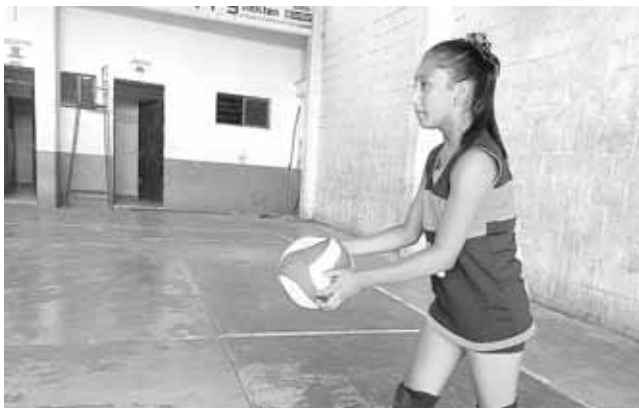
► Buscando el espacio.