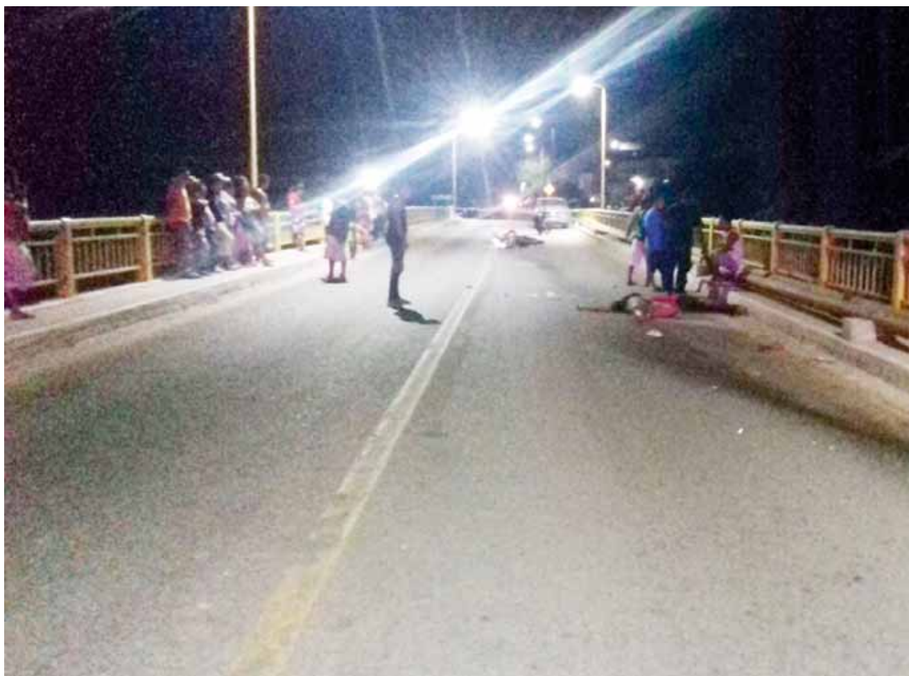
► Los cuerpos quedaron en medio del puente.

Por otro lado, está prohibido viajar más de dos pasajeros en una motocicleta y que estarían violando la ley de tránsito por no contar con la seguridad de manejo de motociclistas.