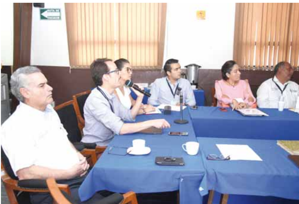
► El objetivo es generar un plan de acción para que Salina Cruz crezca de manera equilibrada,