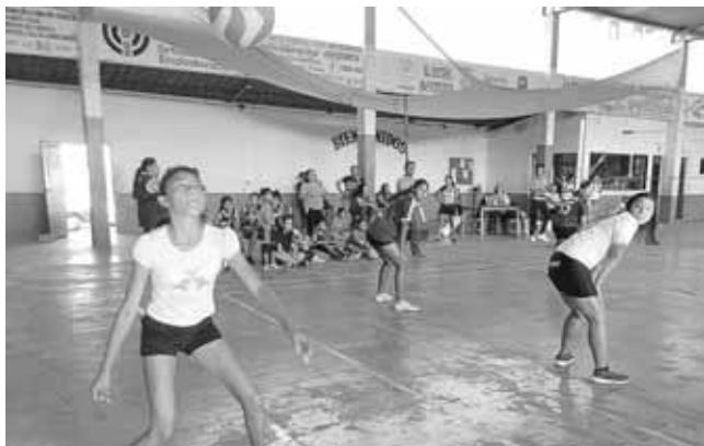
► Buena defensa de Molten.