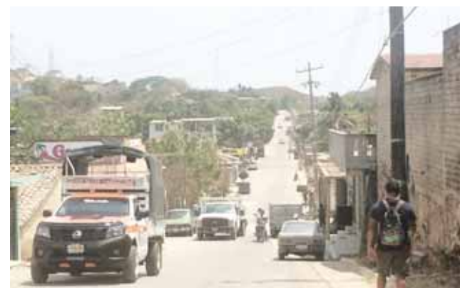
► La colonia es una de las más antiguas de Pinotepa Nacional.

También, para este día, se tiene contemplado una misa eucarística para dar-