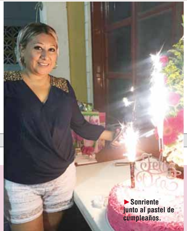
► Sonriente junto al pastel de cumpleaños.