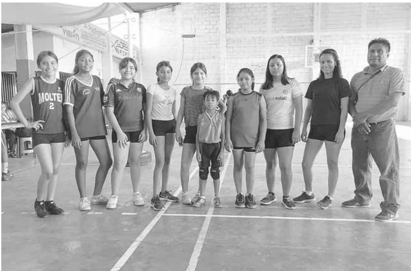
► Molten Jr. defendió con todo el triunfo.

El primer set se fue con anotaciones por ambos lados, la diferencia en la ventaja fue de una y otra parte con volteretas en la pizarra, las chicas de Lagartas Jr. "C" dieron el extra, pero las jovencitas de Molten Jr. no permitieron que tomaran el ritmo de las acciones y aunque el set pudo estar de cualquier lado, finalmente las chicas de Molten Jr.