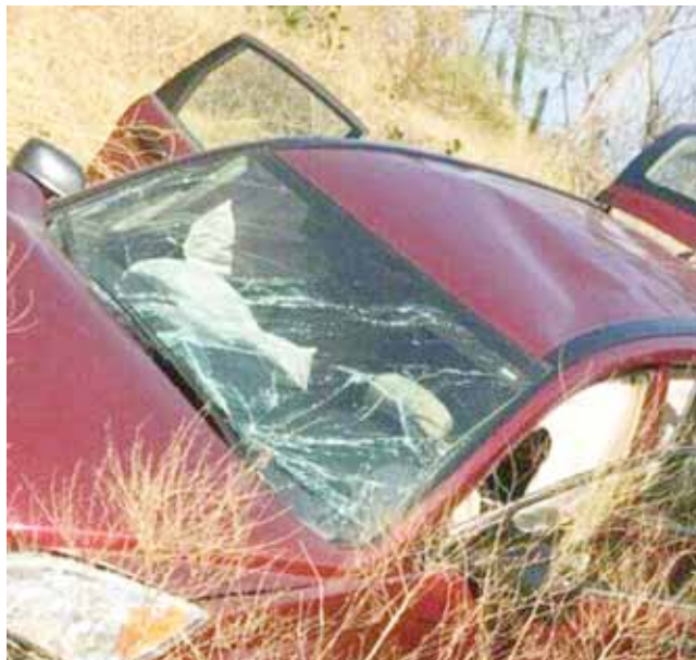
► Solo daños materiales en el accidente afortunadamente no hubo pérdidas humanas.

El exceso de velocidad en la que era conducida la camioneta provocó que el chofer perdiera el control y originó que se suscitara el accidente