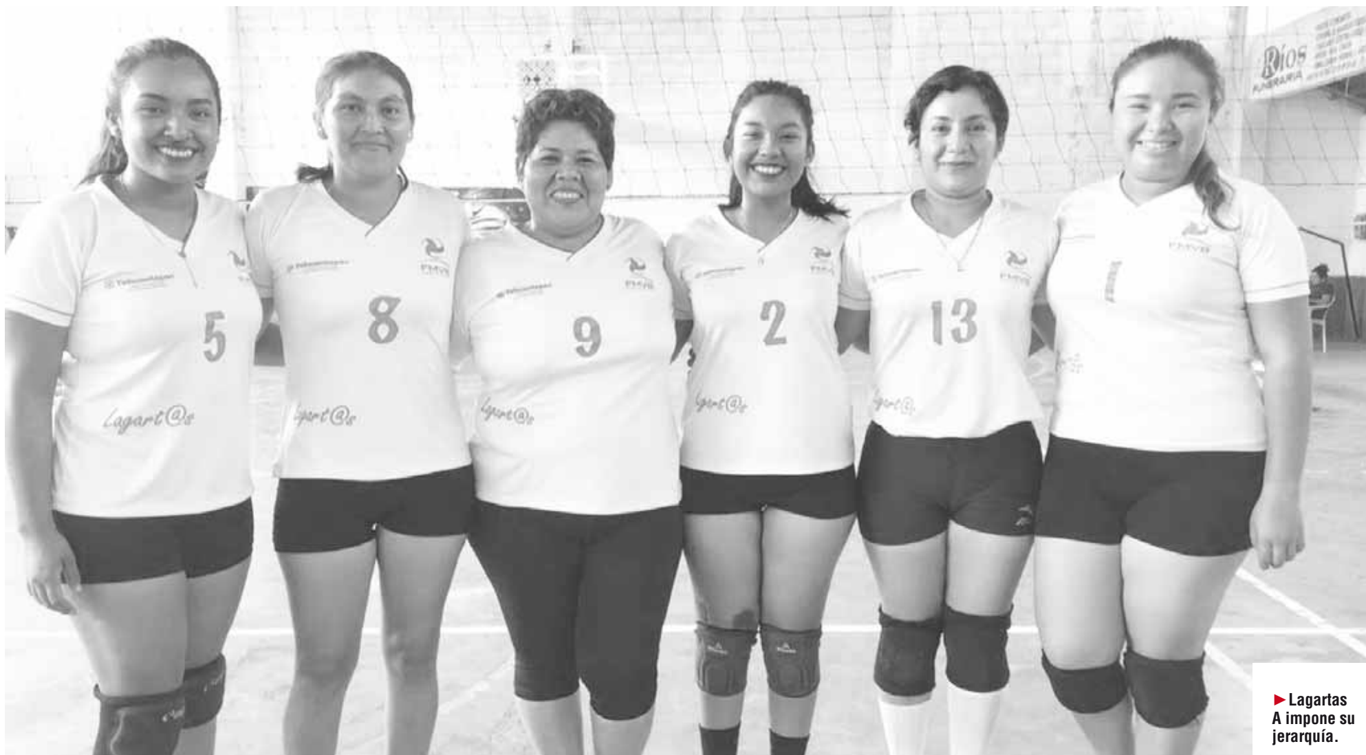
► Lagartas A impone su jerarquía.