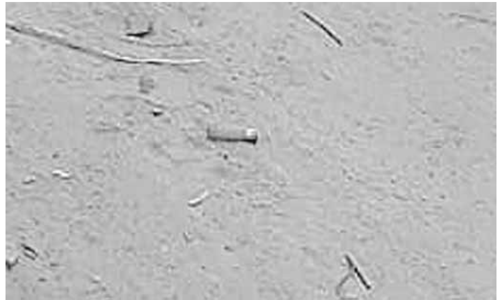
► poner pie de foto