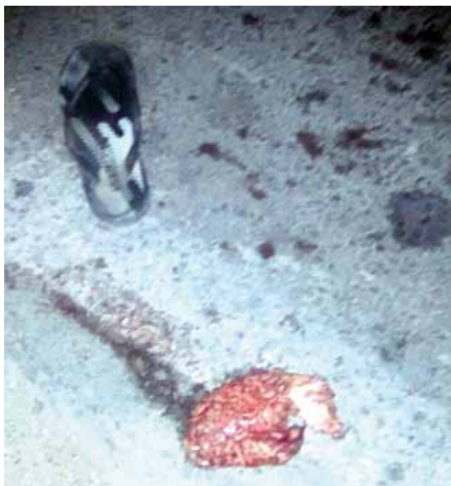
► La masa encefálica quedó a un lado de los cuerpos, junto a una chancla.