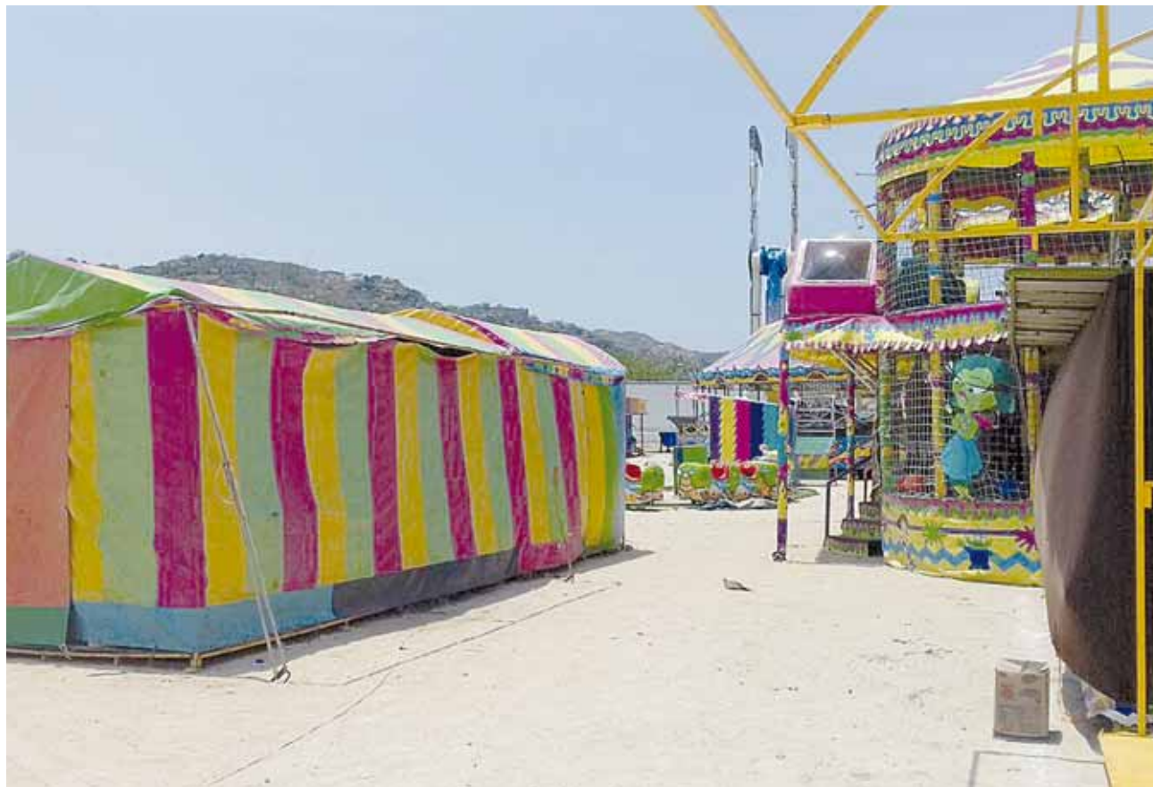
► Los juegos mecánicos están a unos metros de las aulas de los educandos.

Dentro de las funciones de un Enlace de Migrantes destacan labores de prevención, estudio y divulgación de temas relacionados con los derechos de la población migrante, garantizando con ello la igualdad, seguridad, libertad, justicia y dignidad entre este grupo altamente vulnerable.