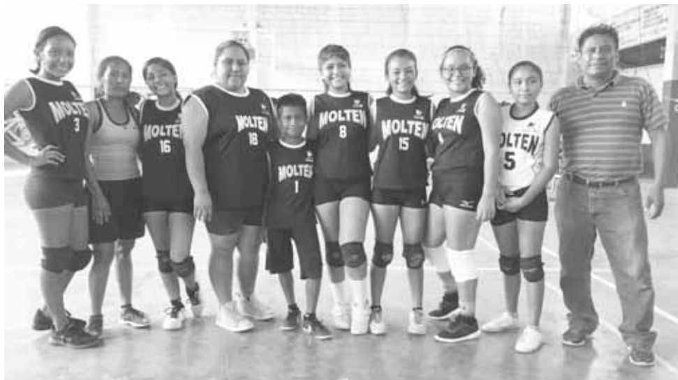
► Molten descoordinadas.

En el segundo rollo, nuevamente las Lagartas "A", hicieron de las suyas y pusieron contra la pared a las jovencitas de Molten, quienes no pudieron plantarse bien en su área y sufrieron la embestida ofensiva de sus adversarias quienes empezaron a cosechar punto tras punto deján-