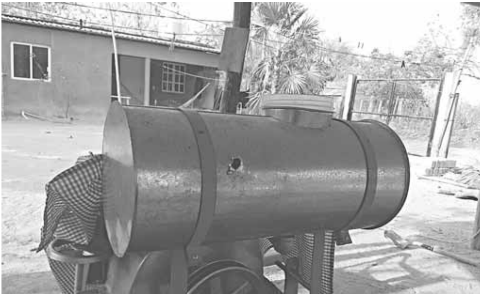
► Disparan contra vivienda de inconforme en San Isidro Apango, Pochutla.