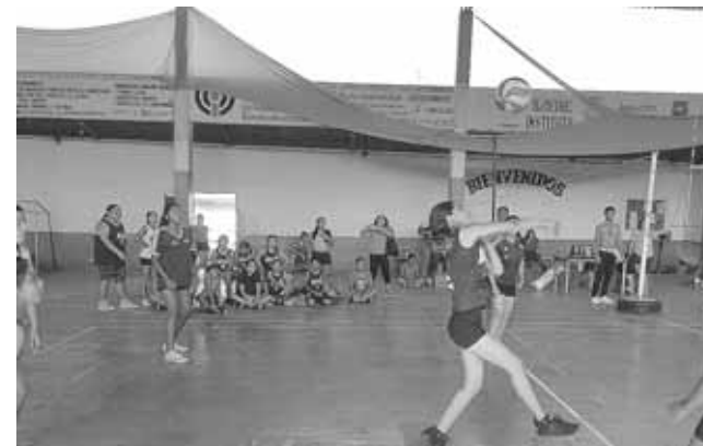
► Efectivos remates.