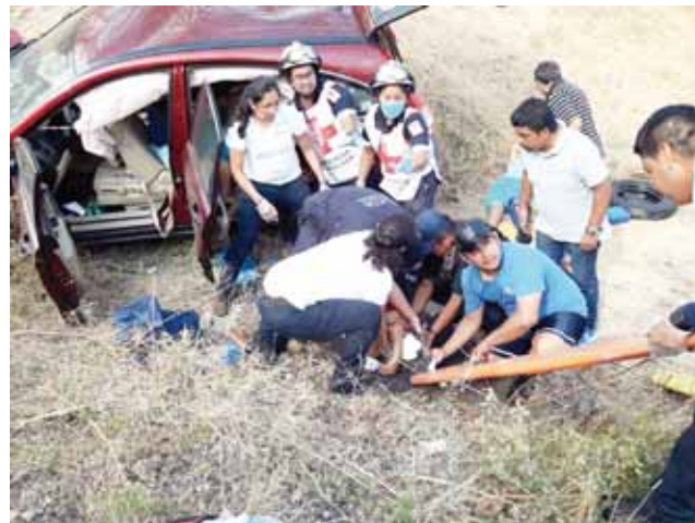
► Lesionados en el lugar fueron atendidos por paramédicos de la Cruz Roja.

recibió informando que tres personas se desplazaban a bordo de su unidad de motor de color marrón con placas de estado, el cual viajaban con dirección a la población del Morro Mazatán, se salió del camino por el exceso de velocidad en el que condu-