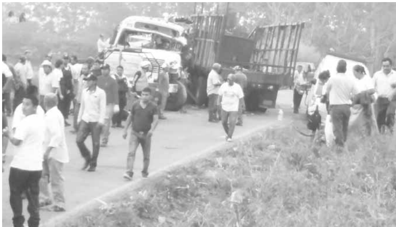
► Automovilistas auxiliaron a los heridos del autobús.