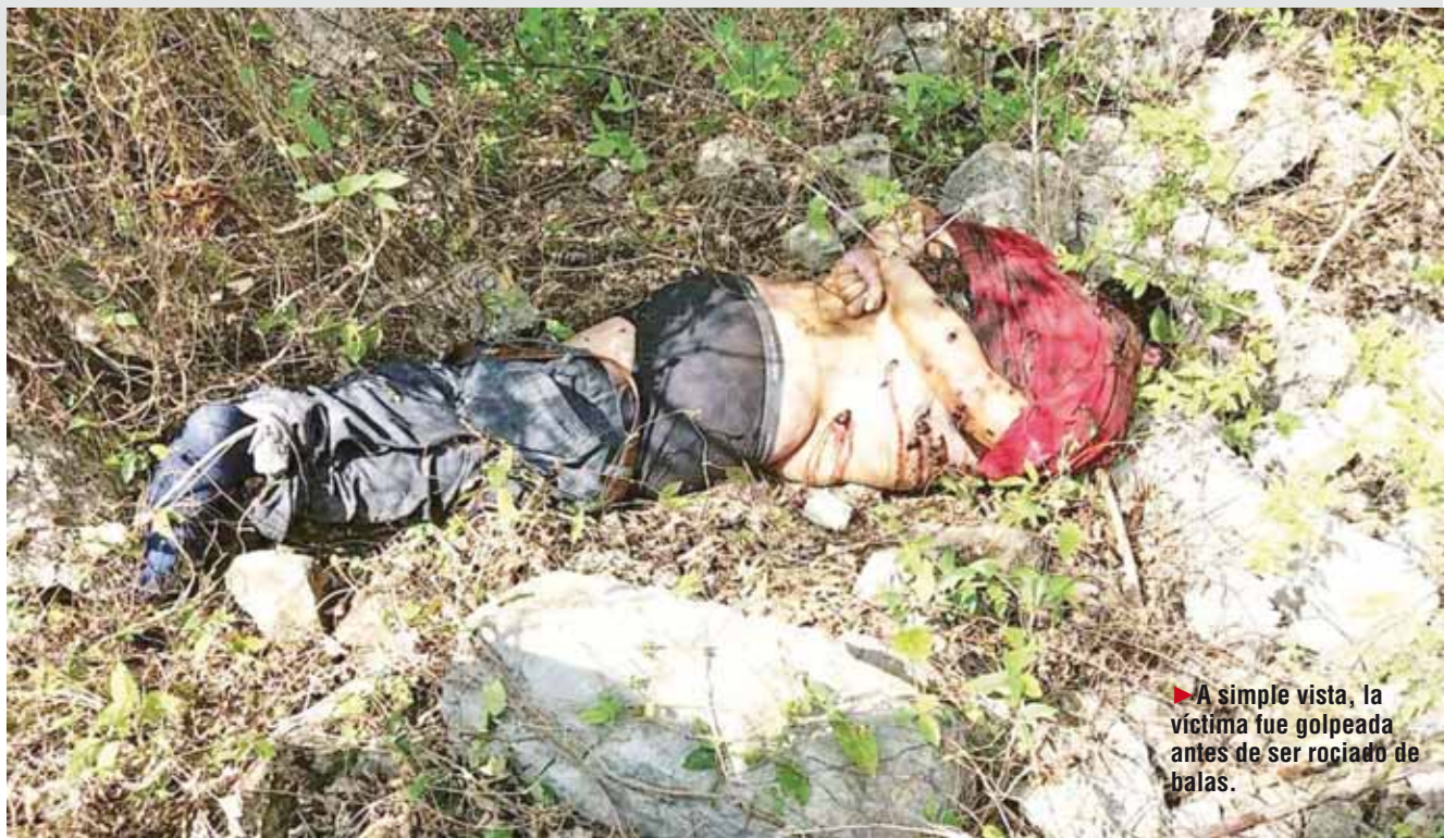
► A simple vista, la víctima fue golpeada antes de ser rociado de balas.

to Mexicano y de la Secretaría de Seguridad Pública también arribaron al lugar para colaborar en la investigación.