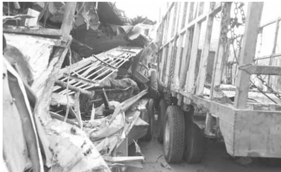
► Los vehículos pesados quedaron reducidos a fierros retorcidos.