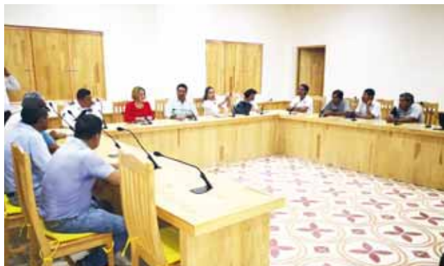
► La autoridad municipal y concesionarios de taxis acordaron instalar una terminal para sitios foráneos.