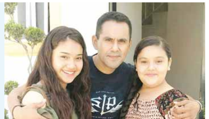
► Padre e hijas en una bella foto de recuerdo.