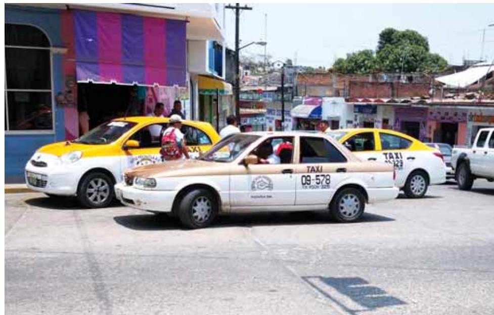
► 120 autos del servicio público de alquiler trabajan en la cabecera municipal de Pochutla.

la trabajan alrededor de 120 autos de alquiler en los sitios 12 de Agosto A. C., Costa Pacífico A.C., San Pedro A. C. Valpi A. C. Pochutla A. C., y Las Golondrinas A. C.