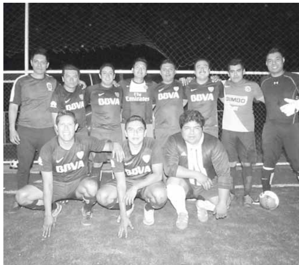
► Apollo sigue firme.