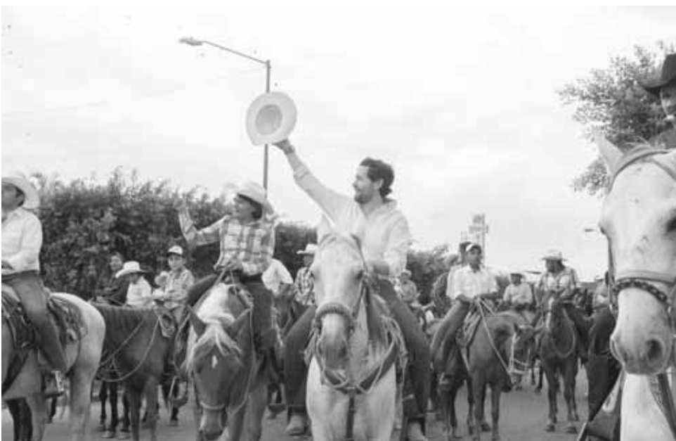
► Un nutrido grupo de simpatizantes lo acompañaron en el recorrido.