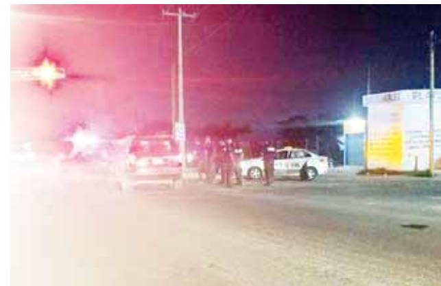
► A pesar de lo aparatoso del percance, ningún conductor resultó lesionado.

A la zona, también llegaron elementos de la Policía Vial y según dictamen, el origen del accidente es por el exceso de velocidad y la falta de pericia al conducir, aunado a las prisas, por lo que una vez levantado el reporte correspondiente, invitaron a