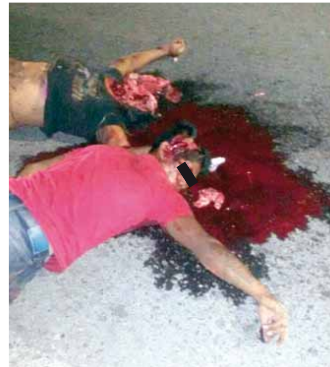
► La escena era espeluznante; la mujer se quedó sin cabeza.