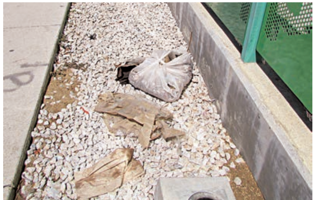
► Exhortan a las autoridades a limpiar el lugar del tianguis.

En un recorrido se pudo constatar que efectivamente en