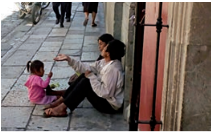
► El Andador Turístico luce con varios indigentes que piden dinero.