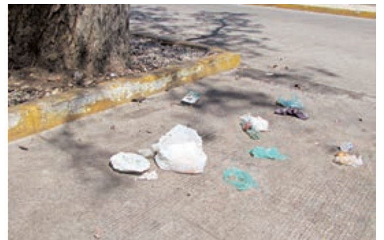
► Dijeron que cada ocho días es la misma situación.

"A quien le toca atender el problema, durante el día de la venta debe mandar a colocar contenedores, papeleras o un camión recolector de basura, además invitar a