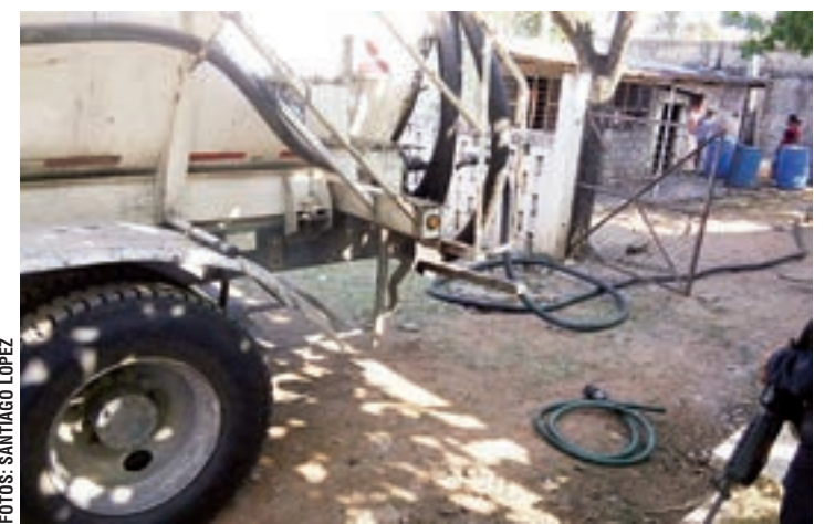
Trabajadores de Pemex inspeccionaron el lugar, donde se encontraron contenedores de distintas cantidades de huachicol.

horas del sábado, los elementos de seguridad se percataron que un tractocamión marca Freightliner, de color blanco, con placas de circulación LC-10-329 del Estado de México se encontraba abandonado. En su interior había al menos 8 mil litros de gasolina presuntamente robada.