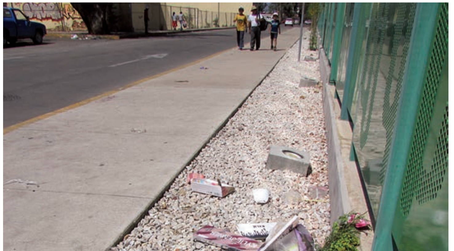
► Los ciudadanos se molestaron por ver las vialidades con basura.

San Pedro vive un clima de paz social y político y hay condiciones para ser visitado INFORMACIÓN 6B