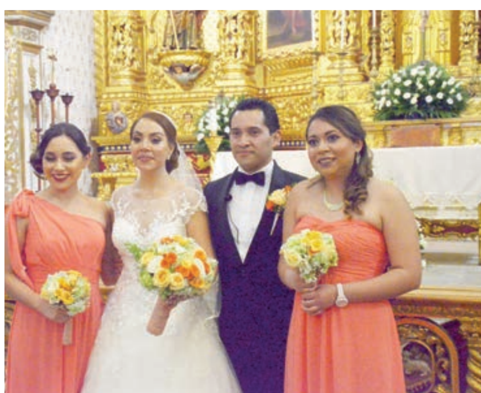
► Sus hermanas los acompañaron en su gran día.