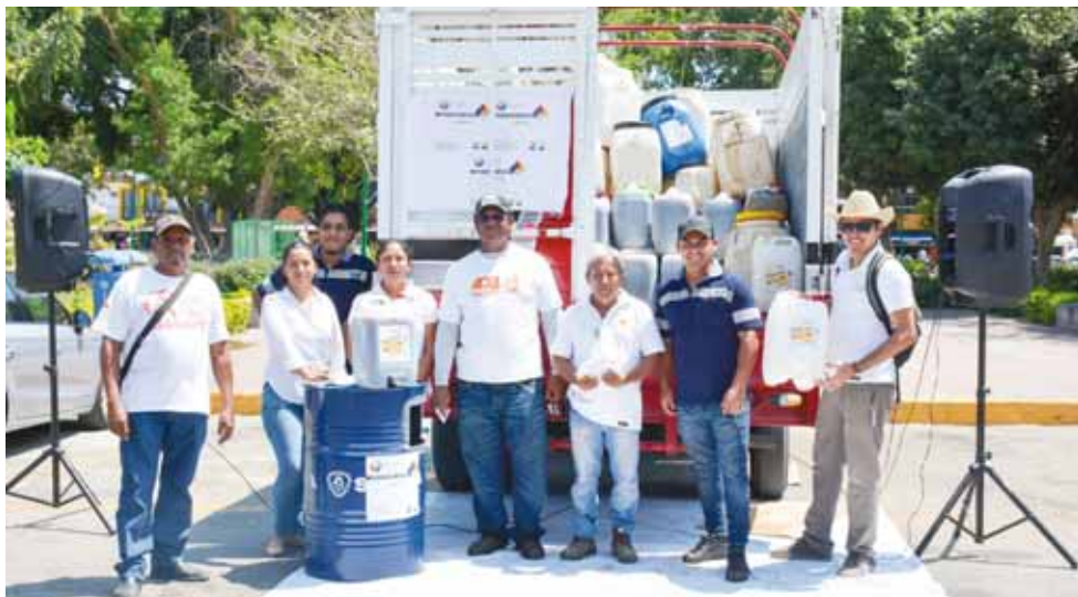
► Cada litro de aceite quemado de cocina que no se recolecta, contamina más de mil litros de agua.