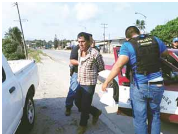
► El hombre al momento de ser aprehendido.

Los elementos policia-cos ejecutaron la orden de aprehensión en Matías Romero, cuando el ahora detenido viajaba a bordo de un taxi de Chimalapa, por lo que fue consignado a las autoridades correspondientes.