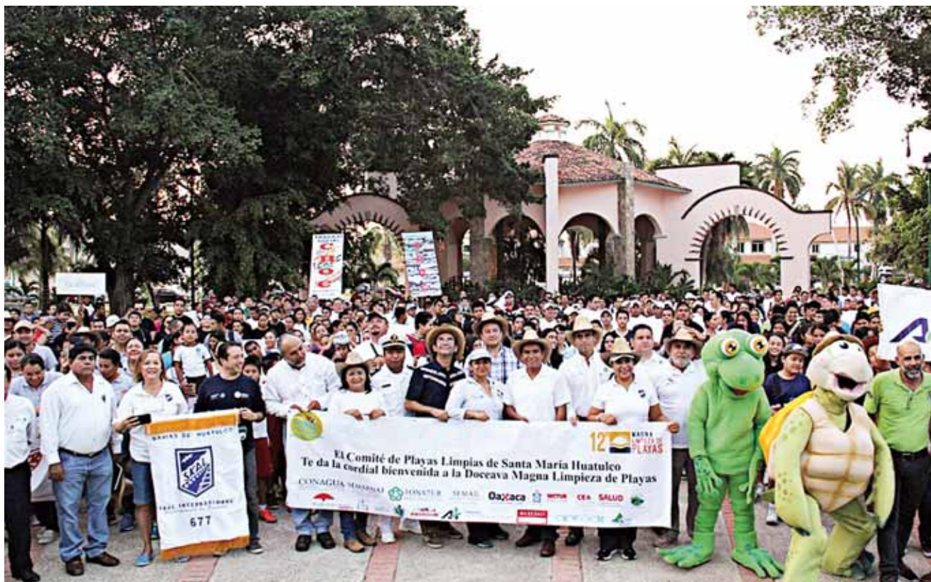
► Más de mil personas se dedicarán a limpiar las 22 playas que comprende Huatulco.

Para esta temporada de Semana Santa se espera la participación de más de 15 instituciones de gobierno y al menos 14 áreas del Ayuntamiento de Santa María Huatulco, con más de 200