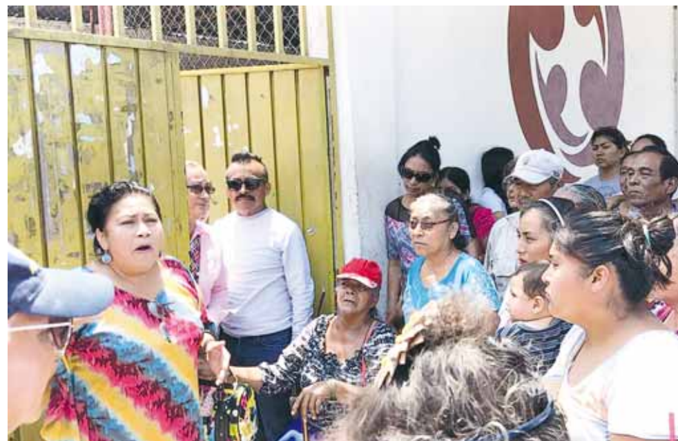
► Desesperados porque no sus casas aún no son censadas.