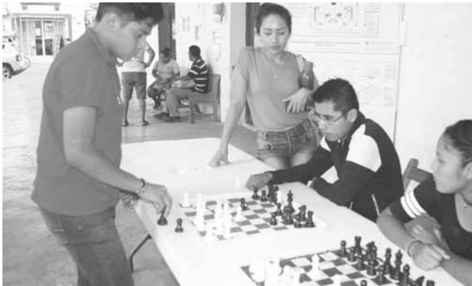
► 3 horas contra 20 adversarios.