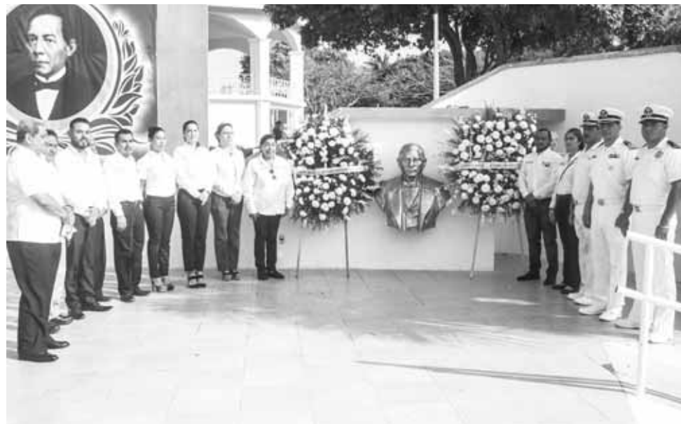
► Se dieron cita miembros de la Logia Masónica, alumnos de diversas escuelas y personal de la Marina Armada de México.