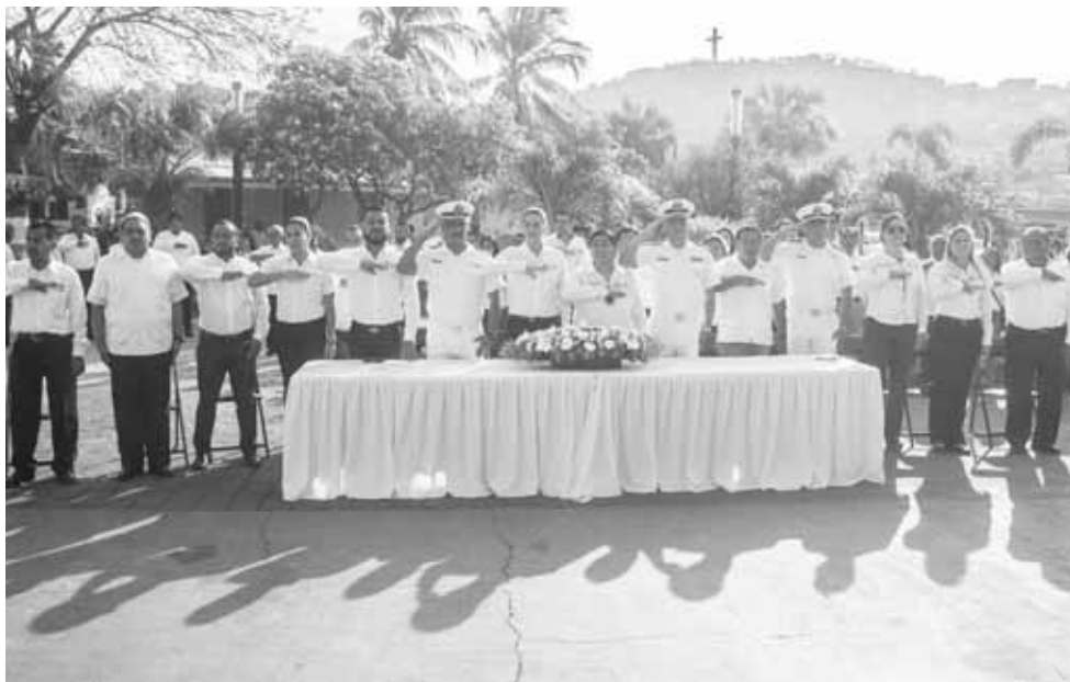
► Durante la ceremonia que se realizó por el benemérito de las Américas, Benito Juárez García.