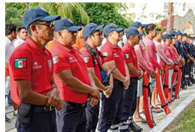
► El cuerpo de policías y rescatistas que estarán ayudando al turismo en Semana Santa.

colaboradores; integrantes de la Asociación de Hoteles y Moteles, entre otras asociaciones civiles.