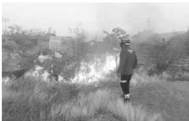
► Las llamas fueron sofocadas por Protección Civil.

totalidad el fuego y así evitar que se propagara a las viviendas y la tortillería.