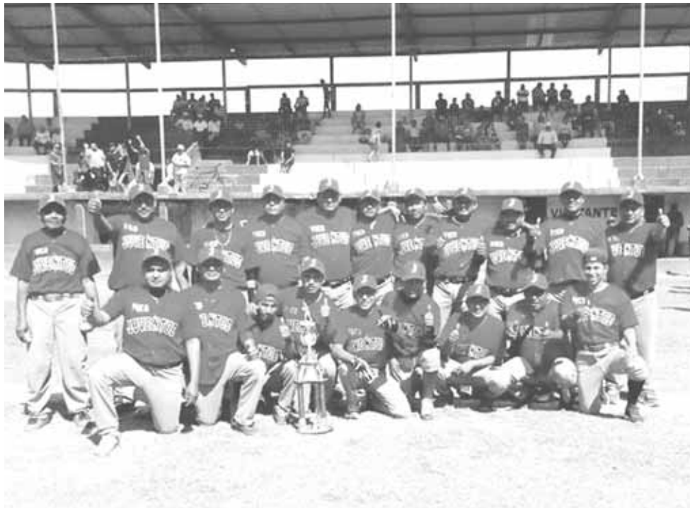
► Juventud va por el refrendo.

Dentro de lo que fue la jornada 1 este pasado domingo 18 de marzo en todos los frentes se dieron los siguientes resultados: Juventud 8-7 Azules; 5 de Mayo 0-9 Tomateros; Piratas 17-16 Alacranes; Tierra Blanca 15-2 Cachorros; Cardenales 3-17 Pericos; Venados 14-4 Mixtequilla; 3 de Mayo vs Dolores quedó pendiente y descansó el