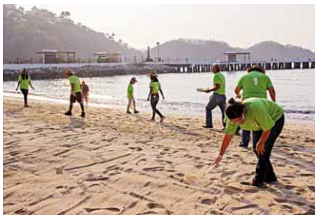
► Las brigadas liberarán de basura cada una de las playas que son visitadas por los turistas.