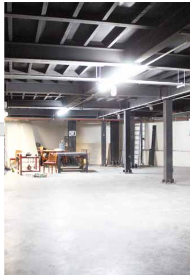
► El sótano sería utilizado para proyecciones, teatro experimental y diálogos.

“En determinado momento, hacer un modelo de gestión para captar recursos para ayudar al teatro, que nos permita