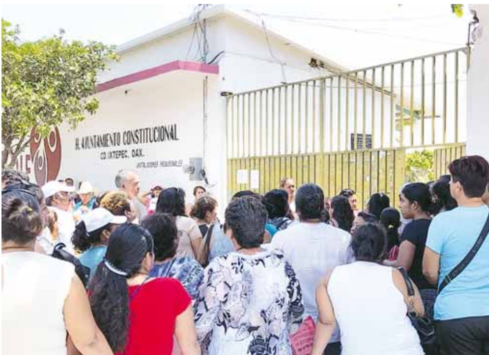
► Aseguran que hay injusticia de parte del gobierno federal.