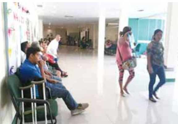
► Hay personas que se la pasan todo el día para que los atiendan.