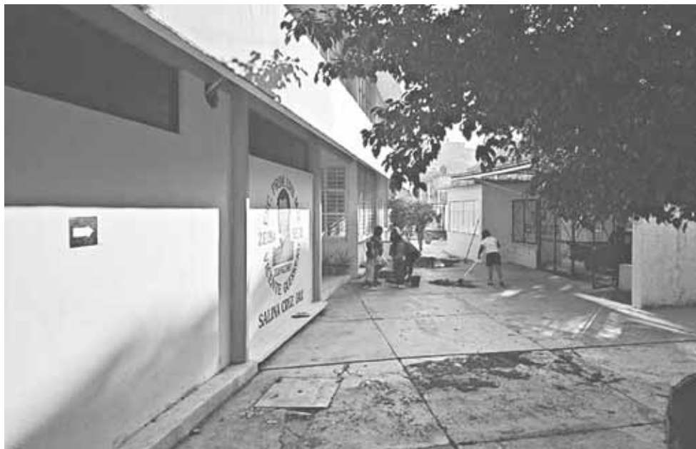
► Explicaron que de manera constante han tocado puertas para obtener apoyo.