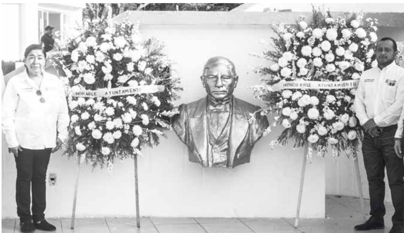
► Síndicos y regidores se trasladaron al busto de Benito Juárez, que se sitúa en el barrio Juárez.