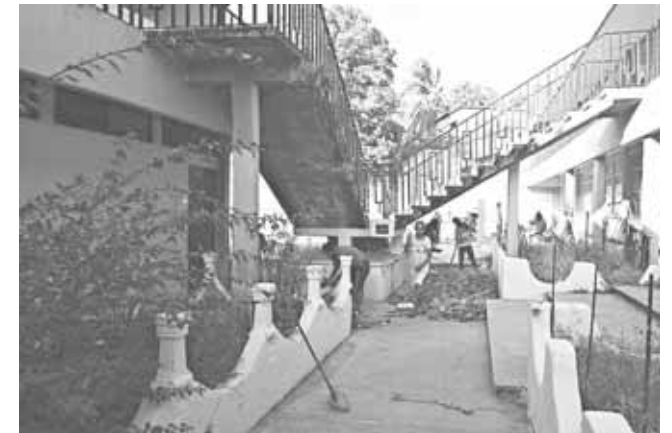
► Quieren saber si el inmueble se puede seguir ocupando.

Dijo que desde hace más de cuatro meses se presentó un documento a la auto-