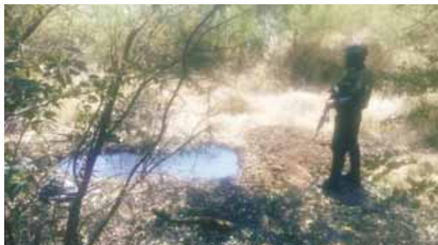
► Durante el operativo que realizó el Ejército Mexicano.

Pero al localizarlos desencadenó una balacera entre ambos bandos, sin que se