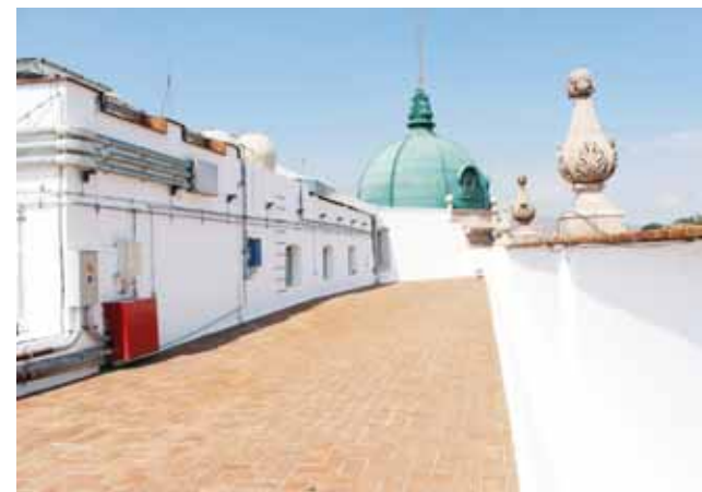
► La azotea tendría un uso para conciertos.

esa figura la Secretaría de Finanzas para darle esas captaciones para el mantenimiento no sólo del sótano, sino del teatro”, refiere.