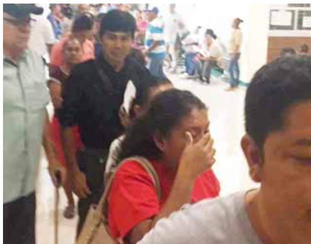
► Largas filas en la sección de farmacia para surtir el medicamento.

visita de forma constante el hospital para su atención médica, por lo que ella casi vive en el nosocomio, porque llega desde la madrugada y se va poco después del mediodía, todo para que sea atendida a buena hora y le surtan de sus medicamentos.