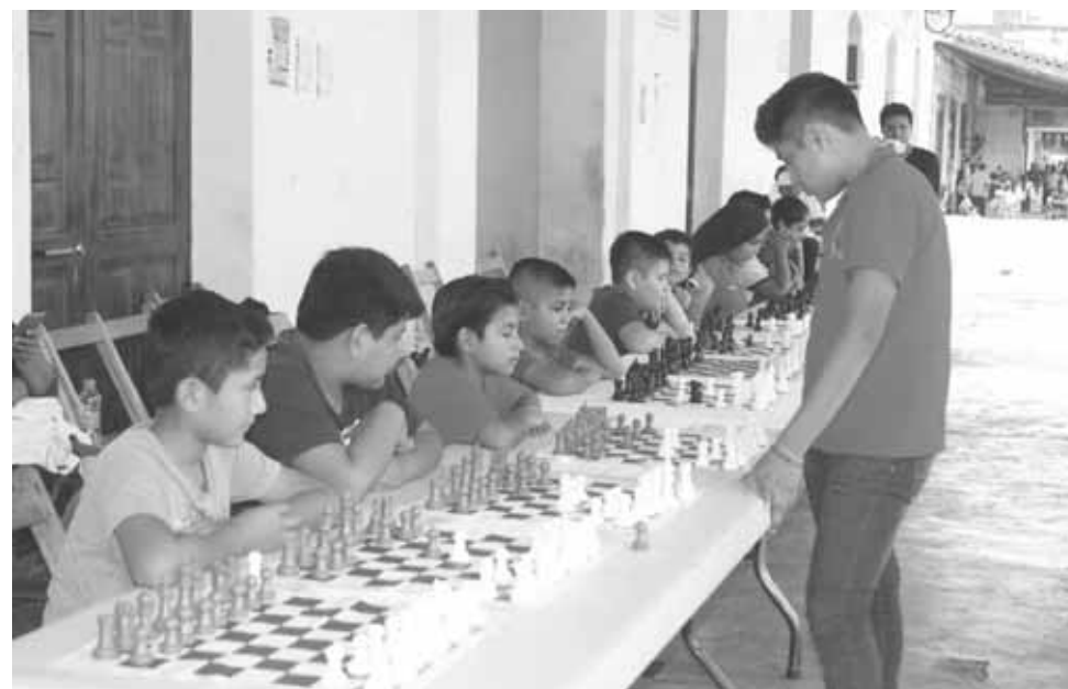
► Jugando con jovencitos de la categoría 2004-2006.