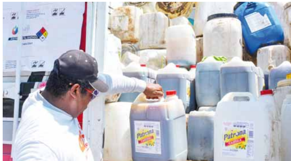
► Se busca que este desecho no termine en el basurero o el mar, y se contribuye con el medio ambiente.