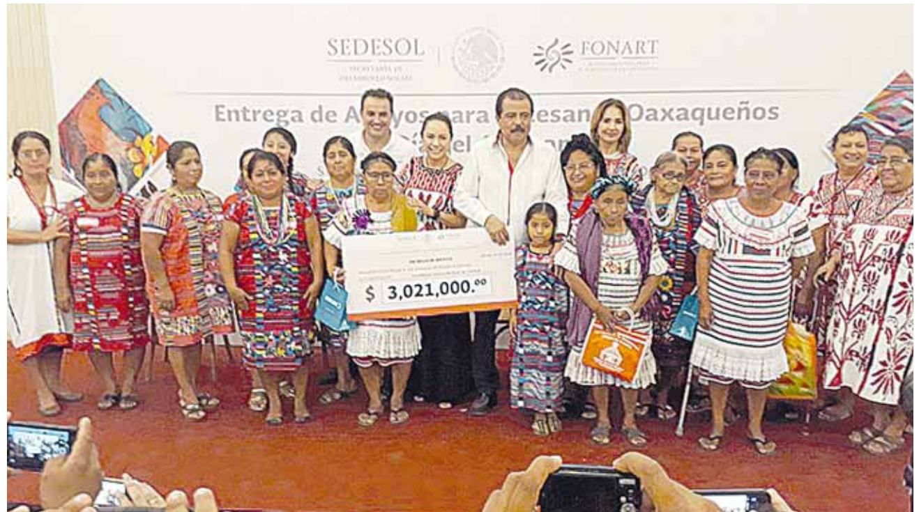
► Las mujeres dedicadas al bordado de textil fueron las más beneficiadas.

Señaló que realizó un ejercicio juntando los tickets de gasto de combustible del mes de febrero que fue de 28 días y acumulando todo lo gastado por turno le dio un total de nueve mil doscientos pesos, otro ejercicio realizado fue que la cuenta es de 270 pesos por 12 horas, le echas 300 pesos de gasolina al taxi haciendo un total de 800 pesos los que tendrían que sacar por turno y eso es bastante difícil.