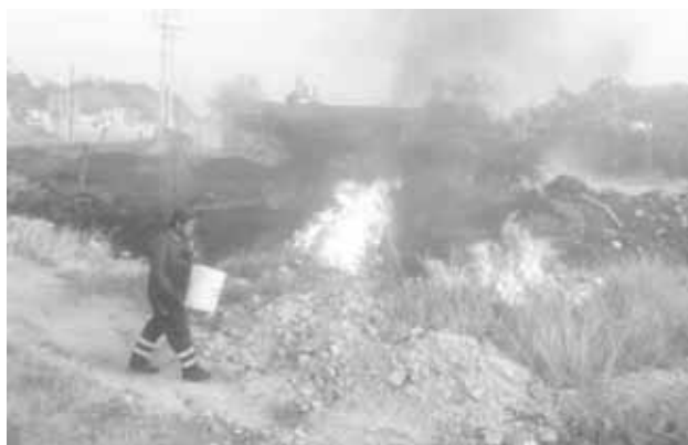
► A pesar de no contar con el equipo suficiente.