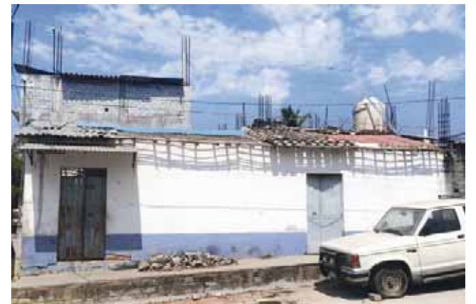
► Las casas lucen devastadas.

que según informó el SSN, sobrepasaron las cuatro mil, las familias han iniciado con la reconstrucción de sus viviendas, ante la lenta respuesta del gobierno federal que ha burocratizado el proceso de revisión de daños en el casco urbano.