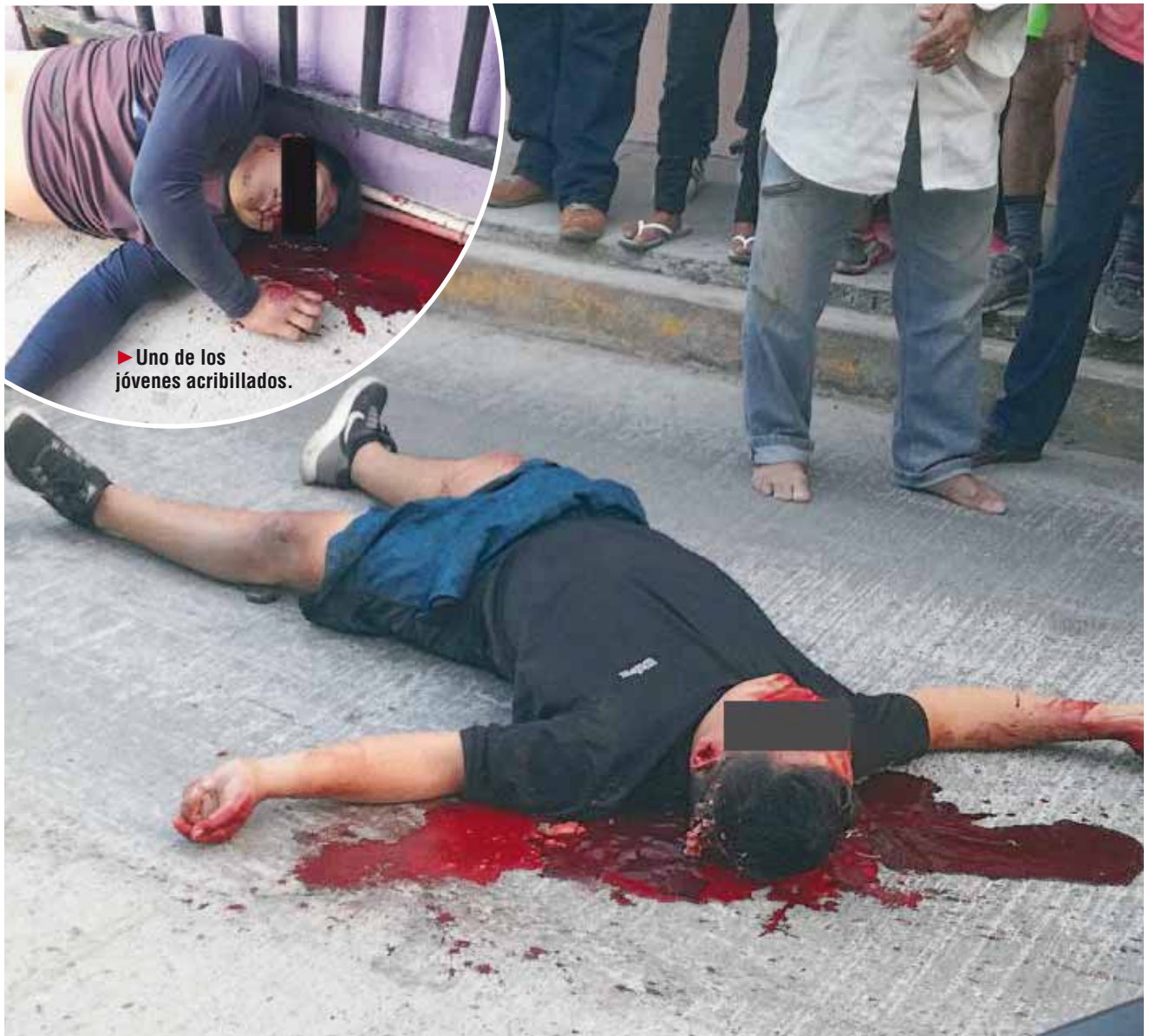
► El cuerpo quedó en medio de la calle, en un charco de sangre.

En este hecho sangriento la policía aseguró varios casquillos percutidos, dos camionetas, una Tacoma y una Grand Cherokee, así como un pasamontañas, entre los ejecutados