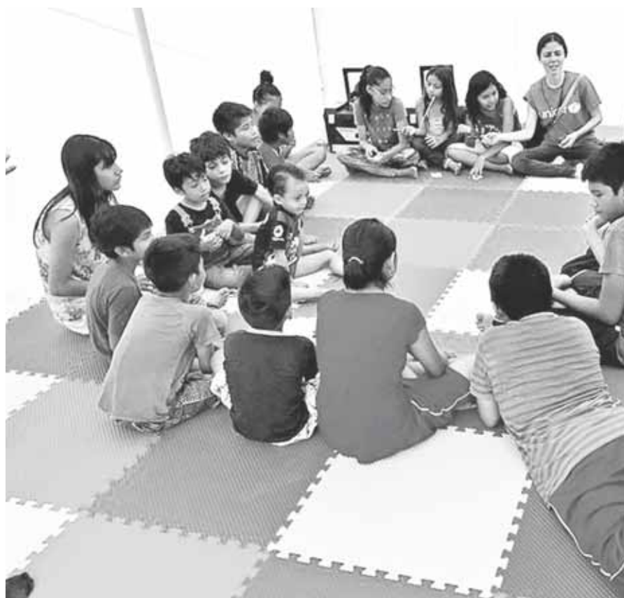
► Los niños recibieron terapia durante el tiempo de la contingencia.

Los talleres se realizarán este domingo 18 de marzo con mujeres embarazadas o con hijos y/o hijas menores de 6 años (solas o con sus bebés), de 10:00