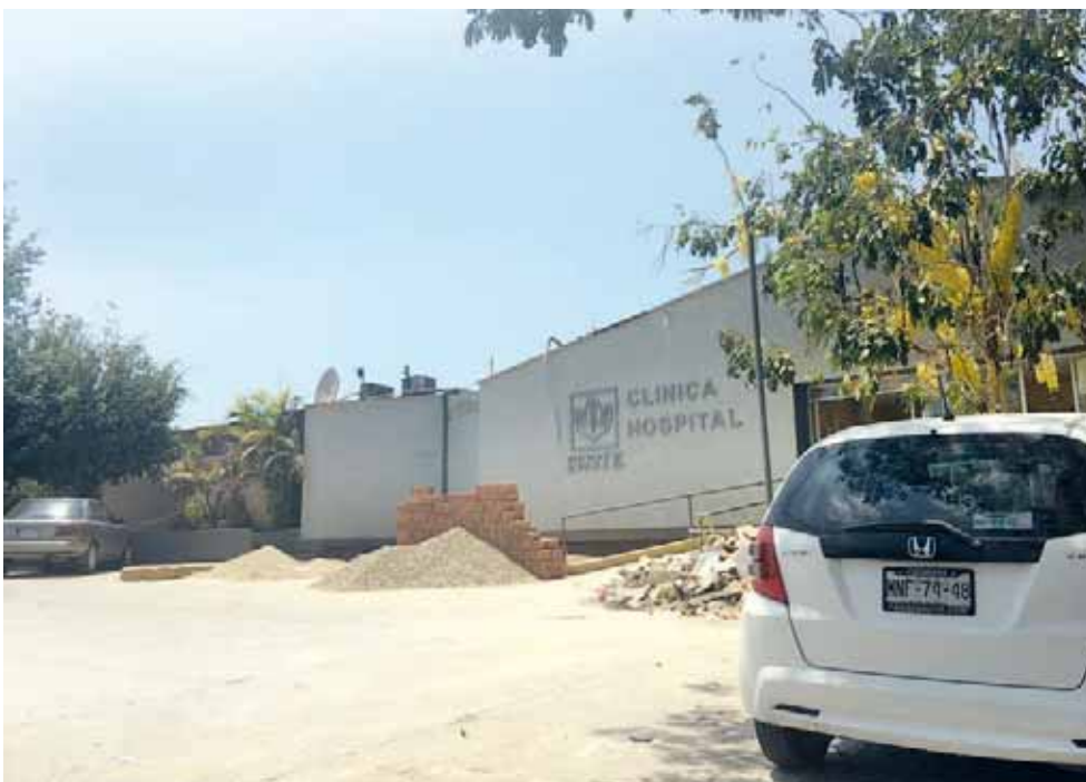
► El hospital sigue en reconstrucción.