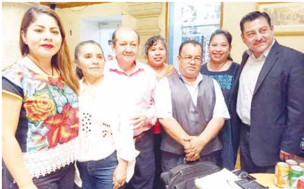
► El director del Grupo Folclórico Universitario y demás miembros de la mesa directiva.

durante las fiestas de Guelaguetza, y que recuerdan el periodo de 1962 a 1980, cuando el grupo representara la Danza de la Pluma y otras en los Lunes del Cerro, además de obras como el Bani Stui Gulal (en que se recreaba el origen y desarrollo de los Lunes del Cerro).