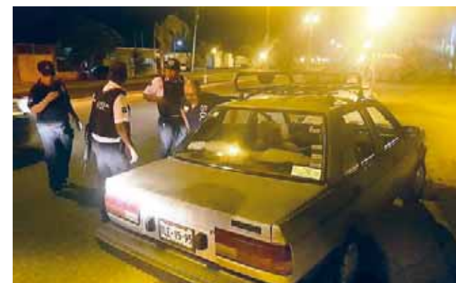
► Al momento en el que fueron arrestados.

el alto y de inmediato le pidieron que descendiera de la unidad de motor para aplicarle el alcoholímetro y corroborar el grado de ebriedad con el que conducía.