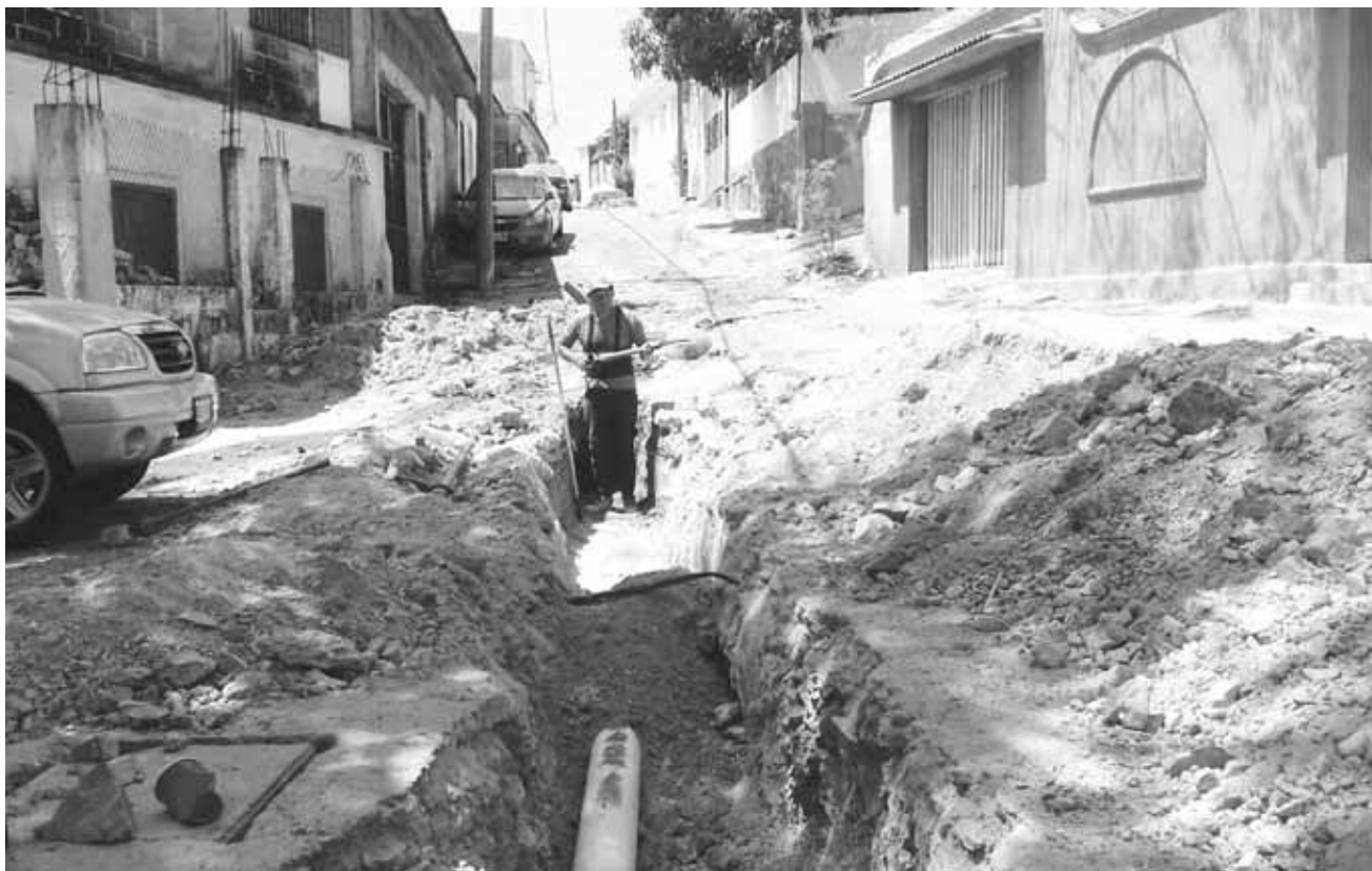
► Los vecinos ya estaban hartos de los fétidos olores que emanaban las aguas.

fue una encomienda del presidente municipal fue que se le diera atención a una demanda de los vecinos y