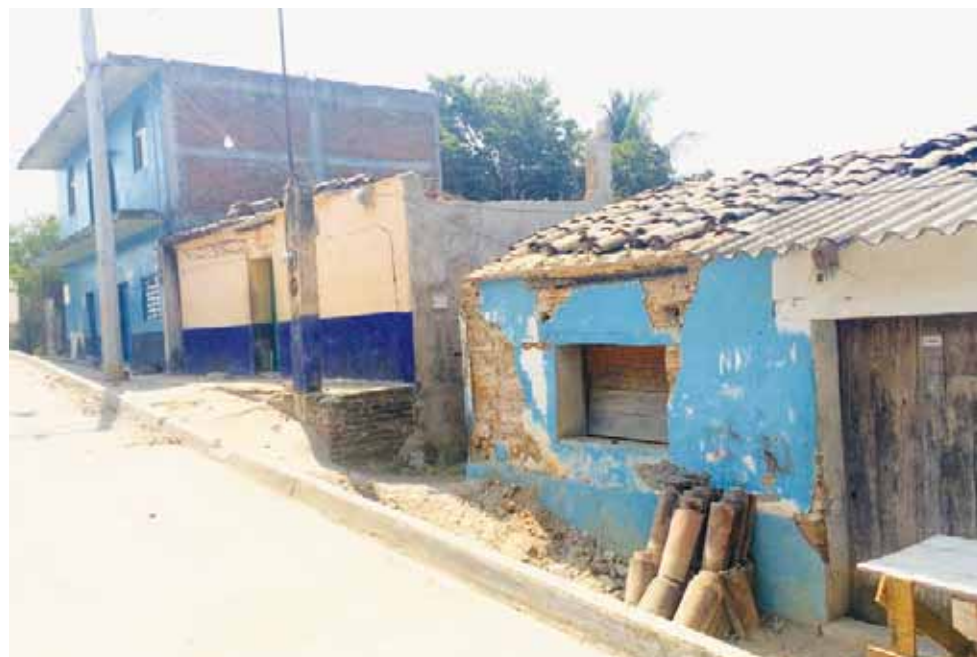
► La vivienda que resultó con severos daños después del temblor con epicentro en Pinotepa Nacional.

las réplicas ocurra una desgracia mayor, “es la única salida que tenemos y temo por mis hijos y nietos que tiene que salir a la calle”, expre-