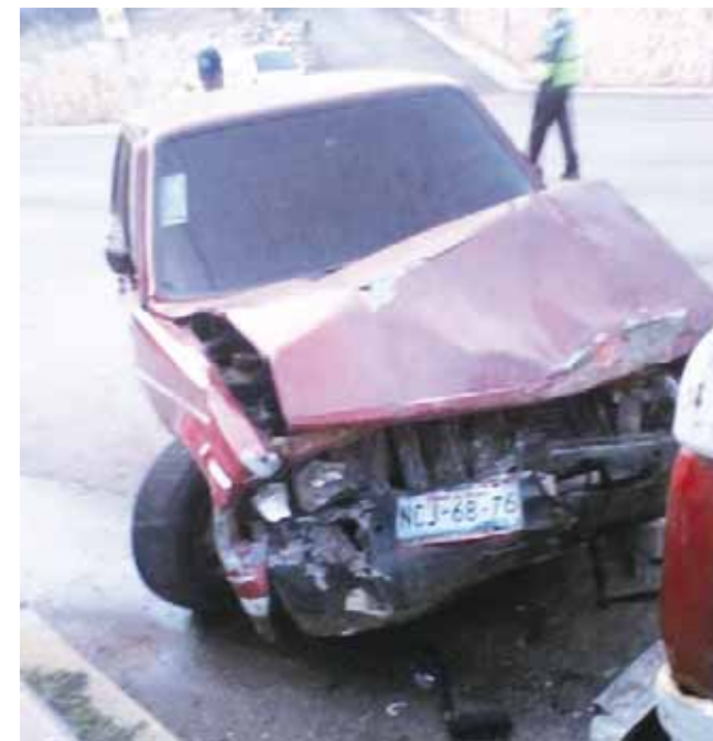
► El conductor quedó detenido tras los hechos.