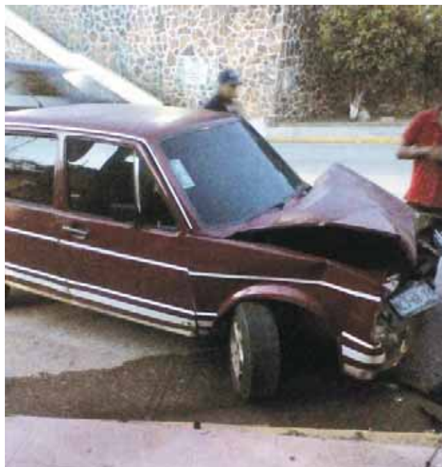
► La unidad quedó reducida a fierros retorcidos.

Por lo que elementos policiacos comenzaron a interrogar al conductor,