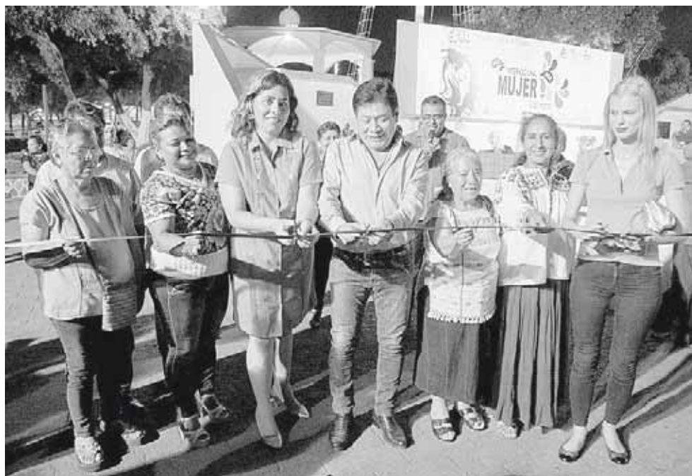
► El presidente municipal de Salina Cruz, Rodolfo León Aragón durante el corte del listón inaugural.