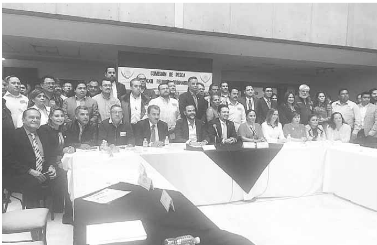
▶ Asistieron técnicos y abogados de la Comisión de Pesca y de la Comisión de Medio Ambiente y Recursos Naturales.

Las modificaciones logradas se espera sean dictaminadas por la Comisión de Medio Ambiente y Recursos Naturales de la Cámara de Diputados, posteriormente a discusión y aprobación del Pleno