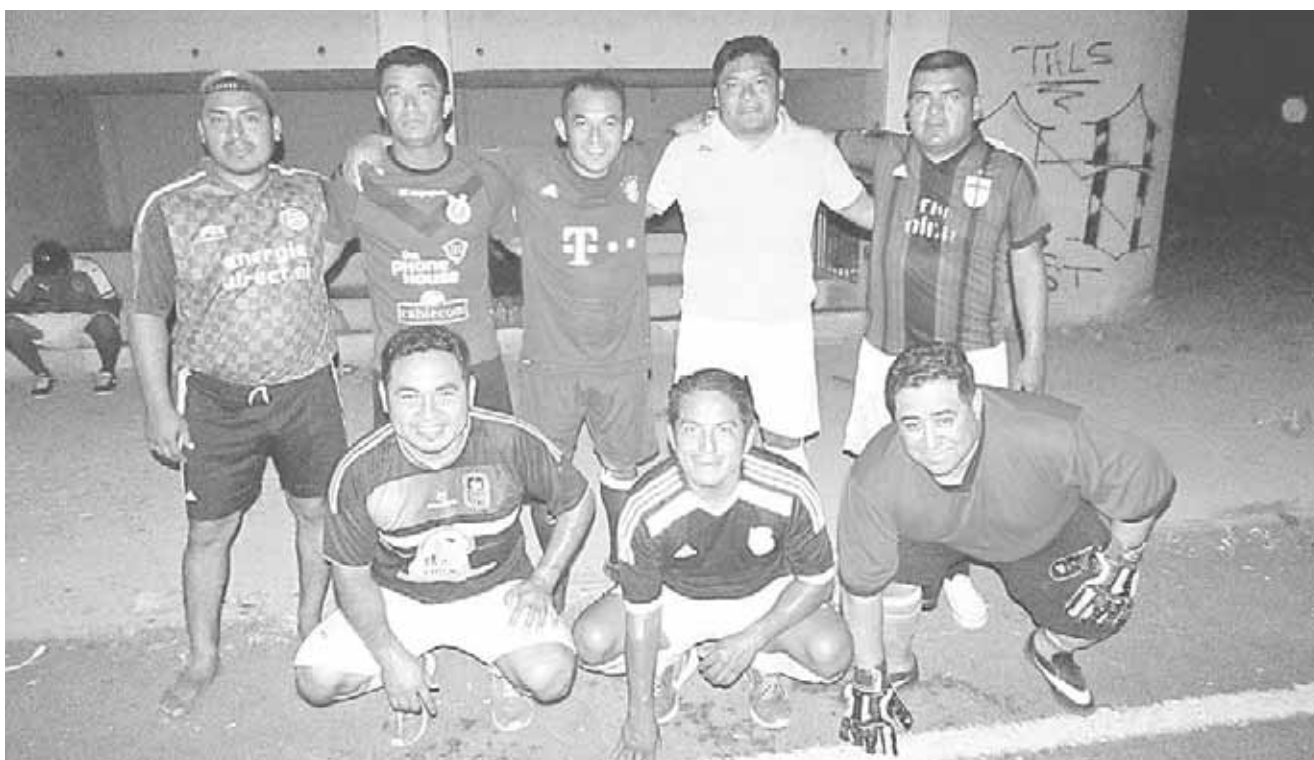
► Soldadura con su 1er triunfo.

Para la parte complementaria, el nivel de juego se emparejó y las acciones se desarrollaron en su mayor parte en la media cancha imponiéndose las zagas