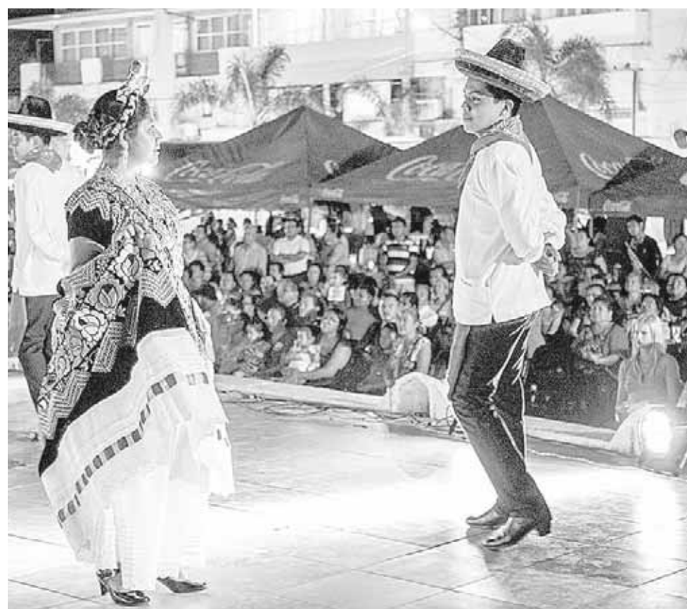
► Participaron jóvenes durante la inauguración del Foro de Empoderamiento.

Puntualizó que es necesario emprender talleres de empoderamiento enfocados a preparar y capacitar a las mujeres para que se desarrollen plenamente en la sociedad y logren el fortalecimiento económico necesario.