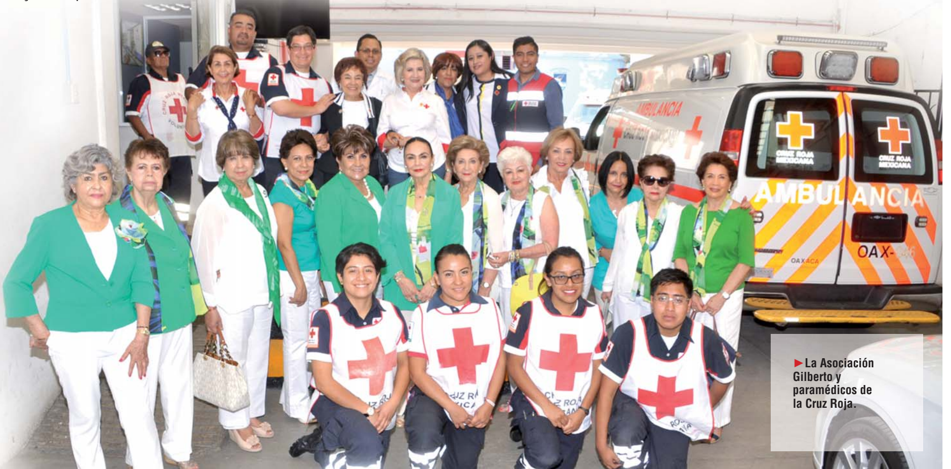
► La Asociación Gilberto y paramédicos de la Cruz Roja.

Esto es por hoy, feliz domingo en familia.