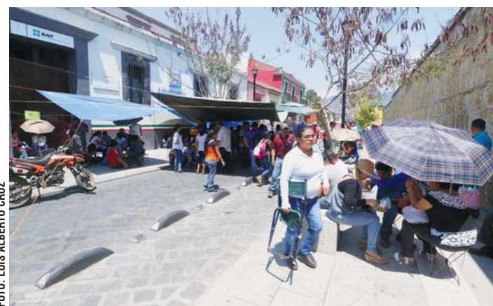
A media semana, los maestros de la sección 22 realizaron acciones de protesta en la capital.

en al menos 3 mil 500 escuelas de Oaxaca, para incorporar en la nómina magisterial los descuentos correspondientes.