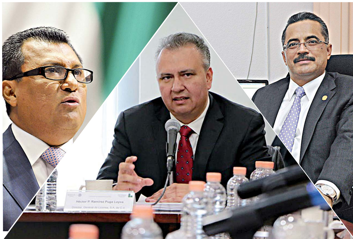
► Como nunca, el proceso electoral 2018, está exhibiendo la decadencia política y los ajustes de cuentas entre partidos.

El proceso democrático mexicano es accidentado por la prevalencia del juego sucio, como ha sido siempre la política mexicana. No gana el mejor para el bien del país, sino el que tiene malas mañas.