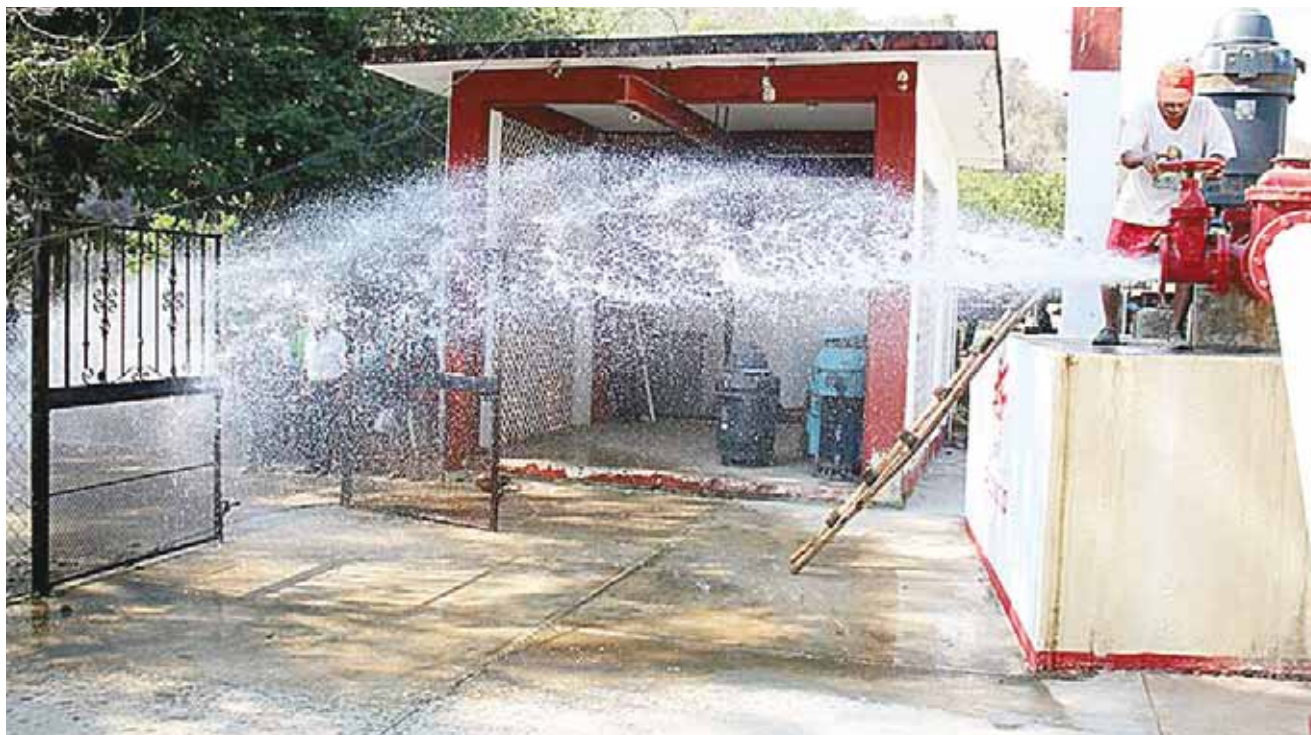
► Buscan crear conciencia del cuidado del agua en Día Internacional del Agua.

Se realizará una plática con representantes y presidentes de barrios y colonias en la que se le otorgará información sobre la situación en la que se encuentra el agua potable en la población, “la situación del agua que traemos de Pluma Hidalgo y Xonene y los ramales de distribución con