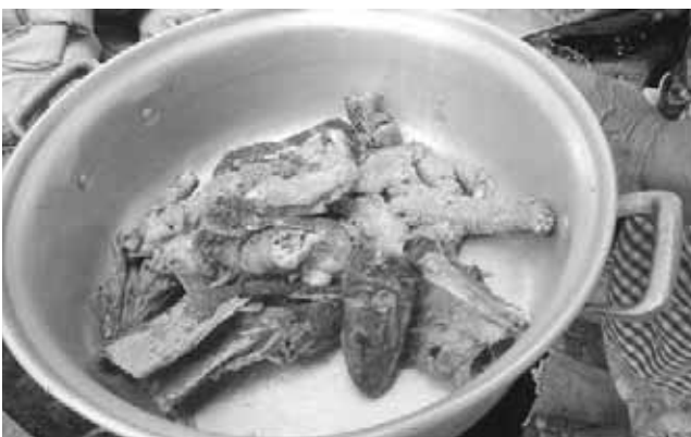
► La iguana se integra al tamal en trozos grandes y cruda.