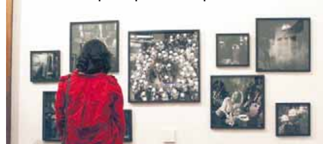
► El certamen espera superar las 358 postulaciones de 2016

Sin embargo, no fue sino hasta 2014 cuando se retomó. Para ello, se creó la primera Bienal de Fotografía Oaxaca. En 2016, junto a la bienal, fue realizado el primer encuentro FotOax,