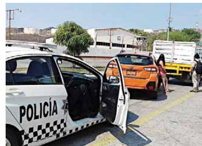
► Después de todo llegaron a un acuerdo.

Por estos hechos, se le requirió a ambos conductores al licencia de conducir, en tanto se ponían de