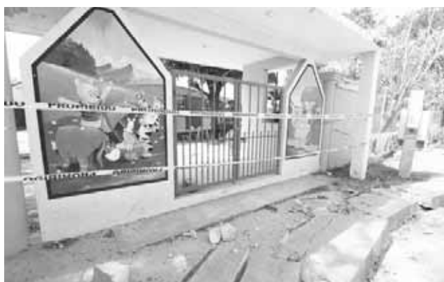
► Algunos daños en escuelas de Pinotepa Nacional.

En el mes de enero, el SSN reportó 2 mil 575 temblores con epicentros den-