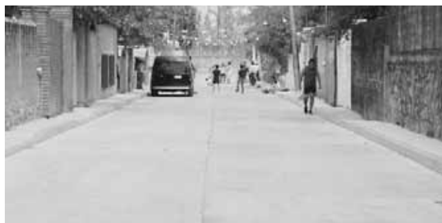
► Se realizó la construcción de 1,609.62 metro cuadrados de pavimento.

transparente de los recursos y su correcta aplicación, ha permitido emprender obras y acciones de impacto, como nunca antes en la historia de Salina Cruz.