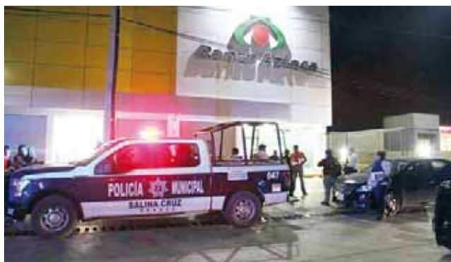
► Cercaron la entrada de la tienda en la que se dio el funesto hecho.

La persona lesionada se encuentra en calidad de detenido para que declare en relación a los hechos ocurridos al interior del establecimiento.