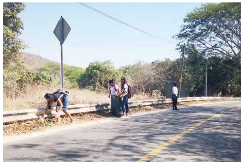
▶ Estudiantes del Instituto Tecnológico de Pochutla y del Centro de Bachillerato Tecnológico Agropecuario.

El objetivo es que los jóvenes participen en la conservación del medio ambiente ayudando con las labores de limpieza de una de las carreteras más importantes.