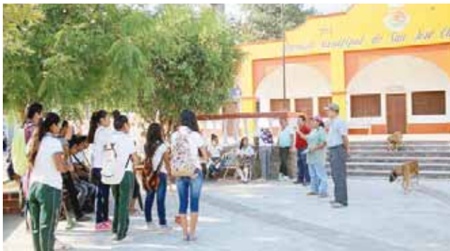
► Explican la importancia de mantener los cuerpos de agua limpios.