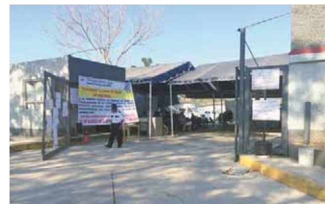
► Están hartos que no cumplan con su pliego petitorio.

Por ello, se han plantado en las instalaciones de la