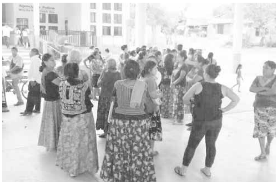
► Las amas de casa exigieron que también censaran sus viviendas.

La retención se dio en la explanada de la agencia de policía de la localidad, donde familias enteras arribaron para presionar a los brigadistas