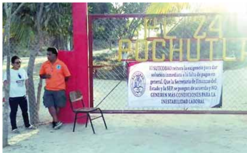
▶ Exigen que se hagan respetar sus derechos.

Dijo que las exigencias son justas, "requeri-