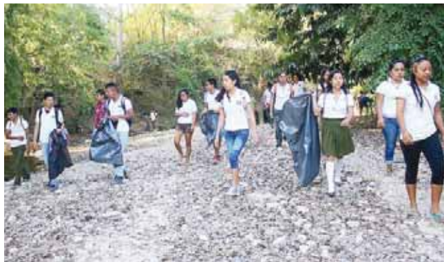
► Se organizaron y por divididos en grupos hicieron las labores.