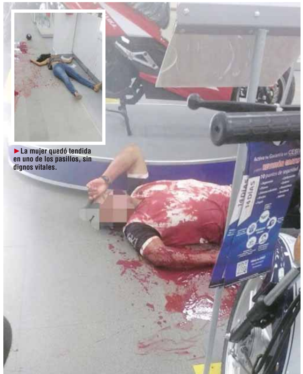
► La mujer quedó tendida en uno de los pasillos, sin dignos vitales.