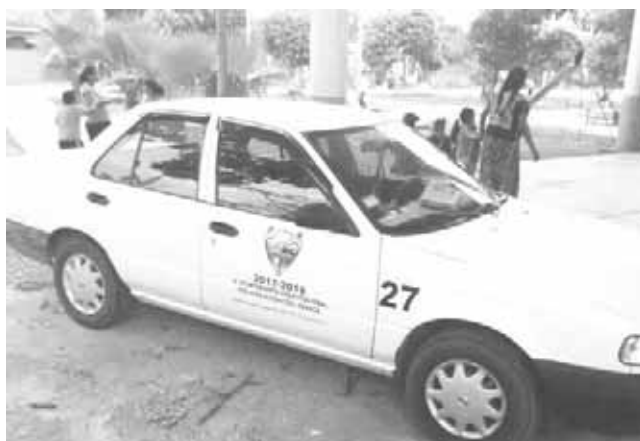
► Empleados del municipio de San Juan Guichicovi, también quedaron retenidos.

ayuntamiento, luego que se les notificara que algunas viviendas que no estaban habitadas y otras en "obra negra" no iban a ser verificadas.