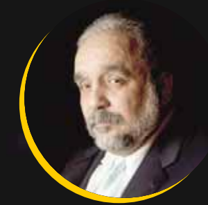
▶ Willie Colón, más inmortal, imposible.