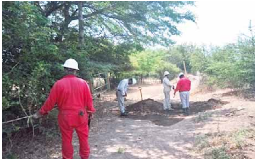
► Llaman a la población en general para que denuncien las tomas clandestinas.

En esta ocasión el personal especializado del Sector Ductos Salina Cruz de Petróleos Mexicanos, controló una fuga de combustible ocasionada por una toma clandestina localizada en el poliducto de Minatitlán-Salina Cruz, ubicado