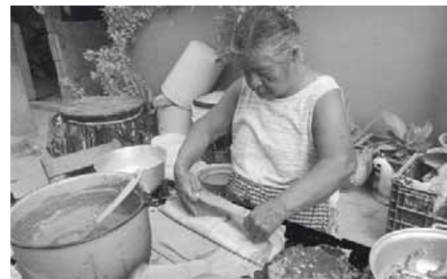
► Las hojas de plátano en las que son envueltos los tamales.