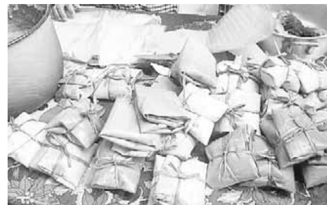
► Los tamales se venden a 25 pesos la pieza, en el parque central de Juchitán.