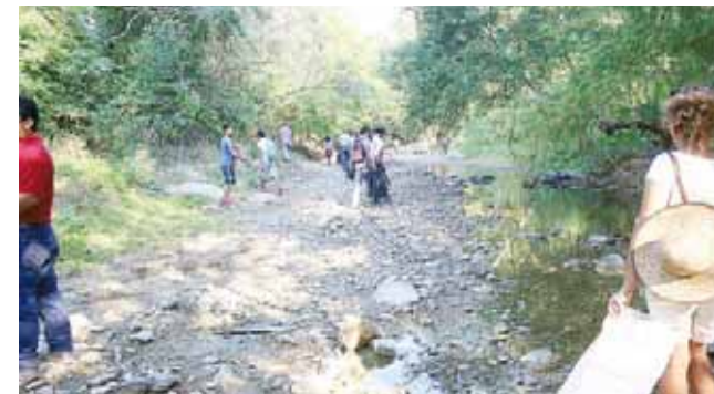
► Involucran a los jóvenes para que participen en las tareas de limpia de ríos.