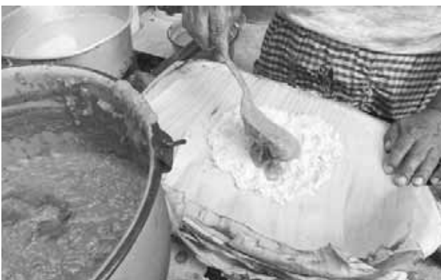
► El mole lleva semilla frita de calabaza, chile, epazote y achiote.