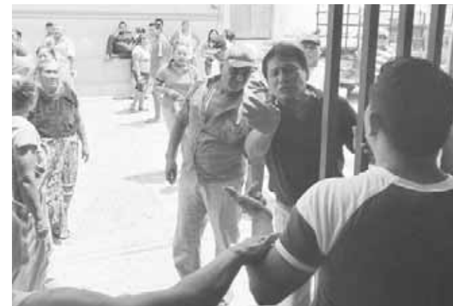
► El grupo de comerciantes inconformes.

Ya que todos los damnificados necesitan apoyo que otorga el gobierno estatal y federal para la reconstrucción de sus casas que resultaron destruidas el pasado septiembre.