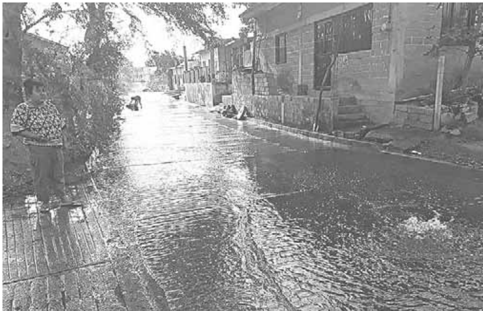
► El agua brota como manantial; exigen que se haga algo para solucionar el problema.

prioridad para atender el drenaje en este momento.