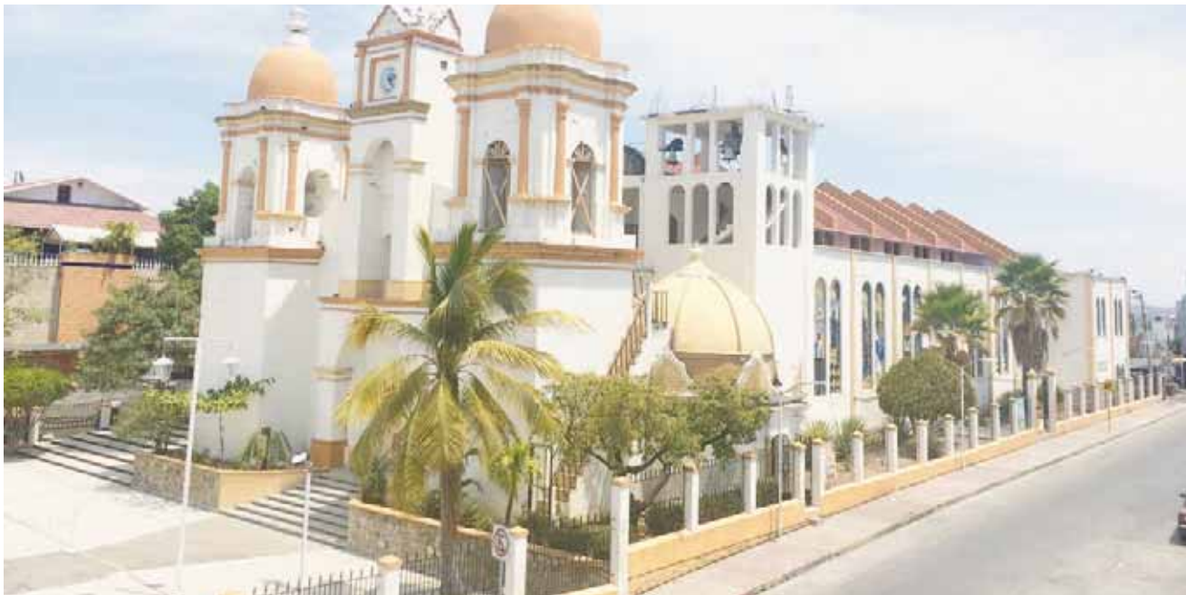
► La iglesia de la población ya tiene daños que impide que se celebren misas para los feligreses.

Otro sismo de 5.3 grados se registró a las 11:46 de la mañana con epicentro a 88 kilómetros de Pinotepa Nacional.