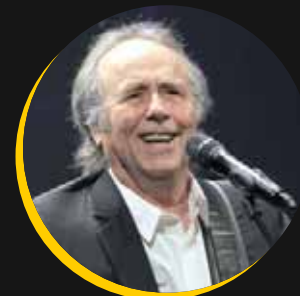
▶ Joan Manuel Serrat también fue nominado.