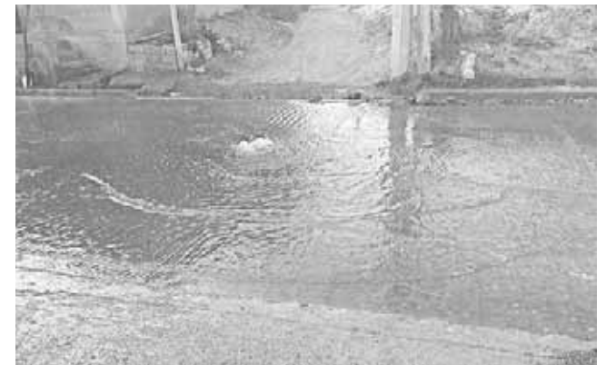
► Los fétidos olores que emanan son un foco de infección para los colonos.

Señaló que ante esta situación decidieron cerrar el acceso de los vehículos por el vado y el Callejón Negrete, pues con la circulación de los coches el olor de las aguas negras llega a los hogares.