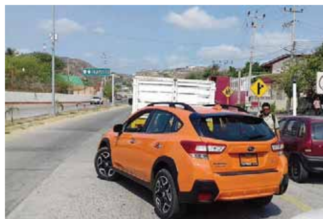
► Las unidades involucradas en los hechos.