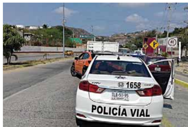
► La policía llegó al lugar para servir de mediador.