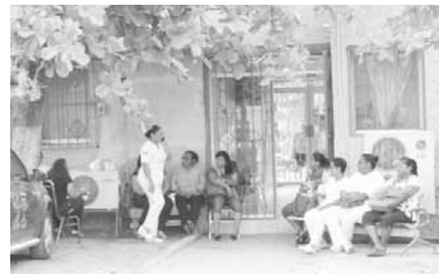
► Demandan pago de los vales de despensa de diciembre del 2017.

Finalmente dijo que solo en esta ocasión es por 12 horas el paro laboral, pero