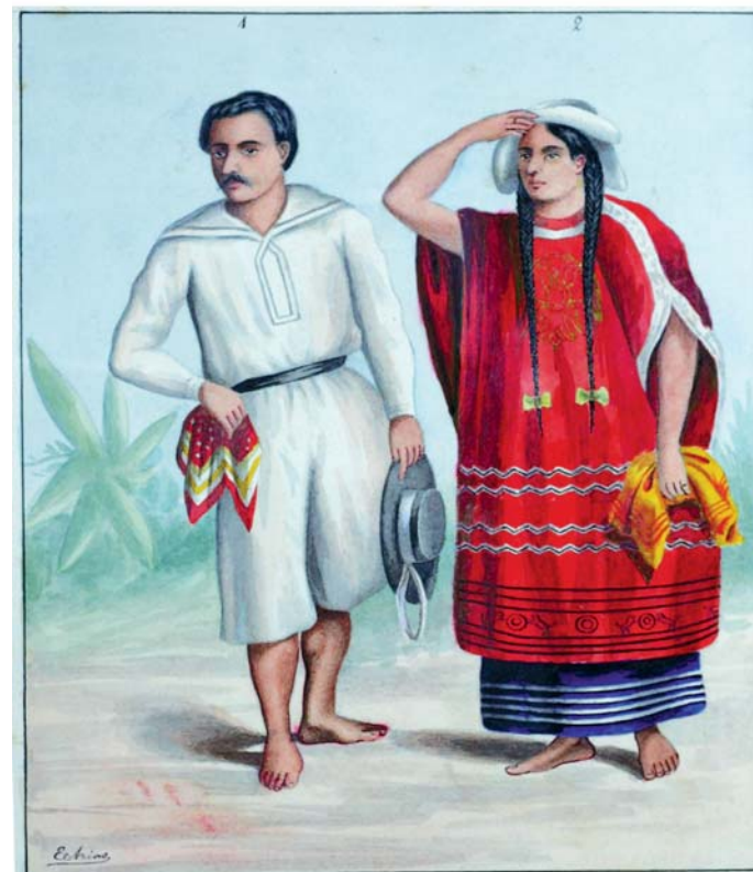
Civilización Cuicateca. Yndios de Teutila. Distrito de Cuicatlan.