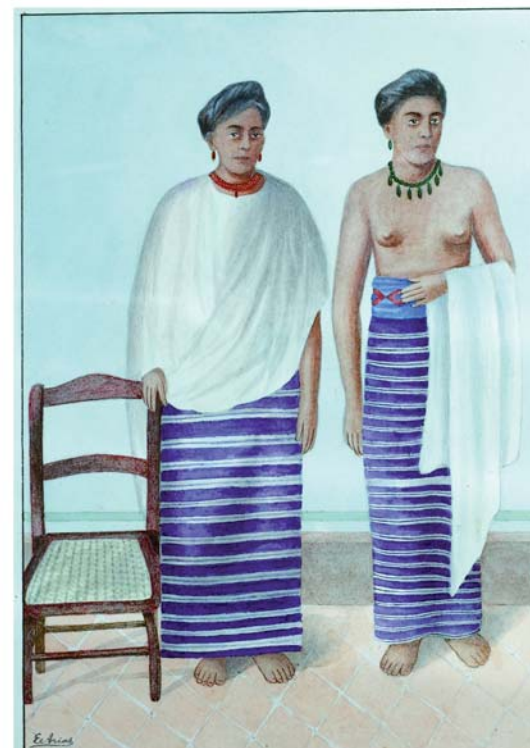
Civilización Mixteca. Yndias de Pinotepa, Distrito de Jamiltepec.