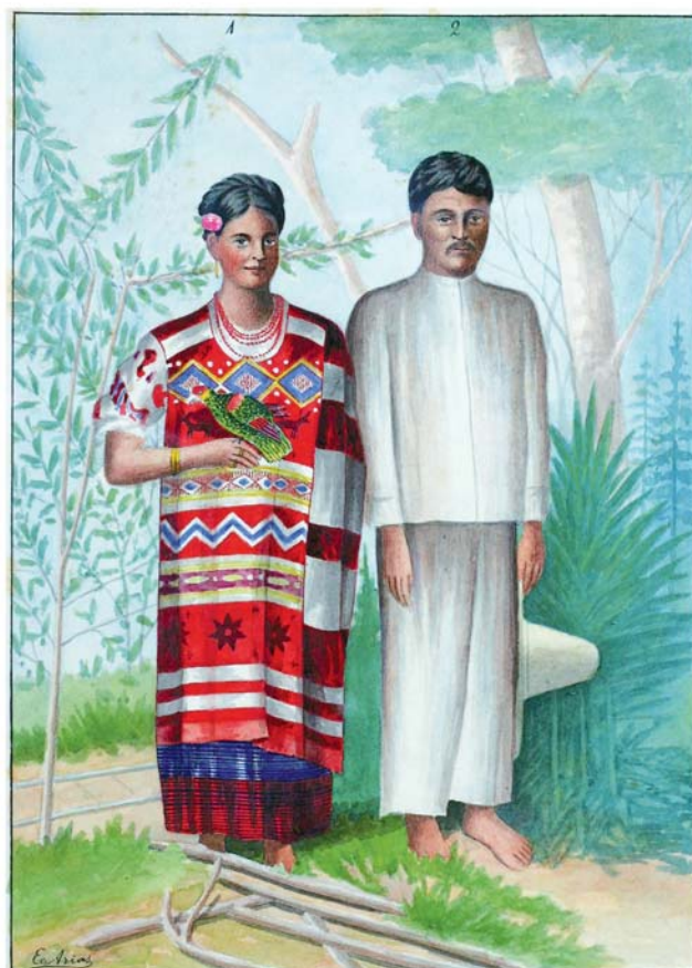
Civilización Chinanteca. Yndios del pueb. de Usila. Distrito de Huautlapec.