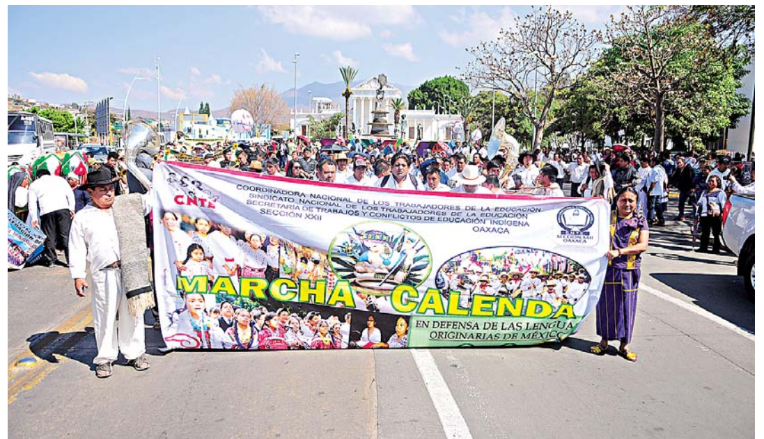
► Buscan equipamiento a fin de mejorar la educación bilingüe.

En contra parte, este gremio propone el Plan para la Trans-