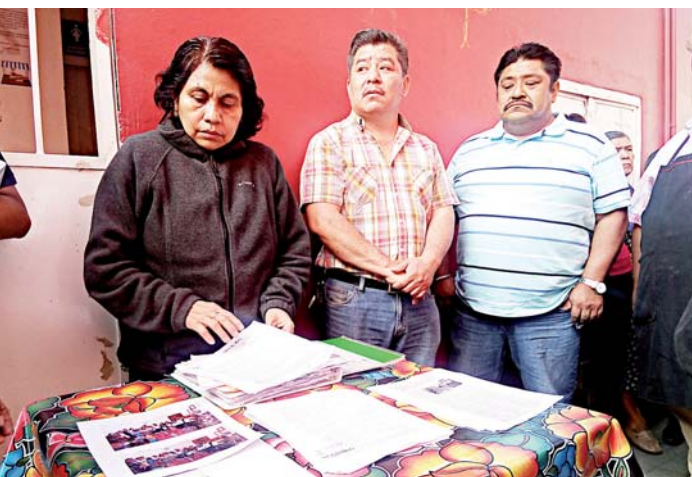
► La dirigente, acompañada por líderes de organizaciones de mercaderes.

El IEEPO aporta 28 pesos diarios por alumno para alimentación a este semillero de músicos INFORMACIÓN 8B