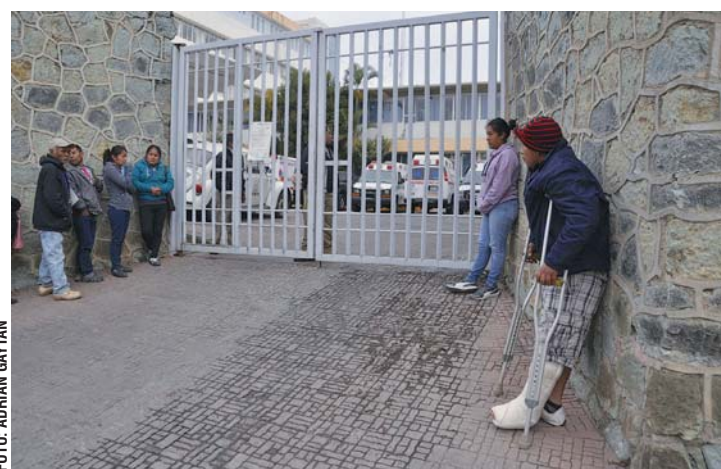
Trabajadores sindicalizados del Hospital Civil mantienen el paro parcial de actividades afectando a miles de usuarios.

debido a la protesta de los trabajadores quienes piden se les garantice la contratación de 140 trabajadores bajo la figura de eventuales, así como el pago a terceros institucionales y no institucionales.