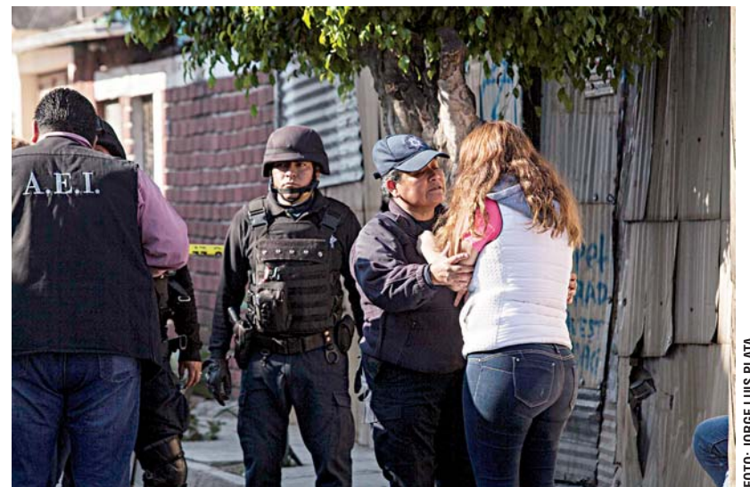
► Dos testigos sufren de crisis nerviosas.

hombres descienden de una camioneta y atacan