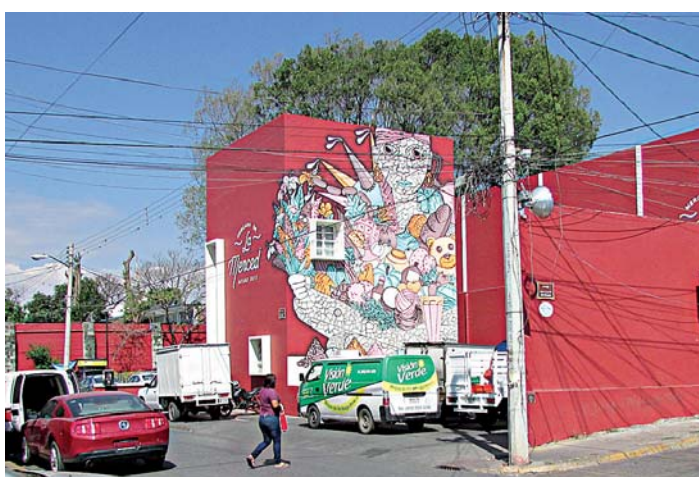
► Panorámica del Mercado de la Merced.