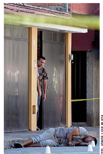
► Vecinos de la calle Sabinos, de la colonia Candiani, presenciaron el crimen.