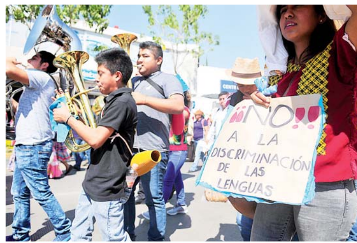
► Conmemoraron el Día de la Lengua Materna.

formación de la Educación de Oaxaca (PTEO) a fin de mejorar la enseñanza en el nivel básico.