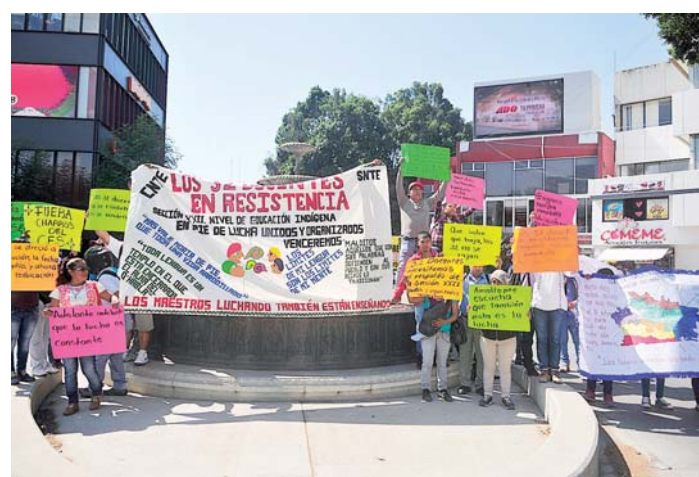
► Se instalaron en ayuno para pedir la contratación de docentes.

Mientras tanto, los docentes en ayuno, analizan el sumarse a una huelga de hambre. En su jornada de protesta han organizado marchas, bloqueo de calles, así como toma de oficinas.