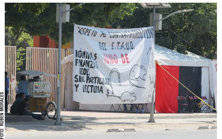
Integrantes del STAUO mantienen las banderas rojinegras en la Universidad.