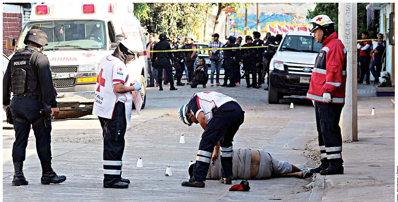
► Paramédicos de Cruz Roja intentan reanimar a la víctima.