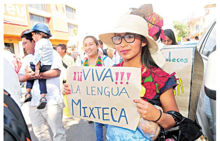
► No permitirán que personal externo los evalúe.