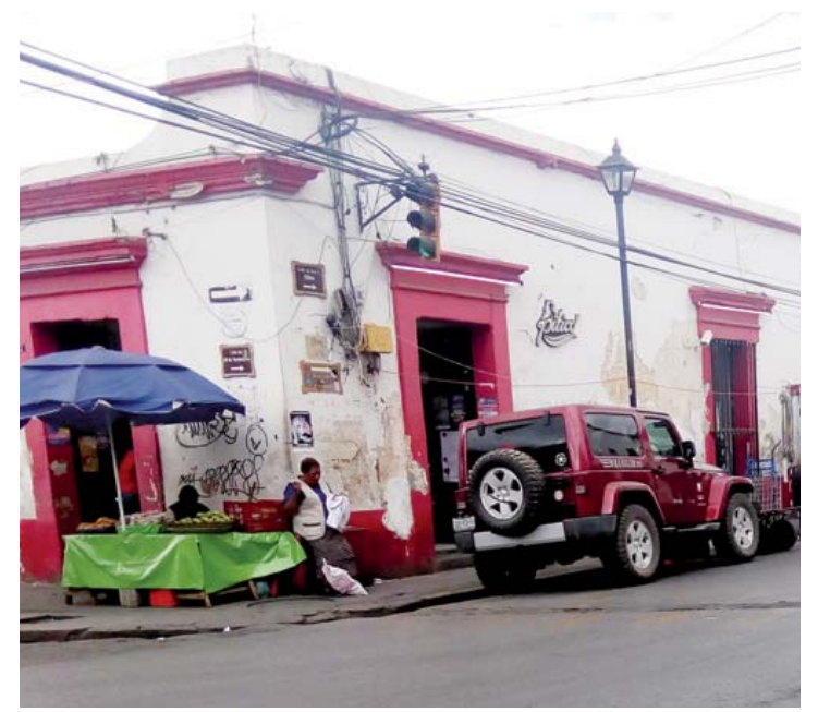
La calle de Mina esquina con 20 de Noviembre es donde más robos se suscita.

Para el 23 de abril estará visitando la agencia de San Luis Beltrán; el 6 de abril, San Martín Mexicápan; para el 13 de abril, en Santa Rosa Panzacola; y el 20 de abril en Trinidad de Viguera.