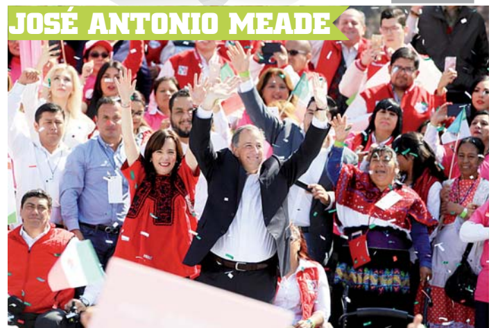
► “Existe enojo por la corrupción”, afirma José Antonio Meade.