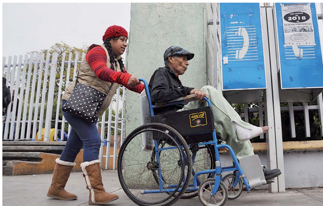
► La práctica de la dicotomía en el sector salud afecta más a los familiares de pacientes de escasos recursos, al pagar más por los servicios médicos.

Las partes involucradas, obtienen ganancias entre un 10 y 20 por ciento, así como obsequios y descuentos para atenciones personales. También está de por medio la entre-