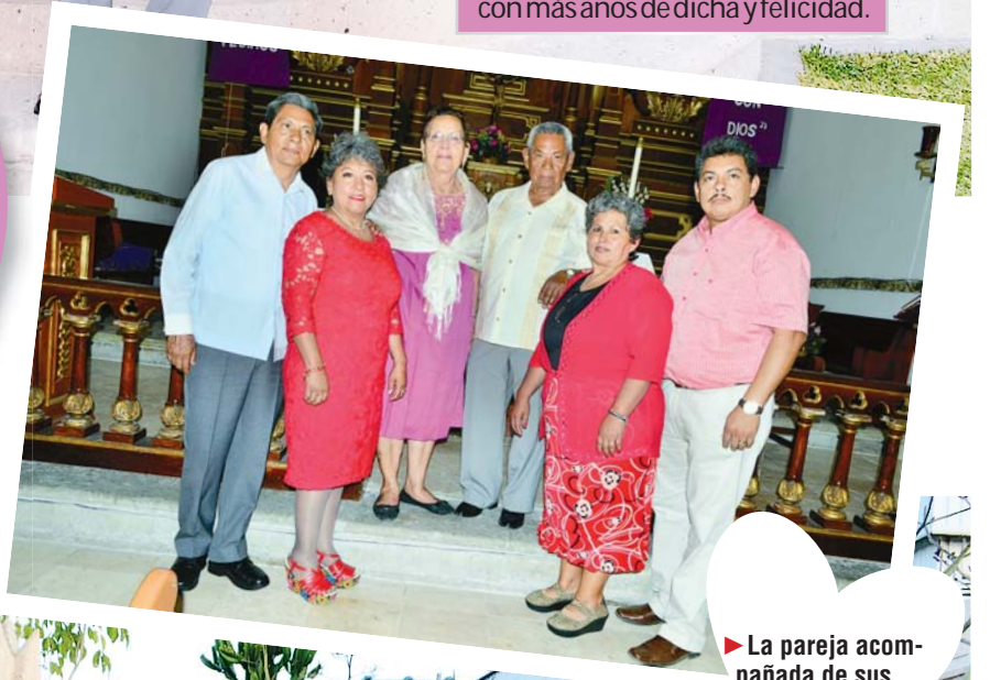
► La pareja acompañada de sus hijos.