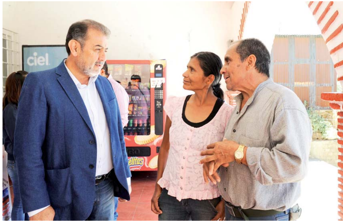
Brindarán asesoría a la ciudadanía en temas de construcción y lineamientos.

"Muchas veces las personas mayores le quieren dar a sus hijos una parte de su terreno o