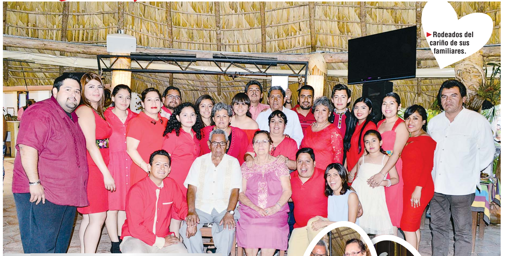
► Rodeados del cariño de sus familiares.

Una vez escuché una polémica en la que se discutía si la cuestión fundamental era ocuparse de crear un mundo mejor para nuestros hijos o educar mejores hijos para el mundo. En el caso apremiante de la vaquita marina creo que nuestro deber es crear sin demora la voluntad y las condiciones para preservarla, al mismo tiempo que educamos a nuestros hijos sobre la responsabilidad de respetar a todas las criaturas que comparten este planeta con nosotros. Como puedes ver, este llamado es urgente.