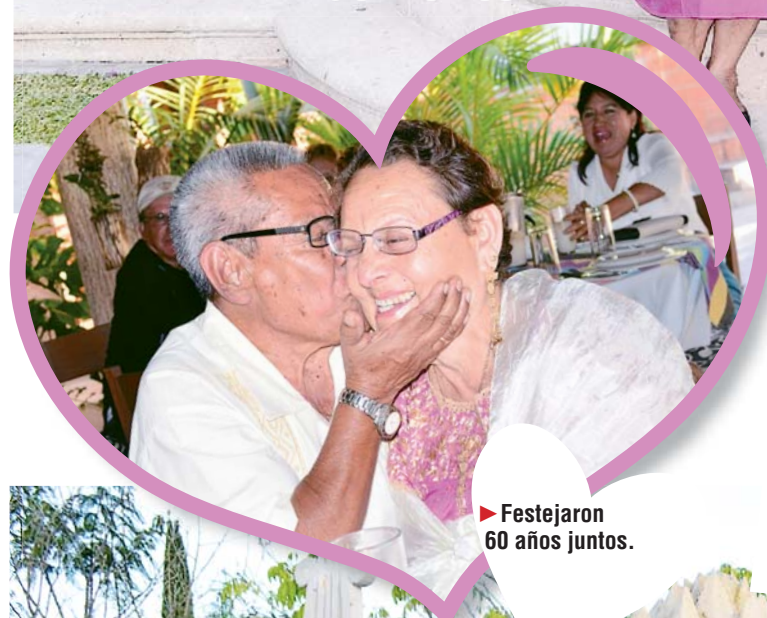
► Festejaron 60 años juntos.

Los acompañaron amigos y familiares, algunos procedentes de la Ciudad de México