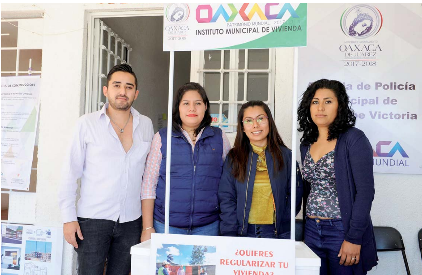
Los módulos de atención visitarán las 13 agencias de la capital, a partir del 23 de febrero.

La mayoría de los comerciantes presume que existe cierto contubernio entre elementos de la policía y los delincuentes, porque extrañamente casi no se ven y cuando se les solicita su presencia llegan a la hora, por lo que no descartaron en organizarse para protegerse en contra de estos sujetos que vienen haciendo de las suyas.