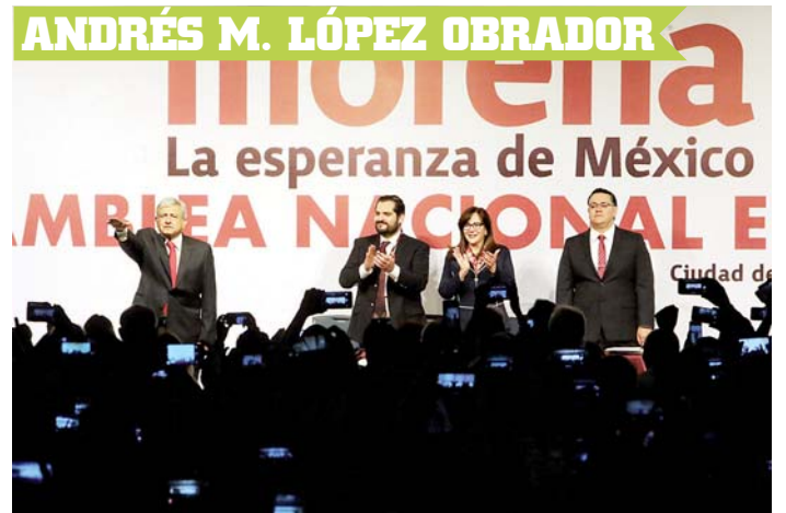
► “Soy terco, es de dominio público”, dice López Obrador.