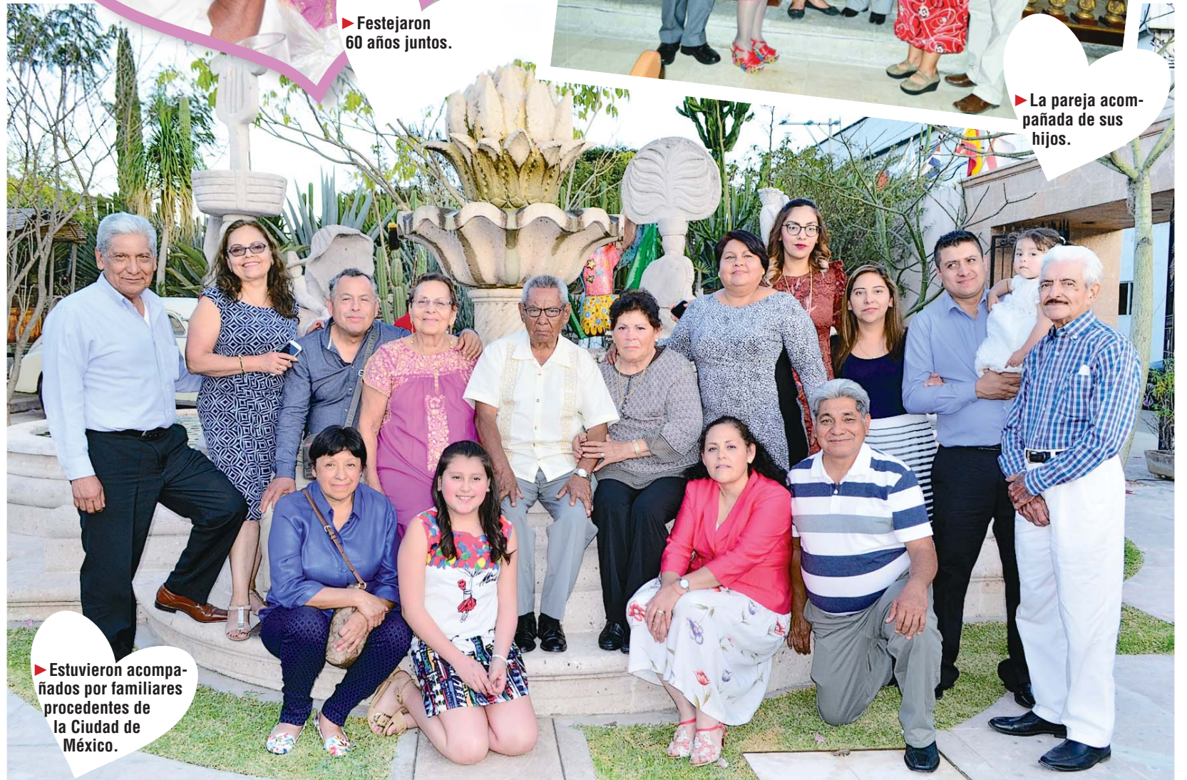
► Estuvieron acompañados por familiares procedentes de la Ciudad de México.