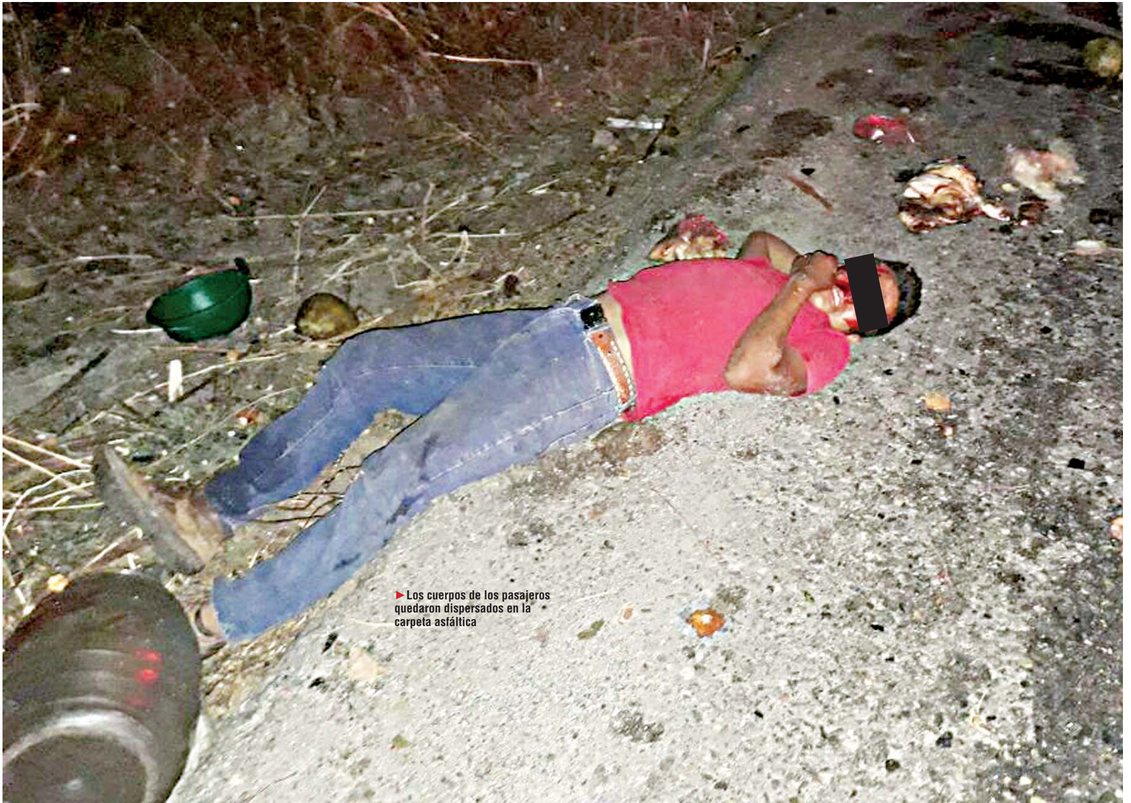
► Los cuerpos de los pasajeros quedaron dispersados en la carpeta asfáltica

policiaca@imparcialenlinea.com / Teléfono 501 83 00 Ext. 3176