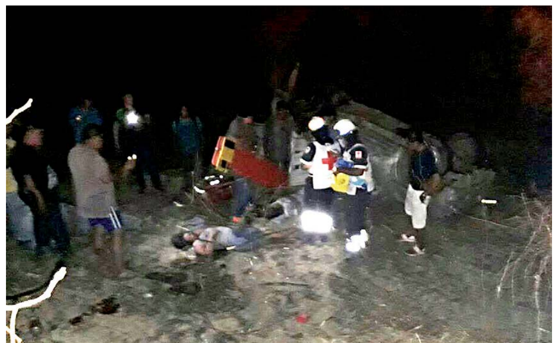
► Elementos de la Cruz Roja auxiliaron a los lesionados en el accidente.