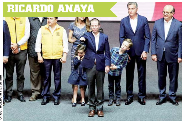
► “A mí no me van a doblar”, advierte Ricardo Anaya.