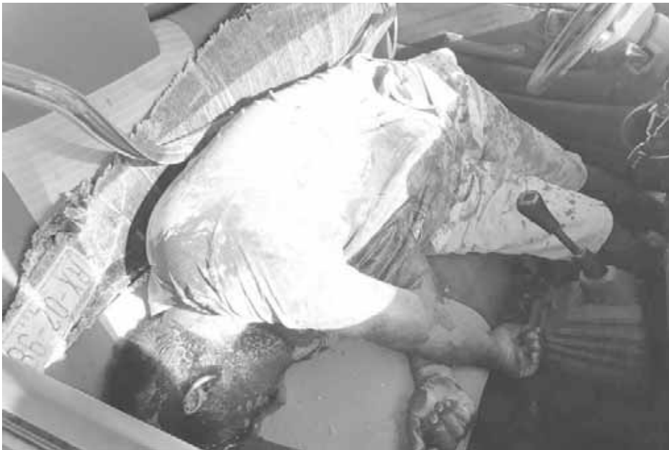
► El cuerpo del joven de 30 años de edad quedó bañado en sangre.