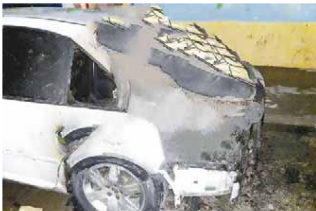
► Ya investigan los hechos ocurridos.