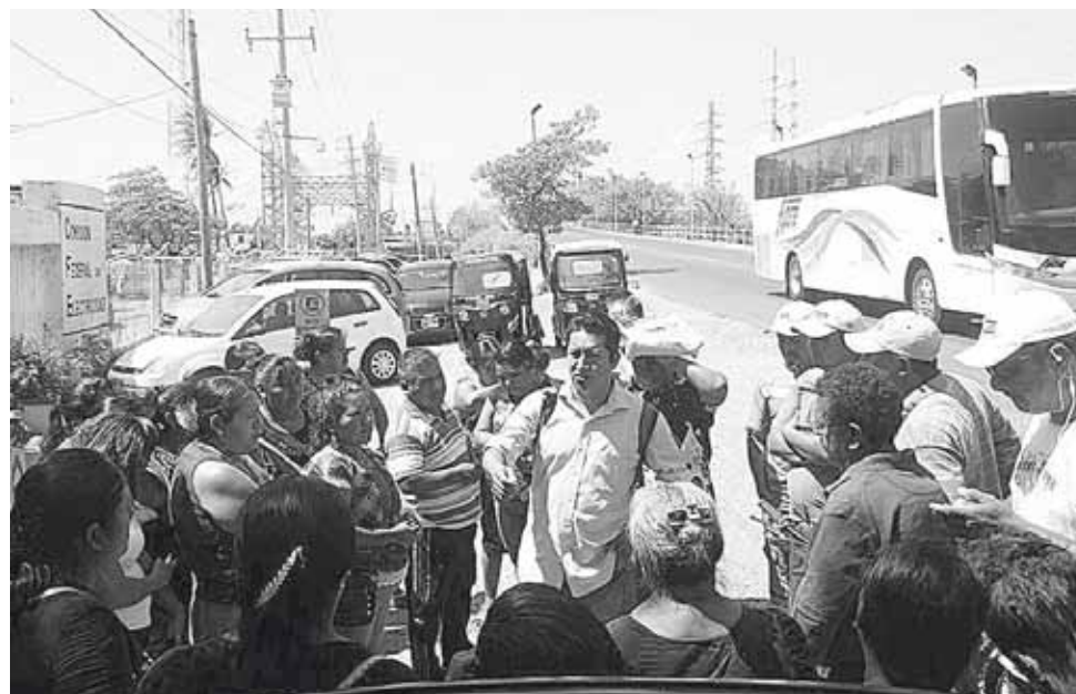
► El grupo de pobladores exigen que la paraestatal les condone algunos meses.

eso creo que se debe buscar mecanismo legal para que se pueda dar esta exigencia de condonar el pago de servicio, yo creo que si TELMEX que es una empresa privada en su momento condonó un mes de facturación, pues una empresa pública, que pertenece a los mexicanos, no pueda hacer esa excepción de buscar un mecanismo legal, para que se pueda concretar la condonación del pago”, aseguró.