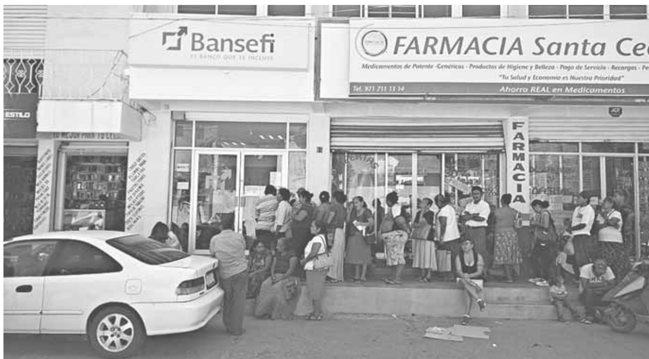
► El grupo de damnificados dio a conocer su posicionamiento sobre la falta de seriedad de las dependencias encargadas de los depósitos.

"Hacemos un llamado a las instancias correspondientes para que atiendan de manera inmediata todos