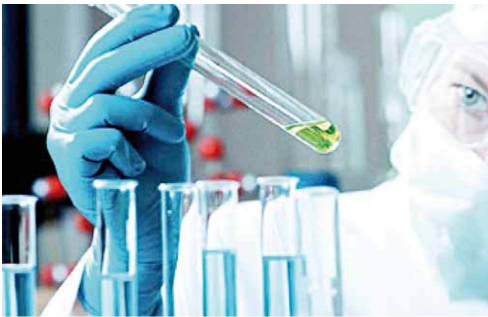
► Explican que los laboratorios les dan un porcentaje a los doctores.

Según la ley en México está penada (Ley General de Salud, Artículo 48 Bis y 419).