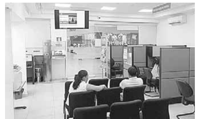
► Piden a los derechohabientes para que se acerquen a pedir informes.

su petición es de acuerdo a la demora que tenga la captación de la documentación del derechohabiente. Explicó que si el mismo derechohabiente se dedica a preparar sus documentos es apoyado por el personal del Infonavit para la organización de los papeles, lo cual puede llevar un lapso de un mes ya que la asesoría es completamente gratuita, asimismo también hay un portal del Infonavit para mayores informes.