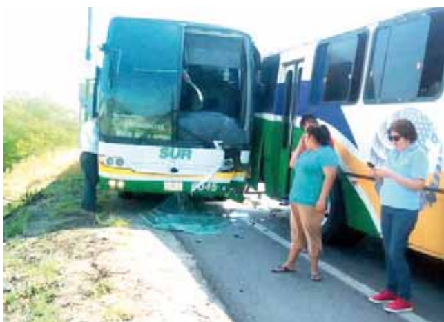
► Las unidades pusieron en riesgo la vida de los usuarios del transporte.

DE ACUERDO CON EL TESTIMONIO DE LOS USUARIOS DEL TRANSPORTE, LOS CHOFERES DE LAS DOS UNIDADES INVOLUCRADAS IBAN JUGANDO CARRERITAS PARA GANARSE EL PASAJE