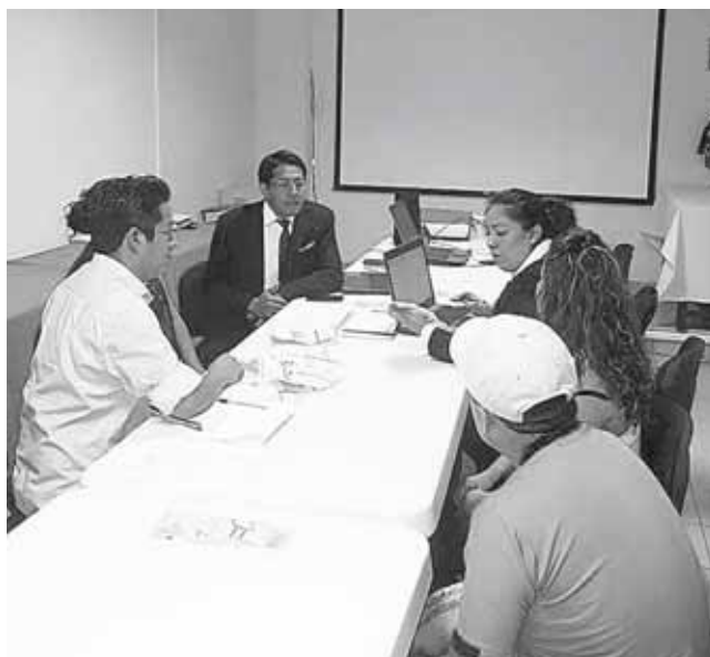
► Durante la reunión con algunos representantes.

“Y es que la CFE ha facturado en estos tres últimos bimestres a los damnificados, en donde han emitido facturas con un alto costo de la energía eléctrica. Nosotros en el mes de noviembre hicimos una manifestación en la Ciudad de México en donde en la mesa de negociación que tuvimos con la Segob, planteamos el problema y pedimos que estuviera un funcionario