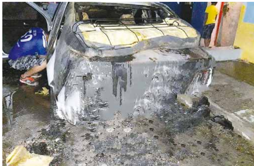
► De acuerdo al propietario, las pérdidas materiales ascienden a los 30 mil pesos.

Por lo que rápidamente con equipo especial lograron sofocarlo en su totalidad, aunque el fuego ya había calcinado la parte