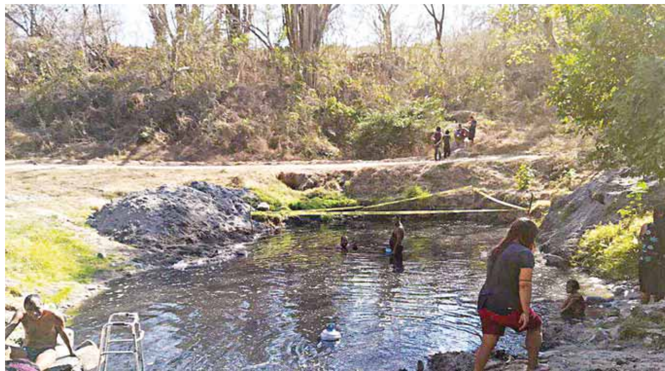
► La poza de 25 por 55 metros no presentó efectos derivados del sismo y la de 10 por 20 metros tuvo una reducción de caudal de 4 litros.

A través de un comunicado, la dependencia federal indicó que los geólogos de las Conagua recomendaron continuar con las acciones de desazolve cada vez que disminuya el flujo o descienda el nivel del agua en la poza, así