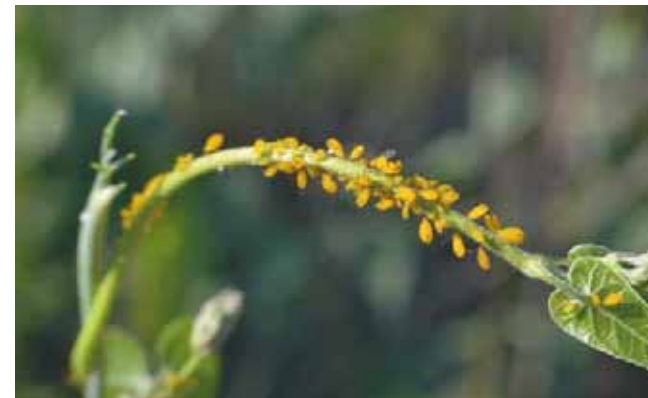
► El objetivo es evitar plagas y enfermedades.

Las oficinas se ubican en la segunda planta al interior de las instalaciones de la Delegación de la SAGARPA Oaxaca, ubicadas en la calle