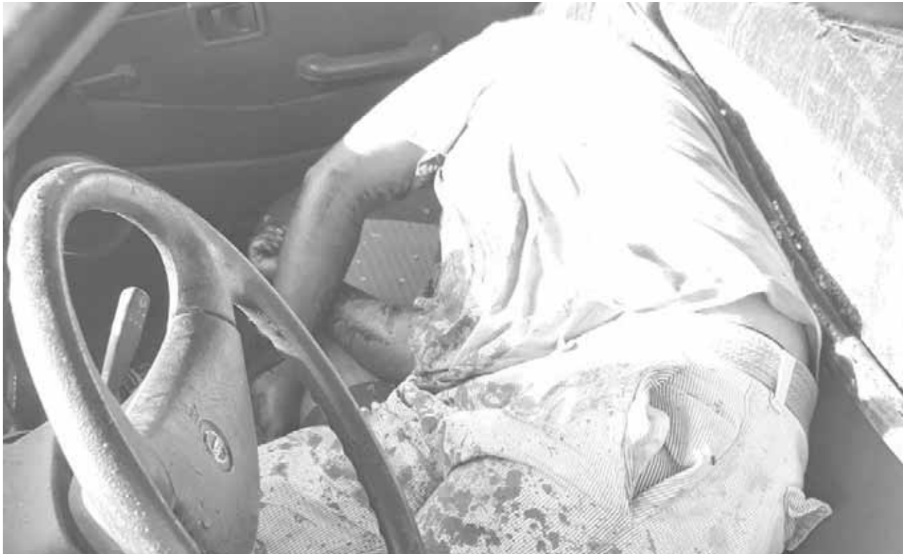
► Ya se abrió una carpeta de investigación para dar con los autores materiales.

EL HOMBRE, ORIGINARIO DE JUCHITÁN, PERDIÓ LA VIDA TRAS RECIBIR VARIOS IMPACTOS DE BALA QUE LO HICIERON PERDER EL CONTROL DE LA UNIDAD, POR LO QUE QUEDÓ LA UNIDAD ENTRE LA MALEZA EN UN TRAMO CARRETERO