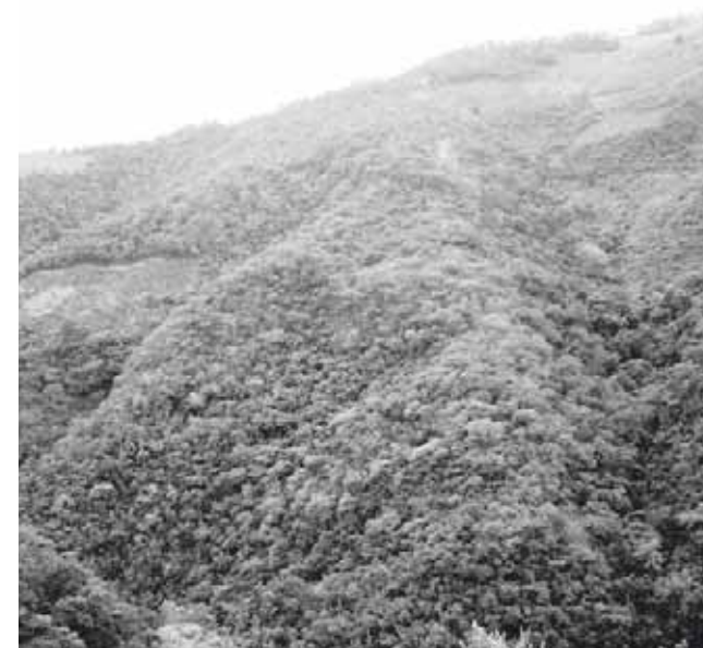
► Las Selvas Bajas son propias de climas cálidos con lluvias escasas y tienen una diversidad única con gran cantidad de especies endémicas.

Así como los de regulación relacionados con los procesos ecosistémicos que regulan las condiciones en que los seres humanos viven y se desarrollan; los culturales, que pueden ser tangibles o intangibles, pero que dependen fuerte-