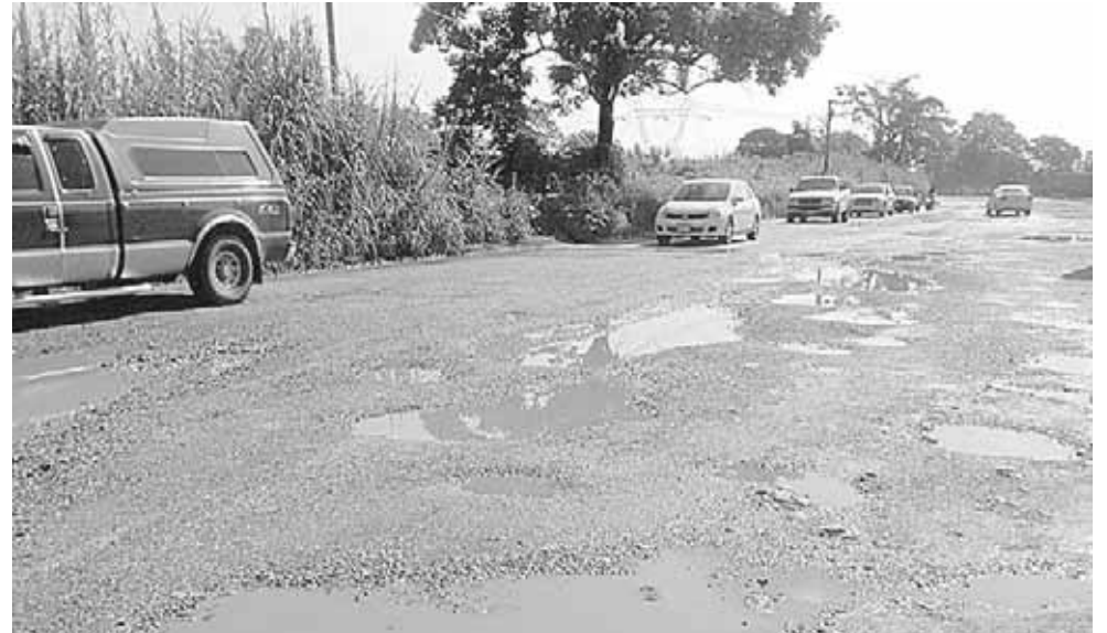
► Así lucía el año pasado este importante red carretera.

Explicó que el gobernador reiteró el compromiso que tiene con el municipio