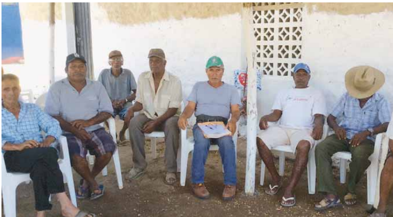
► El grupo de inconformes dieron a conocer su postura ante el presidente municipal de Pinotepa.

Como se recordará, el año pasado, un grupo de pobladores pidió la desti-