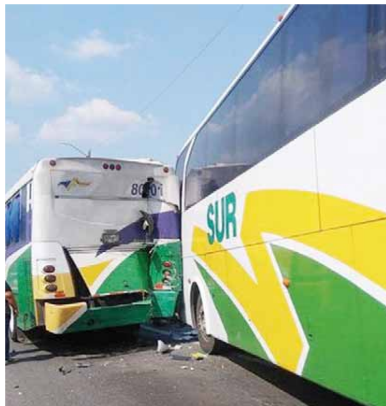
► Los autobuses quedaron a mitad de carretera.

Tras el reporte, los primeros en llegar fueron los policías viales y después