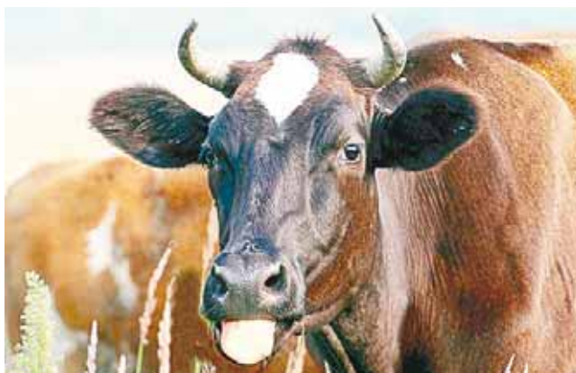
► Explican que el ganado debe de contar con las vacunas.

Aseguran que la muerte de ganado es por irresponsabilidad de los productores y no representa un peligro para la salud pública