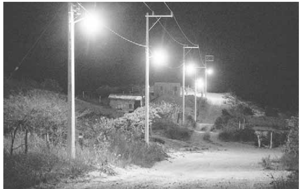
► El presidente municipal de Salina Cruz, agradece a los colonos la confianza.