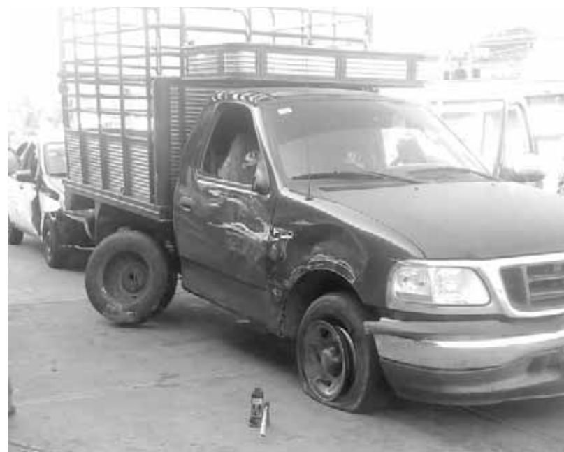
► El chofer de la unidad se hizo responsable de los hechos.

Automovilistas que se percataron del accidente de inmediato lo reportaron al número de emergencia, informando que tres vehículos habían colisionado en el