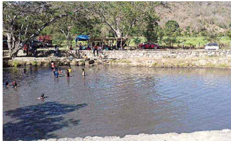
► Las lagunas de Atotonilco se localizan a diez kilómetros de Santiago Jamiltepec, Oaxaca.