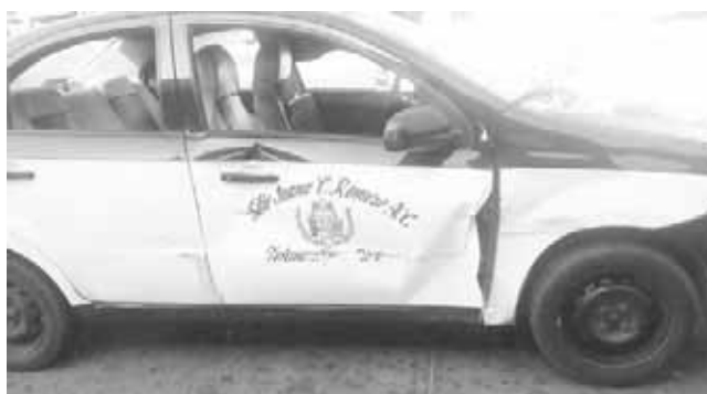
► La puerta del copiloto de taxi quedó abollado.

La mañana de ayer a las 09:30 horas aproximada-