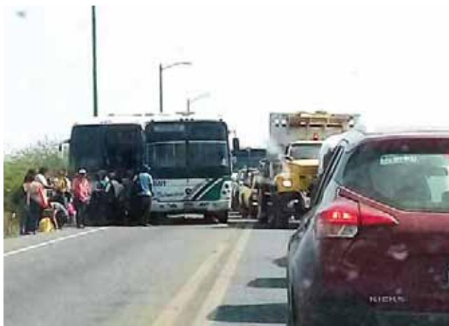
► Las unidades provocaron bastante tráfico en la zona.