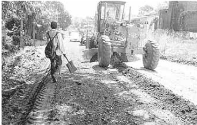
► Los trabajos ya arrancaron de manera formal.

Los ejidatarios de San Bartolo manifestaron estar satisfechos por los trabajos que se están llevando a cabo con el encarpetao asfáltico