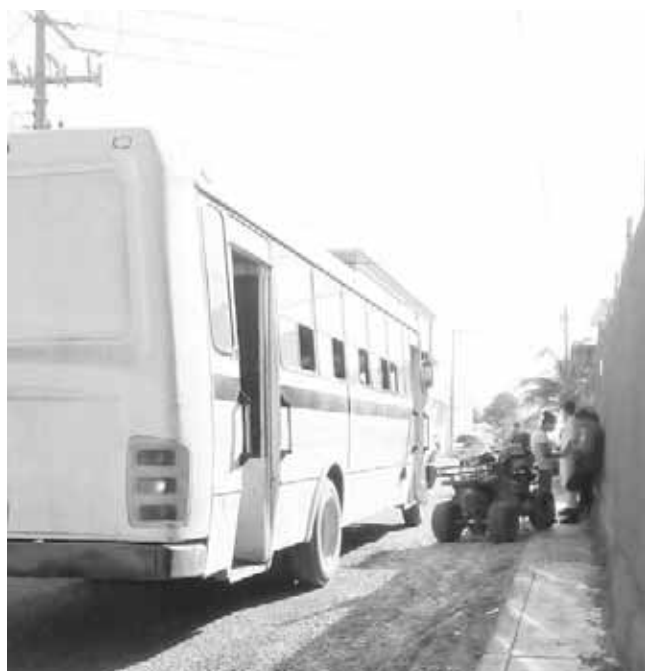
► El herido fue trasladado al hospital tras la valoración de las heridas.

Después de tomar datos del responsable y de cómo se suscitó el accidente, realizaron el llamado del chofer de la grúa para que ambas unidades de motor fueran trasladados al corralón correspondiente en lo que se deslinda responsabilidades.