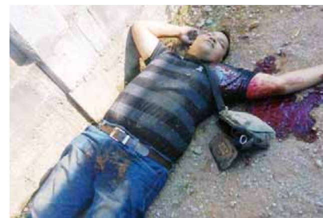
► Un grupo de sujetos armados irrumpieron en una fábrica de block y asesinaron a balazos al hombre.

Entre los primeros comentarios que surgieron respecto al asesinato de esta persona es que hace algunos años, fungió como auxiliar de las llamadas “madrinas” de la Procuraduría General de la República, sin embargo, se desconoce en