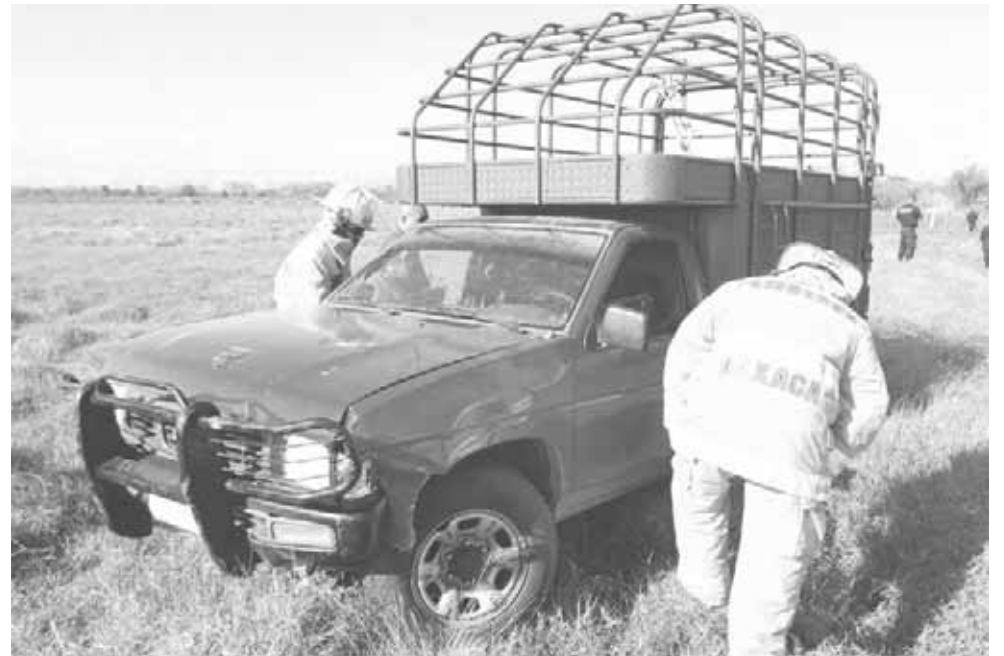
► Los primeros en llegar fueron los elementos de Bamberos.