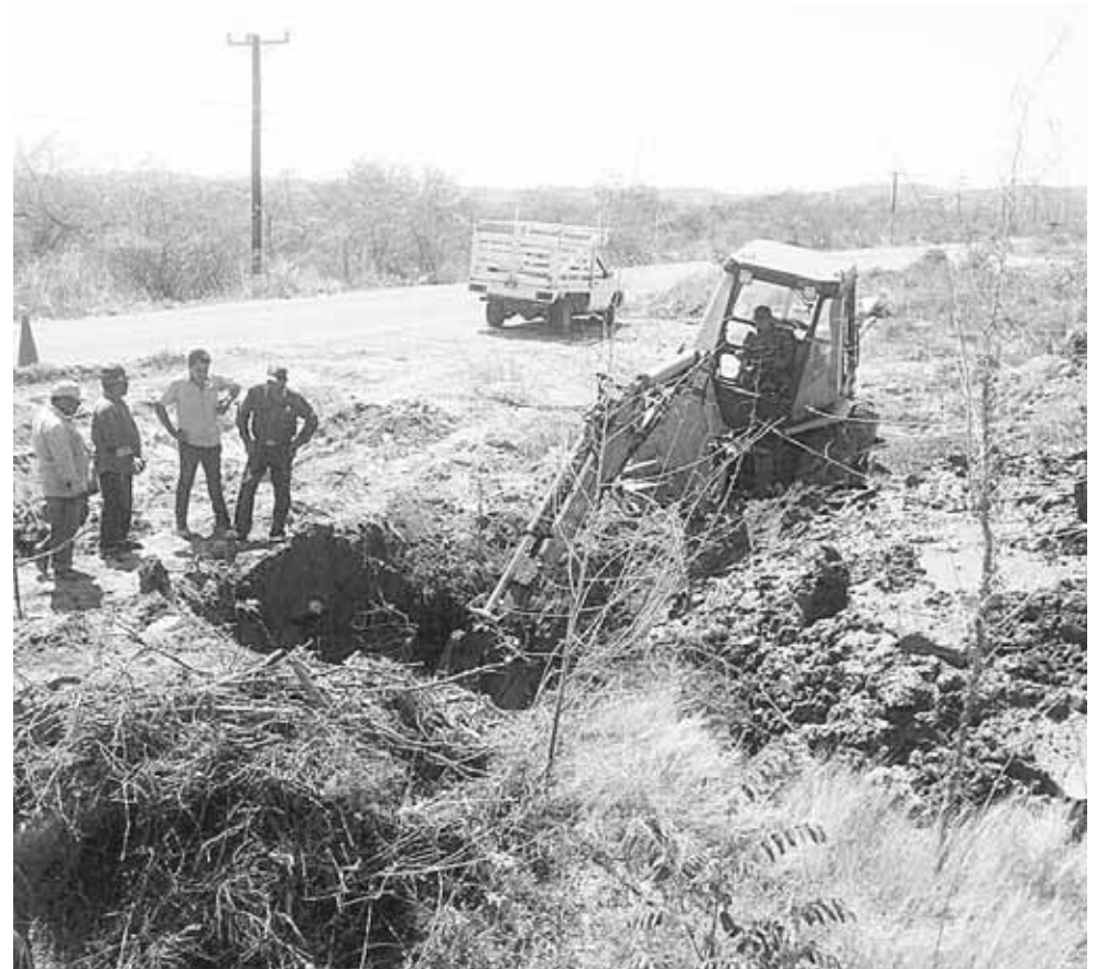
► Se llevan a cabo trabajos para restaurar las áreas en las que se presentan las fugas.

Precisó que son en promedio unos 75 mil usuarios, los que no se les dotará de agua por este desperfecto. Pero confió en que a marchas forzadas que realizará el personal del sistema de agua se logre resolver a la menor brevedad.