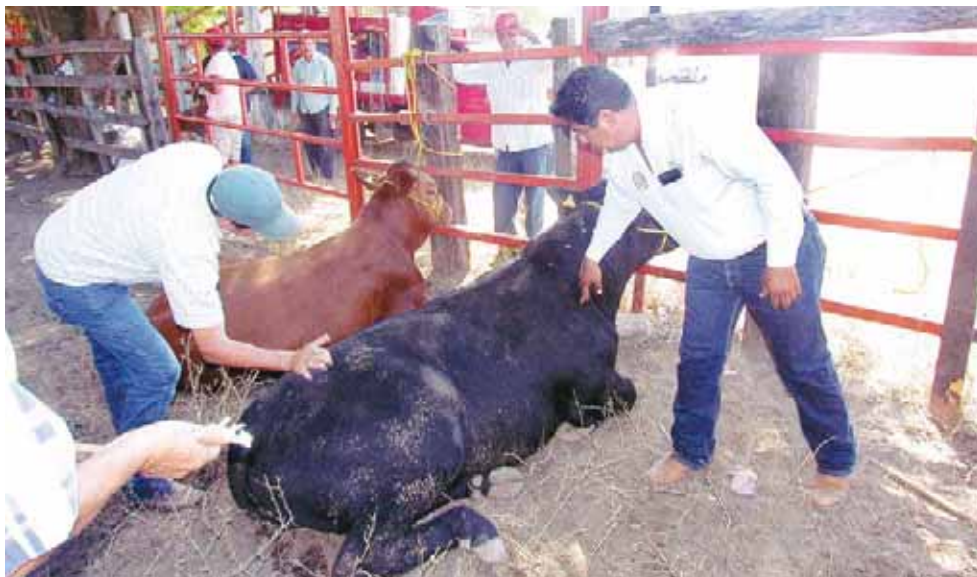
► En un principio se había dado a conocer que se trataba de muerte por enfermedad, pero posteriormente lo desmintieron.