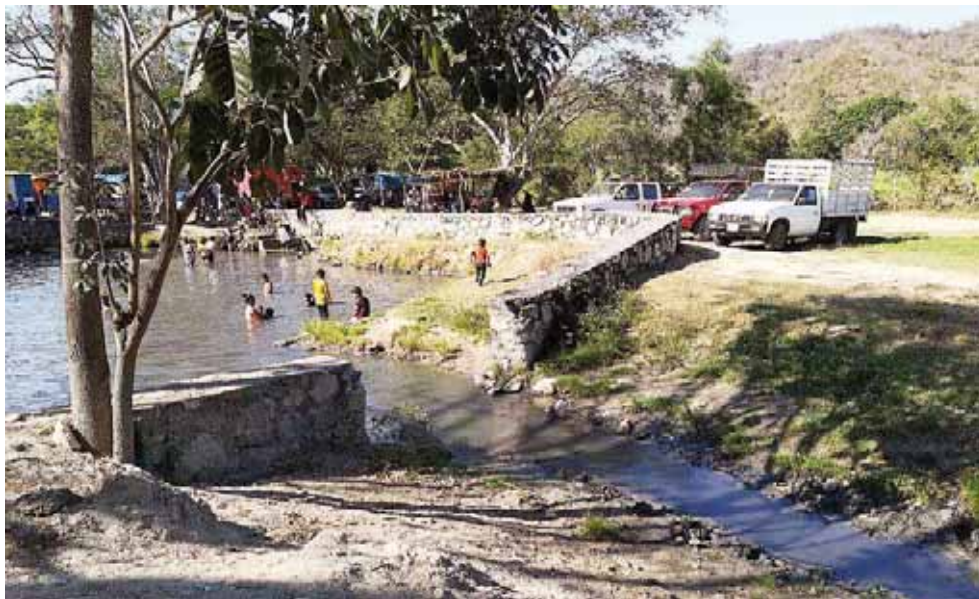
► En colaboración con los habitantes de la región se intensificaron las acciones de desazolve.