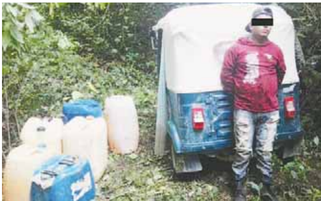
► Se definirá su situación jurídica.

Se informó que el detenido, la unidad y el hidrocarburo asegurado fueron trasladados a la Subdelegación de la Procuraduría General de la República en Matías Romero.