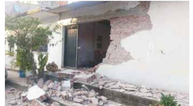
► Las personas de la zona presentaron nerviosismo.