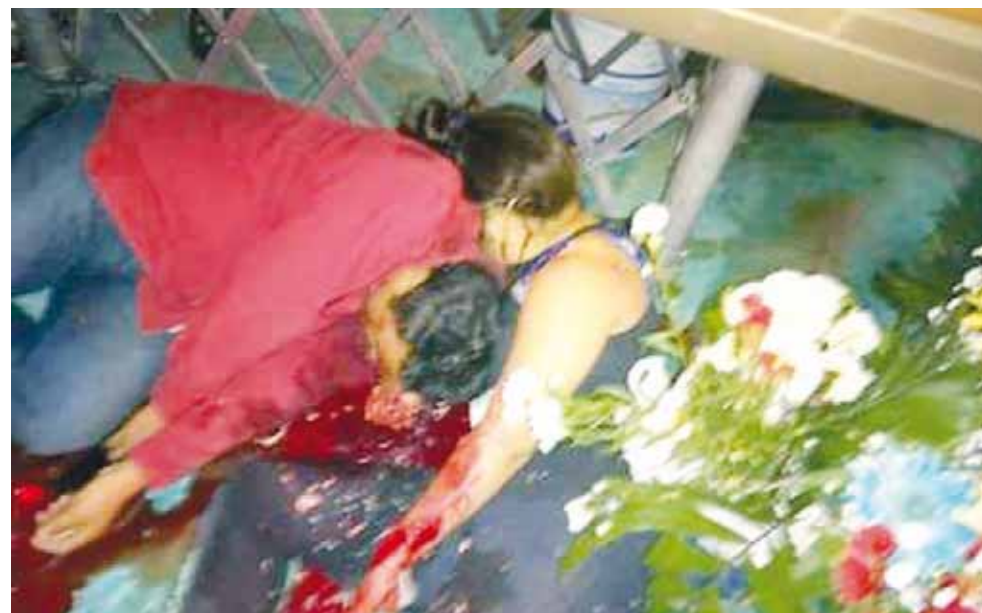
► Así quedó la escena de la masacre.

Luego del ataque, elementos de la Secretaría de Seguridad Pública acordonaron el área en espera de las autori-