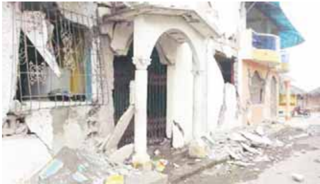
► La zona con mayor percepción fue Jamiltepec.