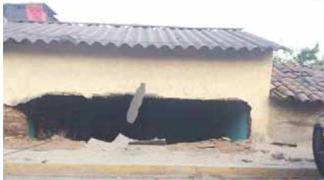
► En Pinotepa Nacional se presentan caída de bardas.