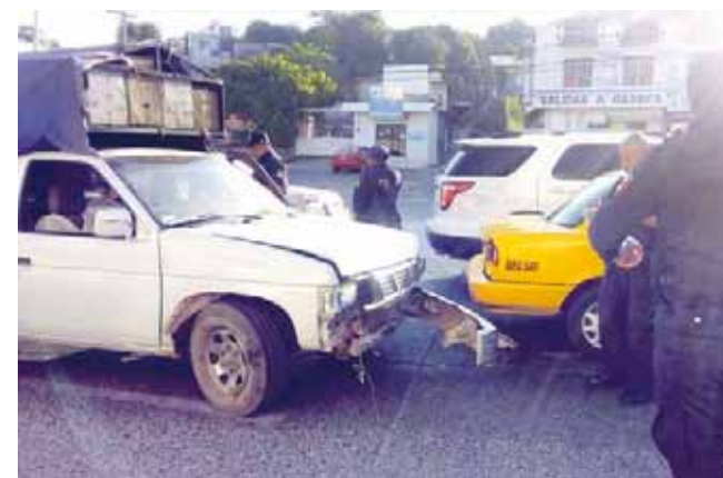
► Las unidades implicadas.

En cuanto a su esposa que quedó en el lugar del accidente para estar al pendiente de la decisión de los de vialidad que se apersonaron después de los municipales que arribaron de inmedia-