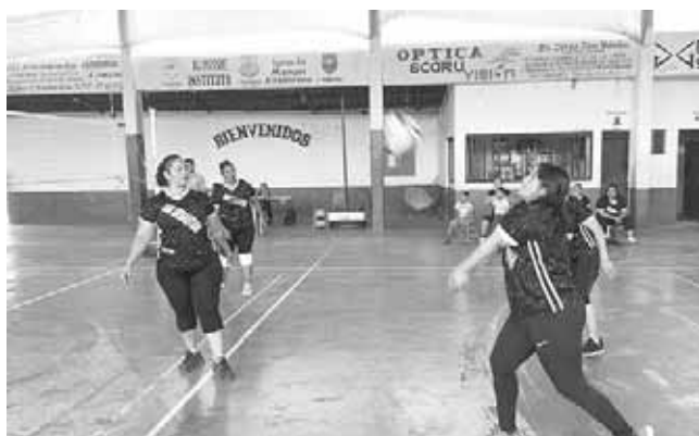
► Adamecia defendiendo su área.