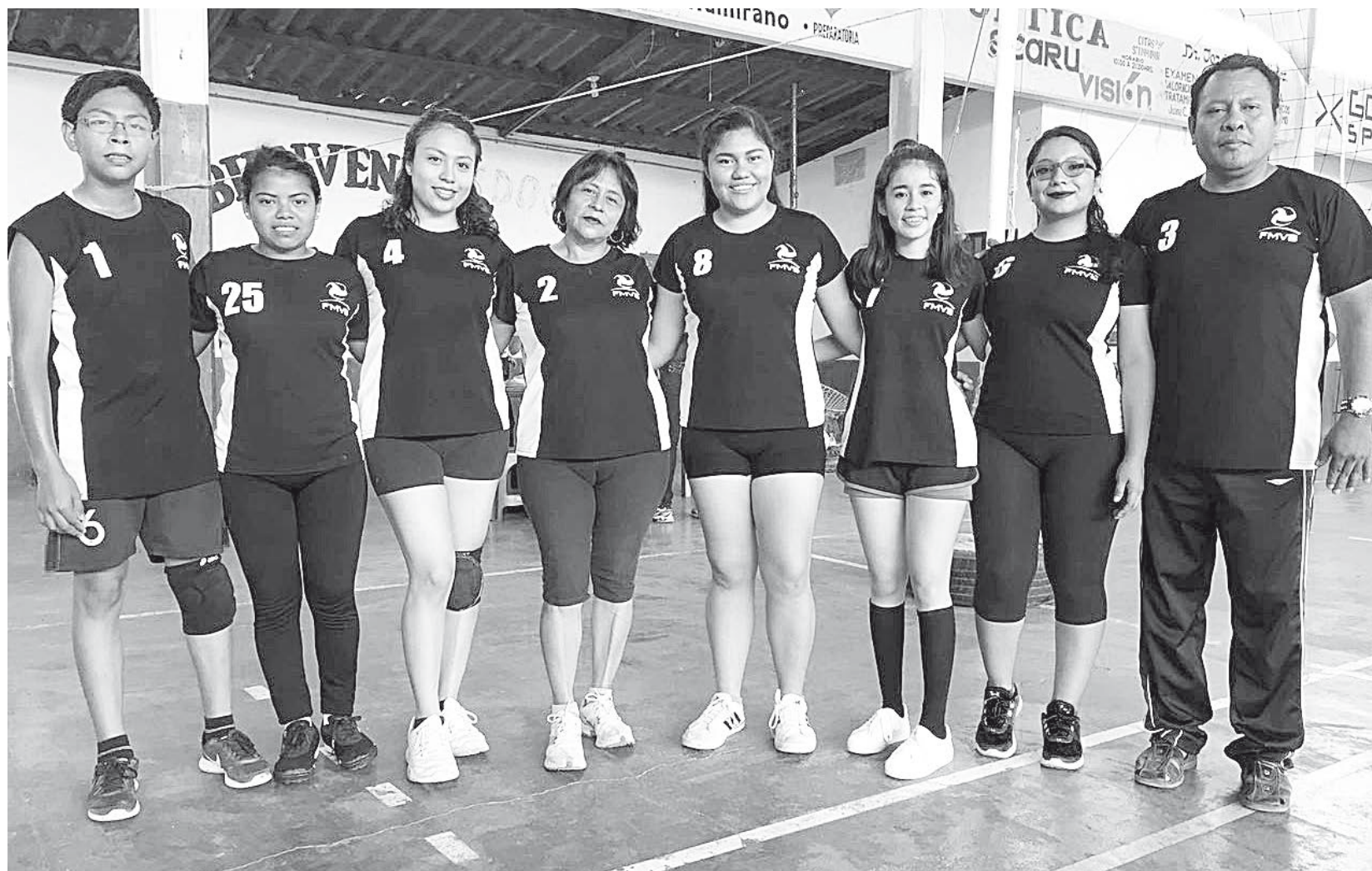
► Los Vastos siguen de frente.

las chicas de San Sebastián bajaron bastante su ritmo de juego y esto fue aprovechado por las chicas de Los Vastos