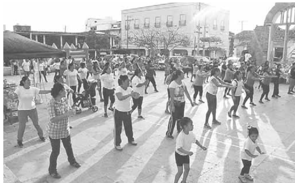
► Diferentes grupos asistieron a la clase.