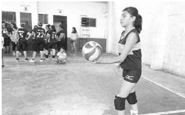
► Con el saque inicio la ofensiva.