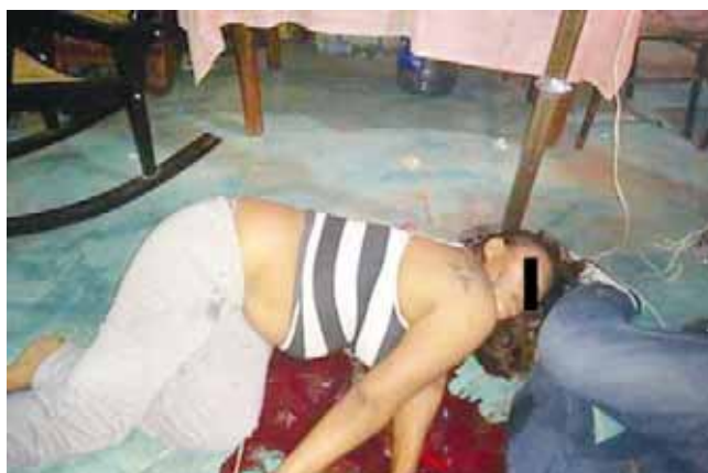
► Cuatro personas fueron asesinadas en el lugar.

Luego del ataque, elementos de la Secretaría de Seguridad Pública acordonaron el área en espera de las autoridades ministeriales para que realicen las diligencias correspondientes