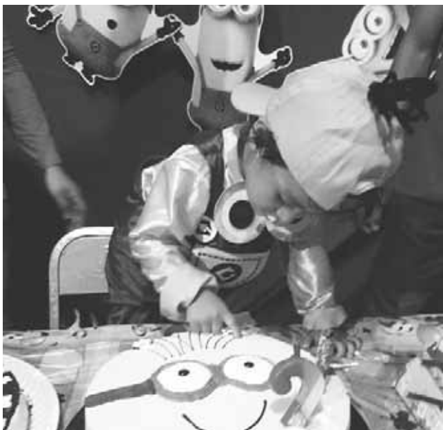
► Apagó las velitas de su pastel de los minions.