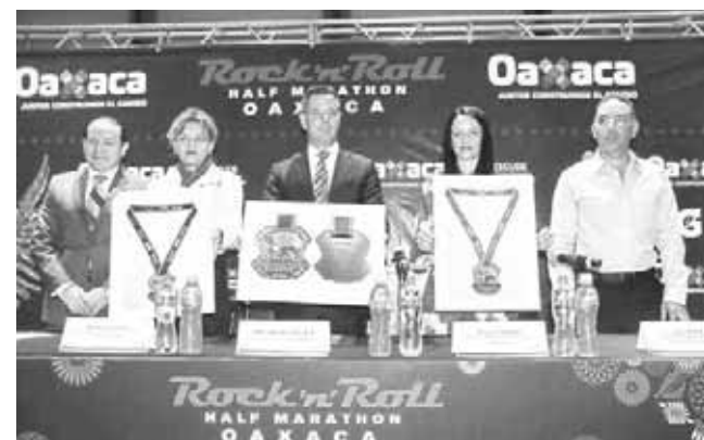
► Rock and Roll Medio Maratón.