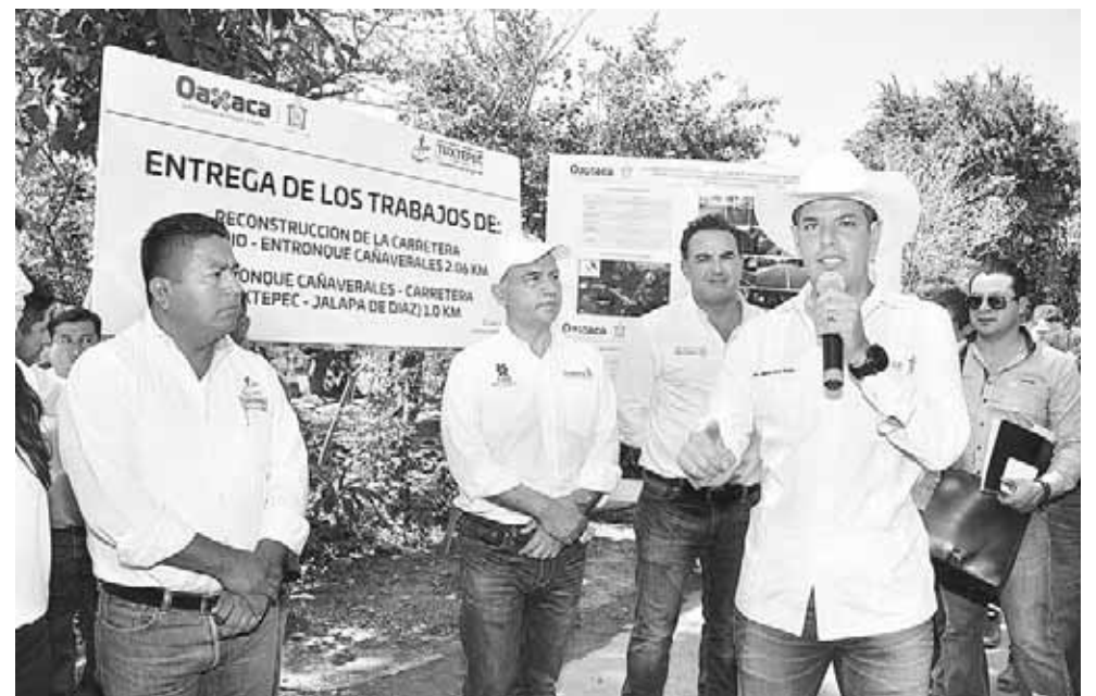
► Se inauguró la rehabilitación un tramo carretero con una inversión superior a los 59 millones de pesos.