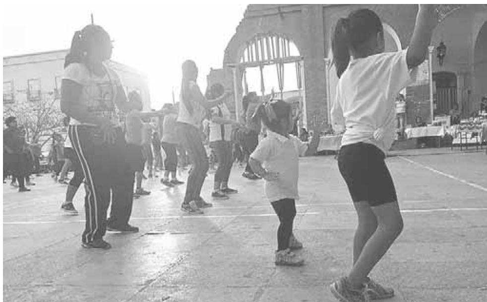
► Se activaron niñas y adultos, quienes se divertieron.