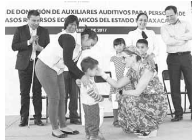
► Explican que en el mes de marzo será cuando se otorguen los apoyos.