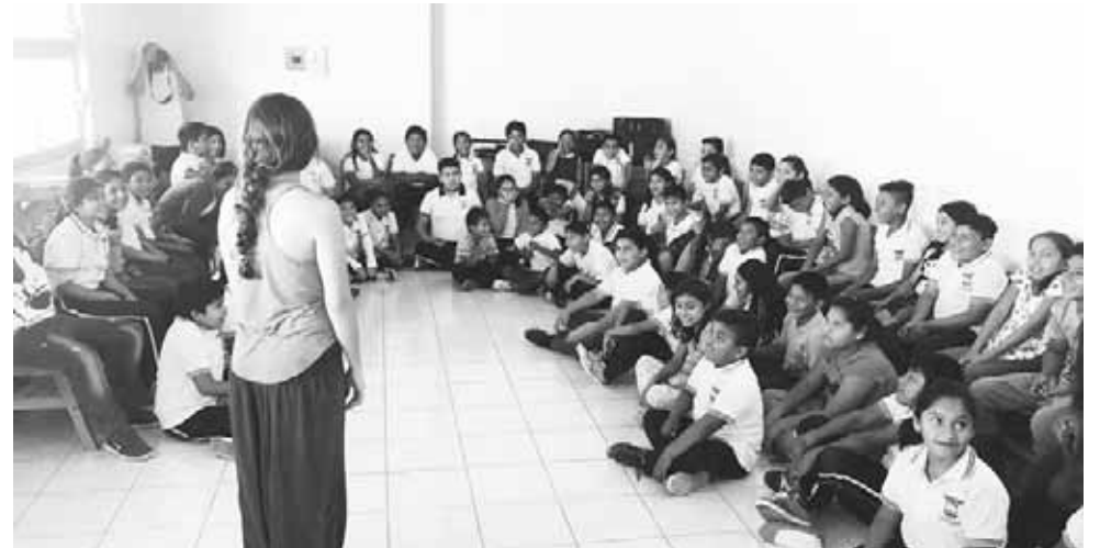
► Han estado en varias escuelas primarias de la zona.

Comentó que el arte siempre une a la gente, pues se