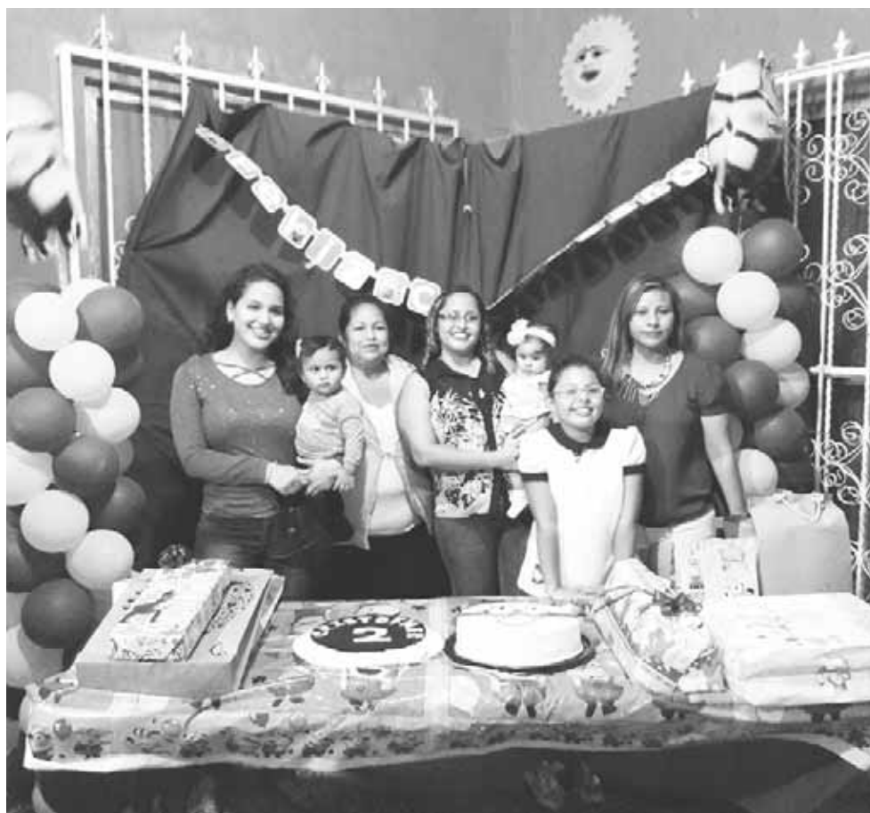
► El pequeño reunido con sus familiares.