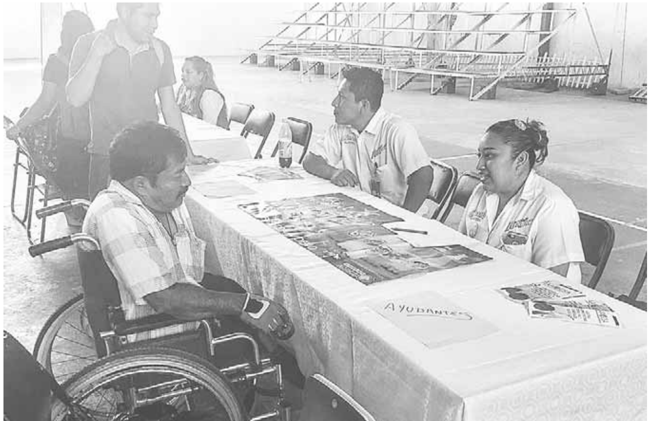
► En la micro feria que se realizó en el interior del palacio municipal.

En este momento el ayuntamiento cordobés amaga con una 'renovación de permisos' a El Mundo, entre otras acciones administrativas, mismas que la representación legal de la empresa editorial revisa.