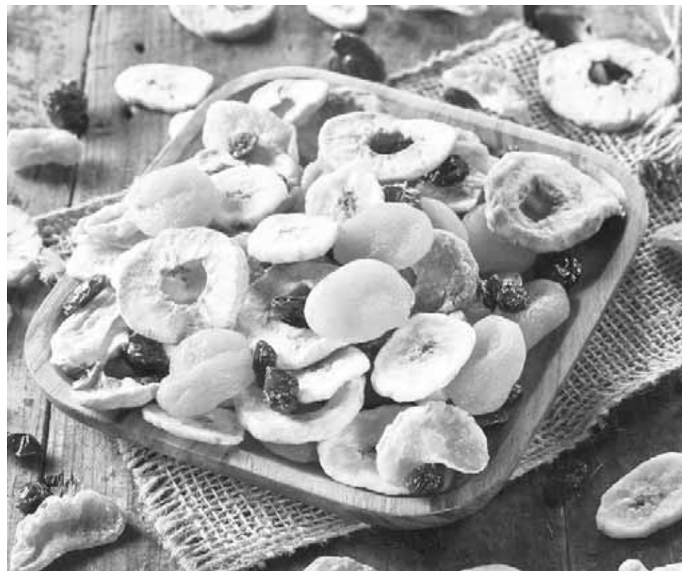
► Aseguran que los frutos deshidratados poseen propiedades al momento de consumirlos, por lo que los productores ya no tendrán pérdidas.

Chávez Zavaleta hace la invitación a todos aquellos emprendedores que gusten para dar a conocer sus proyectos, también pueden acudir para ver de qué manera se les puede apoyar, ya que la intención es tener un mercado para los productos de temporada donde ya no se tenga que echar a perder la fruta, sino que se pueda vender, pero de otra forma, este tipo de acciones son las que se necesitan para que los productores puedan incrementar sus ingresos buscando soluciones para no perder mercancía.