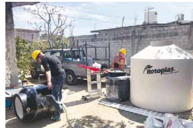
► Instalan filtros de agua densificada.

cubeta y una manta, pues no tienen tubería y es agua de pozos.