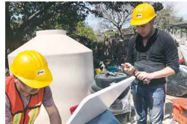
► El objetivo es que beban agua 100% purificada.