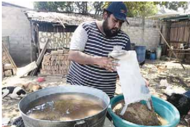
► Realizan los procesos para que sea más pura.

Indicó que trabajan con comunidades para llevar agua segura, agua limpia a través de la “mesita azul”, pero varía cada lugar, en algunas comunidades no se pueden poner los filtros de carbón y membrana, por lo que ponen una