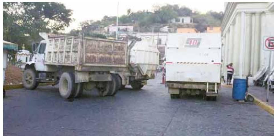
► Los empleados dieron a conocer su inconformidad.

Aunque por otra parte, desde hace un año se ha mantenido la pugna entre dos grupos de trabajadores sindicalizados quienes se pelean la titularidad, con la intención de poder controlar las cuotas patronales y las plazas laborales.