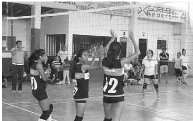
► Férrea defensa Lagarta.