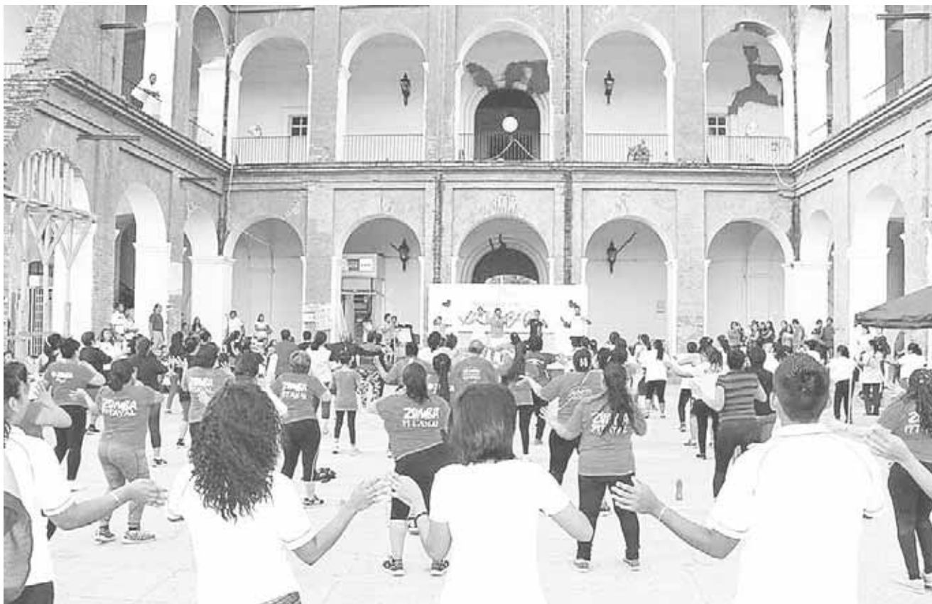
► Concurrida la clase en la explanada.

Felicitó a los instructores que participaron y con quienes se sintió el entusiasmo por contribuir a que estos espacios se mantengan activos con excelentes mega clases