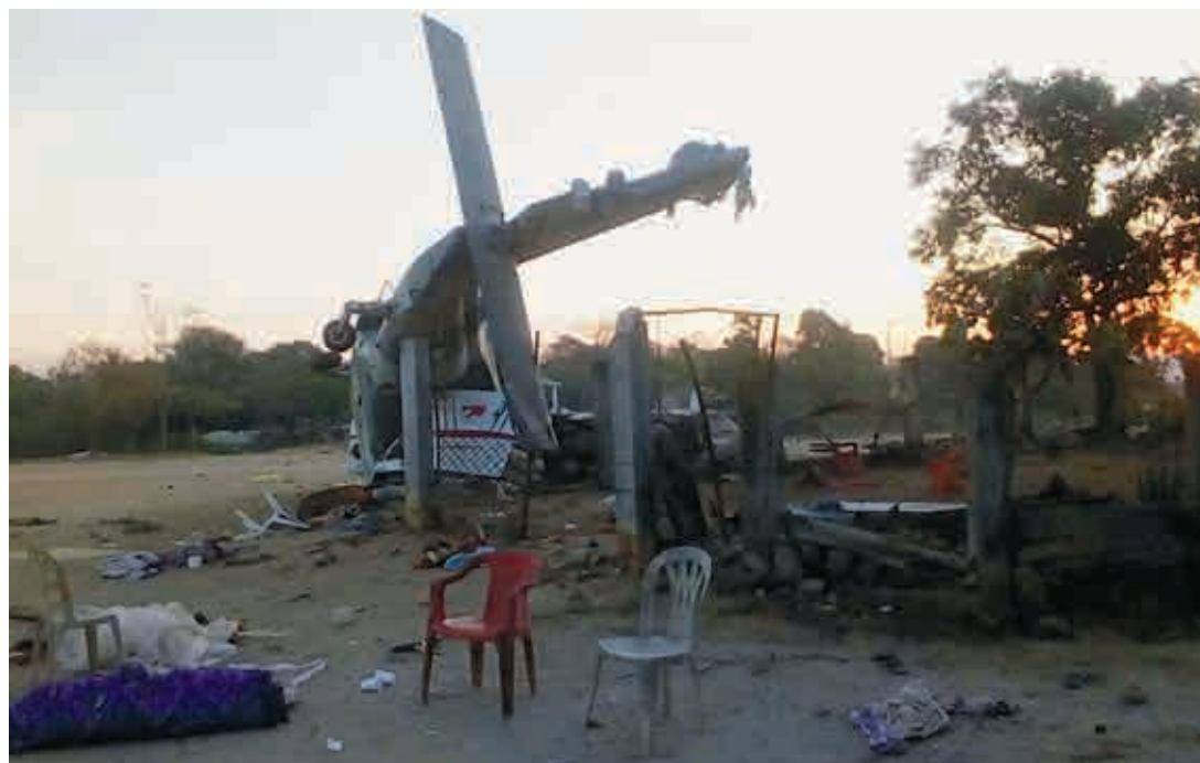
▶ Las investigaciones las lleva la autoridad federal.

Los funcionarios, acompañados por su séquito de trabajo, se reunirían en el Aeropuerto Internacional de Puerto Escondido y cada quien llegaría por su cuenta para después del encuentro organizar el traslado a Santiago Jamiltepec.