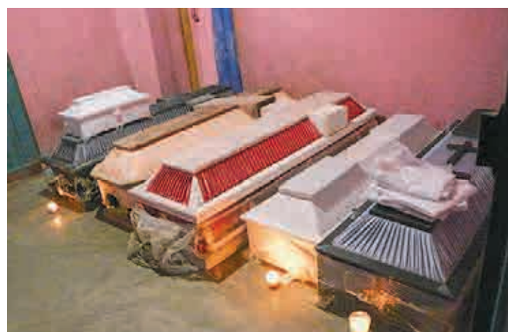
▶ Velaron a las víctimas, cerca de la zona del accidente.