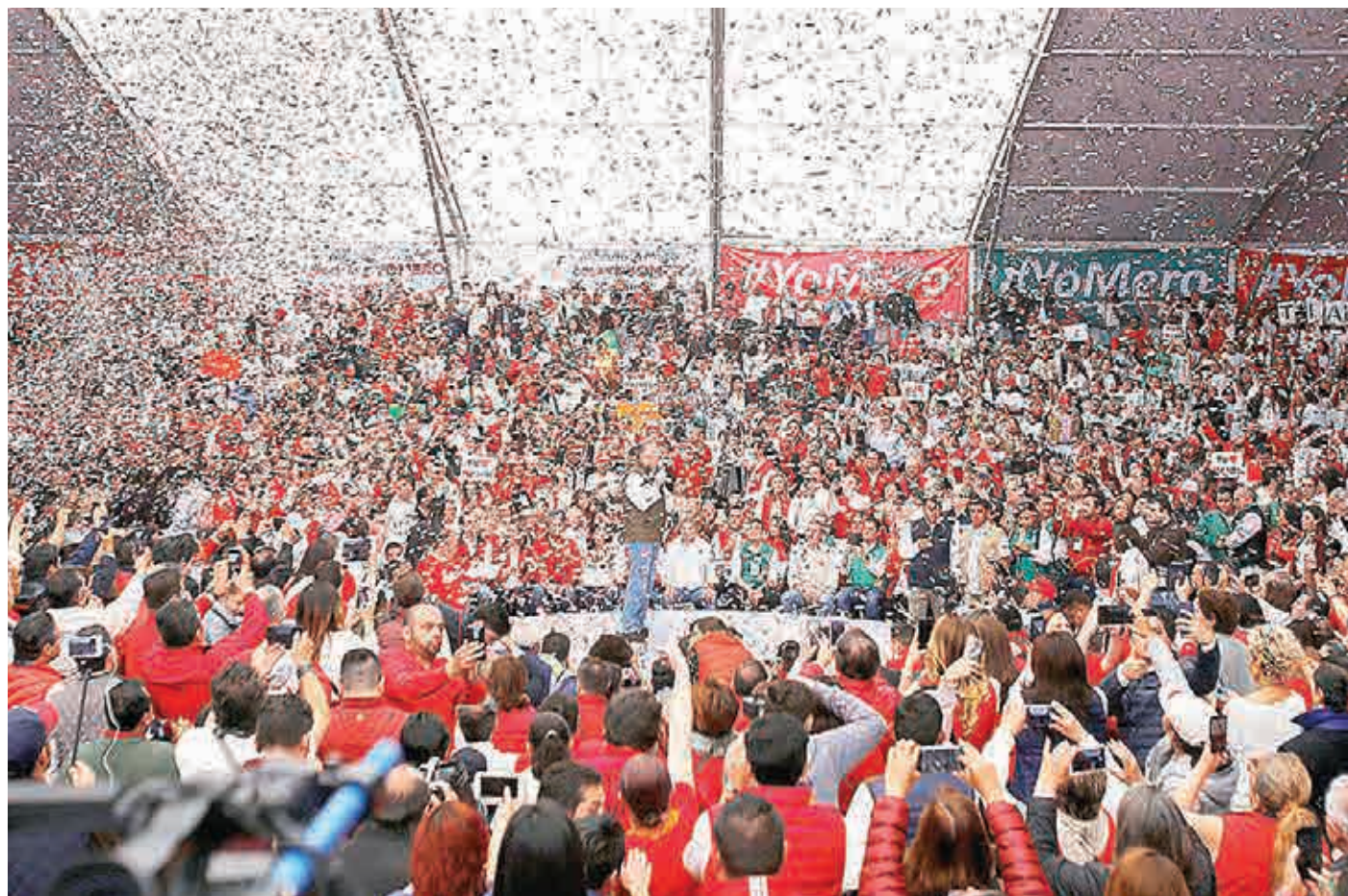
► Los priistas saben que los tiempos políticos son adversos. Los hay que no tienen disposición ni siquiera de dar la batalla.

Dados los resultados de las encuestas, quien más ha subido es Anaya. Meade ha disminuido y Obrador se mantiene en su nicho de simpatizantes. Por eso mismo, es de esperarse que la gran final será muy reñida entre Morena y PAN-PRD.