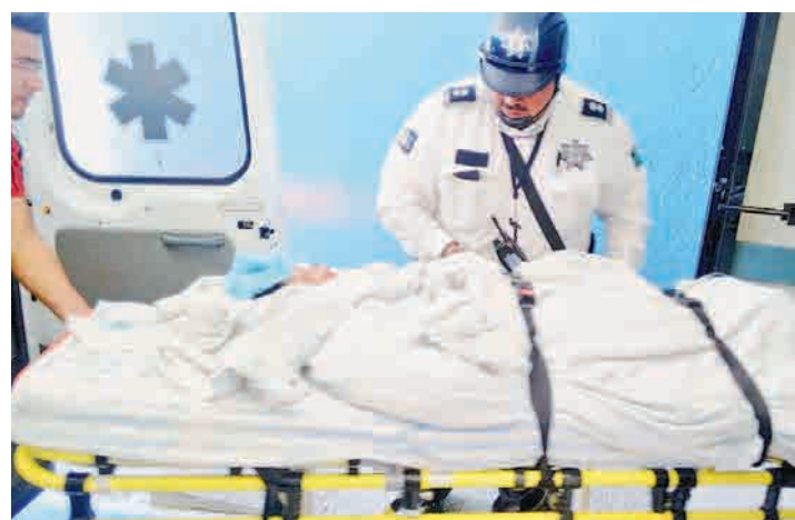
▶ Trasladan a los lesionados a distintos hospitales.

A las 20:00 horas, el gobernador Alejandro Murat arribó al aeropuerto acompañado