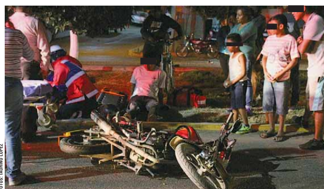
► Los jóvenes salieron proyectados tras ser impactados.

El conductor trató de escapar después de atropellar a los