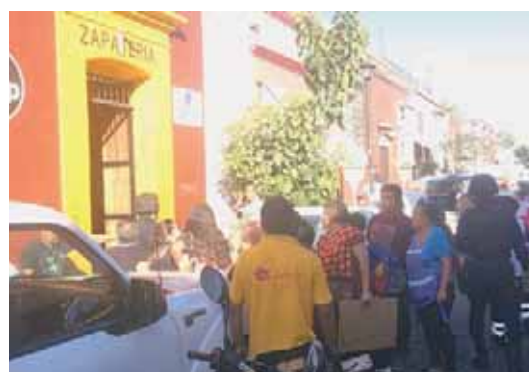
► Curiosos se comenzaron a aglomerar cuando llegaron los paramédicos para revisar al líder.