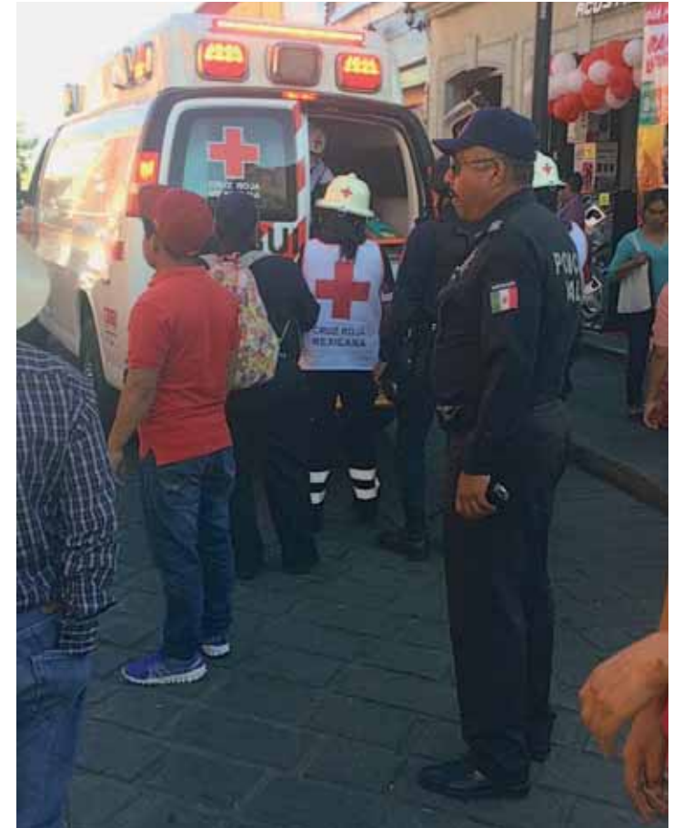
► Paramédicos al llegar, solamente confirmaron la muerte.