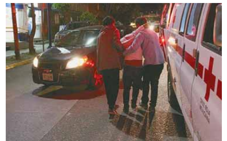
► Trasladan a los lesionados a la clínica para su atención.

Dos jóvenes lesionados al ser embestidos en el bulevar Guadalupe Hinojosa