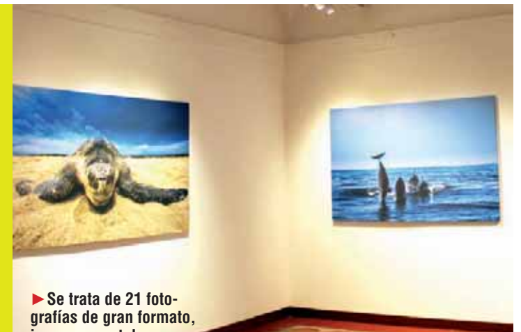
► Se trata de 21 fotografías de gran formato, impresas en tela.