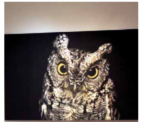
► Ha vinculado la biología con la fotografía.

POR AHÍ dicen que si no tienes este conocimiento de biólogo, las fotografías no te van a mostrar lo bello de la naturaleza. El vincular la fotografía con la biología ha sido muy gratificante y para mí es súper padre tener una fotografía mía en libros, en revistas, en calendarios, postales... hemos hecho juegos para los niños, loterías y lo más bonito es que este material en las comunidades donde trabajamos lo regalamos en las escuelas y los niños se muestran muy contentos y disfrutan bastante de la fotografía.