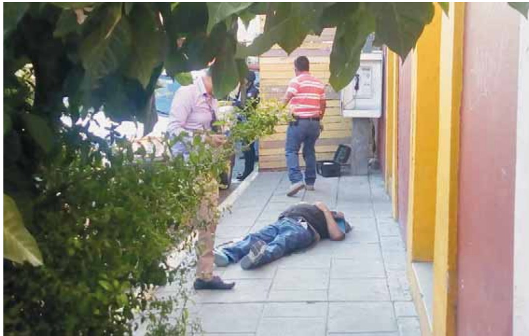
► Se espera el resultado de la necropsia para saber la causa de la muerte.