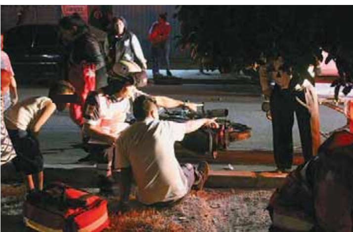
► Paramédicos les brindan los primeros auxilios.

Mientras se realizaban las diligencias por las autoridades, un sismo y una réplica de considerable intensidad, sacudieron a la ciudad capital.