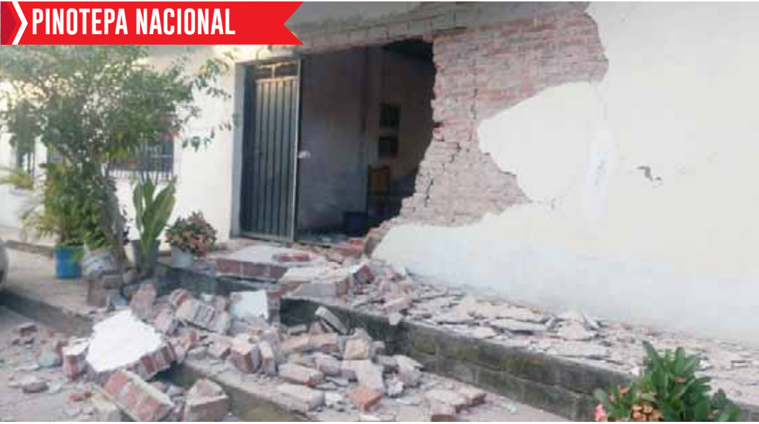
Varias viviendas sufrieron severos daños en Pinotepa Nacional.