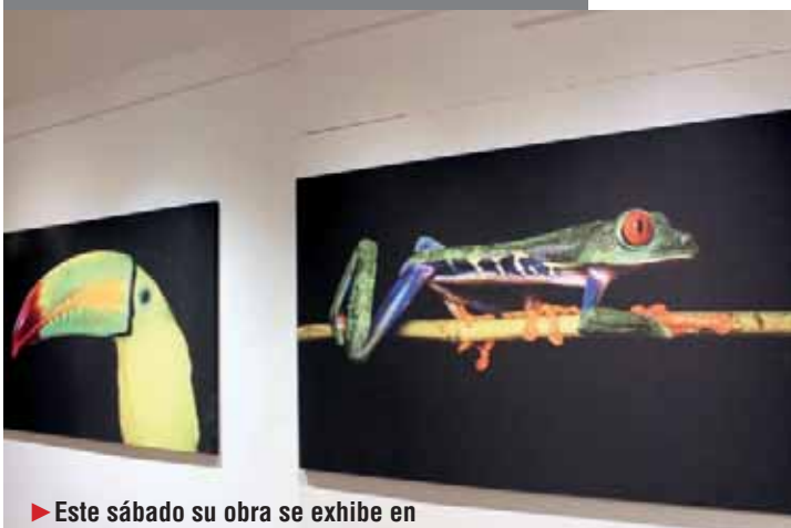
► Este sábado su obra se exhibe en las rejas de Chapultepec.