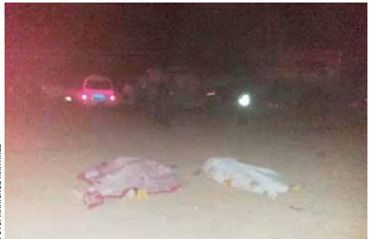
Hasta el cierre de la edición, once cuerpos habían sido rescatados.