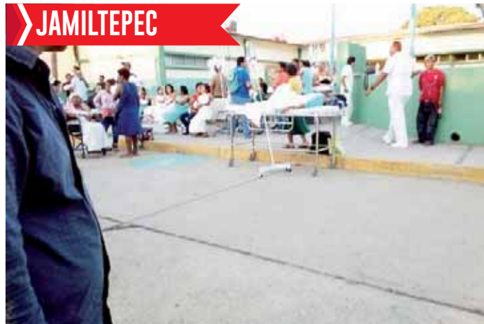
El Hospital del IMSS en Santiago Jamiltepec fue desalojado.

La aeronave aplastó una camioneta tipo Urvan y otros vehículos; entre las primeras víctimas, 9 adultos y 2 menores de edad