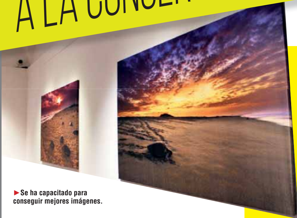
► Se ha capacitado para conseguir mejores imágenes.

También ser el inicio de una serie de exposiciones que se realicen cada año, de tal forma que se incluyan más proyectos de conservación que existen en el país.