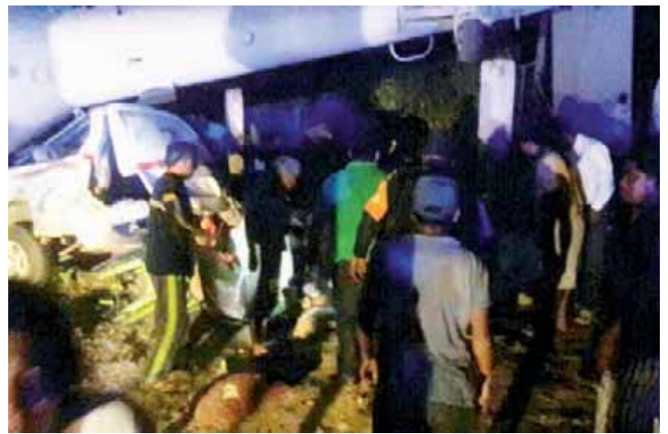
La aeronave aplastó una camioneta Urvan.

En tanto, una camioneta tipo Urvan color blanco, literalmente quedó aplastada por el helicóptero y habría