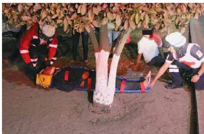
► Los dos resultaron lesionados ante el golpe.