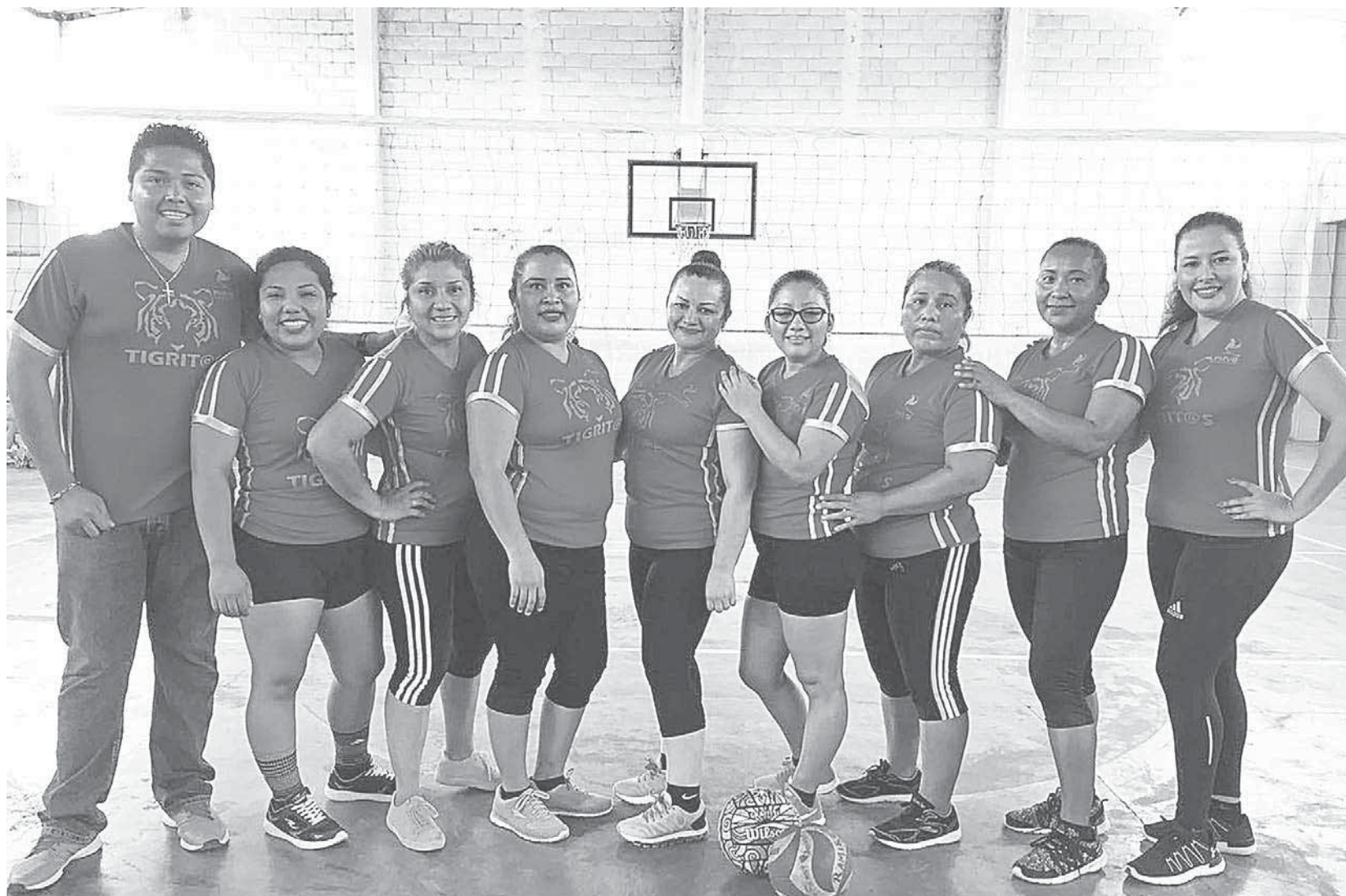
► Tigritas con boleto en mano.

Las acciones se inclinaron desde el principio del primer parcial del lado de las jóvenes de Tigritas, quienes se plantaron bien