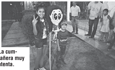
► La cumpleañosera muy contenta.

En el festejo los invitados disfrutaron de unos ricos bocadillos, los niños rompieron las piñatas y le entonaron las mañanitas a la festejada mientras esta apagaba las velitas de su pastel.