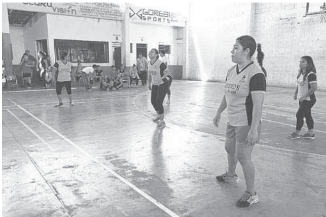
► Friend's Club esperando la ofensiva.