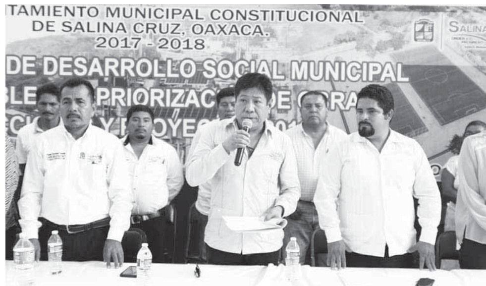
► El presidente municipal de Salina Cruz continúa realizando su trabajo en pro de las familia de la ciudad que más lo requieren.

estatal, aunado al apoyo del gobernador del Estado Mtro. Alejandro Murat Hinojosa, para alcanzar con mezcla de recursos la proyección de más obras con el objetivo de consolidar el desarrollo de Salina Cruz.