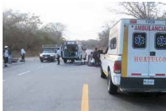
► La ambulancia llegó a apoyar a los heridos.

Corporaciones de emergencias y policiacas se movilizaron al ser enterados de un choque entre una motocicleta de la marca Yamaha contra un coche compacto utilizado como taxi, ocurrido alrededor de