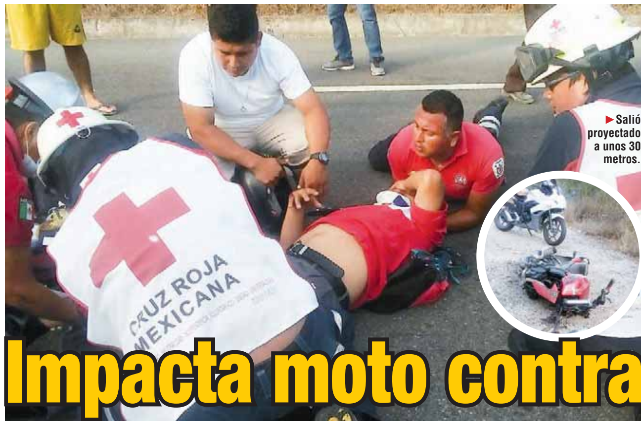
► Salió proyectado a unos 30 metros.