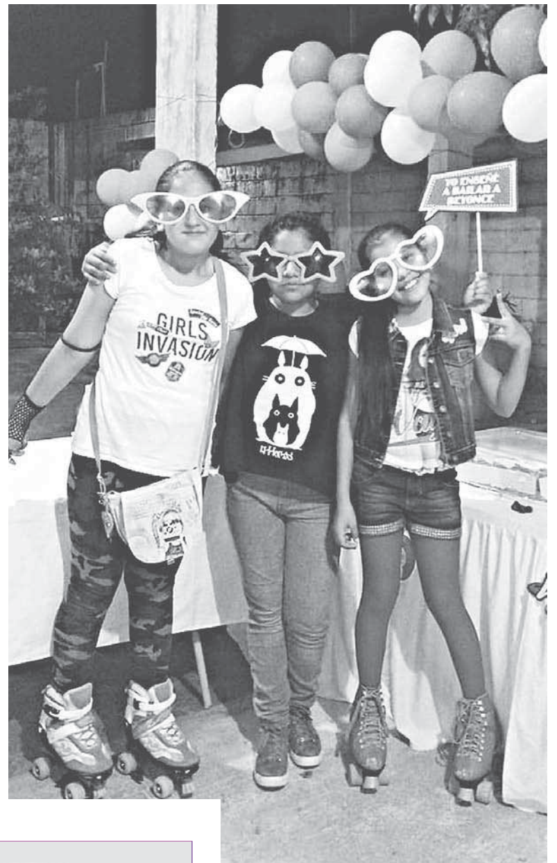
► La cumpleañosera compartió este día con sus amigas.