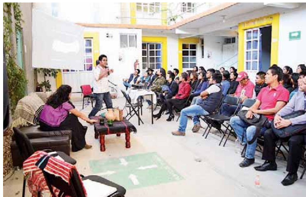
► En el sistema educativo no se contempla a los pueblos indígenas en su lengua.

Señaló que hace falta mucho trabajo en la socie-