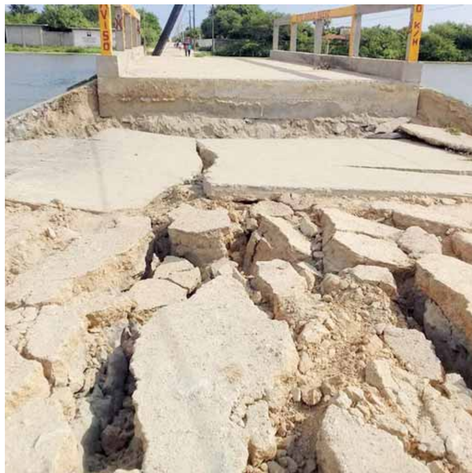
► Con el dinero donado reconstruirán las zonas más afectadas.

De hecho, también los trabajadores petroleros de la Refinería y la Terminal de Operaciones Marítimas de Salina Cruz coadyuvaron en la entrega de estos donativos para apoyar a sus paisanos en situación de desgracia en los municipios de la región del istmo de Tehuantepec.