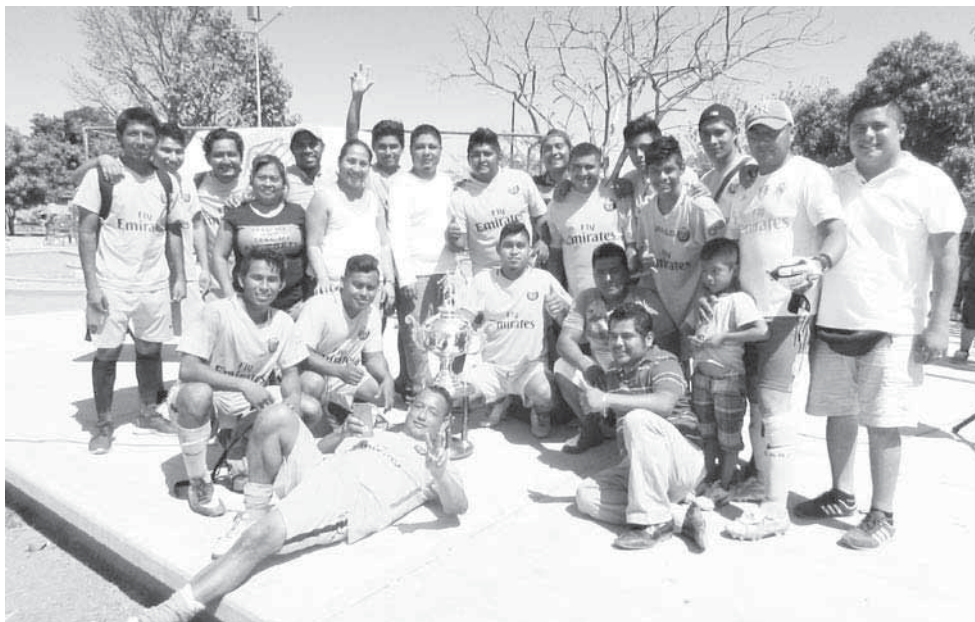
► Deportivo M-1 Campeones.