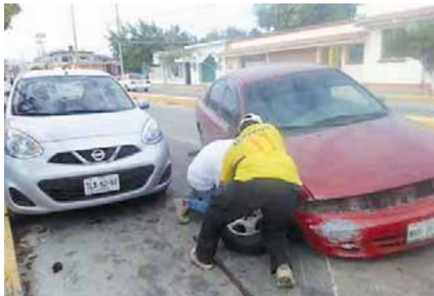
► Las unidades tuvieron cuantiosos daños materiales.