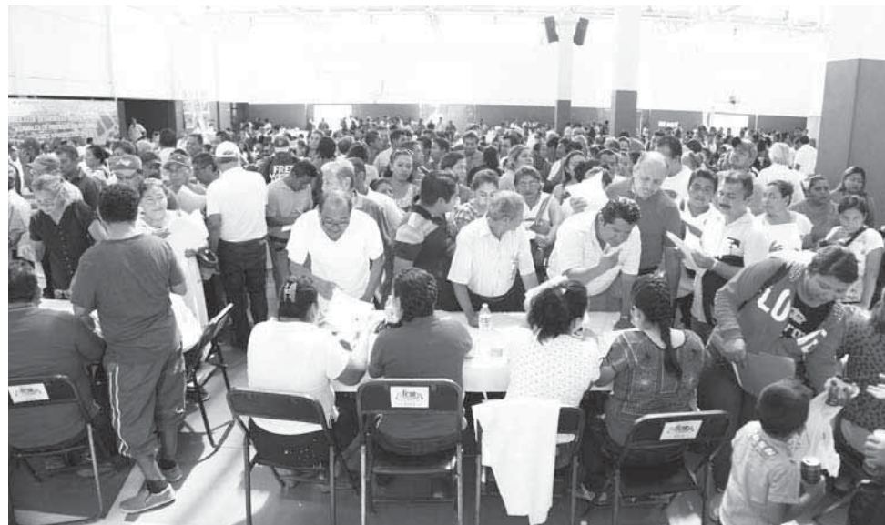
► Explican que pese que el presupuesto es insuficiente, trabajará con la gestión en las dependencias.