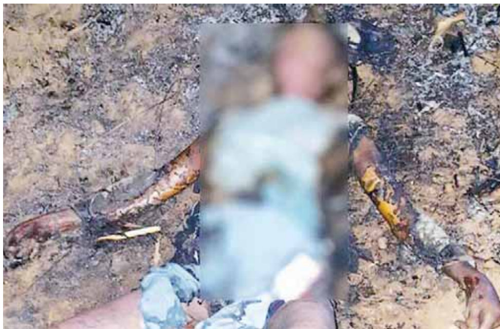
► Fue reconocido por uno de sus hijos.

El campesino prendió fuego al zacatal, pero el viento avivó las llamas que se salieron de control y que Enrique no pudo controlar, se presume que el octogenario intentó ponerse a salvo, sin embargo, fue alcanzado por el fuego y murió quemado.