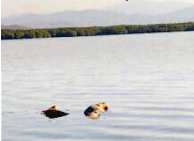
► Fueron dos cuerpos los que encontraron flotando boca abajo los pescadores de la zona.

Ala escena llegó personal de la fiscalía local para el aseguramiento de los cuerpos para trasladarlos y realizar las correspondientes prácticas de ley y establecer la causa de la muerte de estas personas, que según algunos datos aparentan entre 30 y 40 años de edad, las autoridades iniciaron las investigaciones ministeriales correspondientes.