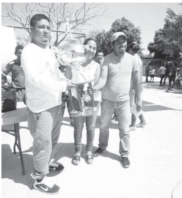
► Orejona para M-1.

Y para firmar el triunfo al minuto 86 a 4 del final Luis Márquez selló los cartones en 4-0, siendo avalado el juego con el silbatazo final de los