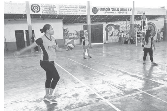
► Nere afianzando el saque.