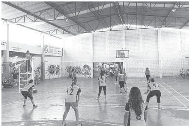
► Juego fácil de Tigritas.