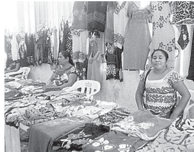
► Los artesanos se mostraron muy felices por la noticia.