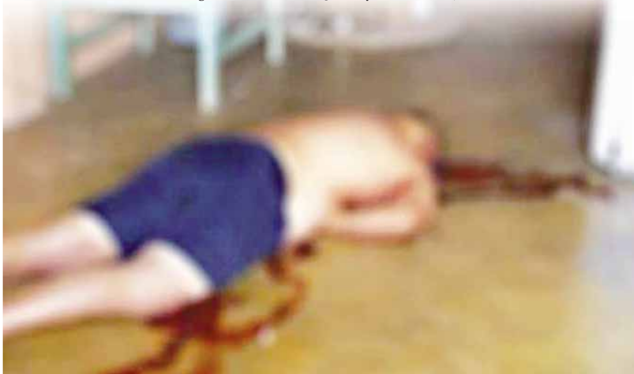
► La pareja estaba en su casa cuando fue atacado a balazos.

Asimismo, se dio a conocer además que esta persona muerta era mototaxista, quien desde hace varios años se dedicaba a este oficio.