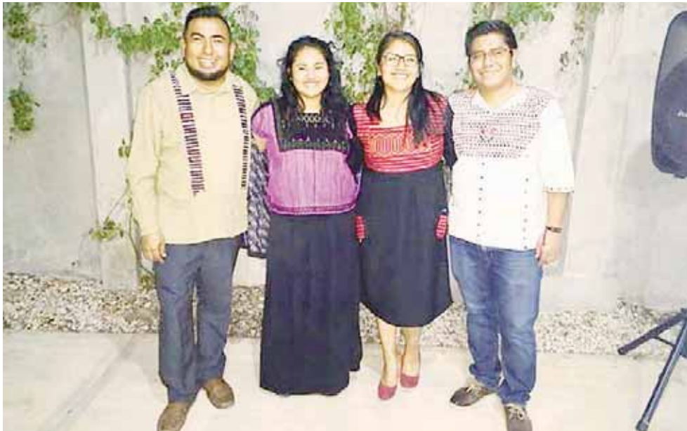
► Planificarán actividades de rescate de la lengua en comunidades interesadas.