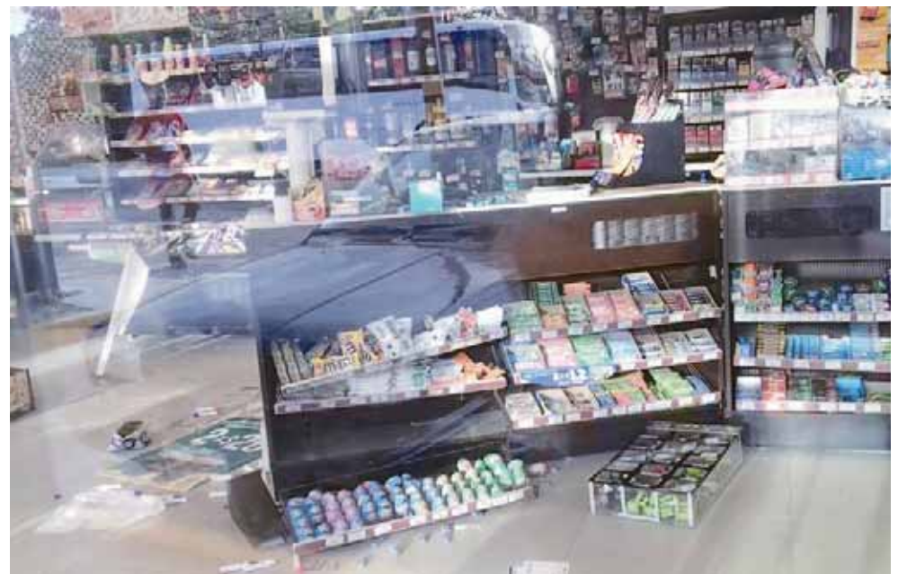
► El lugar lucía desacomodado, como lo dejaron los asaltantes.

(madrugada) cuando un grupo de al menos cuatro personas quienes de acuerdo con la Policía Estatal llegaron a bordo de dos vehículos que por las características que describieron los vecinos era una camioneta blanca y un automóvil de color negro.