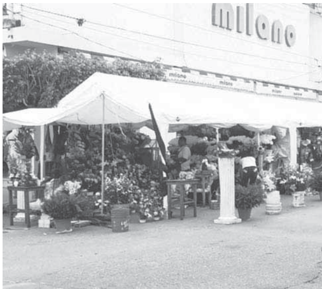
► Las ventas se realizan en el primer cuadro de la ciudad.