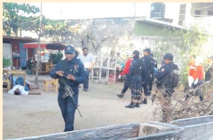
► Policías acordonaron la zona.

Balearon a tres jóvenes cuando convivían en un bar en Juchitán