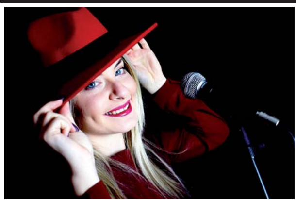
► Ella es cantante de pop en Italia.