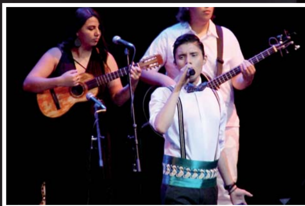
► Es un tenor oaxaqueño.