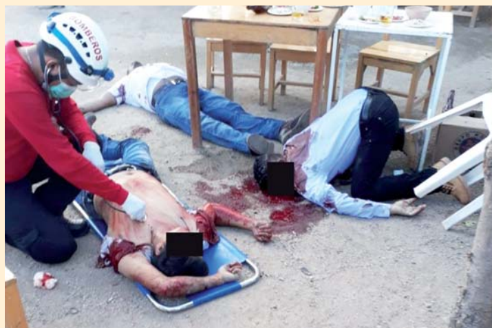
► Los cuerpos quedaron tirados en el lugar.