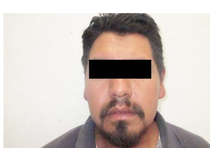
► Lo capturaron por escandalizar y descubrieron que tenía una orden pendiente por ejecutar.

Posteriormente, se consultó en el Sistema Único de Información Criminal (SUIC) de Plataforma México, la identidad de quien dijo lla-