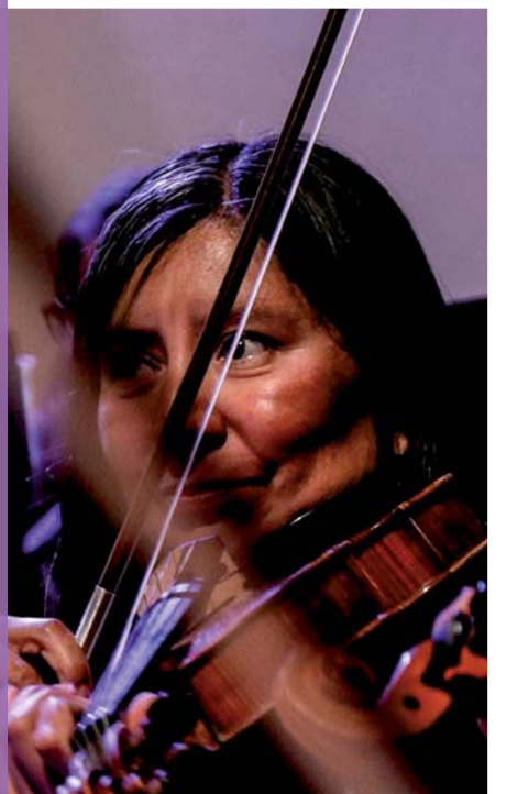
Son originarios de la colonia Vicente Guerrero, de la Villa de Zaachila.