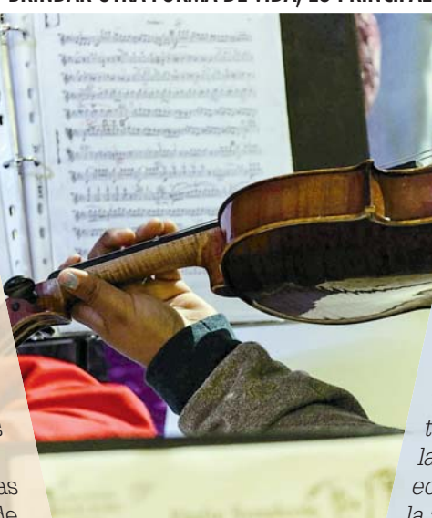
Brindan a los niños otra forma de vivir su vida.