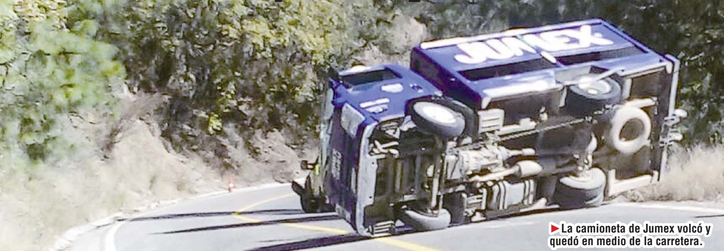
► La camioneta de Jumex volcó y quedó en medio de la carretera.