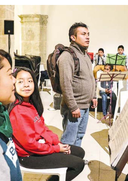
Aún se necesitan apoyos para la naciente orquesta.