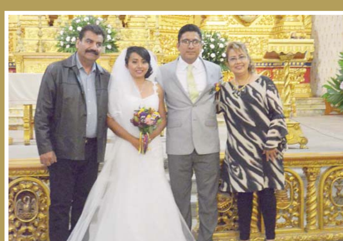
► Recibieron bendiciones por parte de sus más cercanos.