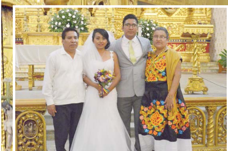
► Sus más allegados les desearon un matrimonio lleno de dicha.