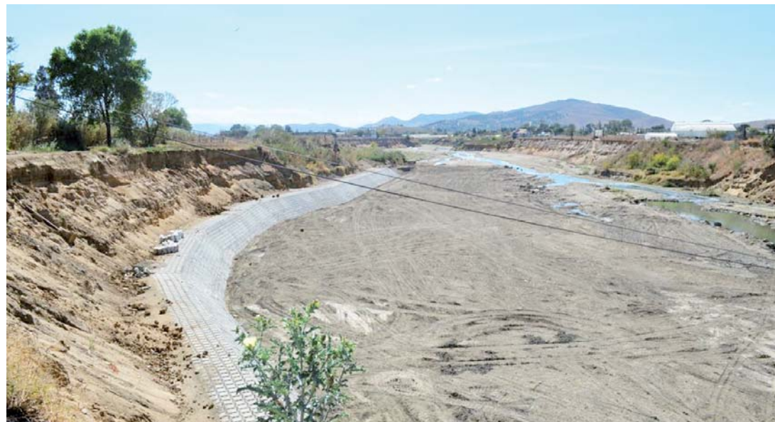
► Productores de tomates en el playón de la riberas del Río Atoyac.