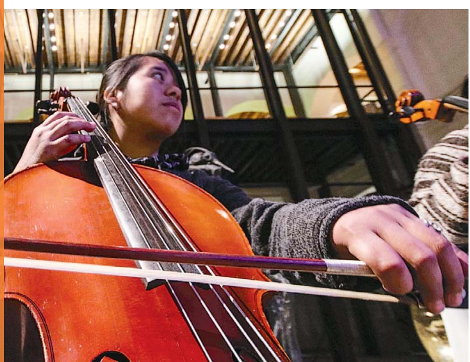
Los niños ponen su mayor esfuerzo en los ensayos.

Esa etapa a la que refiere De Boves se ha superado, pero los apoyos aún se necesitan para la naciente orquesta sinfónica. Por eso los conciertos que en febrero y abril el Coro Air France dará a beneficio de estos niños y jóvenes.