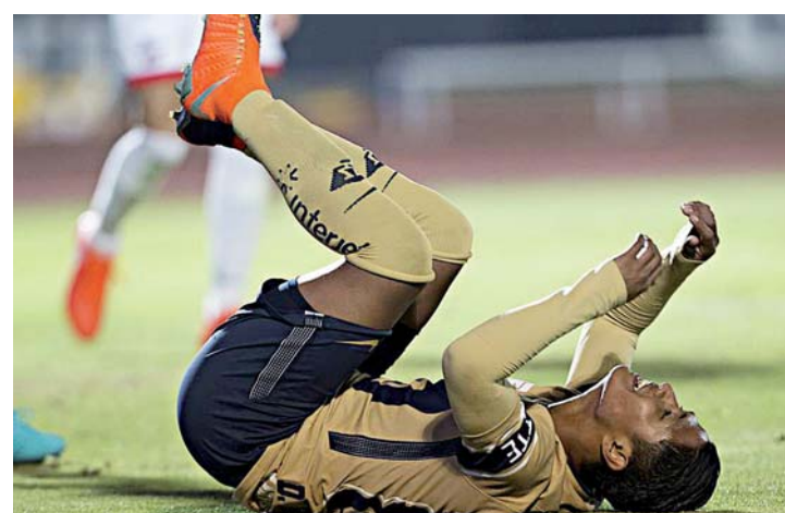
► Los felinos comienzan la Copa con el pie izquierdo.

Apenas 120 segundos después, Pumas perdió un balón e la salida, el rebote favoreció a Ávila, quien se quitó de encima a Magaña y la mandó a