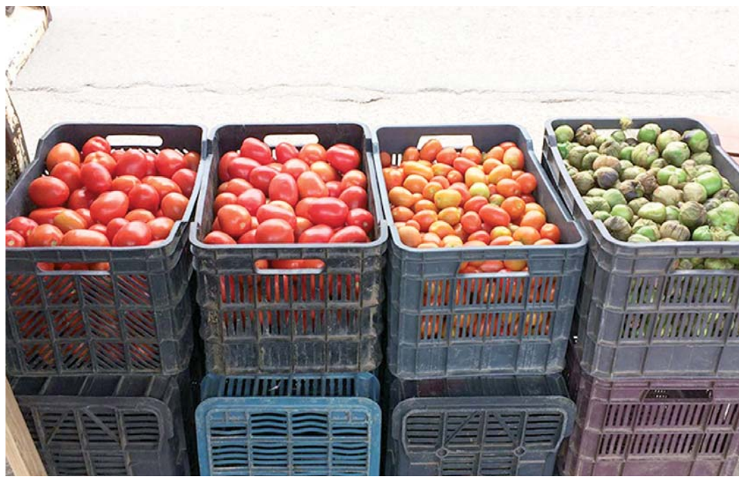
► El frío y el alza del combustible ha encarecido el tomate.

Estela García, quien desde hace varios años se dedica a la venta de este tipo de alimentos, indicó que las bajas temperaturas que se han registrado han ocasionado que la producción disminuya, aunado a esto el alza de los combustibles hace que los productores