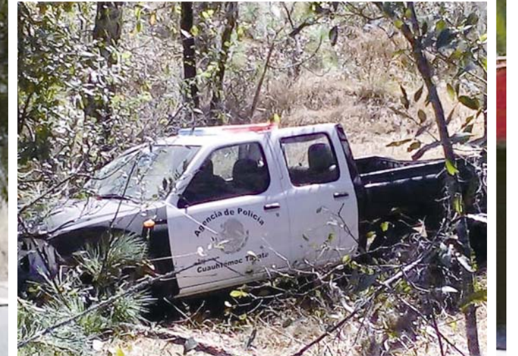
► La patrulla cayó a una pendiente de 50 metros de profundidad.

Dos lesionados y daños materiales, el saldo del accidente