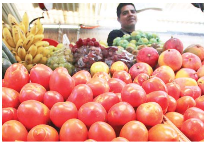
► El tomate ha elevado su precio en la última semana.