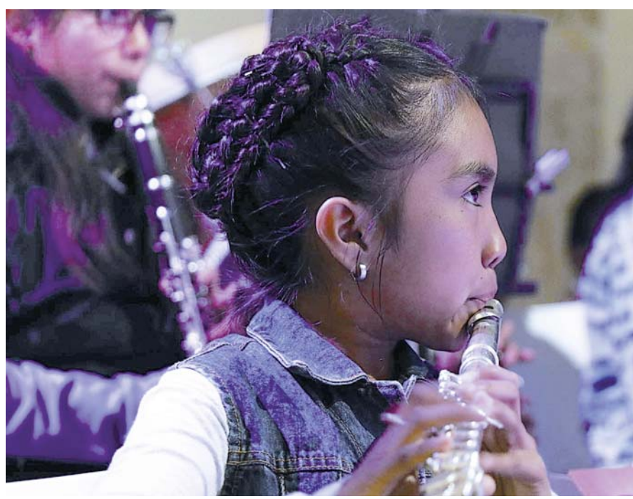
La quinta sinfonía de Beethoven se empezó a ensayar el 2 de enero.