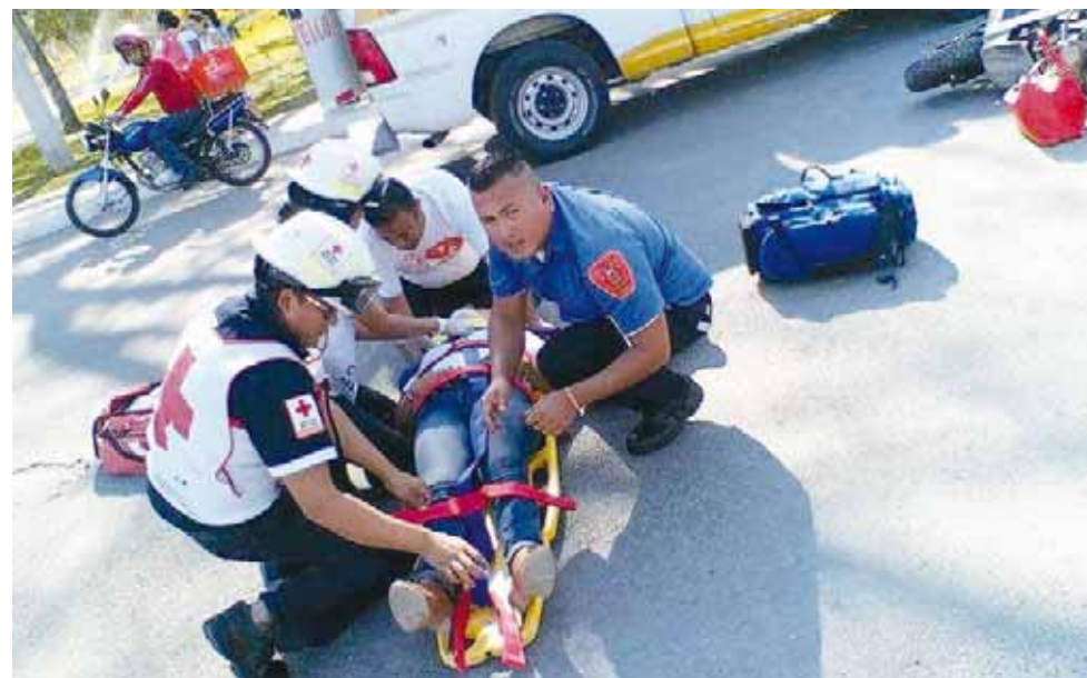
► Paramédicos brindan los primeros auxilios a la mujer lesionada.