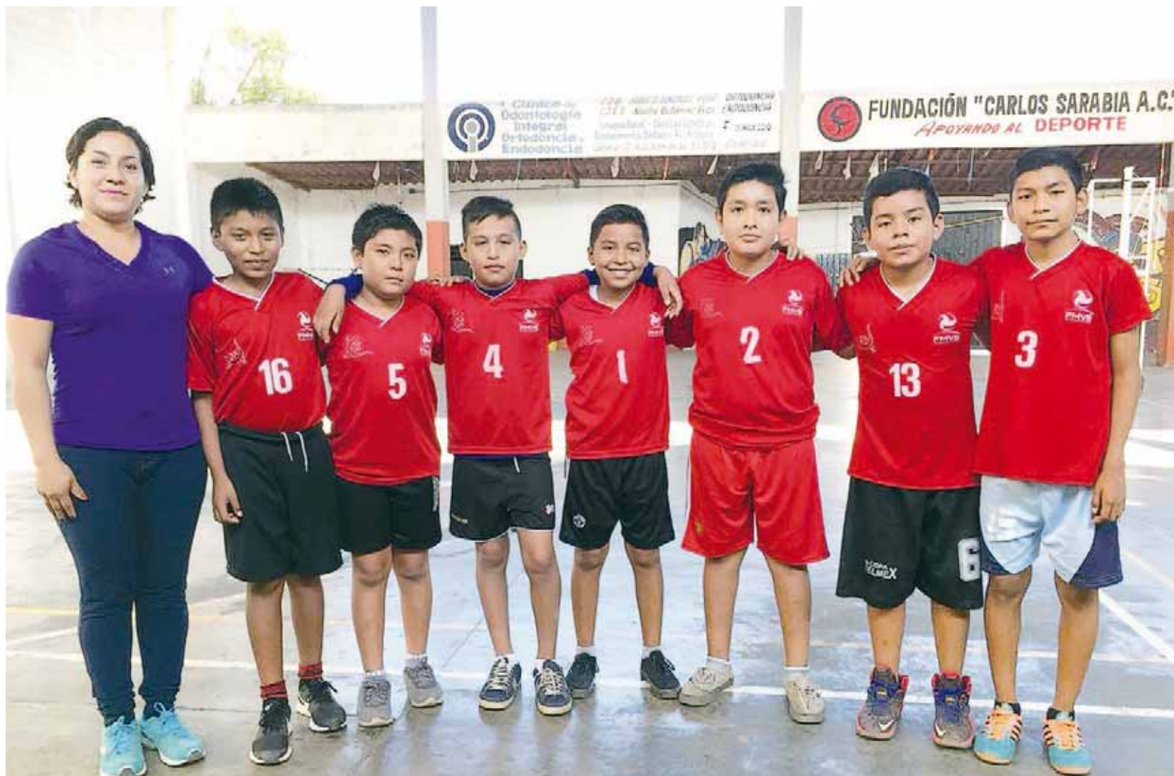
► Lagartos Jr. B no afloja el paso.

En el segundo rollo las Lagartos Jr. B, hicieron gala de su gran reacción, sin caer en la desesperación empe-