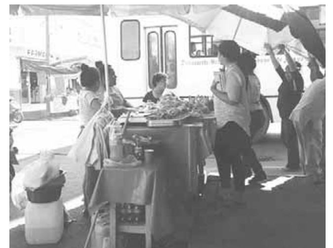
► El puesto ambulante fue retirado.

Dijo que esa persona le hizo llegar un documento solicitándole un cambio de lugar para colocar su puesto, sin embargo, nunca se le dio respuesta, ya que cada negocio tiene un lugar asignado, por lo que ya se le pidió que regresara a su lugar de origen y no ocupe nuevamente este espacio.