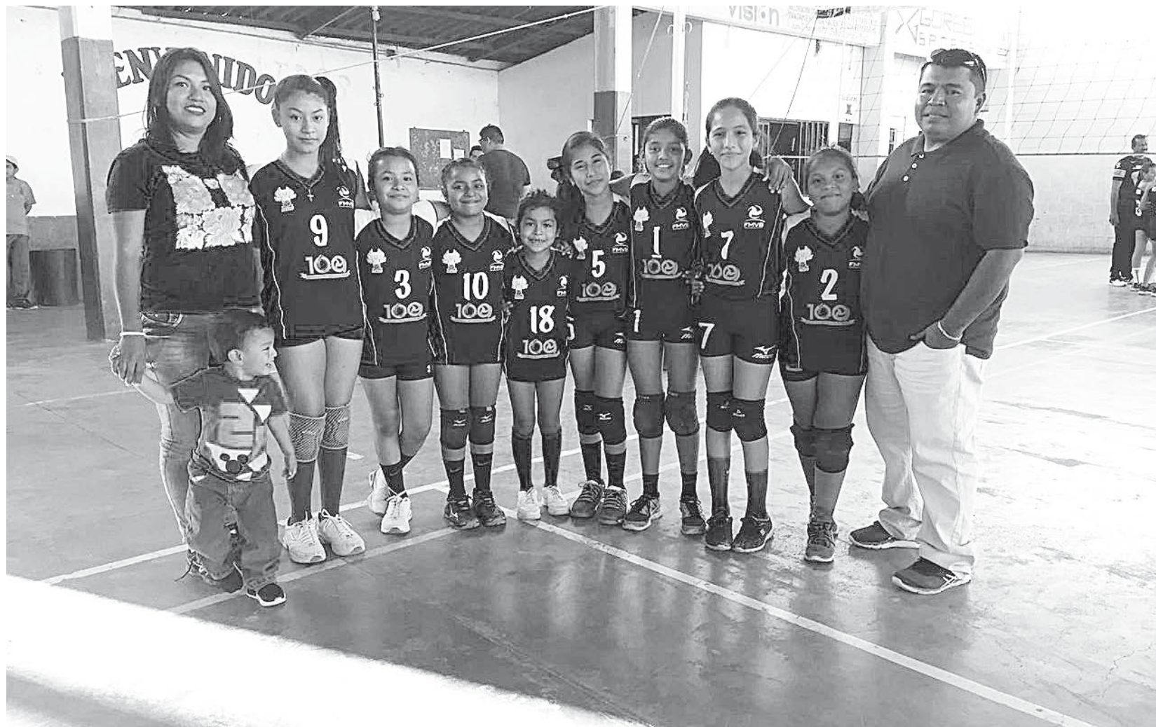
► Tekas B se metió a la pelea.

En el segundo parcial, las Panteritas sacaron las garras y le hicieron la vida de cuadritos a las Tekas B poniéndolas a sufrir, pues lo que pensaron que sería una tarde tranquila se convirtió en una tormentosa lucha de poder a poder, las anotaciones fueron fluyendo unas tras otras en una y otra área, hasta que se empató el juego a 24 unidades y tuvo que definir mediante el set point donde se adjudicaron