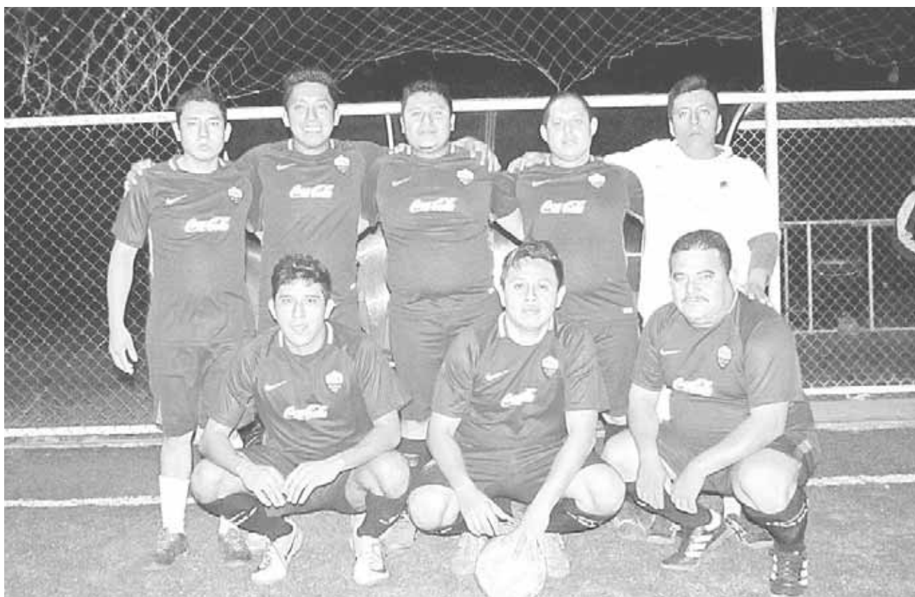
► Coca Cola líder momentáneo.