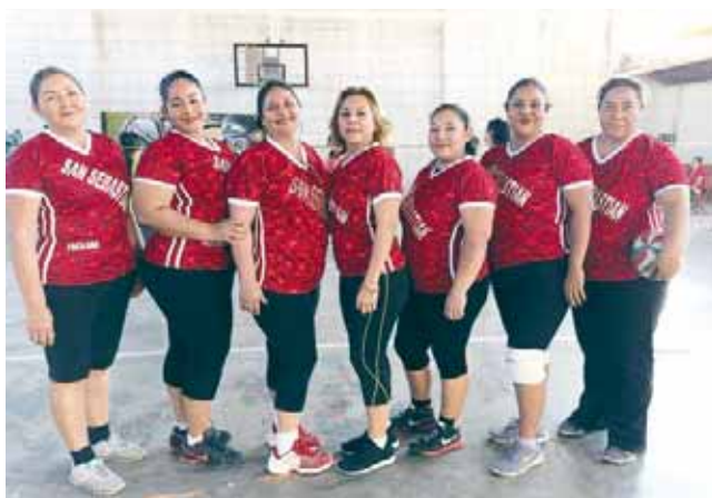
► San Sebastián se confió.

zaron de ceros y fueron poco a poco superando a sus adversarias, quienes si cayeron en el exceso de confianza y fueron superadas con