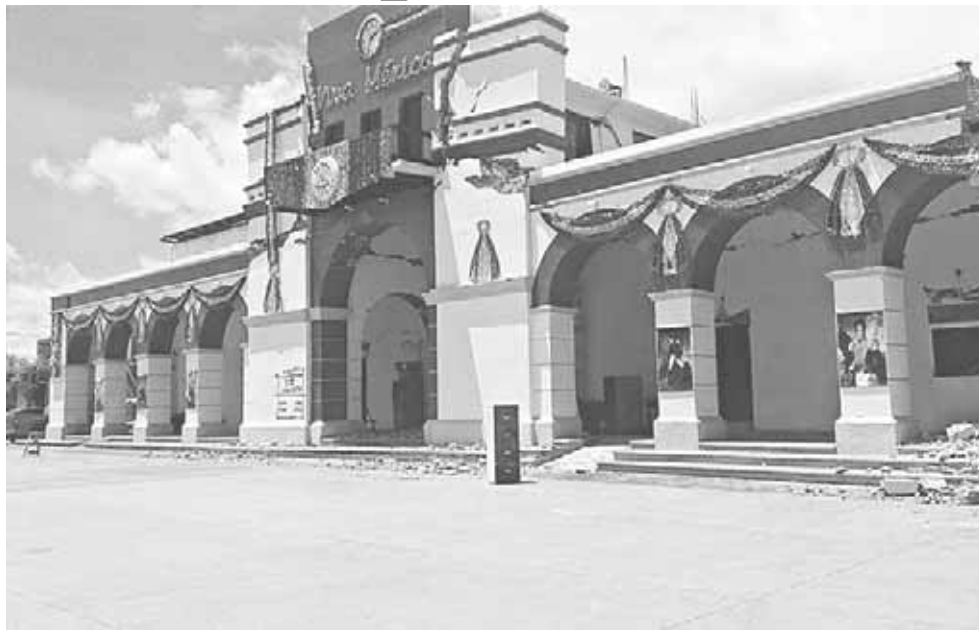
► El palacio quedó devastado después del terremoto del pasado mes de septiembre.

“Tenemos el plan de hacer la demolición del