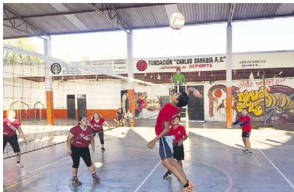
► Rematando para la anotación.

gran ventaja por las chicas de Lagartos Jr. "B" con marcador de 25/17 igualando los sets y obligando al tercero y definitivo.