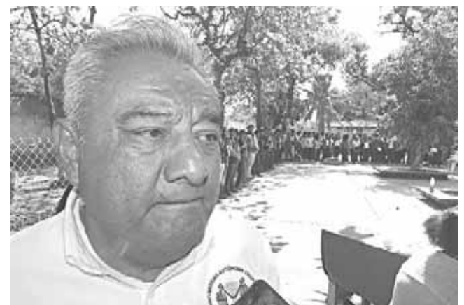
► Explican que la finalidad es que las familias puedan ser auto suficientes y auto sustentables.

Comentó que así es como han tenido una gran cantidad de solicitudes de dife-