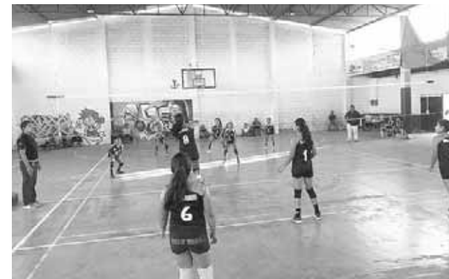
► De nervios las acciones.