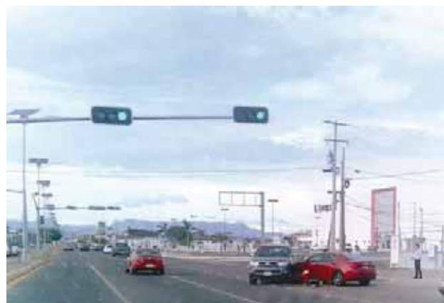
► Las unidades colisionadas en el lugar.

En este accidente se vio involucrado el conductor que conducía una camioneta Tacoma de color arena con