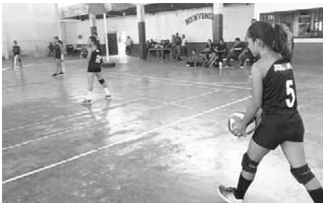
► Calculando el saque.