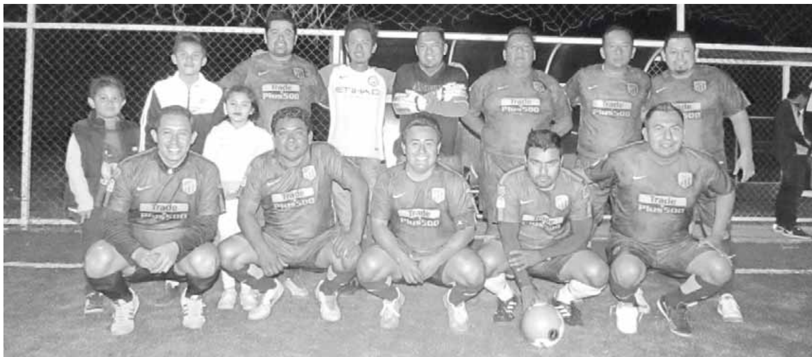
► Magisterio va sobre el liderato.