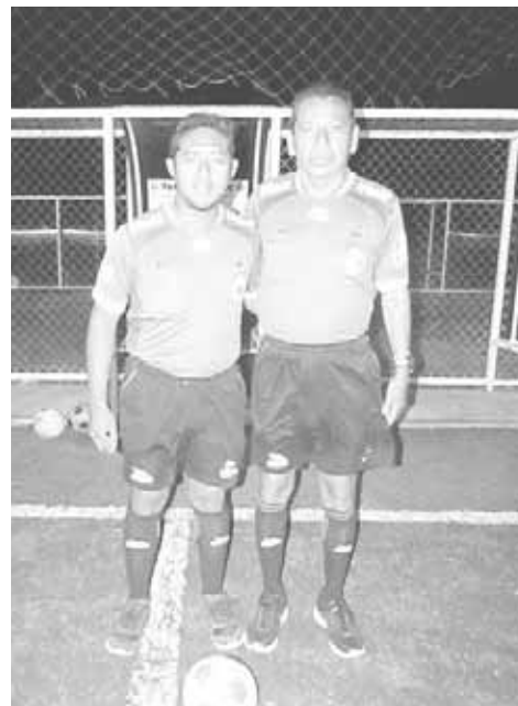
► Dupla de silbantes raudos.