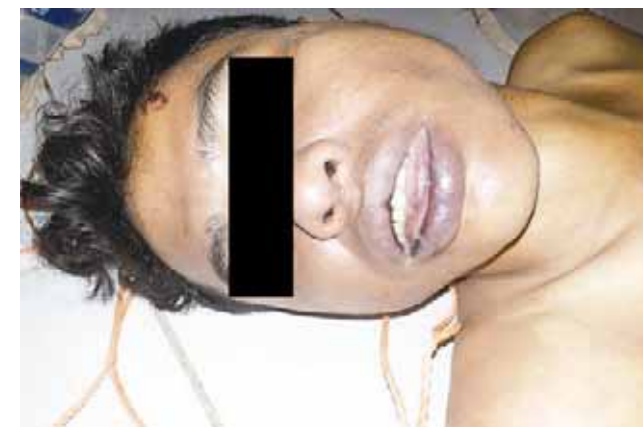
► El hombre era de origen guatemalteco.

De la discusión, el joven guatemalteco perdió el control y decidió quitarse la vida colgándose