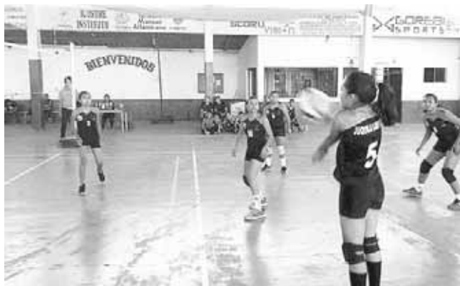
► Aguerrido el duelo.