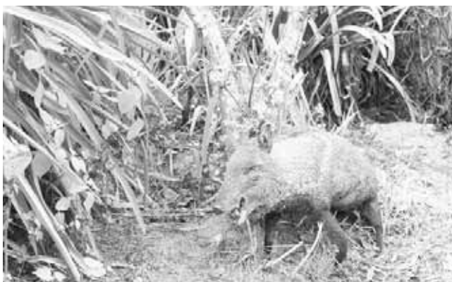
► Se ve fauna silvestre como venado, jabalí, tejones, zorras, entre otros.