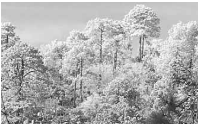
► En el bosque se pueden avistar plantas como orquídeas de diferentes colores.

El clima frío también favorece los proyectos de cría de truchas, gastronomía que se ofrece a los visitantes en sus diferentes preparaciones. "Todo lo que nos da la naturaleza se aprovecha, por el frío también se da la manzana y el durazno", comenta la autoridad.