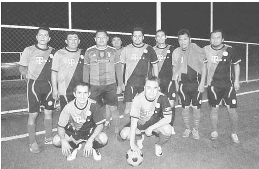
► Unistmo sin unidades.