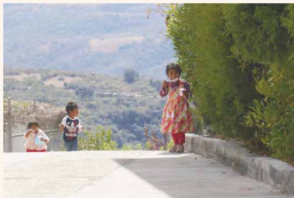
► Niños caminan por las calles.

Pasa el medio día y sobre la calle principal, la única que está pavimentada, están varios niños los pequeños comiendo y platicando. Su inocencia es evidente, su conversación gira en torno a la velocidad con que se comen un yogurt, todo lo dicen en mixteco, lengua natal que aprendieron de sus abuelos.