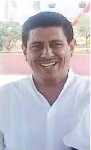
► SALOMÓN JARA CRUZ Lo cuestionan

Pobreza Extrema en el Estado de Oaxaca”, el cual atestiguó el titular de Sedesol, con el cual a partir del 1 de enero del 2018, 203 municipios del Estado que se verían beneficiados con la venta de leche Liconsa a un peso el litro, ahora la recibirán de manera gratuita, gracias a la aportación de 7.4 millones de pesos que hará el gobierno estatal para beneficiar con este fortificante a las y los habitantes de estas comunidades... Iniciamos la semana el pasado domingo haciendo entripados. Y no es para menos. Siempre hemos dicho que ésta como la anterior legislatura se ha caracterizado no sólo por ser una de las más improductivas sino una de las más onerosas y opacas a nivel nacional. Porque los y las señoras diputadas validan a las comisiones y órganos de transparencia y acceso a la información, pero jamás rin-