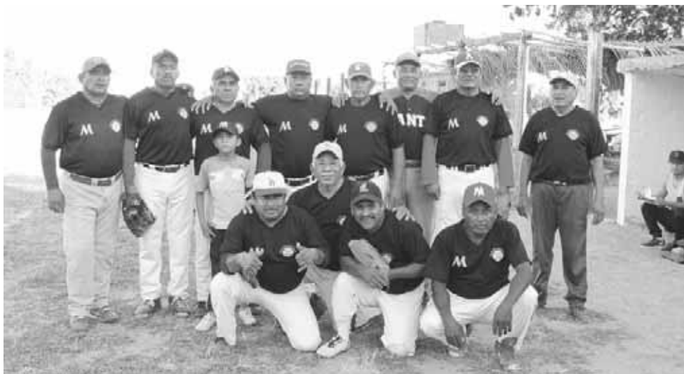
► Mixtequilla, contra la pared.