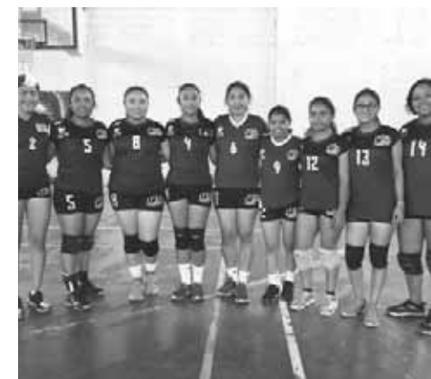
► Salina Cruz se queda en el camino.

de el inicio del partido empezó a producir unidades. La ofensiva del Tecnológico de Salina Cruz no pudo plantarse bien en el terreno de juego, dejando la zona defensiva vulnerable, lo que fue aprovechado por las chicas del Tec del Istmo, que se adjudicaron el primer set por 25/5.