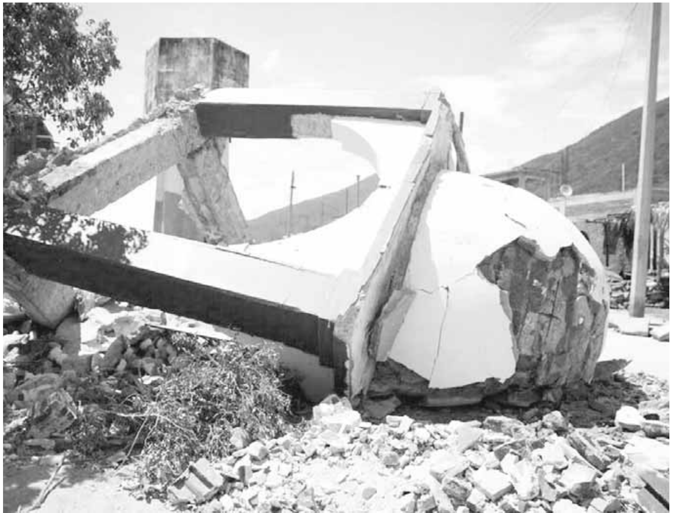
► Afectaciones en el municipio de Santiago Astata.

No obstante, denunciaron que han pasado tres meses y no ha habido apoyos a Santiago Astata a pesar de que el gobierno federal se comprometió a ayudarlos a través del Fondo de Desastres Naturales.