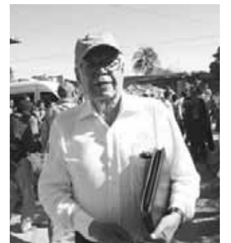
► El secretario de Salud federal.