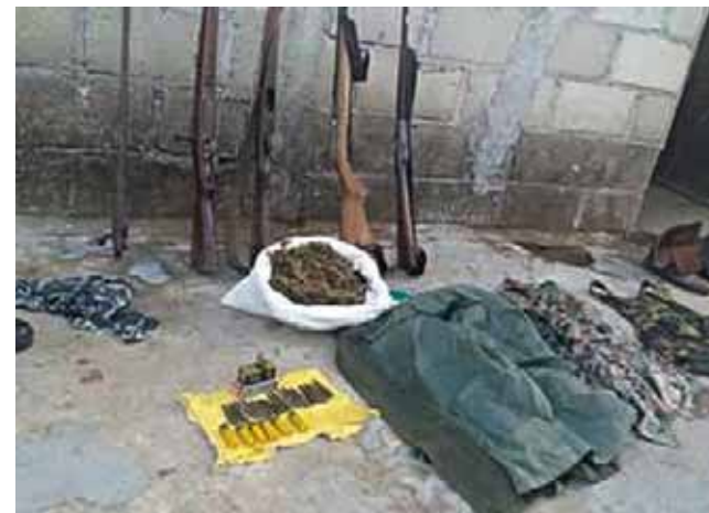
► Hallaron armas y otras evidencias en un cateo en su casa.