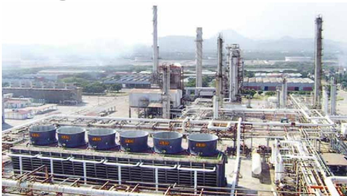
► La Refinería Antonio Dovalí.

aterrizaron en el aeropuerto de Huatulco y fueron trasladados vía terrestre a Salina Cruz, con los que se daría solución a las fallas registradas en el sistema que dejó el terremoto, sin embargo, al momento la planta opera de manera irregular.