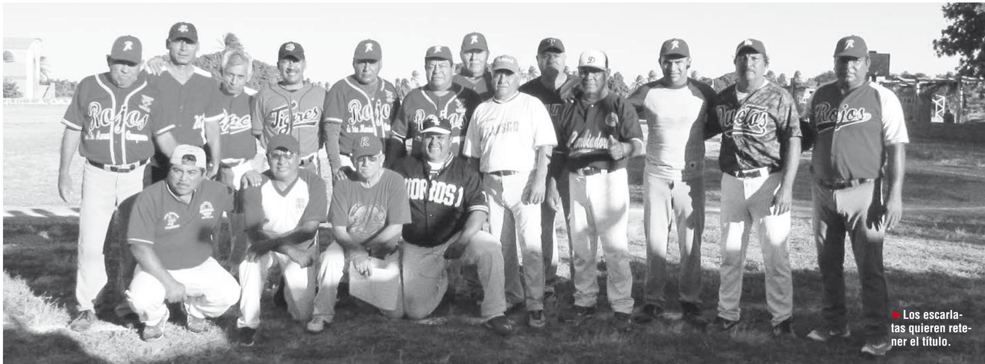
► Los escarlatas quieren retener el título.