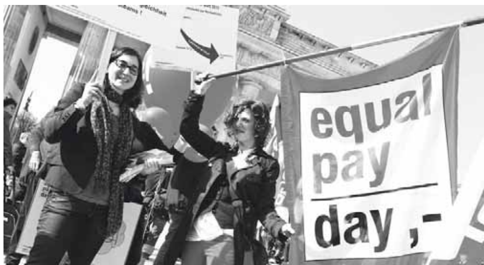
► Protesta por la desigualdad salarial en Berlín.

Las cosas empeoran. Si todo sigue como hasta aho-