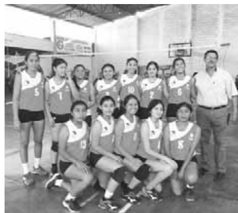
► Istmo avanza en la ruta hacia el título.

Lo que se vislumbraba como un juego de los más cerrados se definió en pocos minutos, ya que el plantel del Tecnológico del Istmo salió con una ofensiva arrasadora y des-