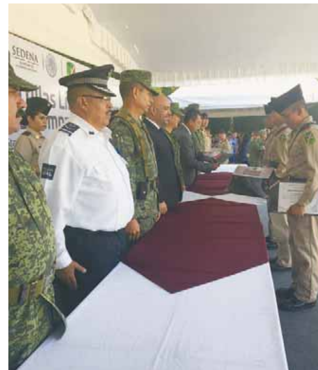
► 102 hombres concluyeron su servicio militar.