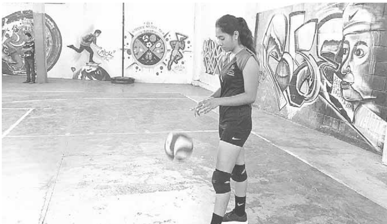
► Con mejor oficio Panteritas.