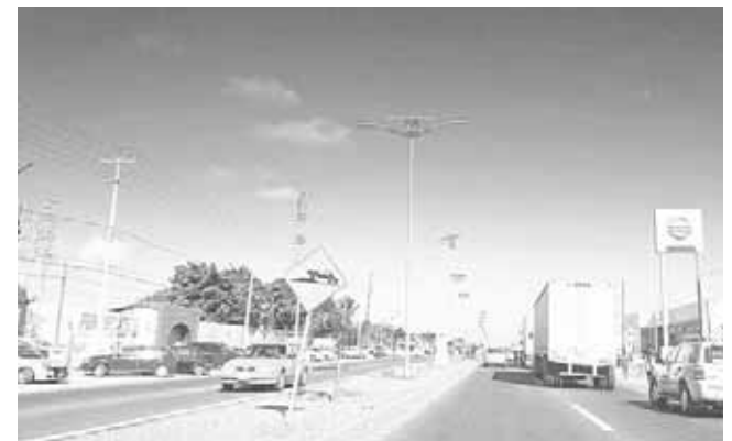
► Los inconformes acusaron a Protección Civil de pasividad.

“Por supuesto que la Sección 22 no se hará responsable en caso que un aula se desplome o toda la escuela completa, queremos que el gobierno conjuntamente con las instancias verifiquen personalmente cada una de las escuelas y certifiquen el estado en que se encuentran”, añadieron.