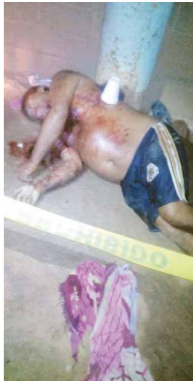
► El hombre fue asesinado afuera de su domicilio.

En las oficinas del Ministerio Público fue abierta una carpeta de investigación por el delito de homicidio calificado en contra de quien o quienes resulten responsables.