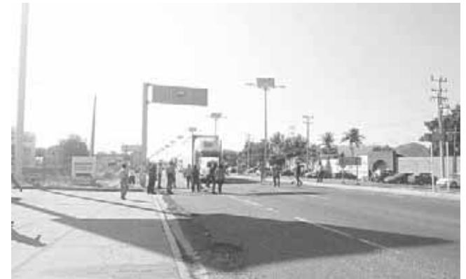
► Aseguran que hay estructuras en grave riesgo que requieren atención.