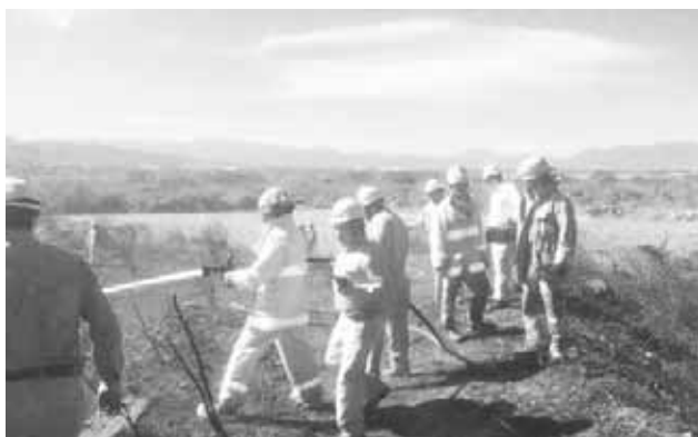
► Las autoridades exhortan a la ciudadanía a evitar realizar quemas en pastizales.

La gerencia de la Refinería informó que el personal de PEMEX está preparado para actuar de manera inmediata, eficiente y segura, ante cualquier eventualidad no deseada dentro y fuera de las instalaciones.