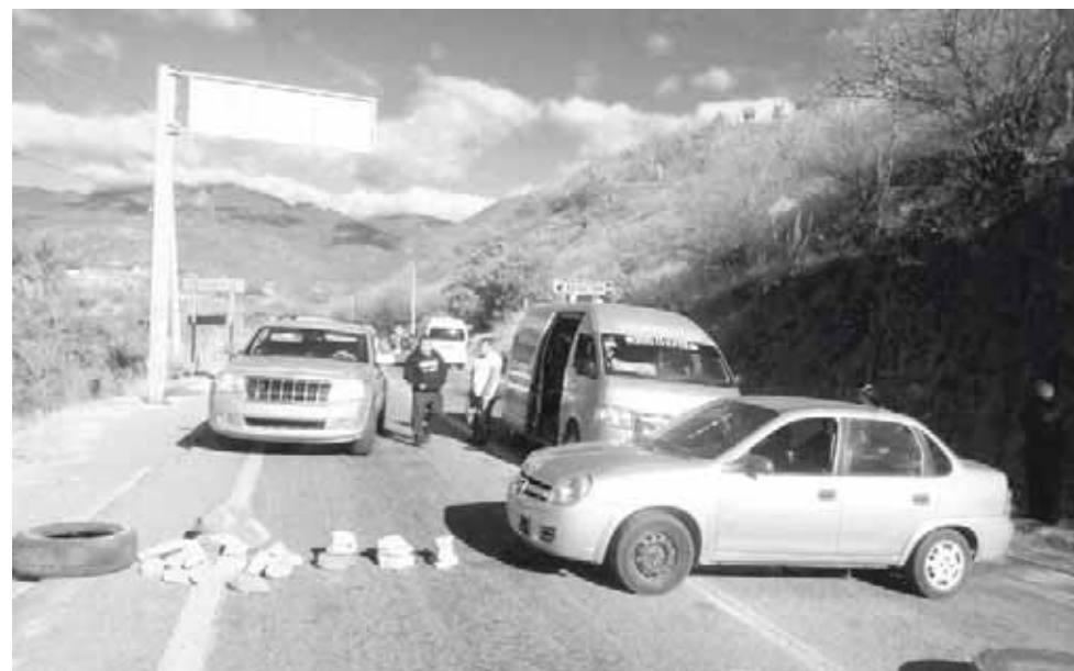
► Los bloqueos de la CNTE por varias horas de este miércoles.

Los maestros, en algunos puntos acompañados por padres de familia, exigieron la reconstrucción de más de mil escuelas dañadas por los sismos