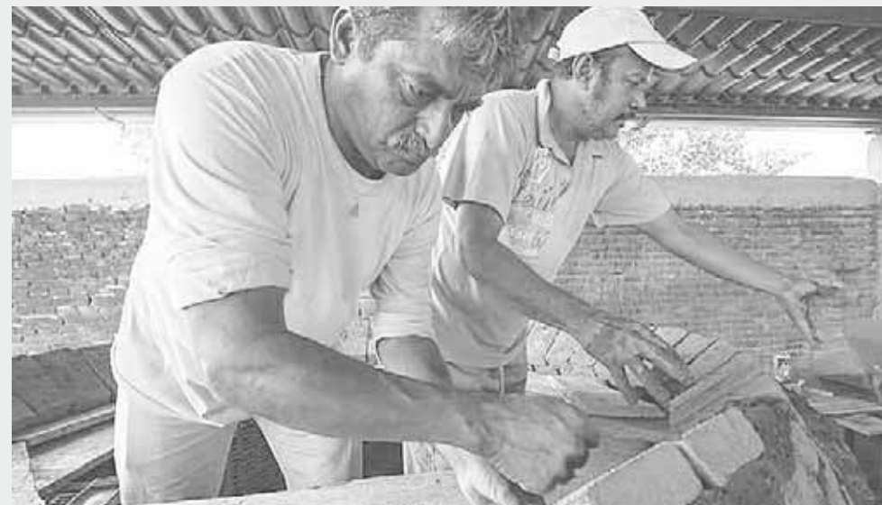
► Hasta la fecha, la organización lleva 44 hornos contruidos.