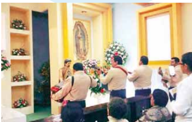
► Celebrando a la Guadalupana en la capilla de la colonia Petrolera.