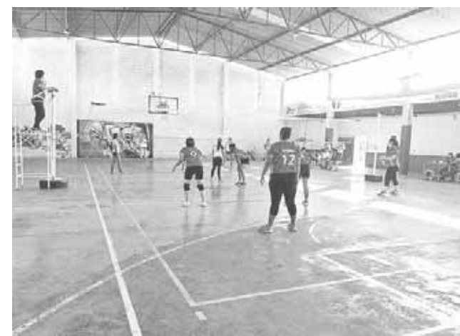
► Esperando para la recepción.

San Sebastián mantiene su posición en la tercera escalinata en tanto Mamás Tecuanis luchará todavía por meterse a la fiesta grande.