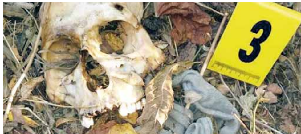
► Ambos occisos eran originarios de Matatlán, Tlaxolula.