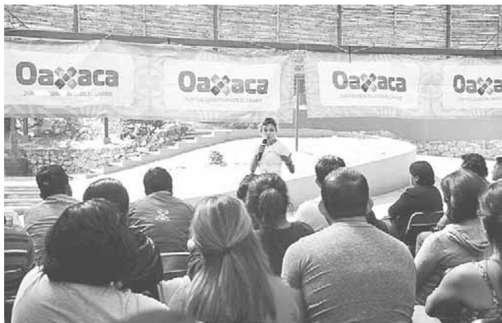
► El objetivo fue dar continuidad a los beneficiados de las activaciones físicas.

General de la CECUDE, consideró que es indispensable dotar de herramientas a quienes desde los ayuntamientos tienen la tarea de promover el deporte, por ello, señaló que la CECUDE en coordinación con el ICA-PET y el SICCE Deporte impartirá cursos de capacitación en materia deportiva, "de manera que quienes sean instruidos podrán replicarlos y formar personal preparado para la difusión y aplicación de la Recrea-