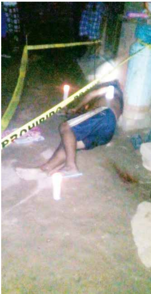
► La familia dice desconocer quién pudiera tener motivos para dañara al occiso.

Dentro de su domicilio le dieron muerte a balazos, sus familiares exigen sea investigado el caso