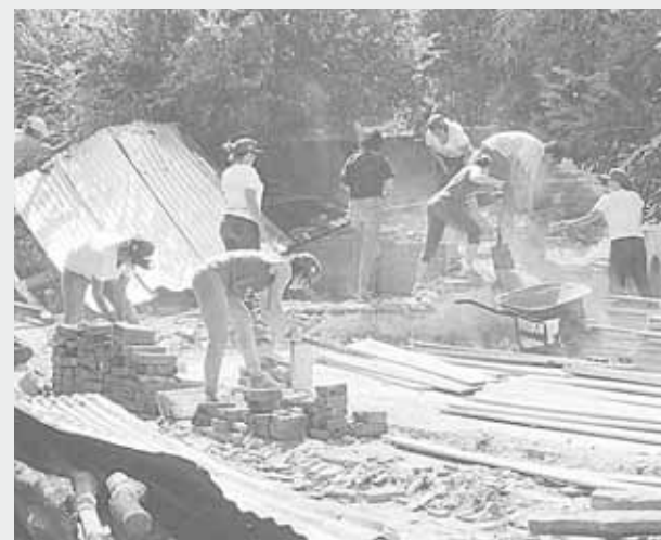
► Su objetivo actual es beneficiar a 50 familias.