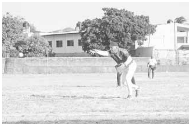
► Tommy se llevó la derrota.