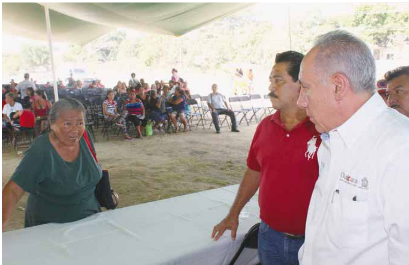
► Buscan beneficiar a los comuneros que enfrentan los estragos de las bajas temperaturas.

El coordinador de Protección Civil visitó a comuneros, entregó apoyos y resaltó la necesidad de organizar comités de Protección Civil