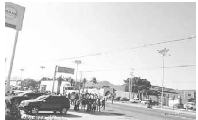
► El terremoto dejó pérdidas en más de 20 escuelas y otras 50 con daños superficiales.