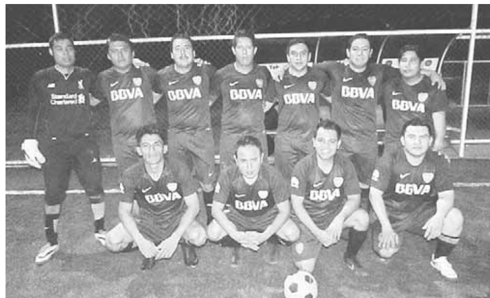
► Apollo remontó y ganó.