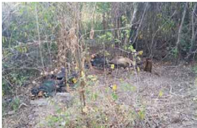
► El hallazgo atrajo la atención de las autoridades locales y del estado de Guerrero.

Cabe señalar que dicho hallazgo atrajo la atención de las autoridades de las comandancias locales y del estado vecino de Guerrero, donde han existido múltiples desapariciones y secuestros.