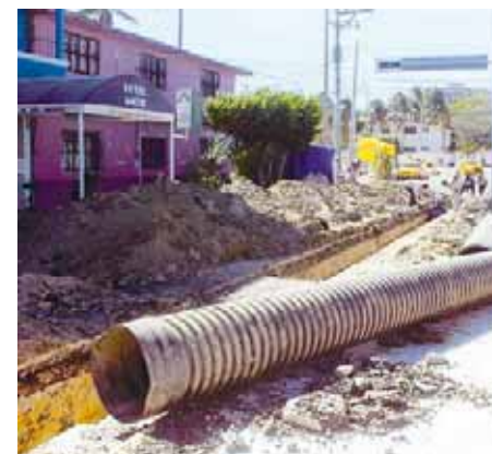
► Supervisan los trabajos de rehabilitación de la red de drenaje en la calle Progreso.

Enfatizó que se está trabajando en el bienestar social y colectivo de las familias salina-crucenses, siendo un gobierno humanista, de servicio, ayuda y bienestar para la sociedad.