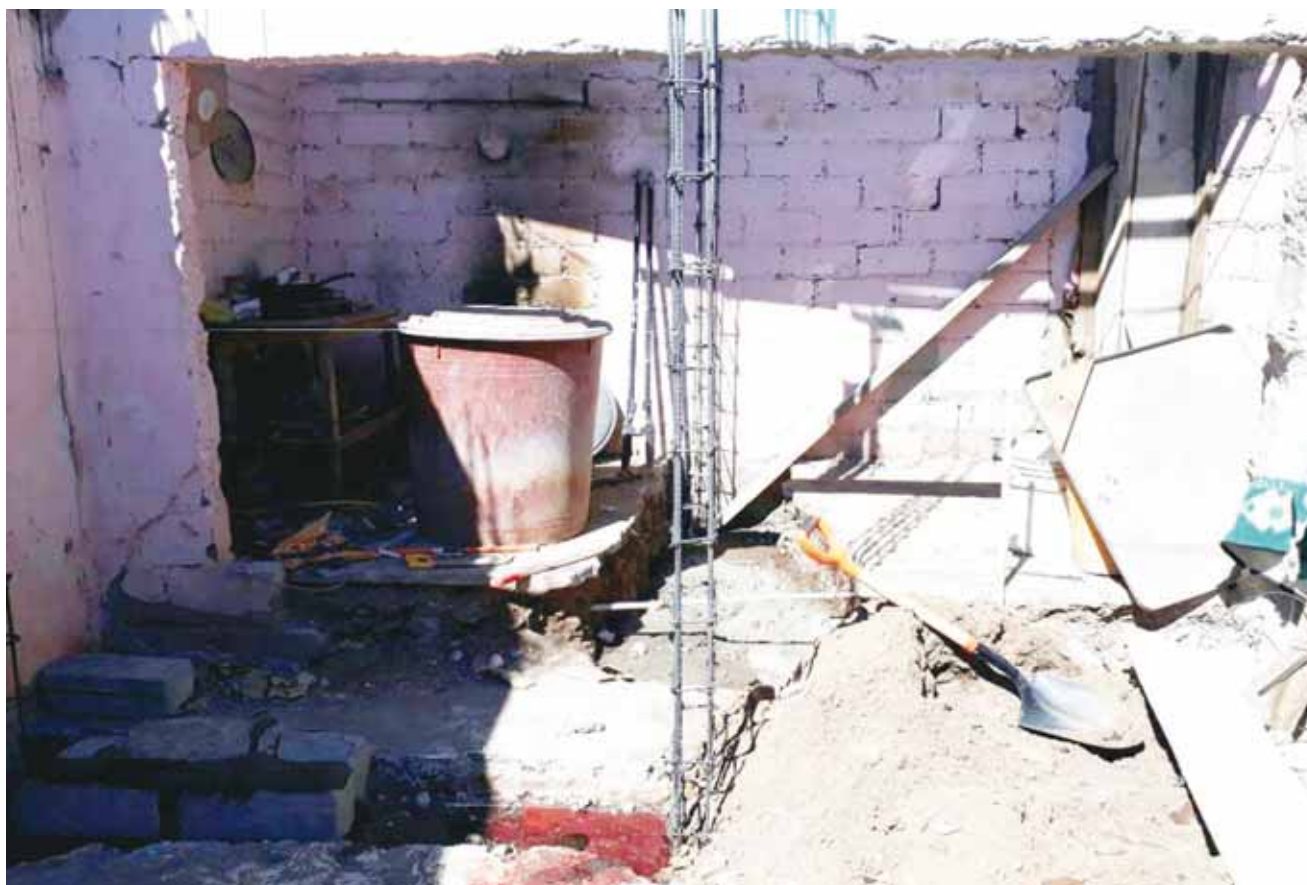
► El occiso fue atacado a balazos con armas de alto poder.