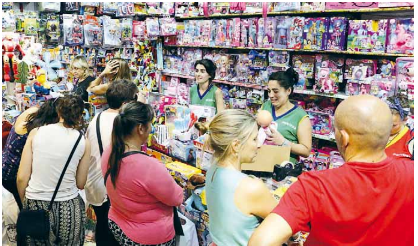
► Comerciantes dejan a tras su racha de pérdidas.

Dijo que en la actualidad, afortunadamente, no hay cierre de cortinas simplemente cambian de giro, mucho negocios no aguantan las ventas bajas ya que los propietarios deben cubrir sus cuentas.