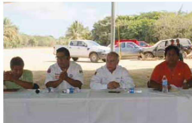
► Agradecen el apoyo otorgado a los comuneros de San Pedro Pochutla.

que traen a los comuneros y demás habitantes que son beneficiados con colchone-