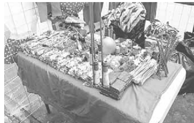
► Denuncian la venta de pirotecnia abierta y sin control.

peligro latente tanto para esas mismas personas como también para los negocios establecidos a quienes nadie les responderá si se llega a presentar un problema como el de hace dos años. EXPLICÓ QUE es notorio que los mismos líderes están protegiendo a sus agremiados ambulantes ya que ni ellos actúan, se supone son una organización donde hay