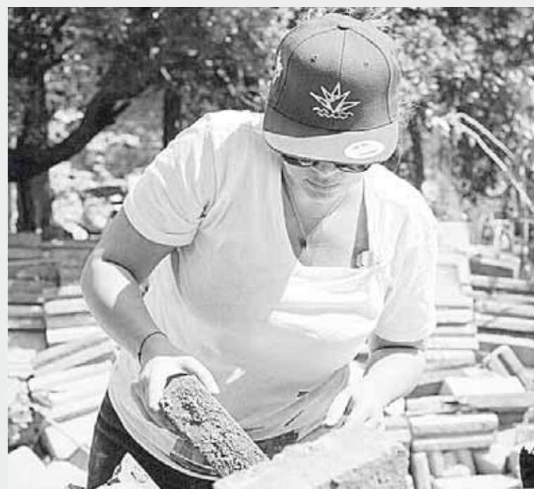
► La organización nació por la necesidad de los habitantes de Ixtaltepec.

prar la materia prima, no tiene un sueldo y es necesario que se den cuenta todo lo que vale su trabajo, que realmente sirva para llevar el sustento a sus hogares, también queremos iniciar el proyecto en Unión Hidalgo donde tenemos ya a por lo menos 15 familias e irnos moviendo a otras comunidades que también lo necesitan, necesitamos multiplicar el apoyo, necesitamos multiplicar el pan en el Istmo”, apuntó.