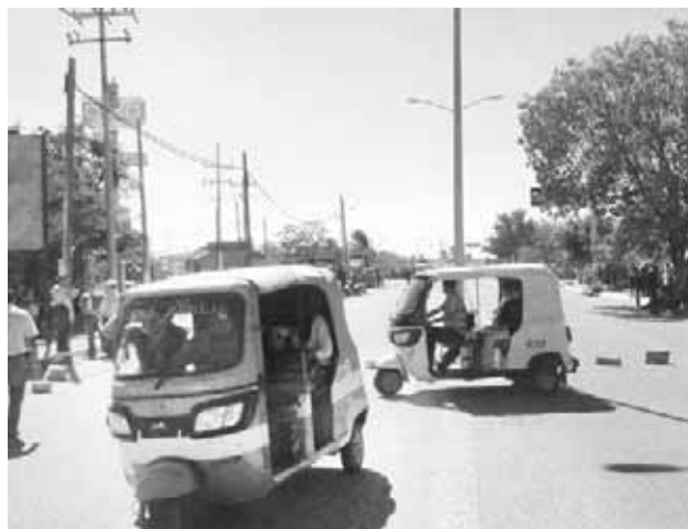
► Mantuvieron incomunicado al Istmo con Chiapas y Veracruz.