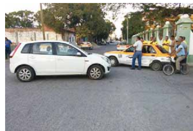
► Los vehículos fueron trasladados al encierro local.

Después de varios minutos en el que los agentes realizaban el peritaje, fue necesario retirar ambas unidades de aquel lugar para ser trasladados al encierro local para sus respectivos resguardos en espera de que el responsable cubra los daños que ocasionó.