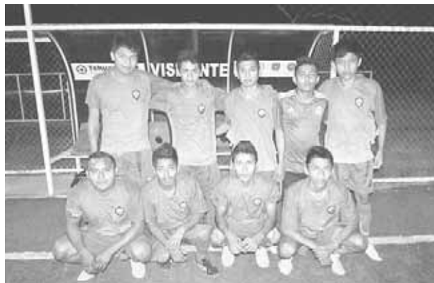
► Yema de Oro se perdió en el terreno.