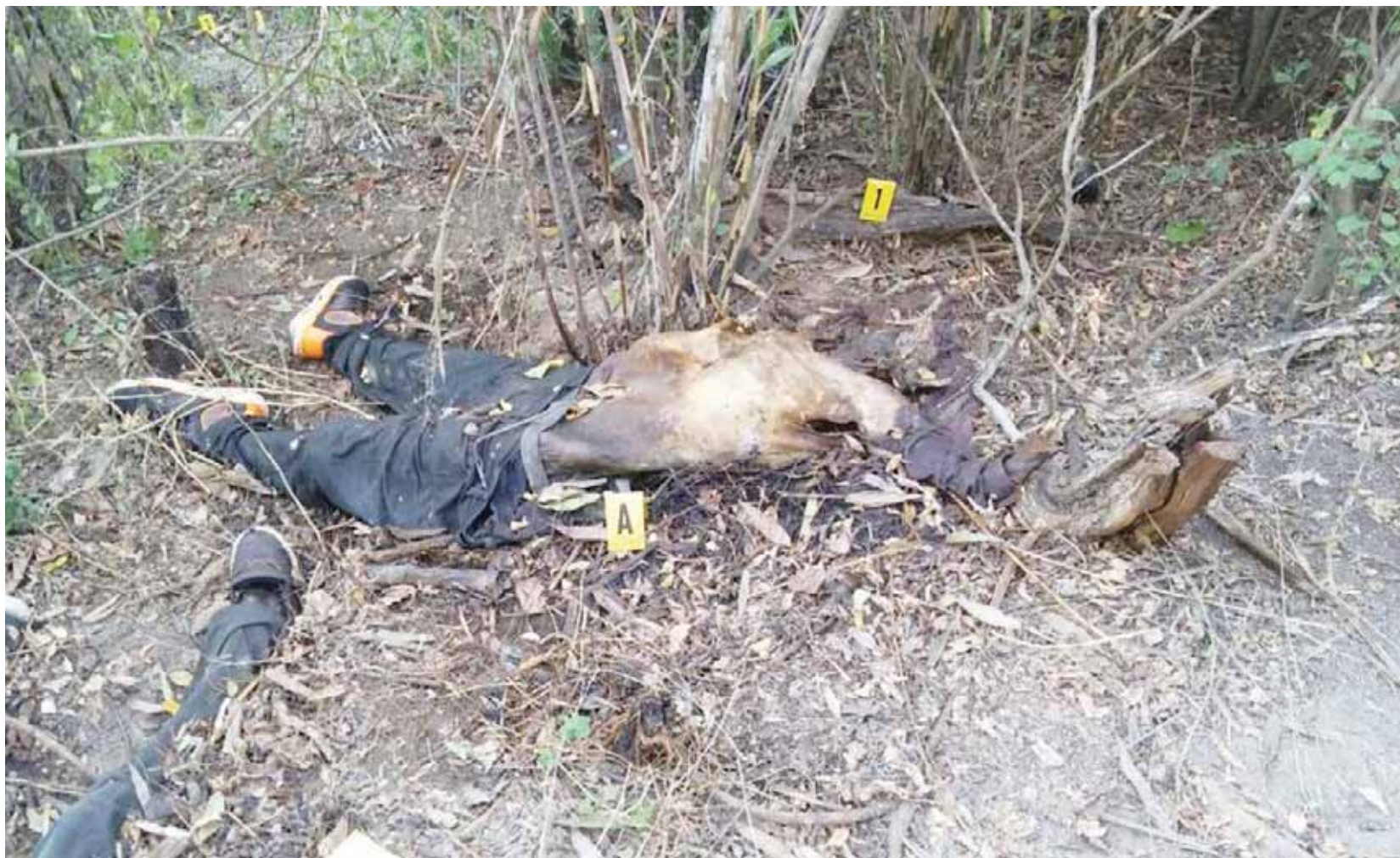
► Ambas personas estaban reportadas como secuestradas desde el pasado 15 de noviembre.

El macabro hallazgo fue realizado por campesinos y atrajo la atención de los poblados aledaños e incluso del estado de Guerrero