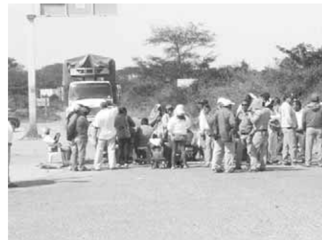
► Los inconformes impidieron el paso hacia la capital del estado.