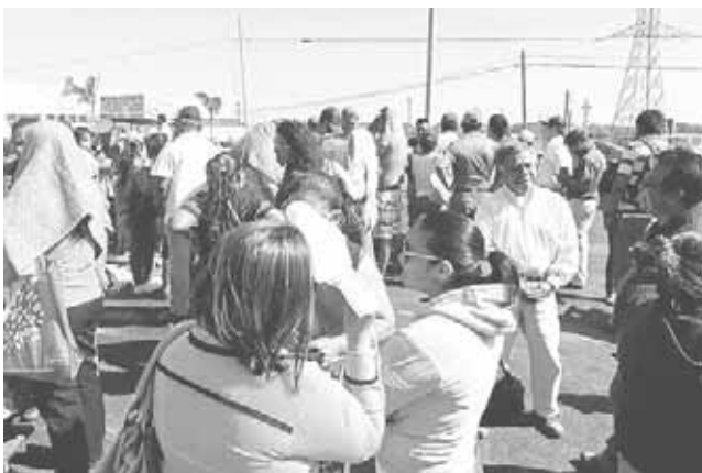
► En Salina Cruz, hay cuatro escuelas que fueron demolidas.

Los profesores denunciaron que los gobiernos no han restaurado poco más de 100 escuelas