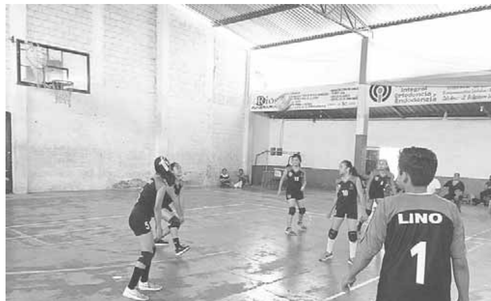
► Buena Recepción.

Panteritas se mantiene en el lugar catorce en tanto Lagartas Jr. "A" no pudo salir del vigésimo escalón.