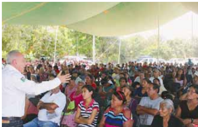
► Conminan a los ciudadanos a estar preparados por cualquier contingencia.