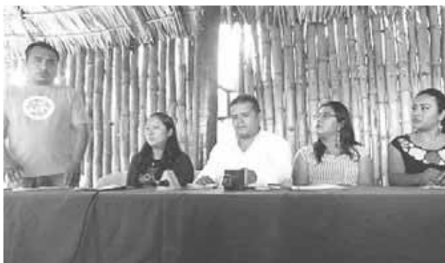
► Exigen la aplicación correcta de los recursos del presupuesto 2018.

El delegado federal es acusado de desviar los recursos del programa empleo temporal destinado a los pueblos del Istmo