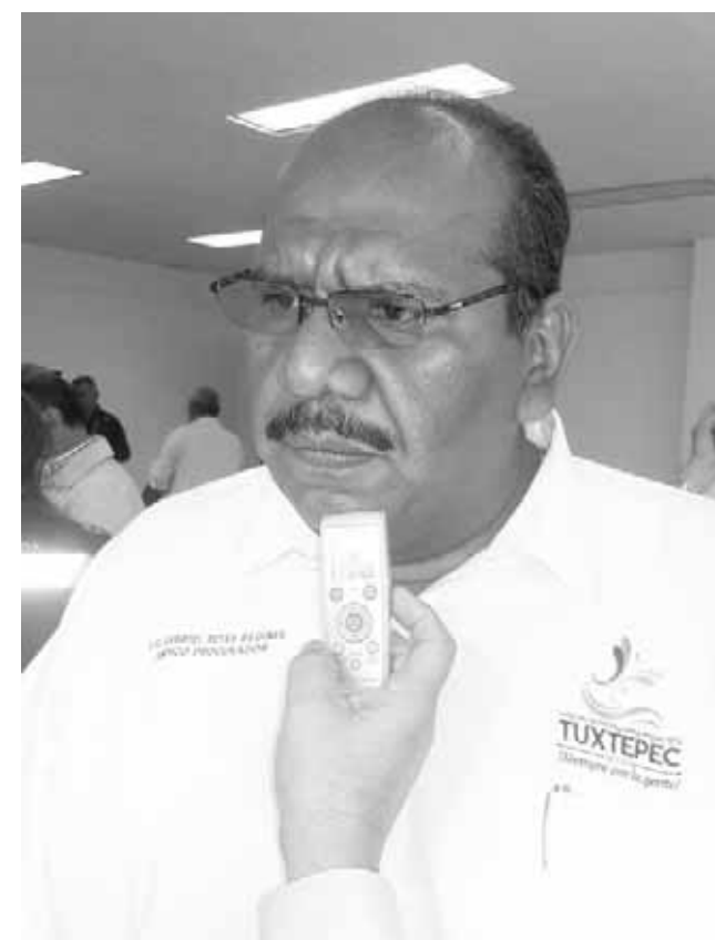
► El Síndico Procurador, Gabriel Reyes Bejines.

Finalmente dijo que este ayuntamiento se convirtió en la Casa del Pueblo, que disfruten el parque que está adornado como nunca, además de que desde esta sindicatura se le desea a todas las familias que pasen una feliz navidad y un mejor año nuevo.