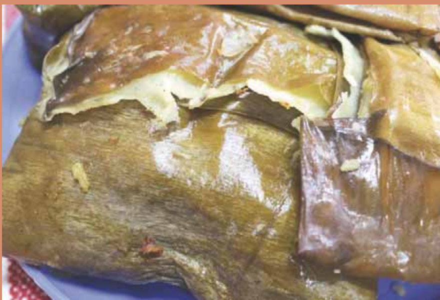
► Tamales de chileajo.