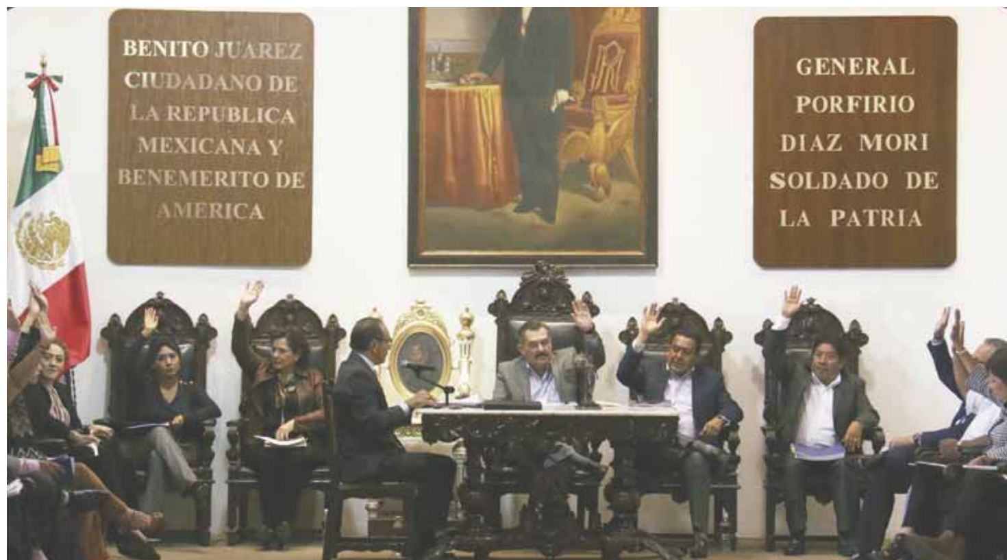
► Durante la Sesión Ordinaria de Cabildo.