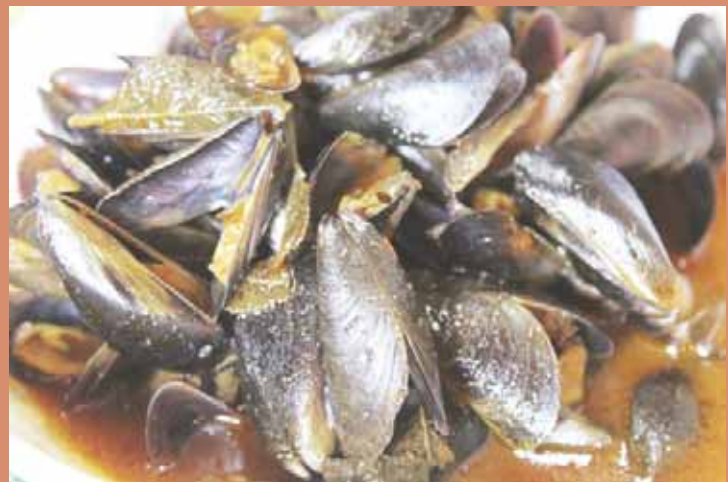
► En la muestra gastronómica habrá platillos como el atole de tichinda.