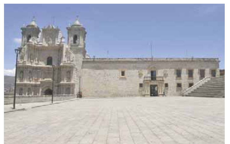
► El evento será en la Plaza de la Danza.