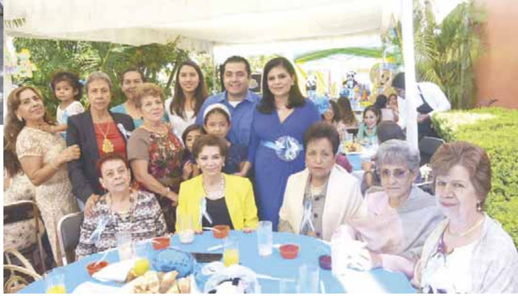
► Sus más allegadas les brindaron consejos, además de colmarlos de bendiciones y felicitaciones.