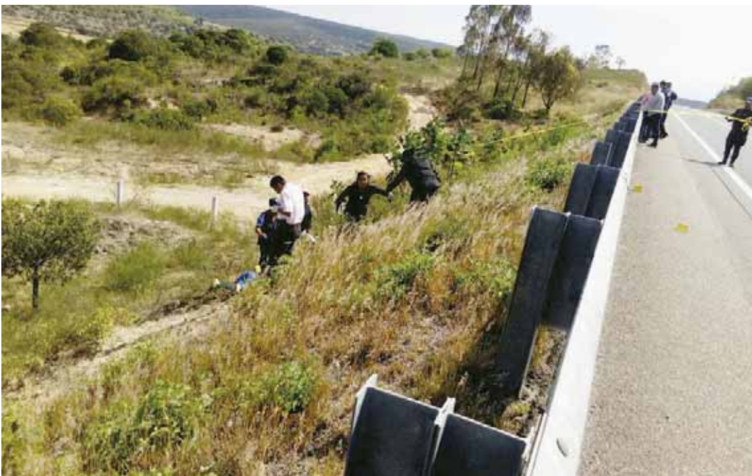
► El cuerpo fue localizado cerca de Asunción Nochixtlán.

Luego de los trámites pertinentes, el cuerpo les fue entregado para que le dieran sepultura por lo que la familia, tras recibirla, se la llevaron a Tlaxiaco.