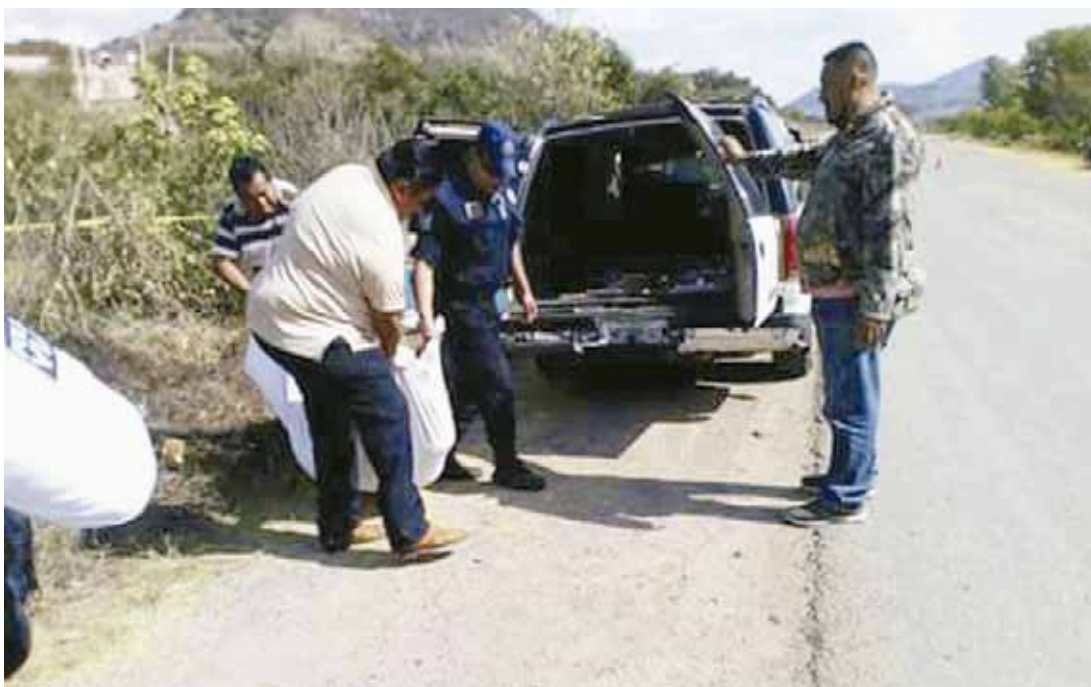
► Los restos fueron llevados al anfiteatro para la necrocirugía y establecer así la causa real de la muerte.

policiaca@imparcialenlinea.com / Teléfono 501 83 00 Ext. 3176