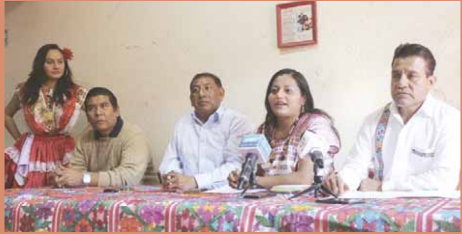
► En el Fandango Costeño, a efectuarse en El Llano, participan más de 10 comunidades.

ESTE 25 DE NOVIEMBRE, EL EVENTO TRAE AL PASEO JUÁREZ EL LLANO UNA MUESTRA DE LA GASTRONOMÍA, LOS BAILES, LA MÚSICA Y LA ARTESANÍA DE LA REGIÓN COSTA