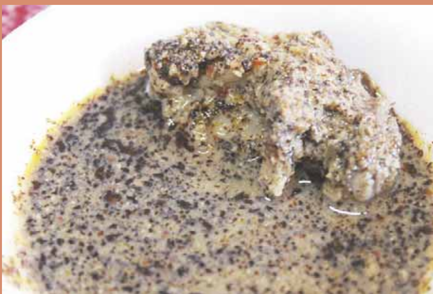
► Salsa de chicatanas con carne de cerdo.