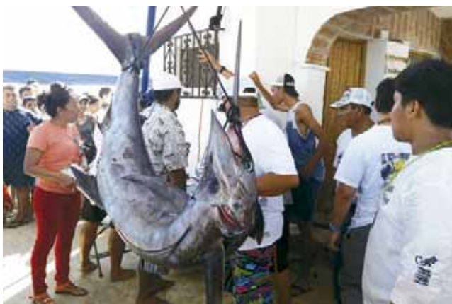
► El pesaje fue abierto al público para que no hubiera ningún problema con los participantes.