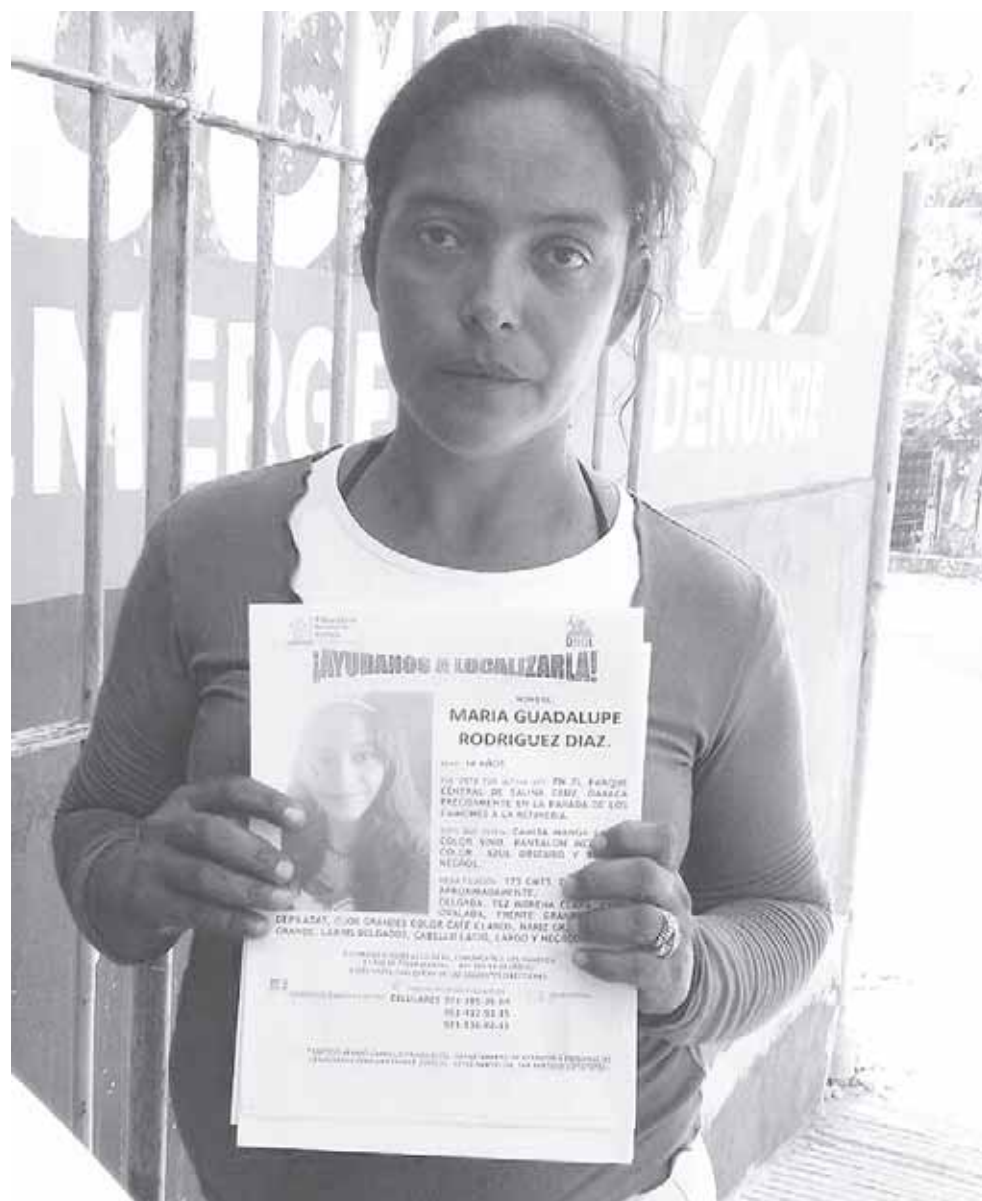
► La desesperada madre clama ayuda para dar con su hija.

“La última vez que supe de ella es que abordó un autobús urbano de ahí no la he vuelto a ver, he buscado en todas partes y no me dan razón de ella, temo por su vida”, expresó.