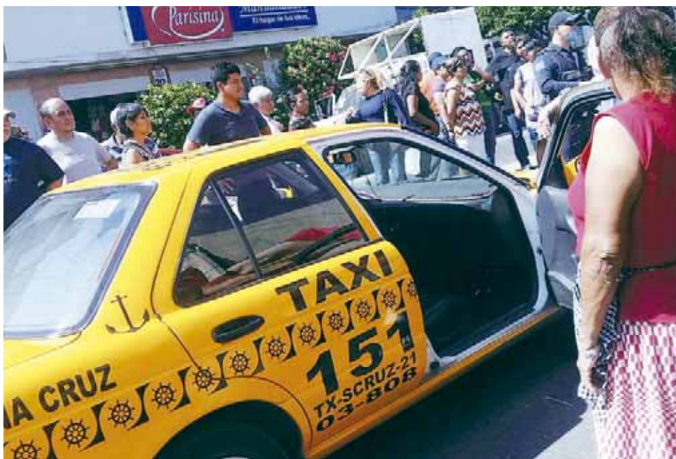
► La unidad que embistió a la mujer en céntricas calles de la ciudad.

municipales, procediendo a acordonar el área desviando el tráfico vehicular,