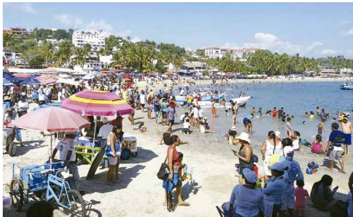
► En un ambiente de fiesta se llevó a cabo el segundo día de competencia, claramente se ve la reactivación del turismo.