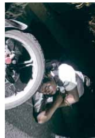
► El joven recibió atención de paramédicos.