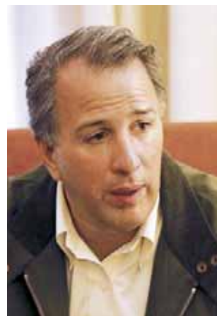
► JOSÉ ANTONIO MEADE KURIBREÑA Y el destape