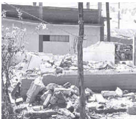
► Hay zonas en las que aún no se han levantado los escombros.

El sismo del 7 de septiembre dejó 14 mil 920 casas con daños, de las cuales 8 mil con pérdida total. El gobierno federal destinó 120 mil pesos para la reconstrucción de casas con daños totales y 15 mil pesos para daños parciales.