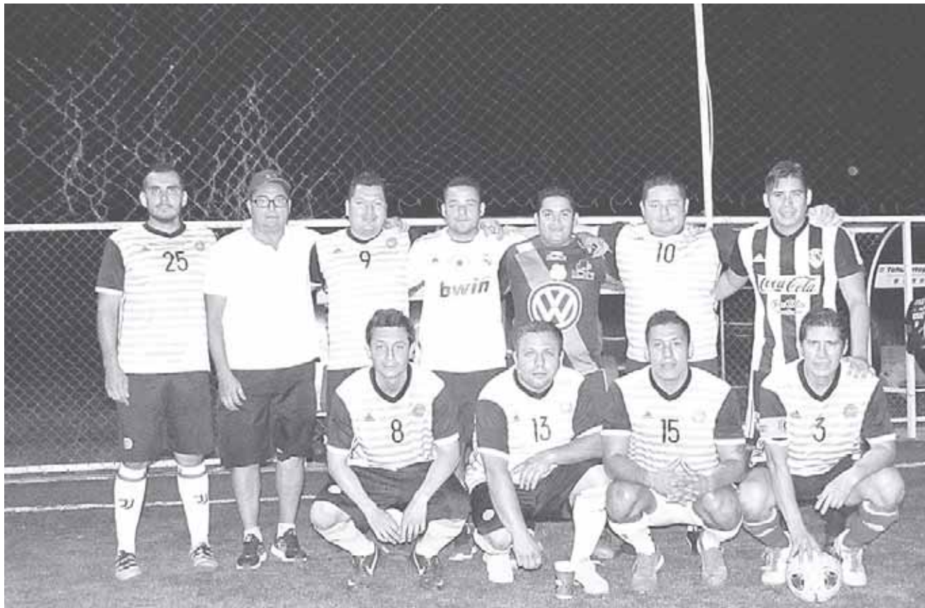
► Pemex Combinado cuidó bien la ventaja.