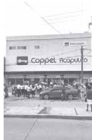
► Empleados de una tienda comercial salieron al punto de reunión.

Las personas que estaban en Plaza Pabellón aprovechando los descuentos del Buen Fin, se alteraron un poco con el sismo que se registró ayer de 5.1