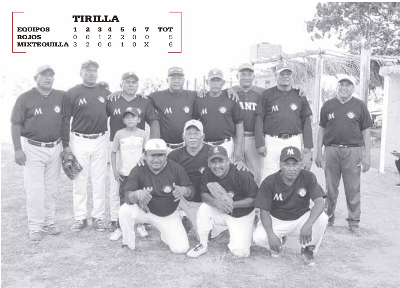
► Mixtequilla sacó la casta.