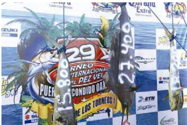
► Exhibición, pesaje y medidas de parte de los jueces a los ejemplares presentados.