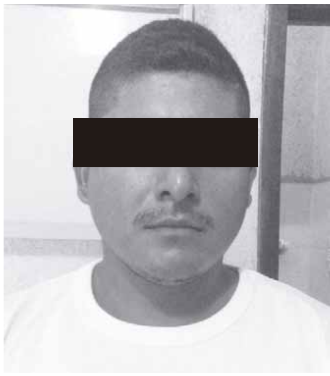
► Las autoridades se harán cargo del hombre.