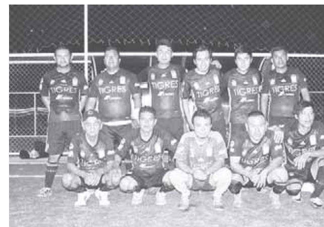
► Cemex muchas imprecisiones.