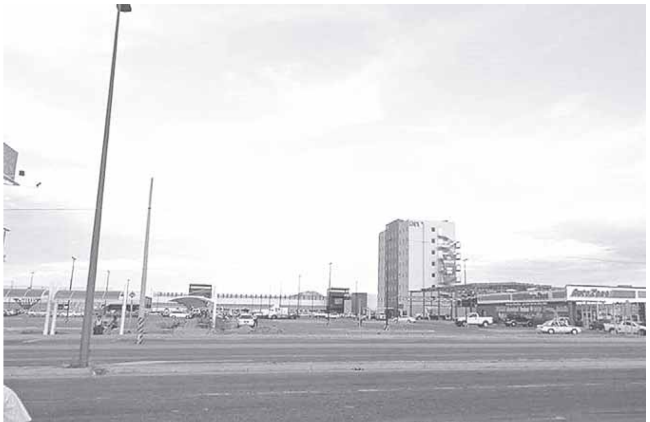
► El centro comercial de Salina Cruz lucía vacío después del movimiento telúrico.