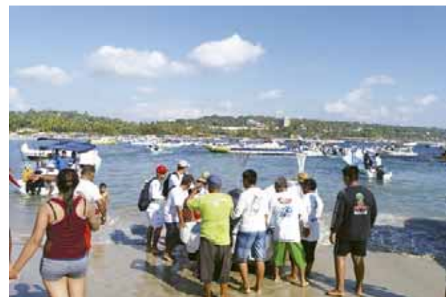
► Al momento de arribar las embarcaciones participantes con su captura.

Hoy será el tercer día de la competencia que reúne a decenas de participantes de toda la República y así darán a conocer al ganador de este importante torneo