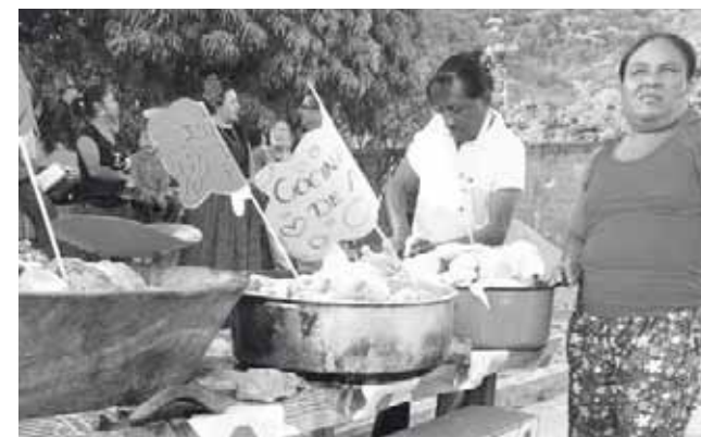
► El pollo fresco también tuvo una gran aceptación.