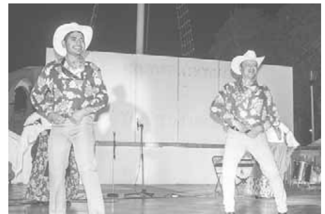
► Uno de los bailables que se efectuaron en la celebración.