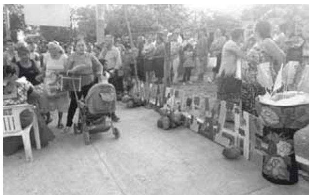
► Las familias se formaron para ser beneficiadas.

se quedaron sin nada por el terremoto, sin embargo, continuarán trabajando para seguir apoyando.