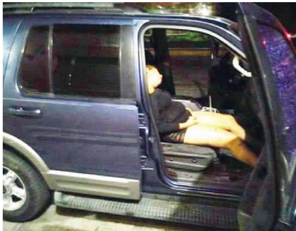
► La mujer que lo acompañaba murió en el lugar de los hechos.

Fue a las 17:30 horas del pasado lunes 20 de noviembre, que personal médico de dicho hospital