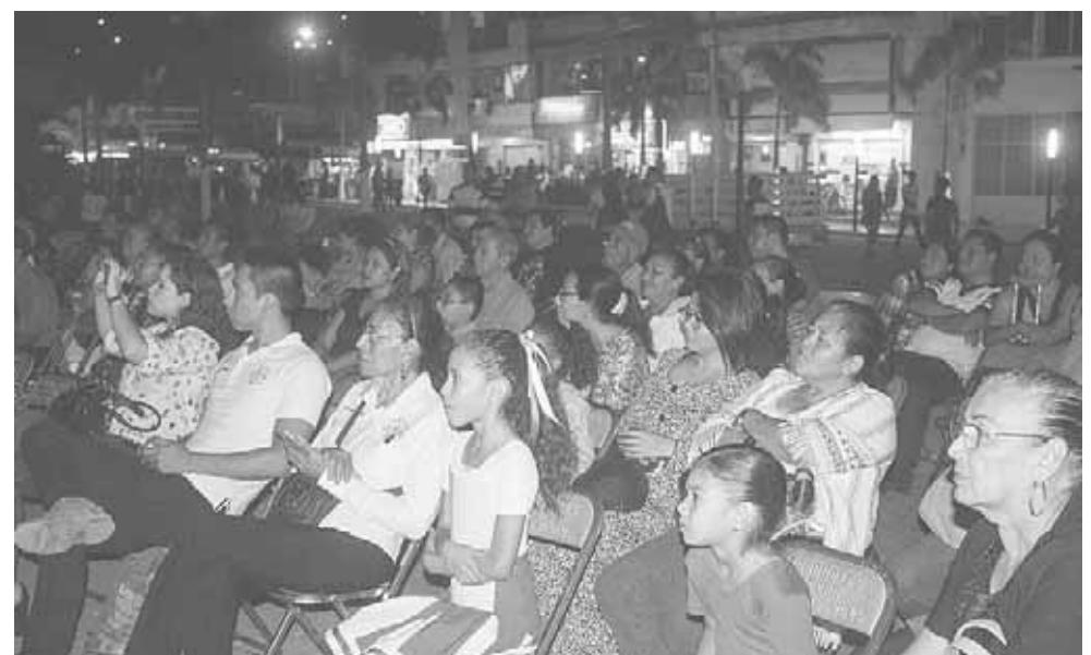
► Los alumnos estuvieron disfrutando del programa social.