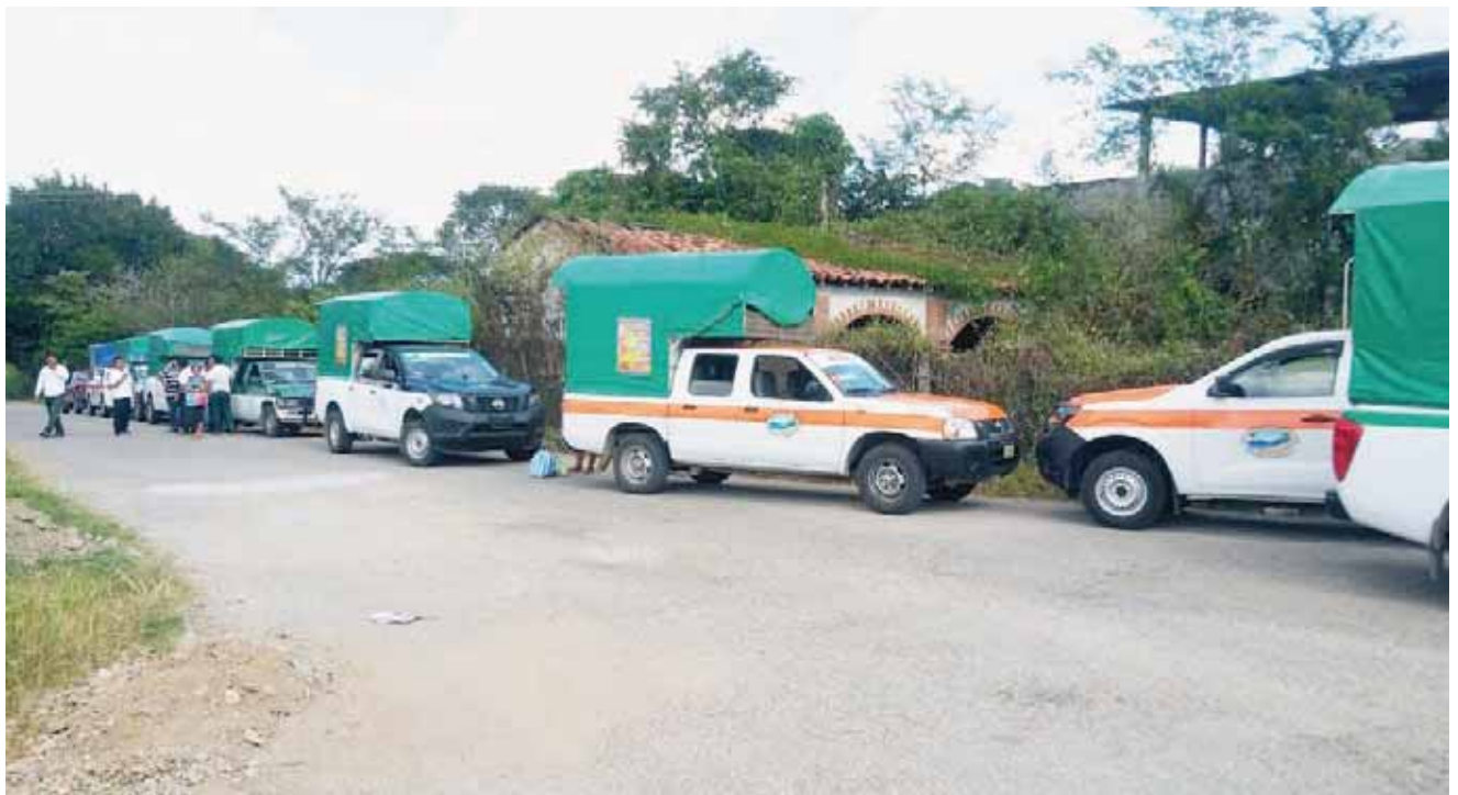
► Choferes se unen para impedir el libre tránsito de una camioneta pirata.

así evitar un enfrentamiento que puede terminar con heridos, ya que la autoridad municipal y estatal en el tema del transporte se ha portado muy indiferente ante esta problemática.