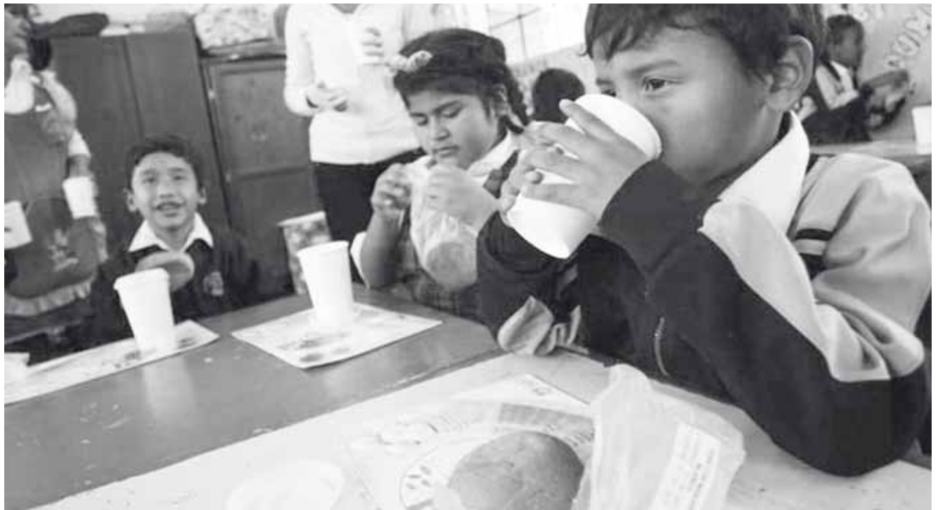
► Aseguran que hay diferentes programas sociales para todos los sectores de la sociedad.

Es necesario que las mismas autoridades sepan de qué manera apoyarán a su municipio, ya que es poco el recurso que se recibe en el año para poder atender