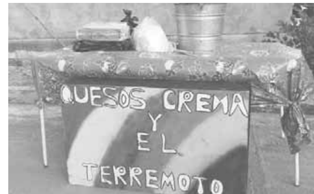
► Ofrecieron quesos y crema a la población.

que lo necesita, la cocina de Grecia sigue, los BinniNaayeche seguimos, pero ahorita nos estamos preparando para ser ya una asociación civil y seguir trabajando para nuestro pueblo, para