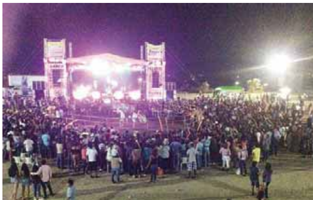
► Cientos de personas se dieron cita en la quemada de castillo.