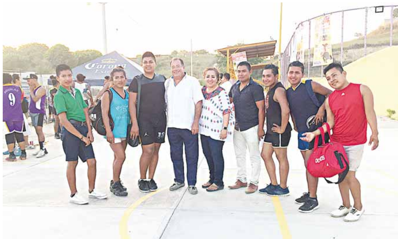
► Los integrantes de los equipos participantes durante el torneo deportivo que tuvo lugar en la colonia 20 de Noviembre.

Durante las actividades que se programaron para la ocasión la que más asistencia tuvo fue el rodeo baile, al que asistieron familias completas