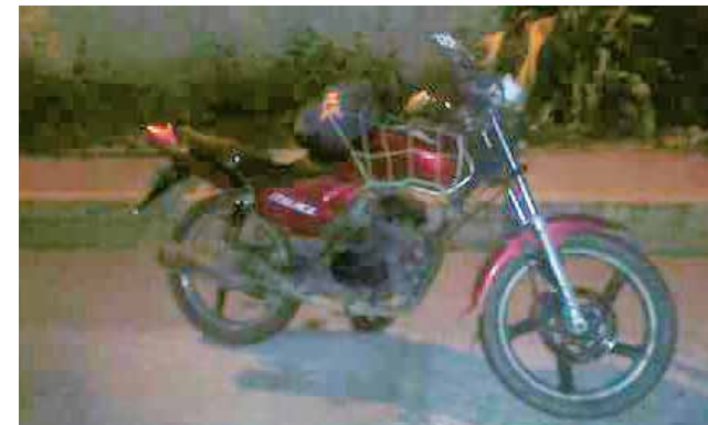
► La unidad de motor en la que se desplazaba el hombre que después de varios días perdió la vida.

Cabe señalar que tras ocurrir el deceso de aquel joven, fue abierta una carpeta de investigación por el delito de homicidio en contra de quien o quienes resulten responsables, por lo que la autoridad ha ordenado que el militar implicado en el accidente sea retenido por las autoridades castrenses y evitar que se dé a la fuga.