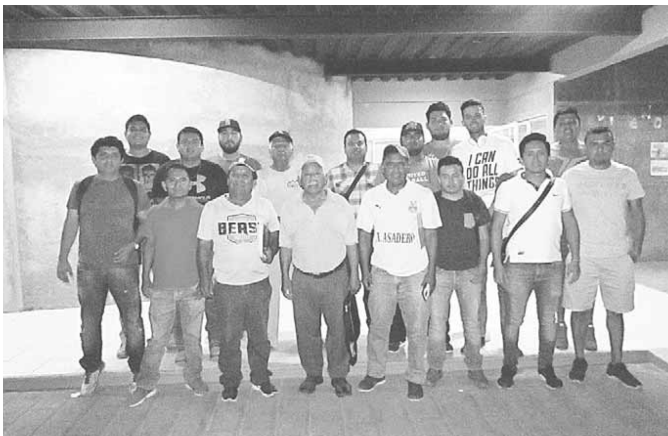
► Listos los equipos para arrancar.

El sistema de juego será Round Robín a dos vueltas en cada grupo y en el arranque de la primera serie, los encuentros quedaron en el grupo 1 de la siguiente manera: El Espinal vs Unión Hidalgo, Asunción Ixtaltepec vs Juchitán de Zaragoza y Jalapa del Marqués vs La Villa de San Blas Atempa; en el grupo 2 el compromiso será así: Ciudad Ixtepec vs Chahuities, San Francisco Ixhuatán vs Santa María Mixtequilla, Salina Cruz vs Santo Domingo Tehuantepec; la hora de inicio será a las 10:00 horas con 30 minutos de tolerancia a los visitantes, los equipos locales serán los encargados de pagar el umpireo y de dotar de pelotas en el juego.