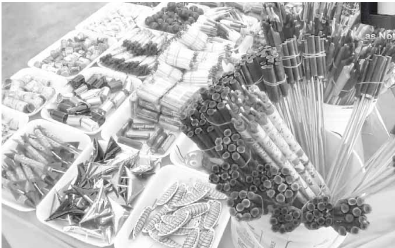
► Los cuetitos son atractivos para los niños, sobre todo en estas fechas.

Mencionó que de esta manera podrán dar la oportunidad a todos los comerciantes que lleven el gusto de vender cohetes y no perjudiquen a nadie más, en