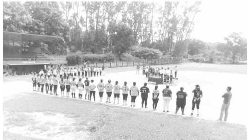
► Rieleras hizo los honores a Jalapa del Marqués.