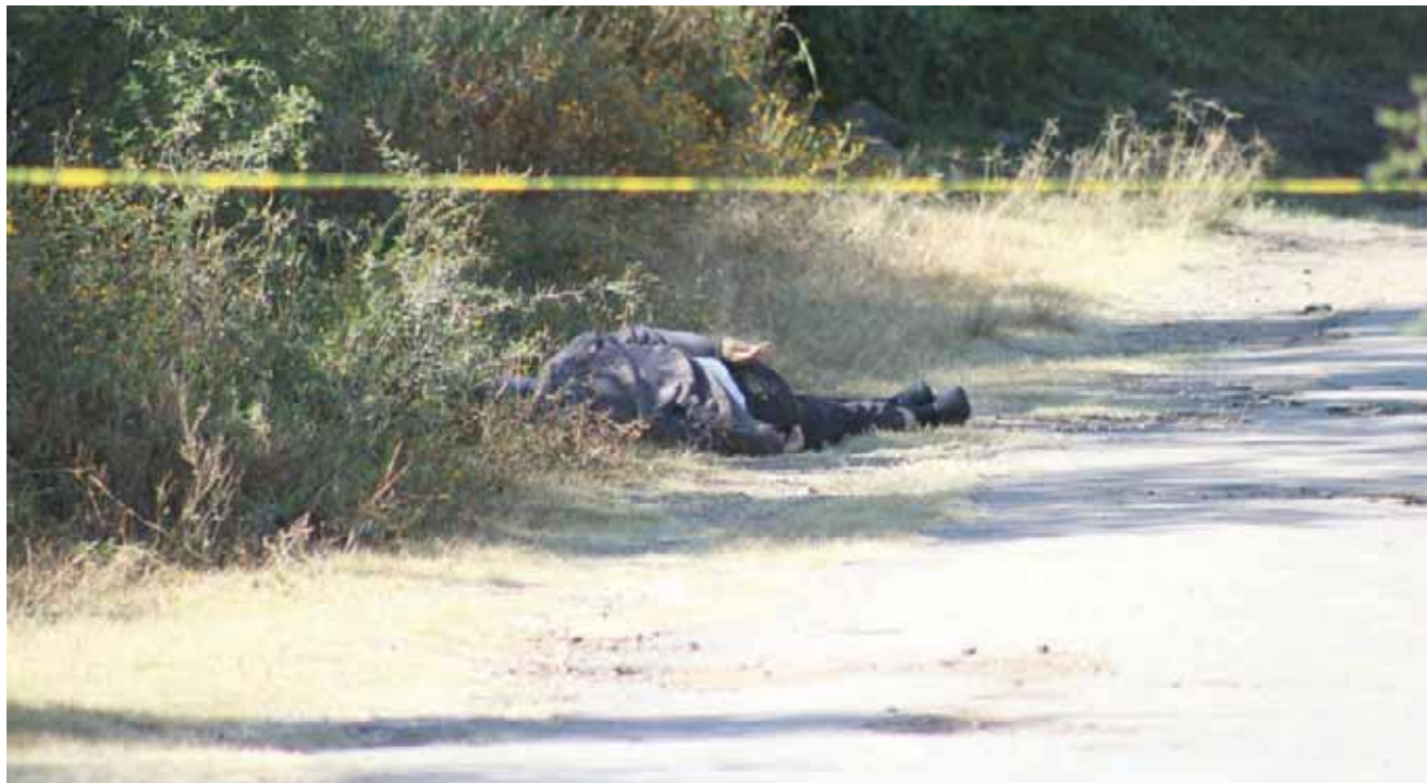
► Desconocen las causas del homicidio del trabajador del volante.

LO HALLAN MUERTO, TRAS VARIAS HORAS DESAPARECIDO. LO ENCONTRARON ATADO DE PIES Y MANOS CON SUS AGUJETAS EN EL CAMINO QUE CONDUCE A LA POBLACIÓN DE DAINZÚ