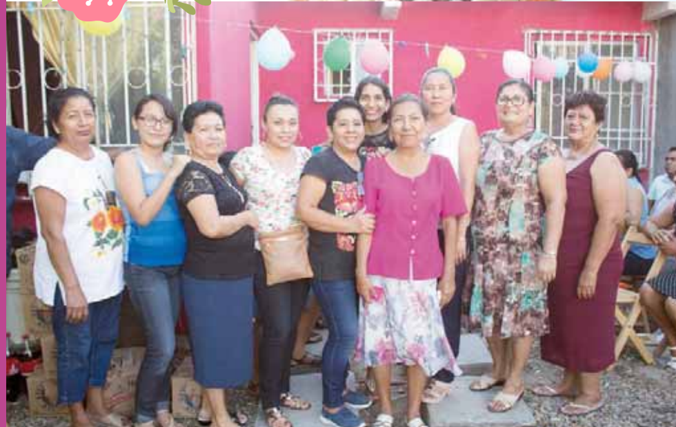
► El grupo de su iglesia la acompañó en la celebración de su cumpleaños.