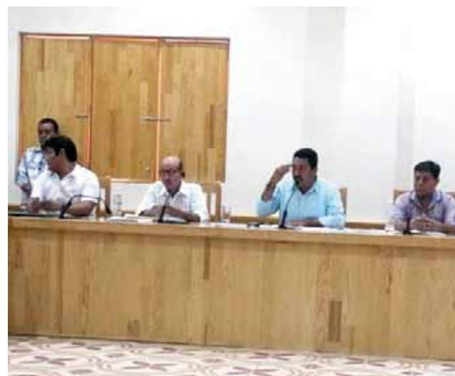
► Detallaron el uso y manejo del recurso público.