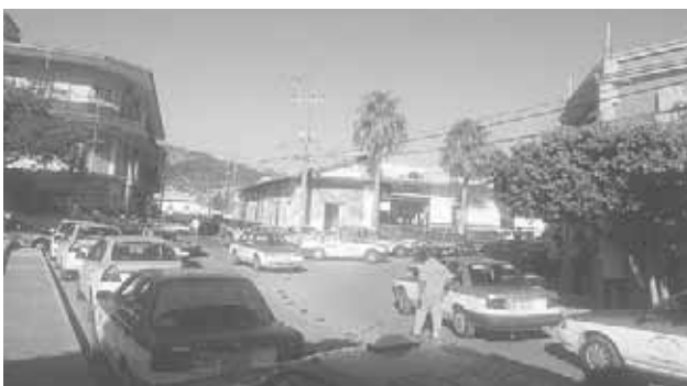
► Dieron a conocer los trabajadores del volante su descontento.

Por espacio de tres horas, los ruleteros estuvieron a las afueras de Sevitra, sin embargo, ningún funcionario los atendió e incluso tuvieron que retirarse poco después de las 10:00 horas.