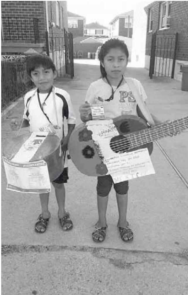
► Los niños salieron a la calle a cantar para recabar fondos.