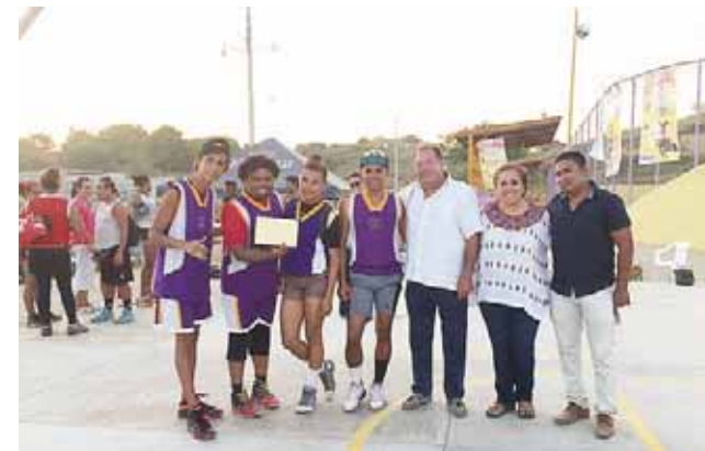
► Aseguran que el objetivo es la sana competencia.