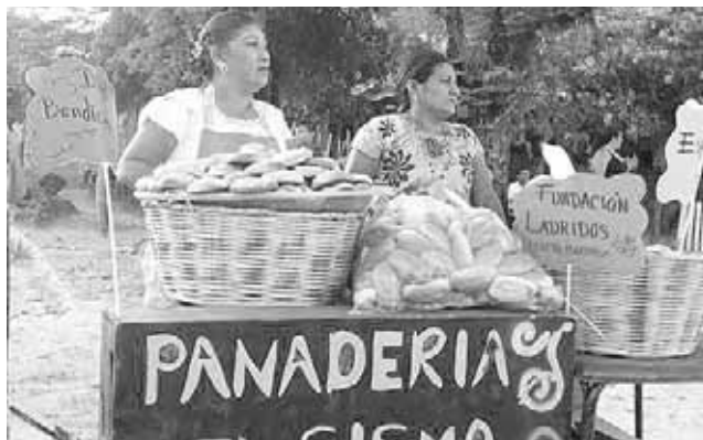
► Las personas que ofrecieron pan fresco.

Indicó que terminó la etapa de cocinar, pues durante más de dos meses estuvieron preparando alimentos para aproximadamente 350 personas, que