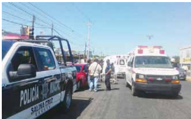
► Por las lesiones que presentó fue trasladado al hospital.

Todo dio comienzo cuando el anciano viajaba a bordo de un triciclo de color plata quien traía consigo