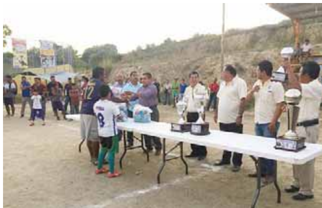
► Durante la premiación que estuvo a cargo de autoridades.