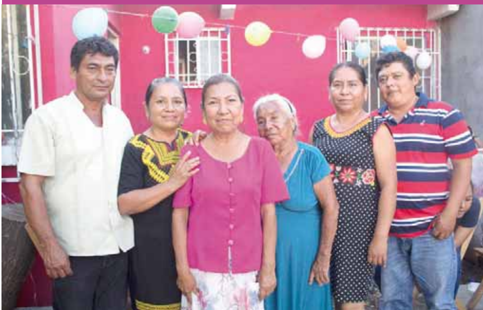
► Acompañada de su mamá, sus hermanas y cuñados.