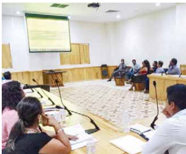
► La sesión ordinaria de cabildo fue de carácter informativo.

El informe detallado fue de enero a octubre del presente, los concejales observaron y dieron cuenta de que como se erogan los recursos, todo está debidamente claro en los fondos 3 y 4