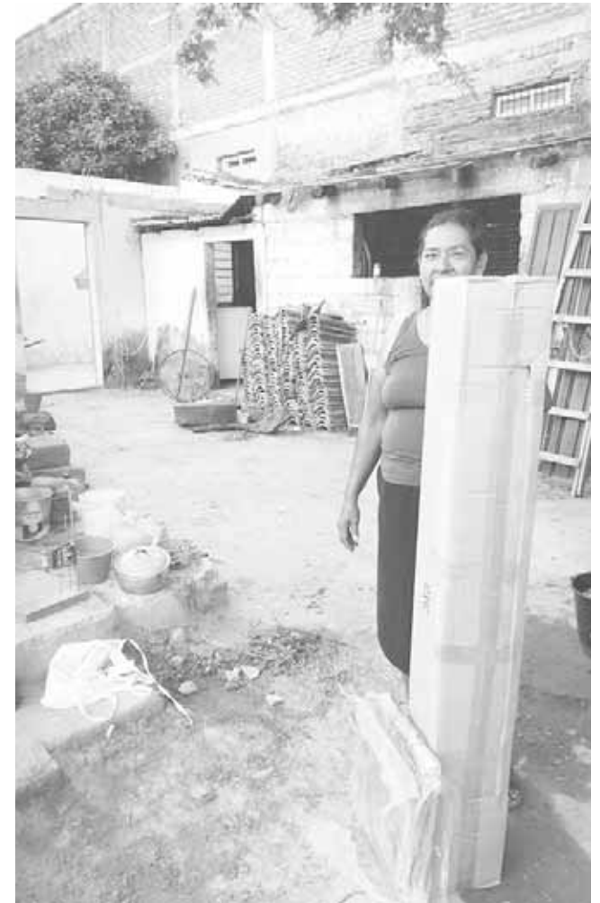
► Las personas que recibieron una casa de campaña.