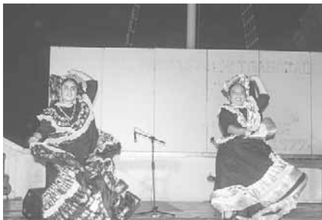
► Resaltaron bailables del municipio para los asistentes.