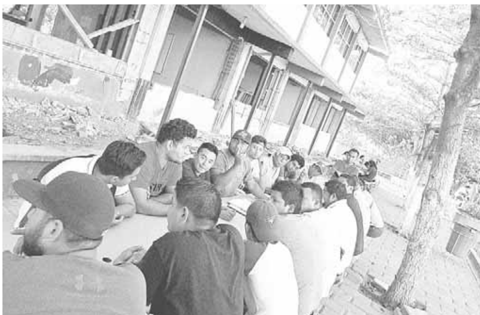
► Se tomaron acuerdos finales.