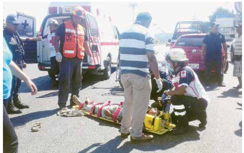
► Llegaron paramédicos para auxiliar a la persona que fue atropellada.

La zona fue acordonada por los mismos automovilistas, ya que a esa altura se hay tráfico fluido, evitando de esta manera vuelva a ocurrir algún