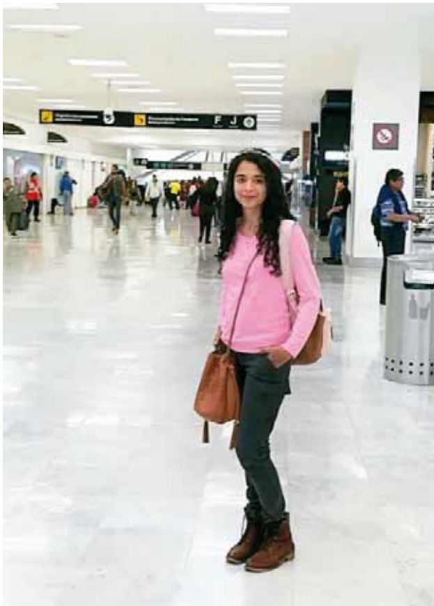
► Estará durante cuatro semanas en la ciudad de Los Ángeles, California.