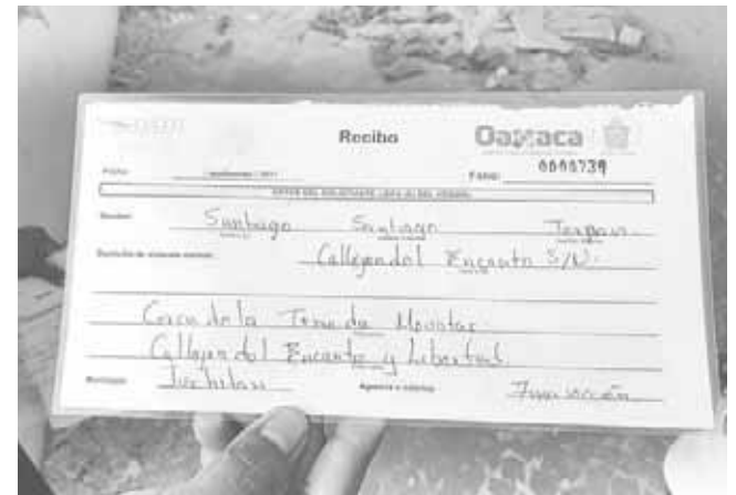
► Muestran las pruebas para dar conocer las inconsistencias.