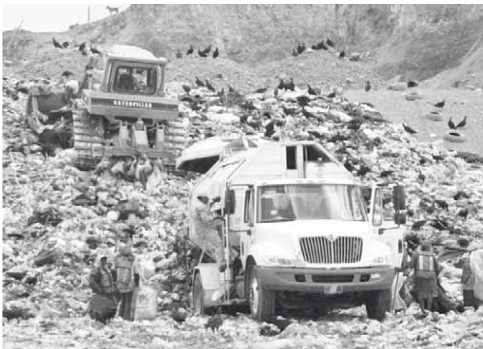
► Actualmente el predio que se ocupa para depositar los desechos de los tuxtepecanos, ya está saturado.

El gobernador del estado ha mostrado mucho interés para que se lleve a cabo este espacio para el tiradero