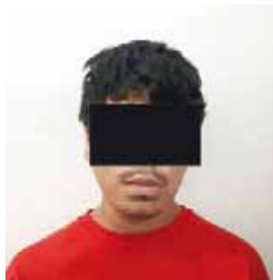
► El hombre que habría matado el ahora detenido.

Por tal motivo, se llevaron a cabo las investigaciones donde se logró determinar que la riña se habría efectuado dentro del bar y no a