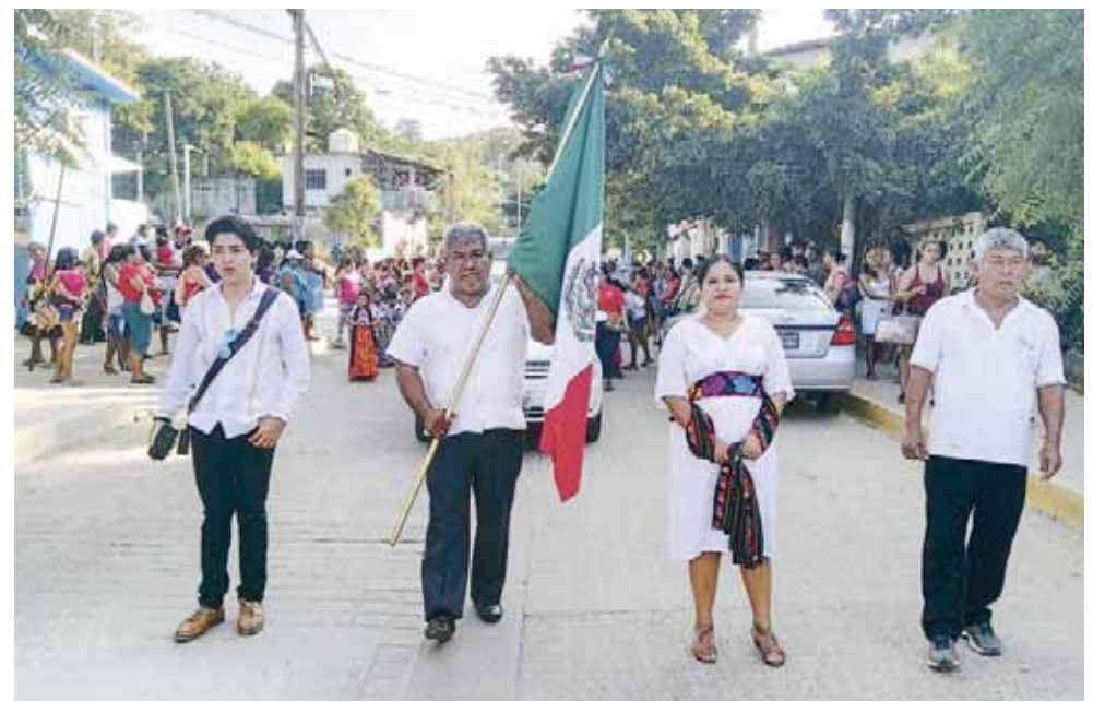
► La autoridad municipal llevó a cabo un acto cívico en conmemoración del día de la Revolución.

La autoridad municipal de Pochutla destacó que por la tarde noche se llevará a cabo un programa cul-