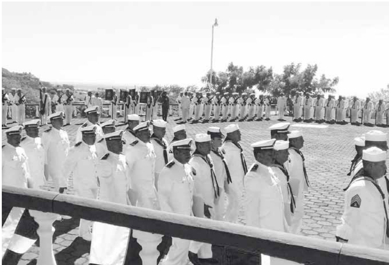
► Durante el acto cívico que estuvo a cargo de la Marina Armada de México.

En esos tiempos de la revolución precisamente en el año de 1913 que el entonces presidente de los estados