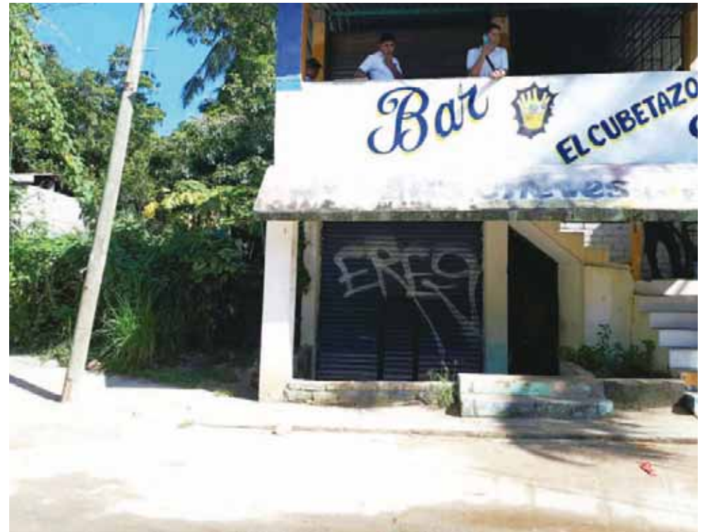
► El bar en el que se dieron los lamentables hechos.

las afueras, como relataban las empleadas desde un inicio, ya que estas fueron sorprendidas por los agentes cuando limpiaban el interior