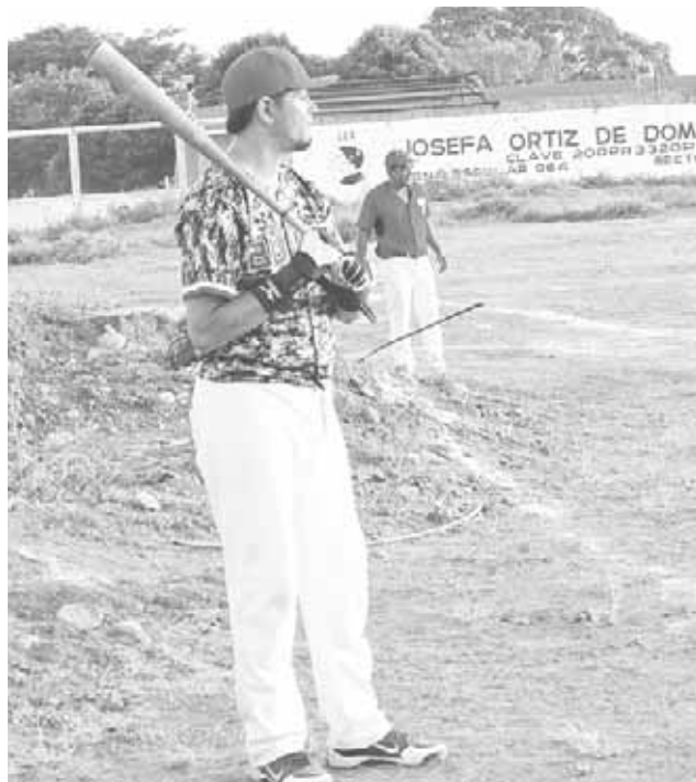
► El Bazooka, es una garantía para su equipo.