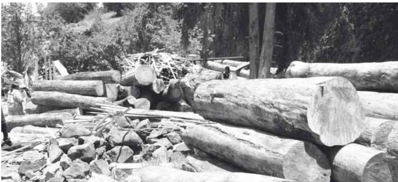
► Lo extraído de manera clandestina se equipara a lo mismo que se produce de manera legal en el estado.

El artículo 419 del Código Penal Federal en el capítulo segundo sobre la biodiversidad, establece que a quien ilícitamente transporte, comercie, acopie, almacene o transforme madera en rollo, astillas, carbón vegetal, así como cualquier otro recurso forestal maderable, se impondrá pena de