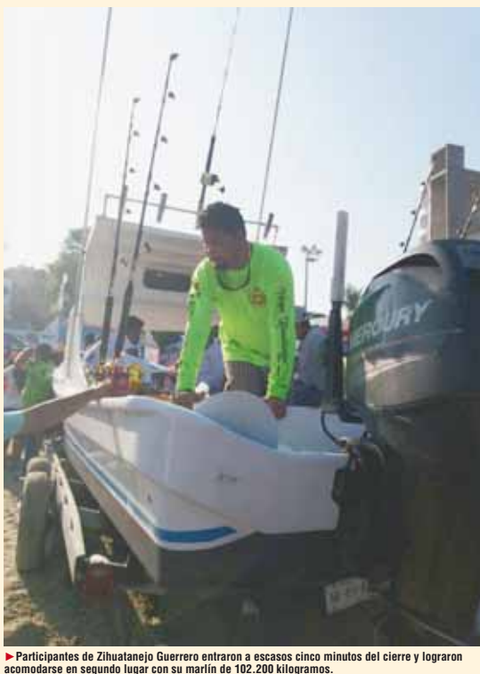
► Participantes de Zihuatanejo Guerrero entraron a escasos cinco minutos del cierre y lograron acomodarse en segundo lugar con su marlín de 102.200 kilogramos.