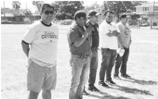
► Representantes de la Liga.