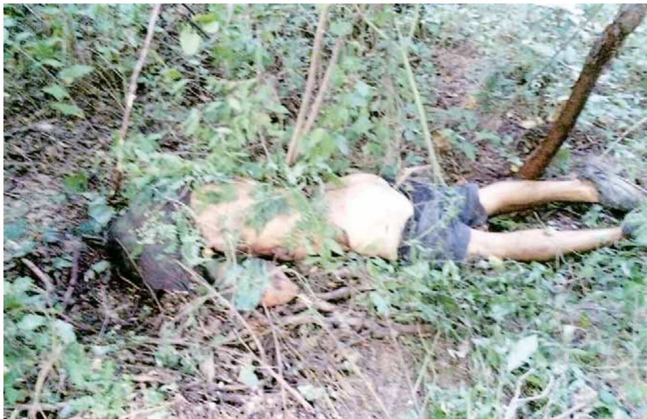
► Hallaron el tronco del cuerpo a un lado de la cabeza del hombre.

Por tal motivo, las investigaciones se ampliaron para comenzar a responder algunas dudas que tenían las autoridades en relación al homicidio de aquella persona, por lo que fueron entrevistados los familiares del occiso, declaraciones que quedaron anexados al legajo de investigación iniciado después de este delito.