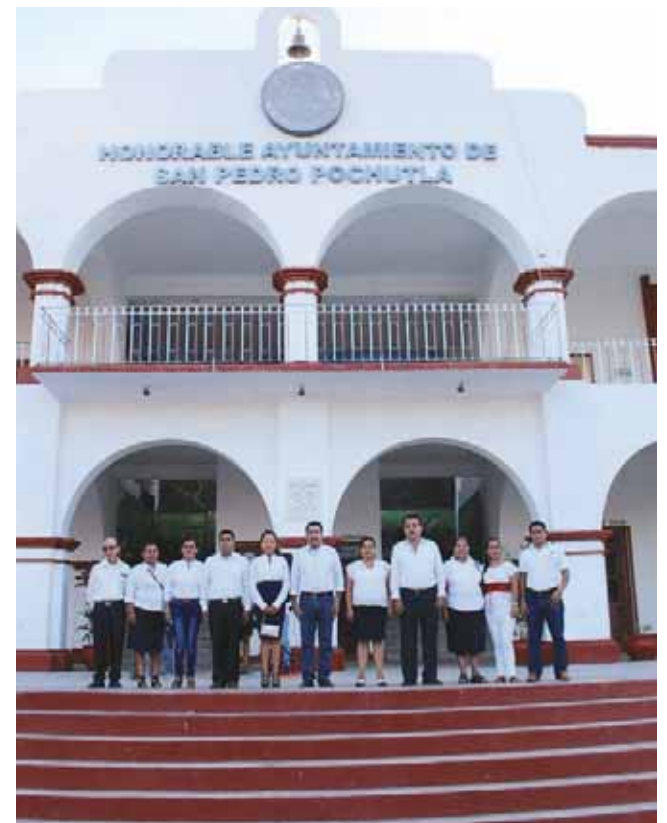
► Docentes, alumnos y la autoridad auxiliar realizaron el tradicional desfile del 20 de noviembre.

Después del acto cívico, se celebró el acto social y posteriormente concluyó la celebración que reunió a autoridades, alumnos y padres de familia.