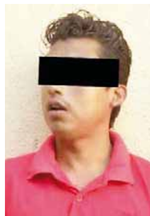
► Se le halló droga.

Los integrantes de la presunta banda, fueron identificados como vecinos del barrio Yatacu, en Pinotepa Nacional quedando a disposición de la Fiscalía General del Estado.