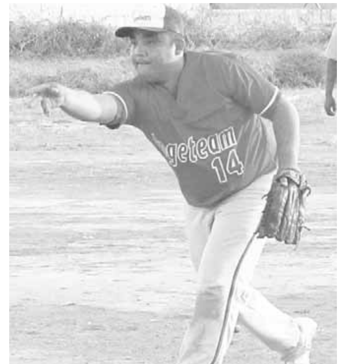
► Lolo destapó el score.