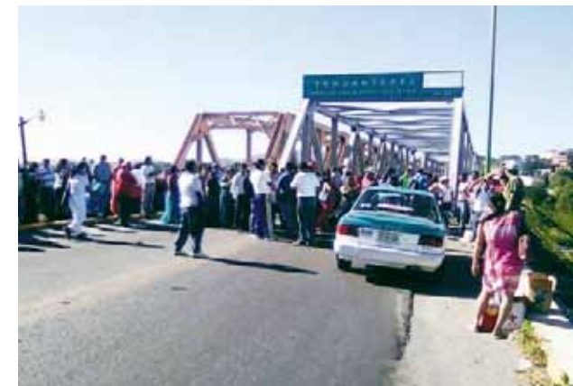
► Bloquearon a la altura del Puente de Hierro.

Finalmente dijo que la temporada que inició el pasado 16 de septiembre termina a finales de marzo, pero se está pidiendo una ampliación de dos o tres meses más, pues iniciaron pero no con los resultados esperados, pues nadie esperaba este terremoto de esta magnitud, ni los daños que iba a generar.