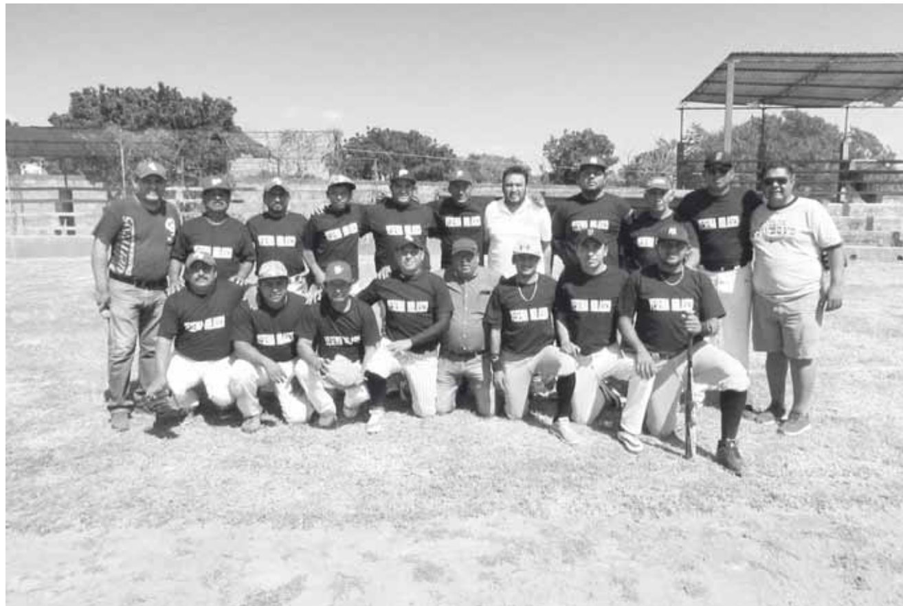
► Equipo de la zona Norte