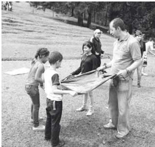
► El objetivo que los niños participen con sus papás.