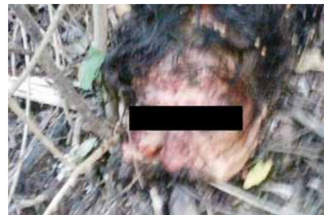
► El macabro hecho toma relevancia en la zona.