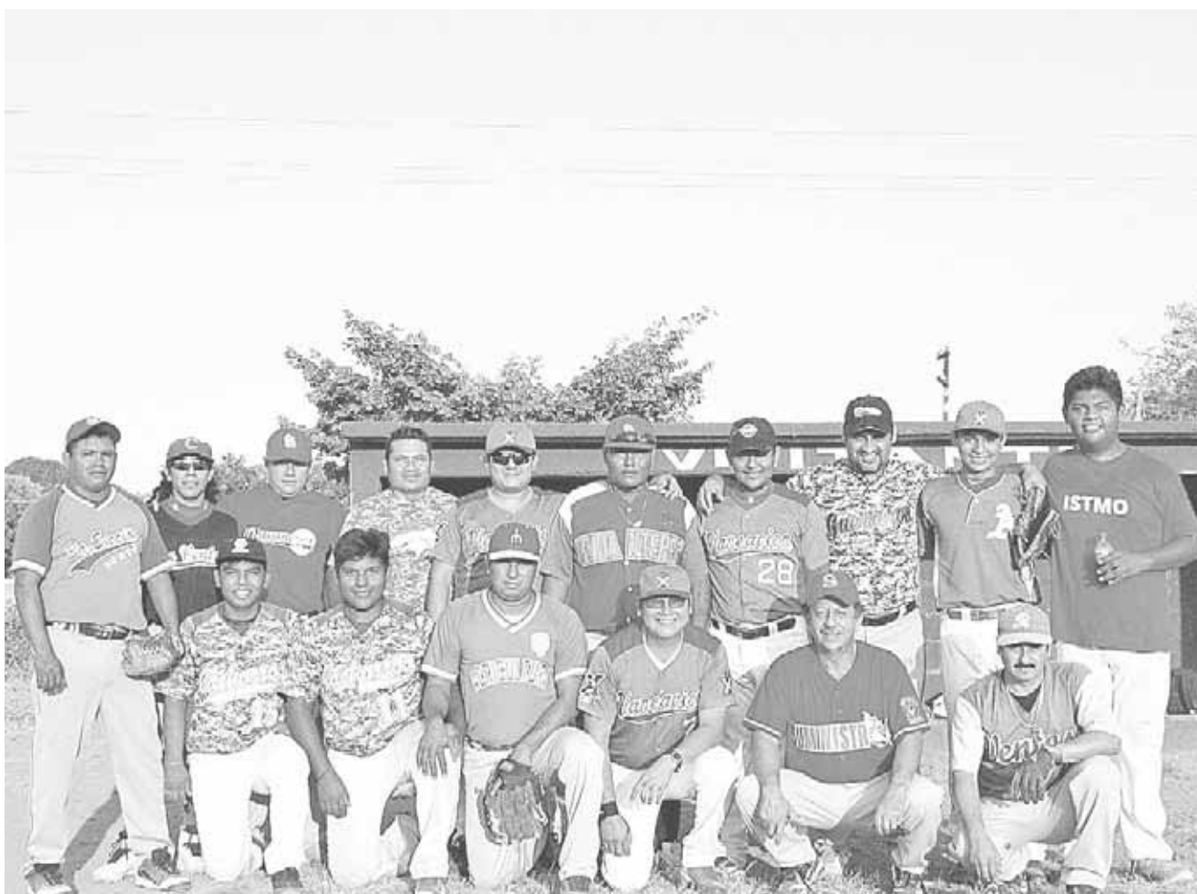
► Xolos con nuevo rumbo.