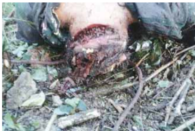
► Las partes del cuerpo fueron identificadas por sus familiares.