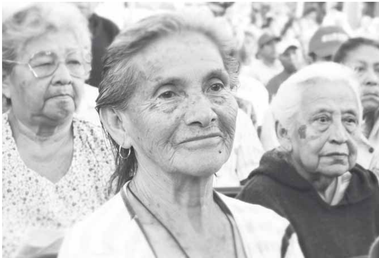
► La invitación es para todas las personas de la tercera edad del municipio.

Mencionó la directora que agradece anticipadamente el apoyo de los paterfamilias por ir a acompañar a sus hijos y destinarles ese día parte su valioso tiempo, pero bien vale la pena para incentivarlos en las actividades programadas por los docentes.