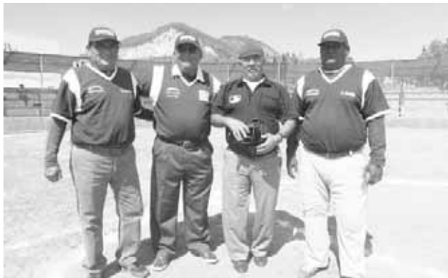
► Cuadro de umpires.