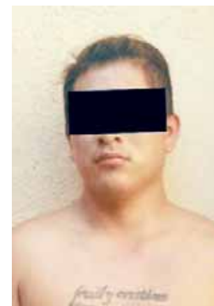
► Poseía armas.