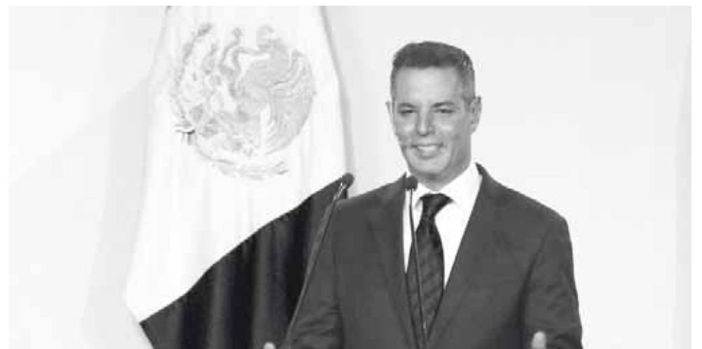
► El objetivo es poder entablar una conversación con el gobernador de Oaxaca.

Señaló que asumieron el compromiso de que la exigencia a la demanda social y política sería por los cau-