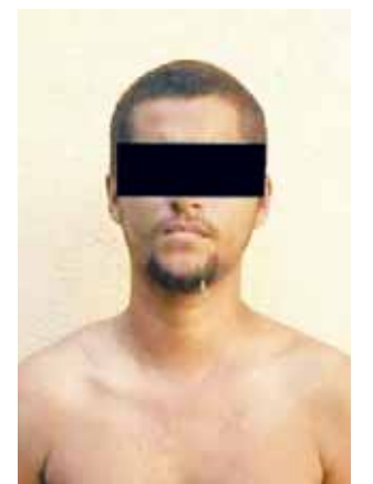
► Acusa de secuestro.