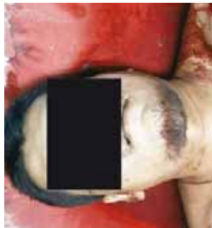
► Quedó bajo la responsabilidad de las autoridades.

De inmediato socorristas arribaron al lugar para brindarle los primeros auxilios al lesionado quien fue trasladado de emergencias a un centro hospitalario, sin embargo, minutos más tarde dejó de existir debido a la gravedad de su lesión.