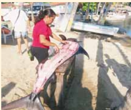
► En la misma bahía, algunos participantes contrataron personas para que les filearan sus piezas que ahí mismo las consumieron en ceviche o filetes asados.