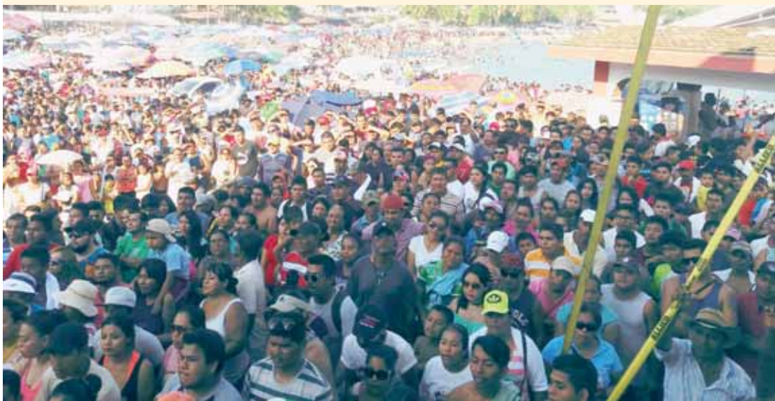
► Un gran ambiente se vivió en la bahía principal en esta gran final.