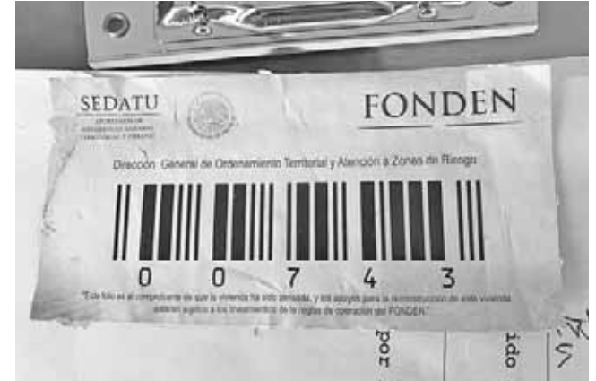
► El folio que le otorgaron no aparece como beneficiario de empleo temporal.