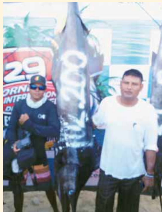
► Los grandes ganadores del primer lugar en pez Vela son originarios de Puerto Escondido, se llevaron la camioneta con valor de 750 mil pesos.