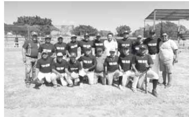
► Equipo de la zona Sur.

Cada uno de los diferentes equipos llegó al terreno de juego a demostrar su madera y con ello empezar a perfilarse en la tabla de posiciones