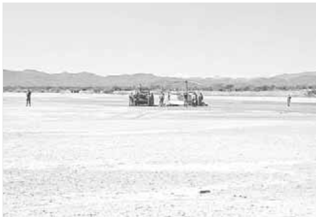
► Se trató de una falla mecánica.