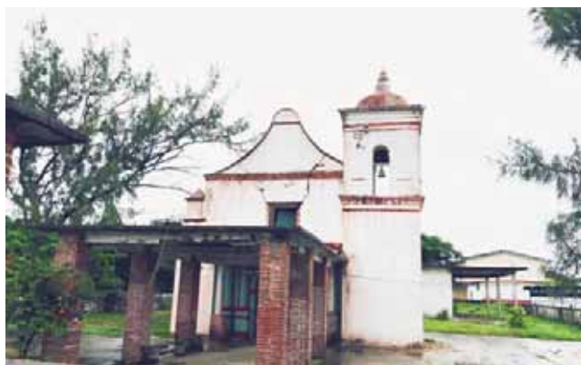
► Luego de los sismos, el templo de la población tiene grietas.

Agregó que en repetidas ocasiones se ha planteado el problema al gobernador Alejandro Murat, con quien hace seis meses se hizo un sobrevuelo en la zona, pero no hay respuesta positiva.