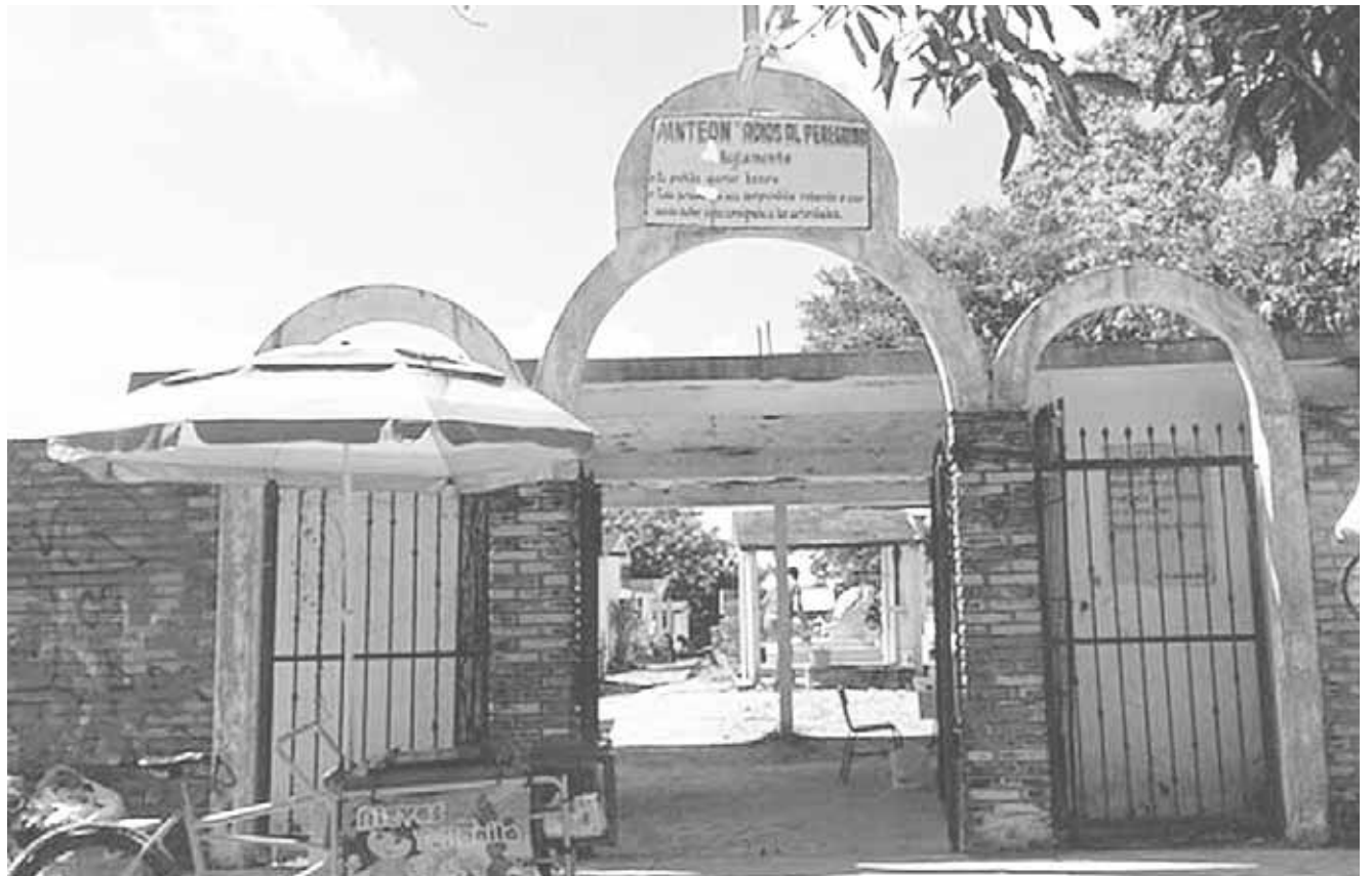
► Una ciudadana señala que le quieren cobrar 36 mil pesos por la perpetuidad.