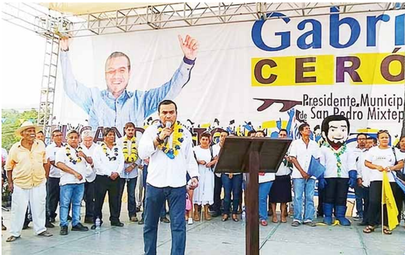
► Asegura que buscará la presidencia municipal.