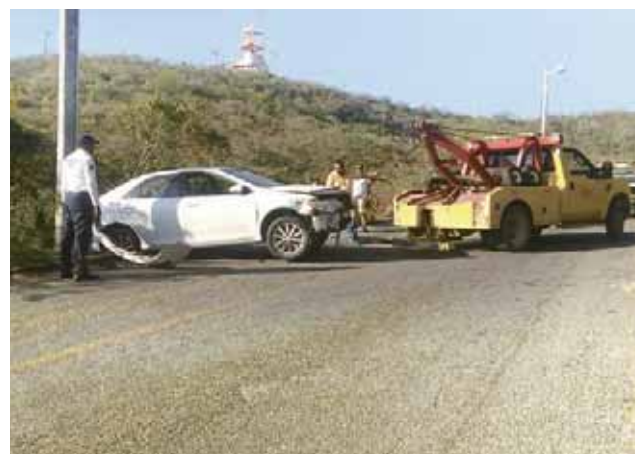
► La unidad fue remolcada.

Al fondo de un barranco de aproximadamente 15 a 20 metros de profundidad quedó el auto compacto marca Toyota tipo Canry de color blanco con placas de circulación MYE-16-