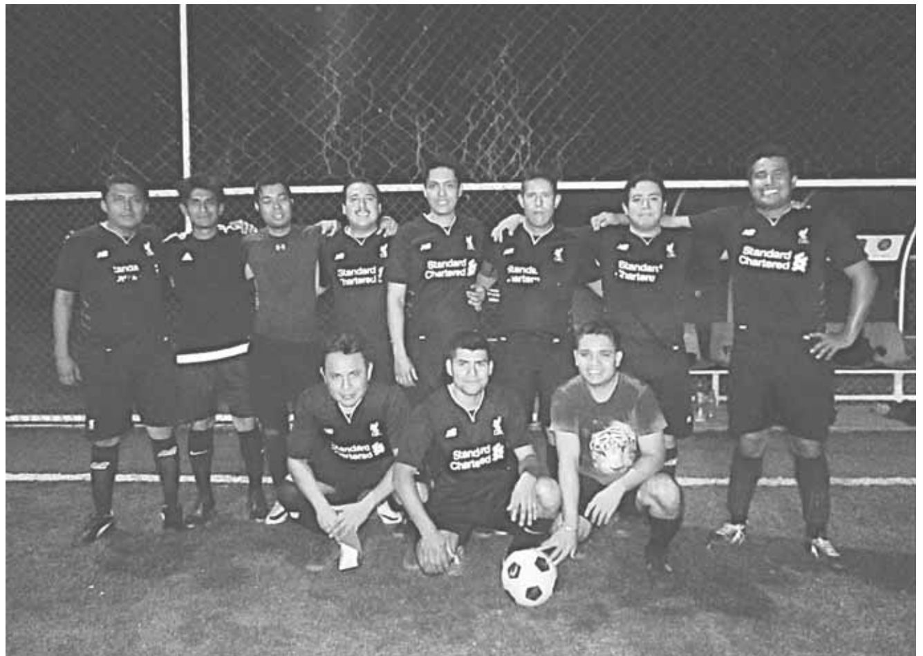
▶ Apollo agarró su dotación.