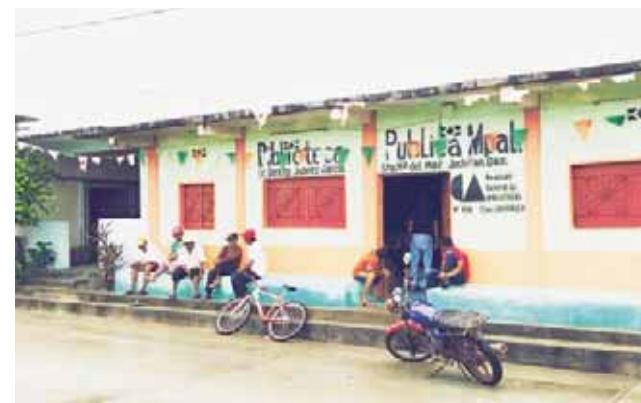
► Los pobladores ya están desesperados ante la falta de atención.