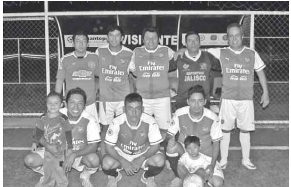
► Coca Cola disfrutó la chispa de la vida.