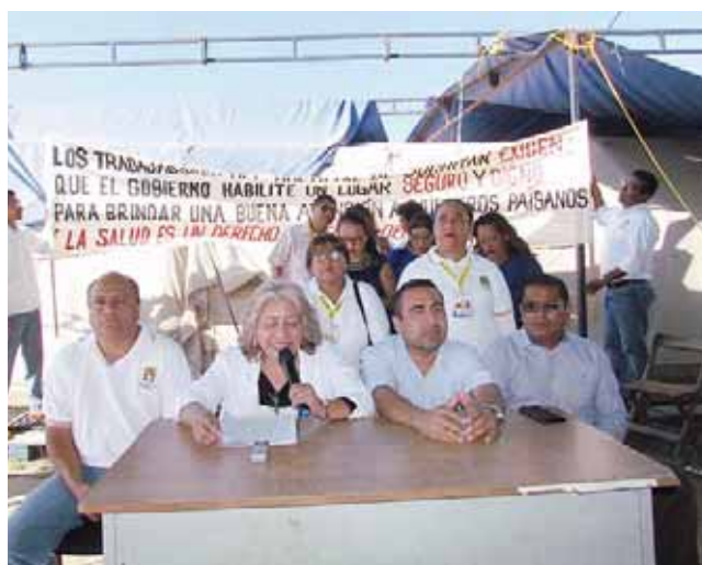
► Aseguran los integrantes del sindicato que los dejaron sin el alma del hospital.

Indicó que no es posible que terminen dándole una estocada final al hospital, pues había un acuerdo des-