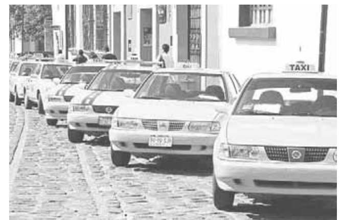
► Apoyan al gremio del transporte para mejorar su servicio.

Señaló que es necesario que los taxistas puedan acercarse a la SEVITRA para poder saber más