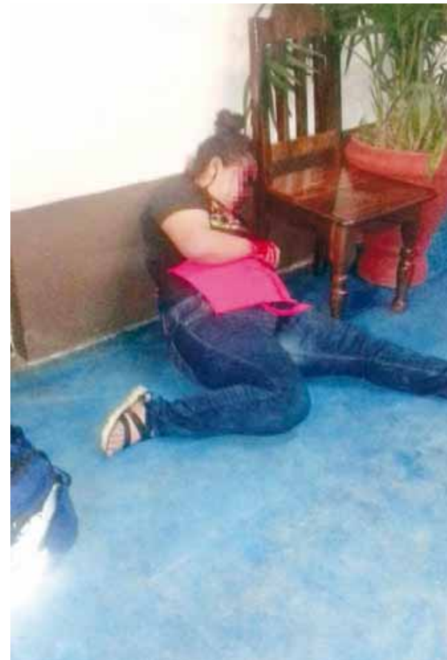
► La mujer quedó recostada junto a la pared.

El grupo de división de género de la costa oaxaqueña, procedió a dar inicio un legajo de investigación por el delito de feminicidio en contra de quien o quienes resulten responsables, resaltando que en la costa oaxaqueña, los homicidios cometidos en contra de las mujeres han ido en aumento de manera considerable.