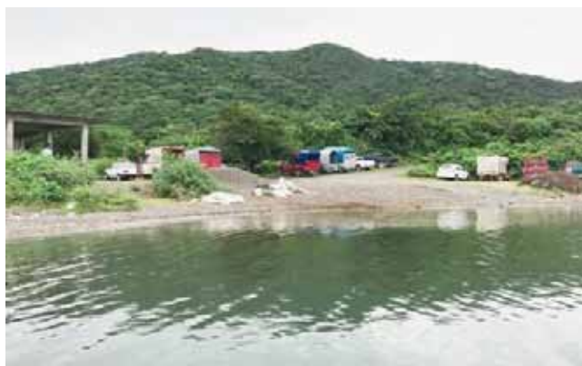
► Todo el acceso es por lancha, a falta de caminos.