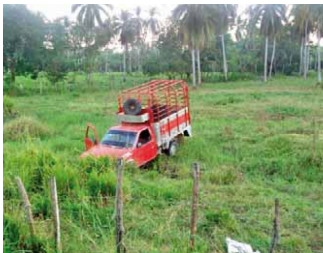
► La camioneta quedó a mitad de un terreno con las puertas abiertas.