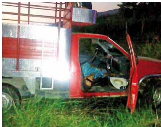
► Se desconocen las causas por las cuales les dieron muerte.

diligencias correspondientes para después realizar el levantamiento de los cuer-