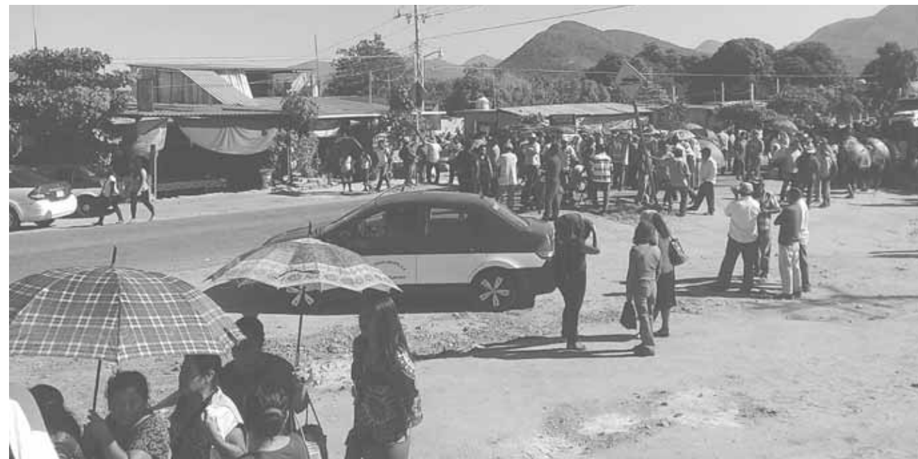
▶ Exigen que los damnificados sean condonados con sus pagos de Comisión de Electricidad. Impidieron el paso por varias horas.

ren que hasta el momento no los han atendido, por lo que decidieron llevar a cabo la manifestación, lamentando los inconvenientes que