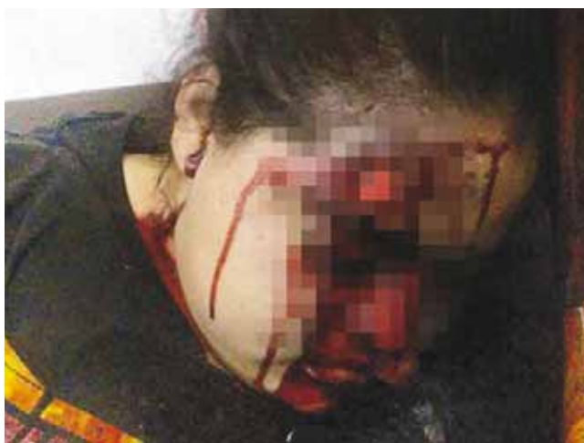
► La joven recibió un balazo en la frente que le causó la muerte.

Dos mujeres, víctimas de la violencia en la costa oaxaqueña, una falleció instantáneamente, la otra se encuentra recibiendo atención médica