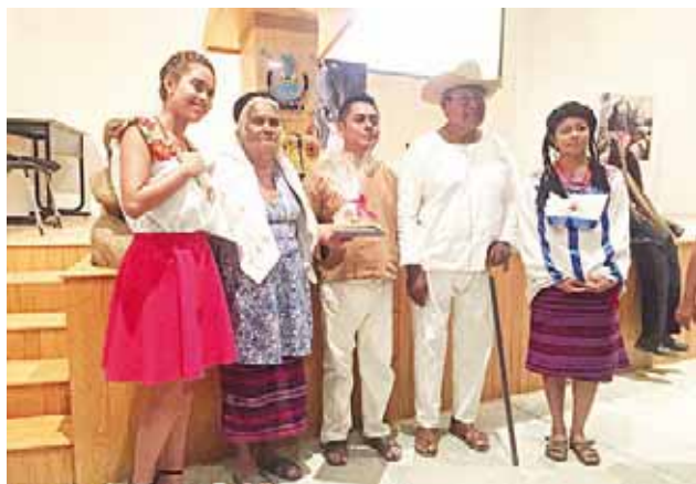
► Actualmente las personas adultas son las que hablan el idioma.