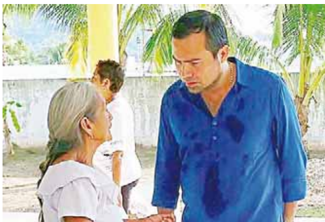
► Sabe escuchar a su gente.

de izquierda, nos postularemos como el más competitivo, para lograr la unidad y el triunfo.