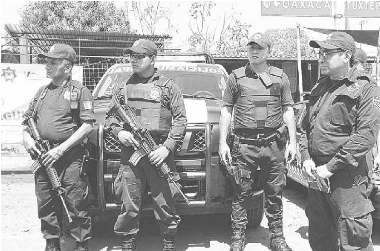
► Las autoridades buscan contratar nuevos oficiales, tanto novatos como expertos.

El regidor de Seguridad Pública indicó que la corporación municipal necesita alrededor de 34 nuevos elementos para mejorar la vigilancia local