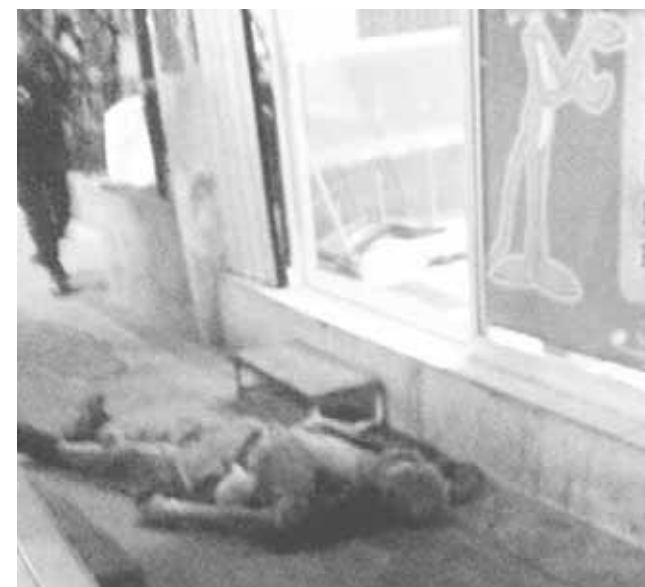
► El hombre estaba en el escuadrón de la muerte.

Los propietarios de la estética al percatarse de ello, de inmediato procedieron a realizar el llamado de los paramédicos, para que acudieran a prestar los primeros auxilios, ya que se encontraba mal herido.