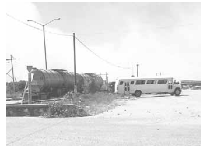
► También los autos abandonados son un riesgo.

De esta manera, también el personal de Marina contribuyó con las labores de ayuda para sofocar el incendio que se registró en el municipio.