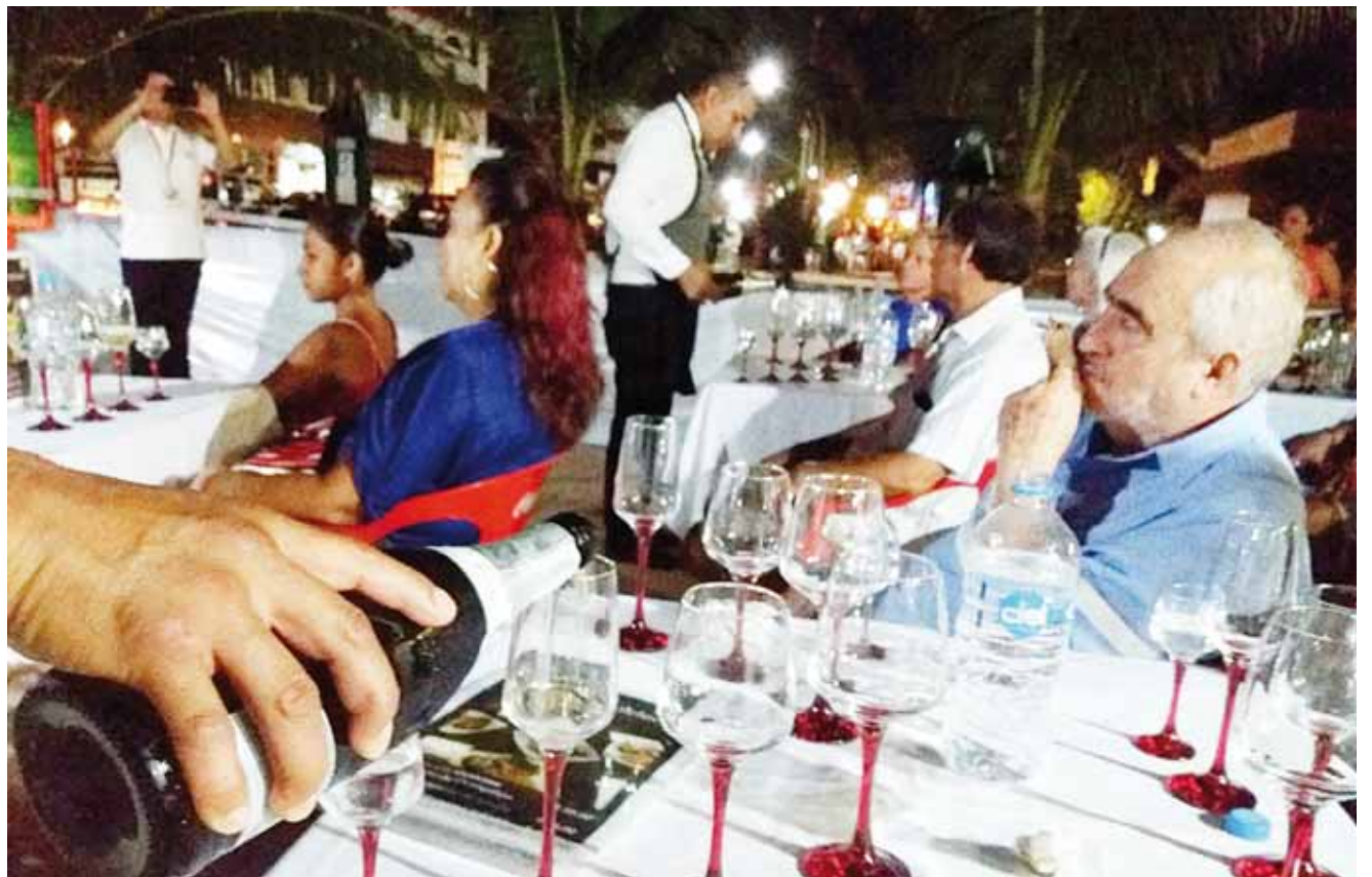
► La cata tuvo un buen nivel de vinos a degustar.