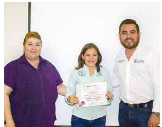
► El objetivo es profesionalizar la atención turística.

En este curso taller se realizó la entrega de 22 constancias a los participantes para profesionalizarse en la atención turística y mejorar la calidad de productos turísticos, debido a que Salina Cruz, es un municipio en desarrollo.