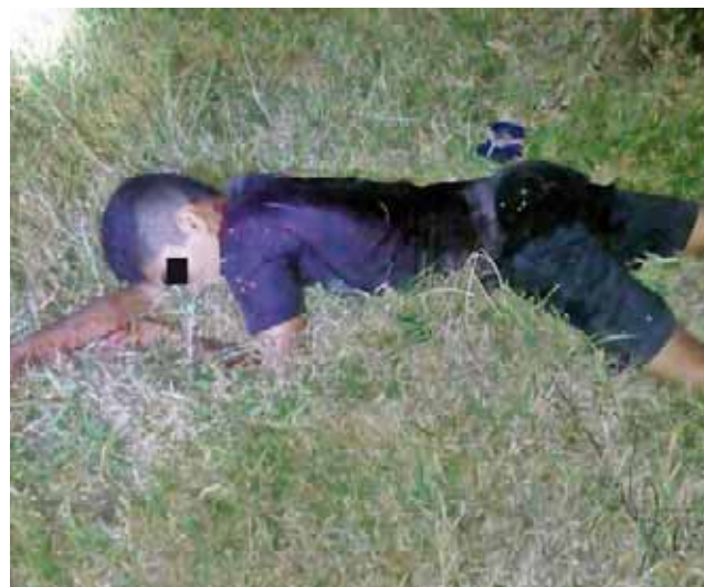
► El segundo muchacho quedó entre la maleza, sin vida.