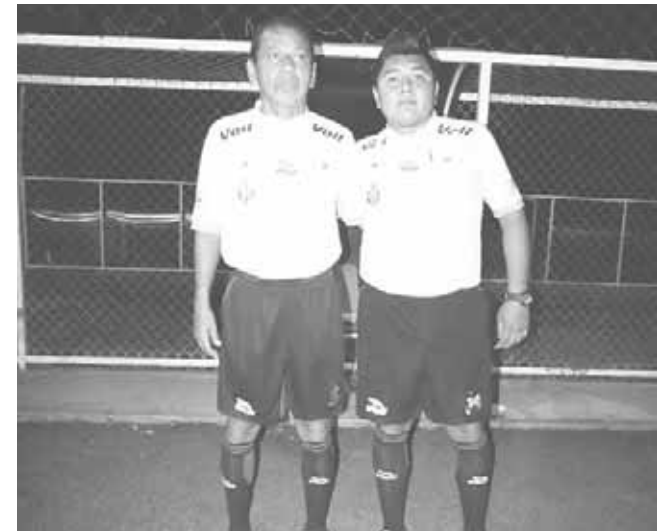
▶ Veteranisimo y Seven Up con los silbatos.