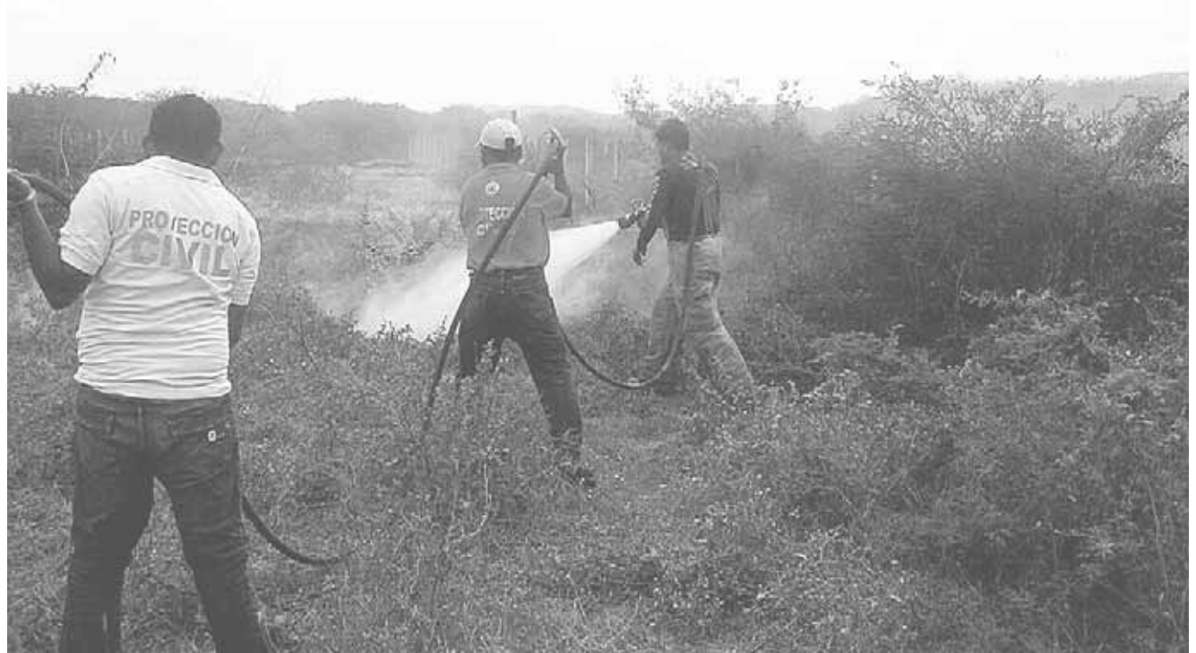
► Llamam a la comunidad en general para que tome precauciones.

Las zonas más vulnerables o propensas de Tehuantepec, son las tierras comunales ubicadas en la carretera Transistmica con dirección a Salina Cruz