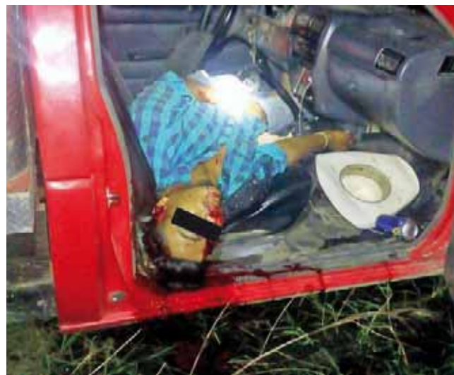
► Uno de los jóvenes murió en la cabina de la camioneta.

Elementos de la Agencia Estatal de Investigaciones, se trasladaron al sitio indicado donde realizaron las