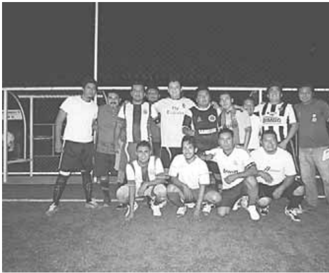
▶ Alpura se deslactosó.