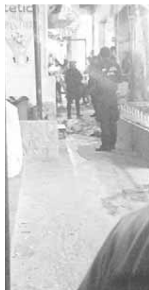
► Fue trasladado al anfiteatro.

En el lugar transcurrieron un sin número de personas quienes vieron lo acontecido cayeron en crisis nerviosas, algunos corrieron a dar aviso a un elemento de tránsito que se encontraba cerca del lugar.