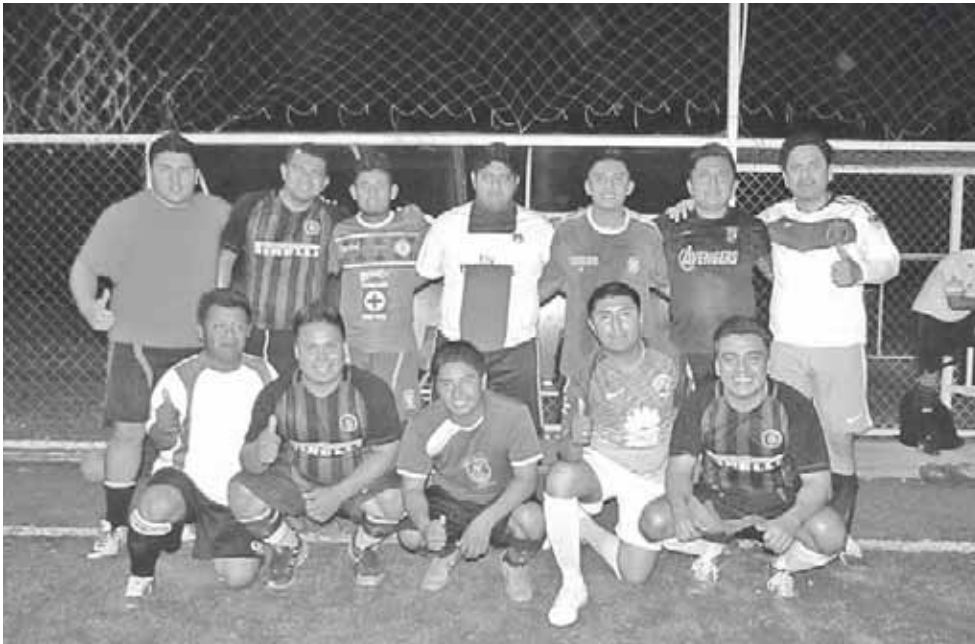
► Banco Azteca desfalcado.