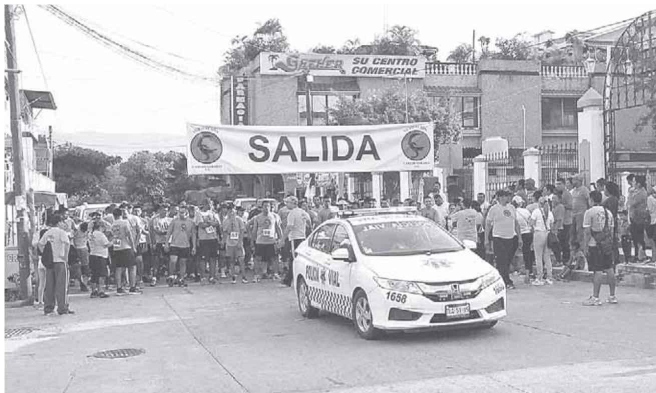
► Competidores y público portaron un moño rosa para concientizar sobre la importancia de prevenir el cáncer de mama.

La competencia se llevó a cabo con el objetivo de concientizar a la población sobre la importancia de una vida saludable