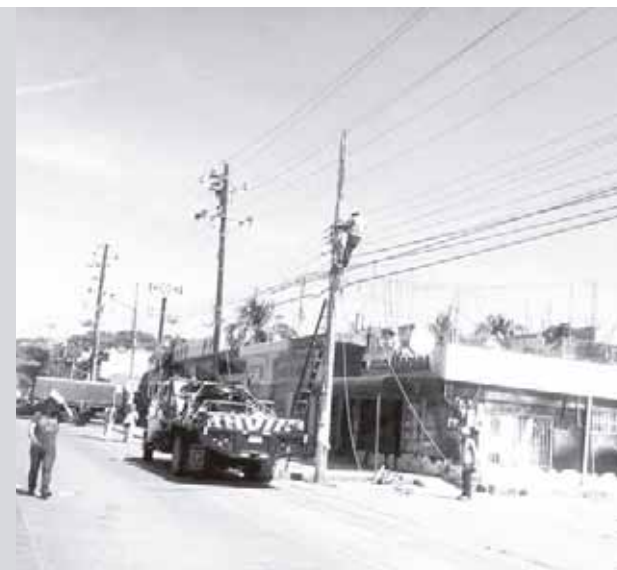
► Los ciudadanos piden que la CFE evite generar congestión vial.

Dijo que no hay un plan de reordenamiento vial, aunado a que las calles están saturadas de casas rodantes utilizadas para la venta de tacos, tortas y otros productos que bien pudieran ser retirados