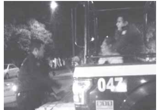
► El ciudadano fue detenido por oficiales de la Policía Municipal.

El ebrio ignoró a su pareja y se paró frente al vehículo con las manos extendidas, realizando