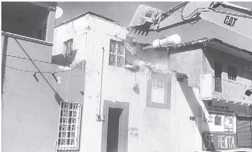
► La ciudad de Salina Cruz sólo se reportó daños en algunos sectores.