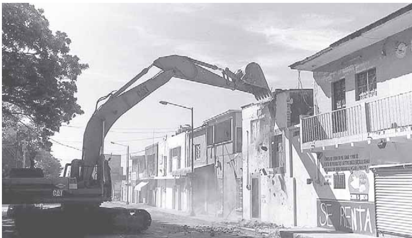
► En Salina Cruz las demoliciones son realizadas por una empresa particular contratada para estos trabajos.

Continúa la etapa de demolición y en breve arrancará la construcción de las casas afectadas por el terremoto del 7 de septiembre