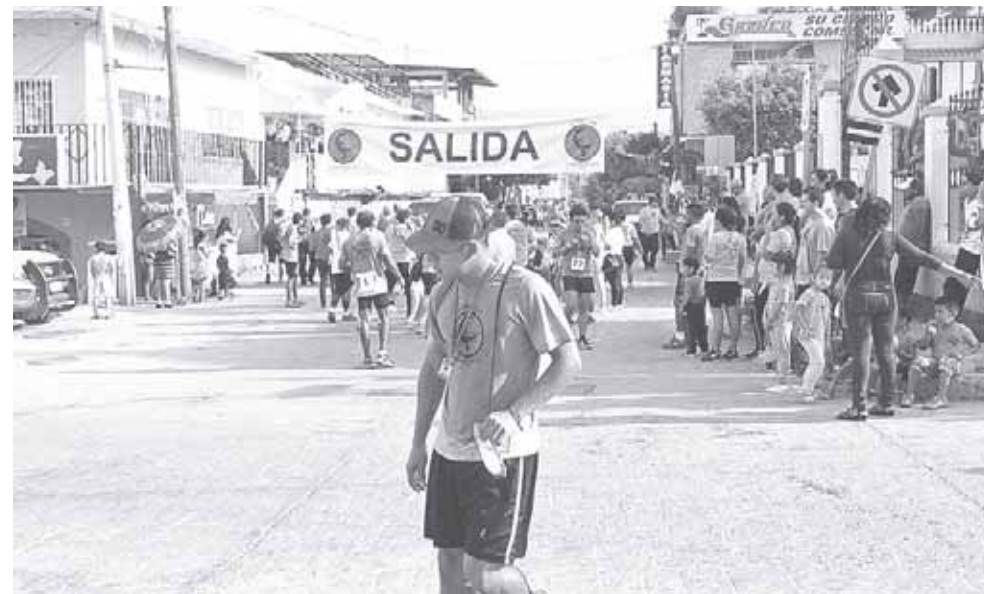
► El registro y los uniformes fueron otorgados de forma totalmente gratuita por los patrocinadores.