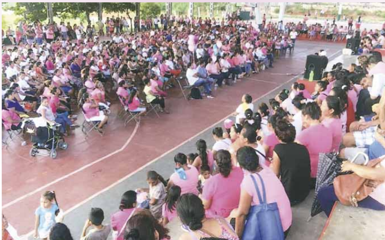
► La conferencia incluyó testimonios de personas que han luchado contra el cáncer.

Las integrantes de Mujeres Solidarias de la Costa presentaron una serie de conferencias enfocadas a favorecer la salud de las ciudadanas