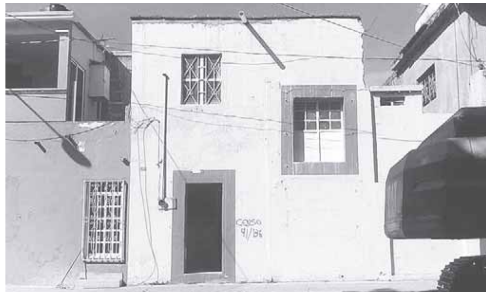
► Las viviendas que resultaron dañadas fueron edificadas hace más de 50 años.