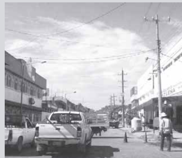
► La CFE trabajó en la avenida Tampico, la cual desahoga el flujo de la zona centro.