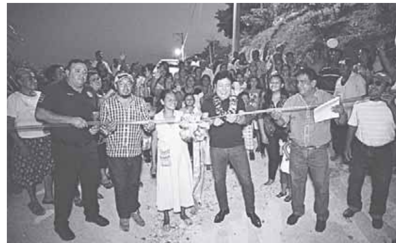
► Con esta obra se fortalece el desarrollo de los sectores de la población.