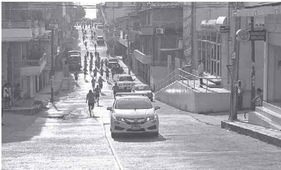
► La carrera atlética por el Día del Médico recibió la participación de más de 150 corredores.