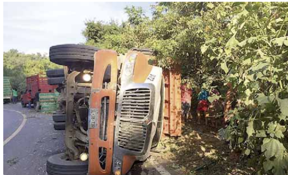
► La probable causa del accidente fue el trazado de la vía, el cual tiene pronunciadas curvas.