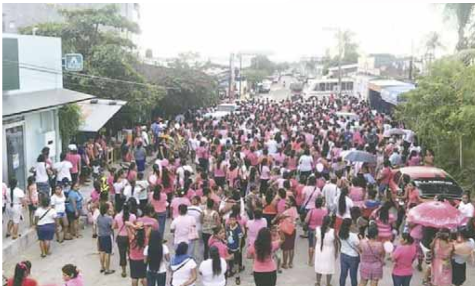
► Las activistas buscan crear conciencia sobre la importancia de detectar el cáncer a tiempo.