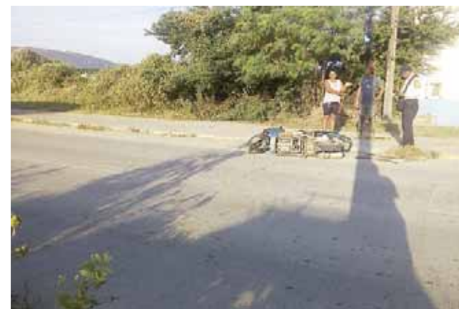
► El lesionado es reportado como grave debido a las lesiones que sufrió en la cabeza.

Al fin llegaron paramédicos de la Cruz Roja Mexicana quienes le brindaron atención médica y lo trasladaron al hospital.