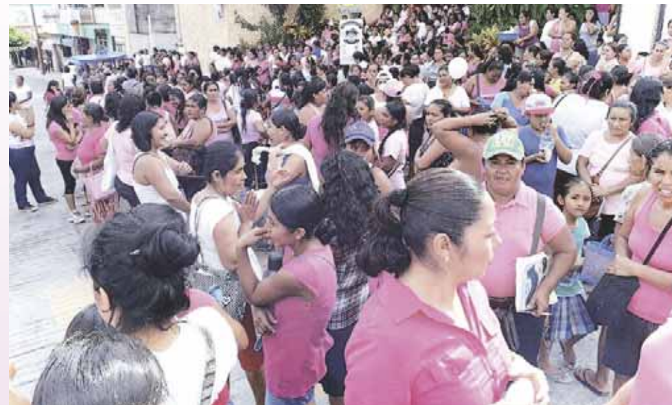
► El foro Todas somos capaces de todo se realizó en la Unidad Deportiva Benito Juárez.