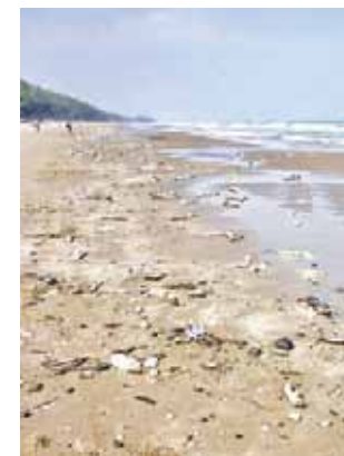
► Ni enderum qui nobilitus.

pueden provocar la muerte de todo organismo viviente en una comunidad biológica.