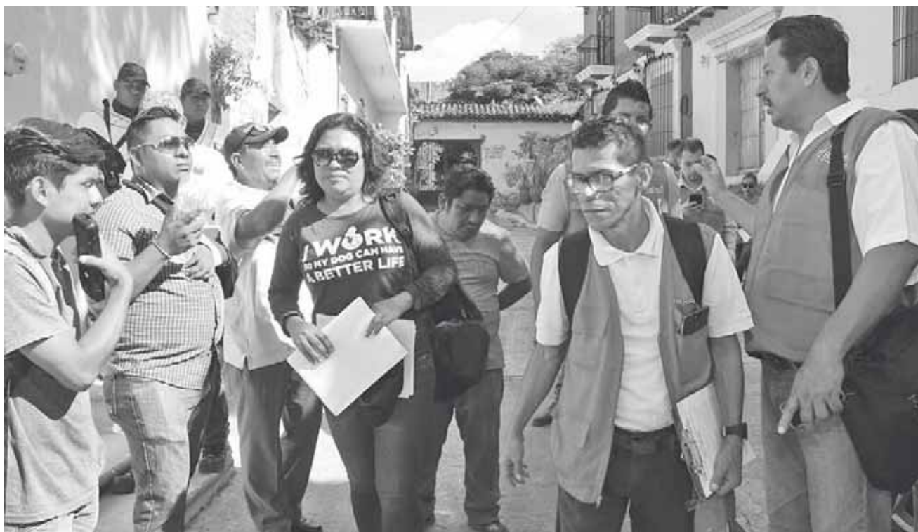
► Para eficientar la entrega de las 421 tarjetas por parte de BANSEFI, personal del Ayuntamiento acompañó y coordinó la entrega.

Hoy se llevará a cabo la entrega en el Barrio Santa Cruz Tagolaba, la Tercera, Cuarta, Quinta y Sexta sección, en el Fraccionamiento Infonavit Sandunga y la colonia Industrial