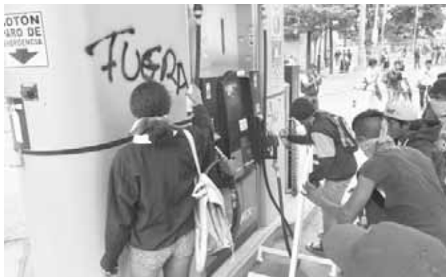
▶ Jóvenes encapuchados se dedicaron a pintar los inmuebles.