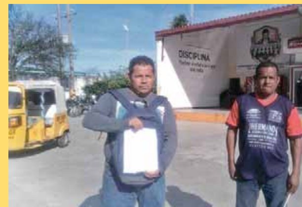
► Los uniformados que piden que se respeten los derechos laborales de sus compañeros.

Los policías manifestaron que no levantarían el paro hasta no llegar a acuerdos positivos que favorezcan a sus compañeros despedidos.