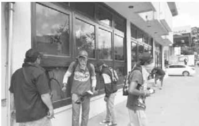
▶ Casas particulares, negociaciones entre otras, las afectadas.