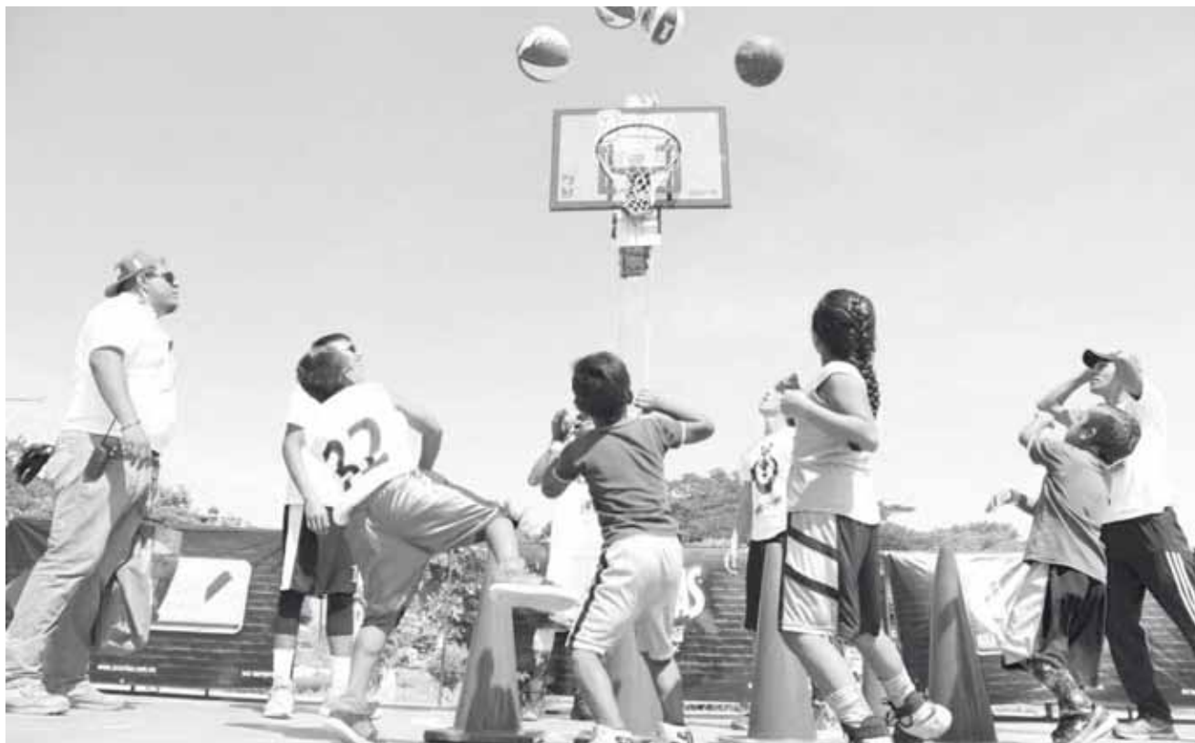
► Los pequeños deportistas realizaron sus prácticas en una de las canchas que se va a remodelar por parte de Zucaritas.

Para este año, el programa evoluciona llegando a nivel nacional a través de la recuperación de 37 Canchas en 10 estados de la República.