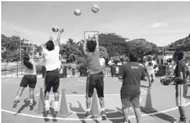
► El presidente municipal busca mejorar el deporte.