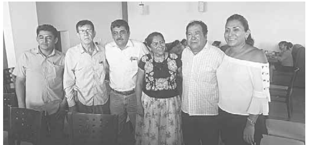
► Durante la reunión que sostuvieron los ediles.

“Es muy lamentable que estos magistrados, en estos días en que nos encontramos sufriendo una tragedia que nos afectó en todo el pueblo y la región, que a muchos nos dejó sin casa y algunos tristemente con la pérdida de algún familiar, nos venga a dar el tiro de gracia con esta decisión se villista e inhumana, nos preguntamos lo siguiente: ¿por qué en estos momentos?, ¿porque Santa María Xadani?, ¿qué interés persigue señor Gobernador?, ¿qué interés persigue