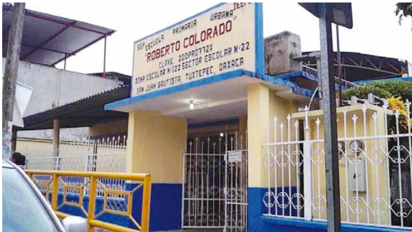
► Algunos planteles educativos sólo será reforzados en su estructura.

Mencionó que las escuelas públicas cuentan con un seguro, el cual aplica cuando las estructuras son dañadas por sismos de más de 7 u 8 grados y en este caso aplica ese seguro por lo que deben hacerse responsables las constructoras, asimismo afirmó que ya se están entregando escuelas con dictámenes favorables por parte de Protección Civil.