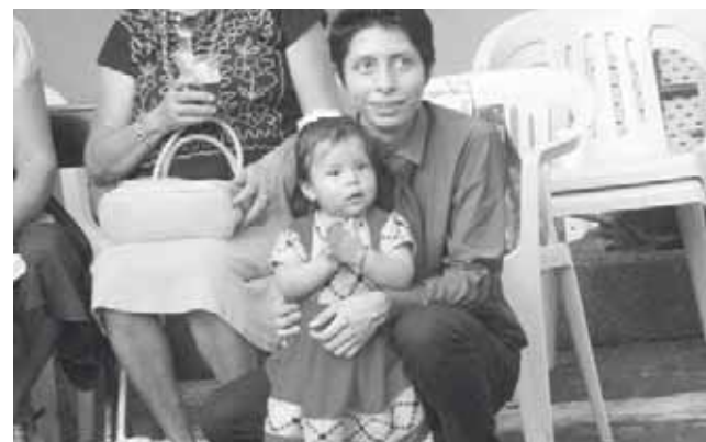
► La cumpleañera con su papá.