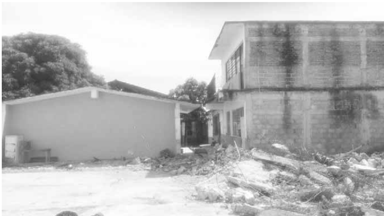
► Decenas de centros escolares aún no son demolidos.

En Unión Hidalgo comenzó la demolición de la Escuela Secundaria Técnica 33 y en La Ventosa, agencia de Juchitán, autoridades locales y directivos de la escuela primaria Ignacio