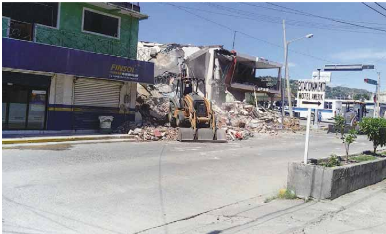
► El calvario parece no cesar, ya que desde hace más de un mes la gente del Istmo vive en zozobra.