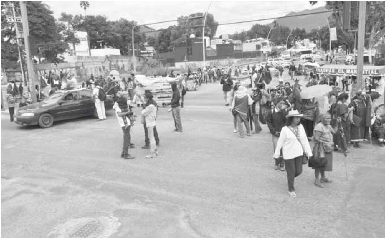
▶ La marcha causó un intenso caos vial en la zona norte de la ciudad.

En otro punto, dijo que en colonias de la agencia de Santa Rosa Panzacola se requieren drenaje, pavimentación y energía eléctrica