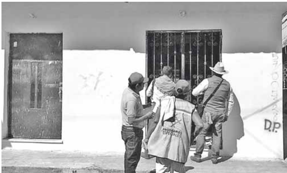
► El apoyo se entregó de casa en casa, por lo que personal calificado acudió a las viviendas.