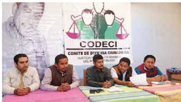
► Integrantes del Comité de Defensa Ciudadana.

Señaló que el trabajo que se está realizando en la Casa de la Cultura es para regresarle un poquito de mucho pues durante años ha estado descuidada y no le han dado la importancia que merece ya que es una de las más grandes del país y no era valorada.