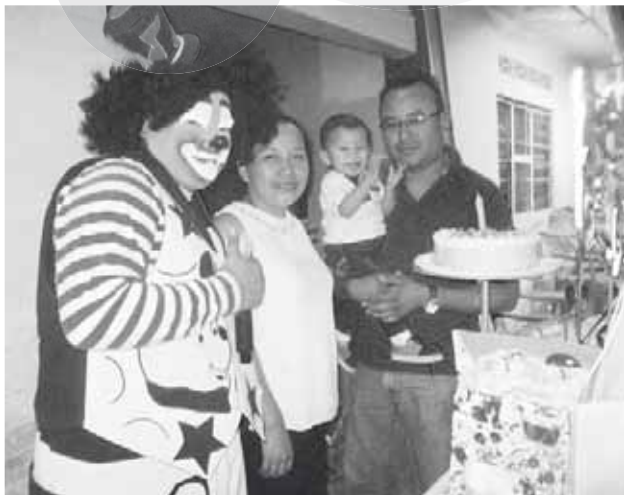
► Tomándose la foto del recuerdo.