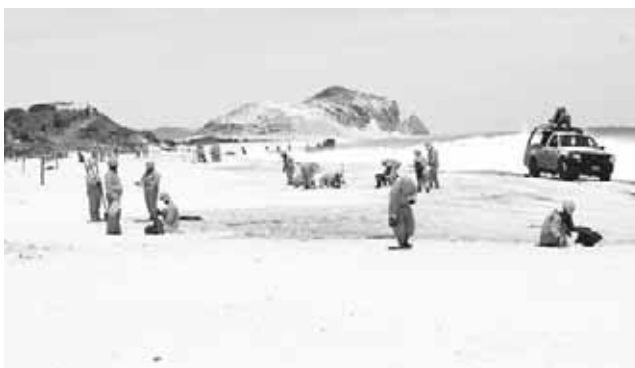
► Decenas de empleados realizan tareas de limpieza.

la agencia municipal de las Salinas del Marqués.