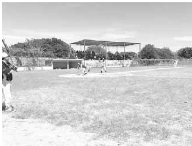
► El pequeño bambino lució en la 1a base.

Por los Pericos inició Octavio Arteaga siendo el serpentintero ganador tirando para 6 entradas con 2/3 y llegó al relevo para cerrar el juego Édgar Reyes