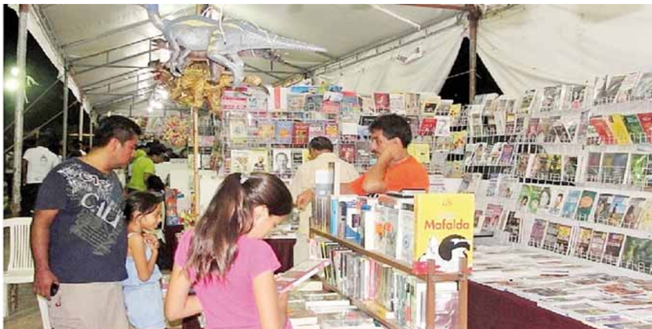
► Durante el evento se realizarán varias actividades culturales para los niños y jóvenes.

Por lo que la CODECI invita al público en general para que asistan a esta exposición artesanal, para que apoyen adquiriendo los productos de personas de esta organización, la cual hasta el momento ha estado apoyando a todos su agremiados que presentan proyectos productivos, la inauguración será a las 9 de la mañana, habrá degustación y trajes típicos de las diferentes regiones del estado.