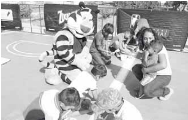
► Ayudaron a pintar las franjas de una de las canchas.