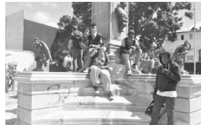
▶ Después de su "jornada" de lucha, posaron cínicamente.

Exigen salida de Ombudsman y liberación de proyectos productivos