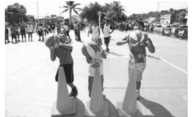
► En Salina Cruz hay talento deportivo, dice edil.