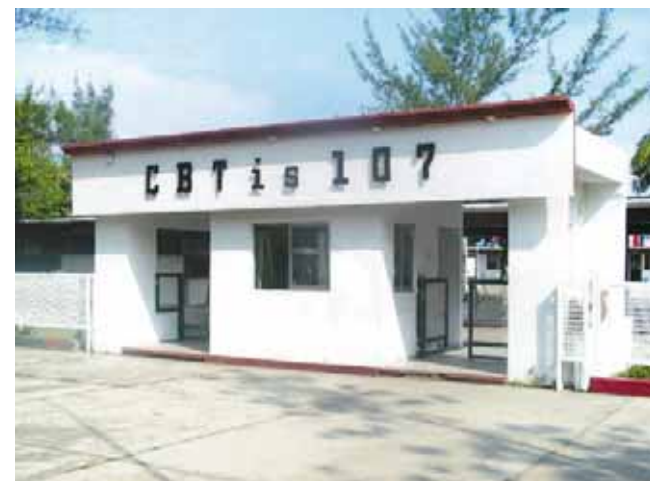
► La institución alberga a decenas de alumnos talentosos.

Expresó el director que este tipo de eventos contribuye a que los jóvenes se expresen y se desenvuelvan dentro y fuera de la escuela, además que para un futuro les servirá para seguirse preparando y para eso son este tipo de concurso para que los jóvenes estudiantes piensen en grande.