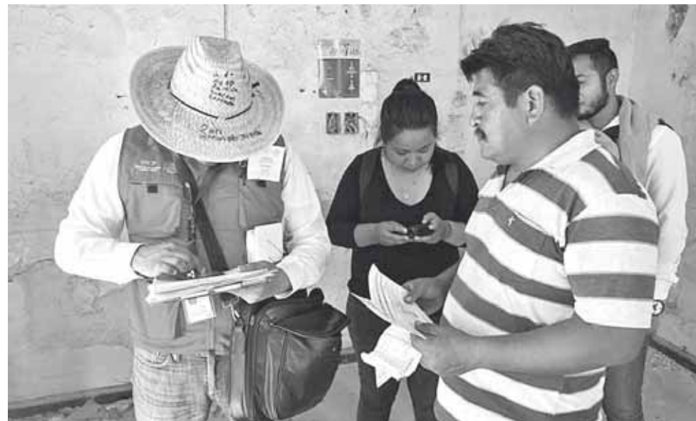
► Las personas mostraron sus documentos para que se les entregara su tarjeta electrónica.