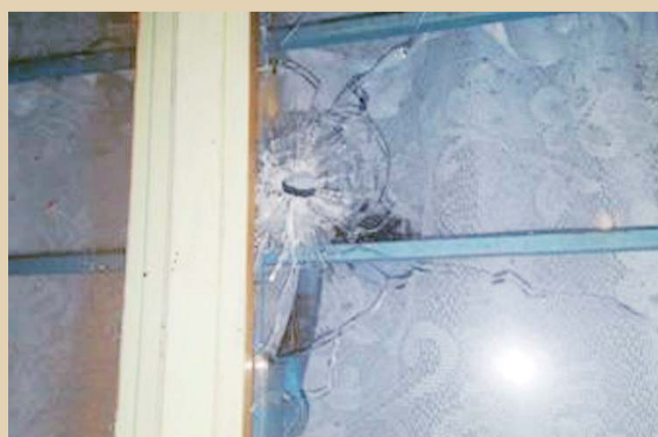
► Dos motociclistas llegaron hasta la vivienda y dispararon.