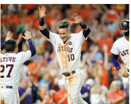
Astros venció a los Yankees en el duelo definitivo.

par de imparables. Ponchó a cinco enemigos y permitió una base por bola. Su relevo, Lance McCullers, estuvo durante cuatro entradas. Solo le conectaron un hit, concedió un boleto y tuvo seis ponches.