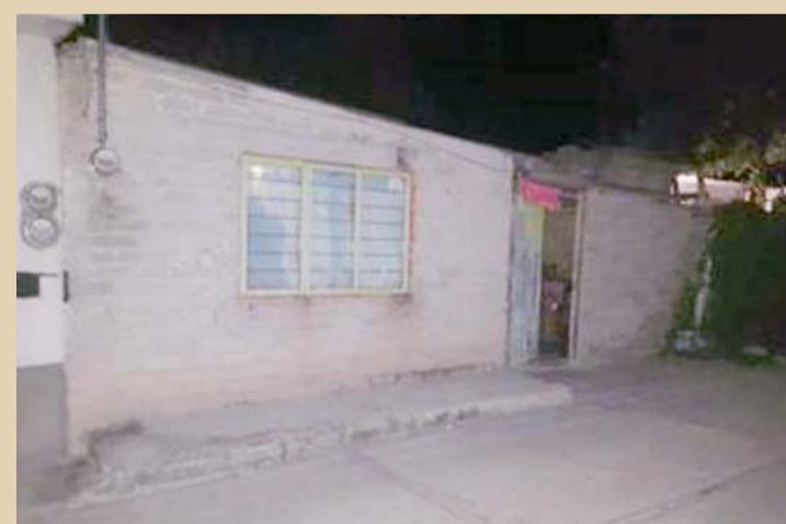
► El ataque ocurrió en la agencia de policía Santa Teresa.