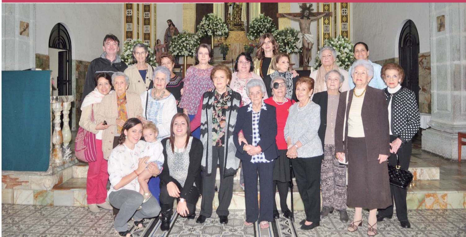
► Su familia y amistades la acompañaron a dar gracias al Todopoderoso.