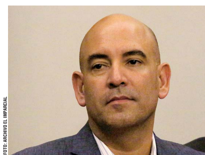
Por los hechos en el rancho "La Engorda", la gestión de Tuñón Jáuregui se ha visto empañada.

HOMICIDIOS 2017: 125 casos en enero 136 en febrero 123 en marzo 196 en abril 158 en mayo 164 en junio 187 en julio 173 en agosto 169 en septiembre