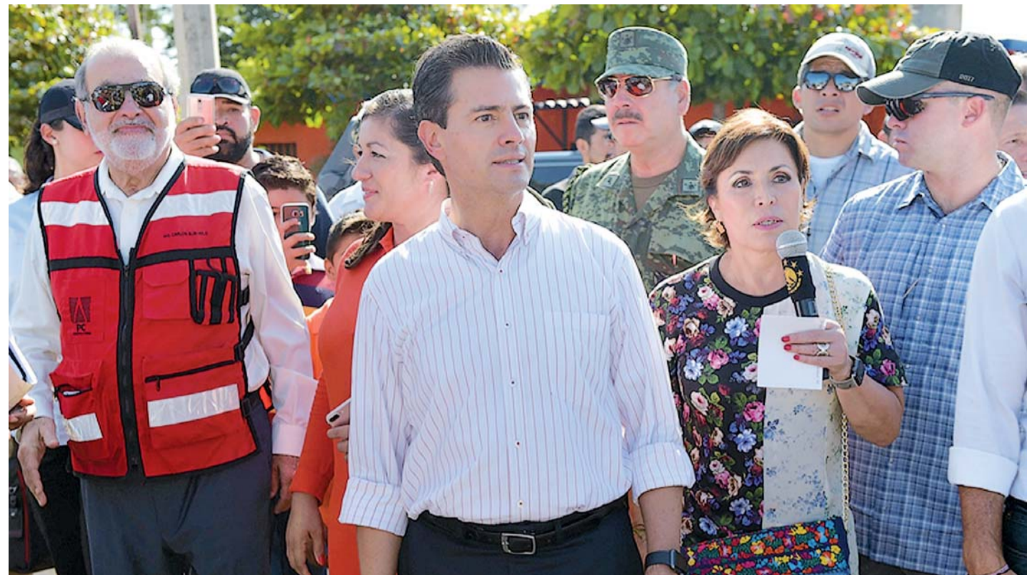
► El gobierno y la sociedad civil han reprobado el pillaje y la rapiña política en la región istmeña.