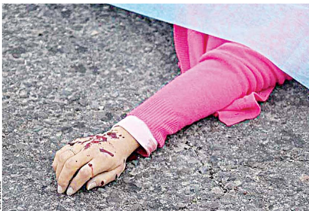
Las regiones donde ha crecido más el delito son el Istmo de Tehuantepec y Tuxtepec, donde en varias ocasiones se han registrado enfrentamientos entre delincuentes y elementos de seguridad.

Los registros criminales no se detienen en Oaxaca, a pesar del terrible sismo de intensidad 8.2 del 7 de septiembre pasado, y que causó una gran devastación en la región del Istmo de Tehuantepec, pues los delitos de alto impacto mantuvieron su crecimiento, de acuerdo con datos del Secretariado Ejecutivo del Sistema Nacional de Seguridad Pública. Aunque septiembre representó un mes de tragedia para los oaxaqueños, tras el primer sismo y sus más de 7 mil réplicas, además de intensas lluvias que incluso también arrojaron pérdida de vidas humanas en la Cuenca y la Mixteca, los homicidios, secuestros y extorsiones no dieron tregua a la entidad, que se mantiene a la alza en este tipo de delitos. El organismo federal, dependiente de la Secretaría de Gobernación, reportó que en la entidad ocurrieron el mes pasado 169 homicidios, cuatro secuestros y 10 extorsiones, sobre todo, casualmente,