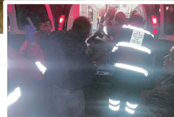
► Paramédicos le otorgan atención de primeros auxilios.

Después de cinco horas del ataque, llegaron al lugar elementos de la Agencia Estatal de Investigaciones, quienes acordaron el área y realizaron la inspección ocular al igual que algunos peritos, ya que supuestamente levantarían indicios, pero los vehículos y personas que pasaron en este sitio ya habían movido todo.