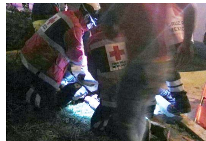
► Lo trasladaron de emergencia a una clínica particular.

"Este cuate ya estuvo detenido hace unos meses por portación de arma de fuego, era muy agresivo y mira", comentó uno de los policías.