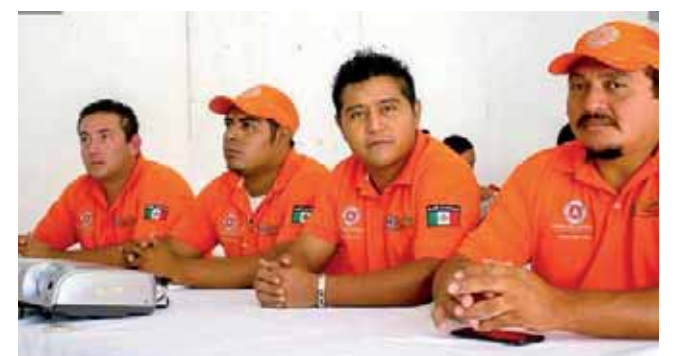
► En lo que va del año han cambiado en dos ocasiones a los integrantes de PC.

De hecho, septiembre fue un mes caótico para el res-