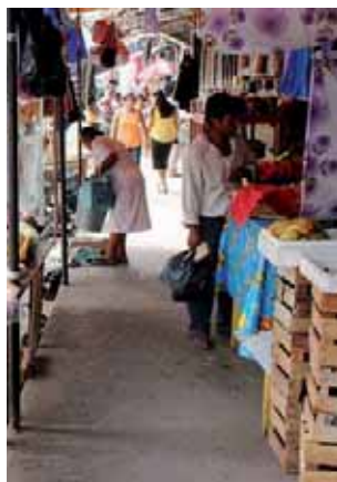
► Imparable comercio informal.

Explicó que desde que el director tomó posesión del cargo no ha llamado a una reunión con representan-