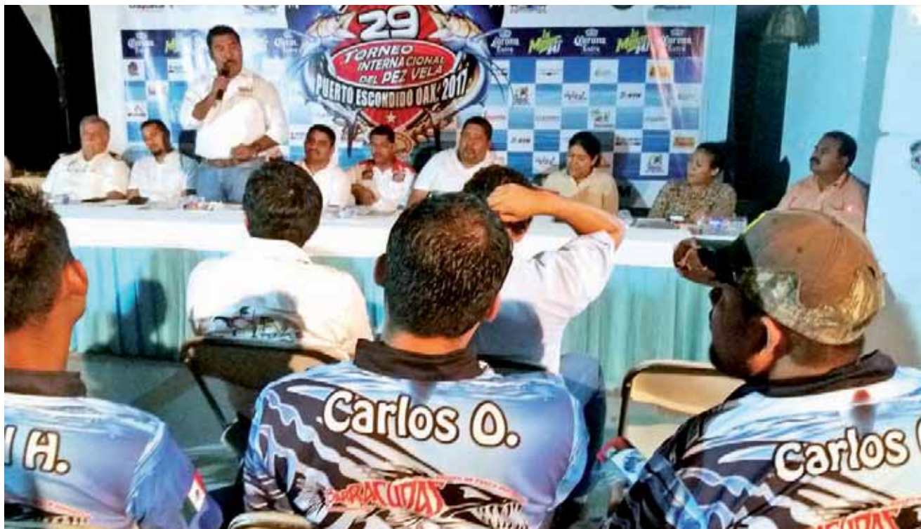
► Durante la rueda de prensa en la que dieron a conocer cada una de las bases para que los competidores se sumen a la justa.

Se dio a conocer que para este año los premios suman un total de 1 millón 800 mil pesos, el primer lugar es una camioneta pickup Dodg Ram equipada con valor de 700 mil pesos