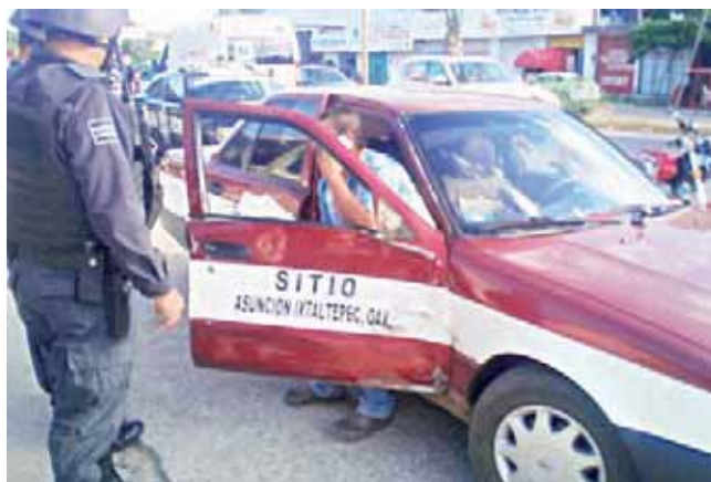
► El conductor del taxi apenas si daba crédito de los hechos.

declaración correspondiente para acordar con el ruletero sobre la reparación de los daños ocasionados.