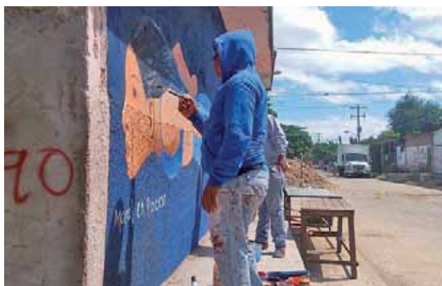
► Explican que no cesarán de imprimir su arte en cada barda.