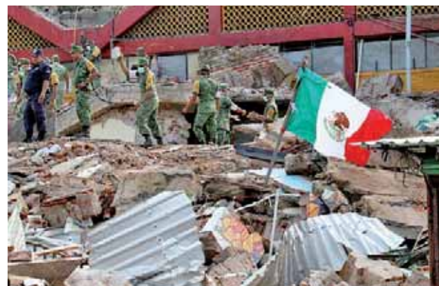
► El sismo el 7 de septiembre devastó la ciudad de Juchitán.

terremoto. Solo algunos se resisten a caer.