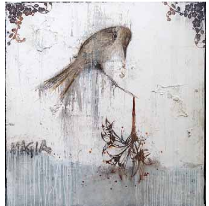
► ST 200x200 centímetros mixta sobre tela 2017.

pintura es esa magia que se encuentra en el trance de vivir en otro mundo, y que desde niño Amador ejercitaba tirado en el piso dibujando en una hoja de papel, haciendo un ruido extraño para entrar en sintonía con las musas, con la inspiración.