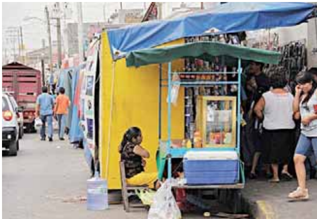
► Explican que ha faltado acercamiento de parte de la Dirección de Comercio municipal.