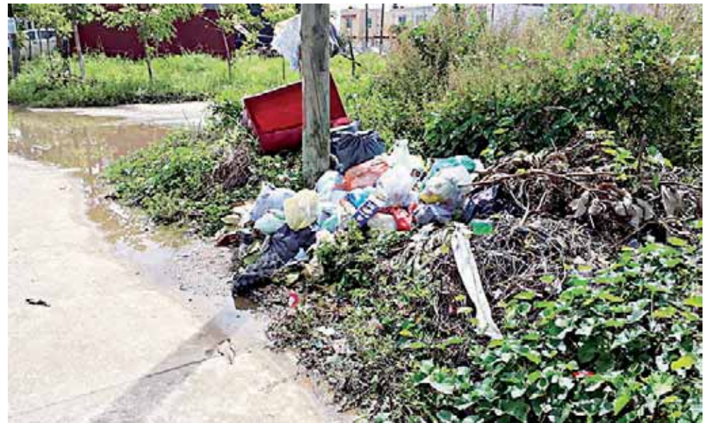
► Dieron a conocer que en breve las unidades estarán listas.