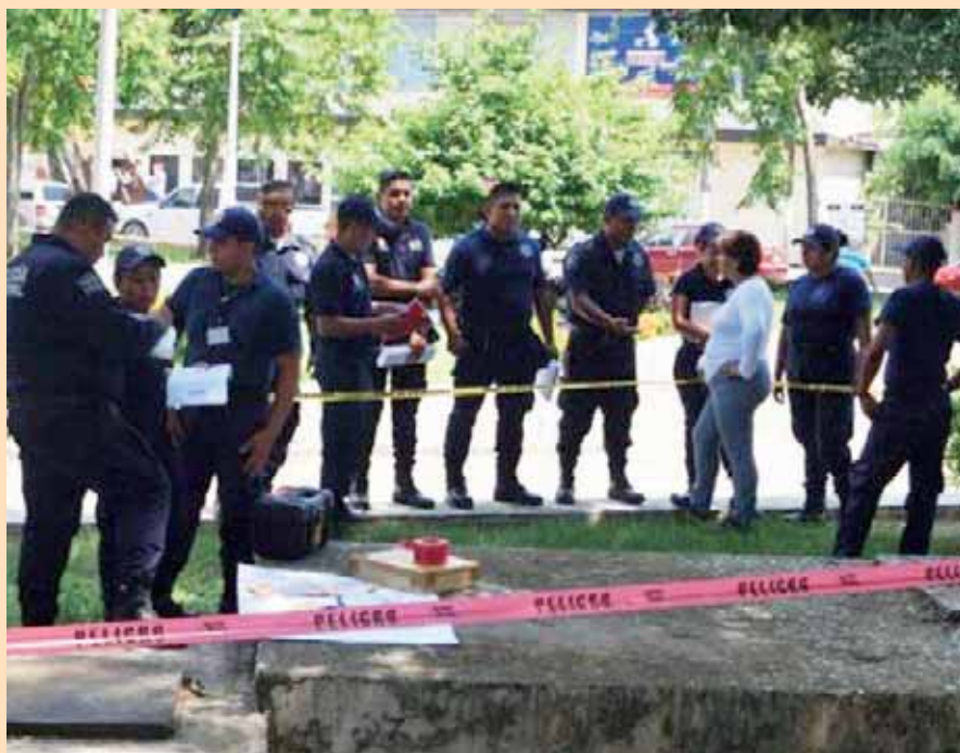
► Los uniformados pueden resolver cada una de sus dudas con la especialista en la materia.

Mencionó que hay mucho interés por parte de los elementos, quienes se han mostrado bastante atentos ante el tema ya que son 30 horas de arduo trabajo práctico así lo estipula el sistema nacional de seguridad pública, este curso es una actualización y es brindada a todos los policías.