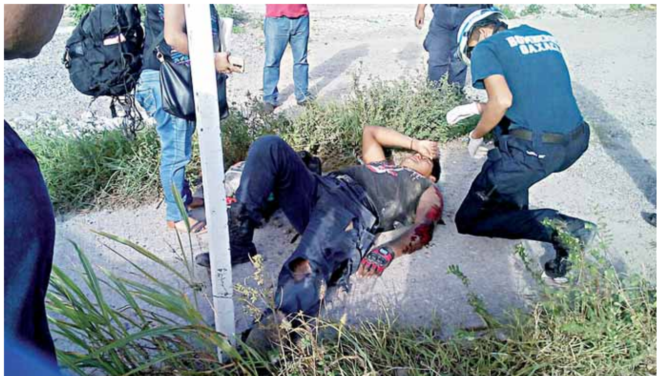
► Fuertes heridas tuvo el uniformado al caer de su unidad de motor.

Por tal motivo, las autoridades correspondientes se hicieron cargo de realizar le peritaje correspondiente, en espera que ambas partes acuerden la reparación de