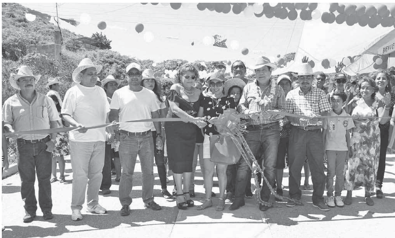
► El presidente municipal de Salina Cruz, cumple a los colonos que confiaron en él cuando se presentó en campaña y ahora como presidente.

Entre aplausos, acompañado de los vecinos, regidores, síndicos y directores, el mandatario municipal cortó el listón inaugural de estos trabajos