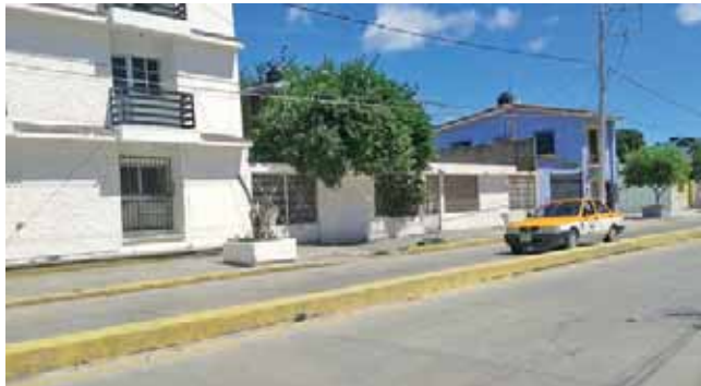
► Amantes de lo ajeno se apoderan de pertenencias de valor.