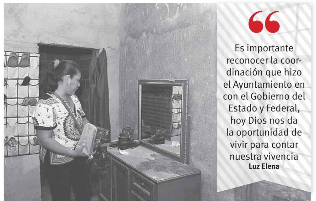
► Cuenta su historia de vida y agradece a los tres niveles de gobierno por su apoyo.

“Lo primero que hicimos fue salir a la calle, ahí se encontraban la mayo-