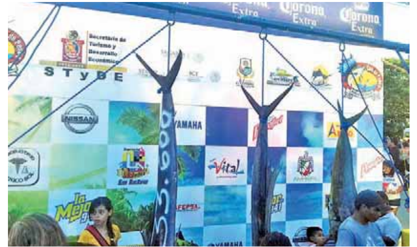
► Esperan que para este año se supere el número de competidores de pez vela.