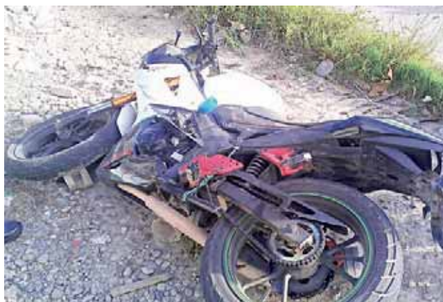
► La unidad en la que se trasladaba el hombre que colisionó con el taxi.