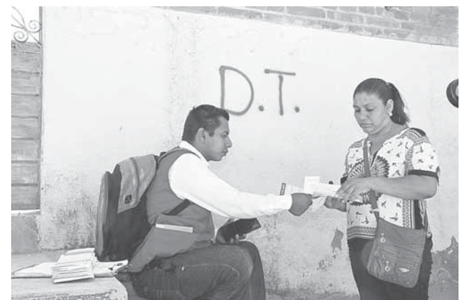
► Ya cuenta con su tarjeta para recibir el recurso.

Unos días después, la Secretaría de Desarrollo Agrario, Territorial y Urbano (SEDATU), pasaría a censar las casas y a proporcionar un folio, el cual presen-