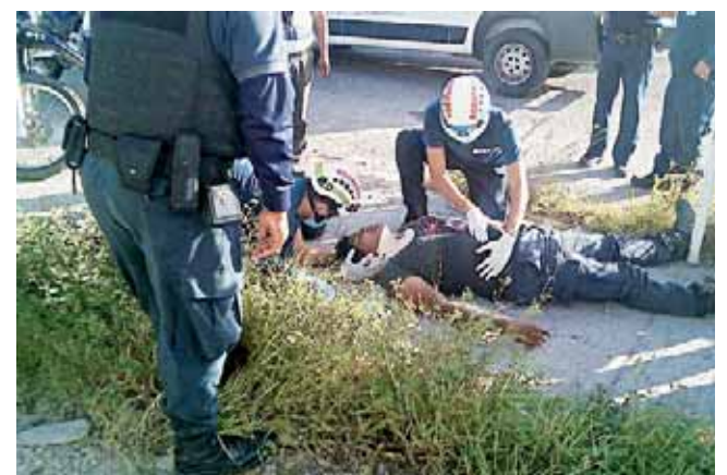
► Fue atendido por paramédicos, quienes lo trasladaron al hospital.