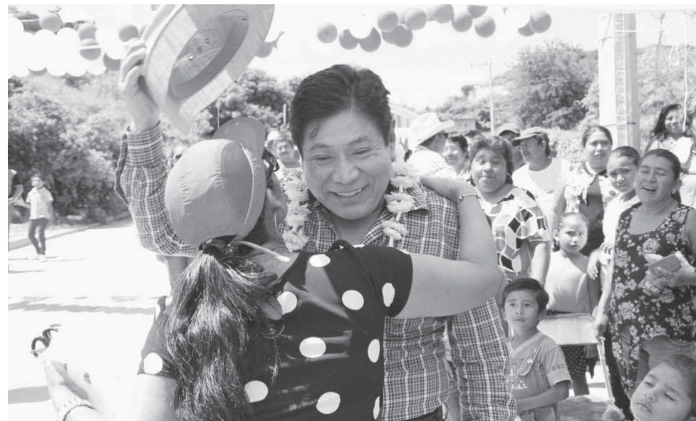
► El gobierno de León Aragón se caracteriza por escuchar a los ciudadanos que se acercan a él.