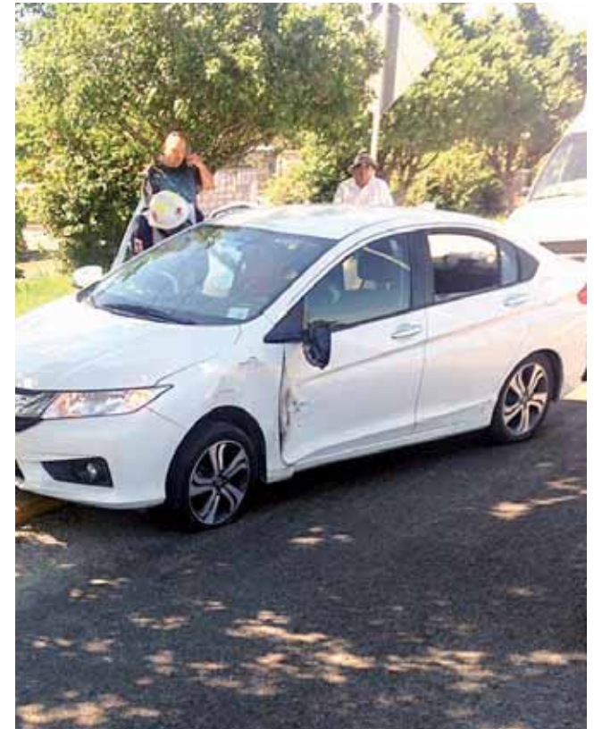
► El carro modelo City presentó daños en su carrocería.

A su llegada de la Policía Vial, primeramente le pidió al chofer del camión