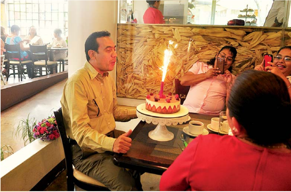
▶ Sopló la vela de su pastel mientras le cantaban las tradicionales Mañanitas .

estilo@imparcialenlinea.com / Teléfono 501 83 00 Ext. 3171