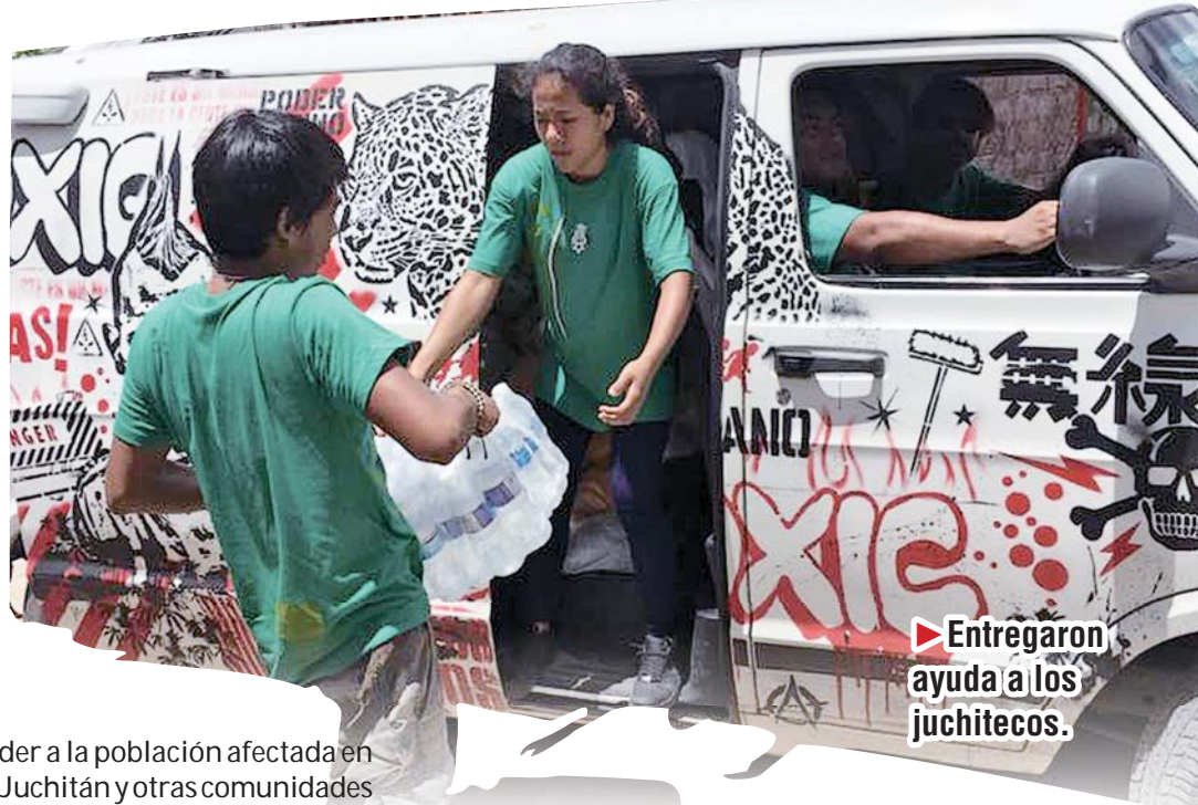
der a la población afectada en Juchitán y otras comunidades de la región donde general-