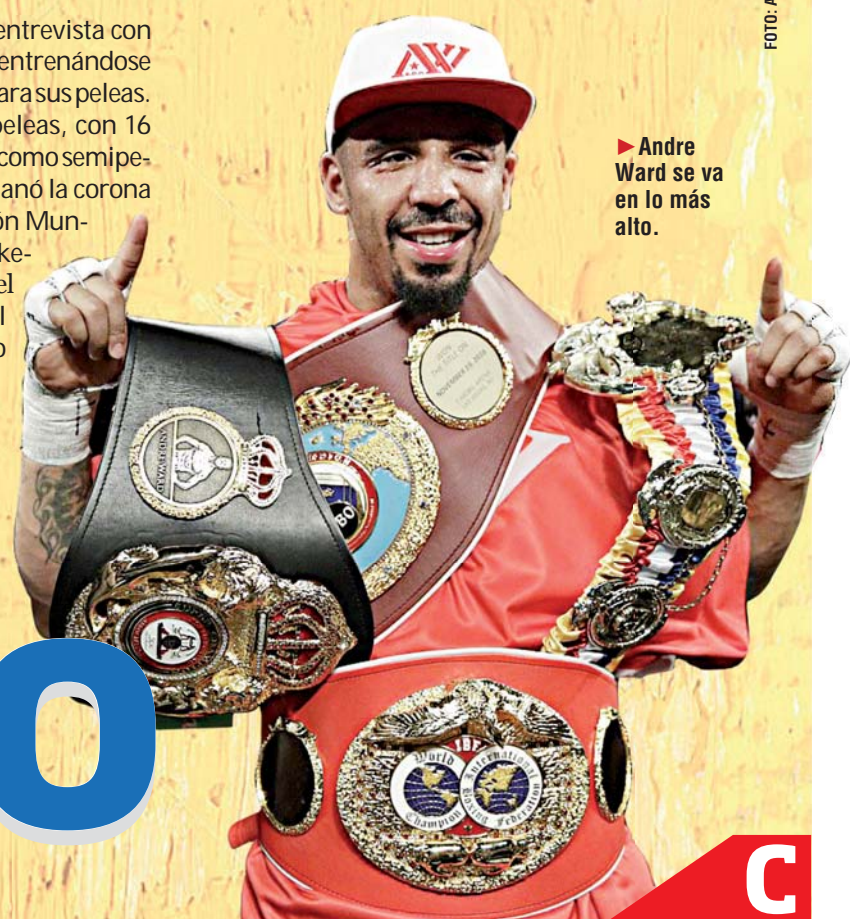
► Andre Ward se va en lo más alto.

Ward ha ganado sus 32 peleas, con 16 nocauts. Ganó el oro olímpico como semipesado en el 2004. En el 2009 ganó la corona supermediana de la Asociación Mundial de Boxeo al vencer a Mikkel Kessler y unificó el título en el 2011 cuando se impuso a Carl Froch en la final del torneo Super Six de Supermedianos.