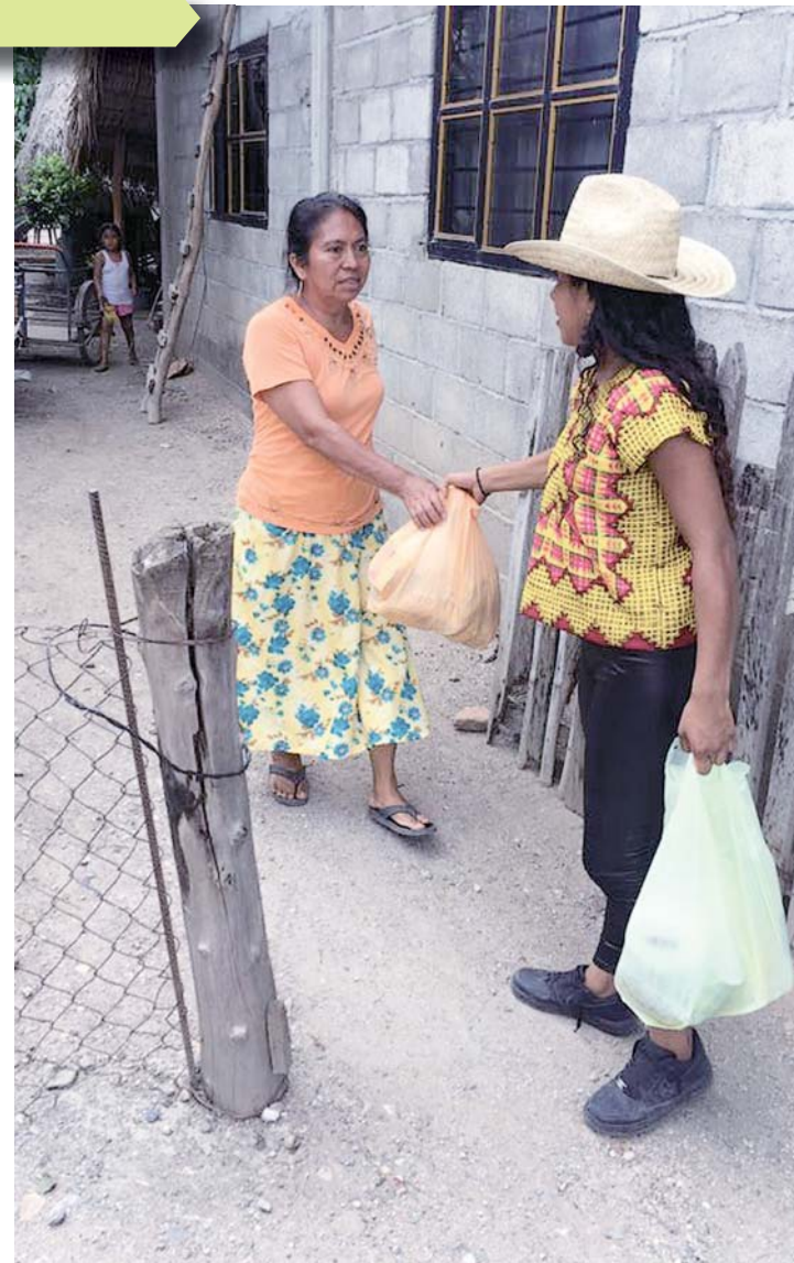
Piden no cesar con el apoyo al Istmo de Tehuantepec.

En Juchitán, donde se registraron las mayores afectaciones y muertes por el sismo, hay quienes se quedaron sin fuentes de empleo, ya que comercios como Coppel y tiendas de tela resultaron afectados. La crisis económica se agudiza ante daños en el mercado y porque “la gente no está comprando del todo”. A quienes no les fue tan